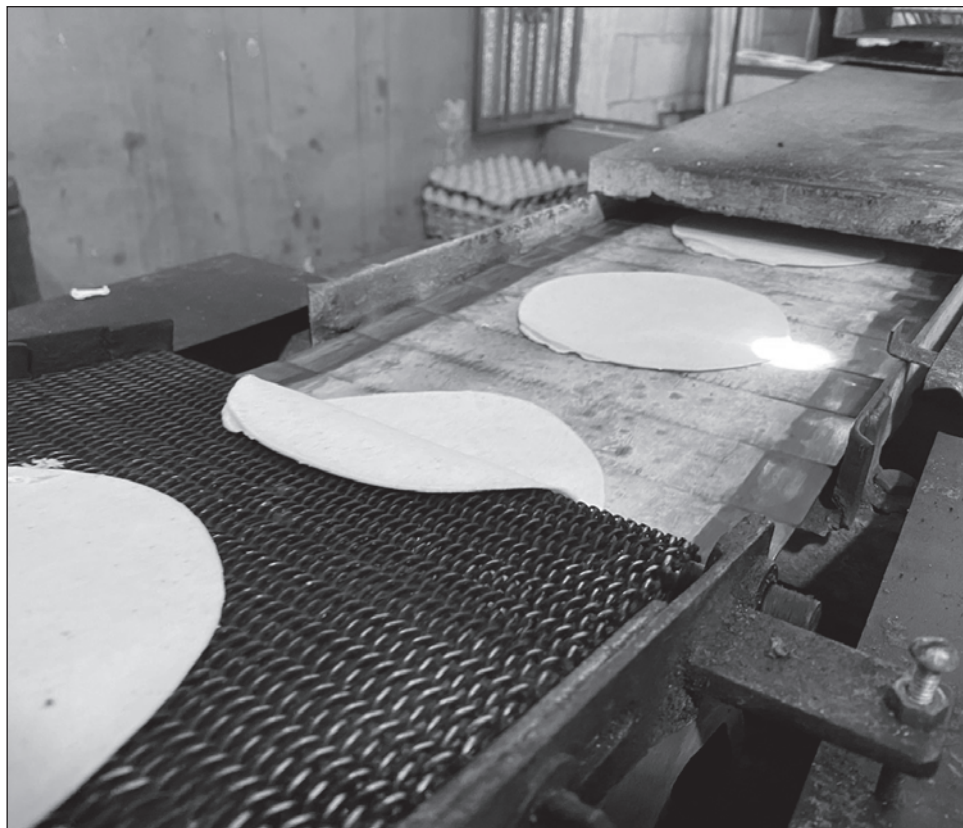
▲ La tortilla es consumido por 98.6 por ciento de los hogares mexicanos.

El hecho de que prácticamente todas las familias mexicanas consumen tor-