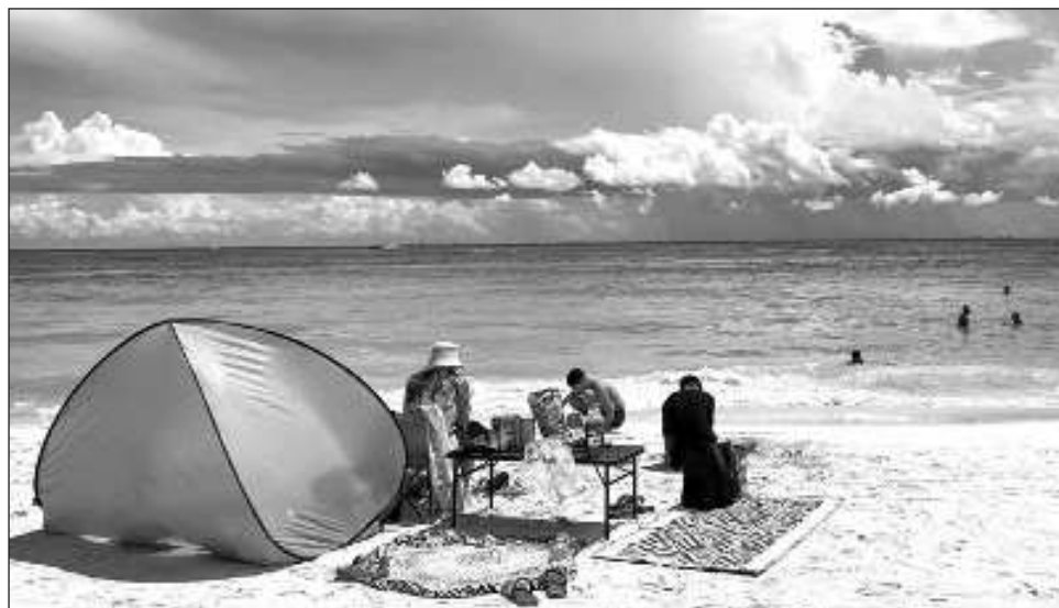
▲ Hoteleros y representantes del sector empresarial sugieren que en lugar de aportar más recursos, se les regrese el impuesto DNR y que ya no les cobren el IVA.

Pero además de los entes públicos, enlistó a otros organismos y cámaras para que se sumen a esta unificación de recursos: la Confederación de Cámaras Nacionales de Co-