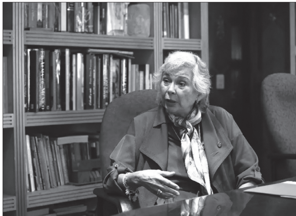
▲ Olga Sánchez Cordero, presidente de la Comisión de Justicia del Senado, junto con otras reconocidas feministas, elabora un plan de gobierno para Sheinbaum.

La ex secretaria de Gobernación detalló que la plataforma que elabora junto a Elvira Concheiro, tesorera de la Federación, y Nadine Gasman, presidente del Instituto Nacional de las Mujeres (Inmujeres), entre otras feministas destacadas de la 4T, será