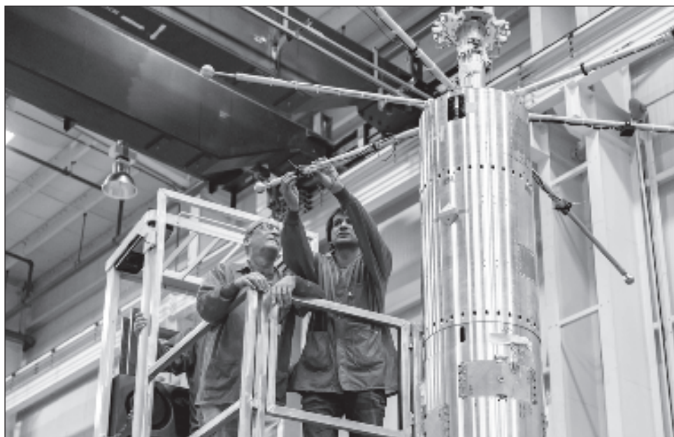
▲ La transmisión de la NASA también incluyó el lanzamiento de cohetes que transportaron instrumentos para estudiar los efectos del eclipse en la atmósfera, pertenecientes a la misión APEP, dirigida por el científico de origen indio, Aroh Barjatya.

Durante un eclipse solar, la luz del Sol desaparece y reaparece sobre una pequeña