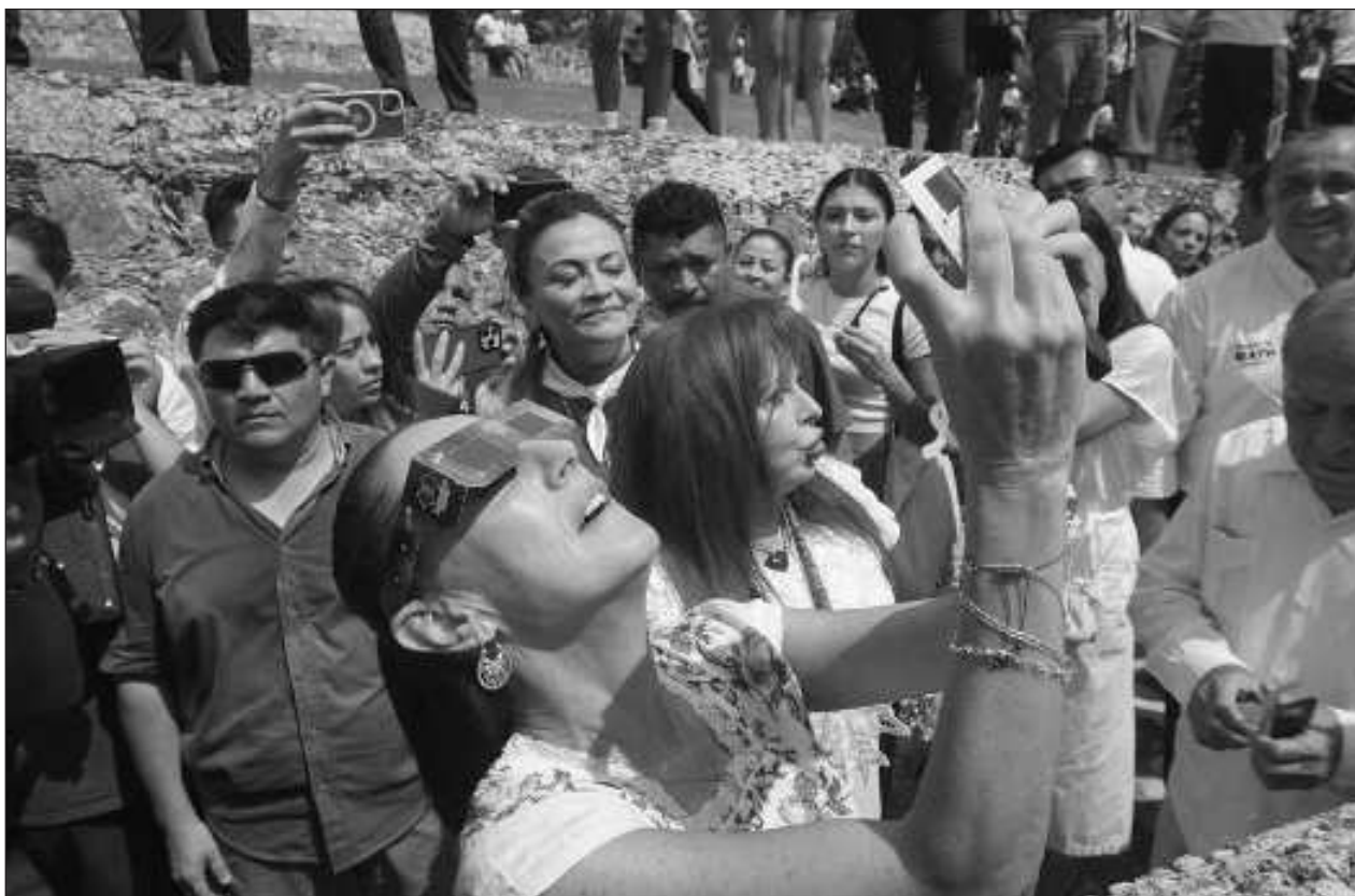
▲ Aunque los lugares específicos para el avistamiento del eclipse anular solar ya estaban destinados, acondicionaron el Museo Fuerte de San Miguel para que la ex jefa de gobierno de la Ciudad de México también lo pudiera atestiguar.