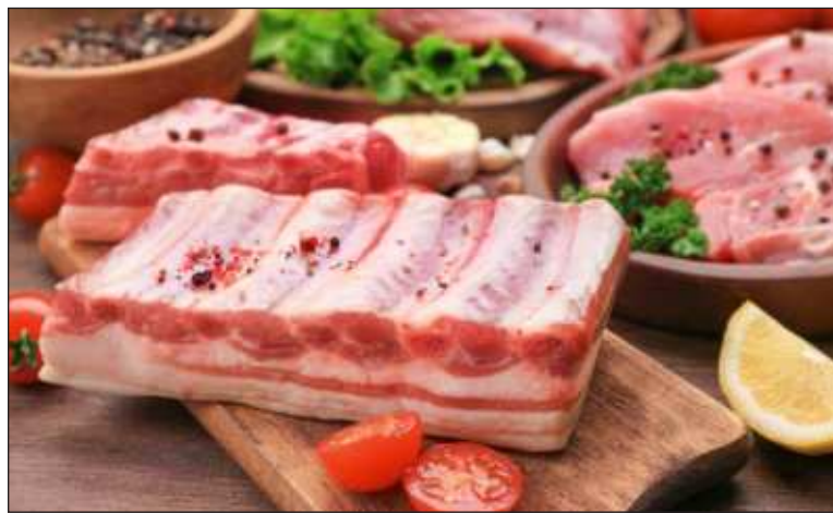
▲ Planta procesadora de Kekén ubicada en Tixpéual recibe certificación FSSC 22000, máxima norma en seguridad alimentaria.

Se añadió que estos procesos promueven estándares de confiabilidad para la atracción de más clientes en Yucatán, otros estados, así como nuevos mercados en el extranjero, propiciando a la par nuevas fuentes de empleos directos e indirectos a través de la proveeduría local y nacional en determinados servicios.