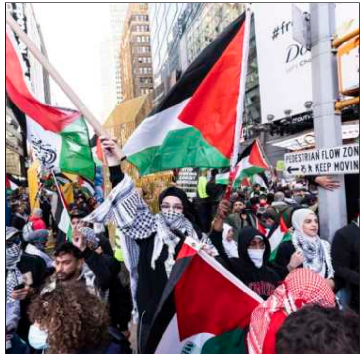
▲ De Irak a Egipto, pasando por Líbano, Jordania o Irán, decenas de miles de personas protestaron en distintos países de Medio Oriente en apoyo a los palestinos de la franja de Gaza. "¡No a la ocupación! ¡No a Estados Unidos!", gritaron en Bagdad, la capital iraquí. También hubo protestas en Irán, donde la población es musulmana.