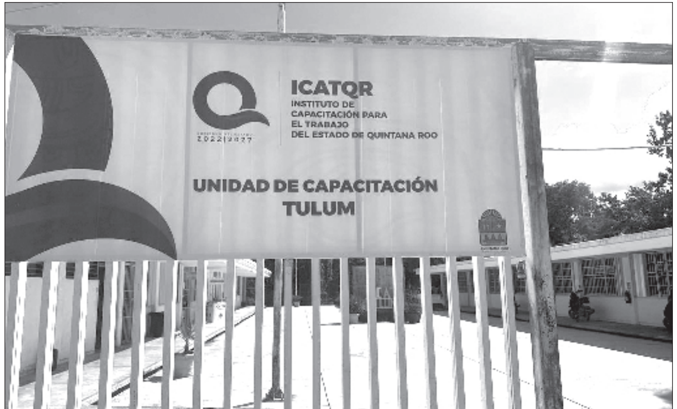
▲ En el catálogo del Icatqr hay cursos de belleza (cortes de cabello, pegado de uñas y pestañas, así como maquillaje), idiomas, bartender, masaje e informática, entre otros talleres de profesionalización.

Detalló que tienen entre su catálogo cursos de belleza (cortes de cabello, pegado de uñas y pestañas, maquillaje), idiomas, bartender, masaje e informática, entre otros talleres. Comentó que esta oportunidad estará vigente todo el mes de octubre y para las interesadas informó que pueden acudir a las instalaciones del Icatqroo, ubicadas en la calle Alfa entre 4 y Tunkul, en un horario de 9 a 17 horas de lunes a viernes