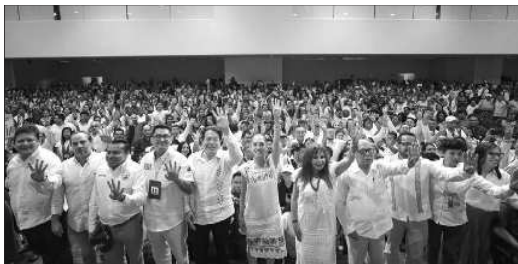
▲ El principal mensaje de Sheinbaum en esta gira no está dirigido a fortalecer su campaña hacia la presidencia, sino hacia la activación de mecanismos de control del voto que le den la mayoría calificada en el Poder Legislativo para impulsar rápidamente reformas a la Constitución.

Los juegos locales apenas inician y las reglas establecidas dejan ver que el Comité Ejecutivo Nacional de Morena tendrá un papel importante y la última palabra. Esto únicamente quiere decir que no importa quién resulte designado coordinador de defensa de la 4T en cada uno de los nueve estados donde habrá elecciones a gobernador; ni siquiera es importante si resulta hombre o mujer, sino que se encuentre alineado con la voluntad de lo que será el gobierno que encabece Claudia Sheinbaum.