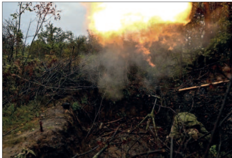
▲ Las fuerzas ucranianas continuaron a las operaciones de contraofensiva en el este y el sur de Ucrania y avanzaron al oeste de la ciudad de Donetsk.

En tanto, el presidente de Rusia, Vladimir Putin, aseguró que la contraofensiva de Kiev había fracasado y que las fuerzas rusas mejoraban sus posiciones en casi toda la línea del frente.