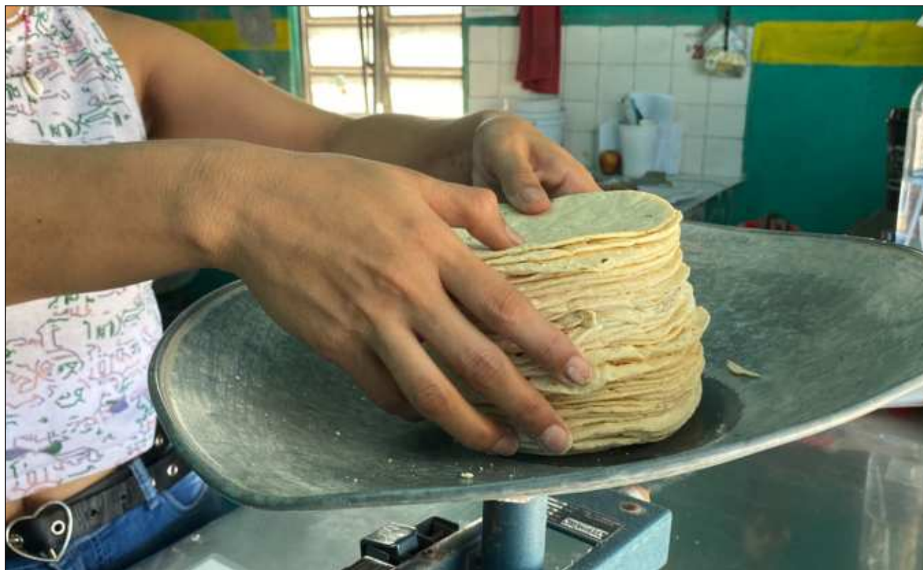
▲ Bejla'e' ku máan u k'iinil Día Mundial de la Alimentación, tu'ux ku kaxta'al u no'ojan tséentikubáaj wíinik. . Oochel Fernando Eloy

"Táan k-k'áatik ka yanak u beeta'al meyajó'ob ti'al u yutsil tséentikubáaj kaaj, ba'ale' ka jach ts'aatáanta'ak le yaan u yil yéetel waaj, tumen suuka'an u jach jaanta'al tumen mexikoilo'ob; ti'al u beeta'ale' ku k'abéetkunsal