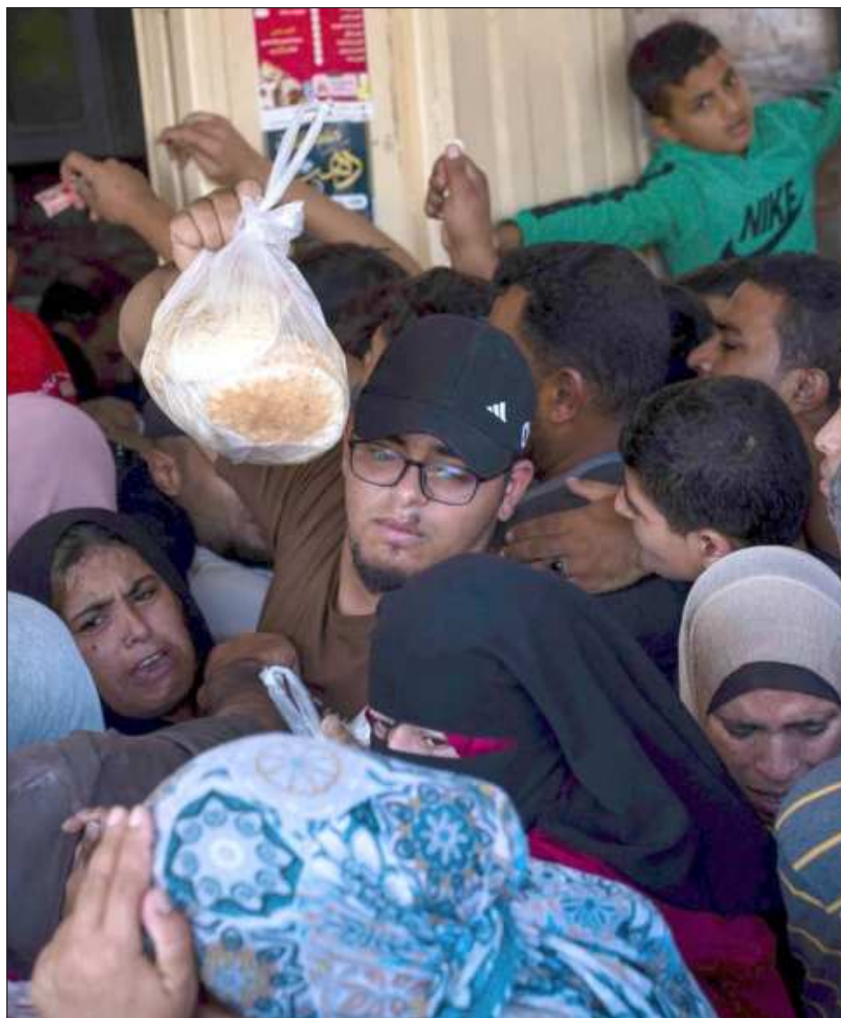
▲ La Organización Mundial de la Salud envió a Líbano dos cargamentos para responder a "cualquier potencial crisis sanitaria" que pueda

estallar y trabaja en reforzar el sistema médico local de cara a posibles "incrementos" de víctimas por enfrentamiento con Israel.