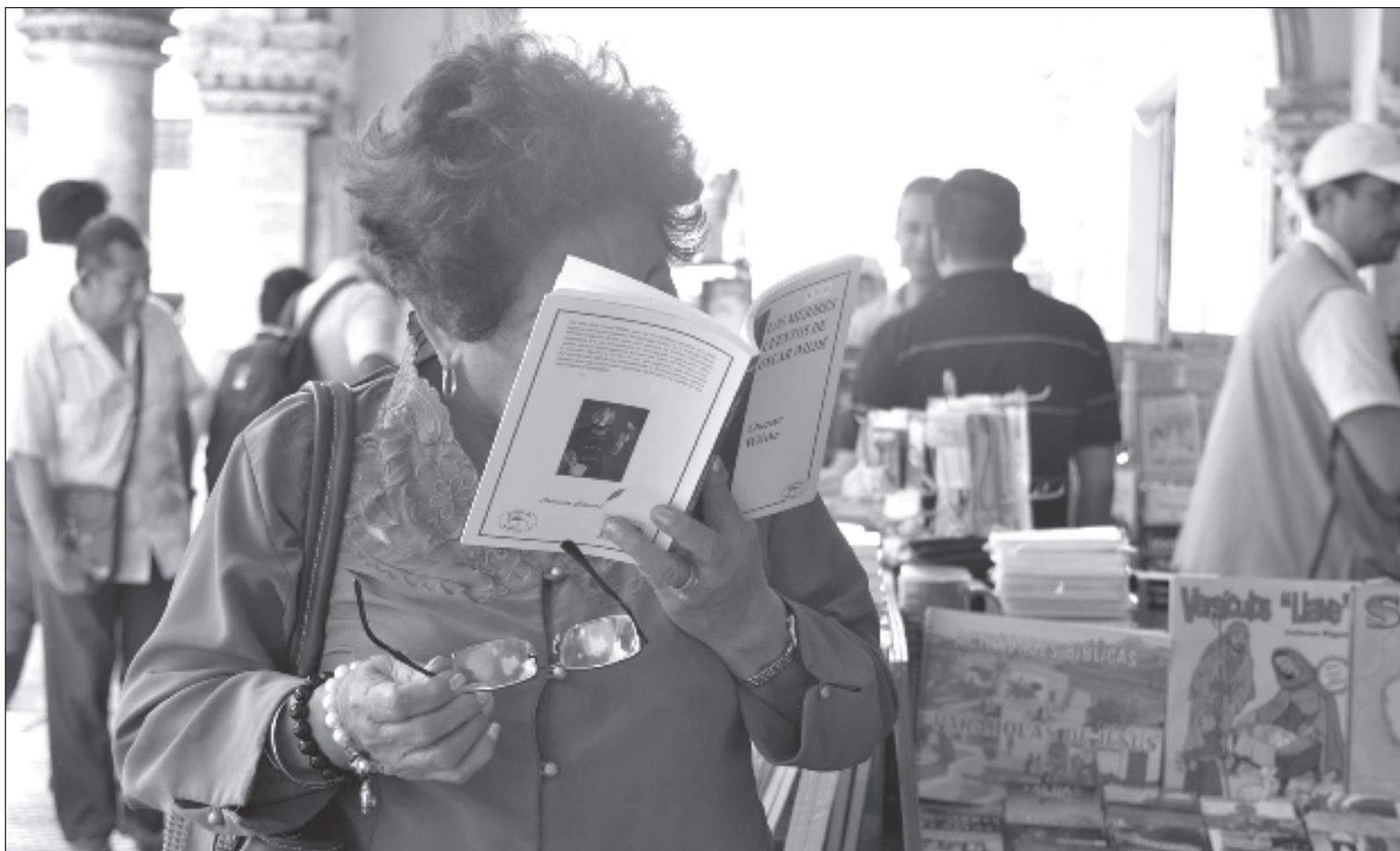
▲ “La lectura de un texto que circula desde Colombia sobre Colón, sacude y hace que me pregunte el grado de ignorancia en la que hemos vivido”.