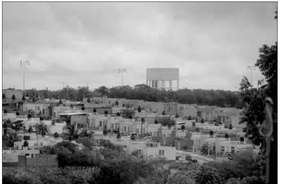
▲ Para evitar que el próximo año incremente la deuda de los créditos inmobiliarios del Infonavit, es importante pasarse de Veces Salario Mínimo (VSM) al cobro en pesos.

Otra de las condiciones es que puede haber una dis-