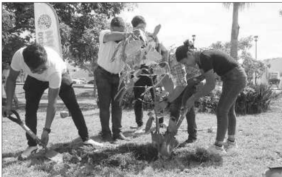
▲ Con el programa Arborizando tu universidad , se han distribuido más de 900 mil árboles en 97 municipios, lo que representa 2 mil 774.05 hectáreas arborizadas.

Arborizando Yucatán se trabaja también con las Universidades con el programa (REDUS) Red Estatal de Universidades Sustentables a