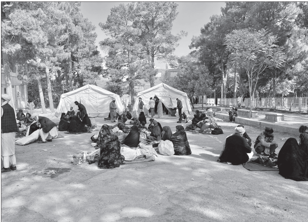
▲ En Herat, la mayoría de los habitantes siguen durmiendo a la intemperie una semana después del mortífero terremoto del 7 de octubre, que dejó un millar de muertos, por temor a que se produzcan nuevos seísmos.

Antes de esa victoria, Azerbaiyán y Armenia se habían enfrentado en dos guerras por el control de este enclave montañoso, una en la década de 1990 cuando se desintegró la URSS y la otra a finales de de 2020, ganada por Azerbaiyán.