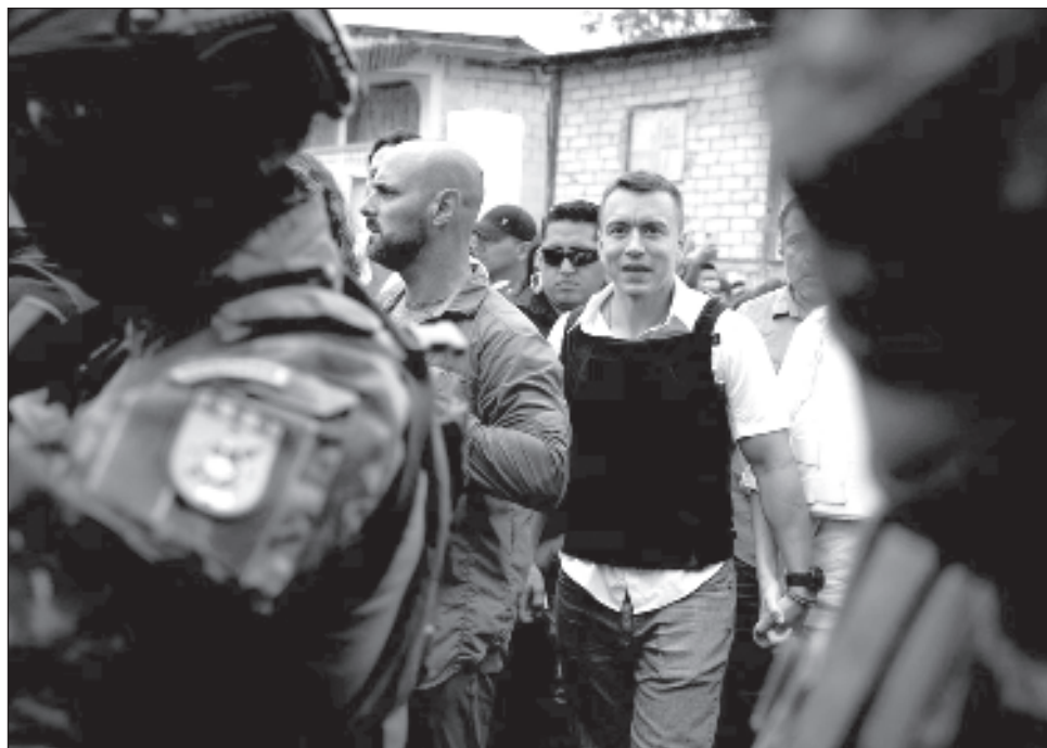
▲ El empresario y ex asambleísta, heredero de una de las familias más ricas de Ecuador, alcanza el sillón presidencial que hasta en cinco ocasiones se le resistió a su padre.

Esto convierte a Noboa, de 35 años, en el presidente electo más joven de la historia de Ecuador.