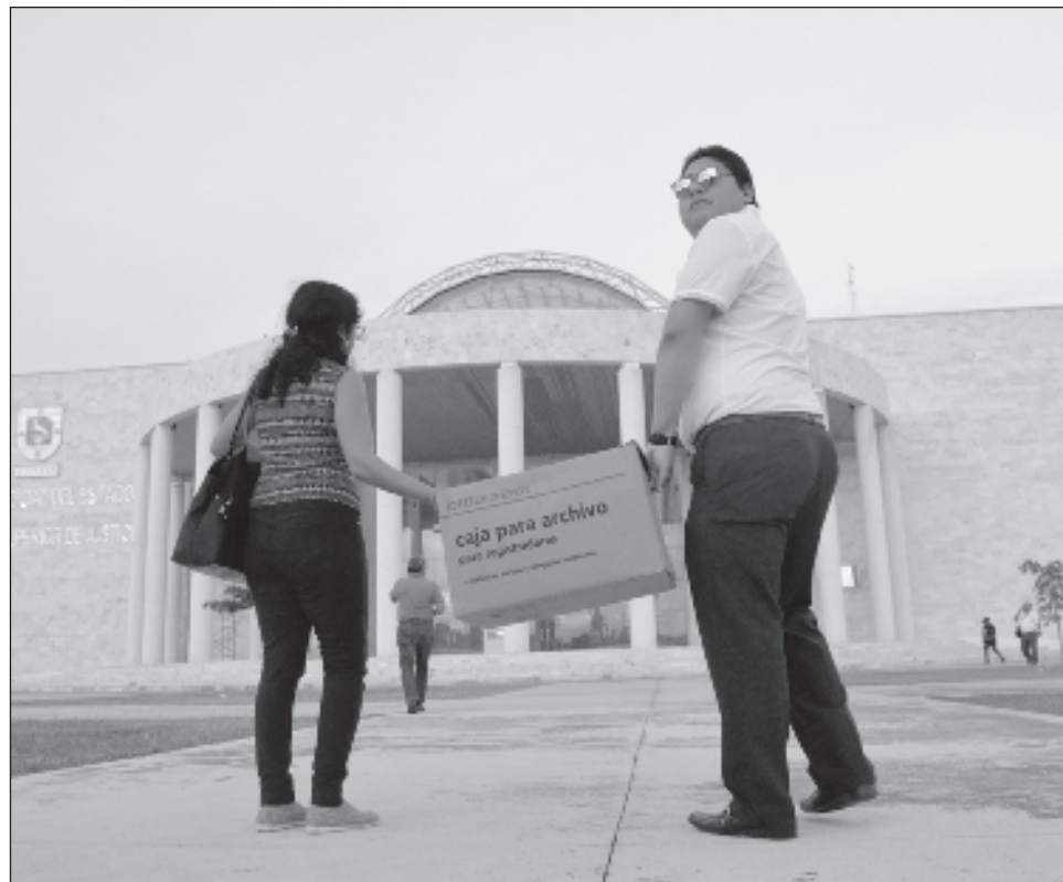
▲ El nuevo código establece obligaciones para los juzgados y tribunales que tienen que ver con la oralidad, la digitalización de expedientes, lo que implica modificación de su infraestructura, modernización de equipo, contratación y capacitación del personal.

Para ello, en el artículo sexto transitorio se establece: "En el caso de la Federación, la Cámara de Diputados, tomando en cuenta la estimación de ingresos aprobados para cada ejerci-