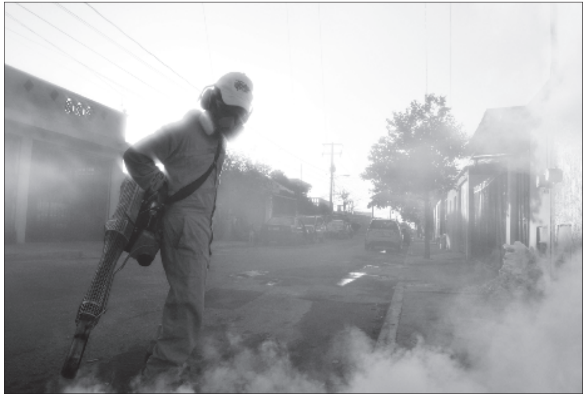
▲ “Según el Panorama epidemiológico del dengue 2023 , hasta el pasado 27 de septiembre se habían sumado 23 mil 241 casos confirmados en el país. Yucatán, Veracruz y Quintana Roo encabezan la tabla con 5 mil 780, 4 mil 625 y 3 mil 76 casos.”.

LAS VOCES QUE en la región hablan del dengue acusan diferentes causas. Cuando se dice que su control “es responsabilidad de todos”, no está claro si estas responsabilidades se trazan a escalas equiparables. Hay quienes apuntan que es deber del vecino —el de junto, de enfrente o del patio colindante— limpiar sus espacios y liberarlos de cazarros, que luego se apiñan en las esquinas de ciertos barrios de la capital. Para otros, la cuestión subyace en infraestructuras urbanas que facilitan estancamientos