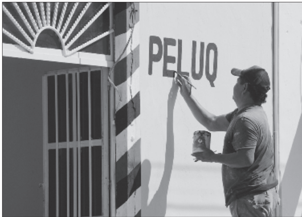
▲ En su reporte de septiembre, el IMSS destacó que la entidad registró un crecimiento anual de 4.5 por ciento respecto al mismo mes del 2022.

De esta forma, entre septiembre de 2022 y 2023 fueron creadas 18 mil 413 nuevas fuentes de trabajo y de enero a febrero del año en curso hubo un crecimiento de 3.4 por ciento en número de trabajadores asegurados y, en ese mismo periodo de meses, se generaron 14 mil 256 nuevos empleos.