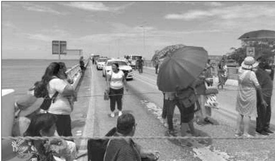
▲ Estiman que son más de 42 mdp de adeudo a los jubilados universitarios, por lo que esperan la presencia de un funcionario estatal o federal, ya que no confían en la rectora.