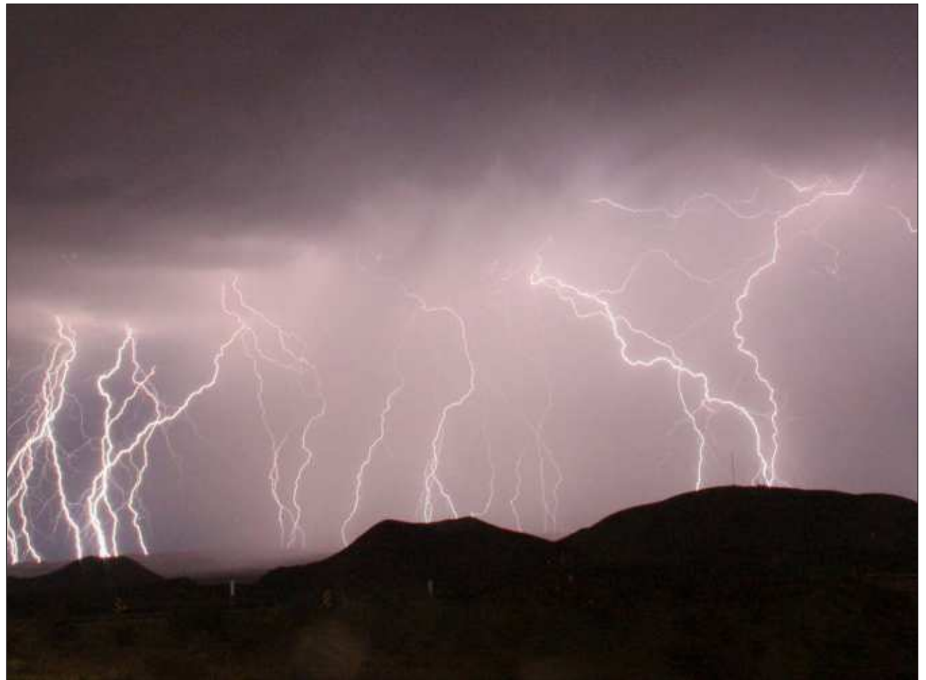
▲ U na'ata'al bix u jaats' cháake' je'el u yáantaj ti'al u yila'al wa je'el u tóokik k'áaxe'.