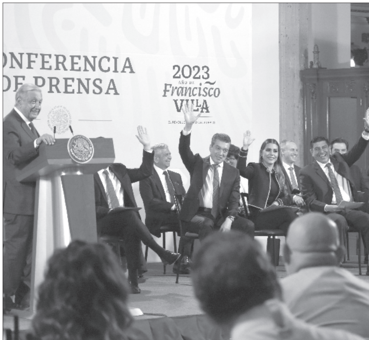
▲ En su conferencia de prensa mañanera en Palacio Nacional, el mandatario fue cuestionado sobre su opinión del proyecto de presupuesto del Instituto Nacional Electoral ante el proceso electoral de 2024.

“Nosotros no podemos modificar, cambiar, lo que envía el Poder Judicial a Hacienda, así como en el caso del INE, porque es facultad exclusiva del Poder Legislativo aprobar el presupuesto. Ellos sí pueden hacer cambios a los que enviamos, pero nosotros no”, concluyó.