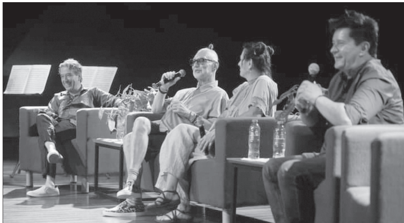
▲ El proyecto musical lleva 10 años de realizar giras en otros estados en la república, y surge gracias al melómano Sabo. Y señaló que "no habíamos nunca imaginado tocar con la OSY en Mérida, es un privilegio, sin duda alguna".

"Como todos, teníamos sueños de niños que luego se convierten en fantasías de adolescentes. Había un disco que me marcó mucho que fue Gemeni Suite de Jon Lord, integrante de Deep Purple (...) en donde siendo parte de una