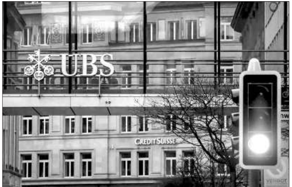
▲ Credit Suisse y UBS explican que Chile y México tienen cifras similares en desigualdad; 40 por ciento de la población más pobre pasó de concentrar 1.8 por ciento de la riqueza en 2000, a tener un patrimonio negativo de 0.1 por ciento en 2022 debido a las deudas adquiridas.

El informe elaborado por Credit Suisse y UBS exhibe