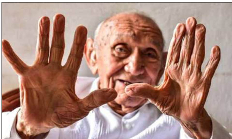
▲ El maestro nació el 23 de agosto de 1921, por lo que estaba a unos días de llegar a su 102 cumpleaños. En su camino dejó una huella indudable en el ámbito cultural del país.

En su camino dejó una huella indudable en el ámbito cultural del país.