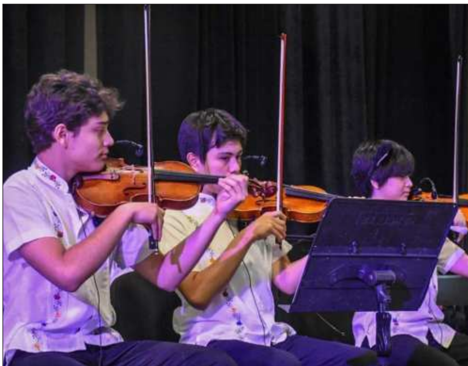
▲ El objetivo del centro es ofrecer educación musical de calidad para que los menores de edad residentes de la capital yucateca consoliden sus habilidades artísticas.

Los interesados pueden visitar la liga https://www.merida.gob.mx/municipio/sitios.php/merida/descargas/Convocatorias/conv-cmm2023.pdf para más información.