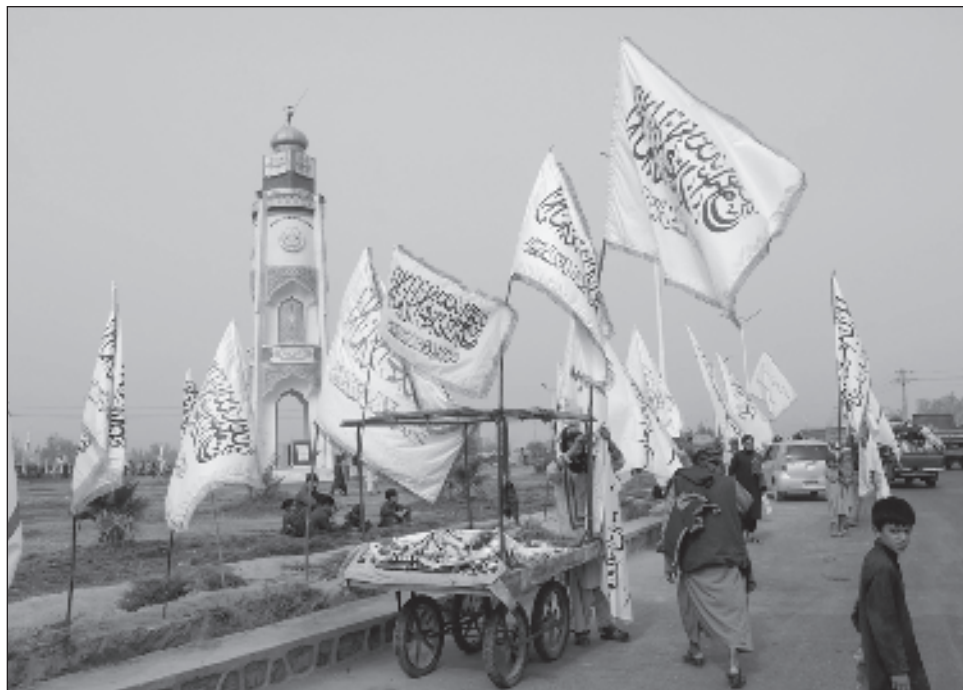
▲ Al hacer balance después de dos años, el portavoz de los talibanes dijo que no hay amenaza para el régimen desde dentro o fuera del país y que no necesitan la ayuda de nadie.

En los últimos dos años, se ha vuelto cada vez más evidente que la sede del poder