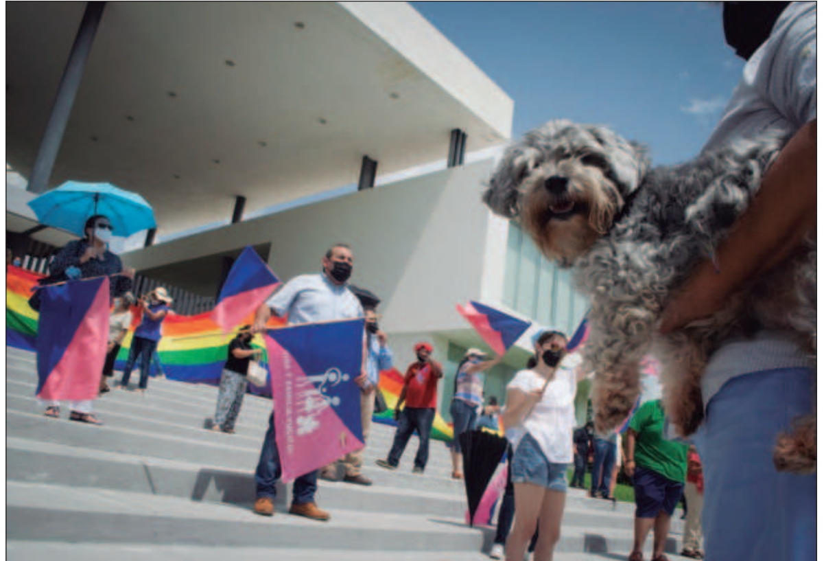
▲ “La convocatoria del FNF a quemar los libros de texto gratuito no es una ocurrencia de un pequeño grupo anticomunista. Es obra de una fuerza implantada en una parte de las clases medias tradicionalistas”.

El FNF no es un membrete reaccionario más. Es una fuerza política conservadora religiosa que surgió para enfrentar la iniciativa del gobierno de Enrique Peña en mayo de 2016, que buscaba legalizar en todo el país el matrimonio igualitario y la adopción homoparental. Como parte de su agenda se oponen, además, a la