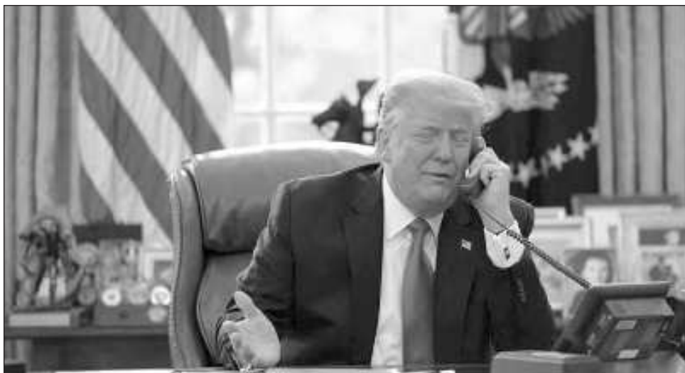
▲ Un jurado investigador los acusó de “conspirar ilegalmente y tratar de realizar y participar en una empresa criminal” después de que Trump perdió las elecciones en Georgia.