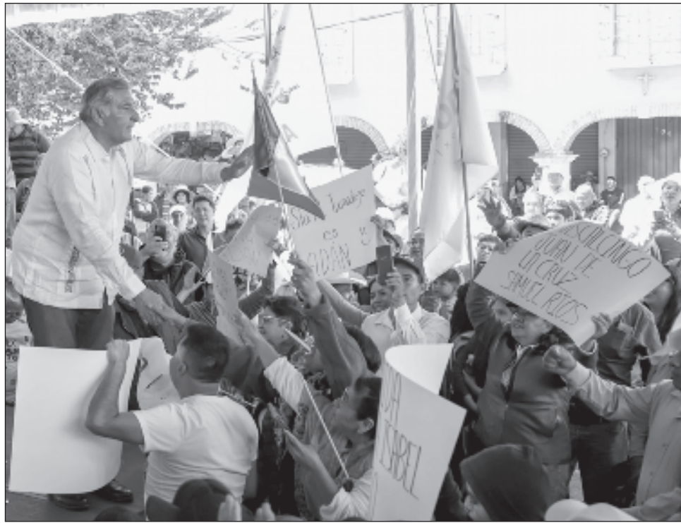
▲ El aspirante a la coordinación de la defensa de la 4T señaló que tiene mucho respeto y admiración por sus cinco compañeros y espera y desea que les vaya bien.

Afirmó que continuará hasta el último momento en el proceso que se desarrolla pues es una gente comprometida y agradecida con el movimiento, con su partido que le dio la oportunidad, lo nombró delegado nacional. “Mi partido decidió que era uno de los cuatro militantes del partido que debíamos de participar en este proceso interno y para mí es un ho-