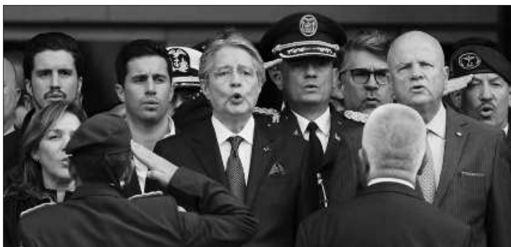
▲ La crisis de seguridad tiene una génesis fácilmente rastreable en el desmantelamiento del Estado emprendido por el ex mandatario Lenín Moreno y profundizado por su sucesor, Guillermo Lasso.

En suma, varias de las democracias sudamericanas se encuentran bajo un doble acecho: el del narcoestado y el de la restauración salvaje de las políticas neoliberales que devastaron a la región hace tres décadas, y de cuyos efectos apenas comenzaban a reponerse las naciones que experimentaron el giro a la izquierda de inicios de siglo.