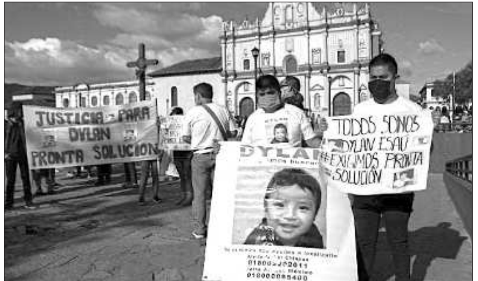
▲ Estos 73 casos formaban parte de un total de 309 documentados por la organización Melel Xojobal durante el primer semestre del año pero 236, 76 por ciento del total, ya fueron encontrados.

La Red por los Derechos de las Infancias y Adolescencias en Chiapas (Redias), integrada por diversas agrupaciones, entre ellas Melel Xojobal, afirmó que "es necesario el trabajo coordinado entre autori-