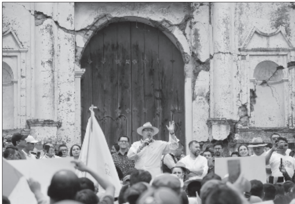
▲ Quienes actualmente ven en Arévalo "al mismísimo demonio", son los herederos, en fortunas y en ideas, que se beneficiaron del golpe de Estado que se dio en 1954, asegura Helen, una de las precursoras de la lucha por la justicia y los derechos humanos de su país.

En la larga batalla por el esclarecimiento y la justicia por el asesinato de su hermana, la reconocida antropóloga