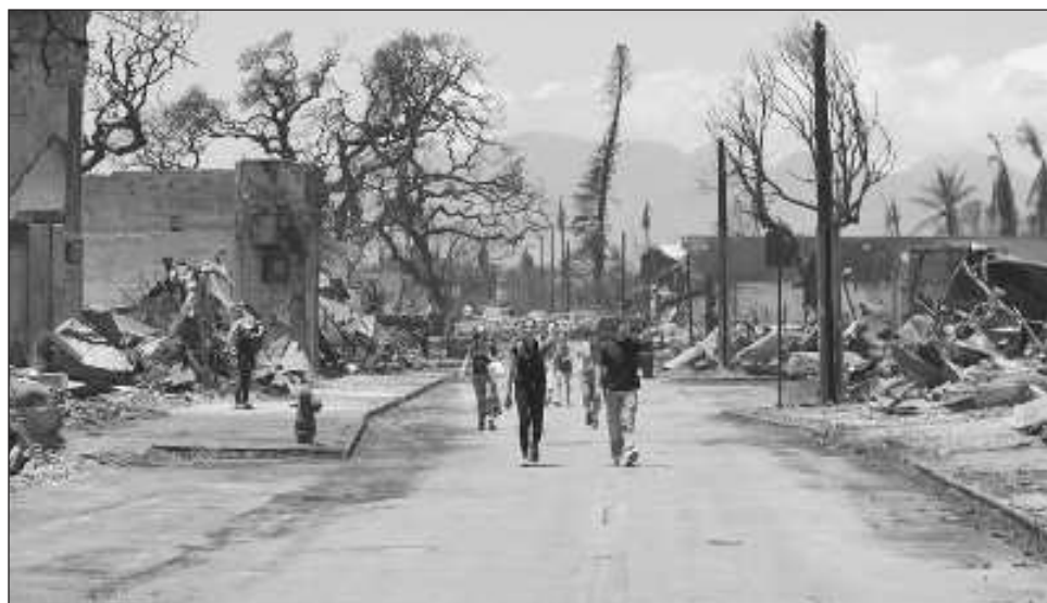
▲ La empresa Hawaiian Electric Co. enfrenta críticas por no cortar la electricidad ante las advertencias de fuertes vientos y mantenerla incluso cuando decenas de postes comenzaron a caerse.

Entre tanto, algunos funcionarios estatales dijeron que faltaba agua para los bomberos, algo que atribuyeron a un fallo judicial re-