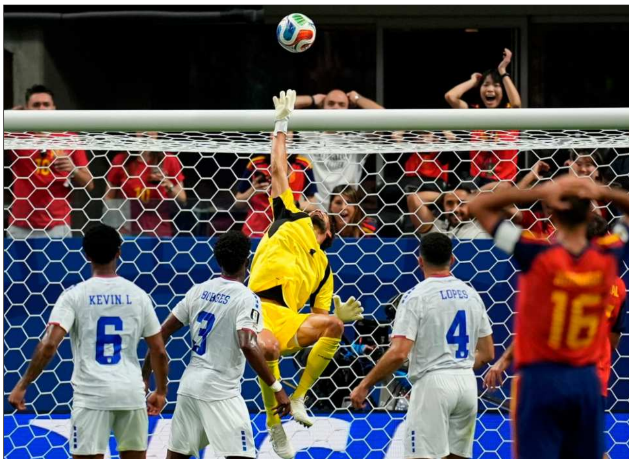
▲ Las ocasiones en que los dirigidos por Luis de la Fuente lograron superar el muro defensivo del conjunto africano, el guardameta Vozinha evitó la caída de su marco con increíbles atajadas, permitiendo a Cabo Verde llevarse un punto.

España tuvo que recurrir a su principal estrella, Lamine