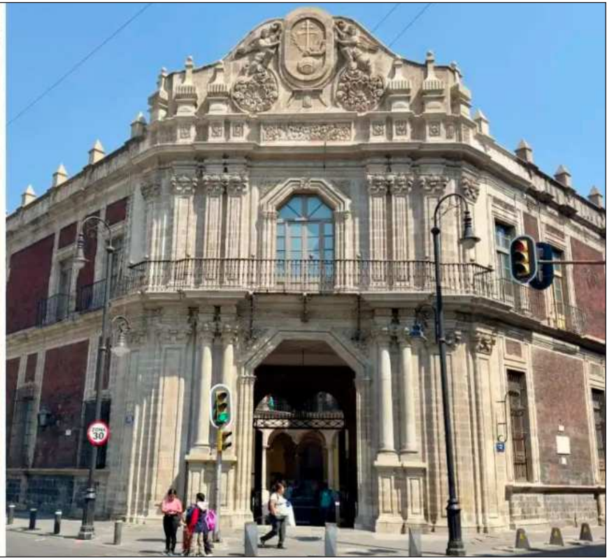
▲ De lunes a domingo, cualquiera puede acceder, asombrarse con las exposiciones de herbolaria, botánica y anatomía. En la fotografía, un aspecto del Patio de Columnas, parte de las Antiguas Cárceles de la Perpetua, y la fachada del Palacio de la Escuela de Medicina.

cules, símbolo del triunfo de la corona española sobre los océanos, y, en la parte superior, dos ángeles custodian el escudo del Tribunal del Santo Oficio: emblema de la fuerza y el poder de la religión sobre el mundo, enmarcado por la leyenda Exurge Domine Iudica Causam Tuam (Levántate, Señor, y juzga tu causa).