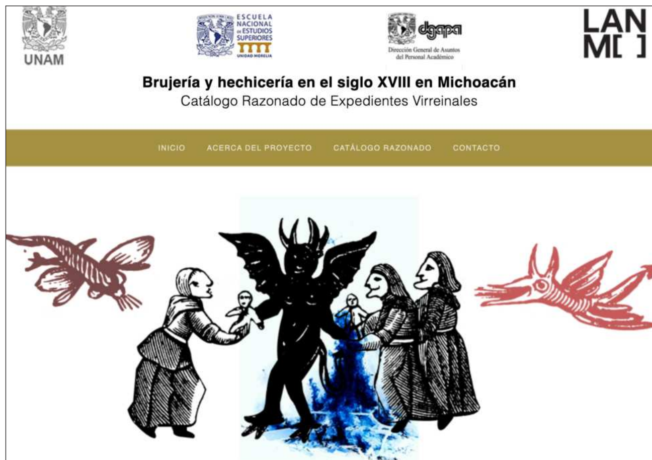
▲ El proyecto se enfocó en 59 de esos oficios, los cuales se relacionan con brujería o hechicería. La investigadora agregó 34 documentos de la serie Procesos criminales , en los que se observa el funcionamiento de la justicia eclesiástica en delitos contra la fe.

En entrevista con La Jornada , López Ridaura explicó que los testimonios, aunque escritos, recuperan la forma de hablar de quienes testificaban. Al tener todos los expedientes en un solo lugar, agregó, es fácil distinguir repeticiones en los discursos. "Cuando la gente se ve obligada a hablar sobre brujería, recurre al imaginario colectivo". Así, según la experta, se pueden encontrar elementos de la literatura popular, que se transmite de generación en generación.