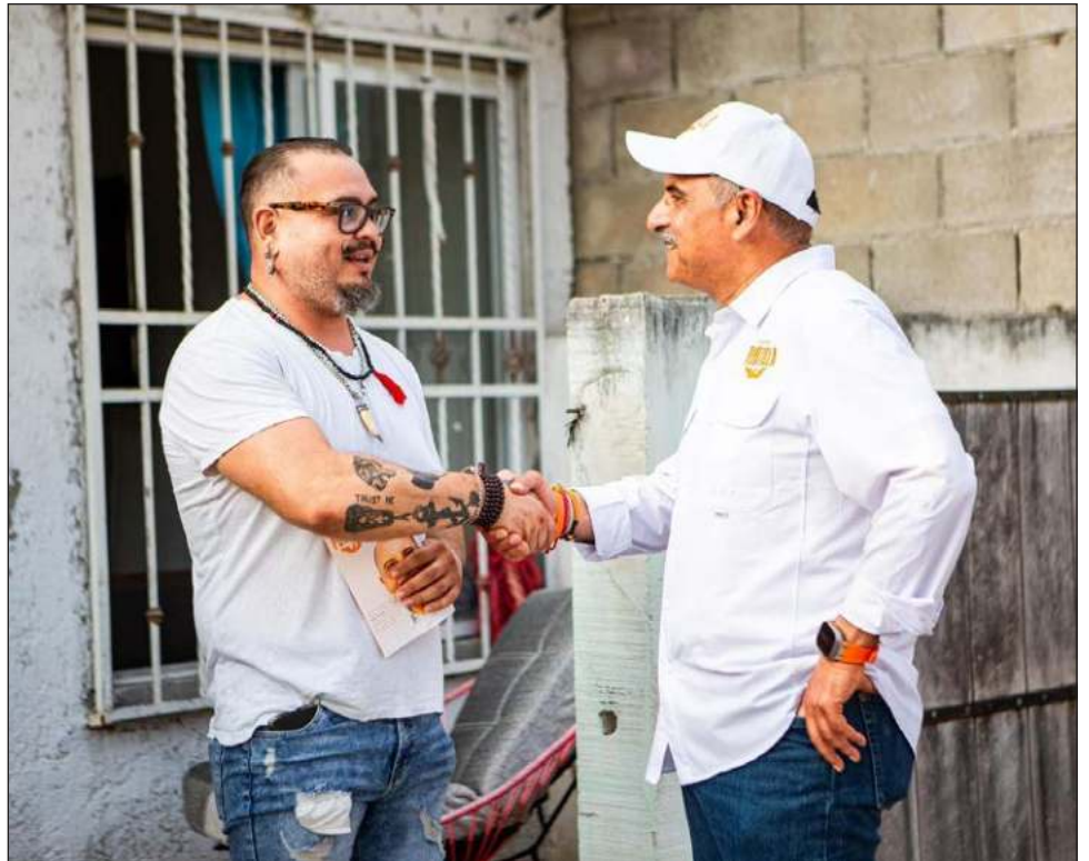
▲ El aspirante de Movimiento Ciudadano a la presidencia municipal de Tulum realizó una visita casa por casa en el fraccionamiento Guerra de Castas.

Las ciudadanas y ciudadanos, externó el candidato, se quejaron de la inseguridad, de los pésimos servicios municipales y del abandono en que se encuentran los pequeños parques del fraccionamiento.