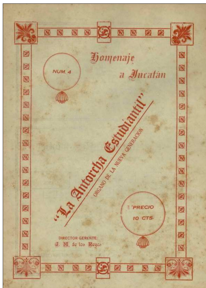
▲ “ La Antorcha Estudiantil. Órgano de la Nueva Generación (...) dedicó su número 4 a dicha entidad del sureste mexicano en febrero del mismo año”. Foto Facsímil