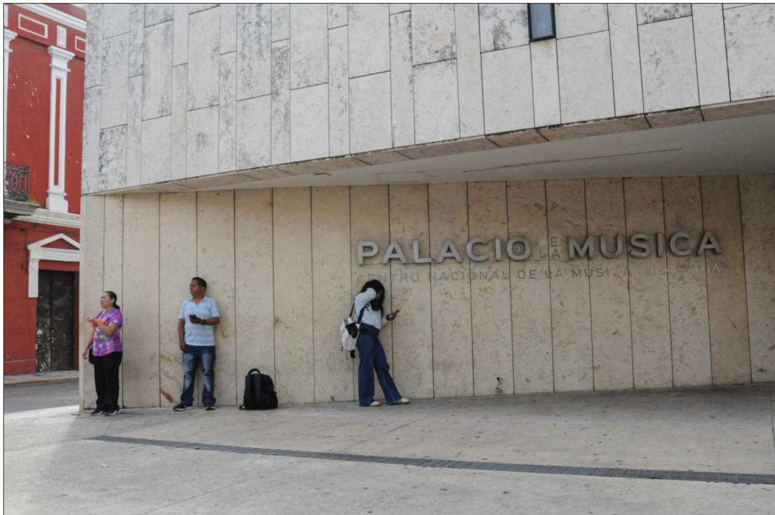
▲ "Siempre estamos esperando algo: algo diferente, algo que deseamos o que no deseáramos que pasara, algo que aún no sabemos nombrar".