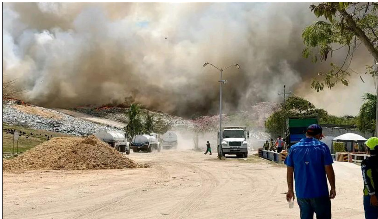
▲La Dirección de Protección Civil Municipal considera que ha logrado contener el incendio, sin embargo, reconoce que con un cambio en las corrientes de aire el fuego puede reanimarse.

Por ahora, las llamas se encuentran extinguidas de la superficie