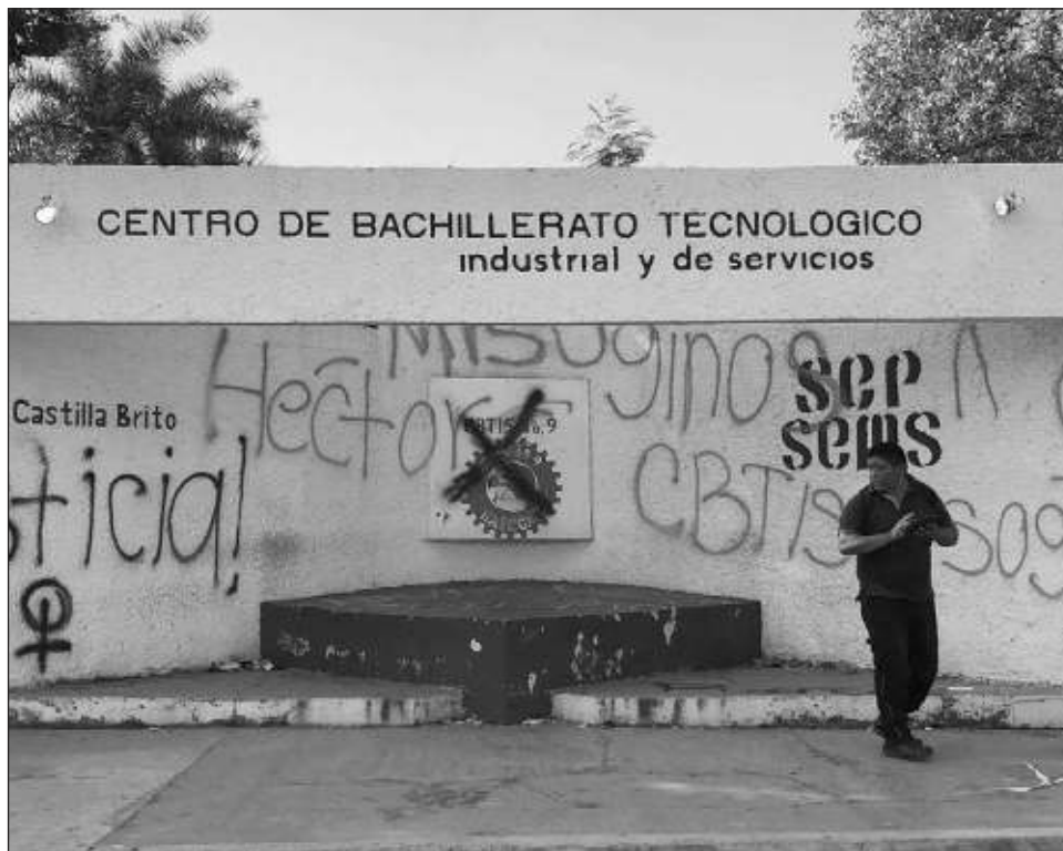
▲ Alumnas, padres de familia y activistas trabajarán en una estrategia legal.

“Por esa razón el viernes valorarán las acciones, pues la escuela sólo hizo un movimiento de clave pero el funcionario acusado y posible