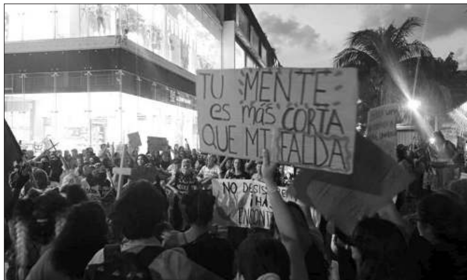
▲ La violación es un delito que va en aumento en Quintana Roo: en 2021 se reportaron 2 mil 553 delitos sexuales (794 violaciones) y para 2022 fueron 2 mil 832.

Salvador Guerrero destacó la importancia de fomentar una cultura de prevención de delitos de alto impacto en Quintana Roo a través de la tecnología y presentó la aplicación llamada No