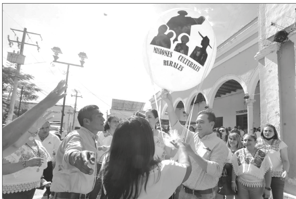
▲ "Las misiones culturales son la herencia vigente de la Revolución; su objetivo principal es contribuir con la formación de ciudadanos capaces de desarrollarse por sí mismos".