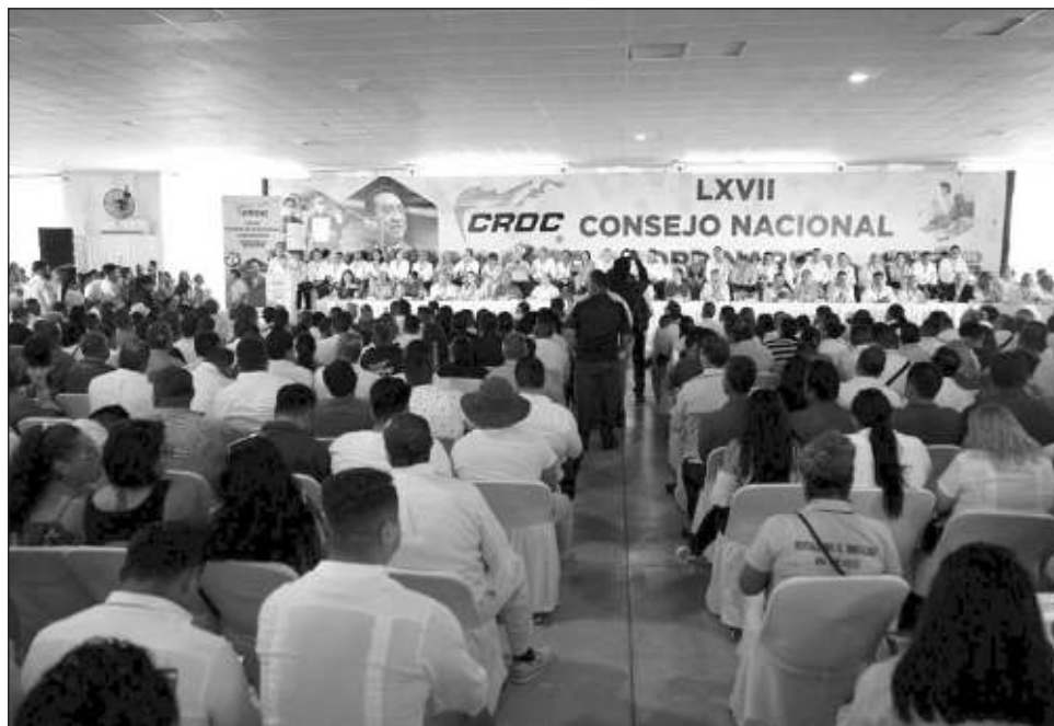
▲ En el LXVII Consejo Nacional Ordinario de la CROC, celebrado en Cancún, la secretaria federal de Trabajo afirmó que la prioridad es el respeto a los derechos laborales.

“Se han generado muchos empleos y la verdad es que eso nos ha permitido recuperar y va aumentando el salario promedio, todavía hay que seguir empujando más el salario en esta región, pero hemos avanzado”, compartió la funcionaria federal en entrevista luego de su participación en el LXVII Consejo Nacional Ordinario de la Confederación Revolucionaria de Obreros y Campesinos (CROC), celebrado este miércoles en Cancún.