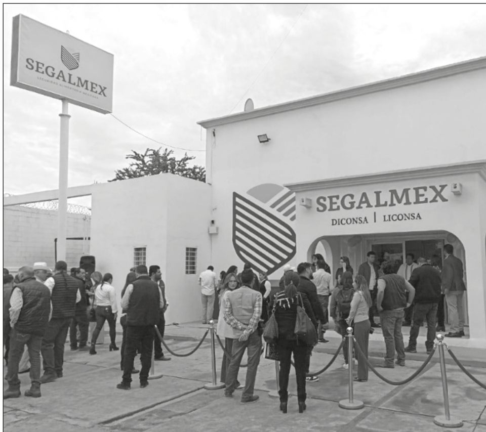
▲ A Gavira Segreste se le acusa de haber participado en la compra simulada de más de 7 mil toneladas de azúcar a través de Diconsa.

Para que se le concediera el beneficio de la suspensión provisional, el juzgado séptimo de distrito impuso a Gavira Segreste el pago de una garantía de 5 mil pesos.