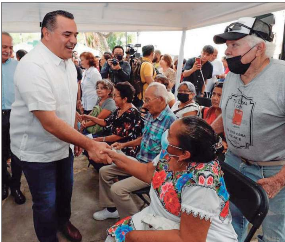
▲ La Feria de la Salud es producto del convenio firmado por el ayuntamiento y el Hospital Regional de Alta Especialidad de la Península de Yucatán en febrero de 2022.

Finalmente, refirió que la Feria se pretende realizar de manera periódica, a fin de extender sus beneficios a un mayor número de personas que viven en colonias, fraccionamiento y comisarías de la ciudad, que encuentran en las ferias de la salud y los módulos médicos del Ayuntamiento de Mérida una alternativa importante para atender su salud.