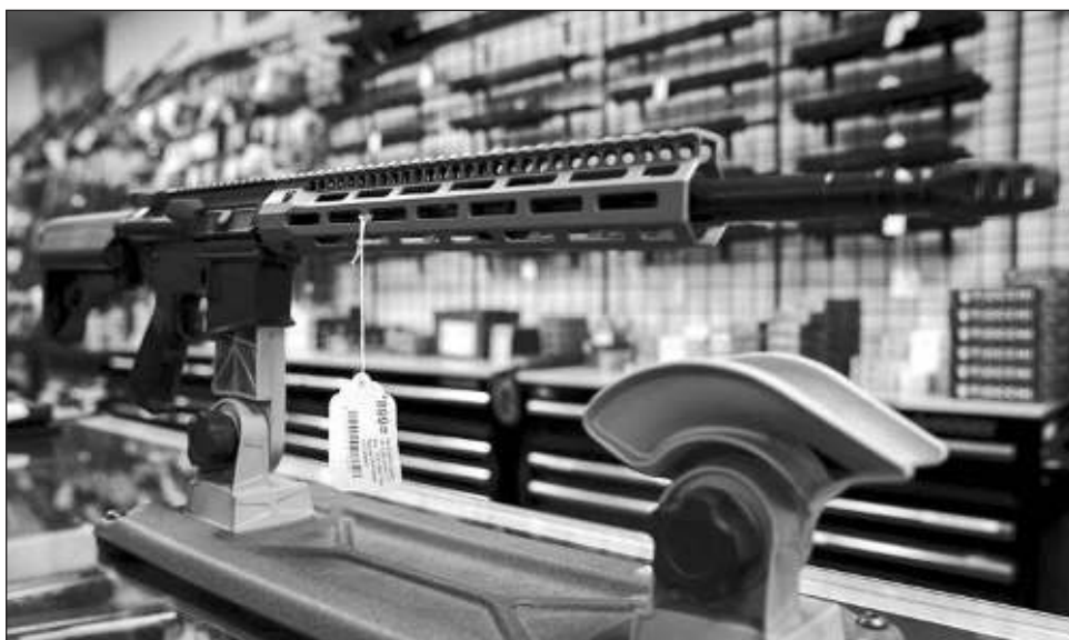
▲ AMLO señaló que las armas que utilizan los narcotraficantes en México provienen de Estados Unidos: "80 por ciento de las armas de alto poder vienen de EU, no hay control".

Señaló que es positivo que se promuevan estas acciones y se ventile el tema públicamente porque antes las autoridades mexicanas "se quedaban calladas, no decían nada, al contrario se hizo el acuerdo del operativo rápido y furioso para meter armas a México con sensores" supuestamente para localizar a los criminales.