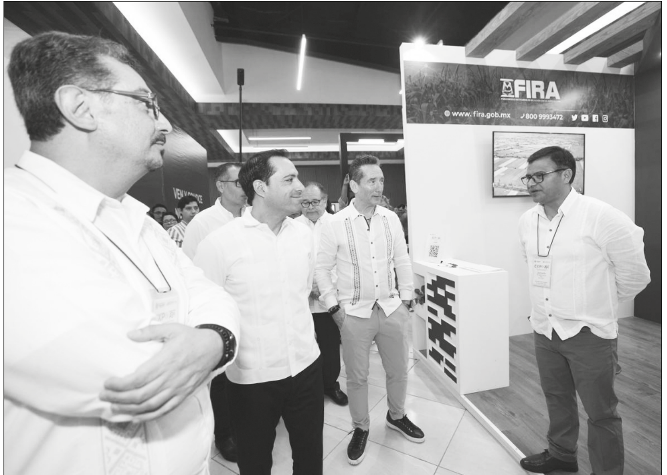
▲ La Asociación de Bancos de México eligió a Yucatán para organizar la Expo Mundo PYME ABM, que se llevó a cabo en la capital hasta este jueves 16 de marzo, y la 86 Convención Bancaria del conglomerado.

El gobernador agradeció a Becker por elegir la entidad para organizar esta Expo y la 86 Convención