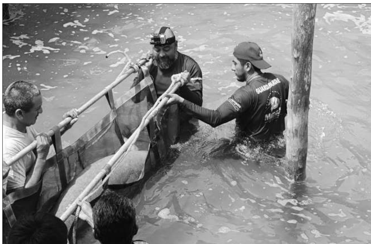
▲ El manatí fue rescatado en 2021, tiempo desde el cual se mantiene bajo cuidado humano.