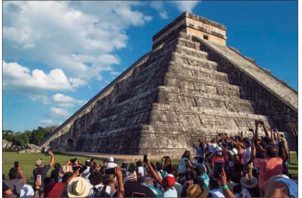
▲ En Chichén Itzá, el fenómeno arqueoastronómico puede apreciarse en la pirámide de El Castillo entre las 15:30 y 16:15 horas, dio a conocer el INAH.

Recomiendan a los asistentes usar calzado cómodo, repelente contra insectos y recordó que si está permitido el acceso con botella de agua, pero los alimentos están prohibidos.