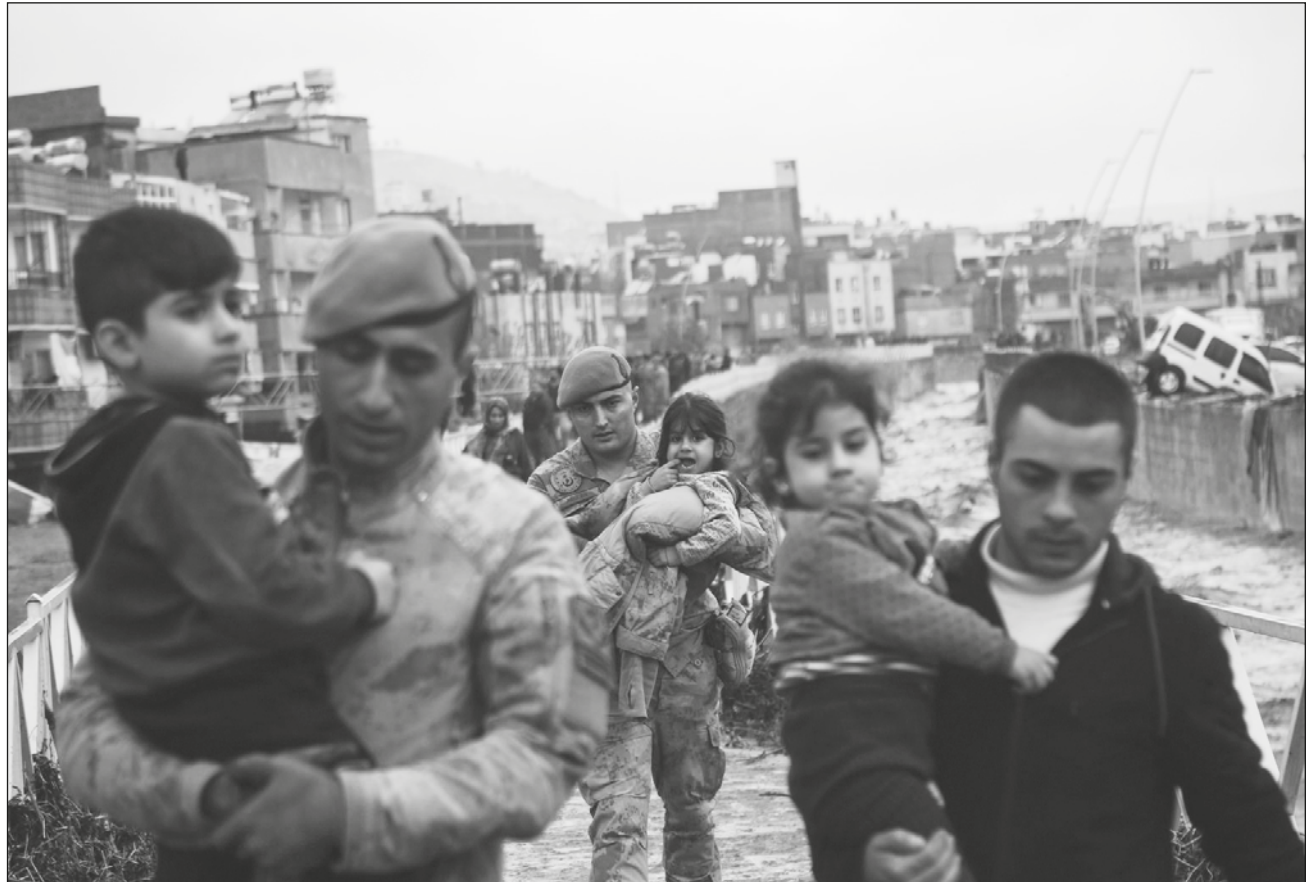
▲ Las imágenes de televisión de Sanliurfa mostraban cómo el agua corría por una calle arrastrando a autos a su paso.

Al menos cinco personas están desaparecidas, dijo el ministro del Interior, Suleyman Soyly, quien agregó que 12 personas fallecieron en la provincia de Sanliurfa y dos más en la localidad de Adiyaman, donde la crecida arrastró el contenedor donde vivía un grupo de sobrevivientes del sismo, indicó el gobernador, Numan Hatipoglu.