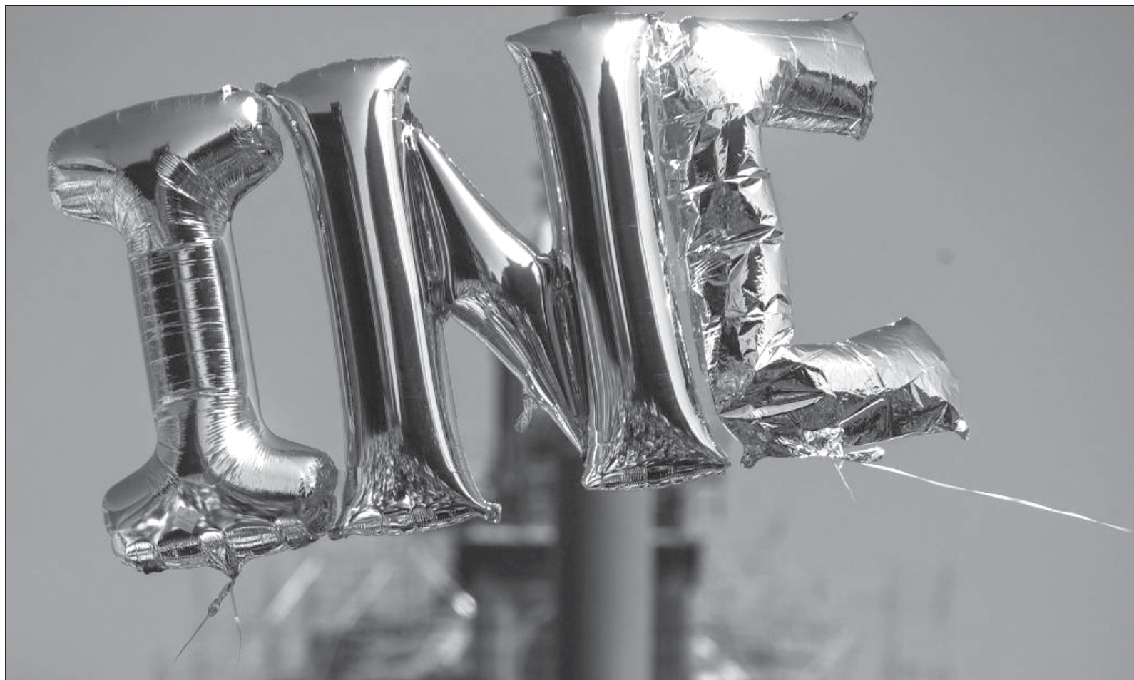
▲ “Los enemigos de Andrés Manuel López Obrador obstaculizan cualquier cambio y judicializan todo para imponer un legalismo que de facto anula y contraviene el artículo 39 de la Constitución: todo poder público dimana del pueblo y se instituye para beneficio de éste”.