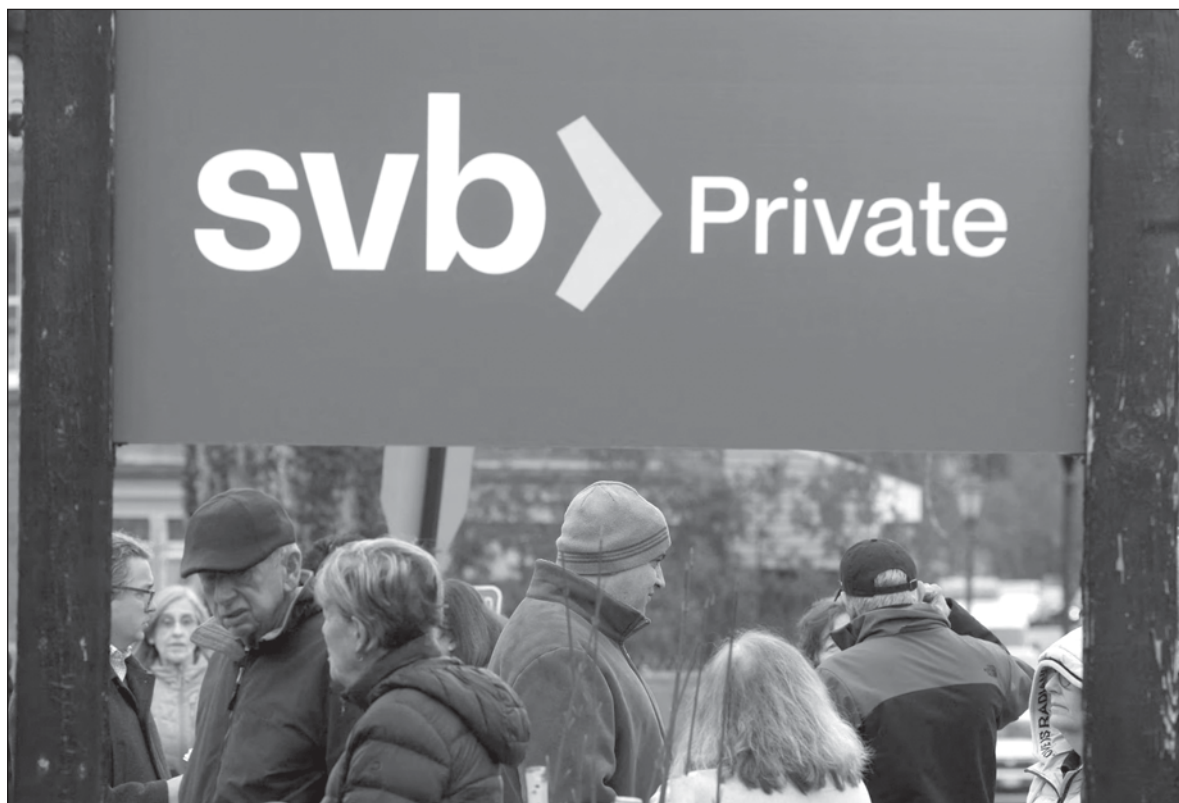
▲ "SVB could not meet the demand for cash since it was locked into bonds which due to rising interest rates had lost value. They now needed to raise funds to cover their losses".

SVB WAS THE 16th largest U.S. bank, and this is the worst banking collapse since the great recession of 2008.