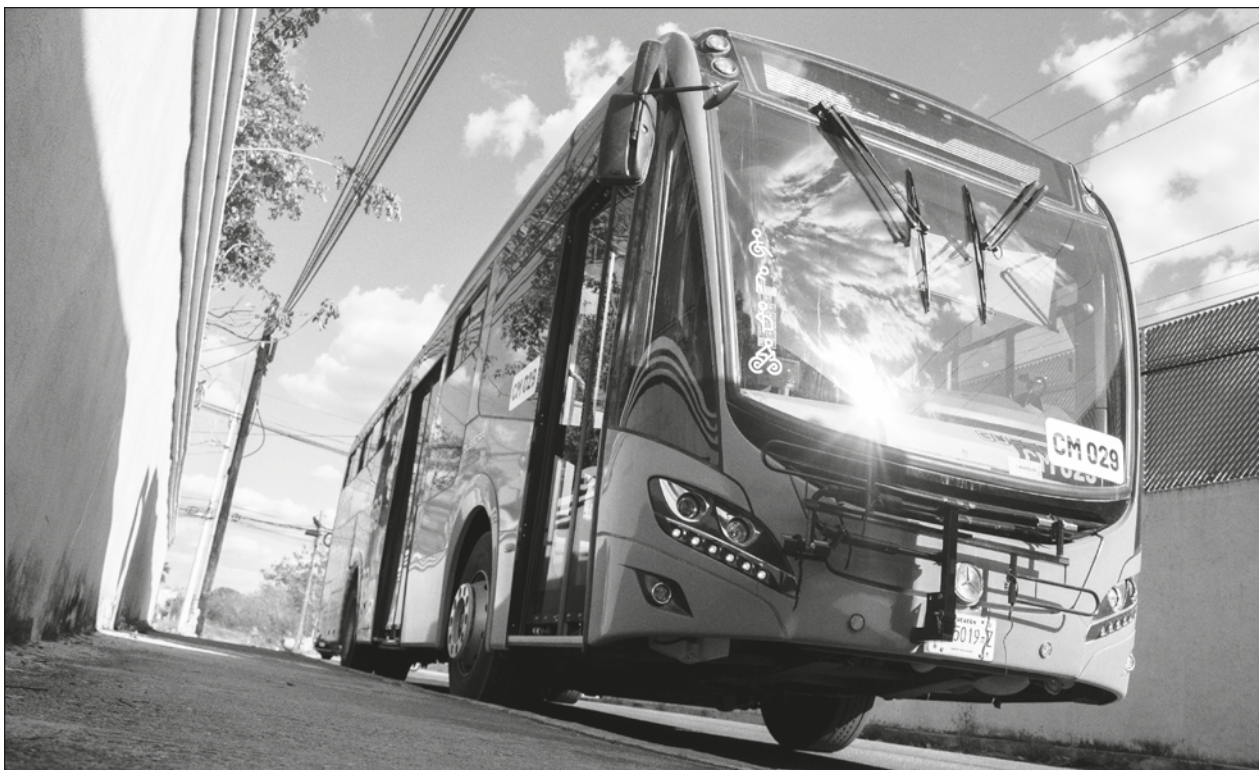
▲ El pasado 4 de marzo la ruta de Circuito Metropolitano de Mérida se incorporó al sistema Va y Ven.

La estudiante detalló que además de la entrega de esta información a la SDS, ya hay también 12 denuncias por parte de la población y, sin embargo, las afectaciones continúan y las acciones para controlar la situación son muy lentas, dijo.