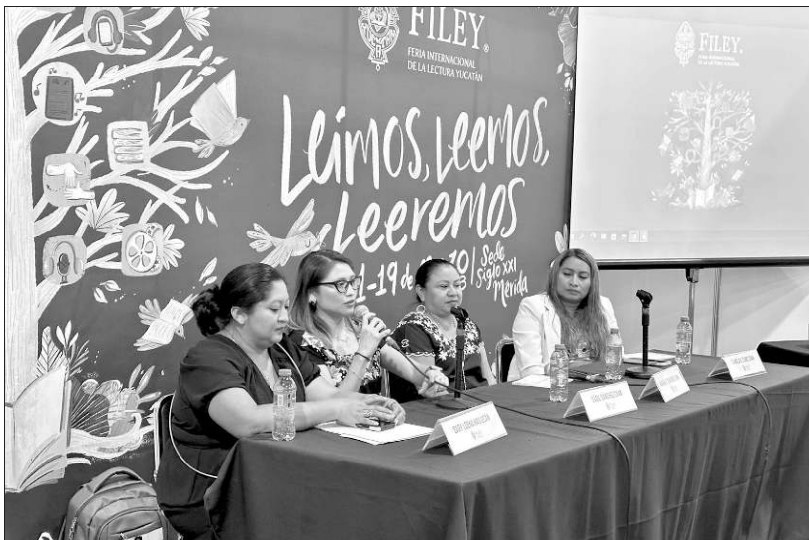
▲ La lingüista reflexionó que no solamente se trata de la escritura y los textos en lengua maya, sino también en cómo éstos son presentados al público; destacó que realizar este tipo de producción literaria es un esfuerzo y también hay que procurar la creación de lectores.

“Si uno lee en español, ya lo puede hacer en maya”, dijo. Sin embargo, reconoció que “si no llegamos y les decimos está en maya automáticamente nosotros que siempre aprendimos a través del español, siempre decimos, no es que está difícil, no puedo leerlo”.