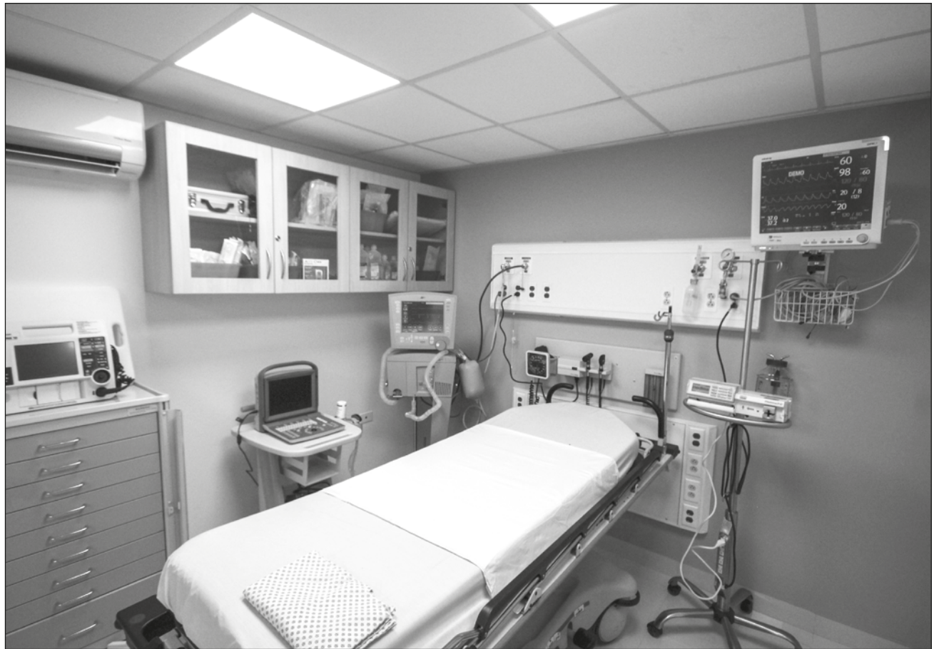
▲ Un procedimiento mal hecho puede ocasionar desde la necrosis de un tejido hasta la muerte del paciente.

la necrosis de un tejido, porque han puesto mal tal vez el ácido hialurónico, tan superficial que no llega circulación a las células y se muere el tejido de una nariz, hay casos y esto provoca desde resultados no