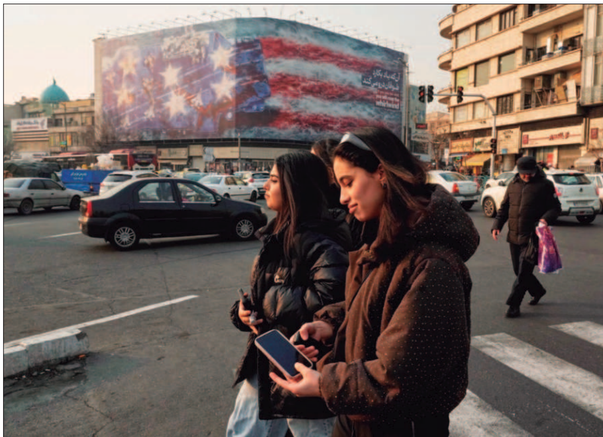
▲ “El enemigo común de la humanidad es el sistema que hizo posible el genocidio en Palestina, incluyendo el capital financiero que lo financia, los algoritmos que lo ocultan y las armas que lo posibilitan”.

los instruyeron para causar muertes y destrucción en Irán con la finalidad de sembrar el caos y decapitar al régimen. Esta operación fracasó. Ahora se espera un nuevo ataque militar estadounidense. Las repercusiones en la economía global podrían ser devastadoras. El cierre del estrecho de Ormuz y las pérdidas económicas en los países de la región, podrían ser muy graves. Y un golpe durísimo a la economía mundial.