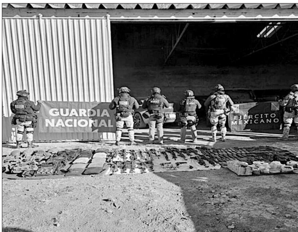
▲ Se incautaron 21 armas de fuego, 19 largas y dos cortas, un lanzagranadas, ocho granadas, 128 cargadores, 5 mil 839 cartuchos, 16 vehículos y equipo táctico.

“De esta manera, la Guardia Nacional, el Ejército y la Fuerza Aérea reafirman la indeclinable decisión del gobierno federal para inhibir las actividades de la delincuencia organizada y reafirmar su compromiso de velar y salvaguardar la paz y seguridad de la población”.