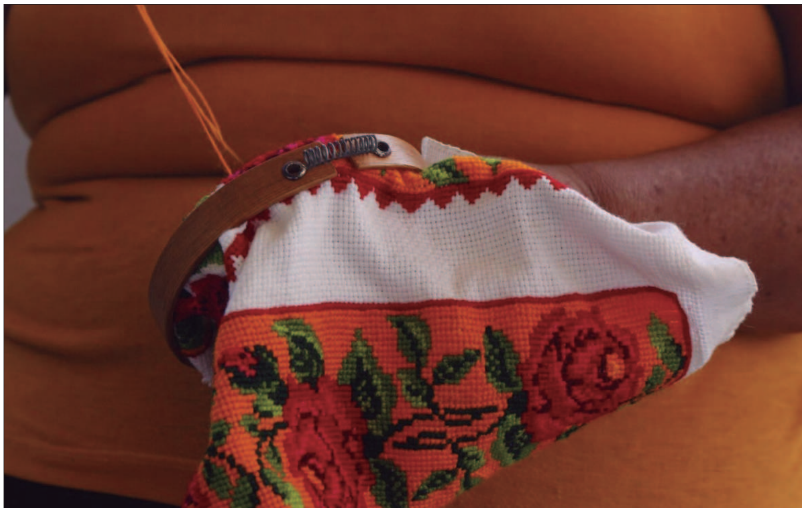
▲ “No es tan fácil que alguien que no conoce el valor que tiene y el tiempo de elaboración de este bordado quiera pagar una prenda así”.

damos a las comunidades más aisladas a llegar más lejos.”