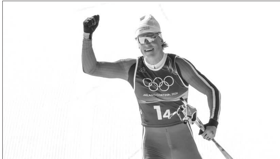
▲ Noruega llegó a 12 oros durante la jornada dominical de los Juegos de Milán-Cortina. En la imagen, Johannes Hoesflot Klaebo, quien estableció un nuevo récord olímpico invernal con su noveno triunfo.

Klaebo completó una carrera impecable, aunque con apariencia desenfadada, y redujo la velocidad antes de la meta para saludar con la mano a los aficionados que lo vitoreaban, antes de terminar en una hora, 4 minutos y 24.5 segundos. Francia mantuvo su sólido rendimiento y fue segunda, mientras que Italia quedó tercera.