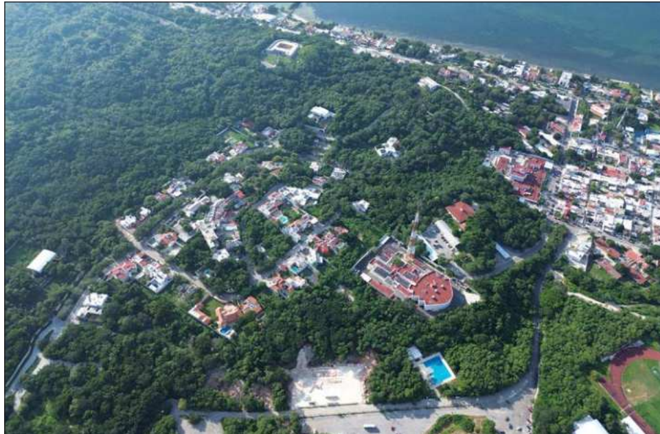
▲ La gobernadora Layda Sansores confirmó que la Universidad Nacional Rosario Castellanos es un hecho y destacó la recuperación de tierras que pertenecían a los campechanos.

Ya se realizó la expropiación y está publicado en el Periódico Oficial del Estado; el Registro Público de la Propiedad y del Comercio