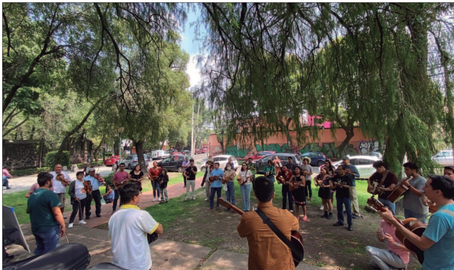
▲ “Tenemos talleres de música y de danza donde enseñamos a gente de todas las edades a tocar y a bailar”.

—Aunque las redes sociales son una gran herramienta y algunos artesanos ya las usan para difundir su trabajo, en la sierra, por ejemplo, no tienen ni señal; entonces, hay muchas maestras que quedan fuera de espacios de divulgación y de comercio. Esas son las comunidades en las que nos enfocamos, así también hacemos nuestra cartera, y ayu-