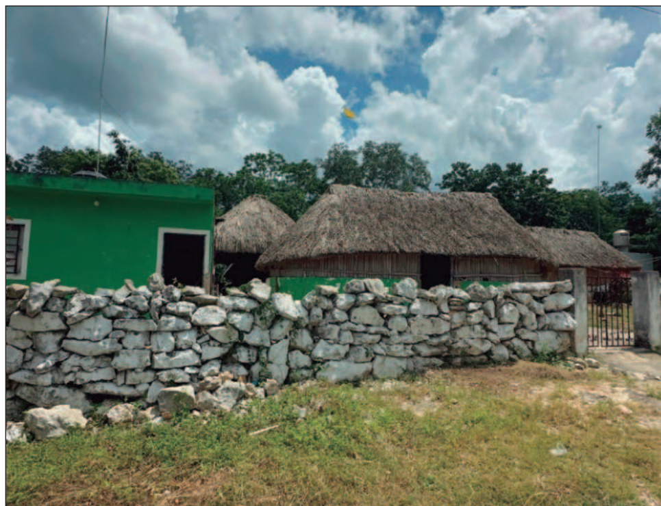
▲ El investigador destacó que el urbanismo maya fue injustamente menospreciado por no ajustarse al modelo europeo de ciudades reticulares.

Sin embargo, afirmó que estas ciudades conta-