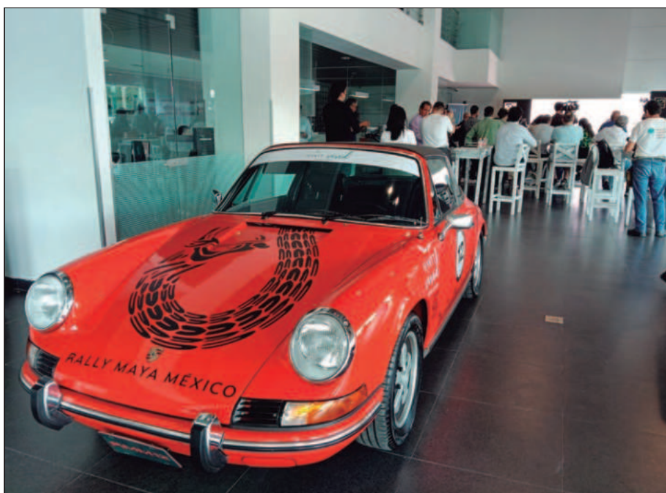
▲ Considerada como una de las competencias de regularidad más importantes del país y un "museo sobre ruedas". La ruta iniciará en Palenque e incluirá Calakmul y Chichén Itzá, esta última reconocida como una de las siete maravillas del mundo moderno.

Además de la competencia, el Rally Maya mantiene un fuerte componente social. En esta edición se apoyará a fundaciones en Chiapas dedicadas a niños con malformaciones congénitas y síndrome de Down.