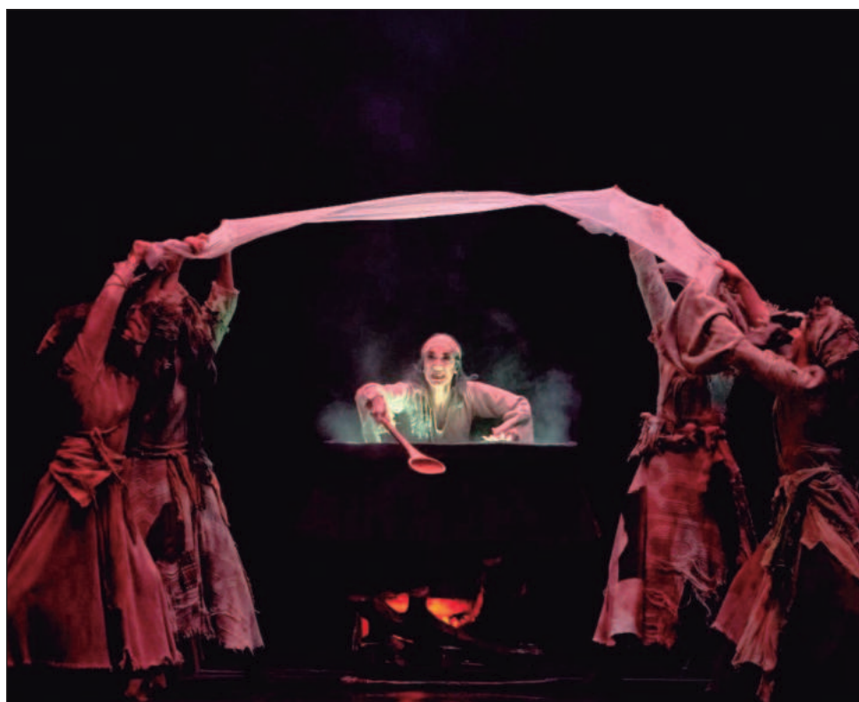
▲ Febrero trae La sífide y el escocés , en la versión de Terrence S. Orr basada en la obra de August Bournonville, acompañada por la Orquesta del Teatro de Bellas Artes.

Entre abril y mayo llegará uno de los momentos más singulares del año: la coproducción con la Compañía Nacional de Ópera de El amor brujo y La vida breve , de Manuel de Falla, propuesta que integra, danza contemporánea y canto.