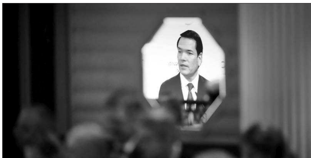
▲ La ultraderecha ni siquiera ha necesitado ganar elecciones para hacer realidad su agenda.

Como se ha señalado en este espacio, la obediencia geopolítica de Europa a Estados Unidos se basó siempre en un arreglo tácito por el cual las medianas potencias cedían su soberanía a cambio de que el "hermano mayor" corriera con la mayor parte de los gastos militares. Pero si desde Bruselas y Londres ya están desmantelando a marchas forzadas sus estados de bienestar a fin de cumplir con su "cuota" presupuestal en la desbocada carrera armamentística, queda claro que el alineamiento con el trumpismo ya no responde a razones prácticas, sino a que, aunque no les guste verse en ese espejo, la mayoría de los líderes europeos tiene más coincidencias que diferencias con el fascismo trumpiano.