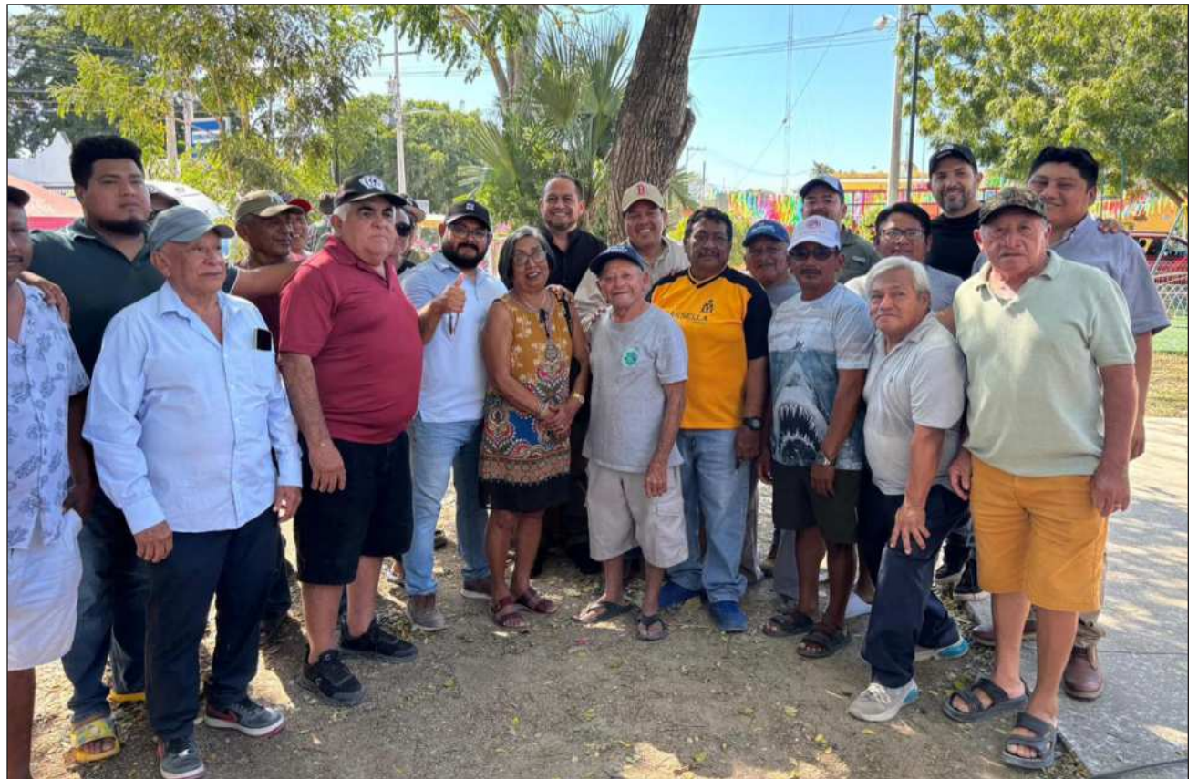
▲ Tras el acercamiento con las autoridades estatales, los manifestantes del grupo de campesinos de Sierra Papacal accedieron a reabrir el bombeo de agua potable y acordaron continuar con el diálogo durante los próximos días.

Como medida de presión, los ejidatarios realizaron el cierre de 10 pozos de agua potable que abastecen a las comisarias progresañas de