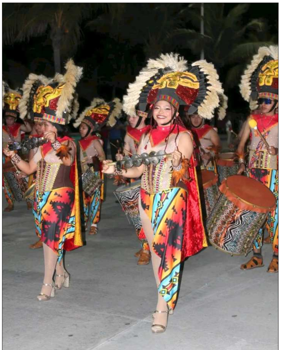
▲ Comparsas, batucadas y carros alegóricos animaron el arranque; reportan saldo blanco.

Las autoridades de seguridad reportaron que hasta el momento se mantiene saldo blanco en esta celebración del Carnaval Carmen 2026.