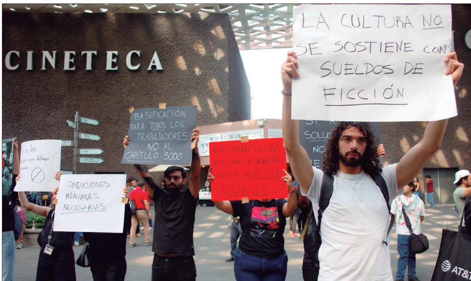
▲ La problemática laboral, aseguraron afecta al personal que consta de 340 trabajadores. En la fotografía, trabajadores de base durante un “paro simbólico pacífico”, frente a las taquillas de la sede Xoco, denuncian que no hay personal suficiente, no tienen seguridad médica y que trabajan muchas horas.

En tanto, el área de Comunicación Social de la Cineteca informó que “fueron liberados los pagos a quienes se les adeudaban periodos de enero y los contratos para febrero y marzo de los Servicios Profesionales de la institución ya fueron autorizados, además se les dijo a los inconformes que estaban cubiertas las demandas que se había comprometido la Cineteca a cumplir y se encontraba trabajando en las que son a mediano plazo”.