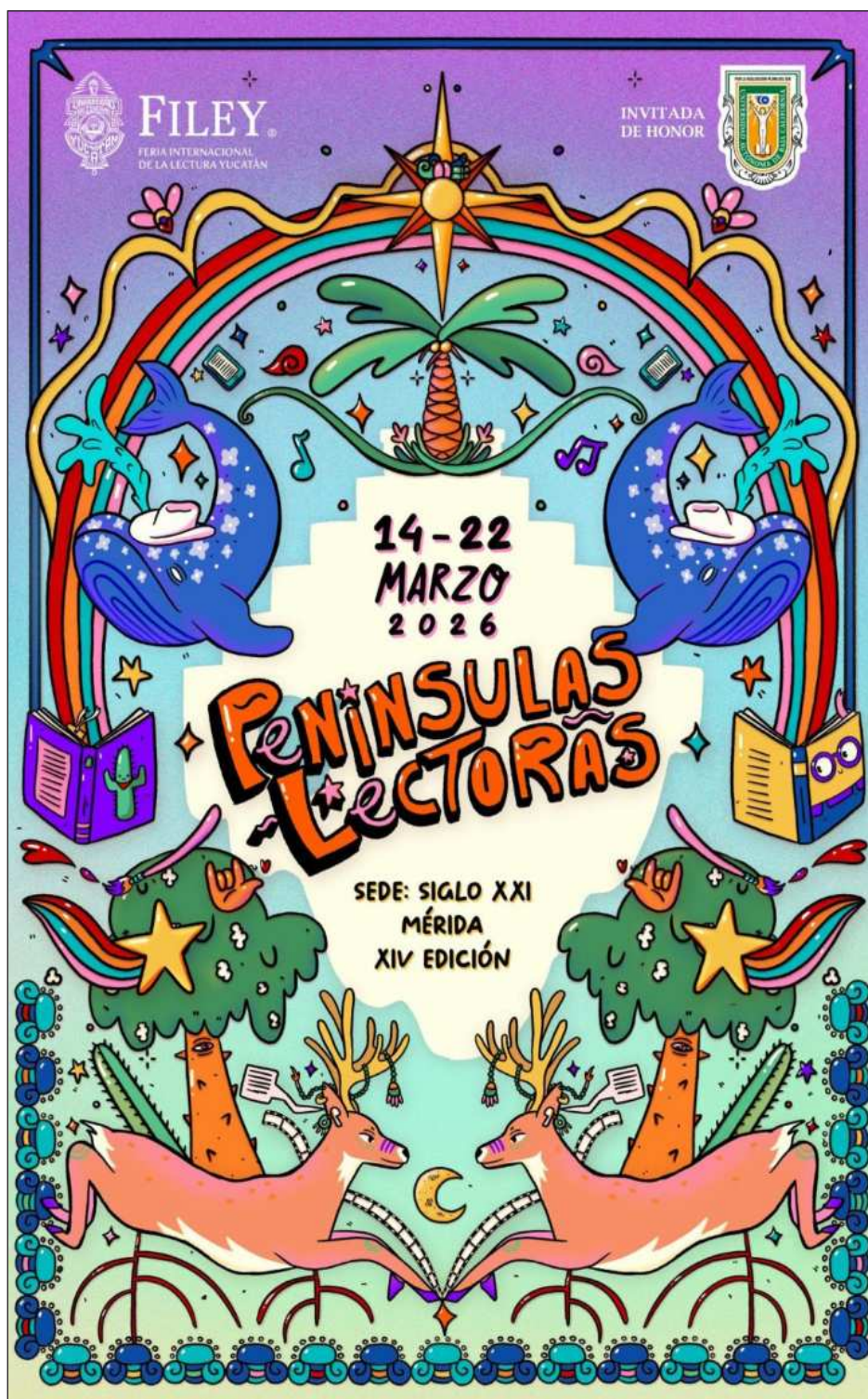
▲ "Se proyecta la participación de mil 694 artistas en esta gran fiesta de la cultura".

"Con 13 ediciones celebradas y rumbo a la décimo cuarta, la Feria Internacional de la Lectura Yucatán, la feria de la UADY, se llevará a cabo nuevamente a partir del próximo 14 de marzo y hasta el domingo 22. Así, a lo largo de nueve días el Centro de Convenciones y Exposiciones Yucatán Siglo XXI se convertirá en un espacio de encuentro para la lectura, el arte, el conocimiento y la alegría del aprendizaje". "En el marco de la Feria Internacional de la Lectura