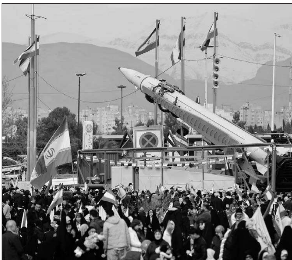
▲ Gobierno iraní ha mostrado disposición condicionada a reducir parte del enriquecimiento de uranio a cambio de alivio de sanciones; prevén otra ronda de negociaciones en Ginebra.

El gobierno iraní ha mostrado disposición condicionada a reducir parte del enriquecimiento de uranio a cambio de alivio de sanciones, y se prevé una nueva ronda de conversaciones en Ginebra encabezada por el canciller Abbas Araghchi, mientras la administración Trump sostiene que prioriza la vía diplomática.