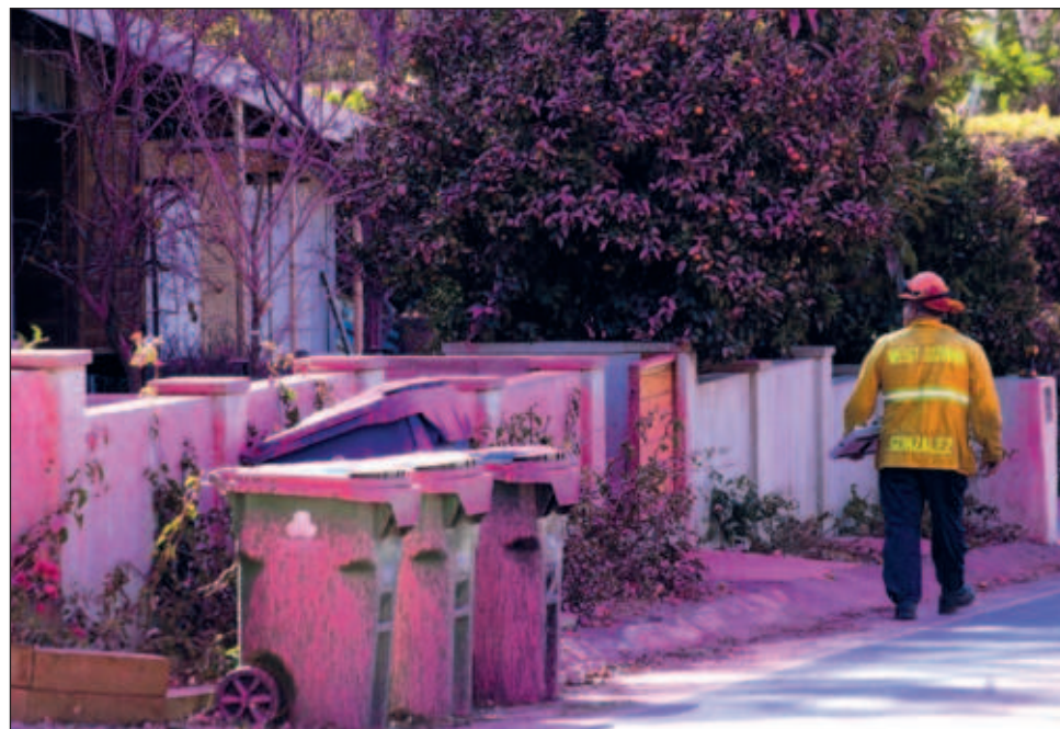
▲ Esta sustancia ayuda a que el agua vertida para sofocar las llamas tarde más en evaporarse y propicia que el proceso de la combustión cuando llega al frente de llama se ralentice.

En general en la lucha forestal, el agua se evapora “rapidísimamente” por el calor intenso cuando se combate un incendio y más aún en las condiciones en la que se está trabajando estos días en Los Ángeles, con circunstancias de “sequía, viento y