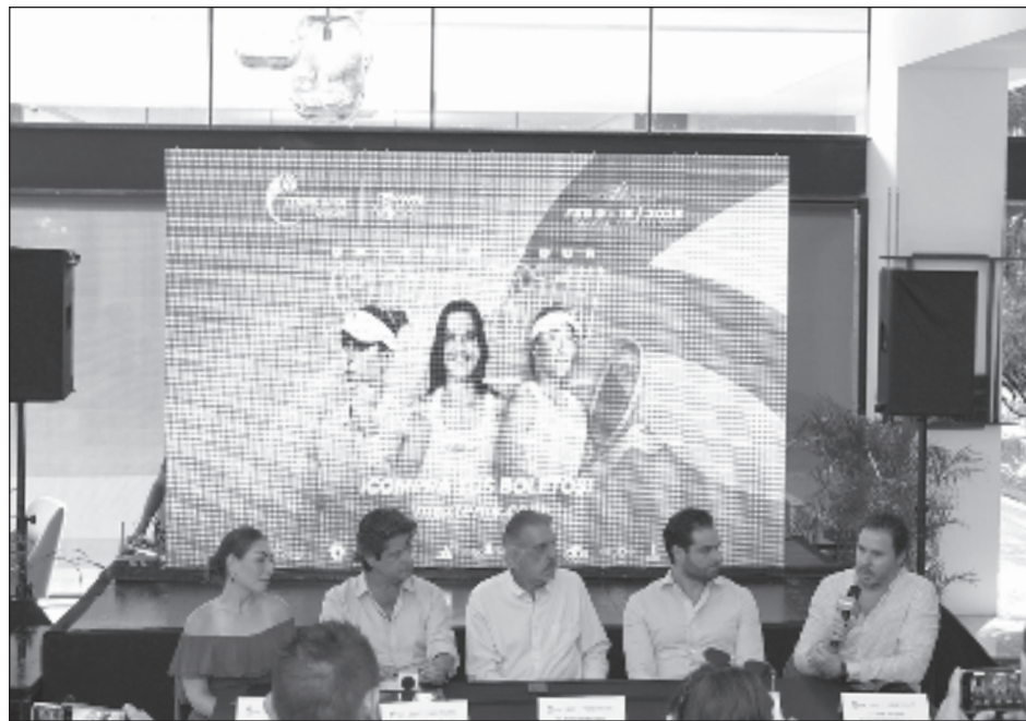
▲ Con el atractivo turístico que tiene Cancún, un sello de clase mundial, Mextenis organizará el torneo WTA 125, del 9 al 16 de febrero de este año.

Con el Cancún Country Club como sede, el torneo busca su propio sitio dentro de la agenda mexicana, junto