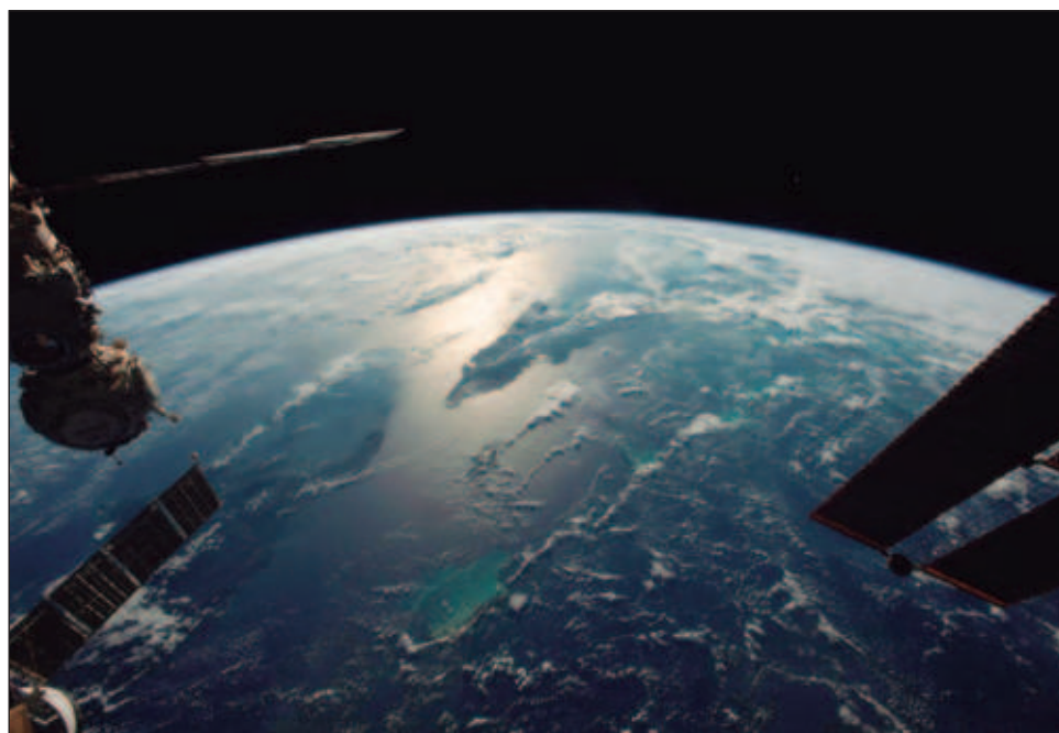
▲ El teórico Nafeez Ahmed señala que está surgiendo un nuevo espacio de posibilidades, en el que la humanidad podría proveerse de energía, transporte, alimentos y conocimientos superabundantes sin dañar la Tierra: “Este podría ser el próximo gran salto en la evolución humana”.

A partir de la literatura científica, el estudio ofrece una teoría del auge y caída de las civilizaciones, a partir de la