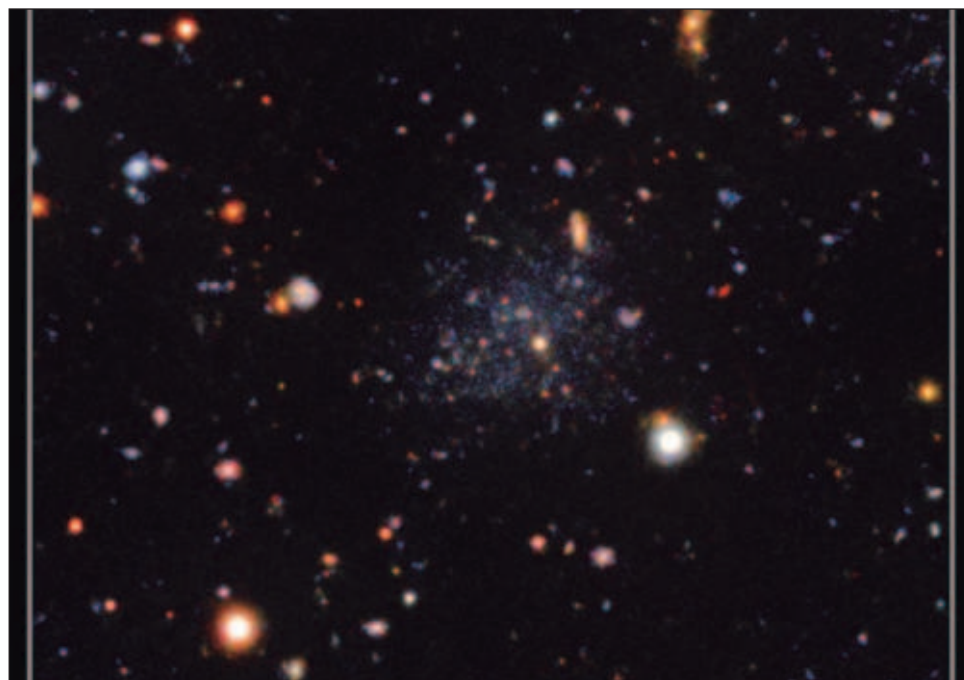
▲ El Espectrógrafo Multi-Objeto Gemini capturó las tres galaxias con exquisito detalle: parecen estar vacías de gas y contienen sólo estrellas muy antiguas.

Pero esto presenta un problema para comprenderlas; Las fuerzas gravitacionales de la Vía Láctea y la corona ca-