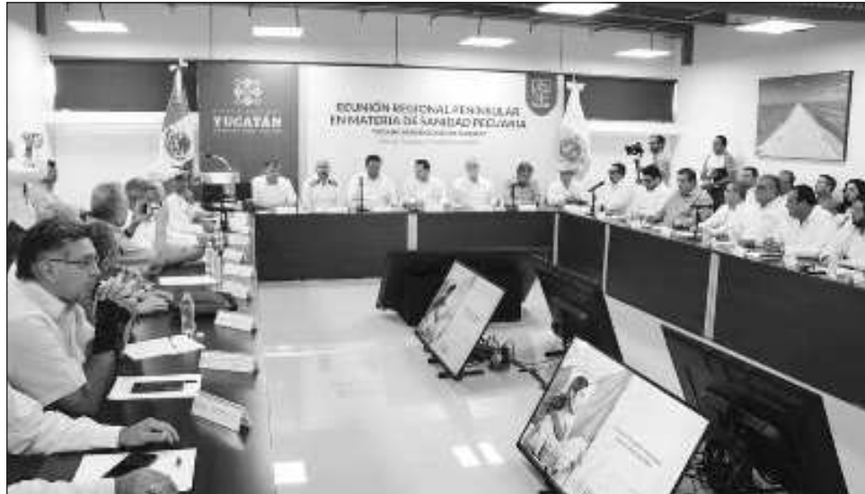
▲ Por primera vez, el compromiso de los tres gobiernos surge para combatir a la mosca Cochliomyia hominivorax , lo que ha dado un paso significativo con la implementación de mejoras en el punto de inspección candelarenses.

Por primera vez, el compromiso de los tres gobiernos surge para combatir la mosca Cochliomyia hominivorax , y ha dado un paso significativo con la implementación de mejoras en el