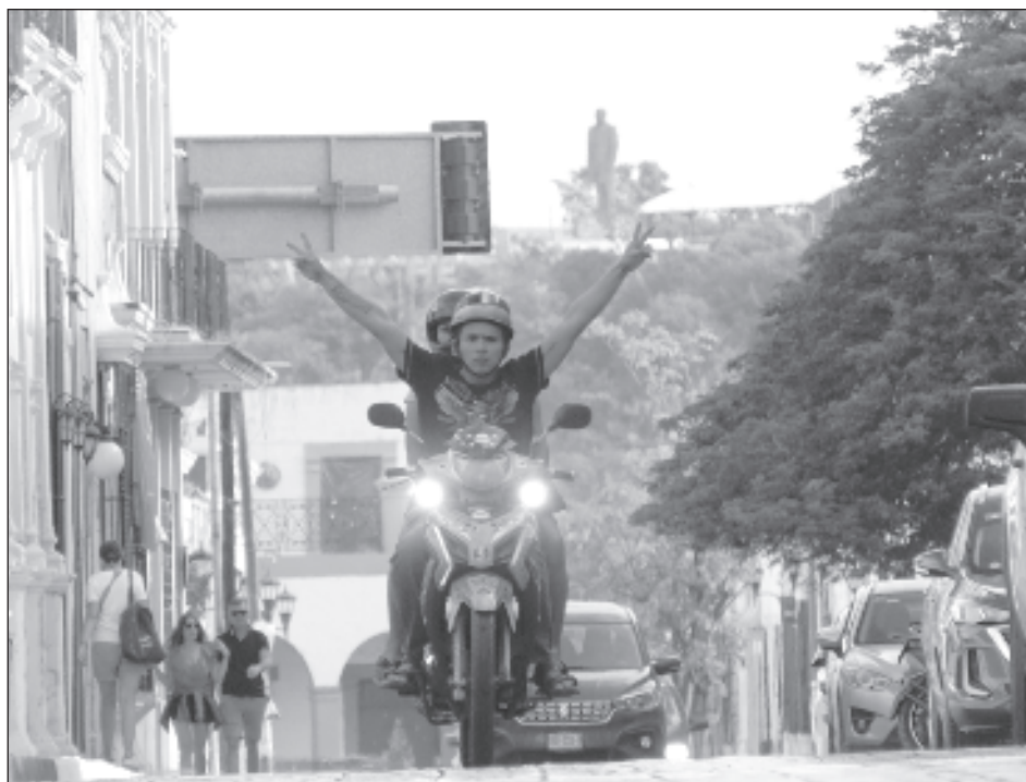
▲ Las autoridades llamaron a las corporaciones policiacas a tomar cartas en el asunto y prevenir la pérdida de vidas en accidentes que se pueden evitar.

Explicaron que durante años se han llevado a cabo campañas de concientiza-