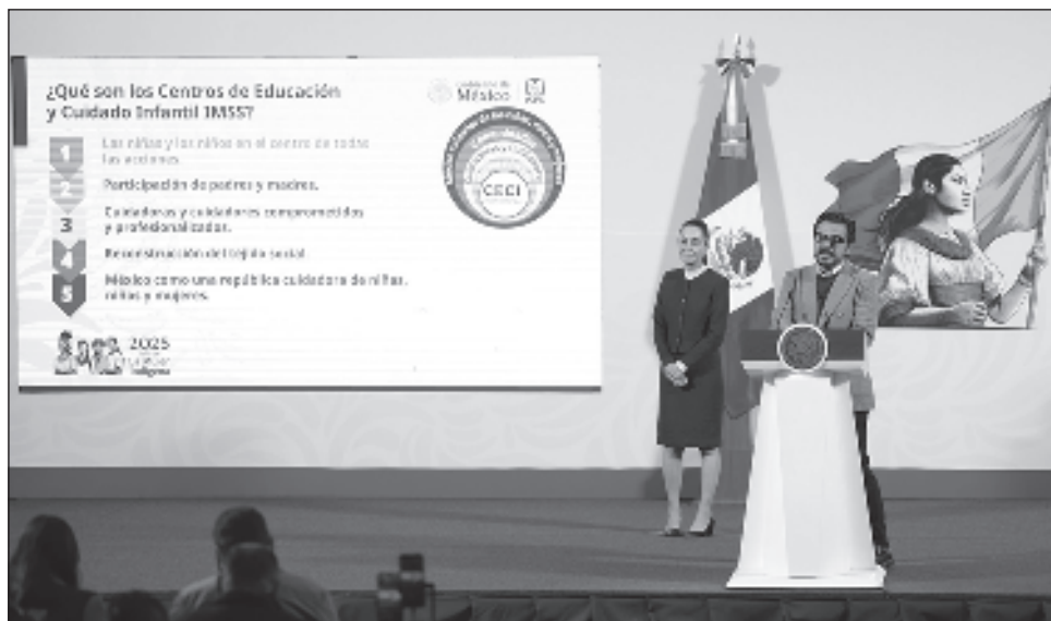
▲ Sheinbaum subrayó que no sólo serán espacios para “guardar” a los pequeños, sino que tendrán una visión de educación y cuidado para la formación desde la primera infancia.

El 30 de abril se pondrá la primera piedra de doce CECI y se prevé, de acuerdo