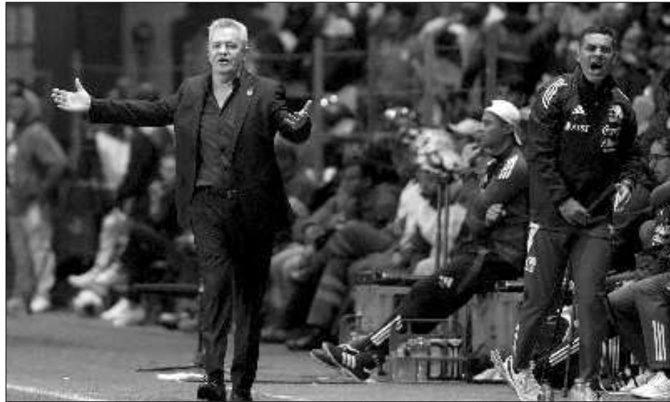
▲ El equipo de Javier Aguirre probará a jóvenes en la gira por Sudamérica.

“Está todo (el plan) diseñado hasta el 2026 y no ha cambiado ni una coma, la