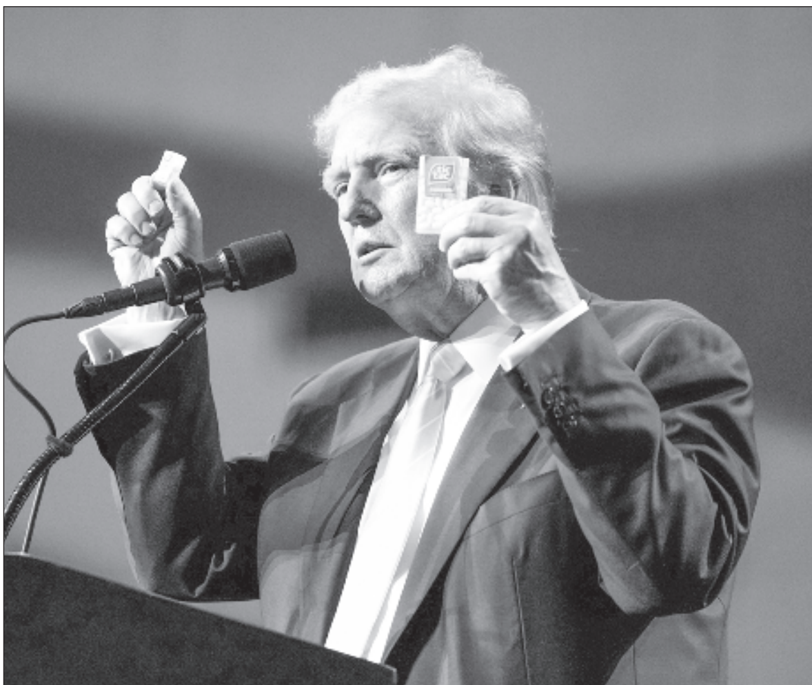
▲ Trump, más allá de sus desenfrenos verbales, desarrolla un proyecto meticuloso de recomposición económica y política mundial, acompañado de los magnates tecnológicos (Elon Musk y Mark Zuckerberg).

México estará especialmente atento a lo que emitirá Donald Trump durante su primer día de gobierno