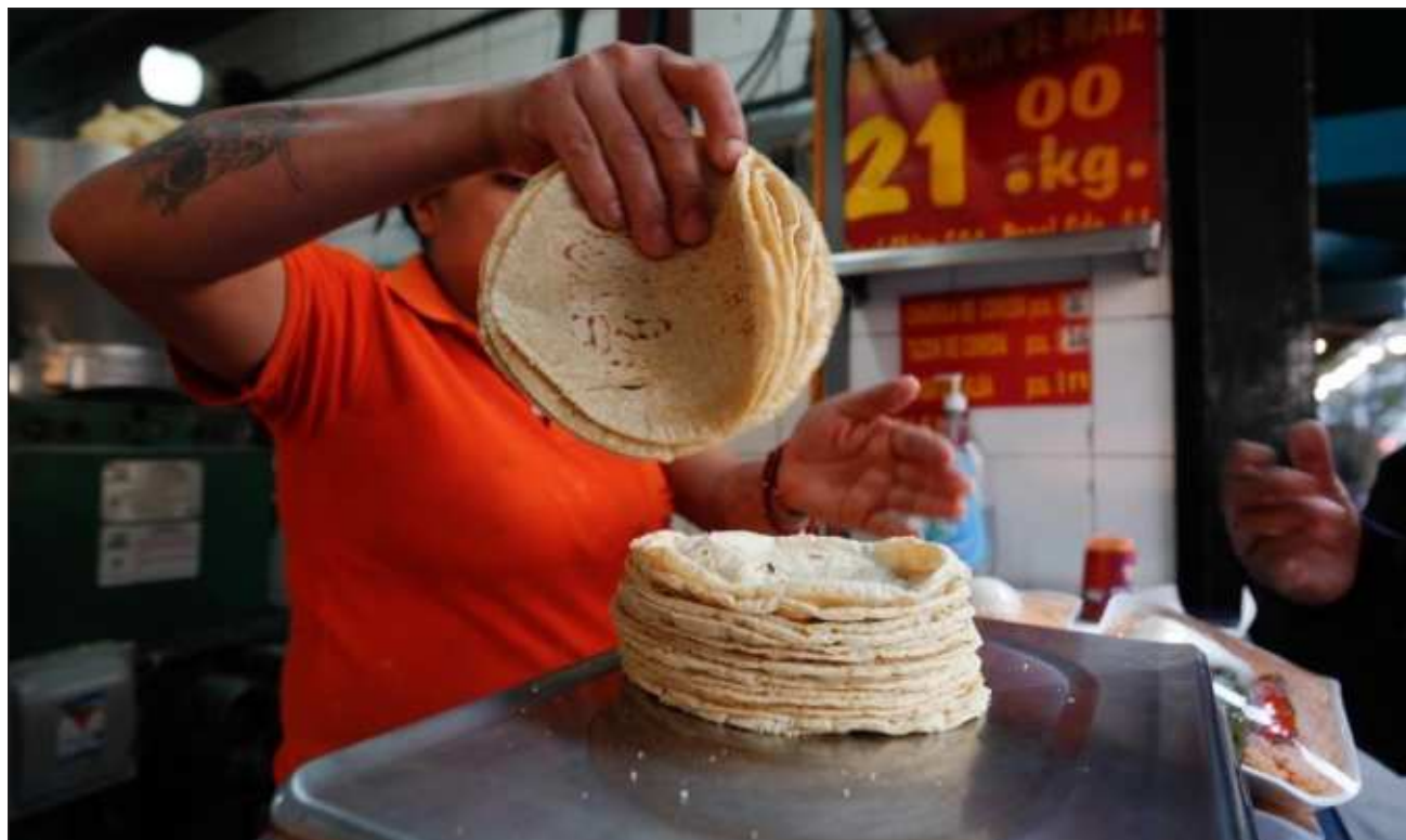
▲ La presidenta Claudia Sheibaum encomendó a Julio Berdegué Sacristán, titular de la Secretaría de Agricultura y Desarrollo Rural, no sólo estabilizar el precio de la tortilla en México, sino reducirlo al menos 10 por ciento para fin del sexenio.