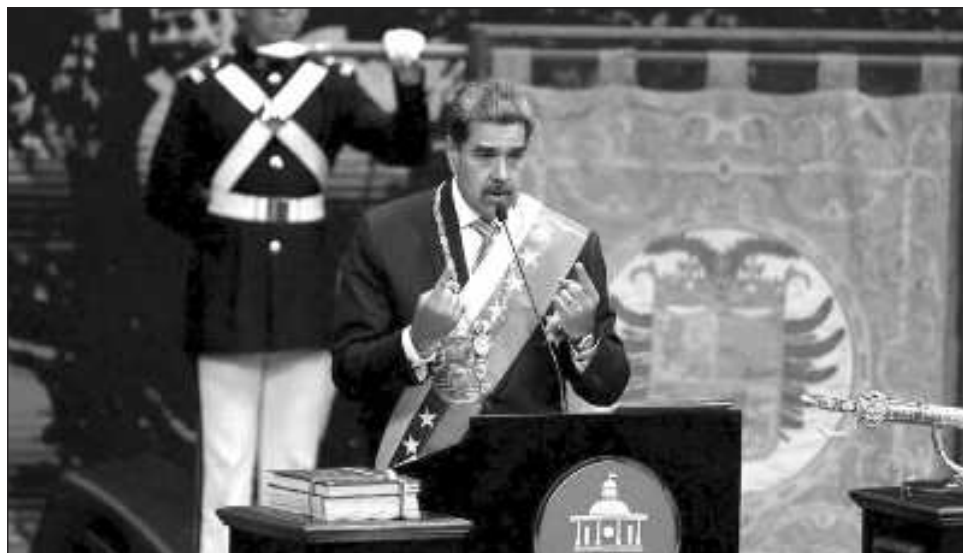
▲ “Soy la garantía de la existencia misma de la República, no exagero ni un milímetro”, destacó el mandatario luego de felicitar por los indicadores económicos favorables.

“Soy la garantía de la existencia misma de la República, no exagero ni un milímetro”, señaló el mandatario izquierdista, que se felicitó por indicadores económicos favorables.