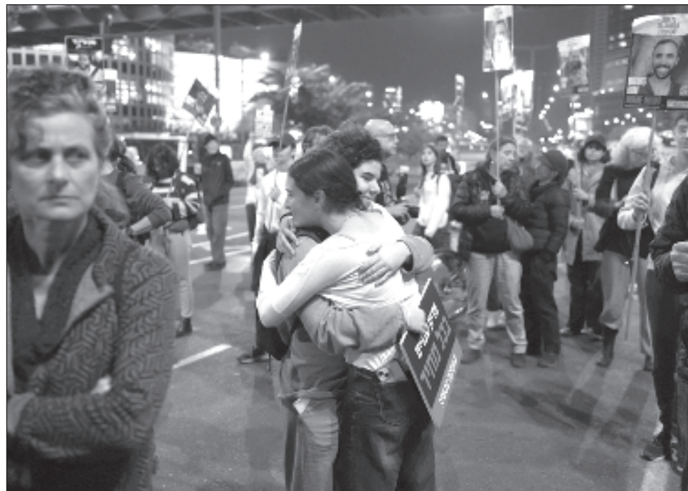
▲ En Tel Aviv, manifestantes que pedían la liberación de rehenes se abrazaron al enterarse del acuerdo; en la Franja, palestinos celebraron el pacto, que debe poner fin a los bombardeos.

El mismo miércoles, ataques aéreos israelíes mataron a 18 personas en Ciudad de Gaza y a otras dos en Jan Yu-