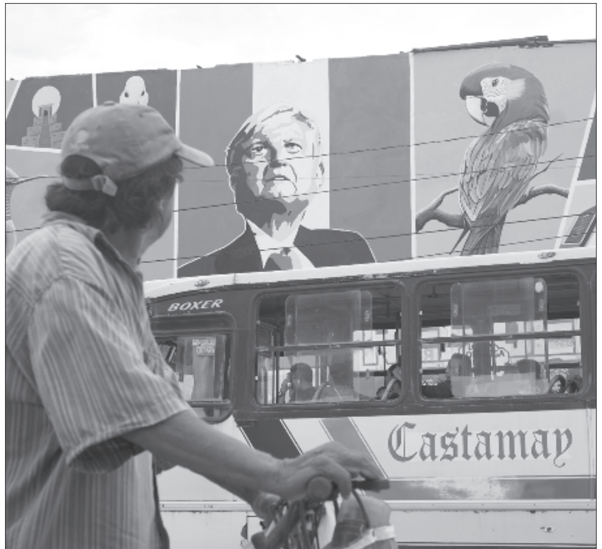
▲ “‘No somos iguales’, aseveró una y otra vez AMLO, pero (...) la necesidad de alcanzar un rápido avance territorial lo obligaron a aceptar en sus filas a gente con prácticas diferentes a las que su marca exigía”.

UNO DE LOS aliados de la marca Morena es el Partido Verde Mexicano, cuya ideología es sacar provecho personal del poder. Son lo opuesto a la marca Morena. No buscan ni buscarán cambiar. Apuestan a la simulación, a la demagogia, a mentir, robar y traicionar. Así lo hicieron cuando