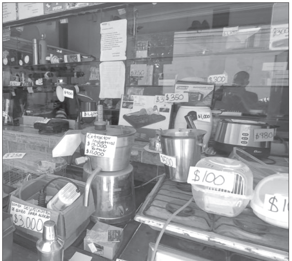
▲ Con el paso de los años la “cuesta de enero” se ha convertido en un fenómeno económico que obliga a muchas personas a recurrir a estos establecimientos.

Sin embargo, sostuvo que en Tulum el impacto todavía no ha sido notorio, lo que refleja la solidez de la economía local durante este periodo turístico.