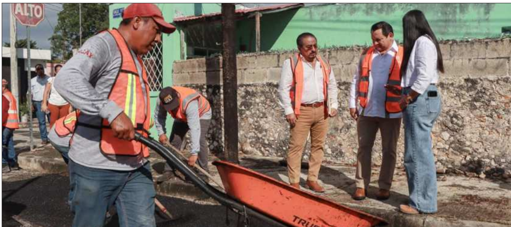
▲ Los trabajos se realizaron en las colonias Castillo Cámara, Melitón Salazar y Dolores Otero de la ciudad de Mérida.