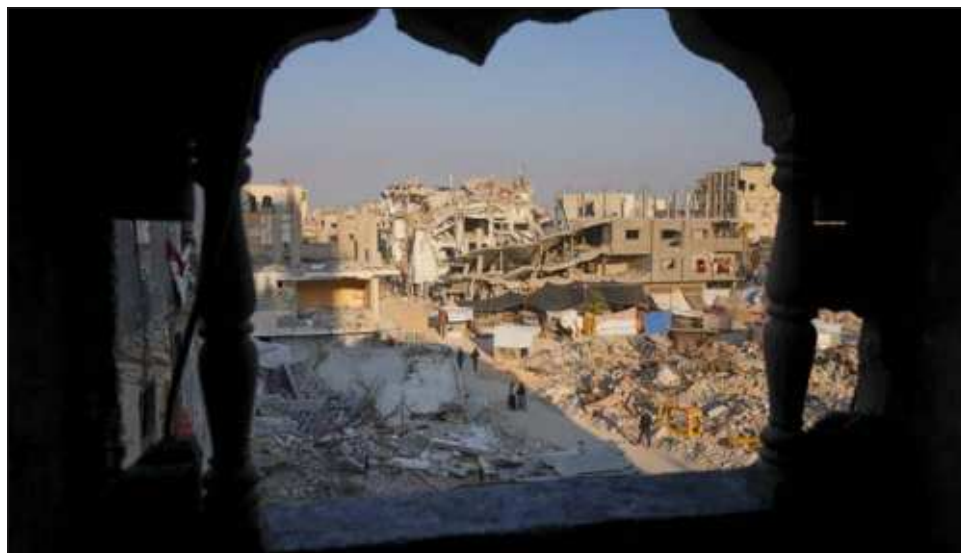
▲ Las discusiones para alcanzar un acuerdo entre Hamas e Israel se prolongaron hasta pocas horas antes del anuncio, con intermediarios recorriendo pasillos y resolviendo los últimos flecos de una tregua crucial para los rehenes capturados en la Franja y para la población civil palestina.

“El hecho de que tengamos un acuerdo tan detallado es que, por ejemplo, estuvimos trabajando la pasada noche hasta las tres de la mañana, resolviendo