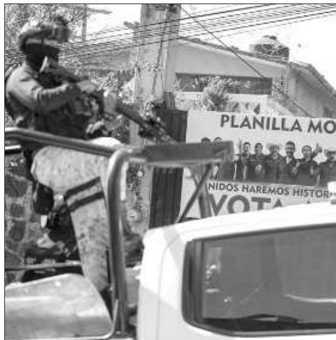
▲ Las balas continúan alcanzando a la clase política, al menos en el nivel de atención inmediata que es el municipal.

Así, esta semana nos enteramos de la desaparición de, presuntamente, 14 personas de entre 17 y 45 años que se dirigían a las costas de Oaxaca con el fin de celebrar la llegada del 2025. Hasta el