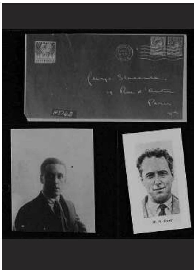
▲ Los Archivos Nacionales, en Londres, incluirán un folleto de la Segunda Guerra Mundial con consejos para formar parte de los servicios secretos de Gran Bretaña.