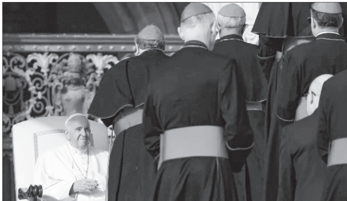
▲ “La Iglesia admite a los homosexuales sean laicos, seminaristas, religiosos y sacerdotes siempre y cuando no pongan en práctica sus tendencias sexuales. Muchos forcejeos y en realidad pocos cambios”.

Un nuevo episodio, de relación de la homosexualidad con la Iglesia, lo encontramos recientemente. La prensa italiana dio a conocer nuevas directrices de la Conferencia Episcopal Italiana (CEI), de que podrían ser admitidos homosexuales al seminario. Para consagrarse al sacerdocio no existen “barreras” para las personas homosexuales, señalaron. El