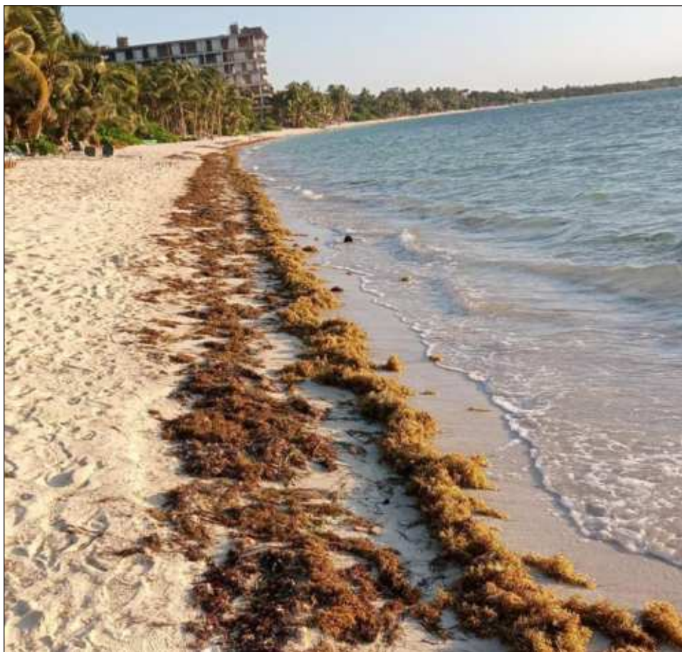
▲ Las playas quintanarroenses ya experimentan arribos anticipados del alga; el incremento significativo podrá verse en verano.

Sin embargo, expuso que prevalece la esperanza de que ocurra lo mismo que los últimos años, cuando en verano el sargazo se desvíaba hacia el norte, hacia las Antillas Mayores, Puerto Rico, República Dominicana y Cuba, librando a los litorales quintanarroenses de este fenómeno.