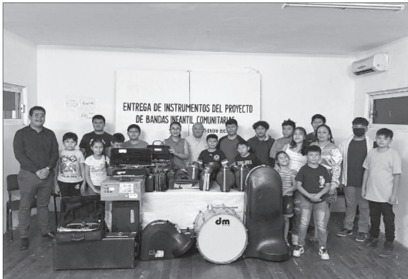
▲ La primera dotación hecha por el Instituto de Cultura y Artes de Campeche consta de instrumentos de aliento y percusión que servirán para la conformación de bandas musicales comunitarias en cuatro municipios. Foto cultura Campeche

Esta primera dotación está compuesta por instrumentos de aliento y percusión que servirán para la conformación de bandas musicales comunitarias. Durante el evento, se destacó la importancia del compromiso, tanto de alumnado como de los pa-