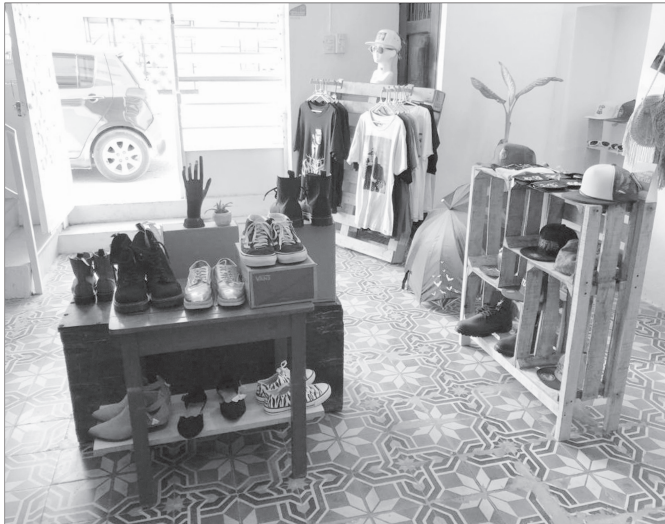
▲ La Milagros es una red de varios proyectos que se unen para todo tipo de público y es un foro abierto a todas las personas emprendedoras. Se encuentra abierto de lunes a sábado de 10 a 19 horas.