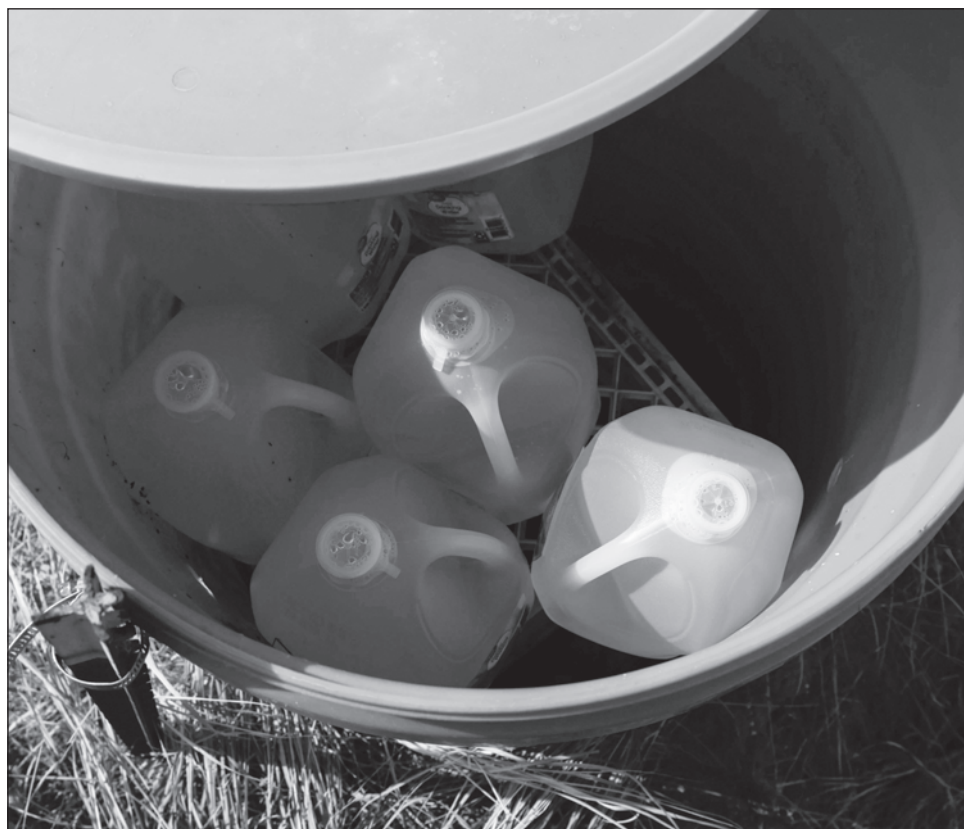
▲ Asociaciones humanitarias atribuyen la pérdida de galones de agua a los incendios forestales en esta región sur de EU o a acciones mal intencionadas y anti migrantes.