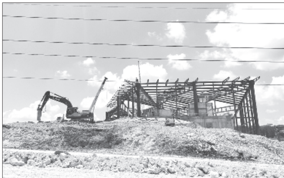
▲ Respecto a las acciones de salvamento arqueológico, en el Tramo 1 se ha recuperado información de 2 mil 698 bienes inmuebles; 248 bienes muebles relativamente íntegros y 281 mil fragmentos de cerámica que ya son analizados.

Apuntó que contarán incluso con un “quirófano” de ser necesario, y estarán equi-