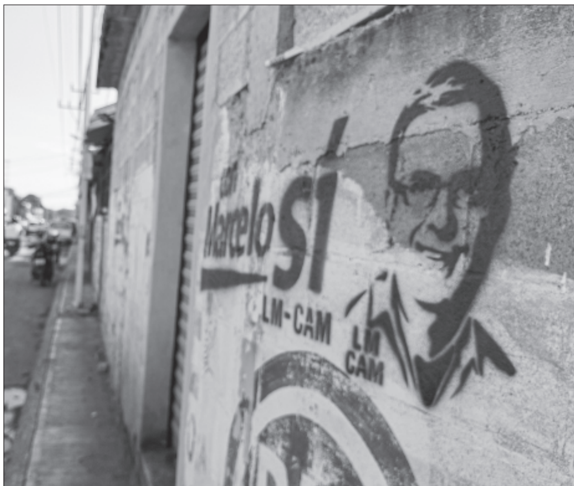
▲ “Sin perder mi independencia, hago un llamado a quienes coincidan con lo aquí plasmado, que den cara y ayuden a generar más apoyos de voluntades a favor de su candidatura, tengo la certeza que en estos momentos es lo correcto”.

EN EL CASO de la oposición, me parece que llega sin posibilidades reales de ganar, incluso pensando en el sueño guajiro de un posible triunfo de Xóchitl Gálvez, a quien se le nota en todas sus respuestas que el tema de seguridad le incómoda, cantinfla