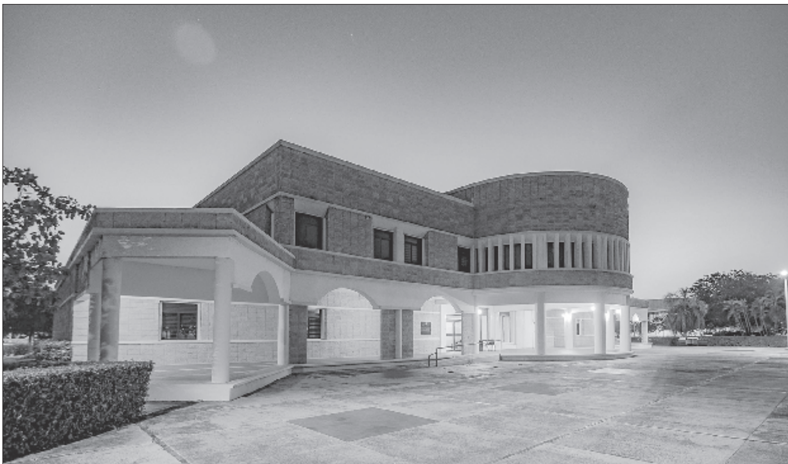
▲ "Mientras que en la UQROO hubo buen nivel de transparencia en el proceso de designación de rector, en las otras dos universidades no. No se discute que el nombramiento fue contrario a la normatividad, pero el proceso pudo haber sido mucho mejor con la debida transparencia".