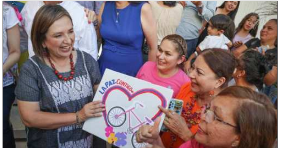
▲ La medida cautelar tendrá efecto hasta que se resuelva el fondo de este juicio de amparo e incluye que AMLO elimine de sus redes sociales cualquier crítica a la política panista.