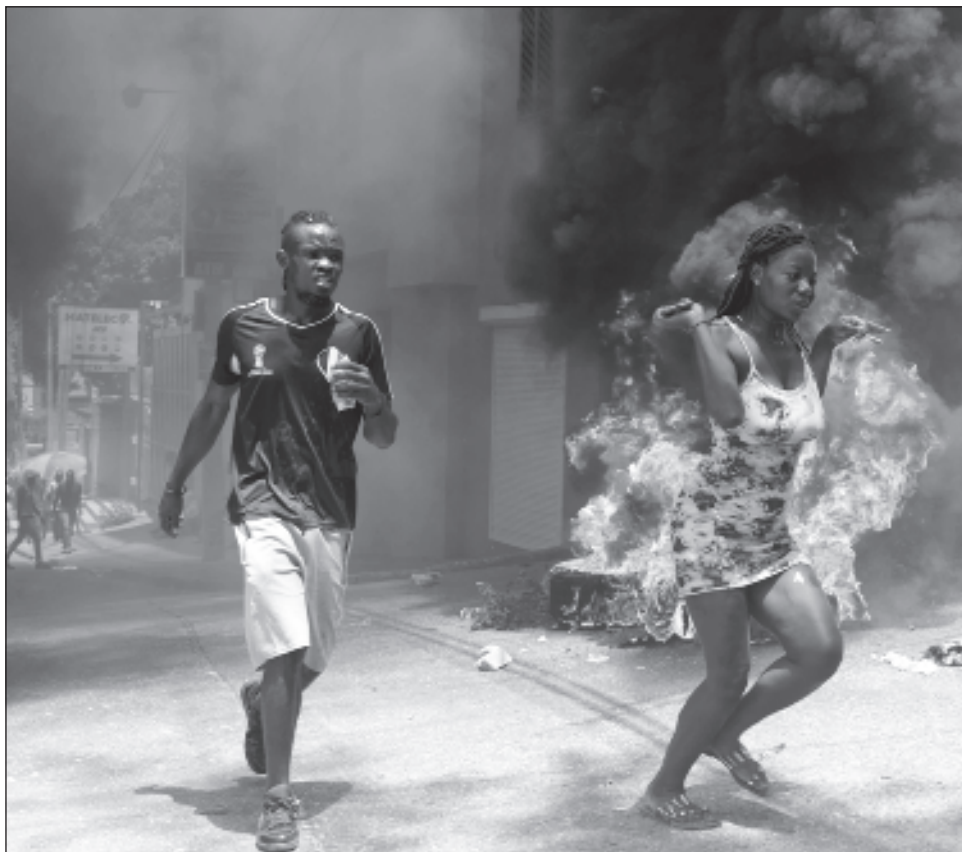
▲ Los expertos estiman que las pandillas controlan 80 por ciento de Puerto Príncipe.

Los expertos estiman que las pandillas controlan 80 por ciento de Puerto Príncipe. Sólo hay unos 10 mil policías para los más de 11 millones de habitantes del país. Más de 30 agentes fueron asesinados entre enero y junio, y más de 400 instalaciones policiales no están operando debido a ataques de grupos criminales.