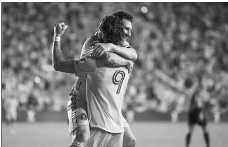
▲ Lionel Messi y el Inter de Miami tendrán hoy una dura prueba ante Filadelfia.

Con 13 goles, el Nashville tiene la segunda ofensiva más prolífica entre los semifinalistas, pero deberá mostrar su mejor fútbol para vulnerar a la defensa de los Rayados, una de las