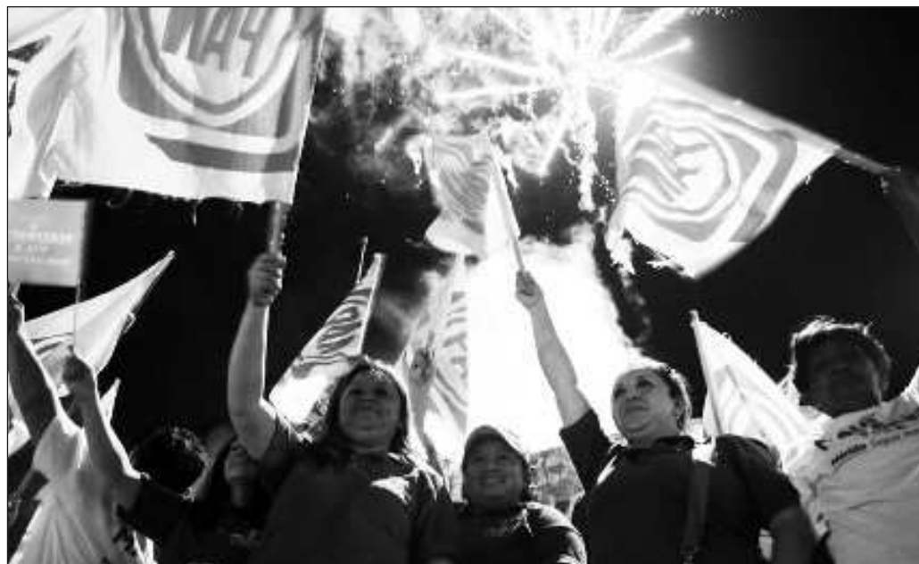
▲ Los yucatecos tuvimos un verano de campaña política adelantada.

Y aunque quiera verse que entre el anuncio del levantamiento de la encuesta y el anuncio de los resultados hay un lapso apenas mayor a una semana, lo cierto es que los cuatro aspirantes panistas ya se encontraban en la mira como posibles candidatos a la gubernatura, ya fuera porque lo hubieran mencionado en alguna entrevista o por haber registrado un hashtag. Lo que concluye hoy es el esprint aparentemente final, pero los corredores todavía tienen fondo y ahora seguirá resolver si el tradicional bipartidismo yucateco encuentra las bases para una gran reconciliación y así ir en alianza contra Movimiento Regeneración Nacional. En el Partido Revolucionario Institucional apenas están calentando motores.