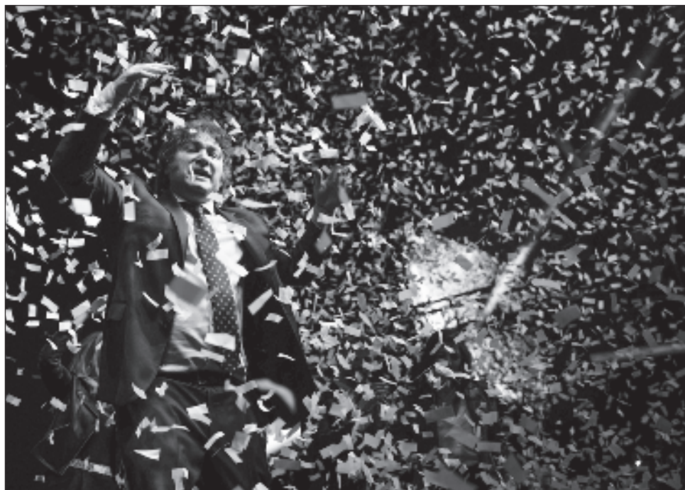
▲ Aunque Javier Milei -que obtuvo 30.04% de los votos- sea un candidato "promercado", al mercado no le han gustado los resultados electorales, reiteran operadores bursátiles.

El Banco Central argentino también elevó este lunes en 21 puntos porcentuales la