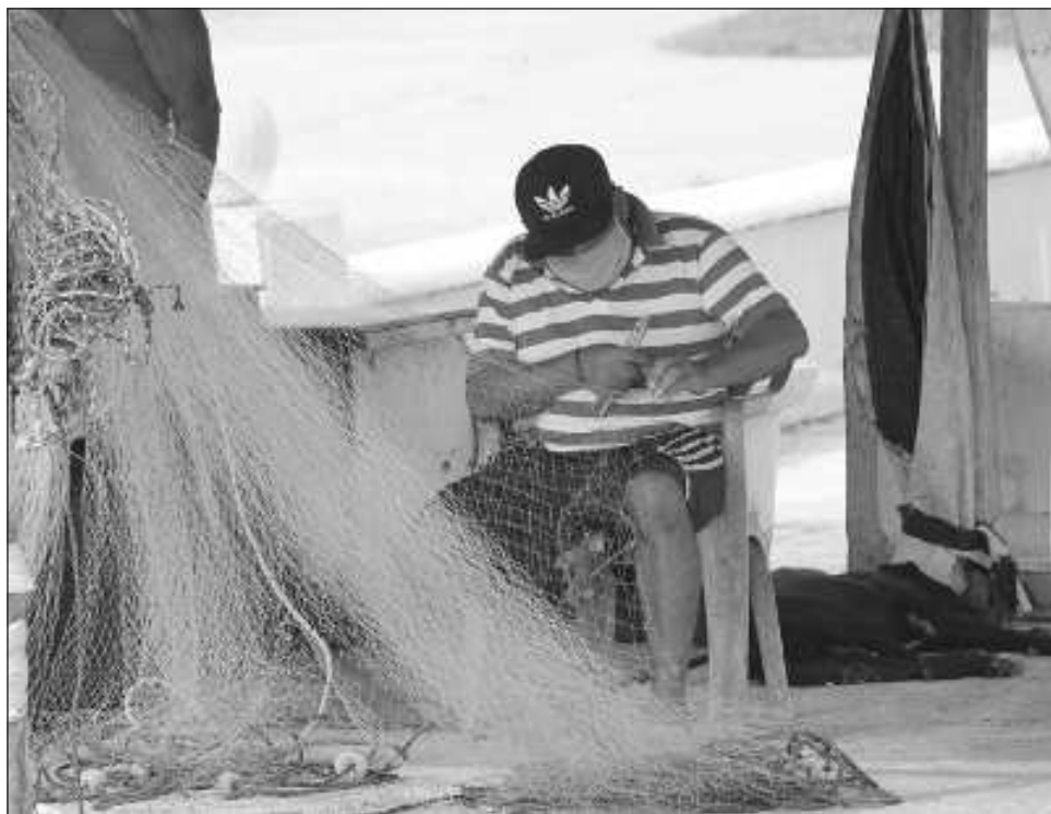
▲ Los pescadores buscan revisar las causas, consecuencias inmediatas y a largo plazo, de los derrames que se han presentado en las instalaciones marinas.

Los representantes de los hombres de mar de lugares como Campeche, Tabasco, Veracruz y Tamaulipas, explicaron que su presencia en la isla es para solicitar a Pemex la instalación de una mesa de trabajo y revisar