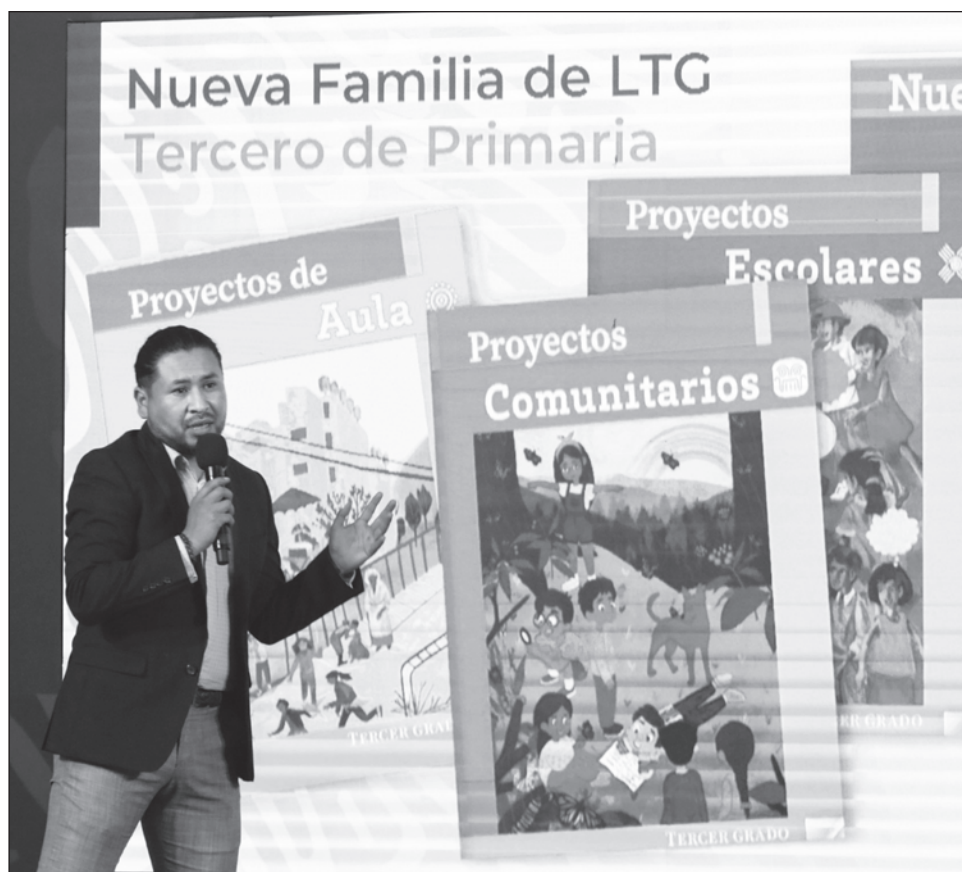
▲ "La opinión de expertos nos indica que debemos completar los contenidos de los libros de texto gratuito, esto es en lectoescritura, matemáticas y ciencia": Mauricio Kuri.

Aseguró que estos materiales están listos y se entregarán junto con los libros de texto gratuito. "La opinión de expertos nos indica que debemos completar los contenidos de los libros de texto gratuito, esto es en lectoescritura, matemáticas y ciencia. El gobierno del estado tiene listos textos elaborados por maestros queretanos".