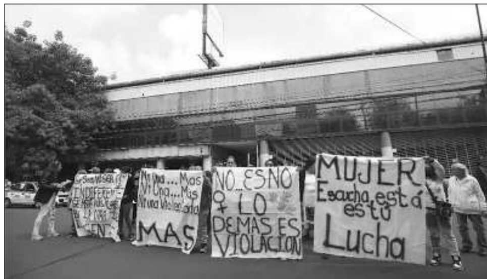
▲ El castigo por delitos de violencia sexual prevalece en la impunidad, pues por cada 157 agravios cometidos durante 2021, sólo una persona pisó la cárcel.

En los primeros seis meses de 2023 se han denunciado 12 mil 134 violaciones, lo que da un promedio diario de 66 denuncias en todo el país, por lo que se de esperarse que en 2023