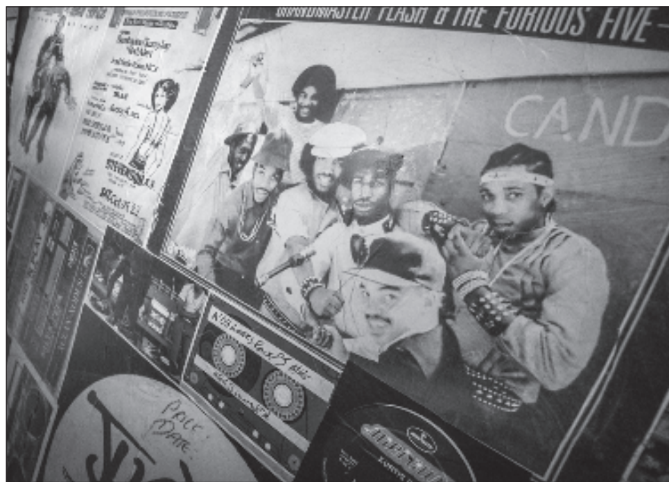
▲ Mientras los gigantes del hip hop celebran este mes el 50 aniversario de una industria multimillonaria, el lugar de nacimiento del movimiento sigue siendo la sección más pobre de NY.

Los vagones del metro que se dirigían a Manhattan se cubrieron de grafiti en los años 70 y 80, después de que los jóvenes “escritores” pusieran sus nombres y mensajes de arriba a abajo. En un momento en que los políticos de Nueva York menospreciaban al Bronx y lo consideraban indigno de inversión, era una forma para que los