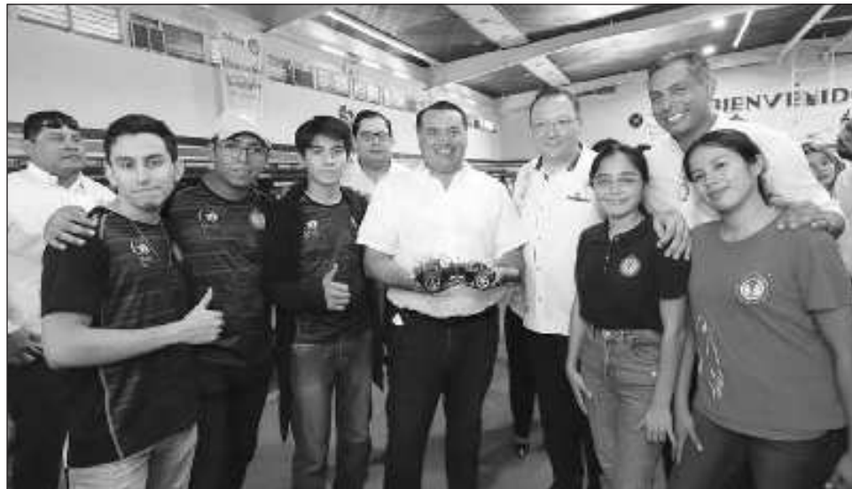
▲ El presidente municipal informó que en el marco del día internacional de la juventud, en esta sesión por primera vez participaron estudiantes universitarios del municipio con el fin de que más jóvenes conozcan y colaboren en los procesos de desarrollo.

“La administración municipal fomenta la creación de mecanismos de participación ciudadana, donde cada vez más sectores de la población se involucren en las decisiones del ayuntamiento,