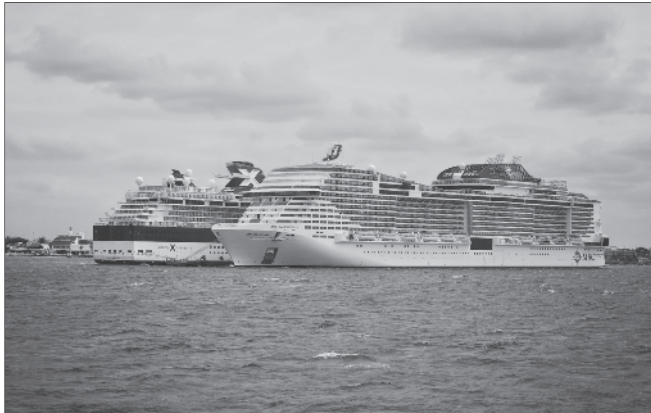
▲ Entre los puertos del Pacífico y los del Golfo Caribe la cifra para este semestre llegó a los 4 millones 968 mil 610 personas, un ritmo de más de 27 mil 600 visitantes diarios, de enero a junio: Secretaría de Marina.

El informe de la Semar establece que los puertos del Golfo Caribe tuvieron un aumento de 65.3 por ciento y los del Pacífico 89.4.