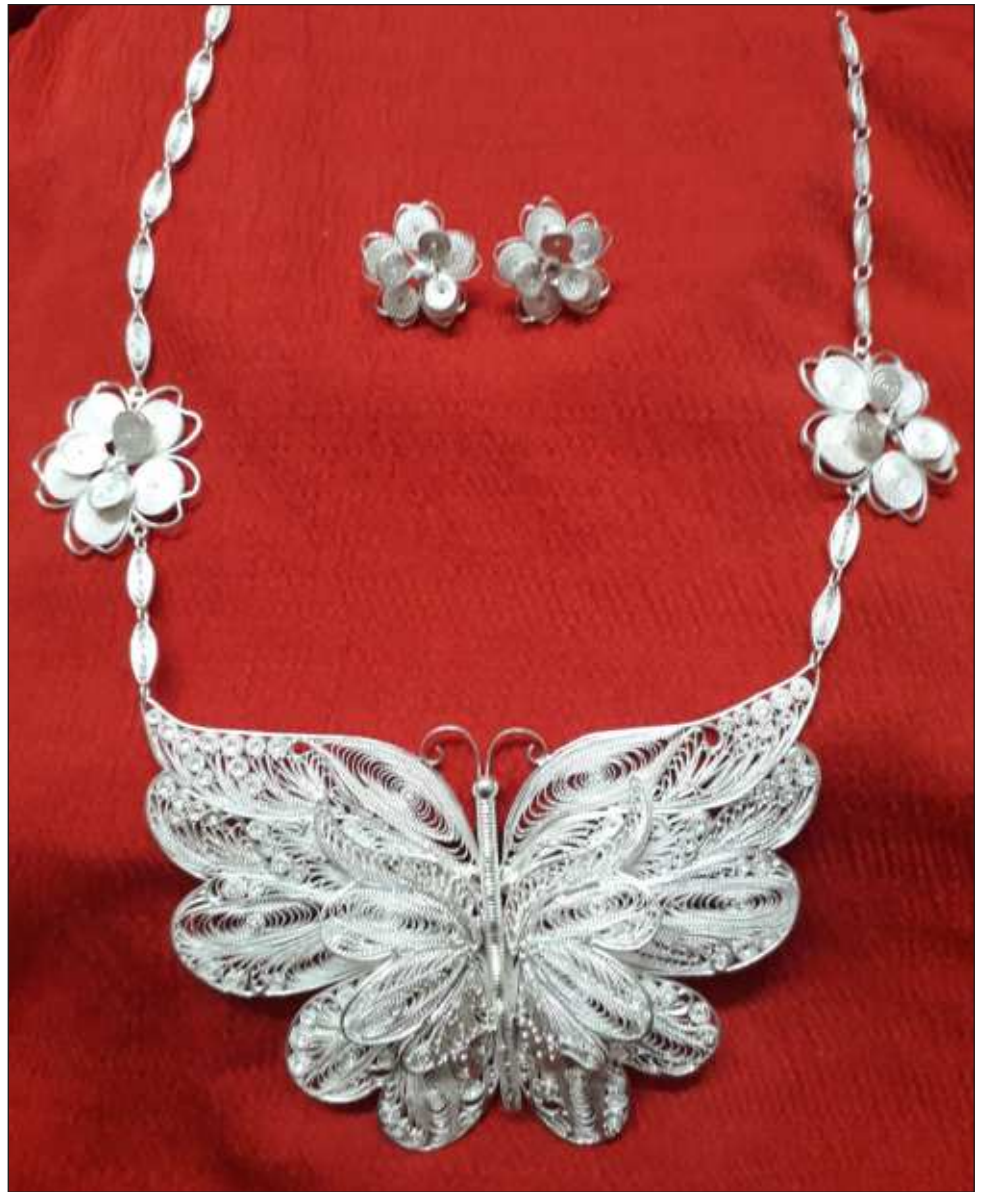
▲ Beyxan, ichil tuláakal Méxicoe', chéen Zacatecas, Oaxaca yéetel Yucatán láayli' yaan máax tu kan u meyajt le fíiligranaána, le beetik sajbe'entsil yanik u ch'éejel.

Uláak' ba'ale', ikil tu bin u mu'uk'antale', Amye' ku béeytal u ts'áak meyaj ti' uláak' kantúul máak ts'o'ok u kanik u meyajt fíiligranaána ti'al xan u náajalta'al taak'in ti'al u kuxtaló'ob.