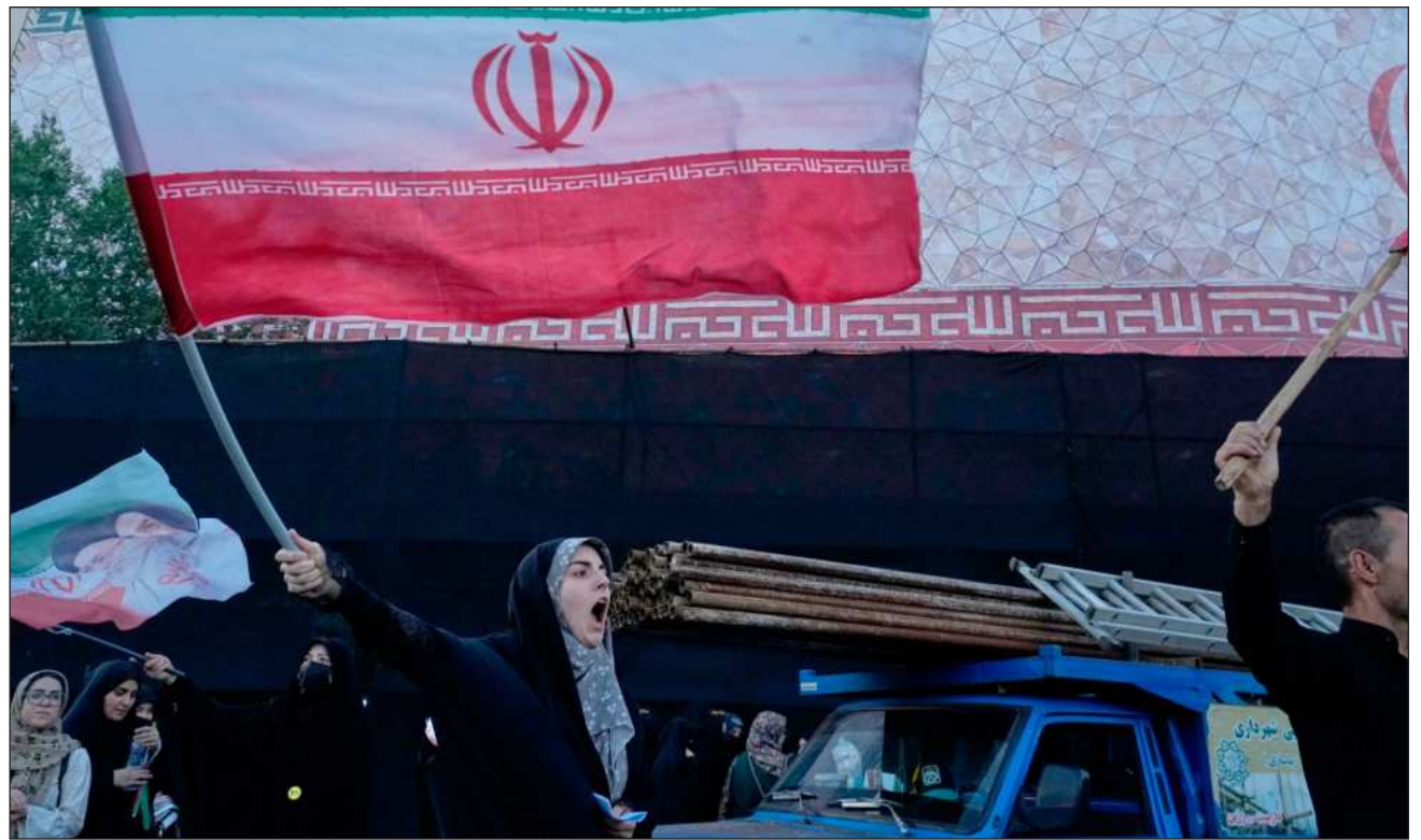
▲ Estados Unidos indicó previamente que relajará su bloqueo de los puertos iraníes a medida que el estrecho se reabra.

El presidente estadounidense Donald Trump confirmó que se ha alcanzado un acuerdo con Irán y dijo que autorizó el fin del bloqueo naval de Estados Unidos de los puertos iraníes en el estrecho de Ormuz.