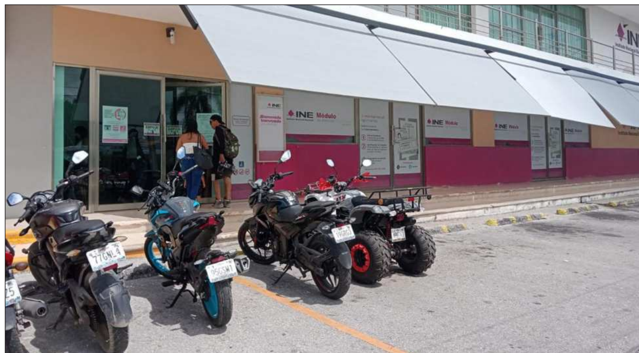
▲ Están ofreciendo cubrir tres plazas en Campeche: la Vocalía Ejecutiva de la Junta Local Ejecutiva, la Vocalía Distrital de Capacitación Electoral y Educación Cívica, y una plaza de Auxiliar de la Unidad Técnica de Fiscalización.

De acuerdo con cifras preliminares, se registró una asistencia superior a 76 por ciento de los 176 sustentantes inscritos en Campeche. Los participantes fueron distribuidos en cinco aulas de la Facultad de Derecho de la Universidad Autónoma de Campeche, sede de la evaluación. Las pruebas tuvieron una dura-