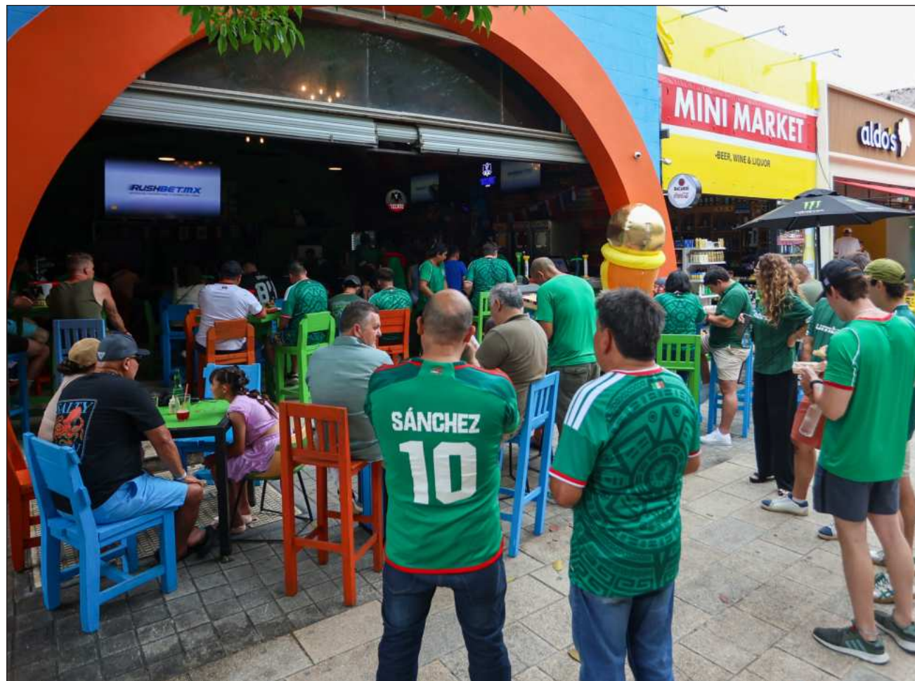
▲ Los comercios sin temática sport bar se mantuvieron hasta en 80 por ciento de su capacidad.

Paralelamente, la dirigencia de Canirac trabaja para proteger a sus afiliados ante posibles irregularidades administrativas, esto