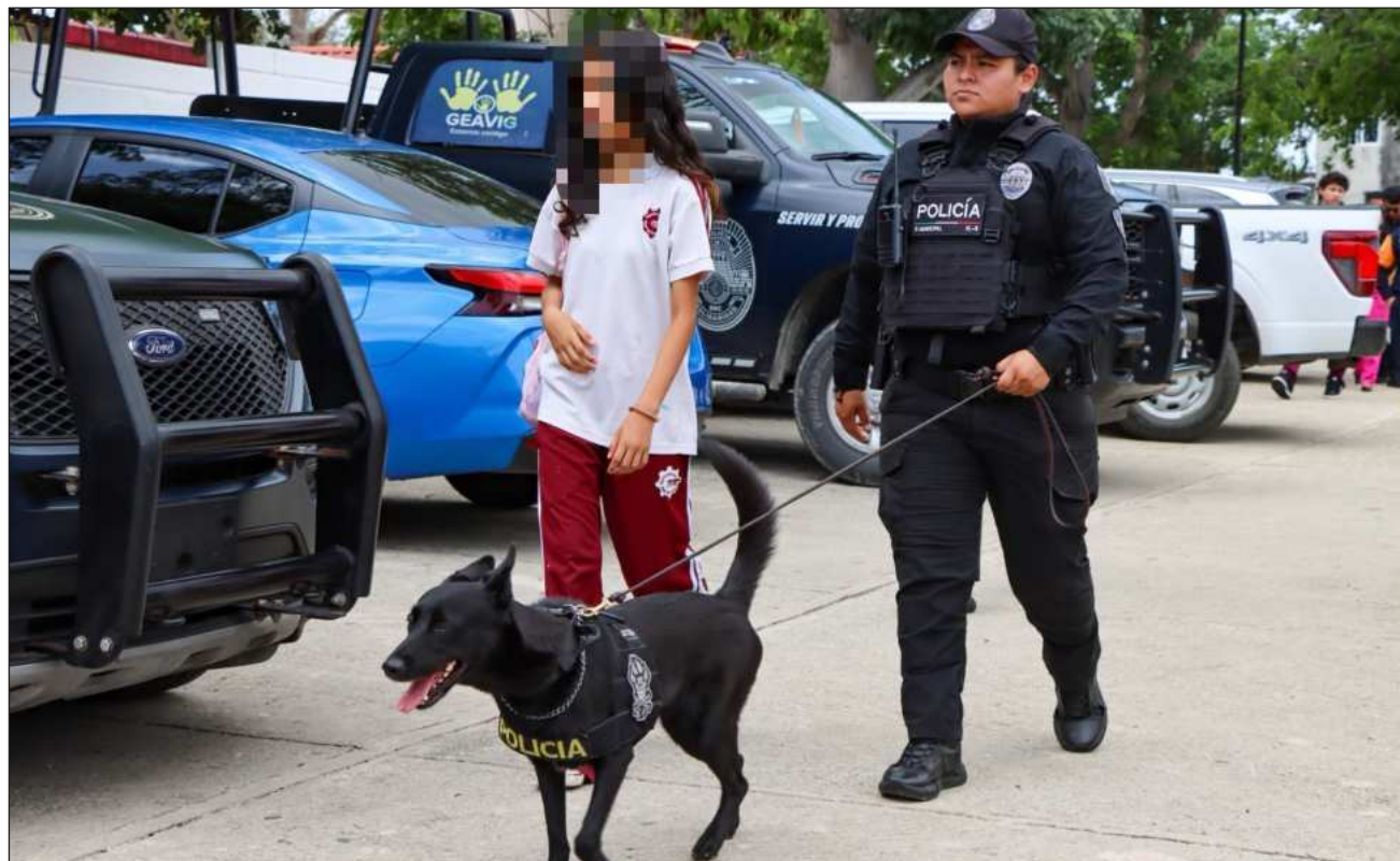
▲ La semana pasada se desarrolló una jornada en la Escuela Secundaria Técnica Número 33.