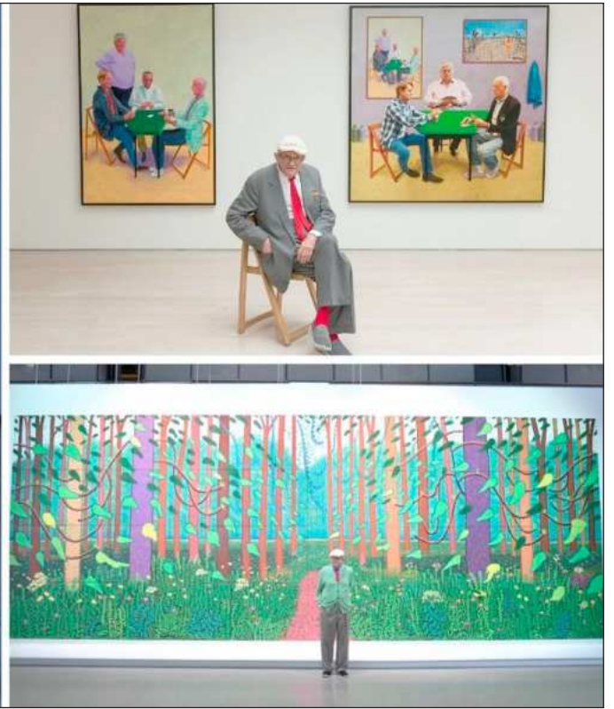
▲ Hockney desarrolló una trayectoria de siete décadas marcada por el color, la observación del mundo cotidiano y una capacidad para probar nuevos medios; su obra abarcó el retrato, el collage fotográfico, el diseño para ópera y los dibujos.

relaciones entre personas del mismo sexo fueran despenalizadas en su país.