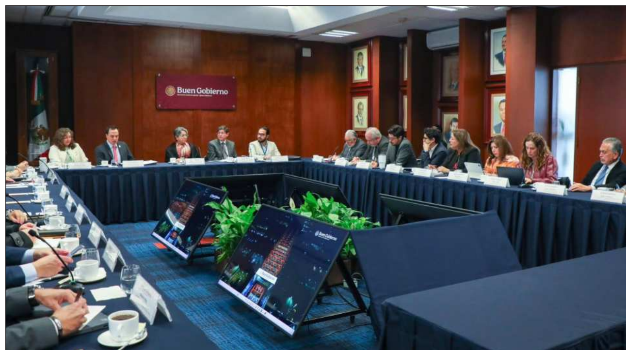
▲ De acuerdo con información de la dependencia difundida este domingo, la mayor sanción recayó en los funcionarios de la CFE. Las faltas no graves dieron lugar a sanciones contra 22 servidores públicos.

Por otra parte, José R., funcionario del IMSS en Puebla, fue inhabilitado por 10 años por obtener un be-