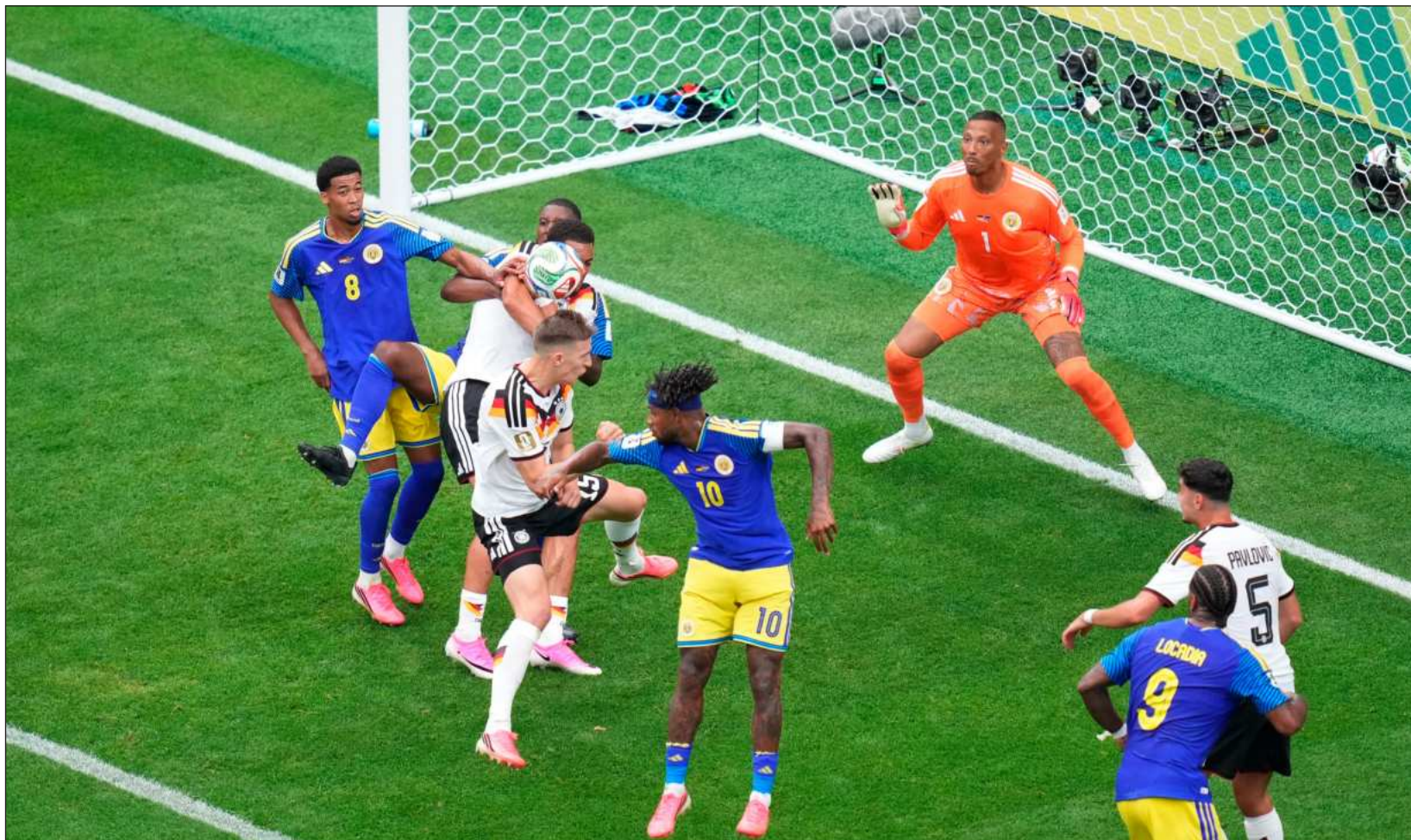
▲ Fue un sólido inicio para Alemania como parte de su misión de redención luego de no pasar de la fase de grupos en Rusia y Qatar.