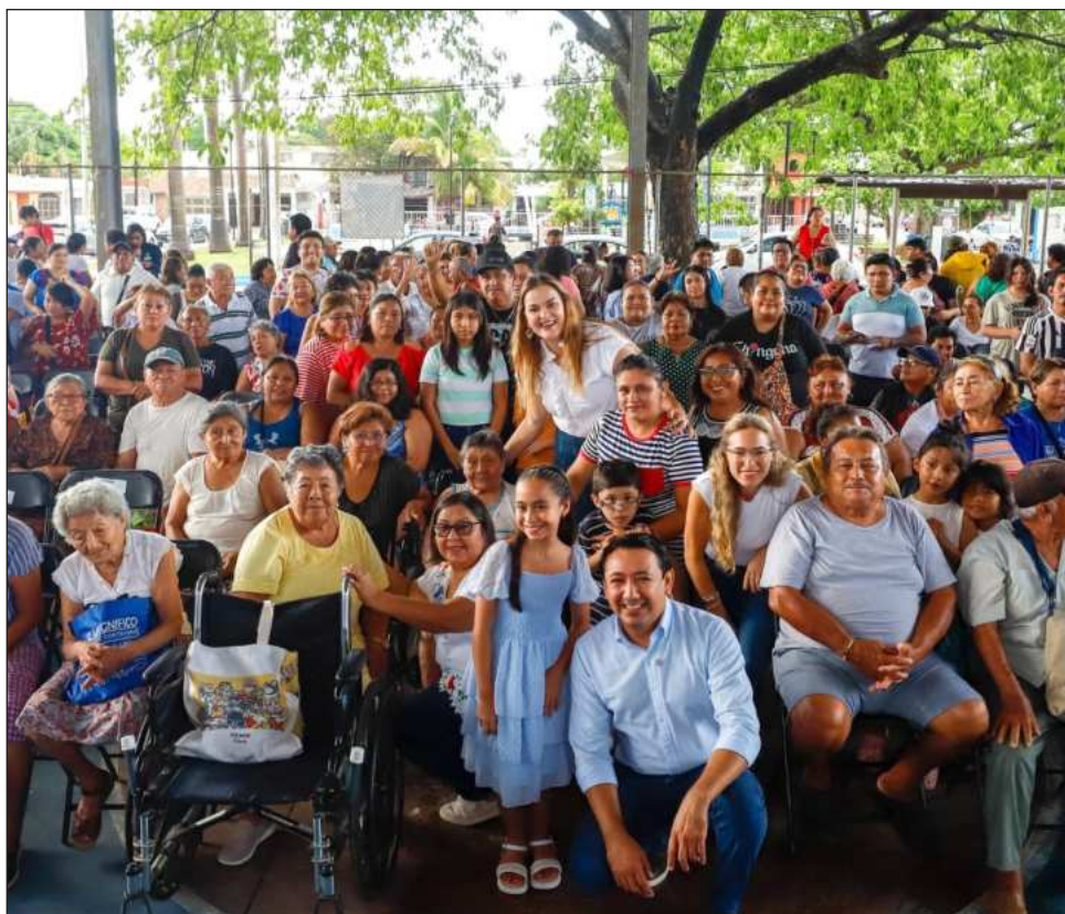
▲ La iniciativa permite que más personas accedan a una atención visual adecuada sin comprometer los recursos destinados a otras necesidades del hogar.

tamiento ofrece terapias de aprendizaje, psicología, comunicación y lenguaje para contribuir al desarrollo integral de las personas con