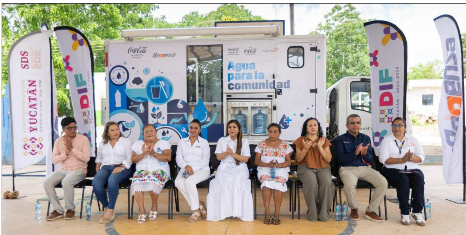
▲ La iniciativa busca contribuir al bienestar e hidratación segura de las familias durante la temporada de altas temperaturas.

Con acciones como ésta, Bepensa refrenda su compromiso de continuar construyendo alianzas que contribuyan al bienestar de las comunidades donde tiene presencia, impulsando iniciativas innovadoras y de calidad que generan beneficios concretos para las familias y fortalecen el desarrollo comunitario.