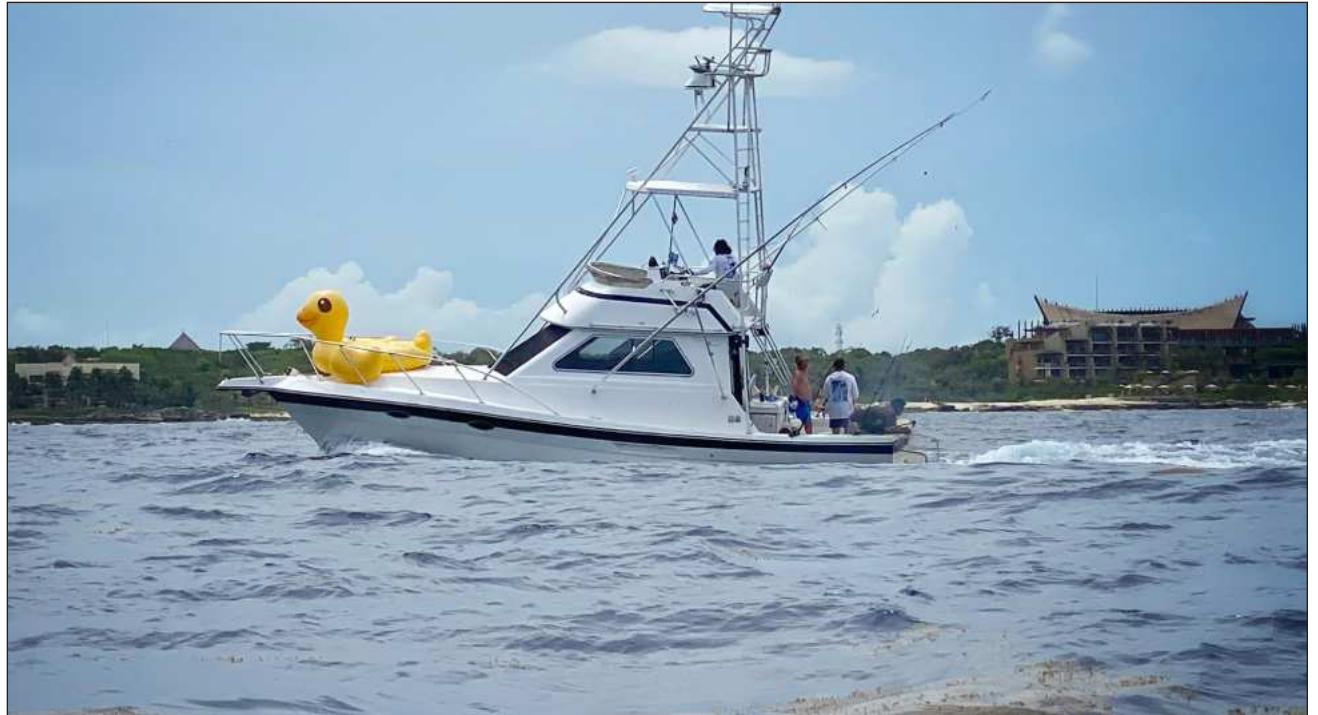
▲ Empresas náuticas operan con ocupación que oscila entre 50 y 60%, un periodo de baja afluencia turística, donde incluso se ha detectado la implementación de días solidarios en hoteles de la zona, una situación inusual para mayo y junio.

Sin embargo, reconoció que existen necesidades de infraestructura que las autoridades deben atender con urgencia para garantizar la seguridad a largo plazo. Si bien el nuevo puente sobre la laguna Nichupté ha mejorado la conectividad y podría evitar un congestionamiento en zona hotelera en caso de tener que sacar las embarcaciones del mar o la laguna, este no sustituye requerimientos técnicos fundamentales para la