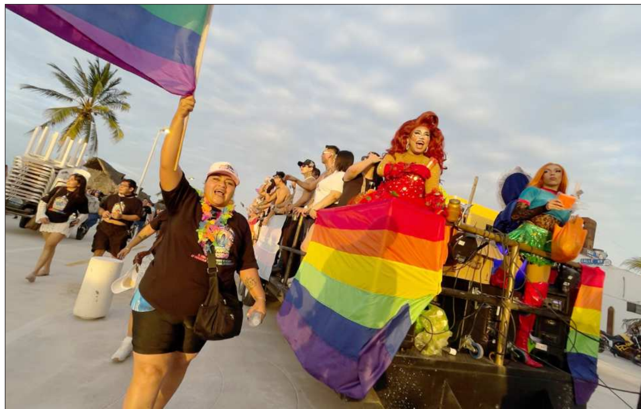
▲ Este año se cumplió la décima edición de la movilización en el puerto y la convocatoria estuvo abierta para todas las disidencias sexo-genéricas, culminando con un mitin de intercambio de testimonios y experiencias.

“No hay nada que curar”, resuena entre los ritmos de