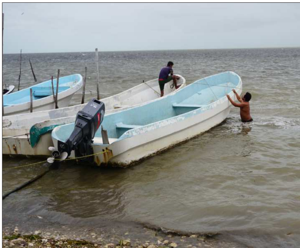
▲ La disminución en las capturas ha provocado que, en ocasiones, los pescadores no logren cubrir los gastos de operación de sus embarcaciones, por lo que algunos incluso recurren a préstamos para costear el combustible.

Por su parte, autoridades de la Secretaría de Marina (Semar), a través de la Capitanía de Puerto, ex-