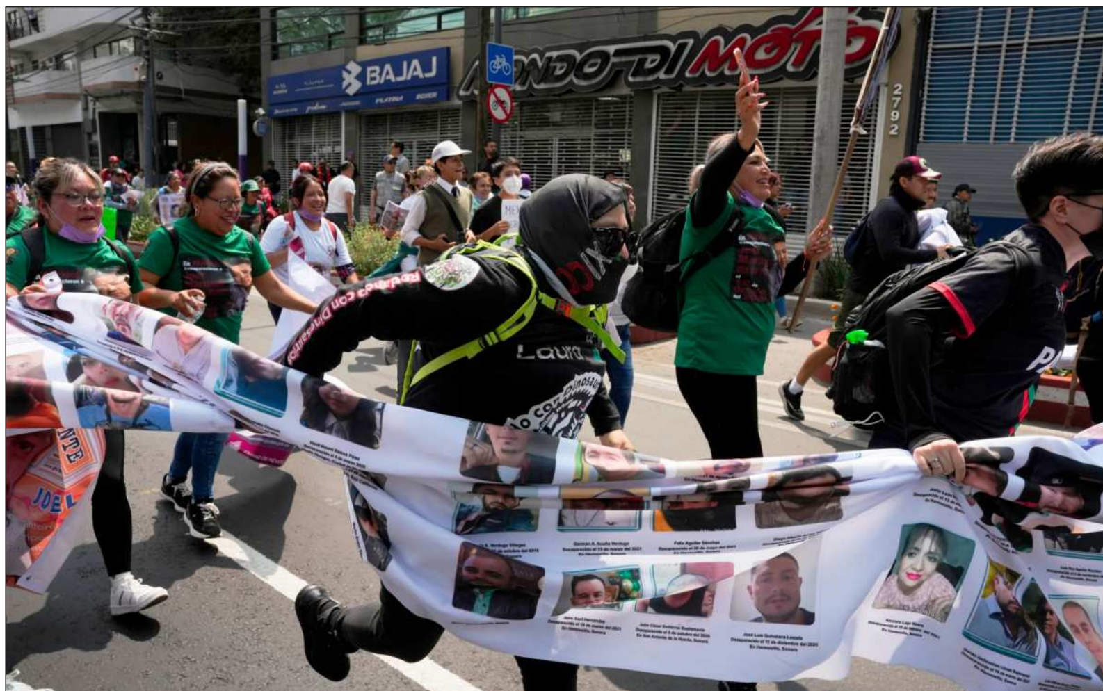
▲ "Existe también una profunda insatisfacción al ver cómo el régimen, en su pragmatismo quizás ineludible, ha reeditado algunas prácticas del viejo sistema como el chambismo , el acarreo y otros vicios que no son saludables para la democracia y que aproximan peligrosamente al populismo un proyecto de gobierno popular".