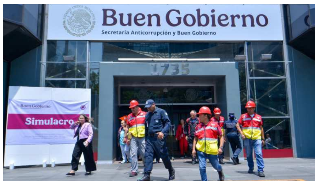
▲ El ruido en estos momentos está centrado en Rocha Moya. Independientemente de lo que resulte de la investigación, debe reconocerse que sí hay frutos en el combate a la corrupción.

El ruido en estos momentos está centrado en una figura: el morenista Rubén Rocha Moya, gobernador con licencia de Sinaloa. Independientemente de lo que resulte de la investigación, debe reconocerse que sí hay frutos en el combate a la corrupción. Tal vez hoy no resulten el caso ejemplar del sexenio, pero sí es posible tomarlo como signo de que podemos esperar una cosecha mayor en el gobierno de Claudia Sheinbaum.