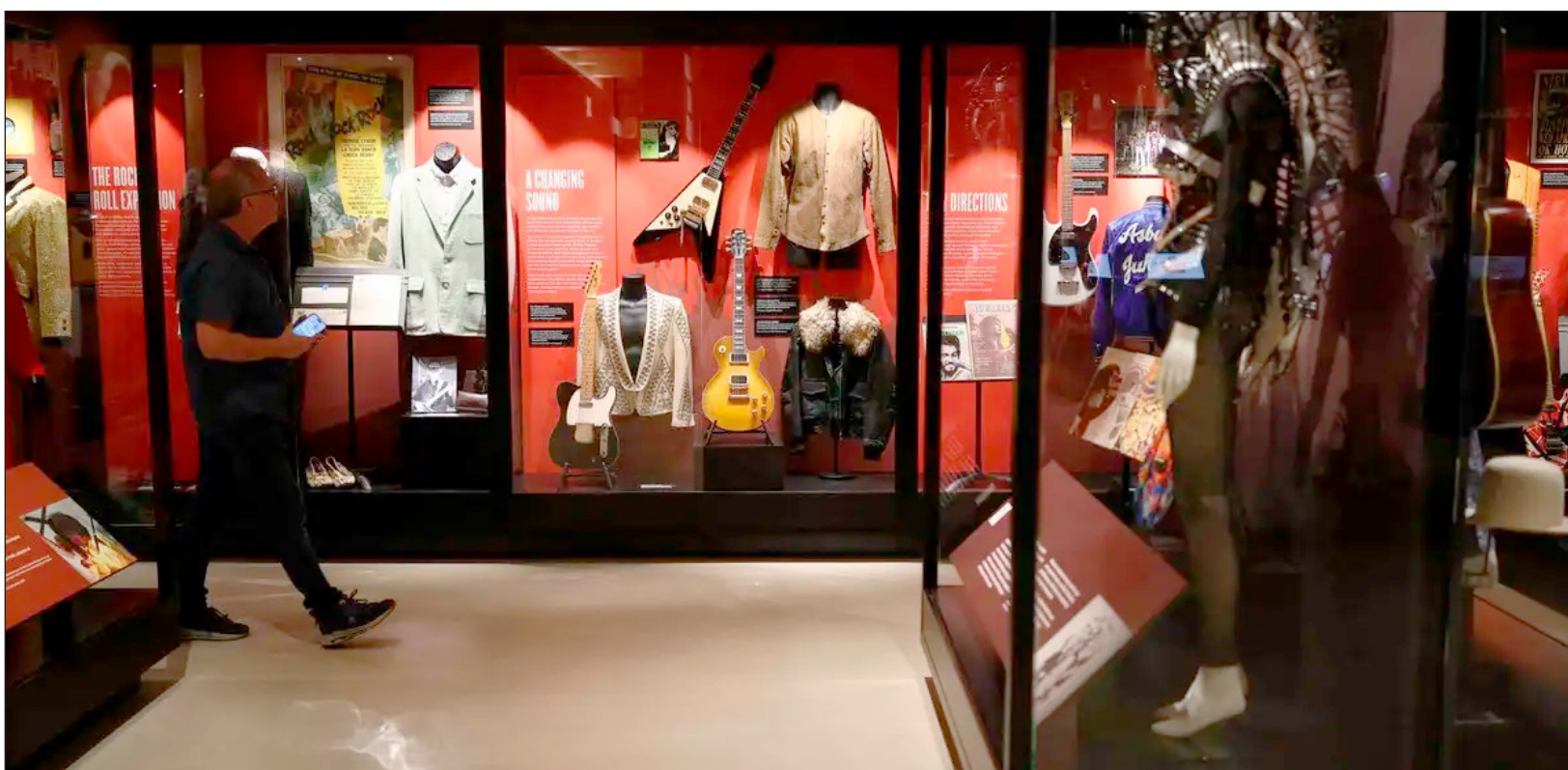
▲ El Centro Bruce Springsteen para la Música de Estados Unidos abarca dos niveles y unos 3 mil metros cuadrados. La primera planta está dedicada a los géneros que conforman la música estadounidense: blues, country, hip-hop, jazz y más; “sólo soy un eslabón en una larga cadena de transmisores”, afirma el artista de 76 años.

“Nos esforzamos por contar una historia apolítica y no partidista”, explica Bob Santelli.