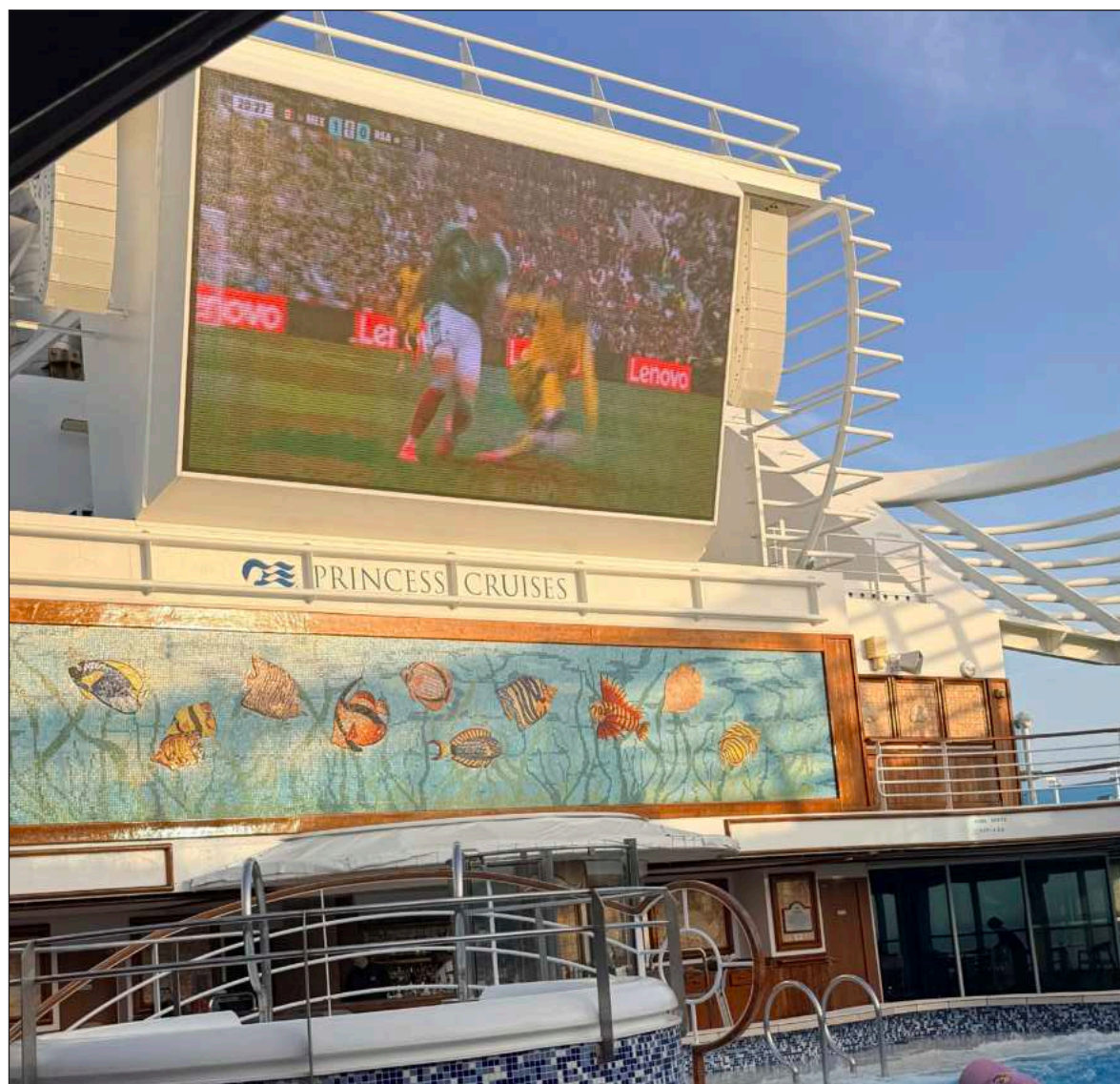
▲ "Este Crucero Mundial , partió y regresará a Sydney y a Nueva Zelanda, por lo que la mayoría de los viajeros son de esos rumbos. Observándolos, caigo en cuenta de que los habitantes de ambos países son muy diferentes".