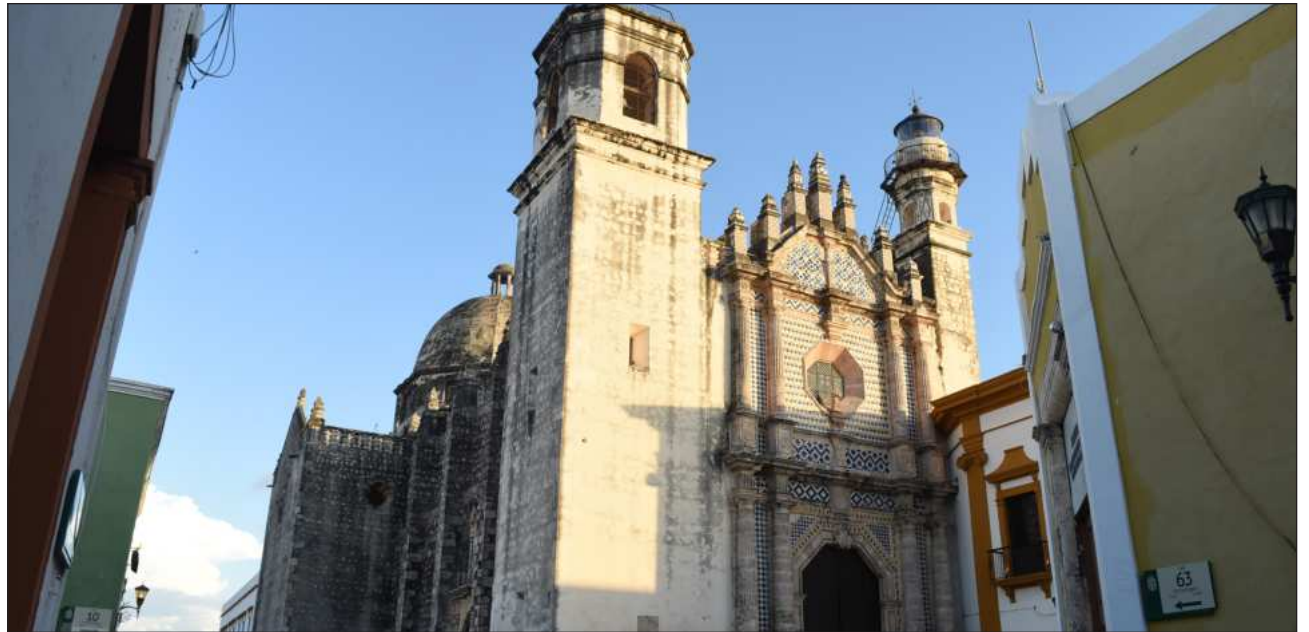
▲ “Estamos pendientes de la iglesia de San Francisquito por su deterioro, estamos tratando de hacer una entrevista con el obispo de Campeche para ver de qué manera podemos hacer equipo”, subrayó la directora.

“Estamos teniendo problemas con los templos y se manifiestan estas situaciones en la época de lluvias”