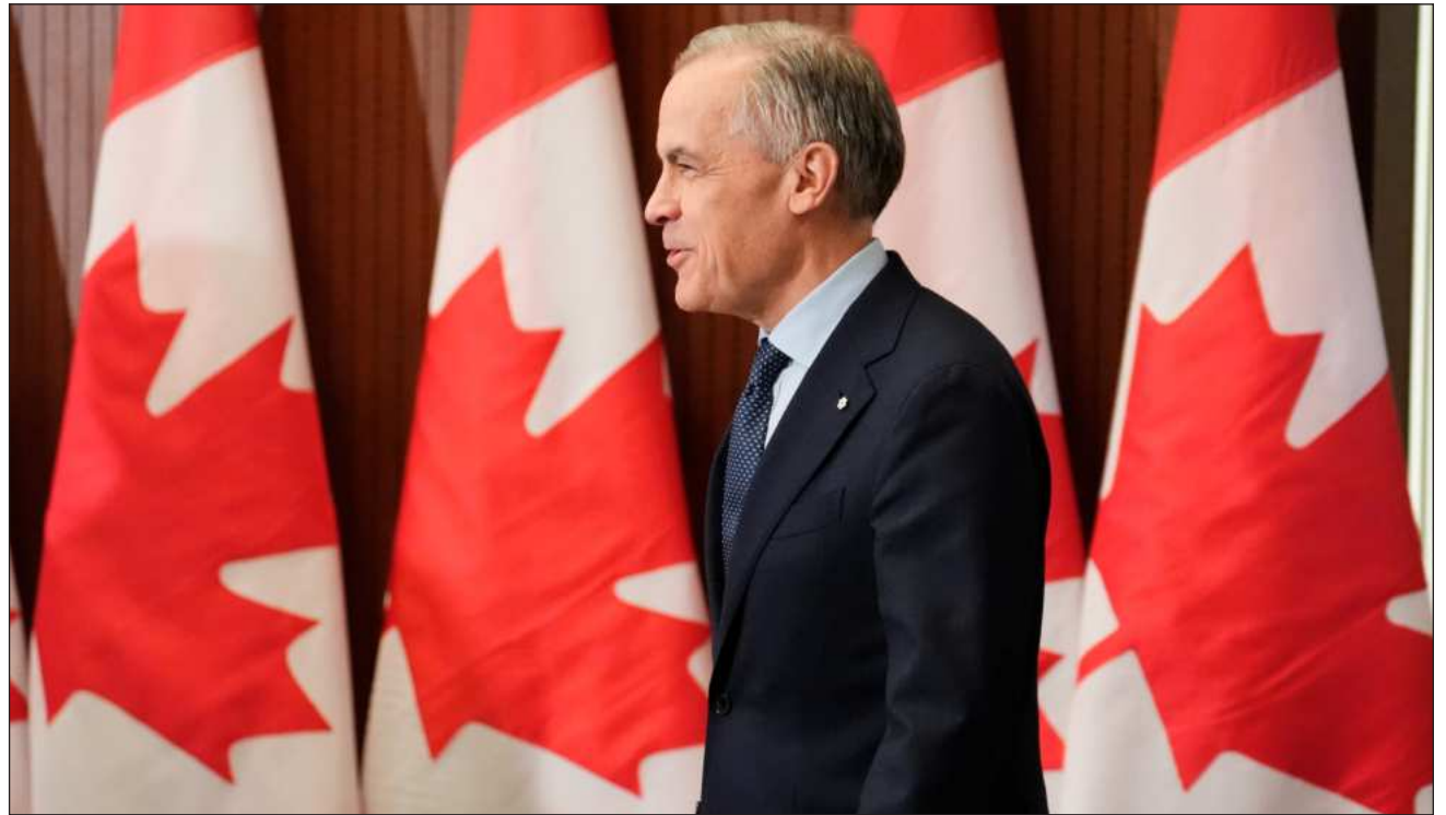
▲ Tensiones comerciales siguen latentes entre Ottawa y Washington. Trump reiteró que su país no necesita nada de su vecino del norte.

"No quieren cambiar la arquitectura fundamental del pacto", subrayó Mark Carney