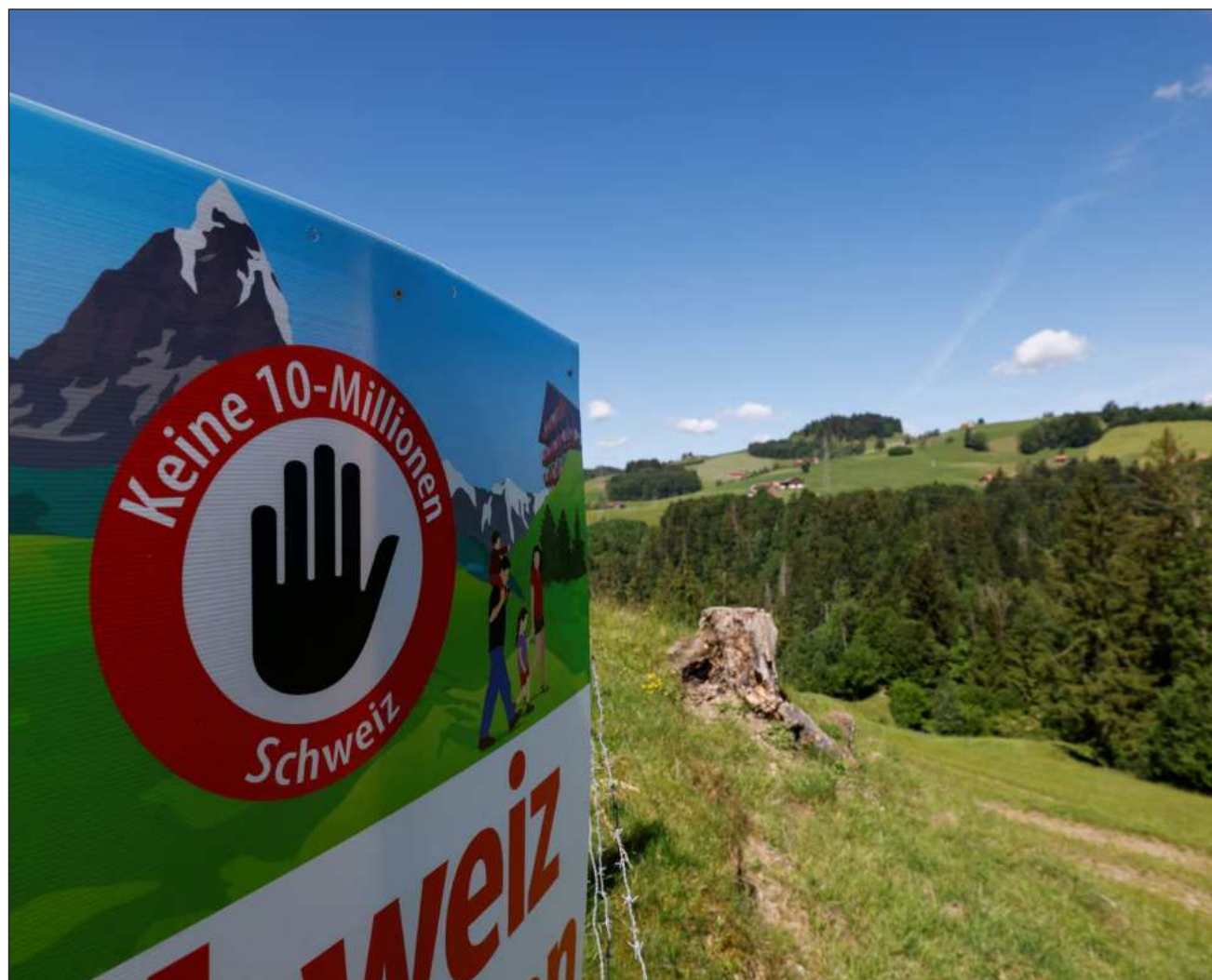
▲ El gobierno, el Parlamento, la Patronal, así como los sindicatos se oponían a la medida anti migratoria.

La propuesta también fue rechazada por la mayoría de los cantones, y los porcentajes más altos a favor del “No” se registraron en Basilea-Ciudad (73.48%),