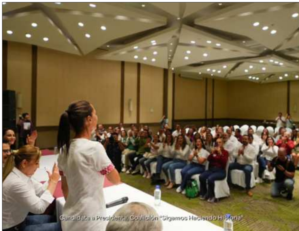
▲ En Jalisco, la abanderada de Sigamos Haciendo Historia destacó que “nosotros estamos arriba de los 50 puntos en el reconocimiento del pueblo de México”.

Entre gritos de “¡vamos a ganar, vamos a ganar!”, Sheinbaum indicó que el día de los comicios solo habrá dos opciones en la boleta: una, la que representamos los partidos de nuestro movimiento, Morena, Partido Verde, Partido del Trabajo y aquí en Jalisco, Hagamos y Futuro. Y del otro lado, el PRIAN o Mo-