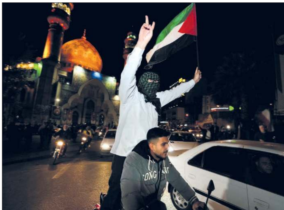
▲ En el transcurso de las dos últimas semanas, las autoridades iraníes afirmaron su voluntad de “castigar” a Israel tras la muerte de siete Guardianes de la Revolución.

Pocas horas antes del ataque contra Israel, Irán capturo en el estrecho de Ormuz un portacontenedores “vinculado” a Israel con 25 tripulantes a bordo, hecho calificado por Estados Unidos como un “acto de piratería”.