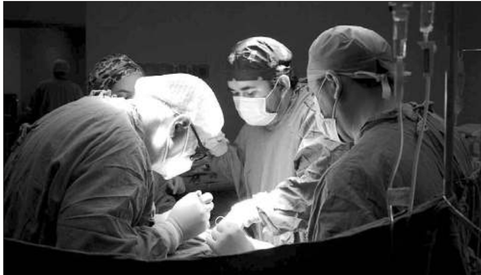
▲ En esta procuración infantil se obtuvieron hígado y dos riñones, se trasladaron vía aérea a Toluca y después a la Ciudad de México, a fin de realizar los trasplantes a niños en lista de espera del Cenatra.

El pequeño superhéroe, como le dejaban ver sus padres, era el niño más carismático de la familia, tenía siete años cumplidos y en la emergencia que presentó fue trasladado a la clínica más cercana donde se confirmó el accidente cerebrovascular hemorrágico.