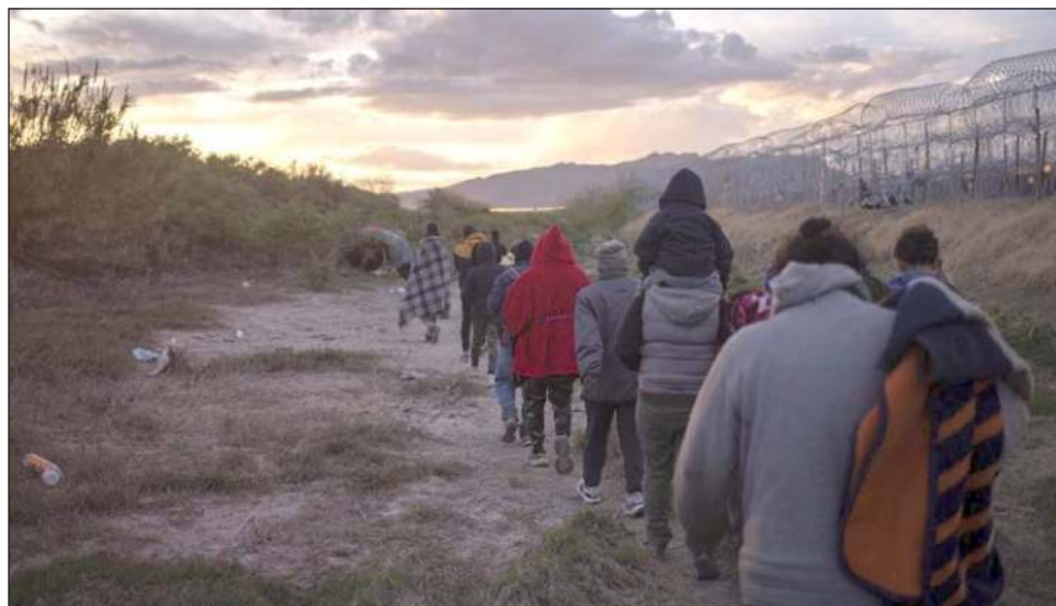
▲ En los núcleos familiares había 17 personas de Colombia (ocho de ellas niñas, niños y adolescentes), siete personas de Bolivia (dos de ellas niñas, niños y adolescentes) y nueve de Brasil.

En los núcleos familiares había 17 personas de Colom-