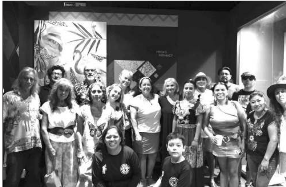
▲ En el Primer Festival por el Día Internacional de la Tierra habrá, entre otras actividades, exposiciones pictóricas, talleres, conciertos, rally y concursos.

"Esta es la primera edición de este festival, esperamos que este hermanamiento de diferentes organizaciones, colectivos e instituciones comprometidas con el arte y la cultura de manera personal y consciente se hagan cada vez más grande. Uno de los objetivos del festival es ge-