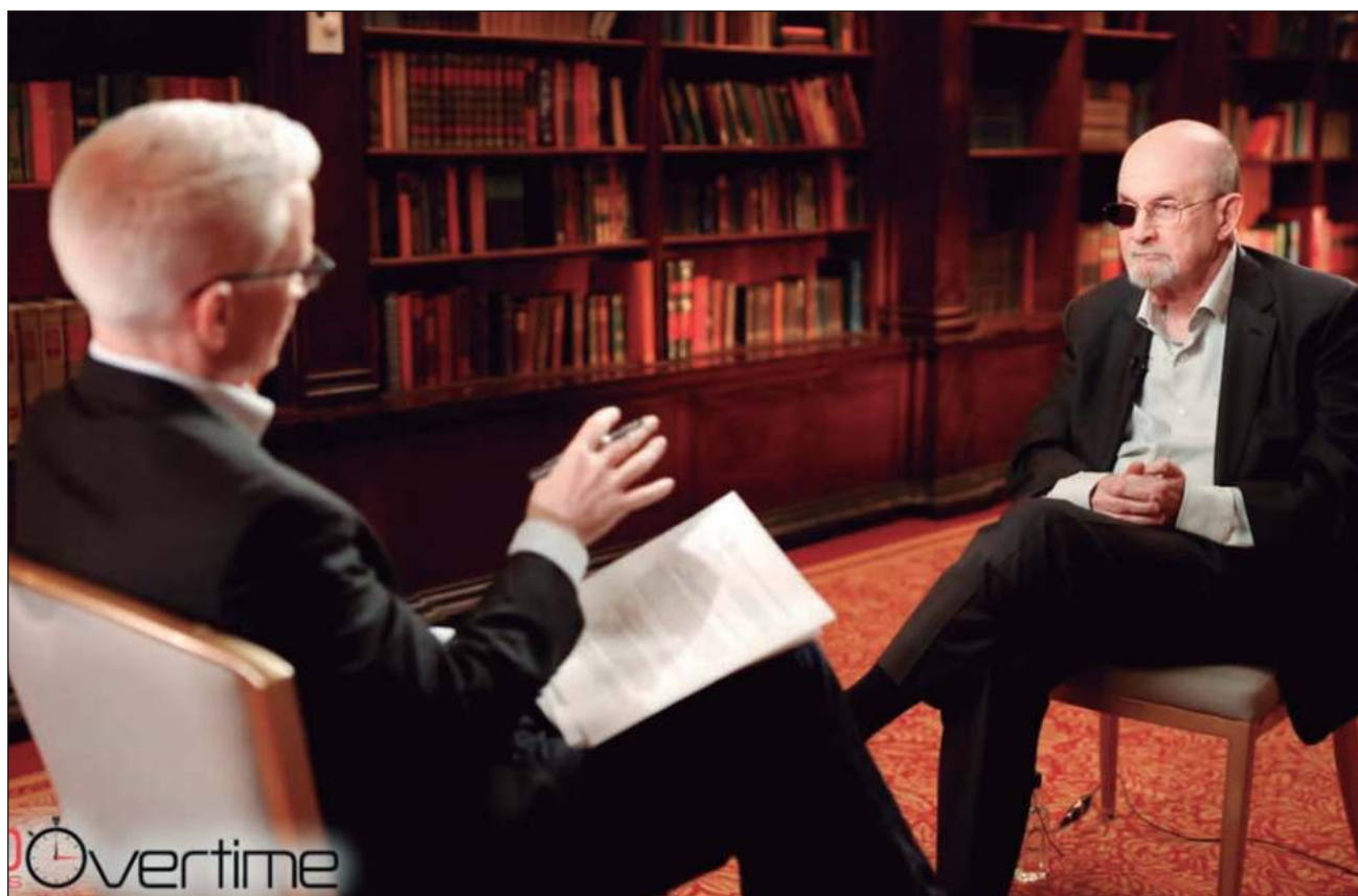
▲ El ataque contra el novelista ocurrió el 12 de agosto de 2022, minutos antes de que presidiera una charla en el auditorio de la Institución Chautauqua, en Nueva York: perdió la vista de un ojo y una mano quedó incapacitada.

Algunas de sus obras más sobresalientes son Hijos de la medianoche , El último suspiro del moro , Joseph Anton y Quijote .