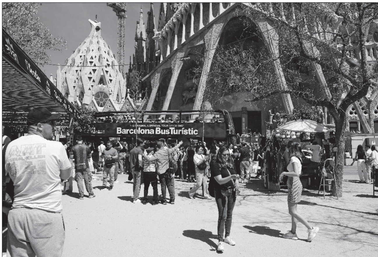
▲ El fenómeno de montaviajes consiste en que empresas turísticas en Internet ofrecen a los usuarios un viaje de muy buen costo, y una vez que las personas realizan algún pago, en su mayoría virtuales, las supuestas firmas desaparecen.

Algunas firmas tecnológicas han anunciado herramientas para prevenir este tipo de delitos