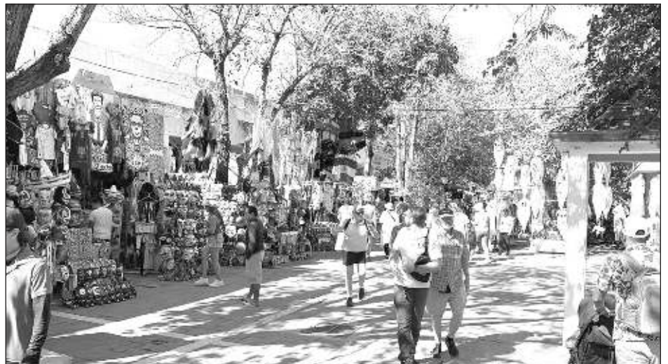
▲ En esta temporada vacacional destacó la preferencia de turistas por artículos que les permitan disfrutar de actividades al aire libre de manera más cómoda y segura.