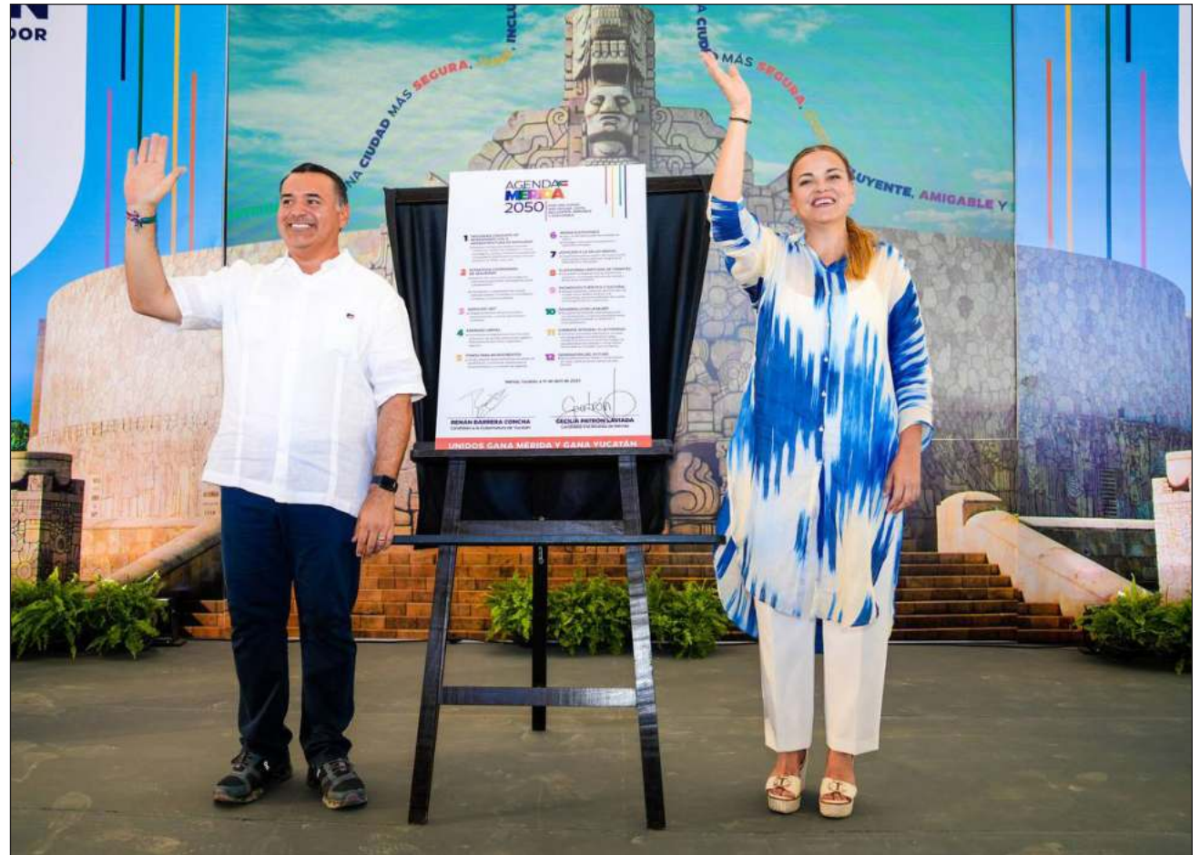
▲ La Agenda Mérida 2050 involucra la mejora de la atención a la salud mental, facilitación de trámites estatales y municipales, una policía mejor capacitada y la creación de la Universidad de las Mujeres.

Cecilia Patrón destacó que esta agenda toma en cuenta a las madres solteras, a los adultos mayores, a los jóvenes, a