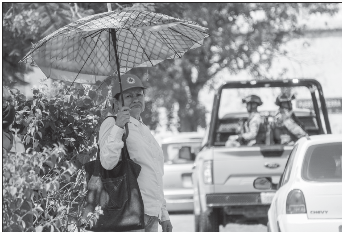
▲ "Las propuestas para mejorar la calidad de vida de las mujeres en condición de pobreza se centraron en mantener o aumentar los programas sociales, con preponderancia en las transferencias monetarias condicionadas".

POR EJEMPLO, ACTUALMENTE los salarios de las servidoras públicas de los centros de atención (rosas