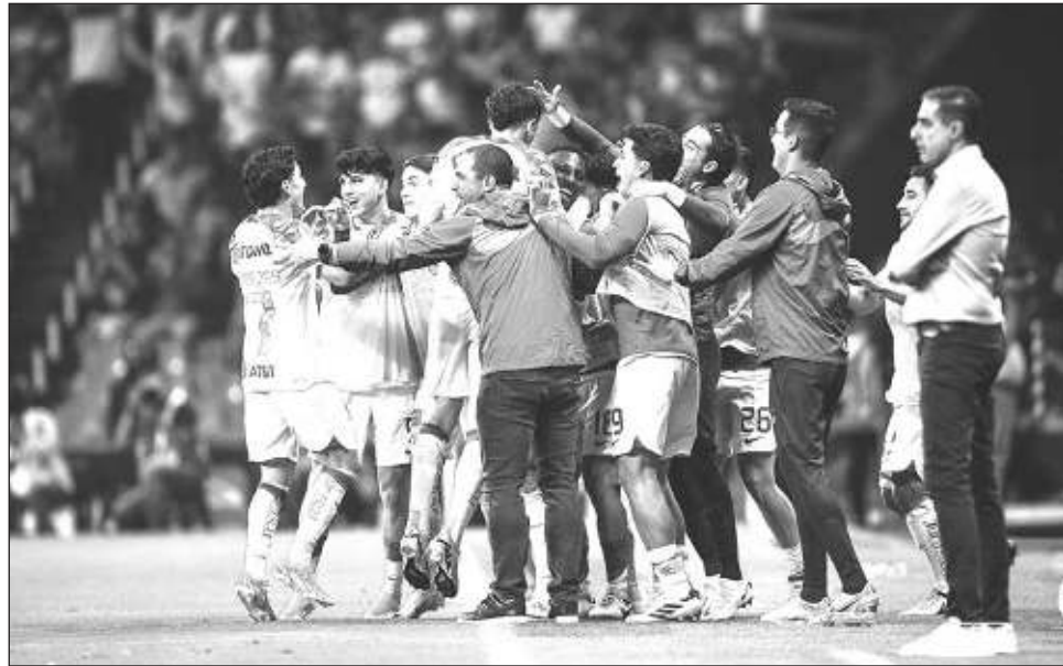
▲ Las Águilas arrasaron con el Toluca para regresar al primer lugar