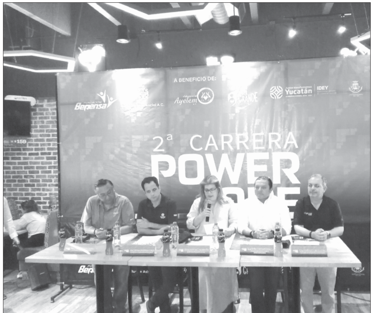
▲ La carrera con causa, que se llevará a cabo a lo largo de la Avenida 128, apoyará a las asociaciones civiles Club Especial Ayelem, Institución Asistencial A.C. y al programa Ser Grande de Fundación Bepensa.