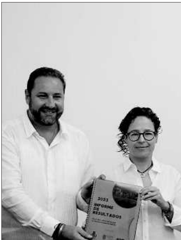
▲ Al inicio de la administración municipal, el porcentaje de turismo nacional y extranjero que llegaba al estado era de 8%, cifra que ahora en día asciende al 19%.

“Aunque estos datos indican que estamos dando resultados, con la información del estudio podremos