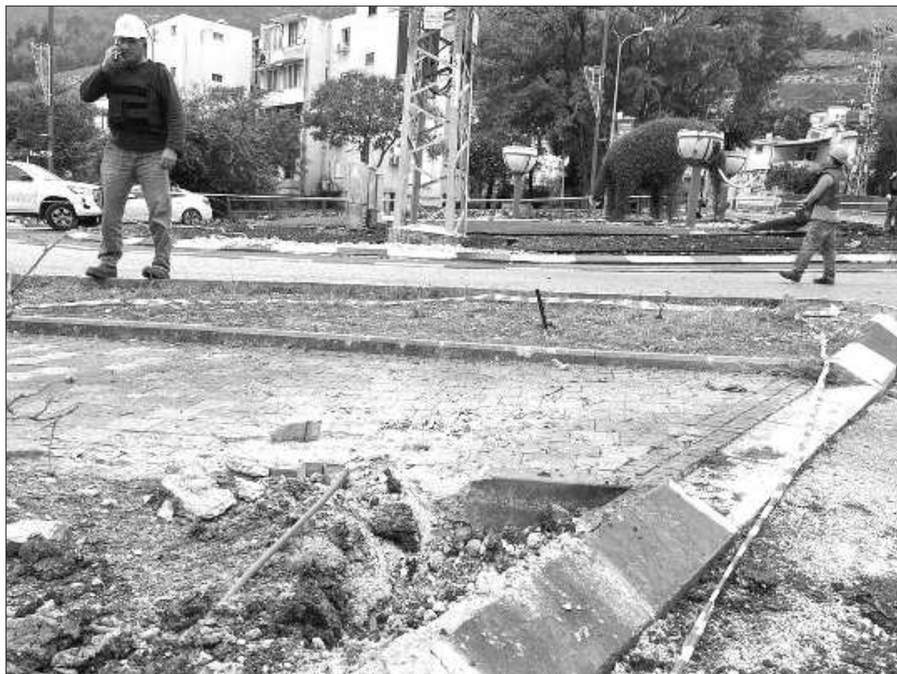
▲ La andanada de misiles lanzados desde el sur del Líbano, probablemente de la organización chií libanesa Hezbollah, mataron a una persona e hirieron a siete israelíes más la mañana del 14 de febrero.

El medio Al-Manar publicó que una persona también fue asesinada en Adchit.