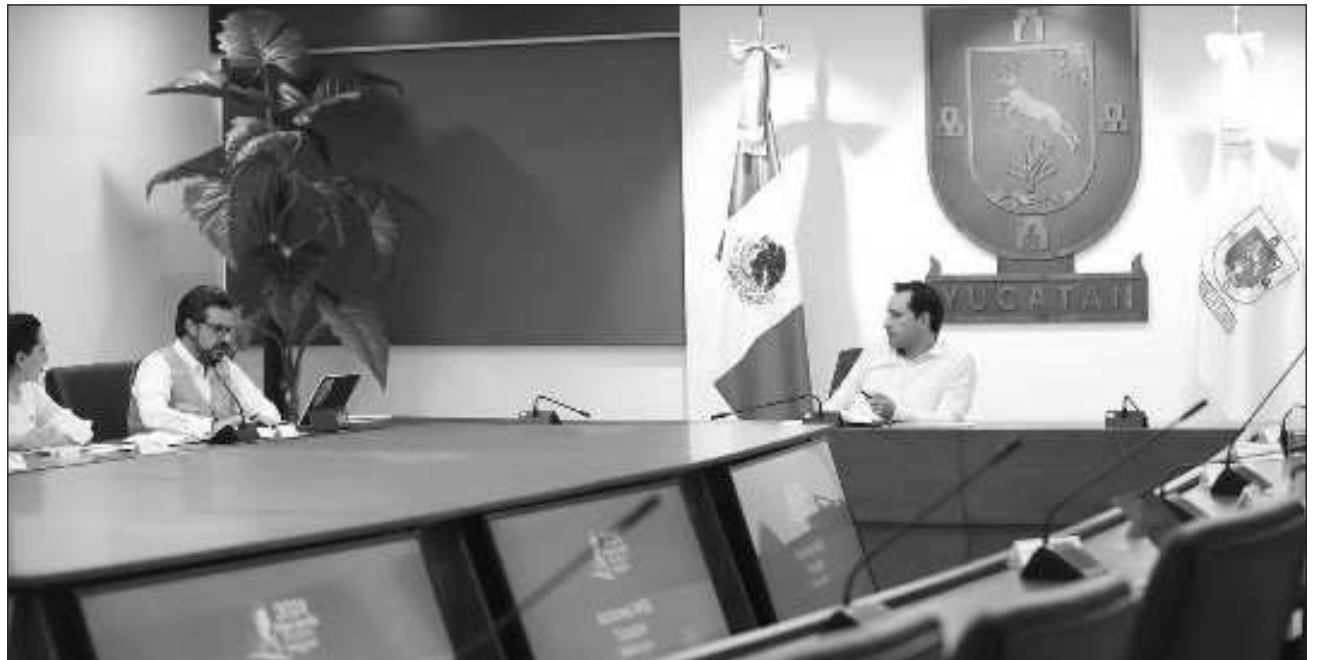
▲ El mandatario reiteró la voluntad del gobierno del estado de seguir trabajando juntos en el impulso de obras y programas que acerquen la salud a toda la población.

Vila Dosal reiteró la voluntad del gobierno del estado de seguir trabajando juntos en el impulso de obras y programas que acerquen la salud a toda la población, principalmente en el interior del estado. Recordó que desde hace un año se trabaja en la remodelación de los 140 Centros de Salud que hay en el estado, a los cuales también se les han incorporado servicios de ultrasonido, análisis clínicos, dentista y atención psicológica. Además, para garantizar que nadie se quede sin recibir atención, se amplió el hora-