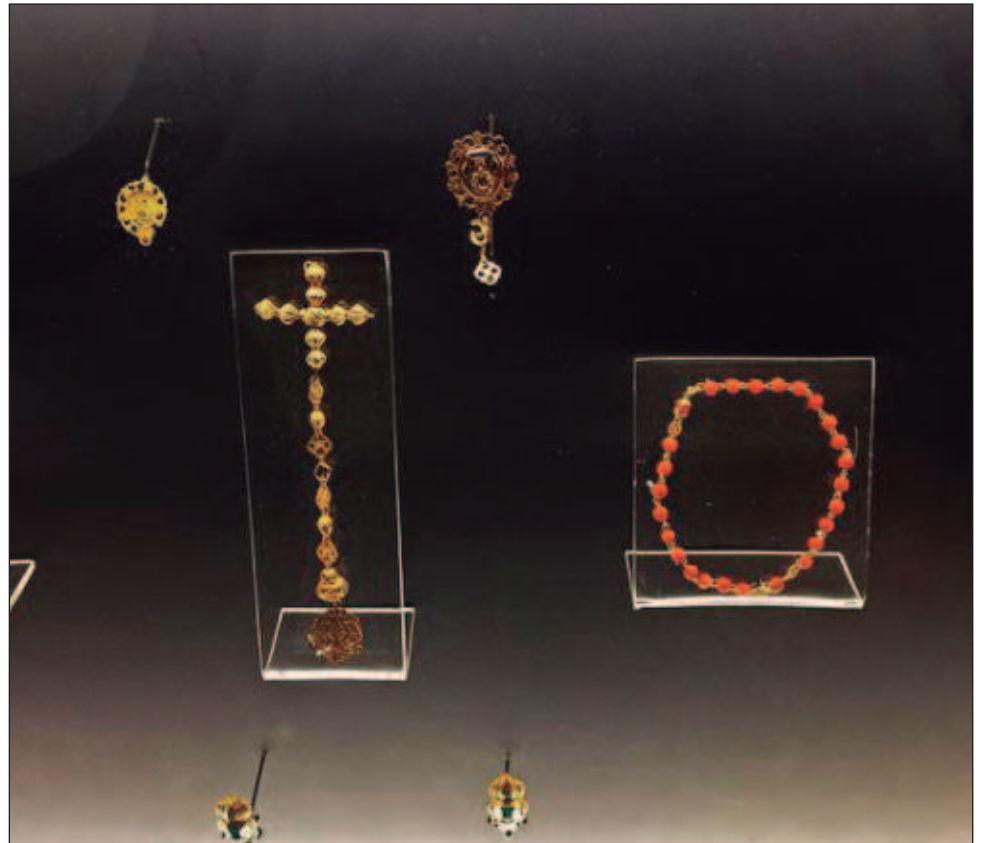
▲ La colección se compone de 420 piezas que forman parte de una investigación interdisciplinar: arqueólogos, estudiosos de la joyería, gemas, metales e ingenieros.

La colección está ahora en la muestra permanente El tesoro de Alacranes , en el Museo de Arqueología Subacuática El Fuerte de San José El Alto, en Campeche, estado del sureste mexicano.