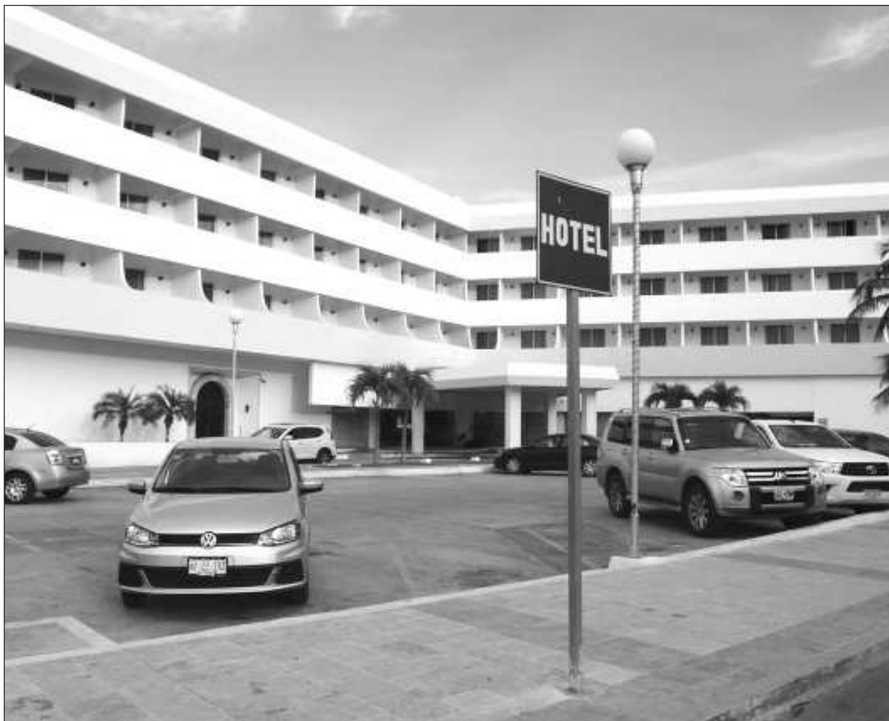
▲ Los moteles de la ciudad reportaron movimiento de leve a regular por el 14 de febrero.

Los vinculados a proceso realizarán firmas periódicas, pagarán una fianza de 5 mil pesos y no podrán salir del estado y menos del país si no es con autorización de un juez, además que no pueden acercarse a los testigos que aportarán información para determinar el grado de culpabilidad o no.