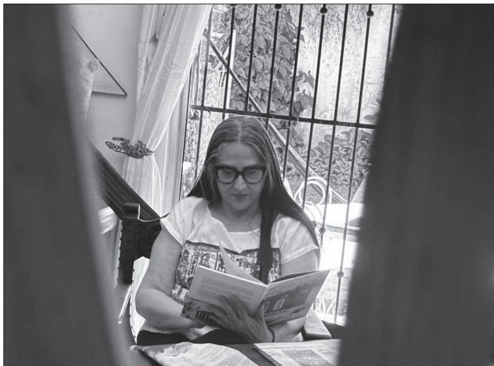
▲ El libro es también una invitación a que los lectores se animen a escribir sus propias anécdotas, a plasmar sus recuerdos y evitar que estos se escapen.

Incluso, destaca un escrito donde comparte el primer secuestro de un avión en México, un momento que vivió de cerca ya que su hermano se encontraba a bordo.