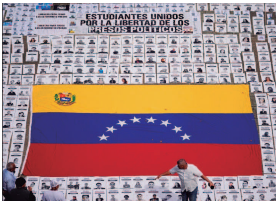
▲ Hasta la fecha el gobierno bolivariano ha ejecutado 406 excarcelaciones; el proceso “no ha culminado aun” y se mantiene abierto, aseguró la presidenta Delcy Rodríguez.

La llamada se produce a 11 días de la captura del presidente, Nicolás Maduro y su esposa Cilia Flores, or-