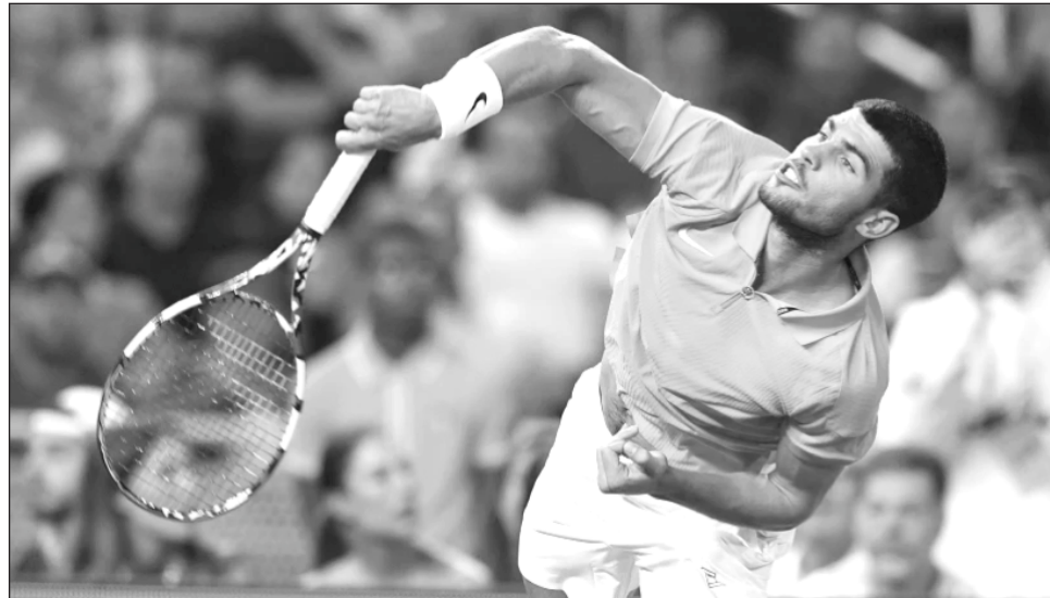
▲ Carlos Alcaraz saca durante una exhibición en Miami, el pasado 8 de diciembre.

El español posee un total de seis hasta ahora: dos de la arcilla roja del Abierto de Francia, el césped de Wimbledon y las canchas duras del Abierto de Estados Unidos. La polaca también: cua-