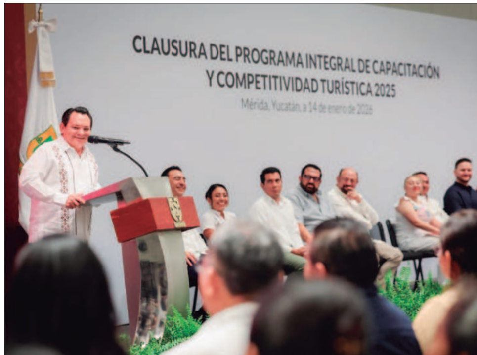
▲ El gobernador Joaquín Díaz Mena encabezó la ceremonia de clausura y entrega de reconocimientos del Programa Integral de Capacitación y Competitividad Turística 2025, mediante el cual más de 2 mil prestadores de servicios recibieron una capacitación.

Díaz Mena precisó que se impartieron 92 cursos, se atendieron 20 municipios y se capacitó a más de dos mil personas, acciones que deben traducirse en mejor