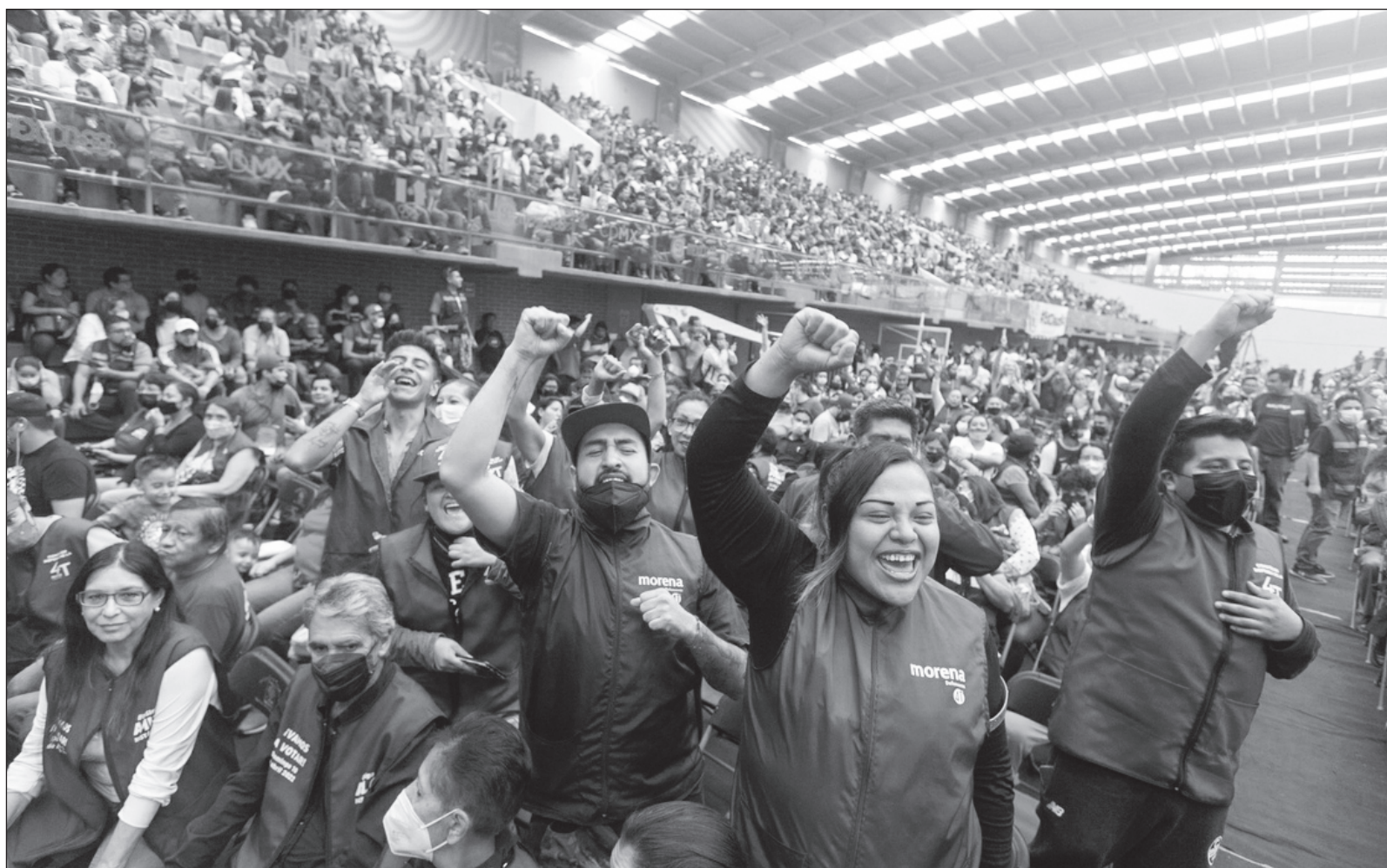
▲ “La definición de candidaturas para el proceso electoral de mediados del año próximo, se adelantará y será en el mes de junio de este año”.