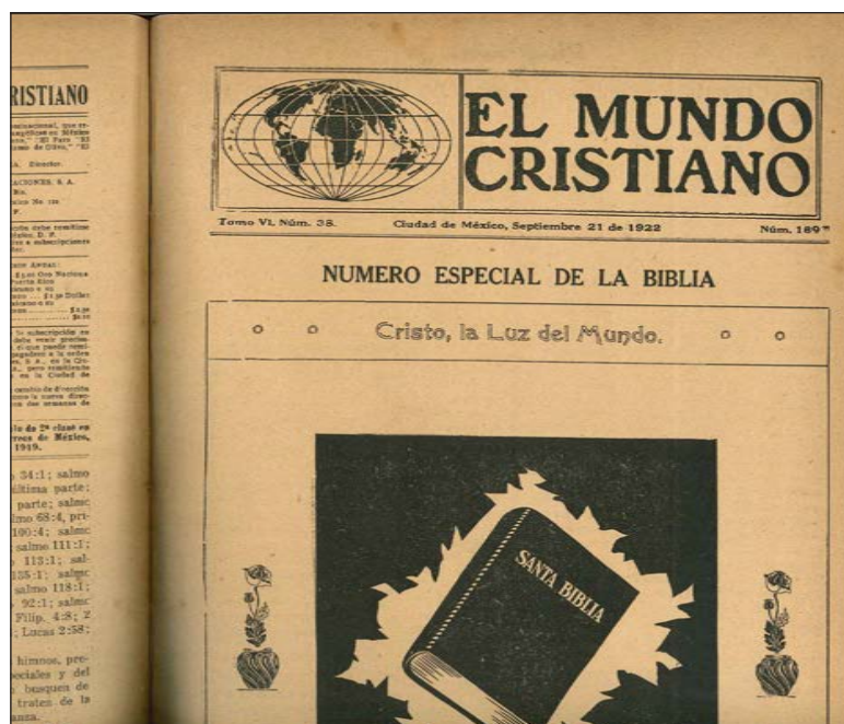
▲ “El director de El Mundo Cristiano expuso una serie de impresiones derivadas de su estancia en tierras yucatecas, tanto en lo concerniente al paisaje y a lo que consideró el carácter nativo como a la vida social”.