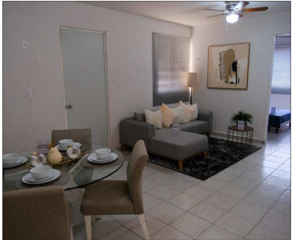
▲ El Infonavit pretende contratar 404 mil 516 viviendas este año.

En total el Infonavit pretende contratar 404 mil 516 viviendas este año, de acuerdo con su titular.