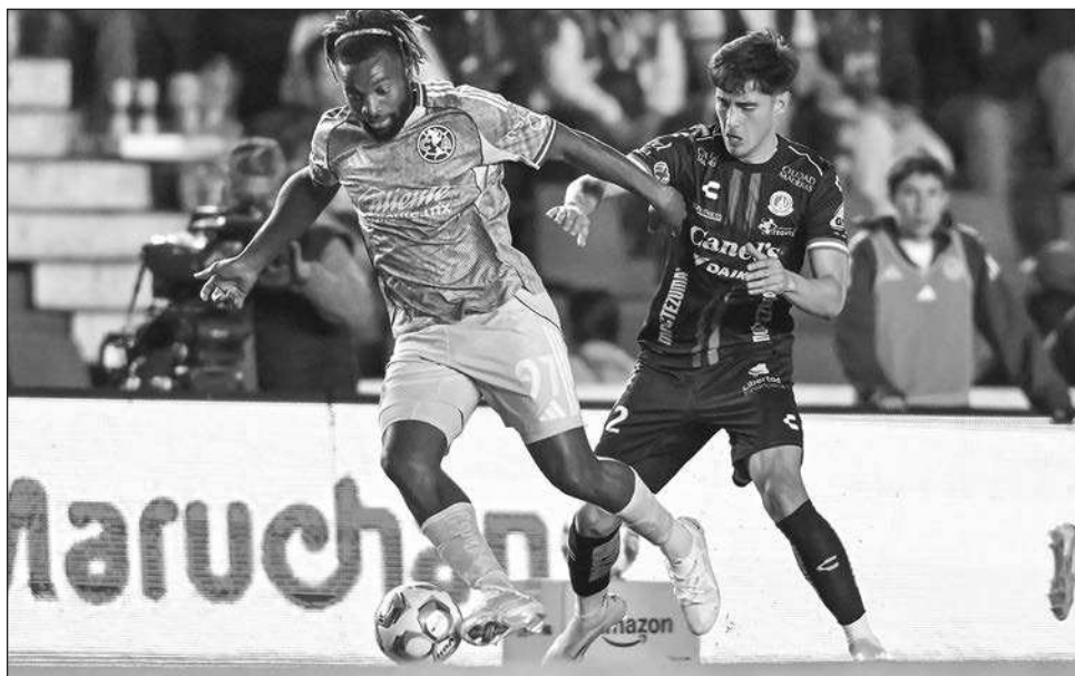
▲ El América se quedó con un punto tras perder 2-0 ante San Luis.

Cruz Azul tuvo que buscar nueva casa poco antes del inicio del campeonato. Las autoridades de la Universidad Nacional Autónoma de México (UNAM) le comunicaron a la directiva celeste que no podría usar más el estadio de Ciudad Universitaria, donde jugó tres torneos de liga (Apertura 2024, Clausura 2024 y