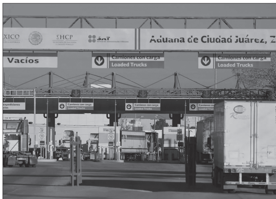
▲ La Presidenta recordó que empresas de EU mantienen numerosas plantas de producción en México, no sólo en el sector automotriz, sino en múltiples ramas industriales.

En su conferencia matutina en Palacio Nacional, Sheinbaum Pardo enfatizó que las economías de ambos países están “muy interrelacionadas, muy integradas” y aseguró que “quienes más defienden el tratado son los empresarios estadounidenses”. Explicó que esto se debe a que empresas de Estados