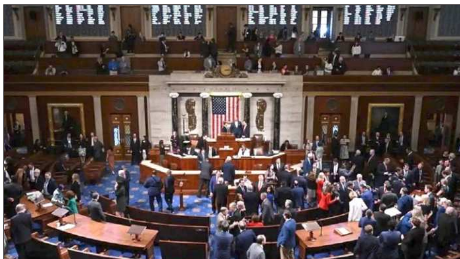
▲ El diputado Joaquín Castro, el demócrata de mayor rango del Subcomité sobre el Hemisferio Occidental, subrayó que "lanzar a Estados Unidos a otra guerra innecesaria -y no autorizada- en América Latina es una movida desestabilizadora que regresará para azotar a la nación".

"Lanzar a Estados Unidos a otra guerra innecesaria -y no autorizada- en América Latina es una movida desestabilizadora que regresará para azotar a la nación", declaró el diputado Castro. Señaló que la gente que representa "no desea que Estados Unidos gaste miles de millones en otra guerra que arriesga desestabilizar la región, migración masiva y abusos de derechos humanos", y ar-