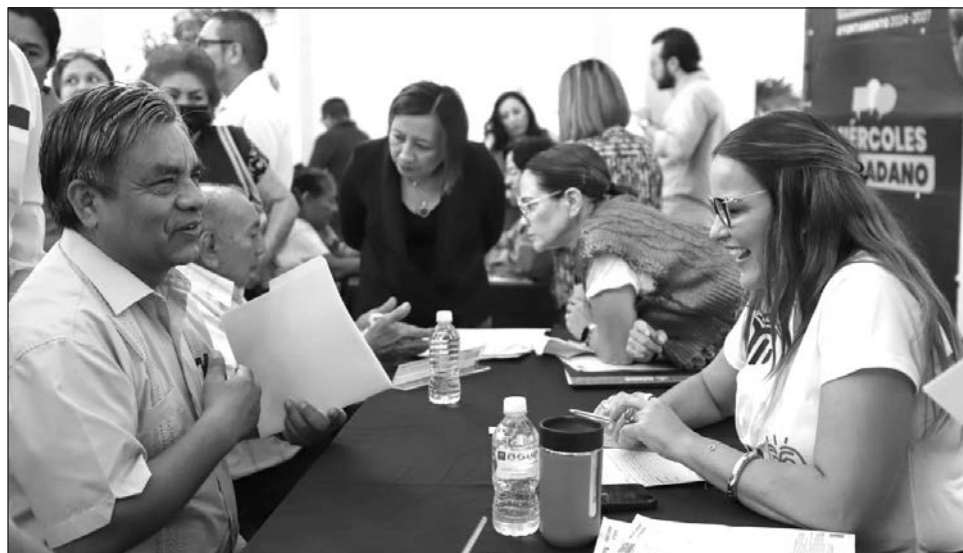
▲ La alcaldesa reconoció la corresponsabilidad social de la comunidad, sobre todo en el pago del impuesto predial, lo que ha permitido fortalecer las finanzas municipales.

“El Miércoles Ciudadano es un mecanismo de participación ciudadana que nos permite gobernar conociendo y atendiendo de primera mano las necesidades de la sociedad. Cada edición recibimos más de cien solicitudes en promedio entre consultas, trámites y servicios, además de acercar programas como la Feria de la Salud, Un Árbol por Familia , Ver Mejor y la Bolsa de Trabajo”, expresó la presidenta meridana.