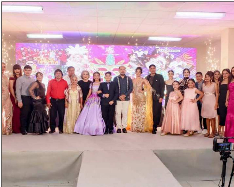
▲ El Carnaval Champotón reafirma su carácter de tradición, identidad y convivencia familiar, como una de las celebraciones más significativas.

Organizadores del Carnaval Champotón 2026 reafirman su carácter de tradición, identidad y convivencia familiar, como una de las celebraciones más significativas del municipio.