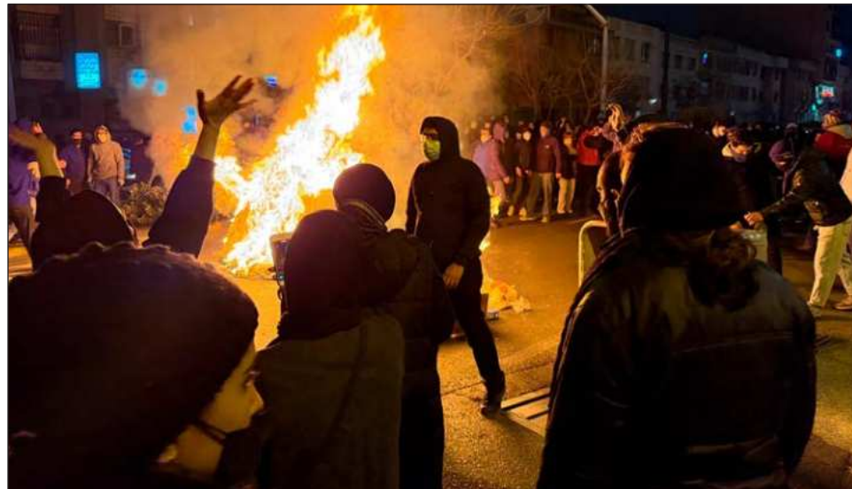
▲ La represión en Irán ha causado al menos 734 muertos, según Iran Human Rights (IHR), con sede en Noruega, que estima que el número real de fallecidos podría ascender a varios miles.

Amnistía Internacional y el Departamento de Estado norteamericano aseguran disponer de información sobre la que sería la primera ejecución de un manifestante, prevista este miércoles.