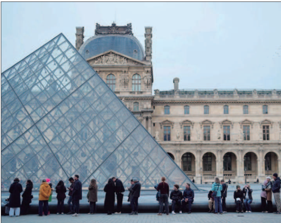
▲ Bajo la nueva estructura, los visitantes que no sean ciudadanos ni residentes de la UE, ni de Islandia, Liechtenstein o Noruega, pagarán la tarifa más alta: 32 euros.

Incremento obedece a repetidas huelgas, hacinamiento crónico y el robo de joyas