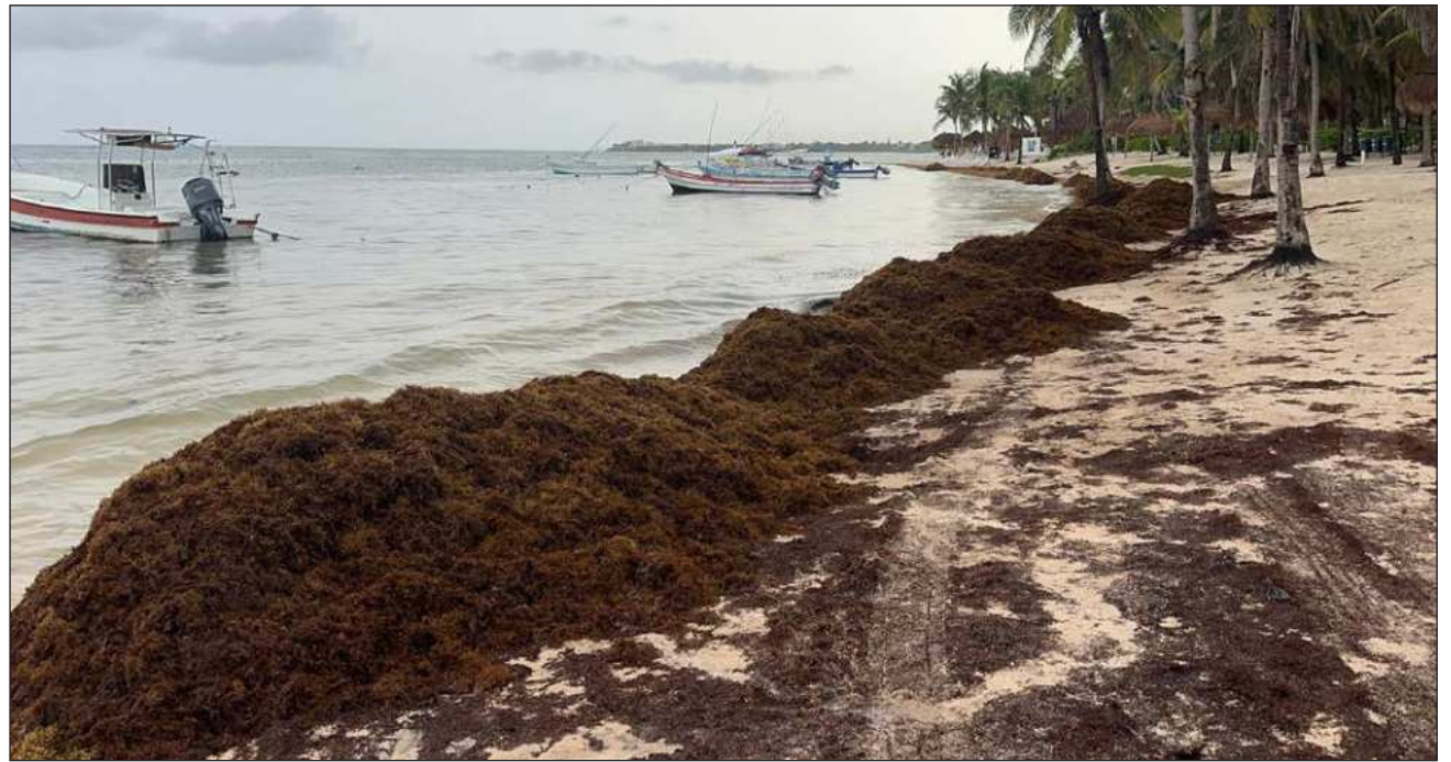
▲ “Es demasiado pronto, pero justamente por eso el gobierno y los hoteleros deben ponerse las pilas y reaccionar rápido; de lo contrario, podríamos enfrentar un año muy complejo”, detalló el especialista en manejo costero integrado y colaborador de Océanos International.

El especialista en esta área de conocimiento aclaró que, aunque existen herra-