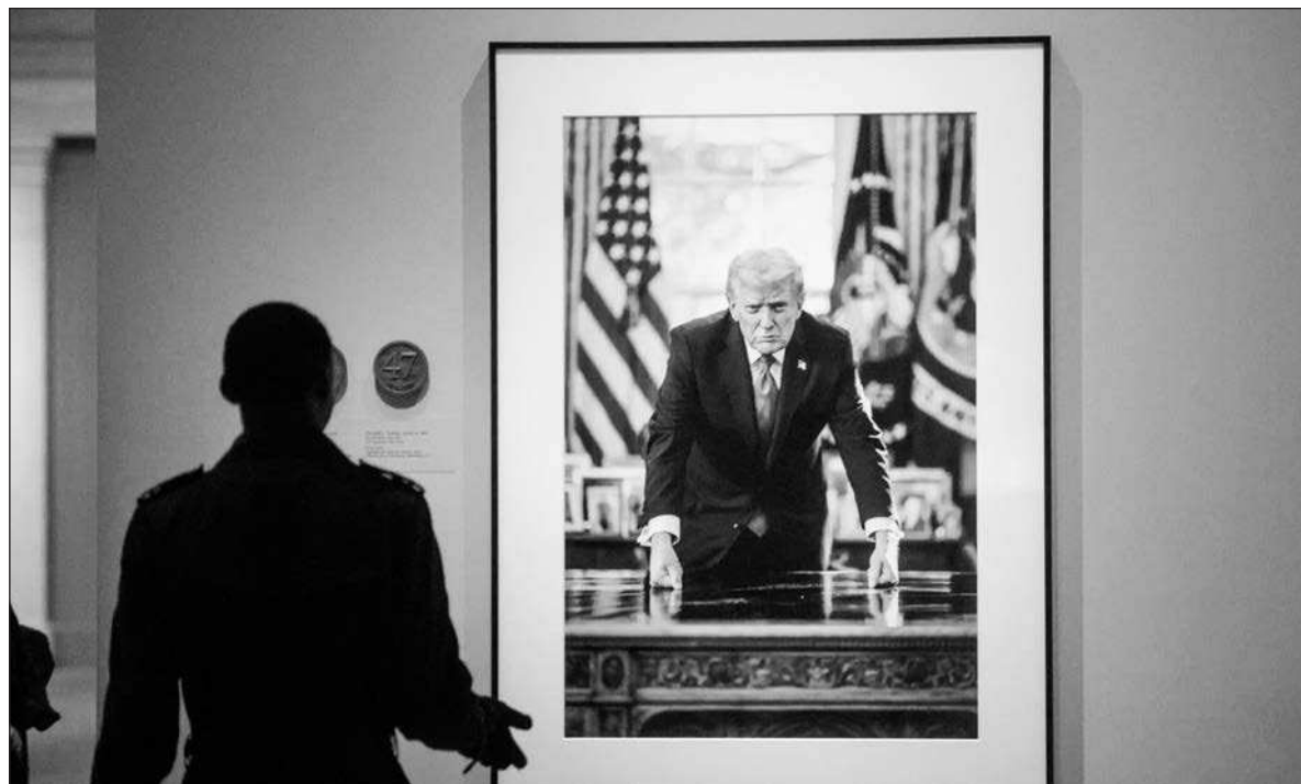
▲ “Contradicciones económicas y políticas se enmarcan, inevitablemente, en una coyuntura en la que Trump se juega el resto de su mandato. El próximo 3 de noviembre habrá elecciones de medio término”.

El teatro de operaciones está atravesado por múltiples y disímiles contradicciones. Las directrices sobre las medidas a tomar en Caracas anunciadas por Donald Trump en su conferencia del 3 de enero, se han modificado. Pareciera que, más que tener un proyecto de acción preciso y ordenado, el horizonte de Washington en esa zona se va ajustando sobre la marcha. La confusión es aún mayor porque los planes anunciados por el mandatario no siempre coinciden con lo que dice Marco Rubio, su secretario de Estado. El