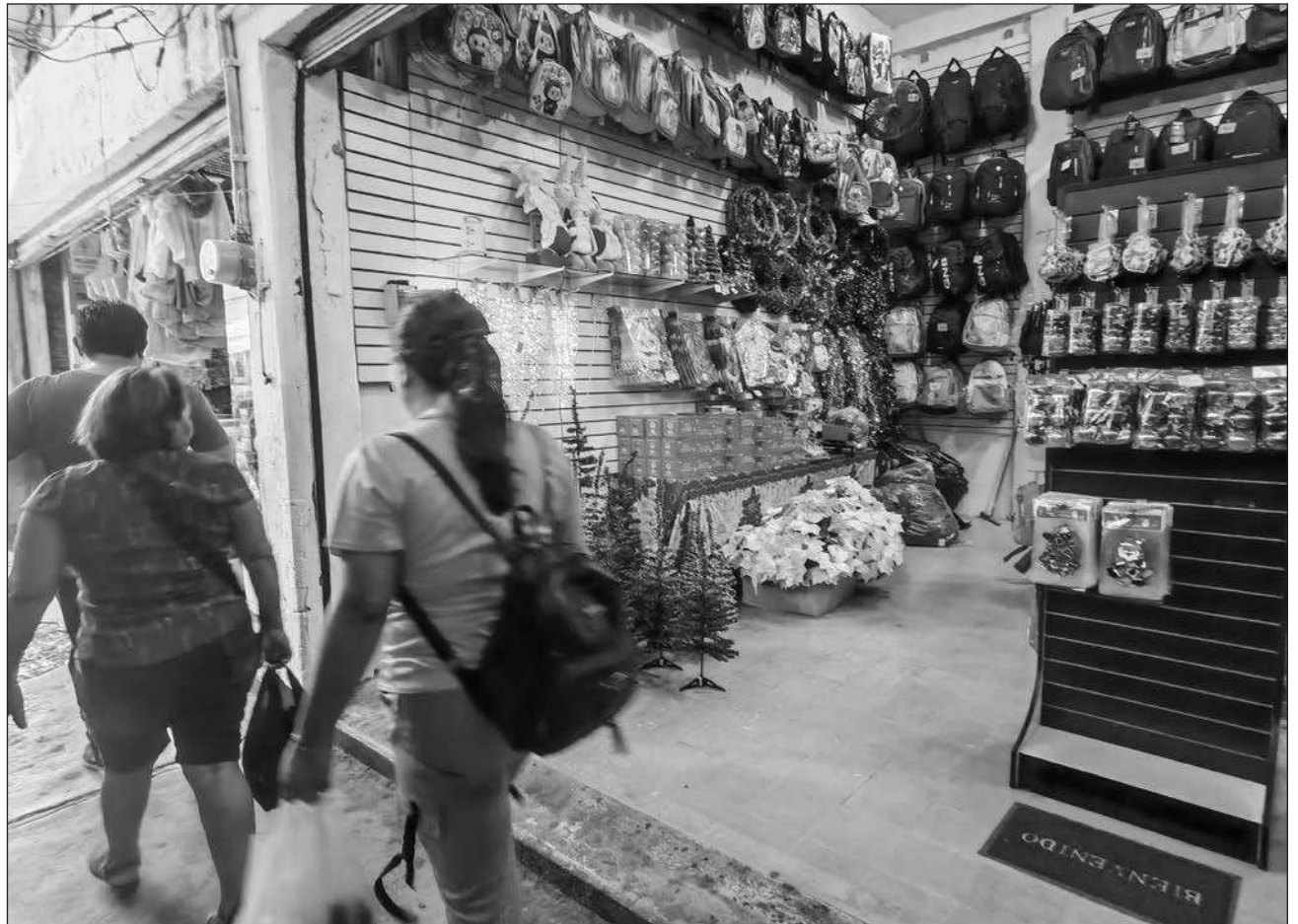
▲ De acuerdo con el presidente de la Canaco-Servytur, entre 2022 y 2025 periodo se presentaron mil 236 denuncias, de las cuales 516 fueron robos con violencia, por lo que destacó la necesidad de actualizar los marcos legales.

Detalló que la incidencia delictiva es a la alza, principalmente en robos a comercios registrados entre 2022 y 2025, periodo en el que se presentaron mil 236 denuncias, de las cuales 516 fueron robos con violencia.