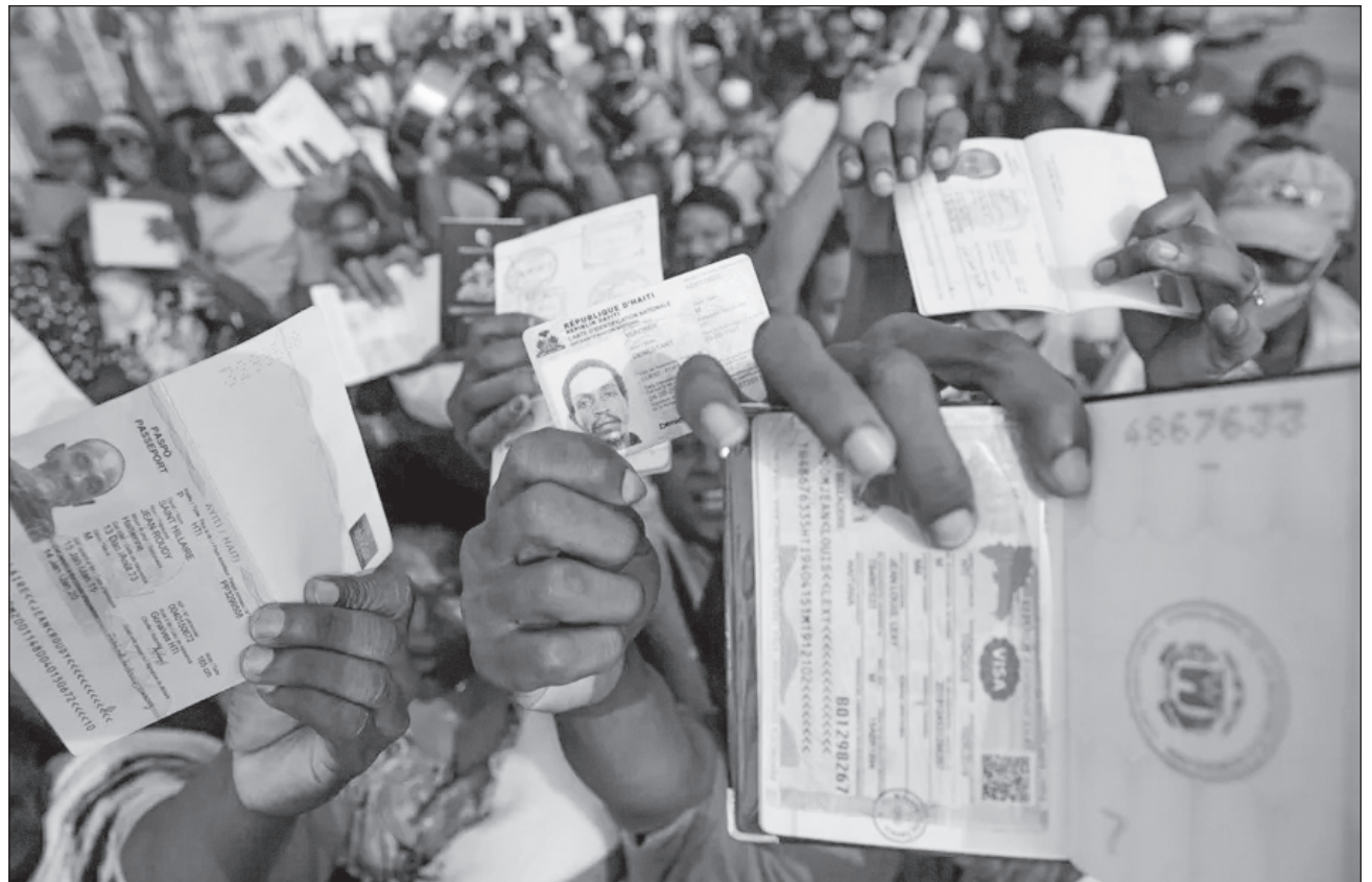
▲ La supuesta pausa en el procesamiento de visas ocurre en el contexto de una amplia campaña de represión de la migración emprendida por el presidente Donald Trump desde que asumió el cargo el pasado enero.

La lista completa de países incluye Afganistán, Albania, Argelia, Antigua y Barbuda, Armenia, Azer-