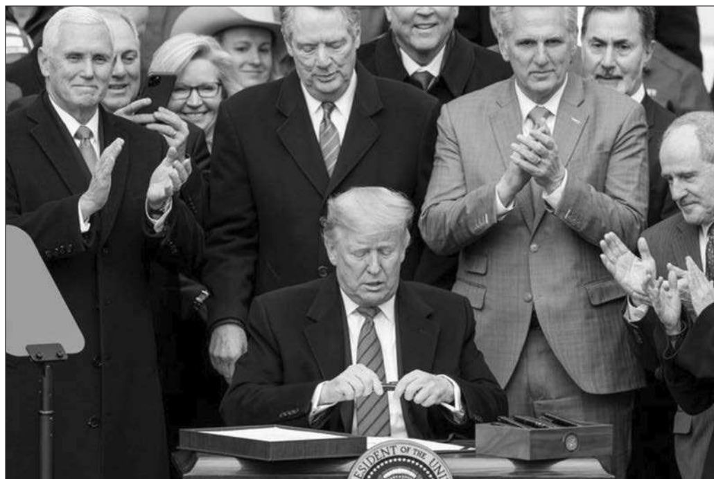
▲ El problema para el republicano es que no sólo daña a sus países vecinos y a los estadounidenses de a pie, sino también a poderosos intereses económicos, así como las perspectivas electorales.

Como aprendió a la mala el anterior primer ministro canadiense, Justin Trudeau, el peor error sería entrar en el juego de negociar por separado e intentar agradar a Trump atacando al tercero, en discordia. Por el contrario, tanto México como Ottawa han de tener claro que su mejor oportunidad de salir adelante de la embestida trumpiana consiste en mantenerse unidos y mostrar al magnate los costos internos que enfrentará si persiste en su unilateralismo.