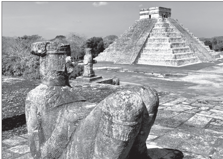
▲ Durante 2019 llegaron a Yucatán 3.2 millones de pasajeros, vía aérea y marítima, y la entidad ahora duplicó su oferta de Pueblos Mágicos.