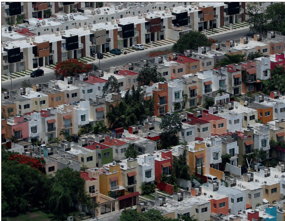
▲ El crecimiento de lo construido por el hombre se observa notablemente a partir de la década de 1950, cuando los materiales de construcción como el hormigón y los agregados se volvieron ampliamente disponibles.

"Al contrastar la masa y la biomasa creadas por el hombre durante el último siglo, enfocamos una dimensión adicional del creciente impacto de la actividad humana en nuestro planeta", dice el coautor del estudio, Emily Elhacham.