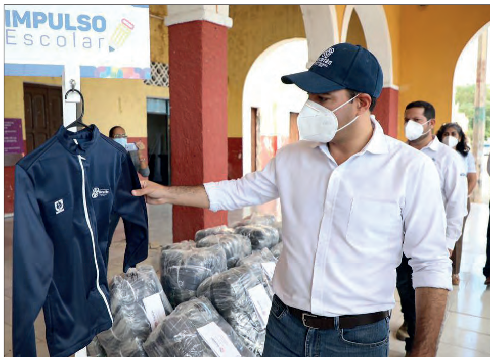
▲ Las prendas abrigadoras serán entregadas a más de 211 mil pequeños yucatecos.

Asimismo, se explicó que las chamarras se distribuirán a los padres de familia de cada escuela manera ordenada y cumpliendo los protocolos sanitarios ante la pandemia del coronavirus, tal y como se hizo con los paquetes de útiles escolares, en fechas y horas que establecerán los docentes de cada plantel educativo. En Homún se beneficia a 807 estudiantes con igual número de prendas.