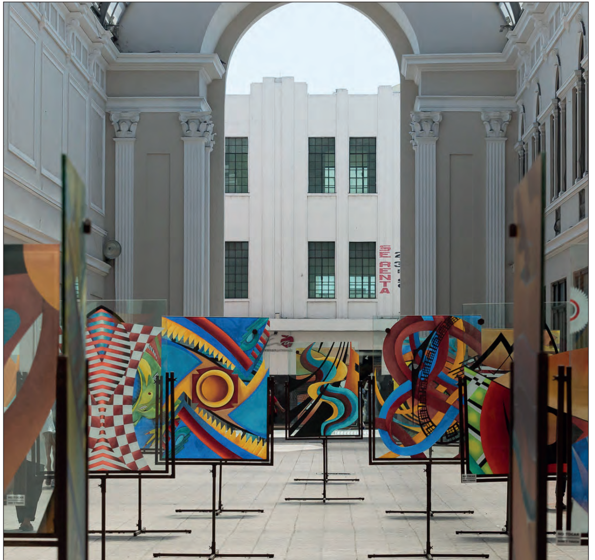
▲ El Macay opera programas de divulgación cultural destinados a la población en general, artistas, gestores, estudiantes, y llega a los municipios de Yucatán a través de Xiimbalarte .

En este sentido, el Macay ha logrado alcanzar una diversidad de objetivos debido al carácter interdisciplinario de sus actividades: las exposiciones han permitido lograr el propósito no sólo de exhibir muestras de arte contemporáneo, sino también de promover la apreciación estética y fomentar la educación artística mediante recorridos guiados. En cuanto a las investigaciones, éstas han favorecido la obtención de contenidos nuevos para su divulgación posterior.