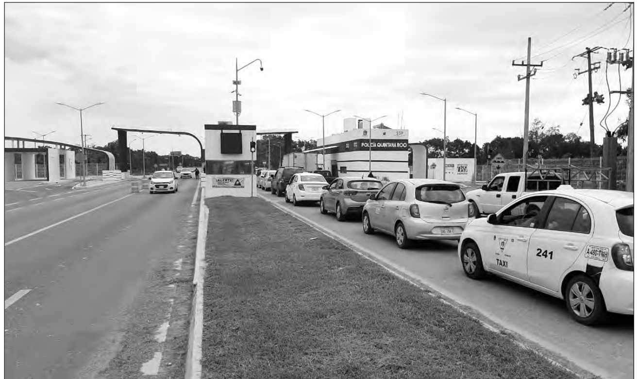
▲ La reactivación de filtros y cierre de calles y avenidas ocasionaron largas filas de vehículos.