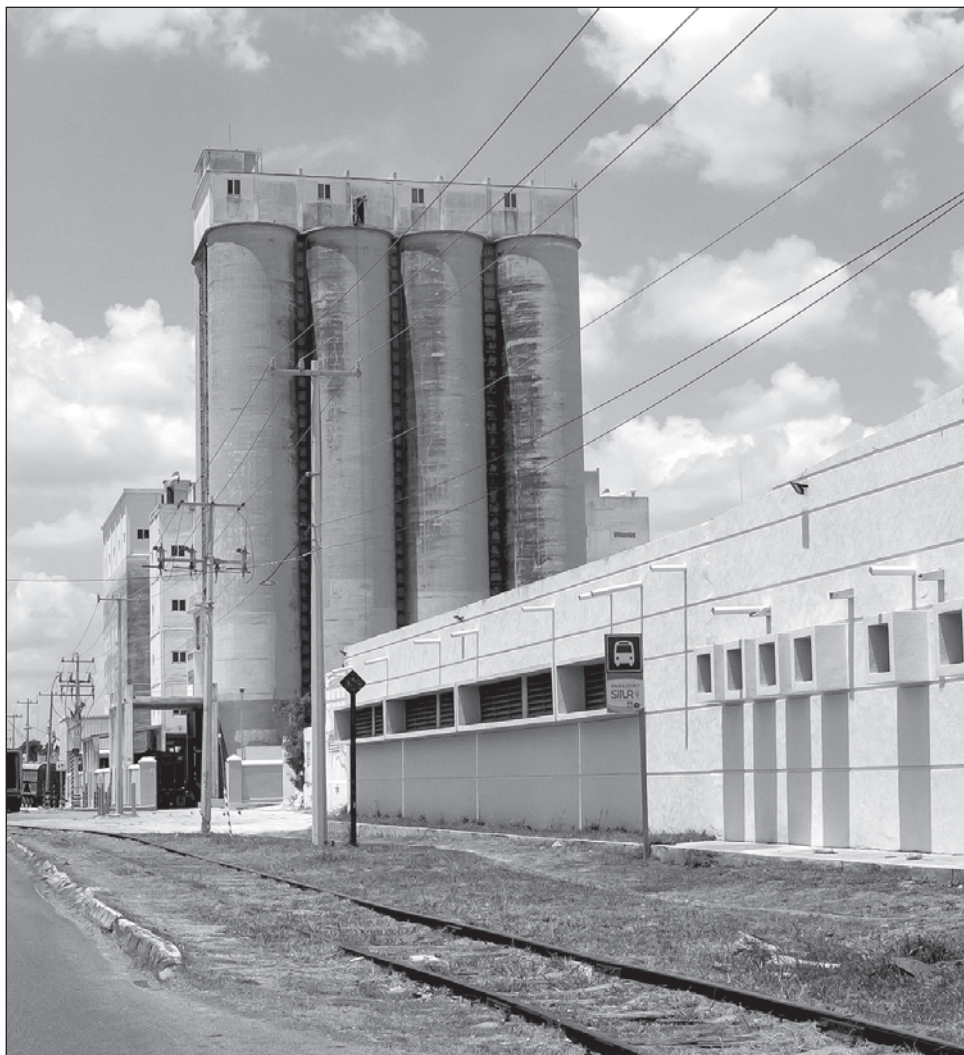
▲ La contaminación auditiva del Centro Histórico es una constante en los últimos años, aunque en este caso proviene de la industria.