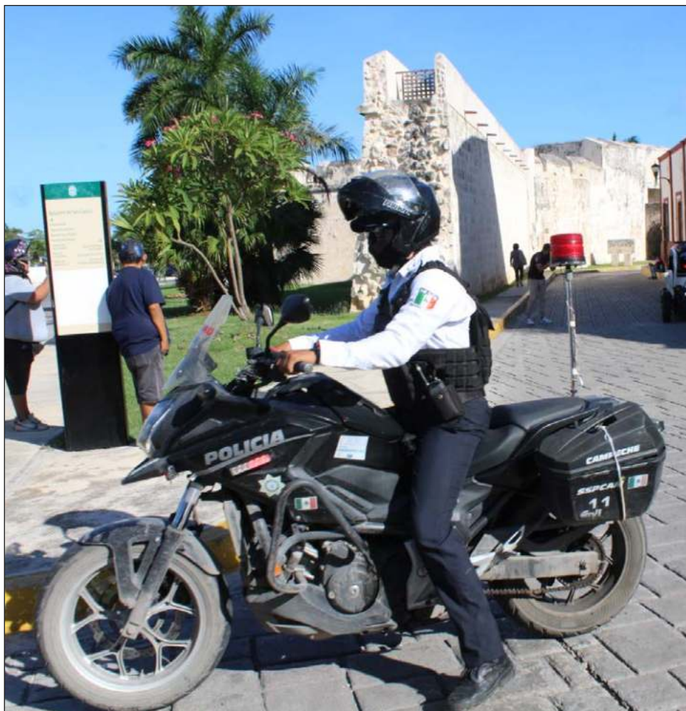
▲ Entre los primeros convenios a firmar se encuentran el relativo a la colaboración en seguridad pública y otro sobre el servicio de tránsito y vigilancia.

También el Convenio de colaboración para la prestación temporal del Servicio de Conocimiento, Calificación e Imposición de Infracciones Administrativas en el municipio de Campeche; Convenio en materia de Estímulos Fiscales: Convenio de Colaboración Administrativa en Materia Hacendaria de Ingresos; y el Convenio de pago en parcialidades para la regularización de adeudos fiscales.