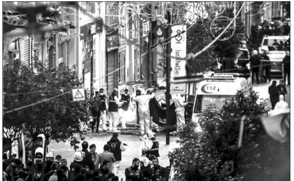
▲ Videos del estallido mostraban ambulancias, carros de bomberos y patrullas policiales en la avenida Istiklal, una calle llena de comercios y restaurantes que lleva a la icónica Plaza Taksim.

G20 en Indonesia, Erdogan no dijo quién estaría detrás del ataque pero aseveró, sin dar detalles, que tiene “el olor a terrorismo”. Indicó que la policía y la