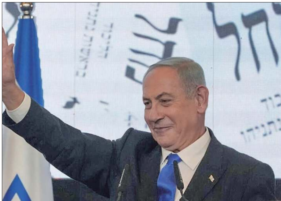
▲ Relegado a líder de la oposición en marzo de 2021, Benjamin Netanyahu había prometido "derrocar al gobierno en cuanto se presentase la primera ocasión".

"Seré el primer ministro de todos, de los que votaron por nosotros y de los otros. Es mi responsabilidad", dijo Netanyahu, de 73 años, pro-