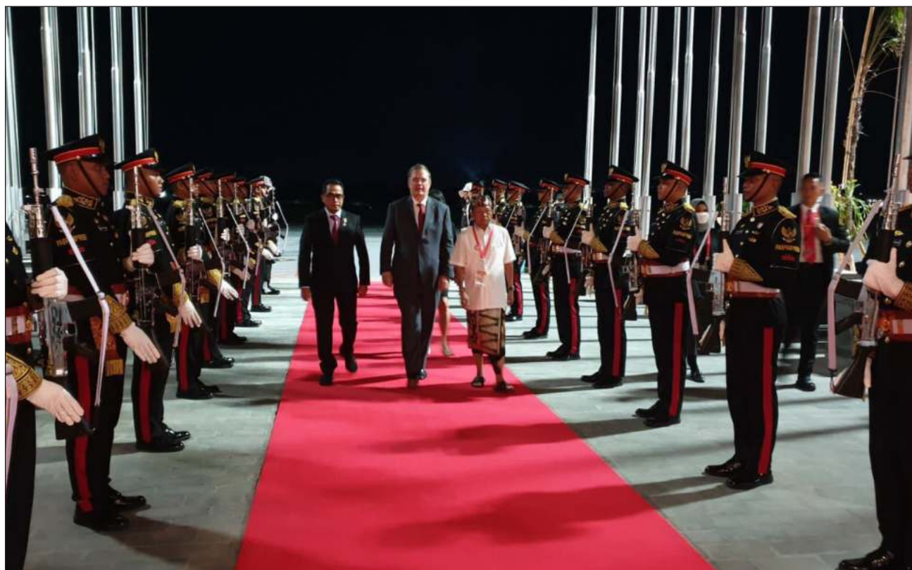
▲ En redes sociales, el canciller Marcelo Ebrard publicó imágenes de la ceremonia en la que fue recibido, la cual incluyó un baile tradicional indonesio. Previamente, por la misma vía, felicitó al presidente López Obrador por su cumpleaños.

Previamente, Ebrard publicó en sus redes sociales una felicitación al presidente Andrés Manuel López Obrador por su cumpleaños.