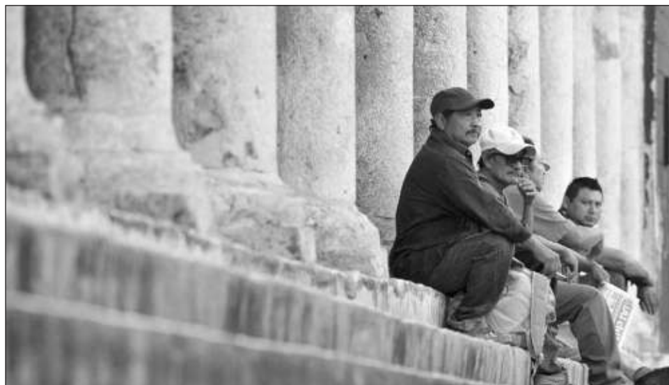
▲ De acuerdo con datos de la Secretaría del Trabajo y Previsión Social, el promedio de las alzas salariales pactadas fue de 4.4 por ciento, pero al descontar la inflación, los ingresos de los trabajadores disminuyeron 3.68 por ciento en términos reales.

En días recientes el Instituto Nacional de Estadística y Geografía (Inegi) informó que en el periodo de referencia la inflación fue de 8.41 por ciento a tasa anual,