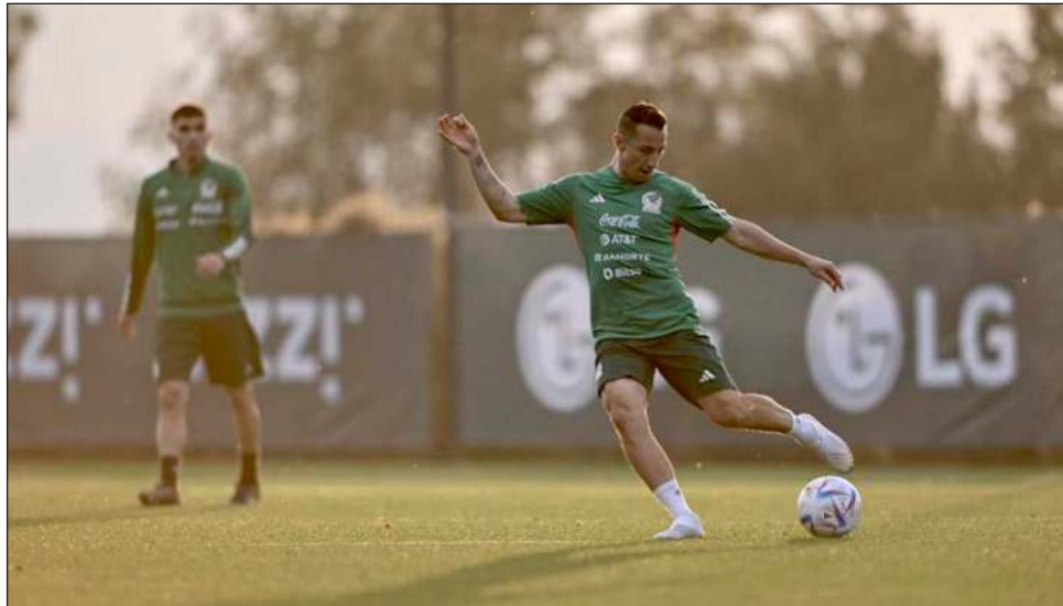
▲ El Tricolor y Andrés Guardado (derecha) continúan con su preparación para el Mundial de Qatar. Este miércoles, ante Suecia, será su último choque amistoso.

Los hinchas invitados acudirán a la ceremonia inaugural vestidos con los colores de cada equipo y entonarán cánticos aprobados antes de que Qatar enfrente a Ecuador