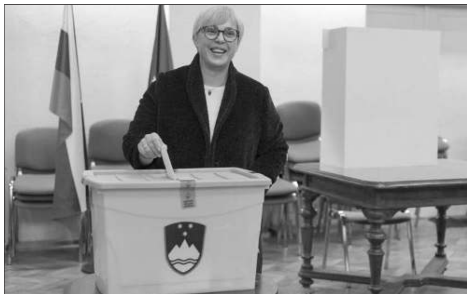
▲ Pirc Musar, abogada de 54 años, será la primera mujer en ocupar la presidencia desde que Eslovenia se independizó tras la desintegración de Yugoslavia en 1991.

“Mi primera tarea será abrir un diálogo entre todos los eslovenos”, declaró mientras su equipo festejaba el triunfo. “Toda mi vida he de-