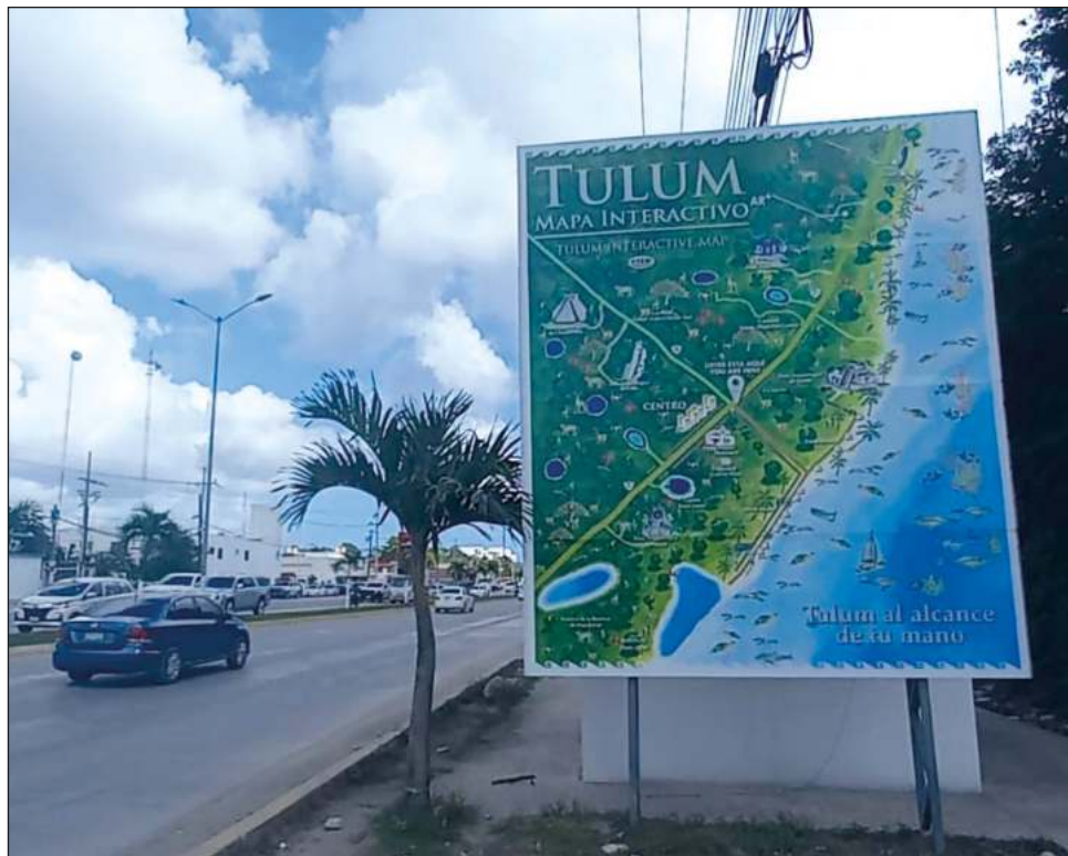
▲ El libramiento proyectado en el Plan de Movilidad Activa de Tulum, a cargo de la Sedatu, evitará que camiones pesados crucen por el centro de la ciudad.

Además, señaló que esta herramienta permitirá determinar en qué momento y en qué punto el transporte de carga puede llevarse a cabo por fuera de la zona de la ciudad, el ya mencionado libramiento de Tulum, para evitar que camiones pesados crucen por el centro de la ciudad.