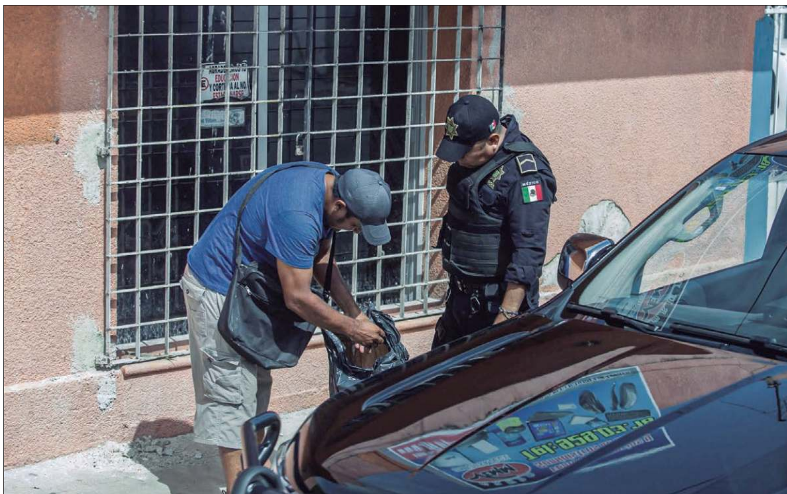
▲ "La razón por la que el líder moral de Morena habla de la seguridad en Yucatán tal vez es porque quiere mandar un mensaje de estabilidad".