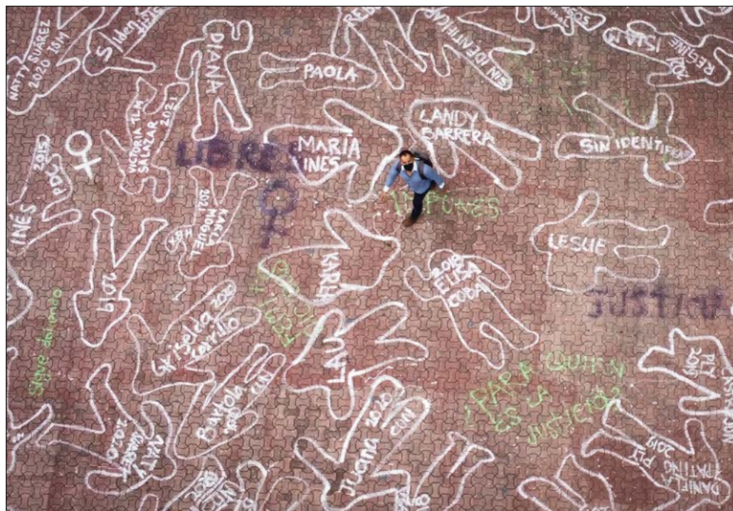
▲ Lo cierto es que el Estado debe tomar todas las medidas legales a su alcance para erradicar el feminicidio en tanto expresión más extrema del odio misógino.

Lo cierto es que el Estado debe tomar todas las medidas legales a su alcance para erradicar el feminicidio en tanto expresión más extrema del odio misógino, así como asegurarse de que cuando éste llegue a ocurrir haya una tasa cero de impunidad para los perpetradores. Cabe desear, y exigir, que los lamentables crímenes contra Ariadna Fernanda, Lidia Gabriela y Mónica Citlalli signifiquen el impostergable punto de inflexión en este sentido.