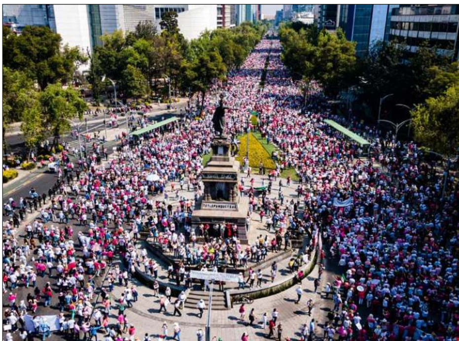
▲ El gobierno de la Ciudad de México reportó una asistencia de entre 10 mil y 12 mil personas en la marcha; también señaló que hubo saldo blanco.

La marcha inició después de las 10:30 horas en Ángel de la Independencia y minutos antes de las 13 horas, la mayoría de los participantes comienzan a dispersarse en el punto de llegada la explanada del monumento a la Revolución.