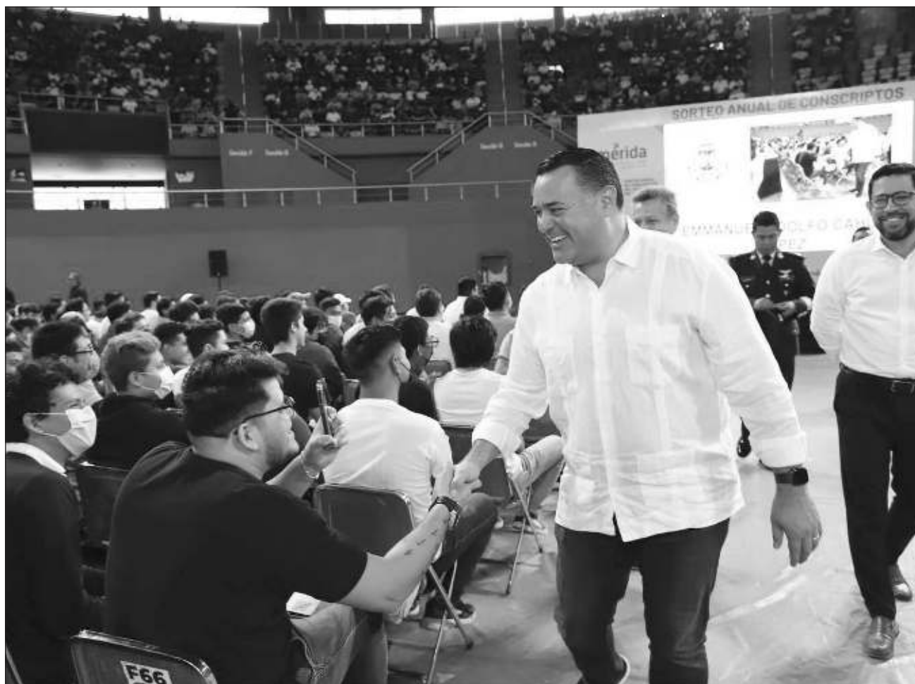
▲ En el Poliforum Zamná, Renán Barrera Concha dio a conocer que, a diferencia de otras ocasiones, el ayuntamiento de Mérida acudió a las escuelas para señalar a los jóvenes la importancia de cumplir con el Servicio Militar.

Ante casi 4 mil jóvenes de la clase 2004 y remisos que se dieron cita en el Poliforum Zamná, para participar en el sorteo anual de conscriptos del Servicio Militar, Barrera Concha señaló que ante la importancia de la realización de este compromiso, el ayuntamiento de Mérida dio todas las facilidades para que los muchachos pudieran cumplir con este requisito y obtener su cartilla militar.