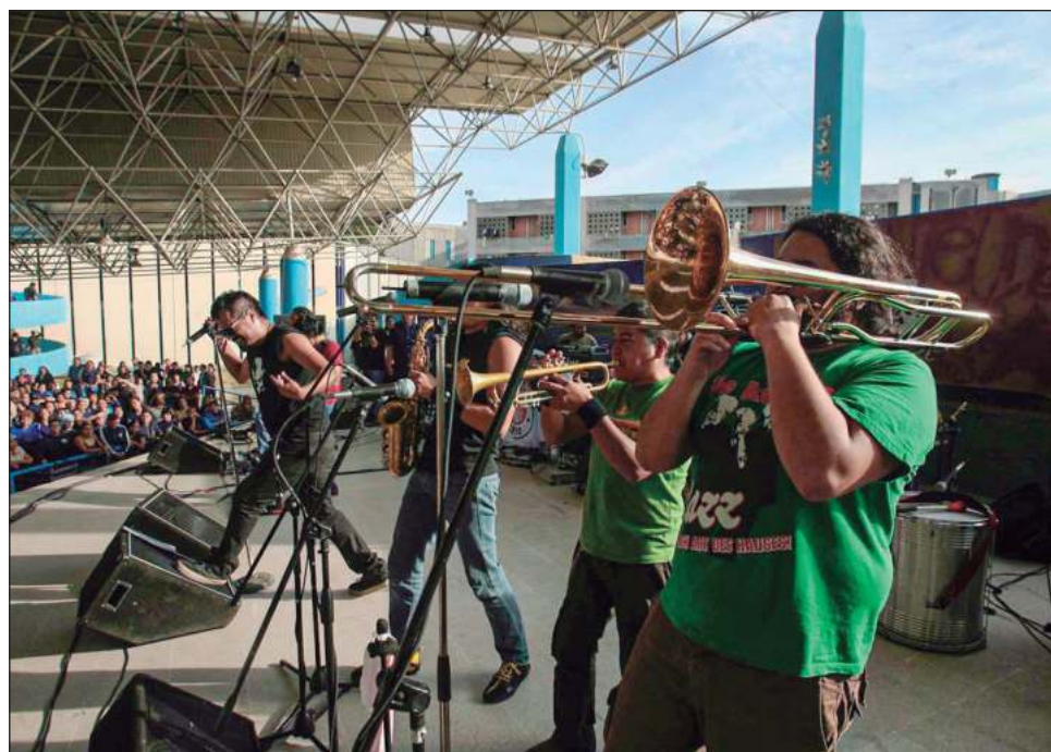
▲ La banda surgió en 1995, cuando aún se movían las aguas sociales y políticas por el alzamiento en Chiapas del Ejército Zapatista de Liberación Nacional (EZLN).

Y acostumbrados a las transformaciones en su camino creativo, los del Panteón confían en que ese deseo, igual que mucha gente en nuestro país, se consolide con el arribo del actual gobierno, aunque reconoce que, como toda mutación, lleva tiempo;