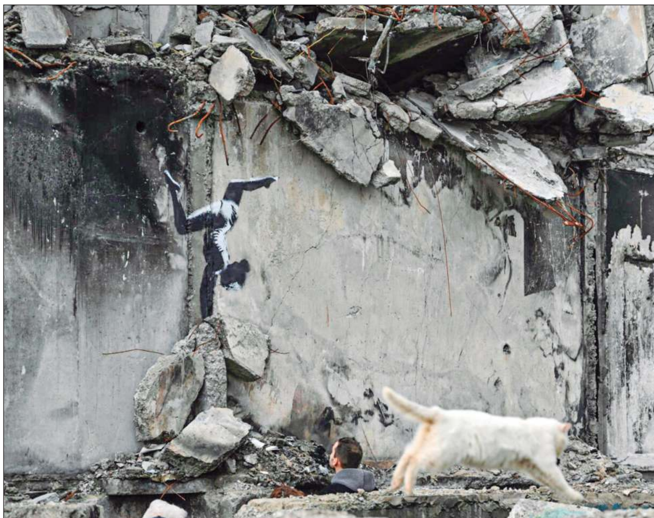
▲ Banksy confirmó la autoría de un grafiti realizado en Borodianka, Ucrania, en un edificio destruido por la guerra.

Borodianka fue castigada por los bombardeos rusos al inicio de la invasión de Ucrania, en 2022. La localidad fue recuperada por las fuerzas militares ucranianas en abril, donde descubrieron fosas.