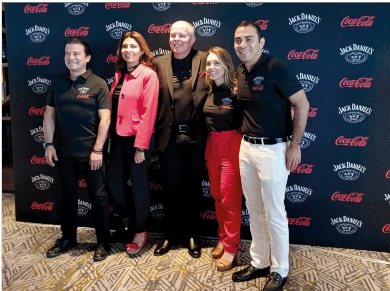
▲ Con la presentación en Cancún, México se convierte en el primer país en el mundo en lanzar la bebida de Jack Daniel's y Coca Cola. A lo largo de 2023, el cóctel llegará a mercados como Norteamérica y Europa.

Si los empleos no se cubren por medio de estas ferias se buscará que las direcciones municipales de Desarrollo Social y Económico coloquen las vacantes, pero también se ofertarán a través de la plataforma de la Secretaría del Trabajo estatal, que es https://qroo.gob.mx/styps/