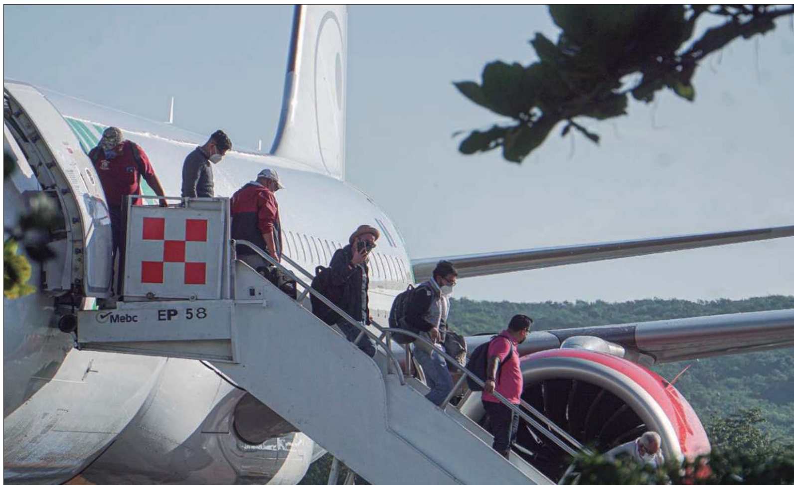
▲ “Caí en cuenta lo desacostumbrada a viajar que estaba cuando en el camino al aeropuerto descubrí que había olvidado mi celular en casa”.