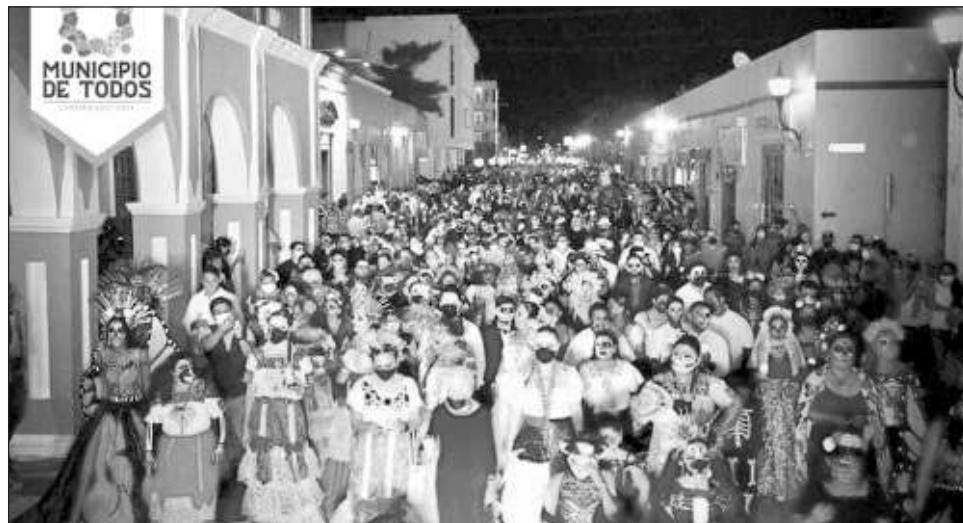
▲ El derrotero del Jolgorio de las Ánimas unió el Parque Jesús Cervera Armas con el Paseo Juárez, donde emprendedores y microempresarios expusieron sus productos.

Partiendo del Parque Jesús Cervera Armas, cientos de personas, ataviadas con coloridos trajes de catrines,