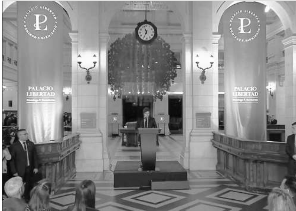
▲ Rodeado de parte de su gabinete y con un enorme operativo de seguridad, Milei llegó al ahora ex Centro Cultural Néstor Kirchner y fue nuevamente abucheado.

Asimismo, el gobierno envió al Congreso un proyecto de ley para reemplazar varios artículos de la Constitución nacional a fin de favorecer la propiedad privada, que le permitirían avanzar en sus proyectos de eliminar al Estado nacional.