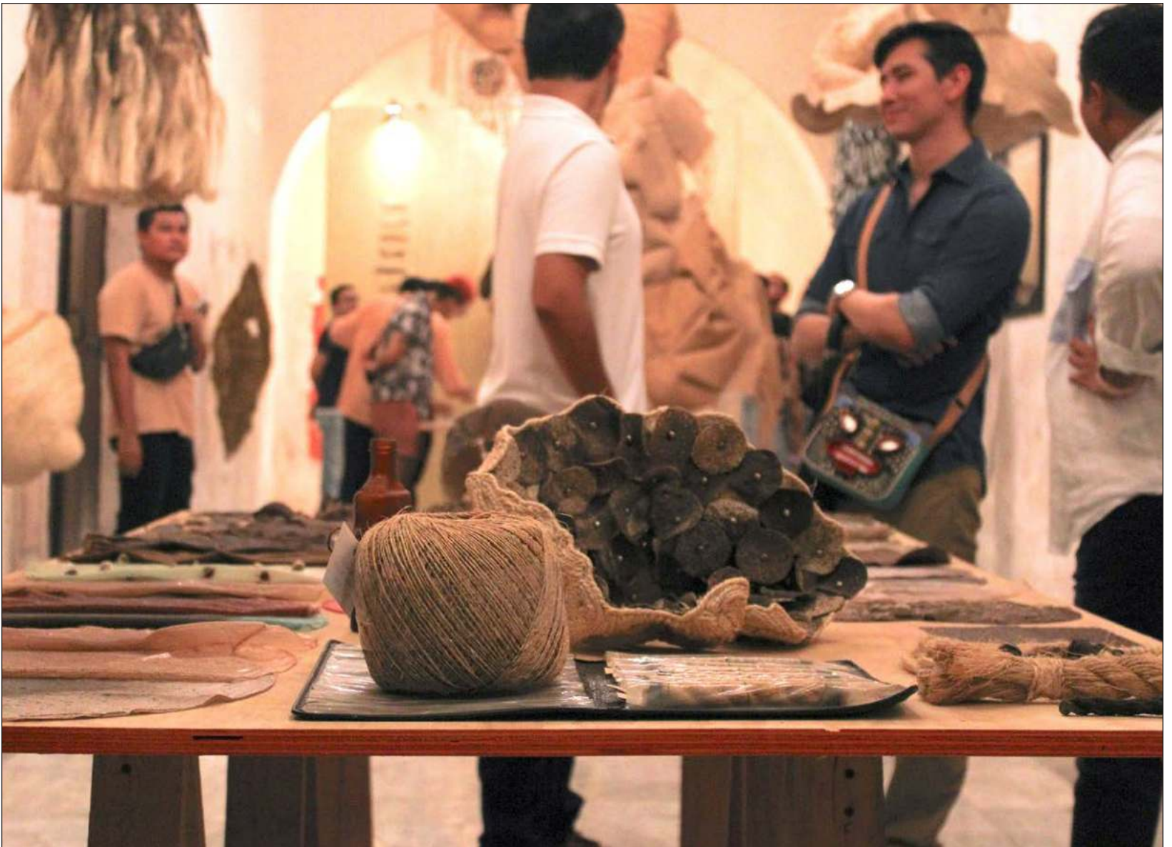
▲ Vista de la exposición Sosok-Soskil. Bitácora expandida, experimentación con bagazo del agave henequén.