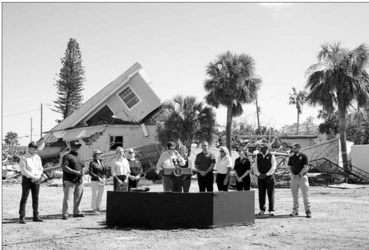
▲ “Sé que están preocupados por el retiro de escombros, y es obvio por qué”, dijo Joe Biden, hablando frente a una casa de playa derrumbada y levantada de sus cimientos. “Queda mucho por hacer. Estamos haciendo todo lo que podemos”.

Al menos 17 personas han muerto tras Milton, mucho menos que las más de 200 que dejó Helene.