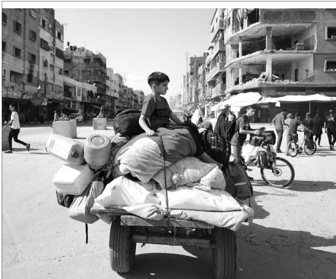
▲ Israel emitió órdenes de evacuación a los residentes del área, cuya población nuevamente debe abandonar un campamento y dirigirse al sur del enclave. En el último bombardeo sobre la Franja murieron al menos 25 civiles, incluidos mujeres y niños.

La labor de la Finul, desde su despliegue en 1978