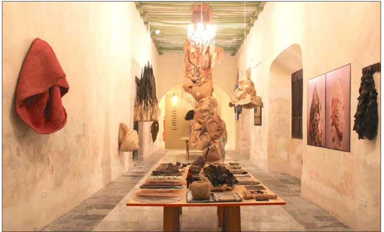
▲ Vista total de la exposición Sosok-Soskil. No todo lo que brilla fue oro.

en el Gran Oasis Cancún con apoyo de Fundación Oasis el próximo 18 de octubre, con atención incluso a hombres que hayan sufrido de la enfermedad.