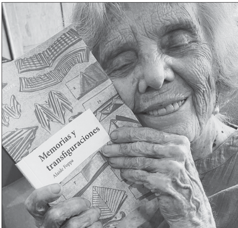
▲ “Sí, Alaíde Foppa fue muy buena crítica de arte. Competía con Raquel Tibol y Teresa del Conde, y sobre todo con Luis Cardoza y Aragón, uno de los grandes refugiados guatemaltecos al lado del cuentista Tito Monterroso”.

—Alaíde hacía traducción simultánea del italiano para la em-