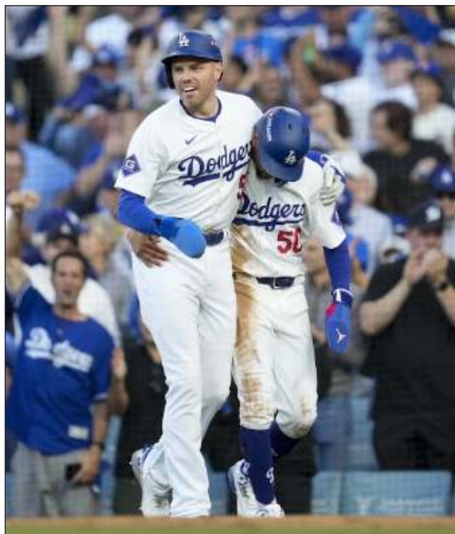
▲ Freddie Freeman (izquierda) y Mookie Betts, tras anotar con sencillo de Max Muncy en el primer acto..

Los tres "MVP" del equipo que dirige Dave Roberts brillaron, ya que Freddie Freeman se fue de 3-2, con impulsada y anotada.