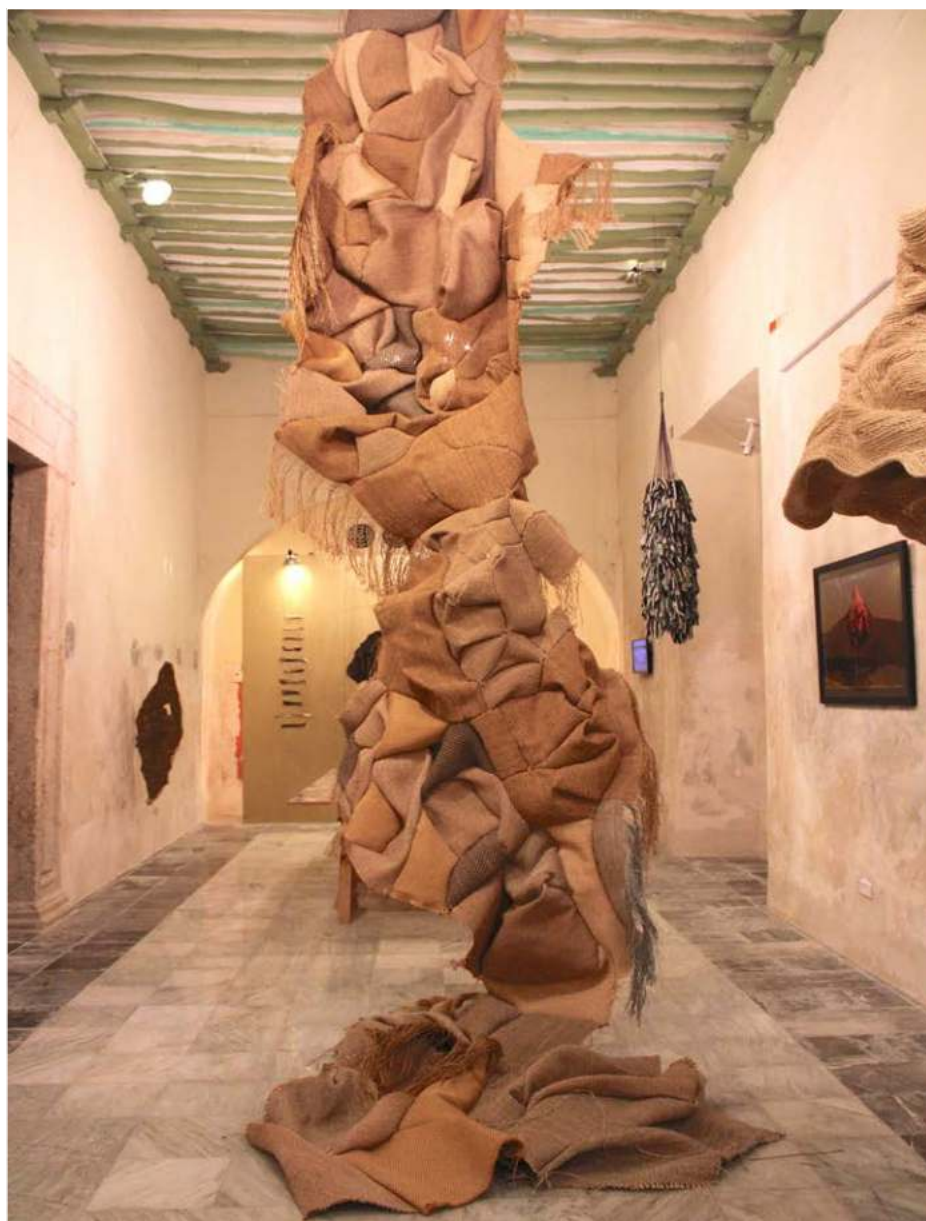
▲ Vista de la exposición Sosok-Soskil . Pieza confeccionada de retacería de alfombras de industrias locales. 6 m x 1.40 m, aprox.