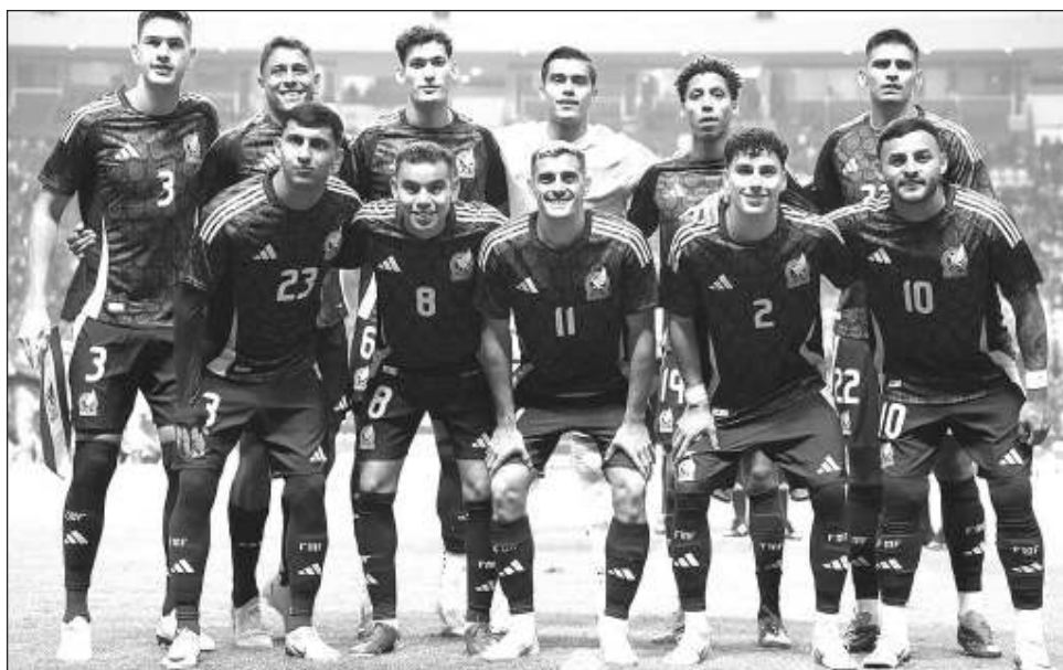
▲ El "Tri" no pudo vencer a un equipo de Valencia lleno de suplentes.

En Puebla, una mayoría de los poco más de 40 mil aficionados que asistieron al desafío abuchearon al "Tri" al final. "No nos gustan", señaló