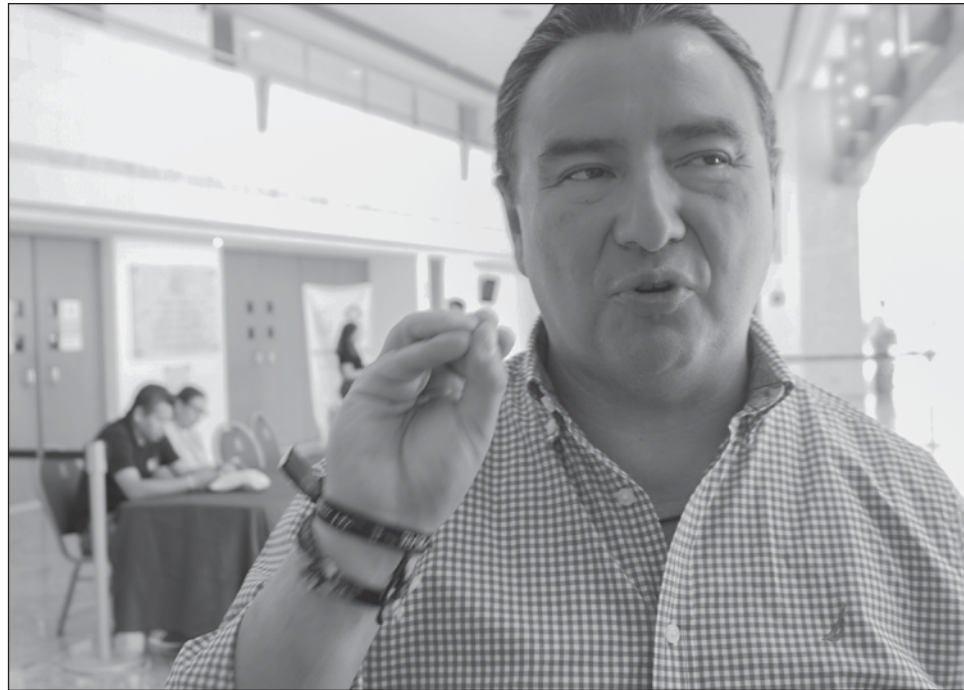
▲ De acuerdo con la dirigencia del tricolor , pusieron sobre la mesa y a consenso los currículos de todos los priistas que actualmente son representantes populares.

En el acto se hizo por tanto, a propuesta del nuevo presidente de esta asociación, una firma de compromisos entre los asistentes.