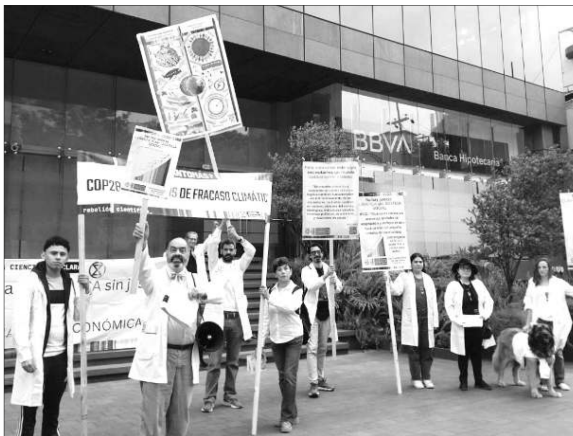
▲ "Para atacar la crisis climática, se requieren cambios estructurales que modifiquen el funcionamiento de nuestras sociedades, a partir de una transformación de los sistemas económicos y políticos imperantes".

Esta transformación implica fijar límites sólidos al consumo desmedido y estilos perniciosos de la élite social; inversión masiva y constante en transporte público, no contaminante y gratuito; redistribución de la riqueza e implementación de fuentes de energía renovables, entre otras medidas imprescindibles para contener esta catástrofe.