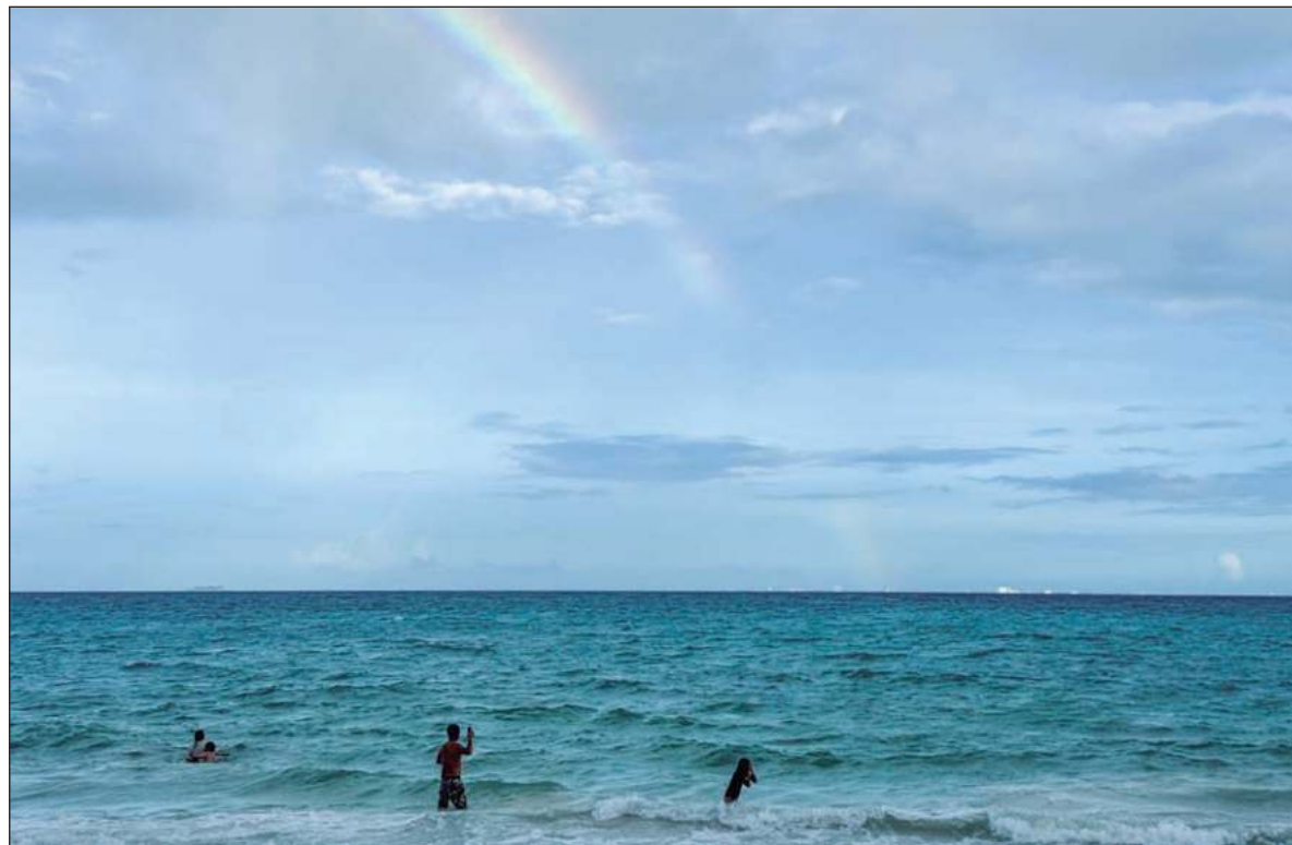
▲ El océano cubre 71% de la superficie, siendo el componente más grande del sistema climático de la Tierra. Albergan alrededor de 230 mil especies descritas, pero su número es mayor, por las aún no descubiertas.

Ella es oceanógrafa y estudia el movimiento del agua en el mar y lagunas costeras y la interacción entre el agua continental y el mar. En Yucatán, indica que el agua del acuífero puede llegar a varias decenas de kilómetros fuera de la costa, no sólo lo que desemboca en los ojos de agua. En Yucatán, ese flujo es lento por no haber montañas, acarreado todo lo que se trasmina al terreno kárstico de la Península, vivo y no vivo. Benéfico o tóxico. Así como el exceso