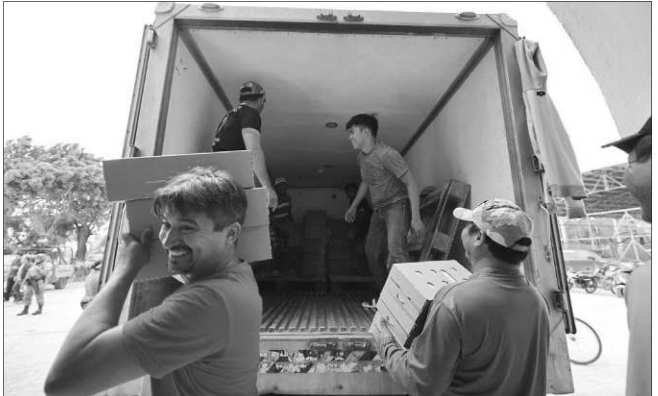
▲ Los artículos que pueden ser donados son agua embotellada, alimentos no perecederos, alimentos enlatados, artículos de higiene personal, productos de limpieza, utensilios de cocina y medicamentos del cuadro básico, entre otros.

SEDESOL: Calle 64 No. 518 X 65 y 67 colonia Centro C.P. 97100 Mérida, Yucatán. Teléfono 9999309170