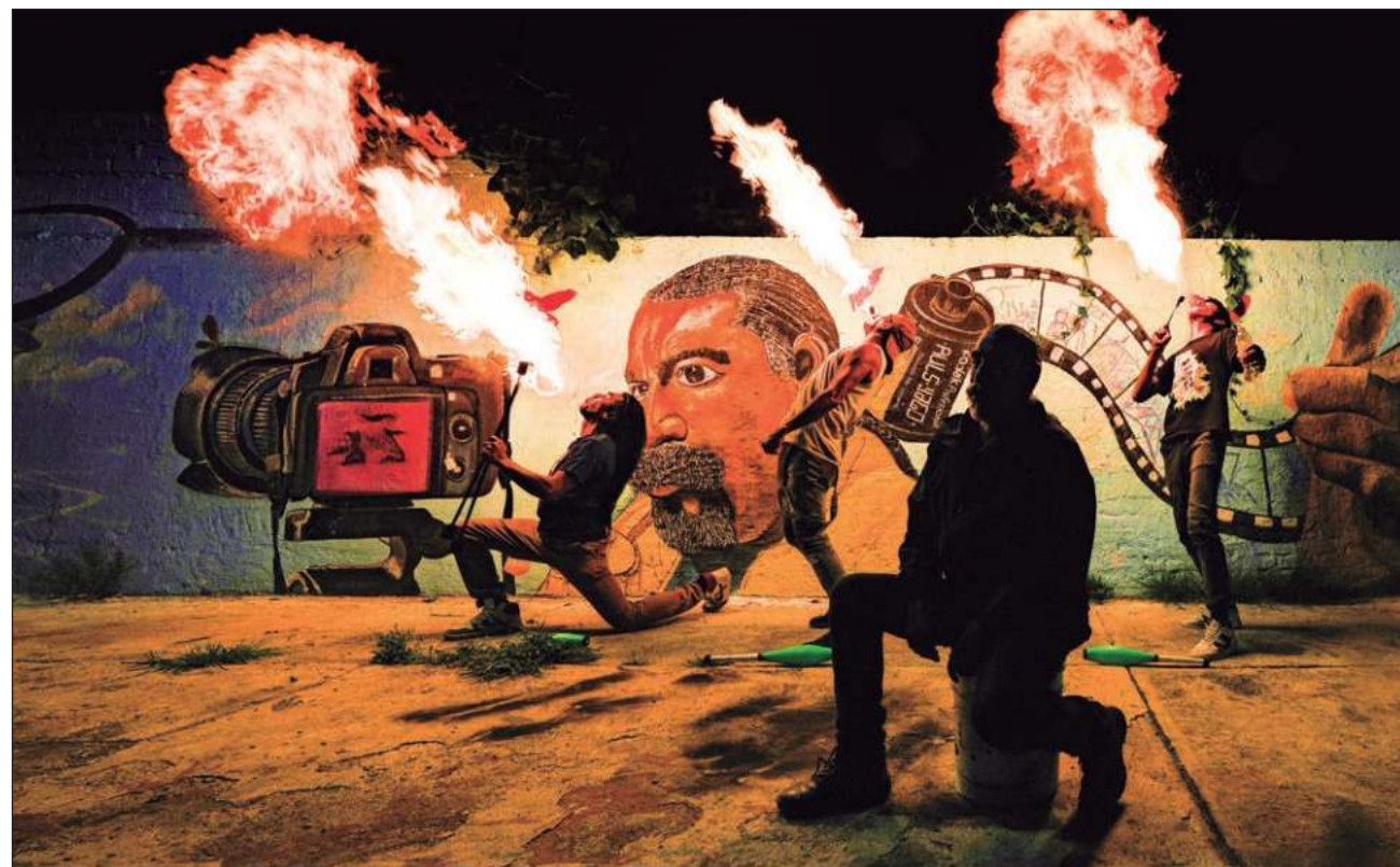
▲ La obra de Yago tiene la firme intención de interactuar de manera espontánea con la gente que transita por las calles; el mural dedicado a su mentor mide 50 metros de largo por dos de ancho sobre la avenida Santa Cruz Meyehualco.

La obra de Yago tiene la firme intención de interactuar de manera espontánea con la gente que transita por las calles, provocando respuestas de identidad so-