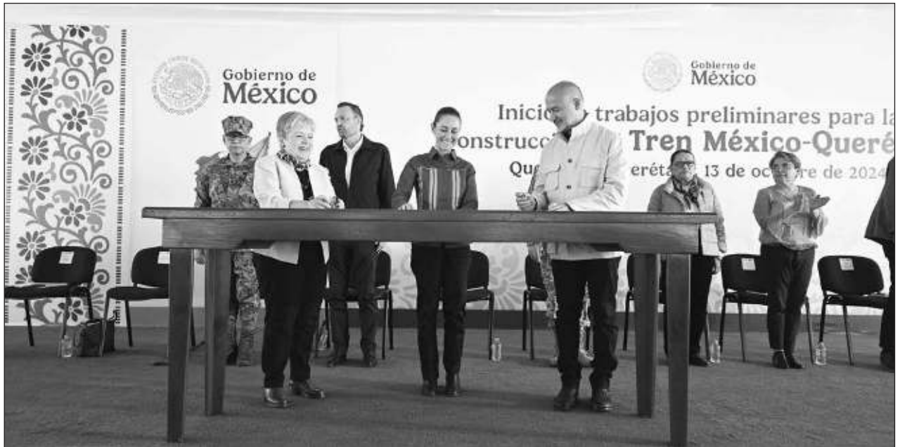
▲ La Presidenta comentó que previo al evento público con el pueblo queretano, hubo un encuentro privado entre ella y algunos integrantes de su gabinete con Kuri para determinar las prioridades de la entidad en donde habrá inversión federal.

La SRE indicó que algunas de estas personas viajarán a México como destino final, mientras que otras decidieron permanecer en Europa. Agregó que la embajada de México en Líbano mantiene comunicación permanente.