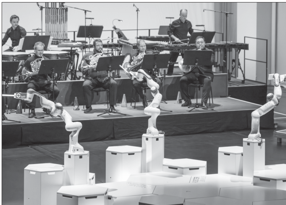
▲ El robot fue capaz de utilizar sus tres brazos para guiar a tres grupos separados de la orquesta, una habilidad que no hubiera sido posible con un solo director humano. La idea de esta máquina se inspiró en los "cobots", pensados para trabajar con seres humanos.