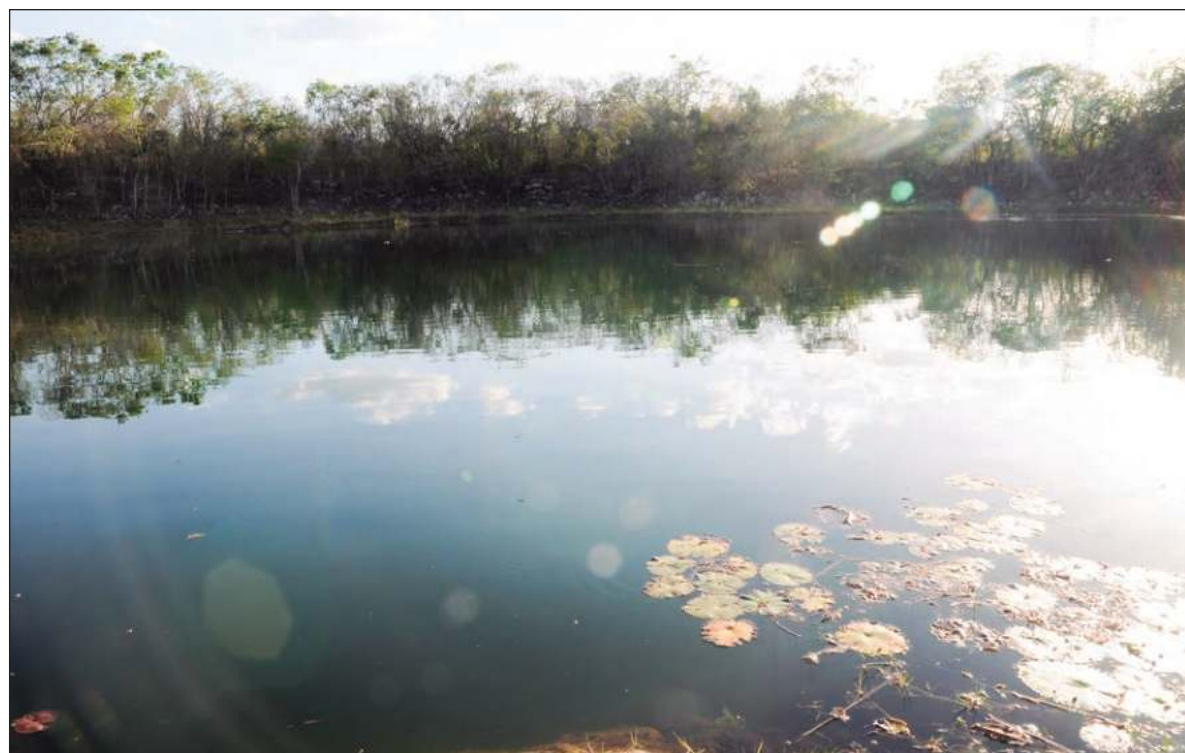
▲ “Las organizaciones hacen un llamado para que el Estado proteja el agua de prácticas de mercantilización y privatización, y reconozca el rol que históricamente han cumplido pueblos y comunidades para preservarla”.

LA ORGANIZACIÓN DE estos grupos de base comunitaria para hacer un llamado a los Poderes Ejecutivo y Legislativo, tiene una gran valía en un contexto de crisis ambiental e hídrica global, con