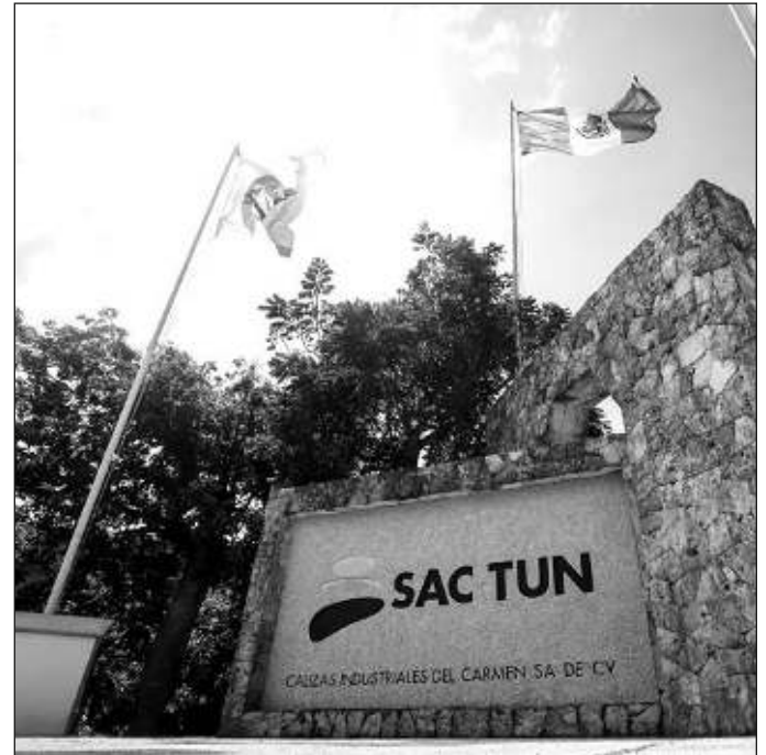
▲ La empresa ha mentido sobre las reservas de piedra caliza y la sobreexplotación de las mismas, tanto para evadir impuestos como para ocultar los daños ecológicos.

Por estos motivos, en el sexenio anterior se denunciaron sus prácticas nocivas y se exploraron formas de restituir el equilibrio ecológico en un área que forma parte del corredor turístico más relevante del país, así como de un ecosistema clave por su biodiversidad. Si algo ha caracterizado la actitud de las autoridades