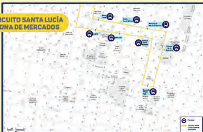
CIRCUITO SANTA LUCÍA ZONA DE MERCADOS

FACILITAR EL ACCESO A LAS ZONAS COMERCIALES Y TURÍSTICAS DESDE DIVERSOS SECTORES DE LA CIUDAD