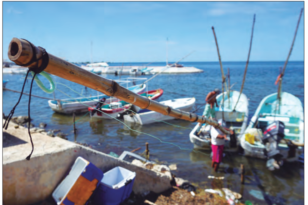
▲ Para salir al mar es necesario invertir aproximadamente mil pesos entre gasolina, aceite y carnada.

Los ribereños señalaron que ahora con la vuelta a las salidas, continúan observando embarcaciones disfrazadas