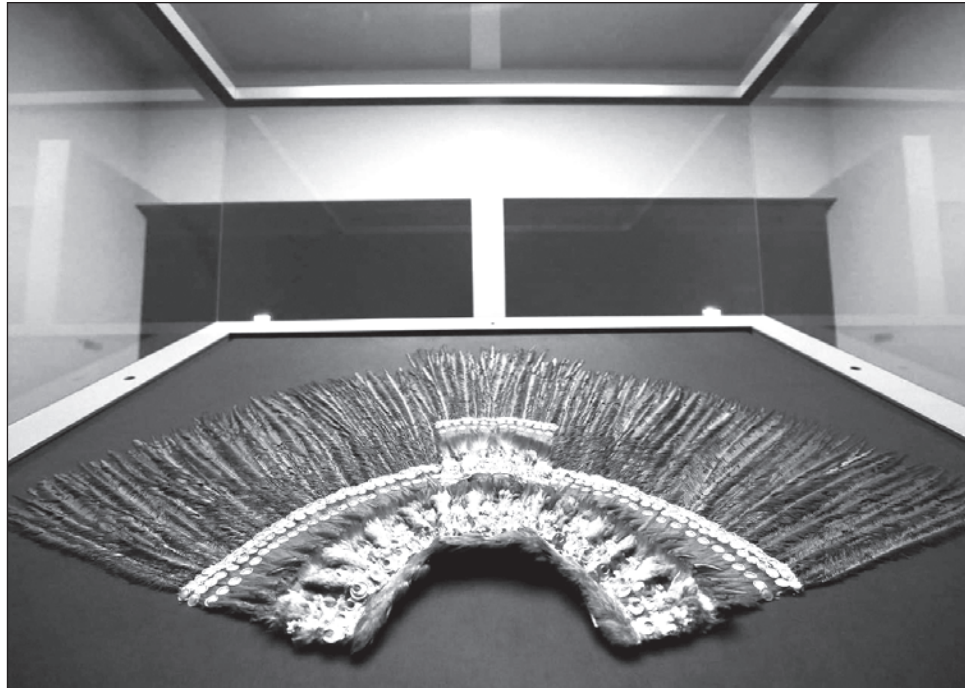
▲ Mucho de lo que se exhibe en museos del mundo fue sustraído de manera ilegal de los países de origen de las culturas, declaró el Presidente.

Mencionó que mucho de lo que se exhibe en museos del mundo fue sustraído de manera ilegal de los países de origen de las culturas.