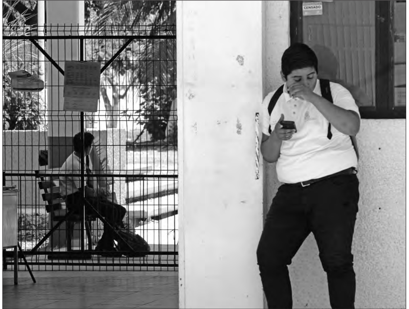
▲ Durante el foro de consulta sobre la nueva Ley de Educación estatal, señalaron la importancia de temas específicos como educación especial para personas con discapacidad, enseñanza de la lengua maya e impartición de inglés.

De acuerdo con las activistas, esto vulnera el propósito de las escuelas de construir un espacio seguro para que las y los niños hablen de todos los temas y obtengan herramientas para tomar decisiones sobre