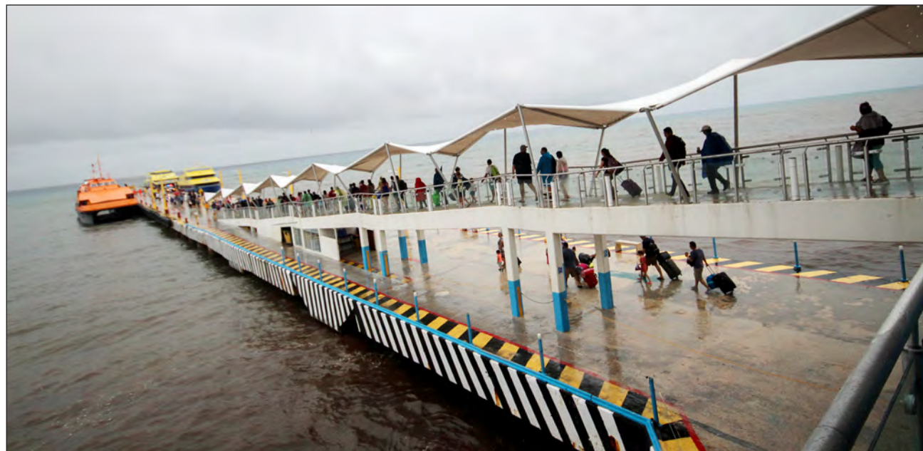
▲ La intención de esta ley es hacer más equitativa la situación de aquellos que viven en las islas, dado que actualmente sus costos de vida son más elevados en comparación a quienes viven en la parte continental.