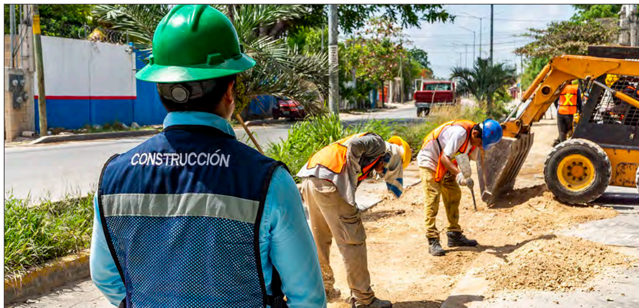
▲ Aguakan tiene programado concluir las obras en febrero del 2021.

Para la ejecución de las mismas se utilizará tecnología de vanguardia, conocida como "Pipe bursting"