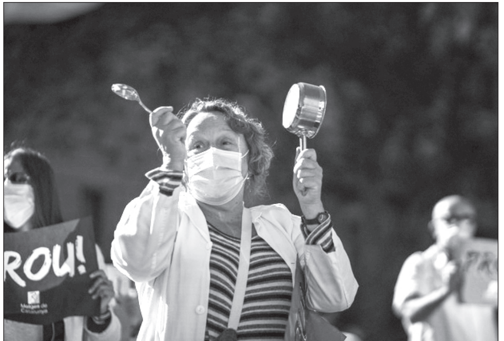
▲ La lucha de feministas rinde frutos con las nuevas normas que eliminan la disparidad salarial por cuestiones de género.

La disparidad salarial es una aberración democrática que excluye, diferencia y viola los derechos de las mujeres, dijo la ministra.