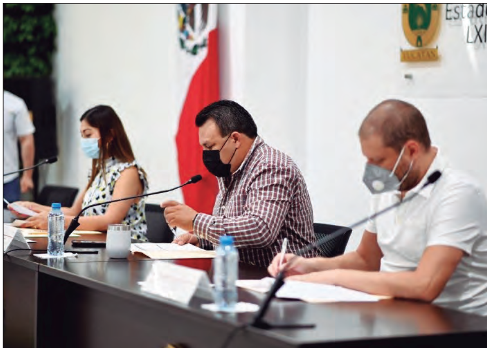
▲ Mediante la propuesta, los diputados pretenden darle el debido reconocimiento a los artesanos yucatecos.

La también presidenta de la Comisión de Puntos Constitucionales y Gobernación, consideró también incluir un "Catálogo único" de bienes y productos artesanales exclusivos de Yucatán, en el que se incluya el nombre de los artesanos que la elaboran y lugar de origen. Actualizado anualmente, por parte de la Casa de las Artesanías.