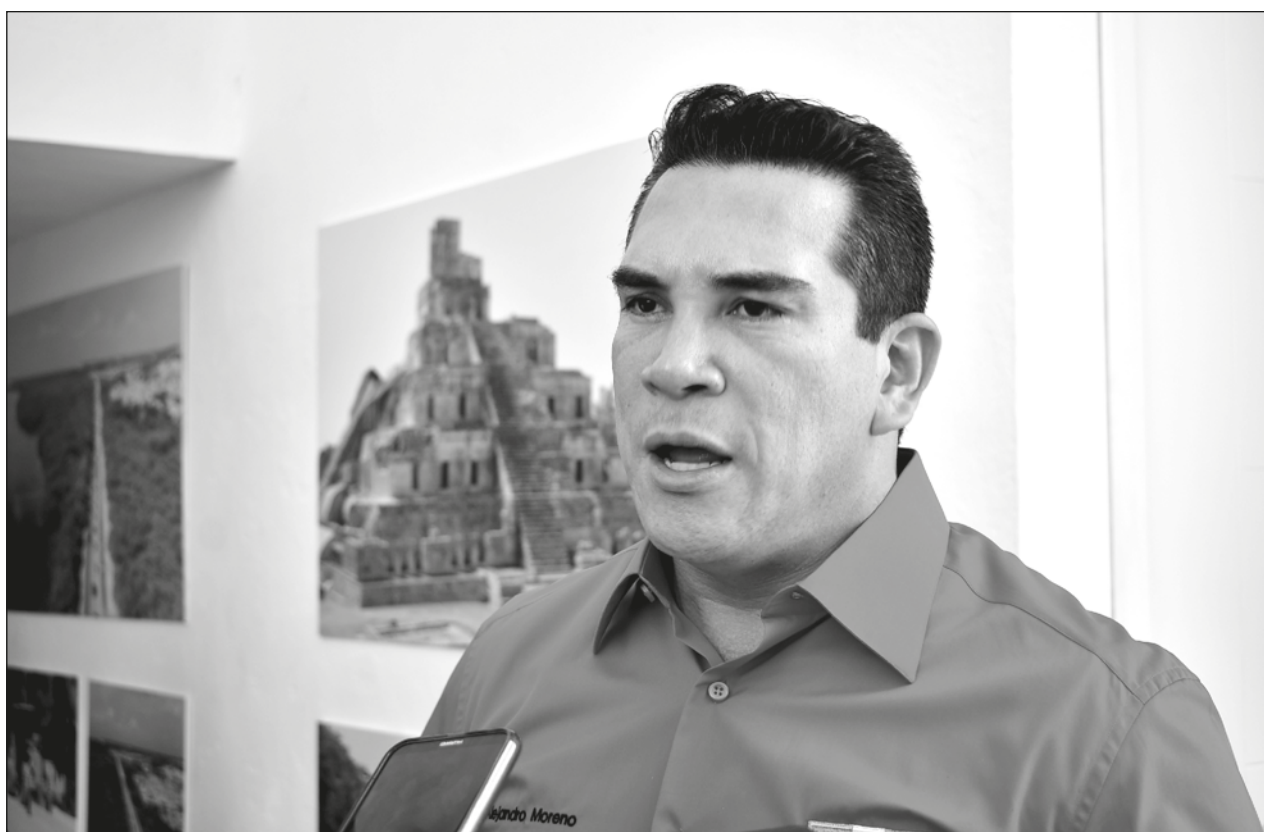
▲ Priistas prevén este martes reunión entre los ex presidentes del partido y Alito, el actual líder.

Precisamente uno de los escenarios en la tan demandada salida de Alejandro Moreno de la presidencia priista, es que si él renuncia, por estatuto, la sustituta natural será Carolina Viggiano, actual secretaria general del PRI, integrante de la burbuja del Alito y esposa del ex gobernador de Coahuila, Rubén Moreira.