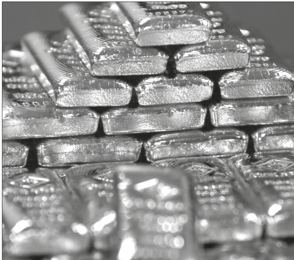
▲ El valor de los metales robados rebasa los 12 mil millones de dólares.

Los criminales utilizaron equipo para cortar candados, abrir los contenedores y robar su contenido, cuyo