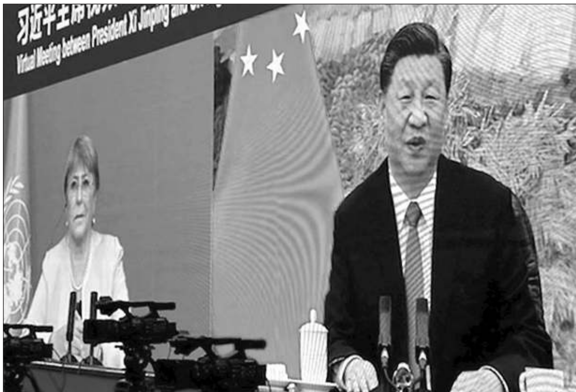
▲ "A few weeks ago, United Nations High Commissioner for Human Rights Michelle Bachelet paid a long-anticipated visit to China to investigate the government's oppression of its Muslim Uyghur minority. The visit turned out to be a joke".

AFTER AN ILLUSTRIOUS career that saw her serve twice as President of Chile and head of U.N. Women, her professional credibility has been destroyed, as has the credibility of the U.N.'s human rights bureaucracy.