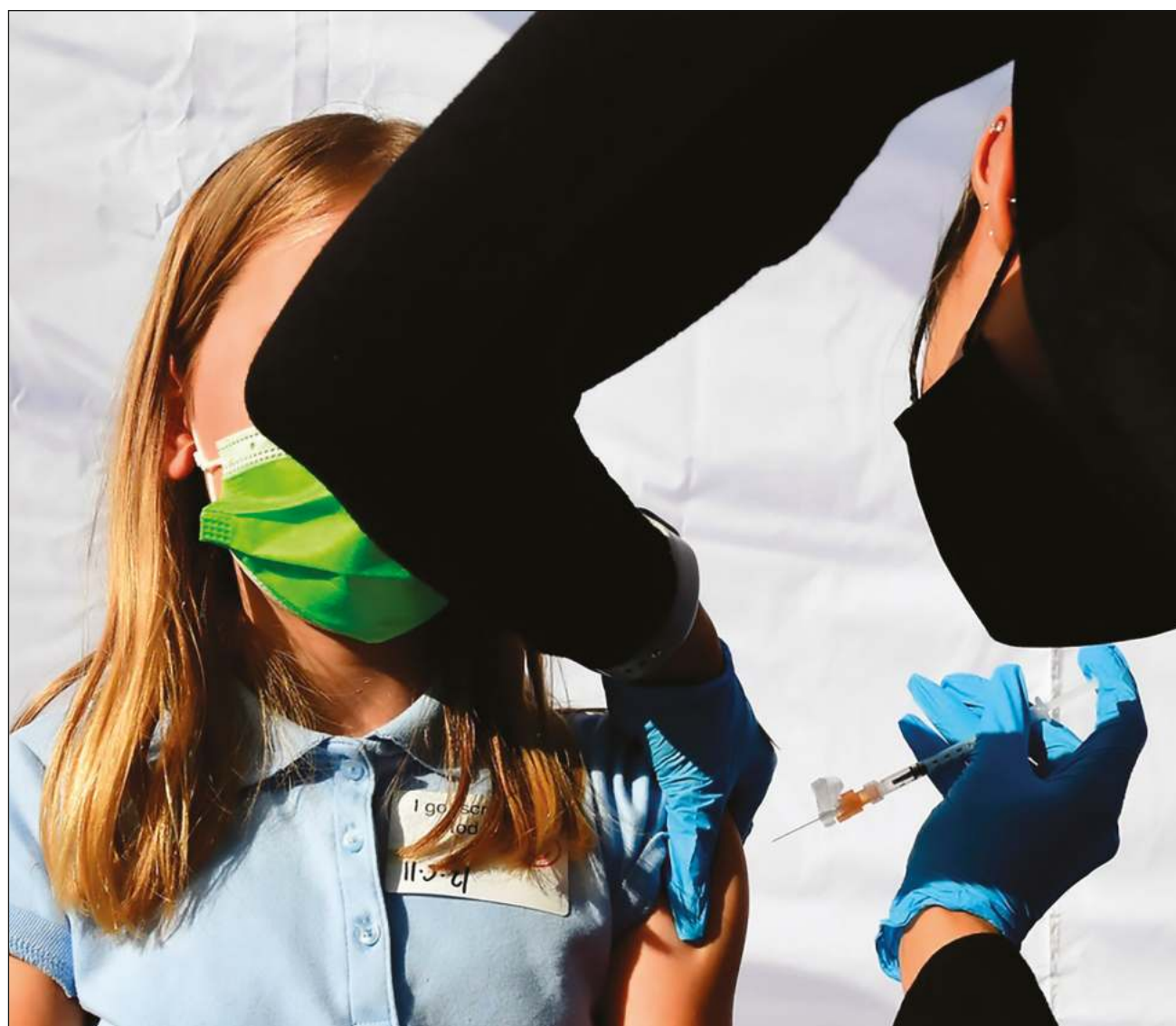
▲ Expertos de la FDA discutirán también si deben aplicarse dos dosis de Moderna a niños de seis meses a cinco años.

El 15 de junio una reunión de expertos deberá decidir si recomienda tres dosis de tres microgramos de la vacuna Pfizer para niños entre seis meses y cuatro años.