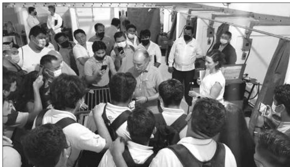
▲ Como parte del Proyecto B.05 de la Alianza del Pacífico (AP), este lunes fue inaugurado el taller de electromecánica en el plantel de Ciudad del Carmen.