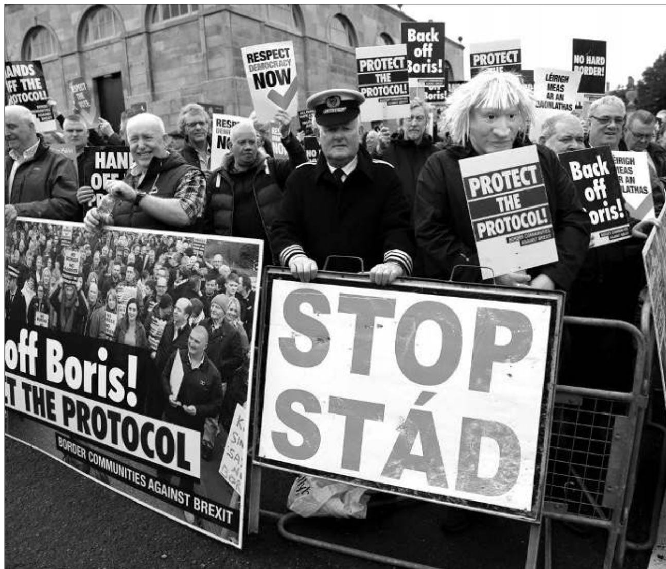
▲ La Unión Europea amenazó con represalias la iniciativa aduanera de la única frontera terrestre de Gran Bretaña.

"Observamos con gran preocupación la decisión tomada hoy por el gobierno del Reino Unido de presentar un proyecto de ley que anula elementos clave del protocolo" dijo el vicepresidente de la Comisión Maros Sefcovic.