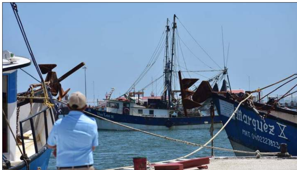
▲ Los pescadores de altura, que cada temporada se dirigen a Veracruz y Tamaulipas, llevan tres años consecutivos de muy bajas capturas, según la Canainpesca.

En una copia en poder de esta redacción con fecha de publicación en el DOF, la Secretaría de Gobernación (Segob) en atención a la sugerencia de la Secretaría de Agricultura y Desarrollo Rural (Sader), encabezada por Víctor Manuel Villalobos Arámbula, instruye que a partir de las 00:00 del 1 de