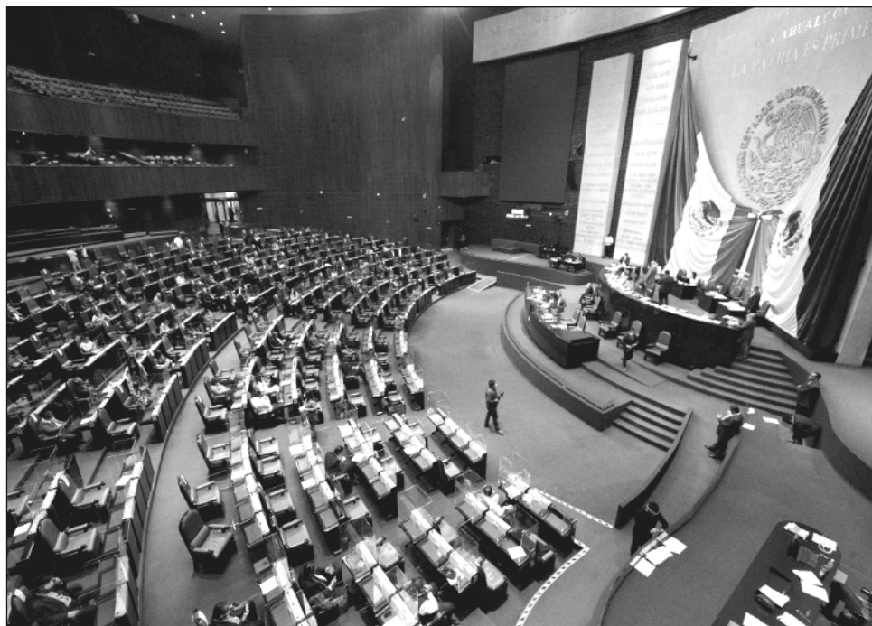
▲ AMLO apuntó que los legisladores de oposición “están declarando que no van a aprobar nada de lo que vamos a proponer”, lo cual calificó de poco análisis.

Apuntó que los legisladores de oposición “están declarando que no van a aprobar nada de lo que va-