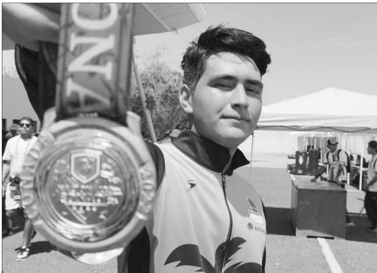
▲ En tiro con arco, el estado obtuvo tres medallas de oro y dos de plata en la máxima justa deportiva del país.