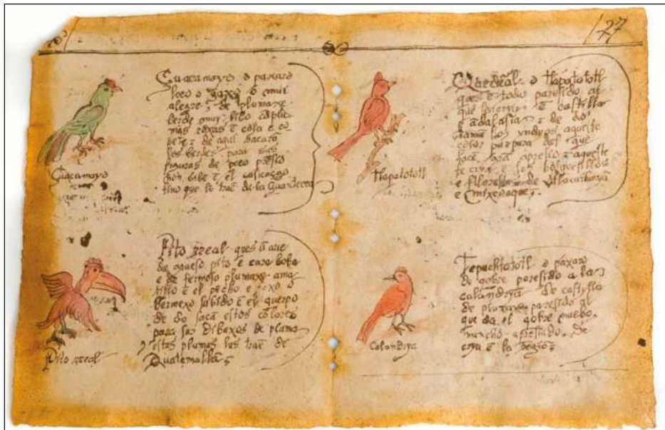
▲ La subastadora española Ansorena ya ha intentado vender el supuesto código; en 2020 pidió 650 mil euros.

Para ella, resulta una obligación de los investigadores no quedarse en el mundo de la academia; debemos conectarnos con la realidad y las personas, porque, al fin y al cabo, nosotros sacamos nuestra información de ellas, por lo que hay que regresárselas también. Como investigadora, no estoy de acuerdo de vivir en una torre de marfil.