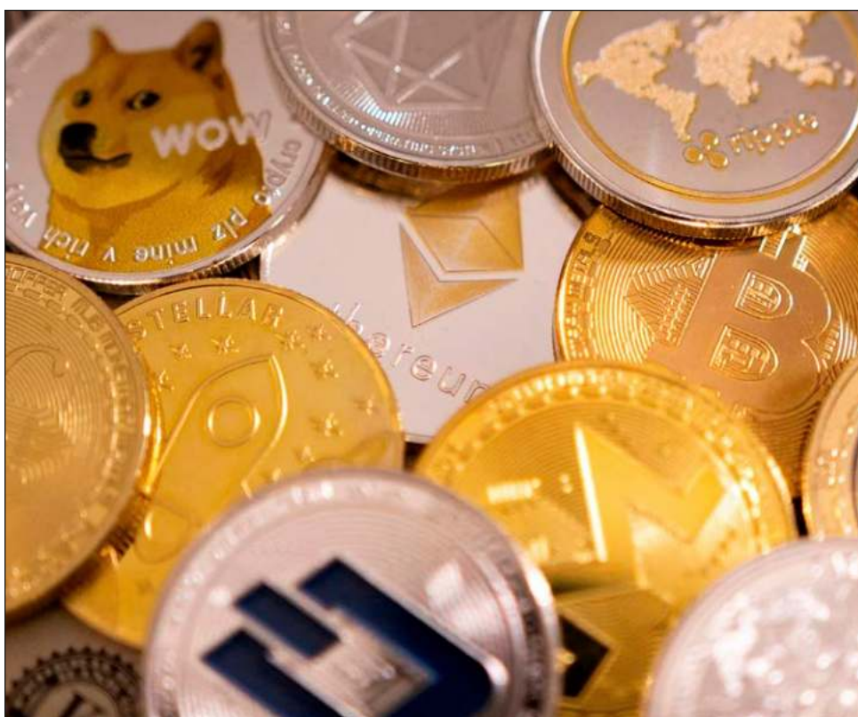
▲ Desde noviembre de 2021, cuando alcanz o un m ximo hist rico, el bitc oin se ha desplomado 65% y el mercado de criptomonedas vale menos de un bill on de d olares.

“No de la manera que Yucat n necesita pero que poco a poco se vayan aterrizando estos proyectos y el pa s pueda cumplir sus metas hacia la transici n energ tica”.