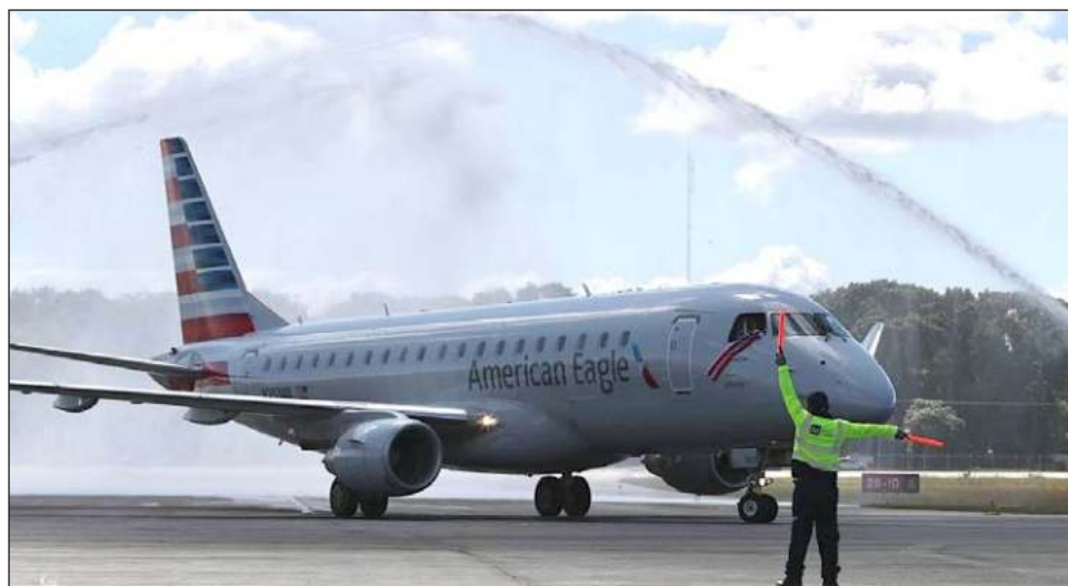
▲ El gobierno de Estados Unidos eliminó la obligatoriedad a realizarse una prueba diagnóstica de Covid-19 por lo menos 48 horas antes de viajar al país vecino.

Consideró que este cambio no necesariamente atraerá a un número mayor de visitantes al Caribe mexicano, pero sin duda hará más cómoda la estancia a los turistas, porque podrán irse sin necesidad de buscar