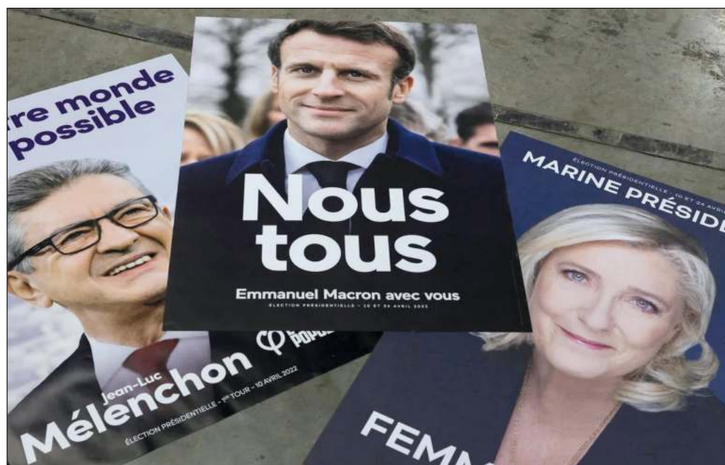
▲ Más allá de lo que dispongan los ciudadanos franceses al acudir a las urnas el próximo domingo, los resultados preliminares resultan esperanzadores por mostrar un regreso de la izquierda.

Sólo queda desear que el buen desempeño de las izquierdas en la primera vuelta legislativa se repita en el balotaje, y que la nueva conformación parlamentaria permita revitalizar la vida política francesa en un sentido democrático y solidario.