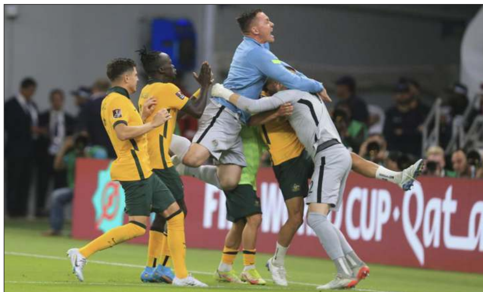
▲ Australia competirá en un duro grupo en el mundial con Francia y Dinamarca.

“La idea se tanteó en la previa, que esto (los penales) podría darse”, comentó. “Al final de cuentas, es como lanzar una moneda. Puede ser derecha o izquierda”, señaló el arquero de 33 años que ataja para el Sydney FC de la liga australiana.