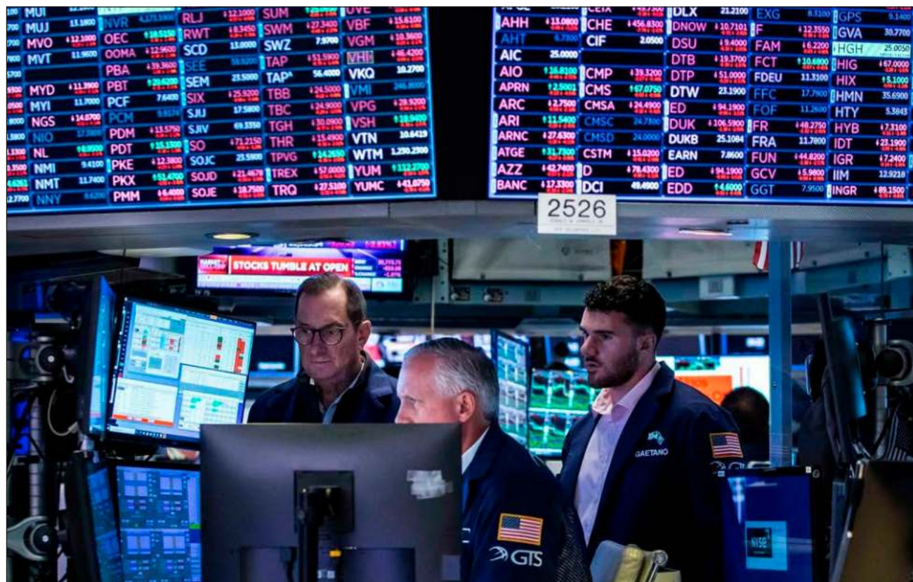
▲ El pasado viernes, los principales índices bursátiles de Estados Unidos tuvieron sus mayores caídas porcentuales semanales desde enero, y terminaron con un desplome más pronunciado de lo que esperaban los especialistas.

"Mi opinión es que realmente no veremos un cambio en el mercado de valores hasta que veamos algún tipo de giro de la Fed. Y con eso me refiero a volvernos un