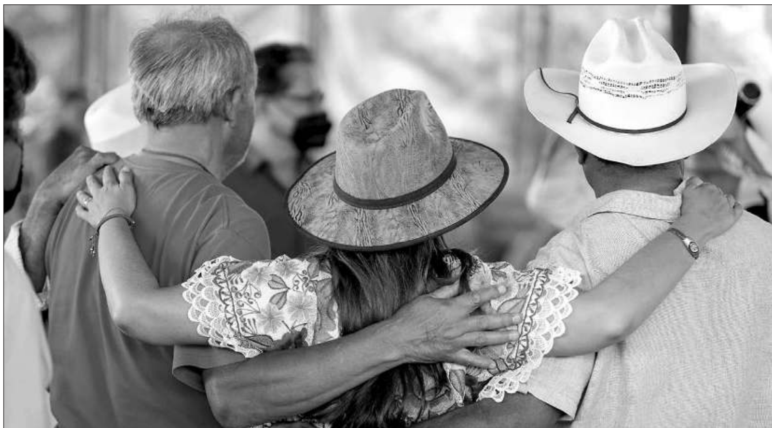
▲ "Una gestión gubernamental que se distinga por su compromiso con la sociedad y el ambiente, con el crecimiento económico en forma sostenible, tiene que ser el resultado de la interacción de personas con la formación, experiencia, perfil adecuado, y que cuenten con la confianza de la gobernadora".