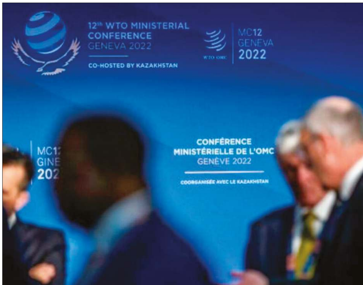
▲ El cambio climático no está incluido explícitamente en los acuerdos de la organización. Sin embargo, los objetivos de desarrollo sostenible y protección del medio ambiente son fundamentales para el organismo.

“Todos los estados con armas nucleares están aumentando o actualizando sus arsenales y la mayoría está subiendo la retórica nuclear y el papel que juegan las armas nucleares en sus estrategias militares”, dijo Wilfred Wan, director del programa de Programa de Armas de Destrucción Masiva de SIPRI.