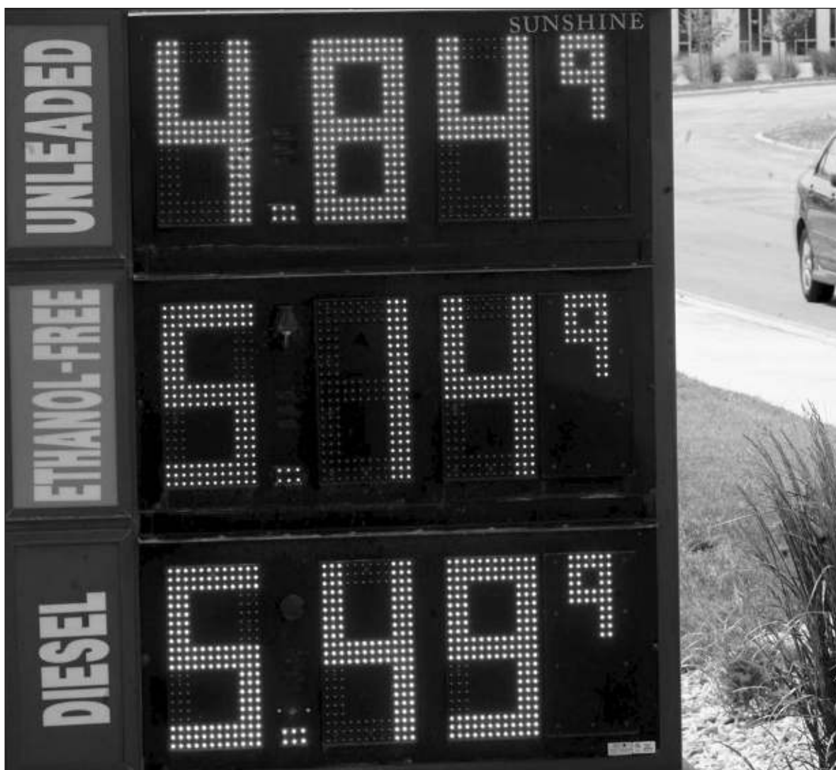
▲ Con el precio del barril de crudo arriba de los 110 dólares, las petroleras registran ganancias extraordinarias, al grado que en Estados Unidos, el presidente Joe Biden afirmó que "Exxon ganó más que Dios el año pasado".

"EXXON, COMIENZA A invertir y comienza a pagar tus impuestos". El presidente demócrata expresó que se asegurarían de que todos supieran cuánto se estaba beneficiando Exxon. "Exxon ganó más dinero que Dios el año pasado".