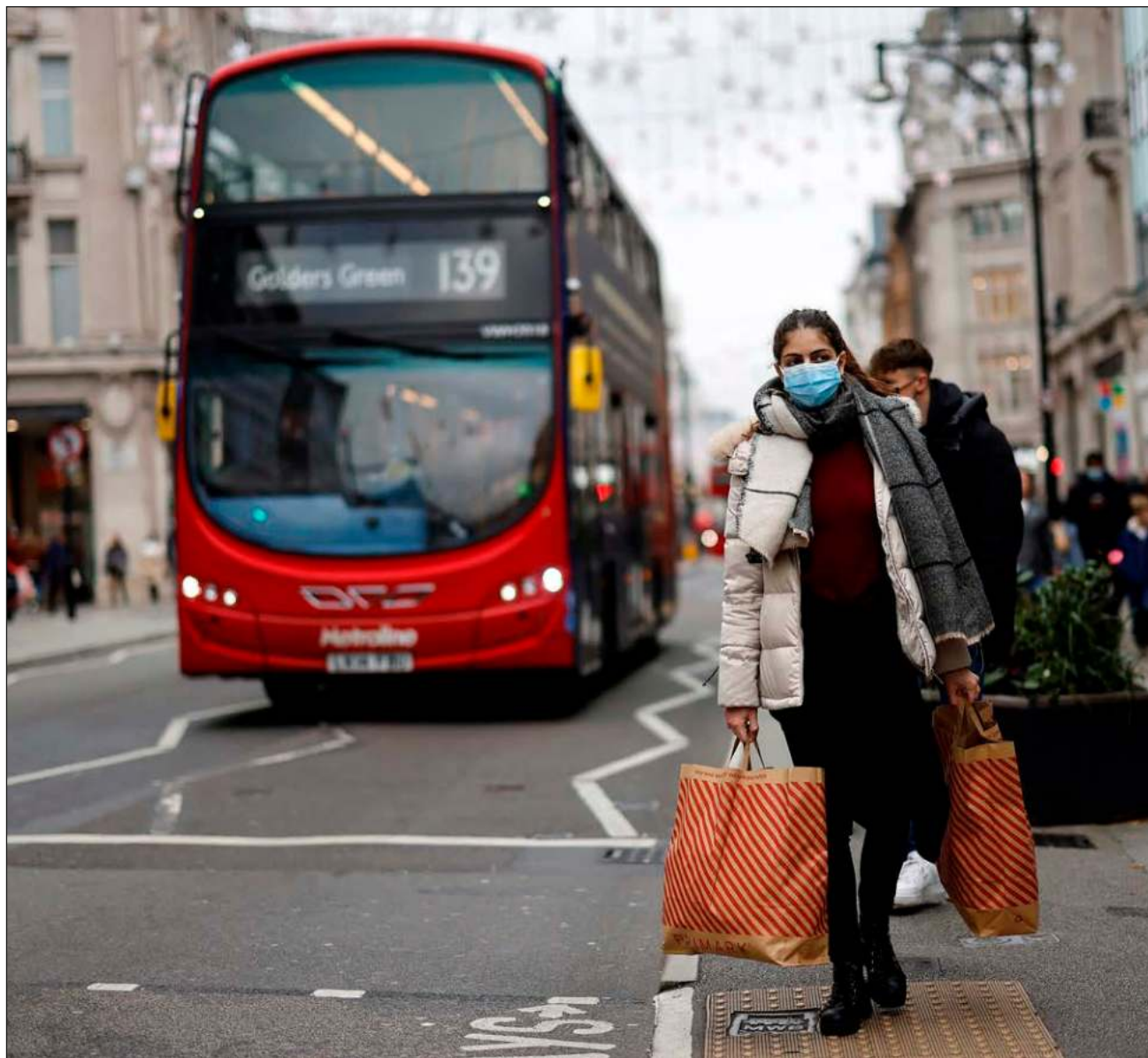
▲ Los economistas advierten que la inflación pesará en los próximos meses en la demanda de los consumidores, mientras que el Banco de Inglaterra pronostica para el año que viene una contracción de la economía británica.

La inflación en el Reino Unido se disparó a 9% en abril respecto al año anterior, un récord en cuatro décadas, sobre todo debido a la energía.