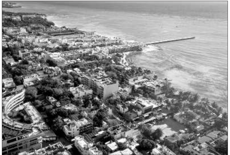
▲ La aplicación, desarrollada a través del RPPC, tiene la finalidad de garantizar a los quintanarroenses la certeza jurídica sobre su patrimonio inmobiliario.

Cristina Torres explicó que es mediante un correo electrónico registrado por el propietario y/o quien acredite interés jurídico de la propiedad como se dará aviso inmediato de cualquier tipo de movimiento que se lleve a cabo entre particulares sobre el inmueble y el folio relacio-