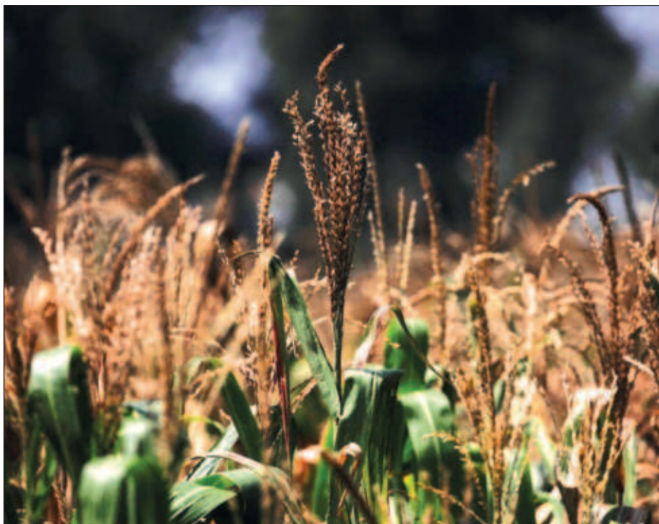
▲ La escasez de lluvias ha afectado las presas de uso agrícola, ya que cerraron el año con un almacenamiento de 42.7%, esto es 34.8% menos respecto al cierre de 2022.

Para eliminar las barreras, la Cofece propuso desasociar las membresías de servicios de streaming, así como cualquier otro servicio no relacionado con el uso de la plataforma; crear una sección en la que se informe a los vendedores; y modificar los criterios del algoritmo de gestión de ofertas y transparentar los estándares que consideran adecuados para proveer el servicio de logística.