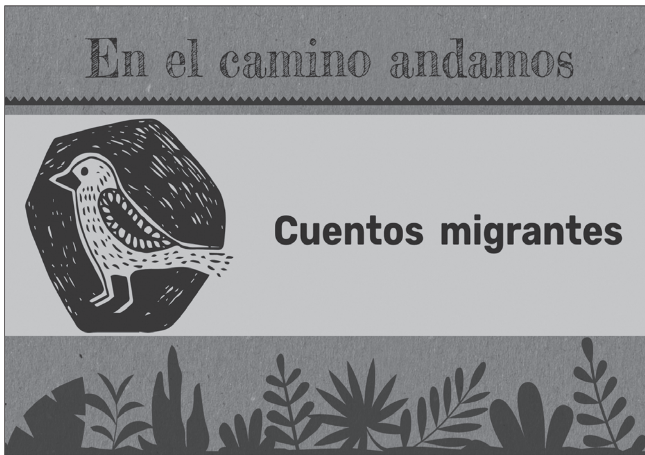
▲ El objetivo de la propuesta, que mezcla narración oral y actividades, es abordar el fenómeno de la migración.