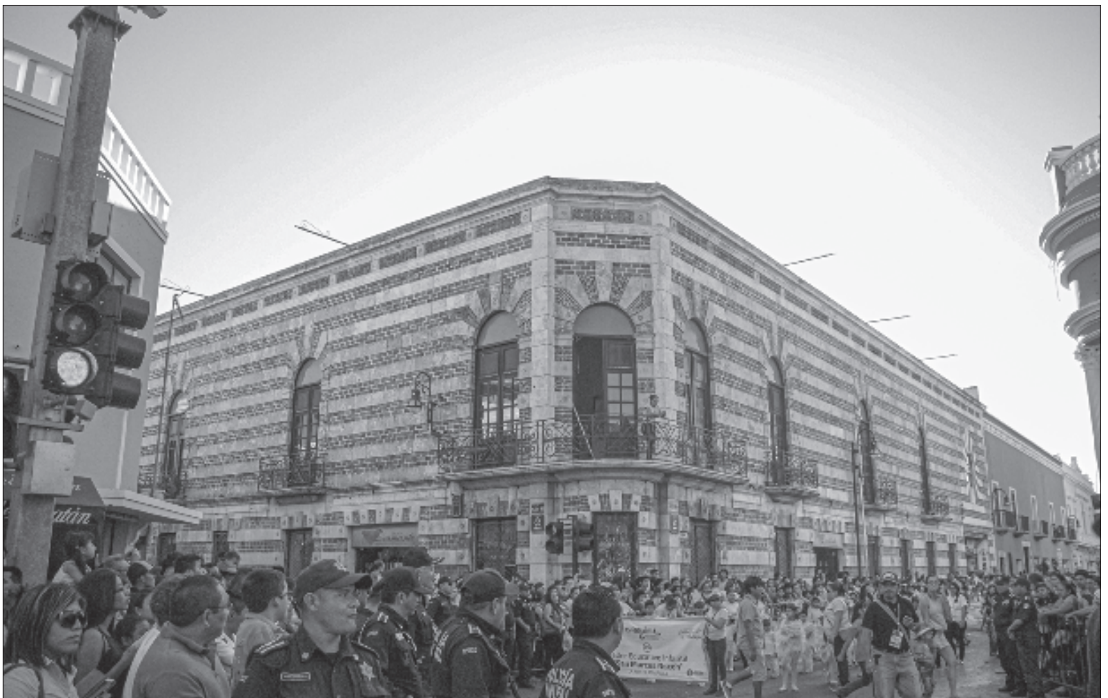
▲ "El traslado de la sede del Carnaval no se realizó tomando en cuenta la siguiente elección, sino la siguiente generación".