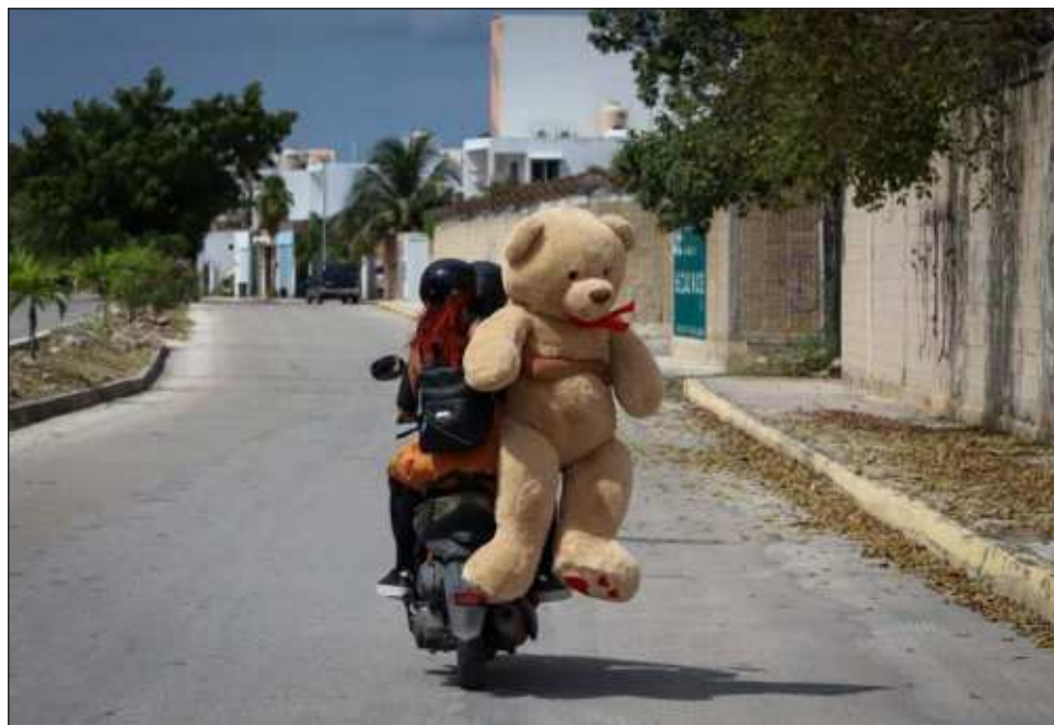
▲ En Quintana Roo, febrero es el mes favorito para contraer nupcias.

En contraparte, los matrimonios han disminuido, al pasar de 45.3 por ciento en 2000 a 37.3 por ciento en 2010 y 30.7 por ciento