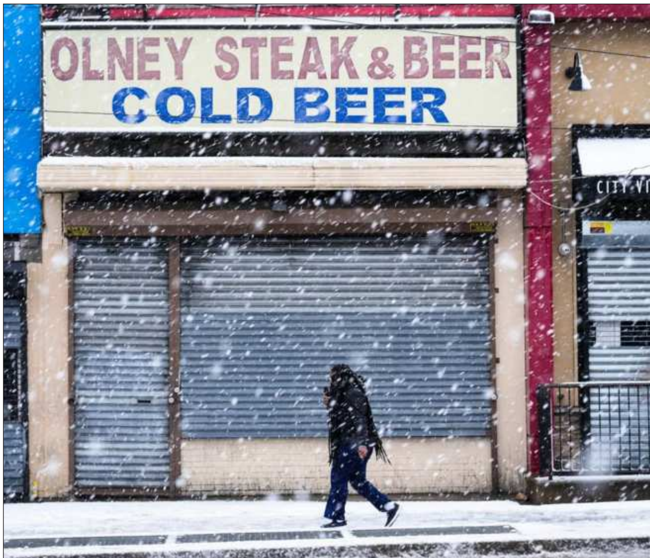
▲ En Nueva York, la ciudad más poblada del país, la lluvia se convirtió en nevada durante las primeras horas de la mañana. Se espera que la ciudad recibiera hasta 15 centímetros de nieve a lo largo del día, lo que provocaría unas condiciones de conducción peligrosas.

Su retórica coincidió con la del ex presidente Donald Trump (2017-2021), quien ha pedido enérgicamente que se rechace el proyecto de ley mientras afianza su nueva postulación.