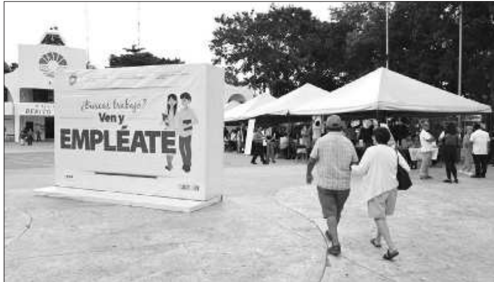
▲ El programa Ven y Empléate se ha convertido en una estrategia que beneficia tanto a las empresas como a los buscadores de empleo.

En el último año el sector inmobiliario ha incrementado su demanda de trabajadores