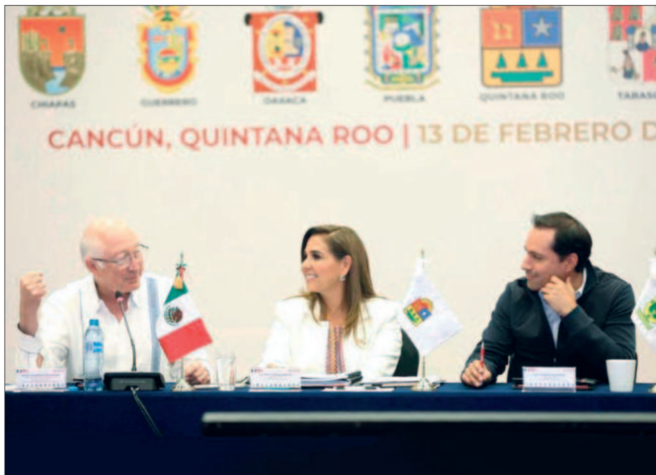
▲ Vila Dosal destacó el papel del embajador Ken Salazar por su compromiso a trabajar en equipo y por asistir a estos espacios donde ha mostrado su apoyo hacia los proyectos que se impulsan desde la región Sur Sureste.

El diplomático estadounidense resaltó el trabajo que a lo largo de su gestión ha hecho Vila Dosal para promover e impulsar el progreso del estado,