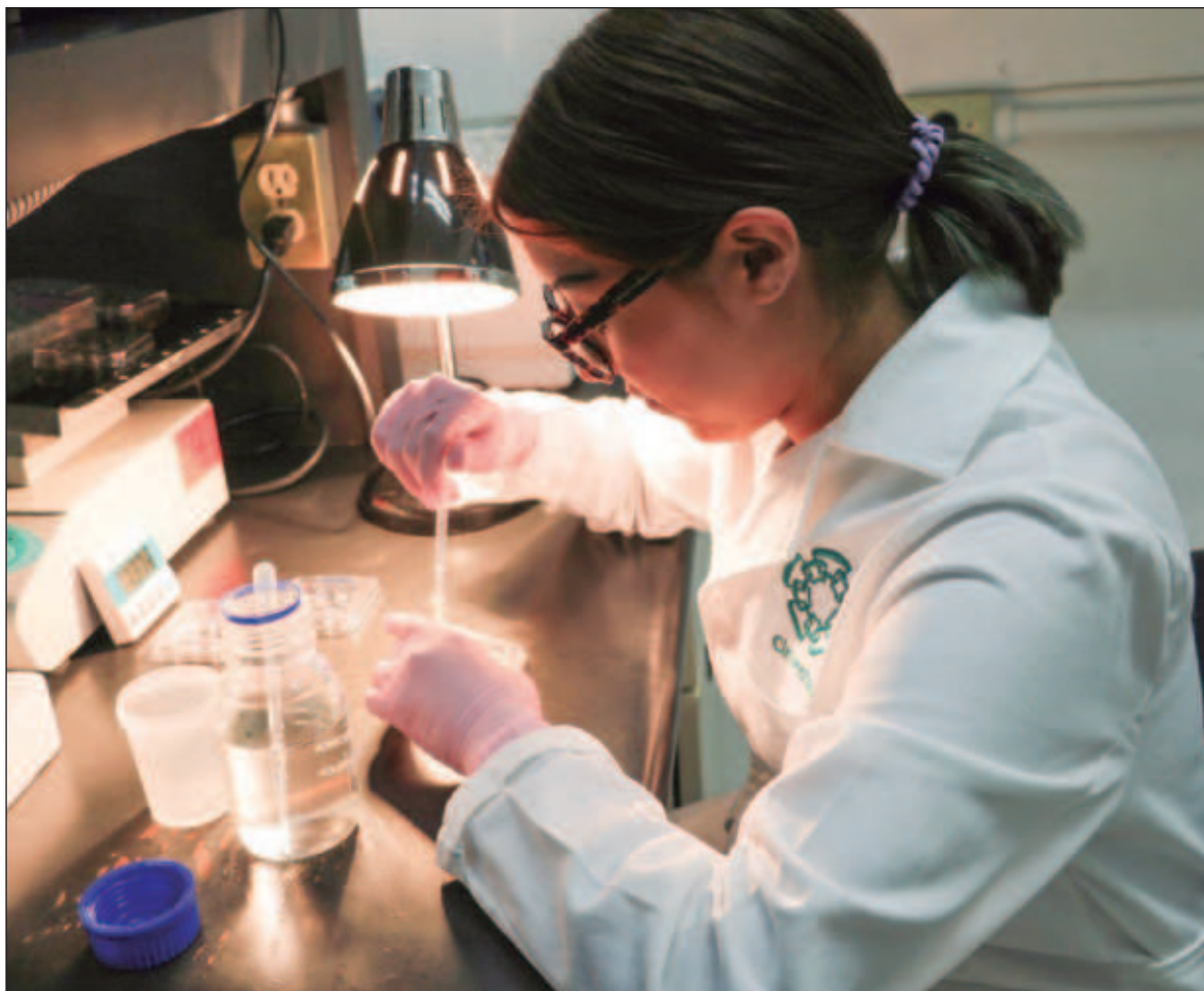
▲ "La Unesco, ha publicado que menos del 25 por ciento de los investigadores en el mundo son mujeres. Menos del 5 por ciento elegirá una ingeniería y menos del 2 por ciento realizará un doctorado en ciencias a pesar que grandes contribuciones científicas han sido realizadas por mujeres".

En el marco del 11 F deben realizarse acciones con las niñas, las jóvenes y las Científicas consolidadas. En este sentido el pasado 9 febrero se realizó una actividad llamada Científica, anota tu gol por la ciencia y una encuesta a una muestra de investigadores Cinvestav de la Unidad Mérida para demostrar que a las mujeres les toma más años llegar a los niveles académicos más altos.