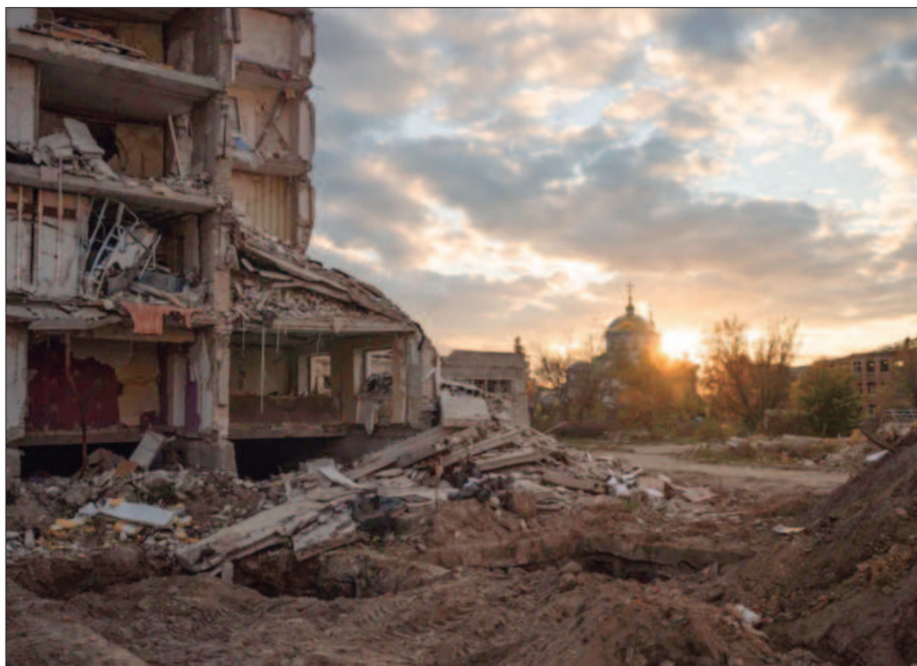
▲ De acuerdo con el organismo de las Naciones Unidas, 340 edificios habían resultado dañados, incluidos museos, monumentos, bibliotecas y complejos religiosos. “La solidaridad internacional será esencial para satisfacer estas necesidades”.

“Los daños siguen aumentando y las necesidades de recuperación del sector siguen aumentando”, dijo a periodistas Krista Pikkat, directora de cultura y emergencias de la Unesco, y agregó