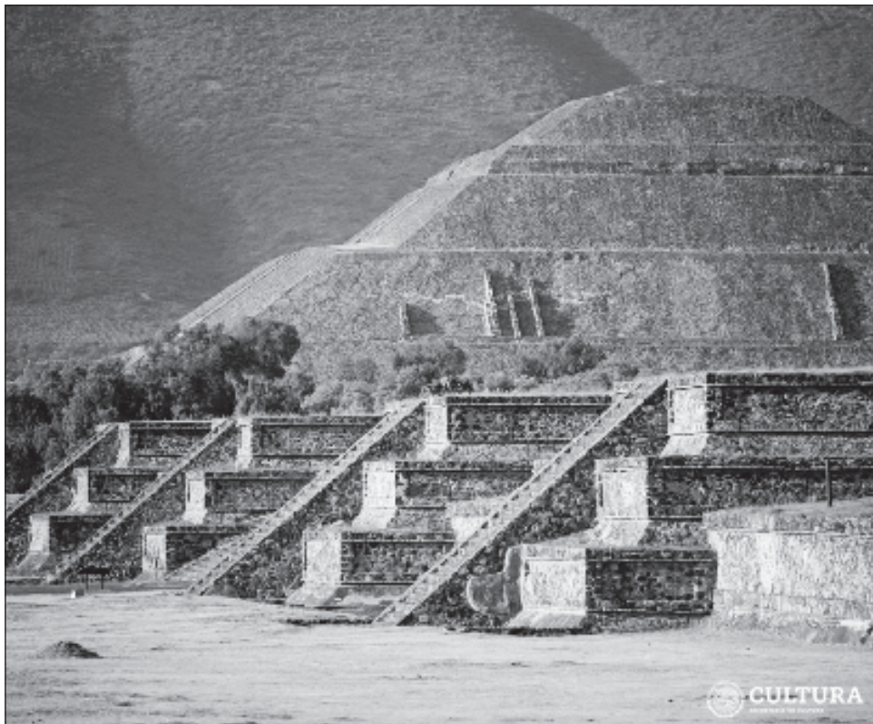
▲ La quinta edición de este evento cultural se realiza para conmemorar el Día Internacional de la Lengua Materna e invita a preservar las lenguas nativas.

“Invitamos a todas las comunidades del Valle de Teotihuacán a la 5ta Muestra de cine en lenguas originarias que organiza el Imcine”.