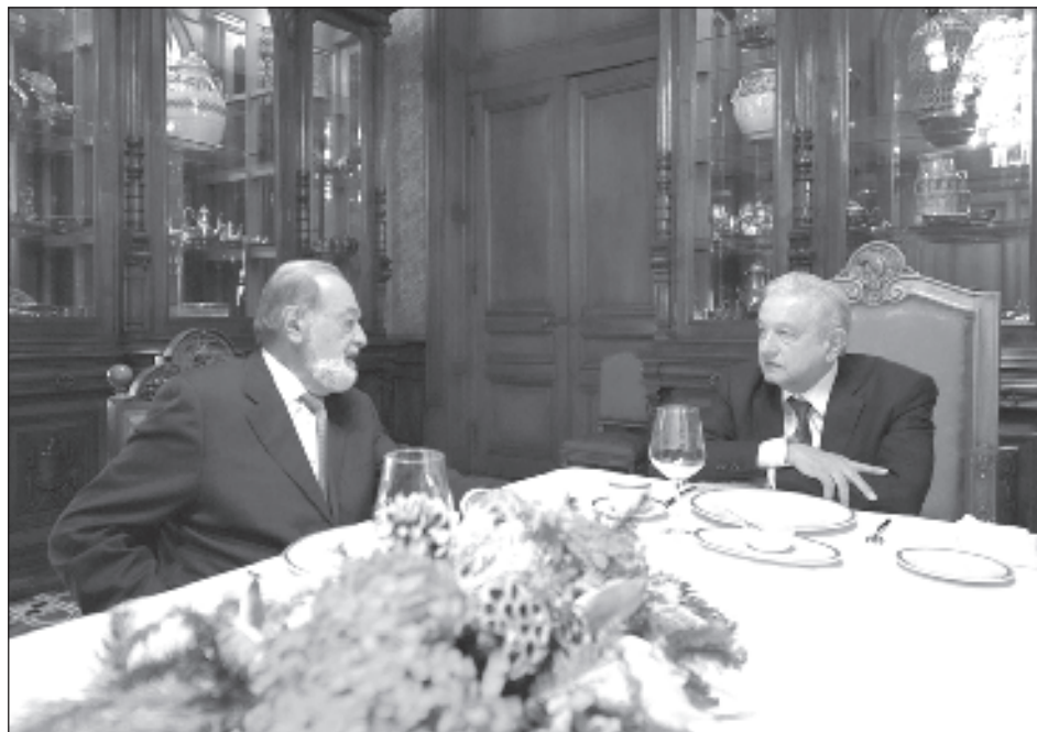
▲ El caso de él y otros empresarios en el país constatan que funciona el humanismo mexicano, señaló Andrés Manuel López Obrador en la conferencia del martes.

“Yo respeto mucho a Carlos y siempre dialogamos y debatimos, no estamos de