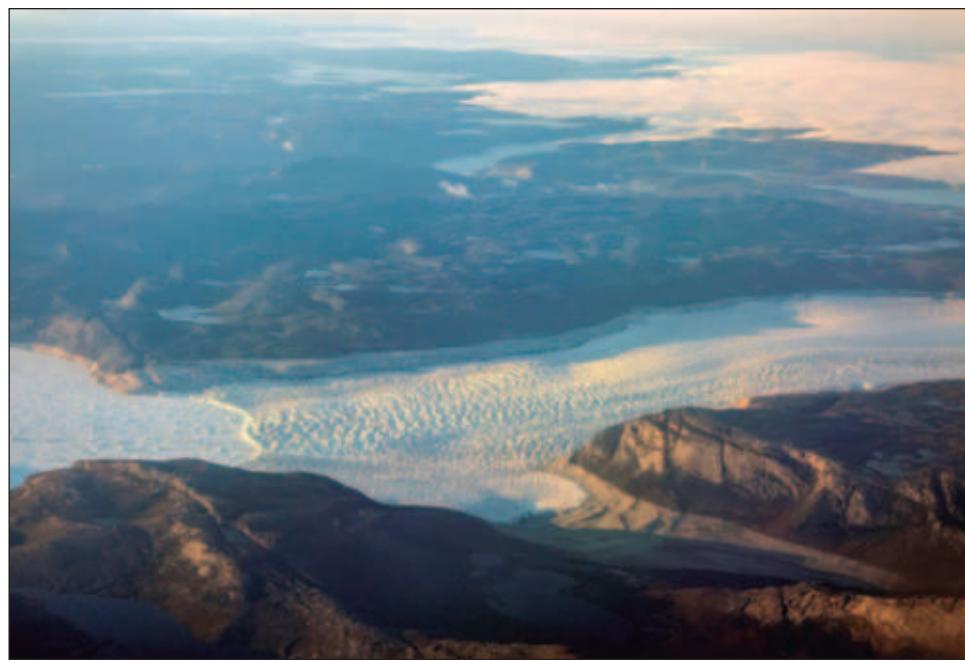
▲ "Hemos visto signos de que la pérdida de hielo está desencadenando otras reacciones que resultarán en una mayor pérdida de hielo y un mayor 'enverdecimiento' de Groenlandia, donde la reducción del hielo deja al descubierto rocas desnudas que luego son colonizadas por tundra y eventualmente arbustos".

Y los investigadores advierten que es probable que en el futuro se pro-