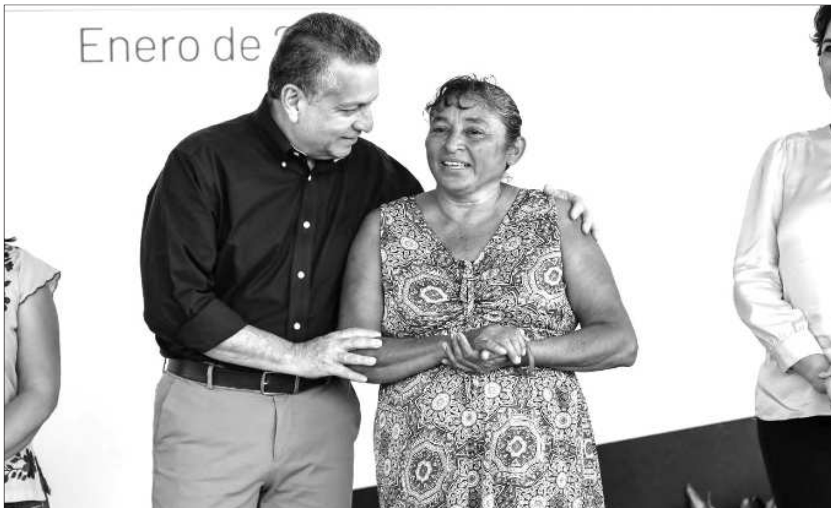
▲ En sesión ordinaria de la Comisión Municipal de Salud Mental se presentaron las acciones en temas críticos en el ámbito de la salud pública.