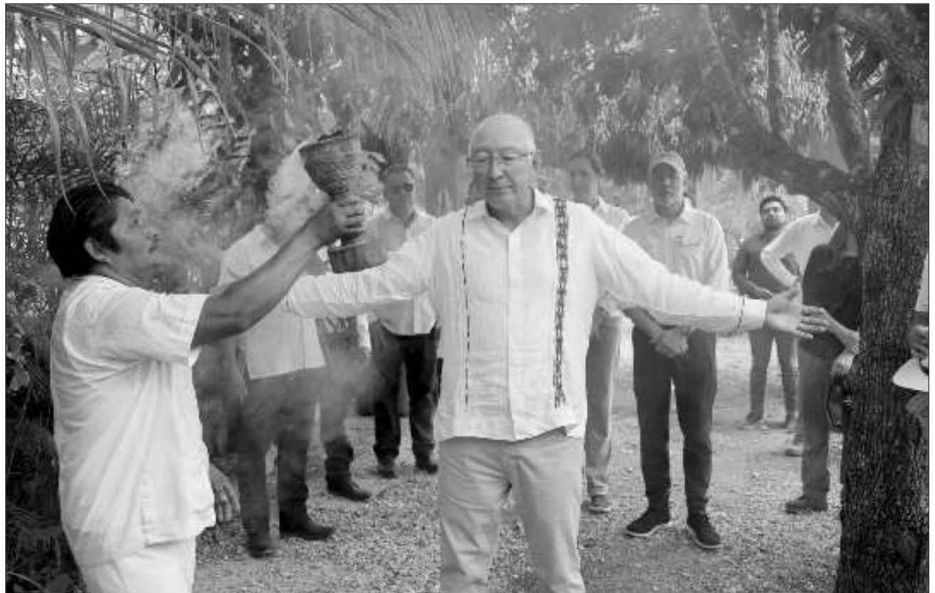
▲ El embajador Ken Salazar reconoció que A'aktun Jaleeb encarna la visión y los resultados que busca Alianza Mundo Maya México, porque las personas de la comunidad brindan una experiencia integral que va más allá del ecoturismo.