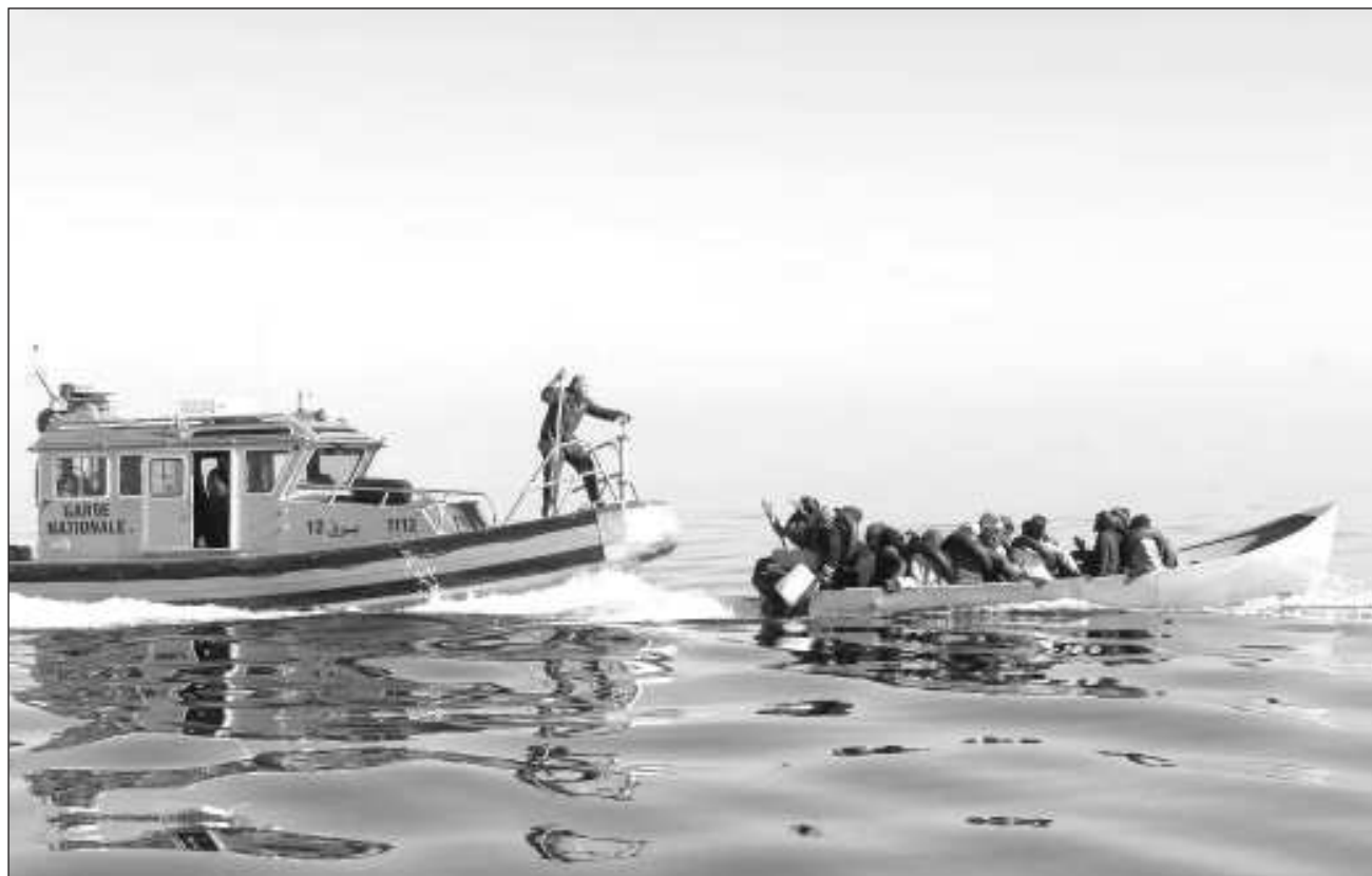
▲ Ahogamiento, accidentes vinculados al transporte, condiciones ambientales extremas y albergue inapropiado, principales causas; 591 muertes-desapariciones se registraron en América Central; 336 en Norteamérica, y 217 en el Caribe.

La OIM destacó que las rutas migratorias monitoreadas por el Proyecto Migrantes Desaparecidos