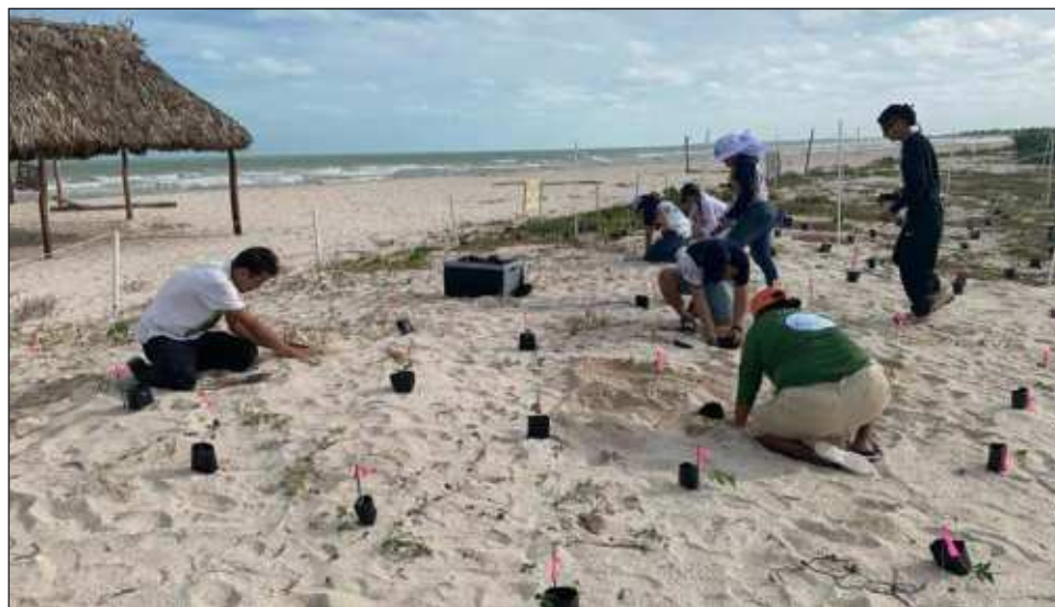
▲ Un grupo de egresados de la carrera de Manejo Sustentable de Zonas Costeras de la UNAM trabaja desde hace casi 5 años en la restauración y conservación de las dunas del puerto.

"Ahorita tenemos un programa con los niños de primaria que se llama Guardianas y Guardianes de la Costa en colaboración con