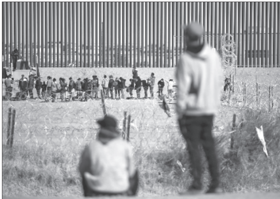
▲ Persisten las agresiones del crimen organizado contra migrantes, al reportar 395 pacientes que fueron víctimas de violencia y 129 consultas de personas que sobrevivieron a un secuestro entre último trimestre de 2023 y enero pasado en Reynosa y Matamoros.

La asociación también señaló que persisten las agresiones del crimen organizado contra migrantes, al reportar 395 pacientes que fueron víctimas de violencia y 129 consultas de personas que sobrevivieron a un secuestro entre el último trimestre de 2023 y enero pasado en Reynosa y Matamoros.