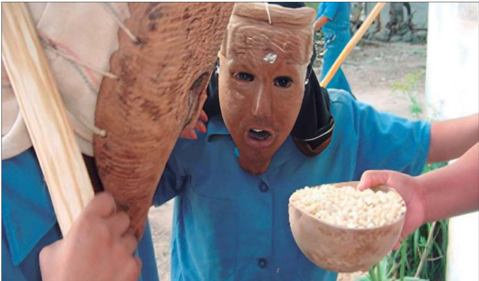
▲ "La Danza de los Abuelos no sólo reafirma las raíces y la memoria histórica del pueblo, sino que también fortalece el sentido de pertenencia".

Coordinadora editorial de la columna: María del Carmen Castillo Cisneros, antropóloga social del Centro INAH Yucatán carmen_castillo@inah.gob.mx