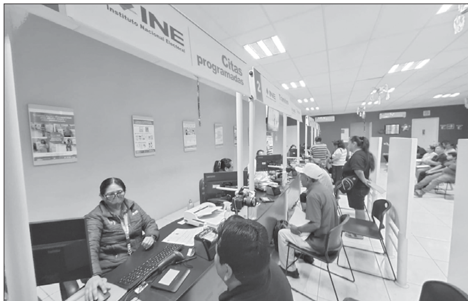
▲ “Nuestra preocupación ha sido, y seguirá siendo, proteger a la ciudadanía. Advertir que quienes participen como funcionarios de casilla podrían convertirse en ejecutores de una reforma impugnada no es una amenaza, sino un llamado preventivo”: Guadalupe Taddei.

Pero no sólo eso, la Jufed respondió a las recientes declaraciones de Guadalupe Taddei, quien calificó de “perversa” su observación sobre las con-