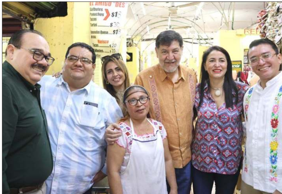
▲ Morena tiene como meta afiliar a más de 10 millones de personas este año, fortaleciendo la organización del movimiento en todo el país.

El senador comentó que la reunión entre la presidenta Claudia Sheinbaum y el Consejo Nacional del Instituto Nacional Electoral (INE), dio buenos resultados y se ha superado el tema del presupuesto para el proceso electoral. Sin embargo, advirtió que el Poder Judicial seguirá intentando sabotear la elección, aunque confía