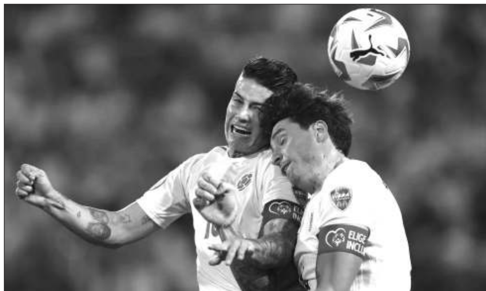
▲ James Rodríguez, líder de la selección de Colombia, es un refuerzo de lujo para el León.

Además de León, Monterrey y Pachuca representarán a México en ese torneo.