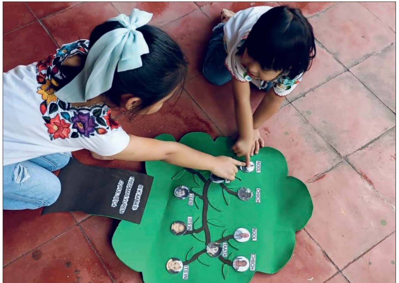
▲ La prioridad es que aprendan el lenguaje con cosas que utilizan en el día a día, como sus colores favoritos.

“Queríamos hacer algo diferente, novedoso, lúdico y llamativo para toda la población, nos habíamos enfocado en algunos contenidos en lengua maya porque a veces no contamos en las aulas para trabajar, a veces sí hay pero no llegan esos insumos a las escuelas donde realmente se necesitan, por eso decidimos trabajar estos contenidos, videos que sean llamativos, coloridos, con contenidos