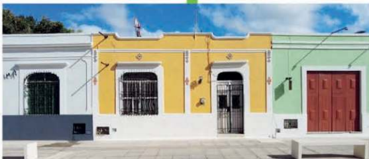
El Ayuntamiento de Mérida invirtió en la pintura en las fachadas de las viviendas que rodean al Parque de la Plancha.