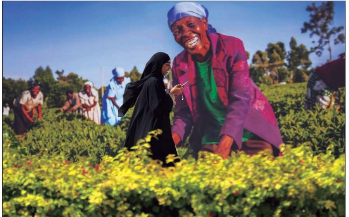
▲ “Merece aplauso la tozuda participación del GCF, organismo que se empeña en impulsar la conservación y el aprovechamiento sustentable de la masa forestal tropical del mundo”.

En este orden de cosas, no resulta sorprendente encontrarse con que en Dubái, a medida que se desarrolla la vigésimo octava Conferencia de las Partes en materia de cambio climático, la discusión más sonora es la que se refiere al financiamiento: ¿Quién debe cubrir los costos de la adaptación al cambio climático global? ¿Se debe esperar que las naciones menos desarrolladas sacrifiquen sus procesos de desarrollo (convencional), en aras de enfrentar los efectos de una nueva circunstancia climática, en la que han tenido una participación relativamente menor que la de los países desarrollados? Por otra parte, precisamente en Dubái, monumento a la generación de riqueza a partir de la extracción de petróleo del subsuelo, se discuten las vías que deberían seguirse