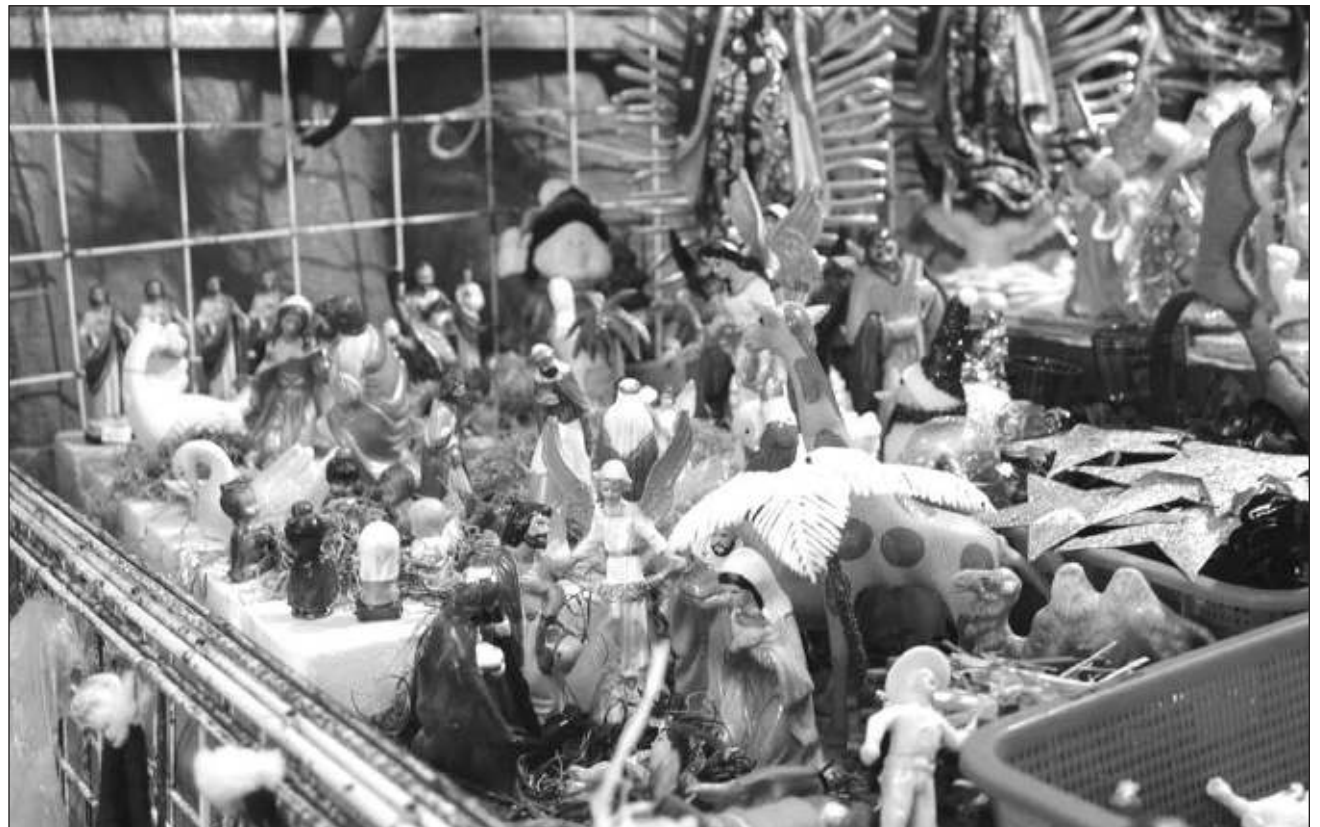
▲ Este operativo concluirá el 6 de enero del 2024 y en él participarán un total de 730 elementos, así como 178 unidades que implementarán medidas preventivas y disuasivas en los 13 municipios del estado, con el fin de tener saldo blanco este periodo.

Entre las acciones que se pondrán en marcha están los operativos Conduce sin alcohol , Tu vida en regla , y Seguridad Bancaria , este