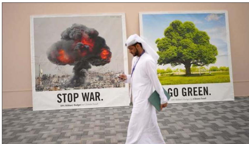
▲ El primer foro de Negocios y Filantropía ofreció a fundaciones, donantes y corporaciones un papel formal más amplio en un momento en que los líderes de la COP28 buscan obtener más financiamiento del sector privado; confirmaron nuevos vehículos de inversión mixta.

“La respuesta honesta es que la comunidad sanitaria mundial, incluidos nosotros, estaba tan centrada en el Covid-19 que proba-