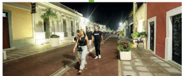
Estamos realizando el Corredor Turístico - Gastronómico de la calle 47 y 60 para conectar a la Plaza Grande, el Parque de Santa Lucía y de Santa Ana con el nuevo Parque la Plancha, en conjunto con el Ayuntamiento de Mérida.