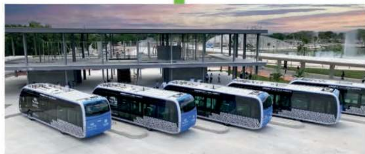
Se construye la estación del IETRAM en el Parque la Plancha, para 3 rutas de este transporte público 100% eléctrico y único en su tipo en Latinoamérica.