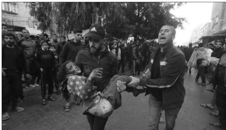
▲ El Ministerio de Salud de la franja de Gaza afirma que 18 mil 412 personas murieron desde el inicio de la ofensiva israelí, en su mayoría mujeres y niños.

El Ministerio de Salud del territorio afirma que 18 mil 412 personas murieron desde el inicio de la ofensiva israelí, en su mayoría mujeres y niños.