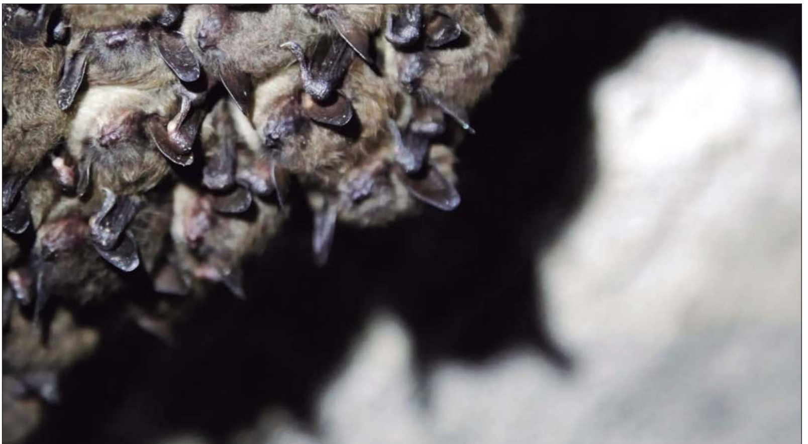
▲ “Son mal conocidos y sus leyendas urbanas son muchas sobre su peligro. Sin embargo, jamás nos explican que la mayoría de ellos son insectívoros”.