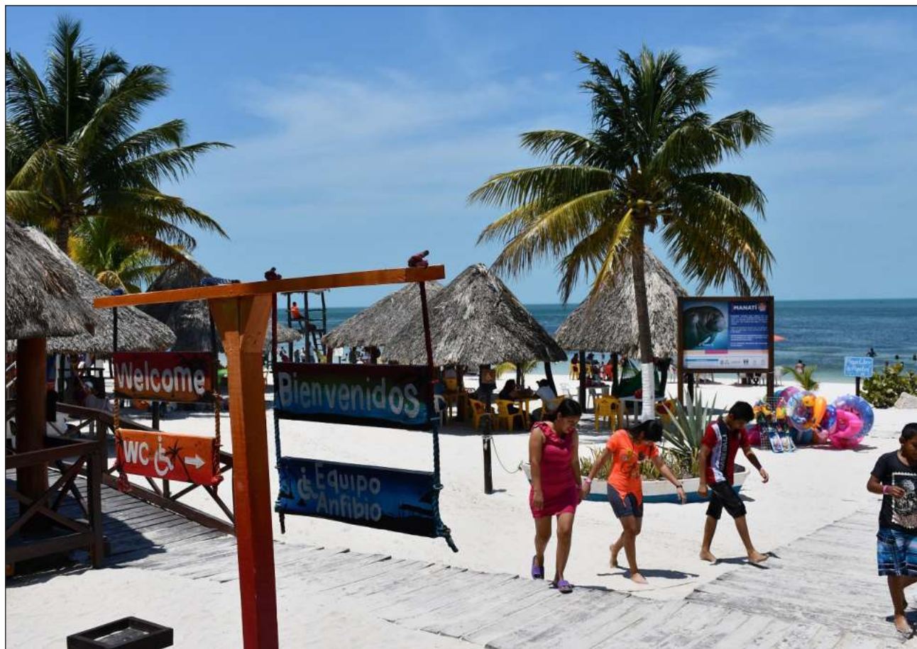
▲ Ceballos Fuentes agradeció a los bañistas su presencia durante todo el año, ya que todo lo que se recauda por las cuotas de acceso, estacionamiento de automóviles y renta de mobiliario, es destinado exclusivamente al mantenimiento y rehabilitación.

Ceballos Fuentes agradeció a los bañistas su presencia durante todo el año, ya que todo lo que se recauda por las cuotas de acceso,