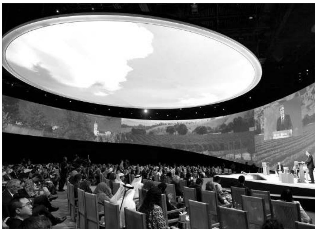
▲ La supresión del empleo de estos combustibles conduciría al desplome de los países que prácticamente basan su existencia en la extracción de petróleo y que también disfrutaban de enormes yacimientos.

Pero mientras, el mundo en general tampoco parece caminar hacia una solución al cambio climático. Con una COP incapaz de avanzar en acuerdos, el mundo seguirá calentándose un poco más cada año.