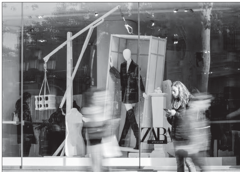
▲ La empresa agregó que algunos clientes se sintieron ofendidos porque vieron en esas imágenes "algo muy alejado de lo que se pretendió cuando fueron creadas".

El comunicado no hace referencia a la guerra entre