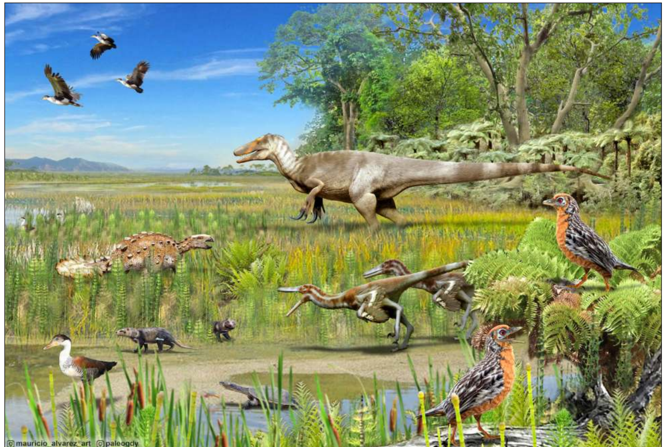
▲ U k'aaba' túumben tuukule' "Cuello de botella de la longevidad", ts'o'oke' yaan ba'al u yil yéetel u muuk'il nukuch ba'alche'ob yanchaj te'e k'inako'obe', ts'o'oke' xáanchaj maanal 100 miyoonesil ja'abo'ob.

Beey túuno', patjo'ol tuukul beeta'an tumen Magalhaes ku ya'ake', ka'alikil táan Era Mesozoicae', mamíferose' yanchaj u maas séebtal u kaxtik bix u yantal u mejenil tu k'iinil