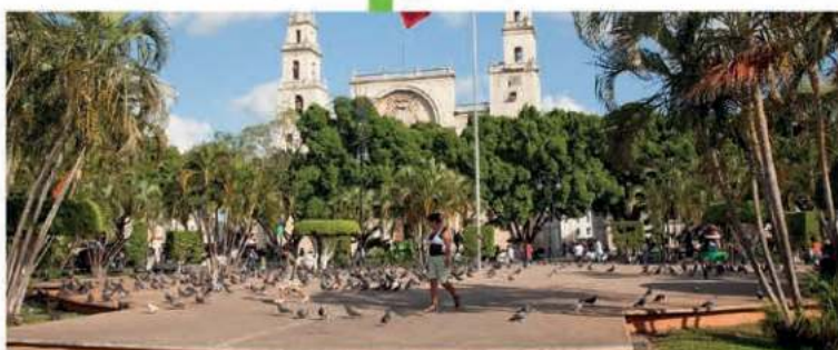
Realizaremos la remodelación de la Plaza Grande