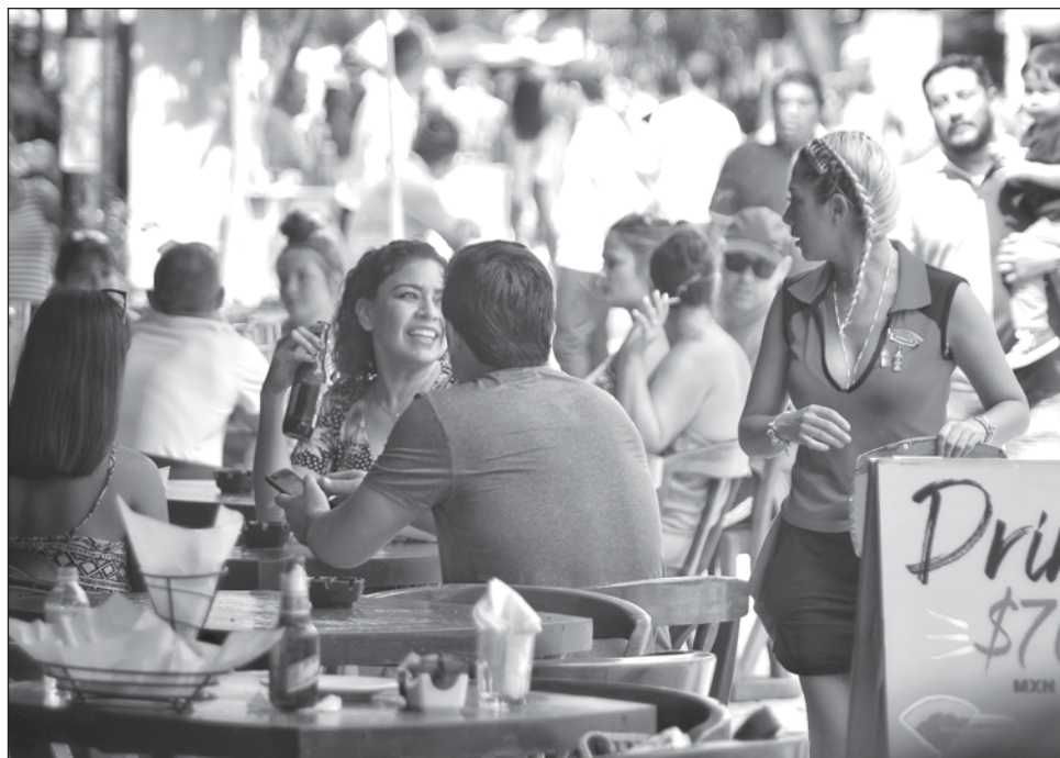
▲ Los visitantes podrán registrar sus visitas a sitios como restaurantes y hoteles, y al final de su estadía, recibirán algunos beneficios por dicho consumo.

El presidente de la federación anunció que a finales del 2024 podrían presentar un avance para que funcione de forma óptima.