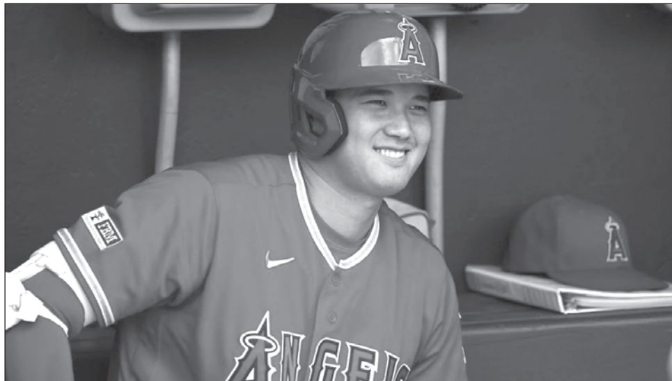
▲ El japonés Shohei Ohtani, nuevo bateador designado de los Dodgers de Los Ángeles.

-Los jugadores en la posición de Ohtani, que acaban de ganar un premio al "MVP", generalmente no se mudan a nuevos equipos. Él es apenas el cuarto Jugador Más Valioso reinante en cambiar de club esa temporada baja, uniéndose a Giancarlo Stanton en 2017 (cambiado de los Marlins a los Yanquis); Alex