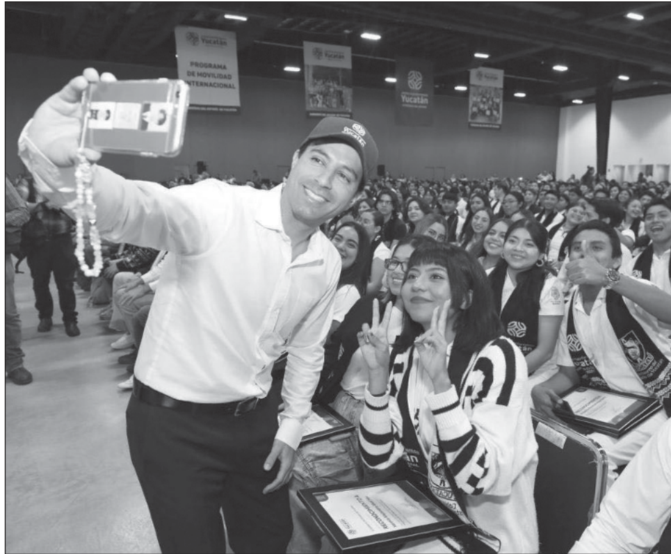
▲ La mayoría de los 500 beneficiados por el Programa de Movilidad Internacional 2024 son mujeres y jóvenes que habitan en el interior del estado.

“Estamos dirigiendo en la modalidad de posgrados, más de medio millón de pesos por cada uno de los 5 estudiantes, y yo siempre digo que no estamos gastando sino invirtiendo en lo más preciado que tenemos, que es nuestro capital humano y nuestros jóvenes, quienes son los que van a construir el futuro de Yucatán en los próximos 20 o 30 años y esta es la mejor inversión que