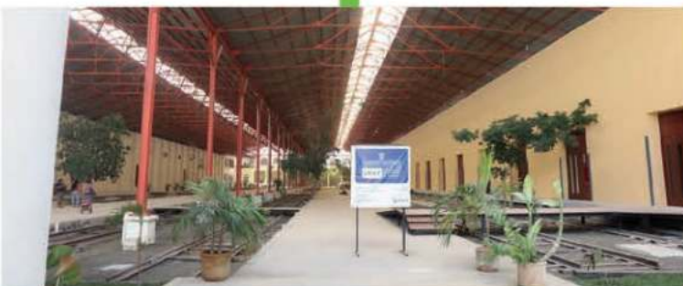
La Universidad de las Artes, UNAY, que ahora es la más importante del sureste del país, se está ampliando para aumentar su capacidad y recibir hasta 2 mil alumnos.

ESTAS SON LAS NUEVAS OBRAS QUE GENERAN GRANDES BENEFICIOS PARA TI Y TU FAMILIA