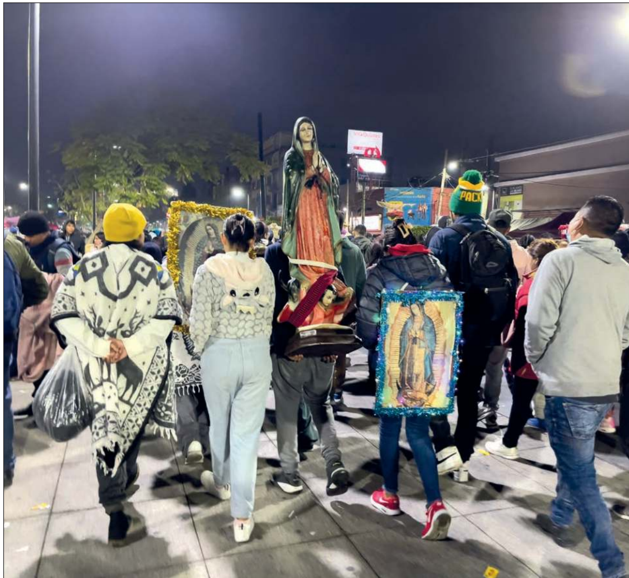
▲ Las autoridades de la alcaldía de Gustavo A. Madero brindaron 3 mil 875 atenciones médicas y 13 traslados hospitalarios.

Alrededor de las 18 horas del martes se normalizó la circulación en el cuadrante de las avenidas Insurgentes Norte, Cantera, Martín Carrera, Ferrocarril Hidalgo y Talismán.