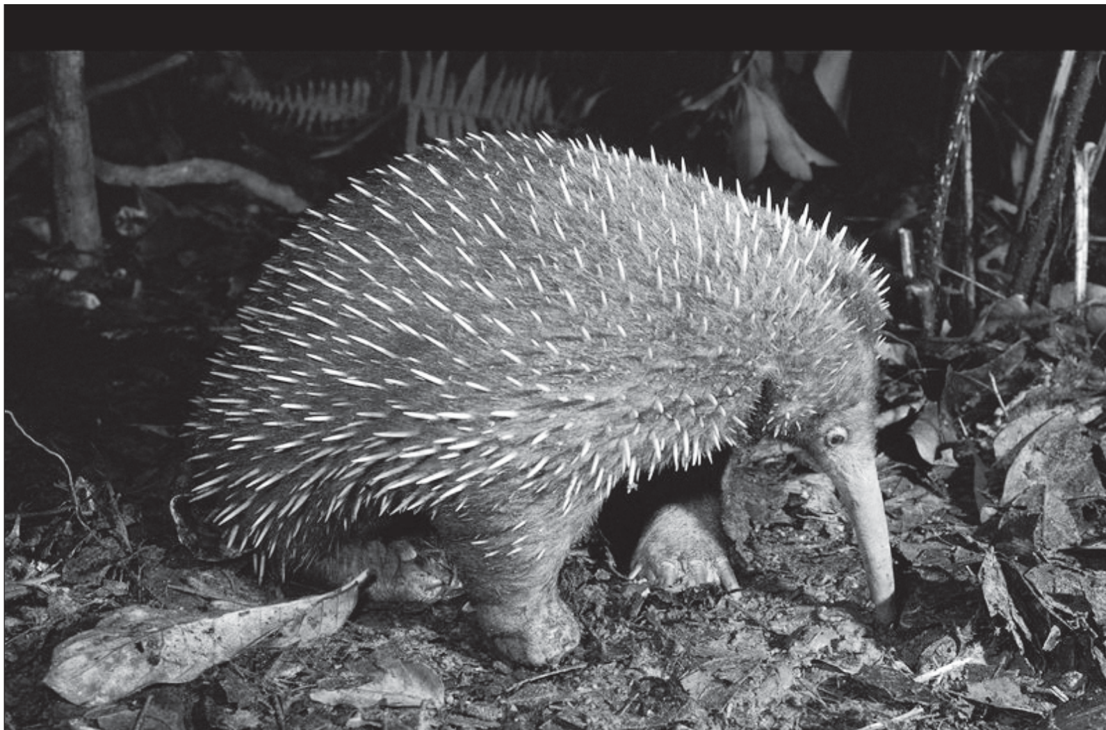
▲ " Zaglossus attenboroughi , conocido coloquialmente como equidna de pico largo (...) Mamíferos cuya peculiaridad es poner huevos".

Para más información sobre la autora puede consultar en https://www.comoves.unam.mx/numeros/quienes/290