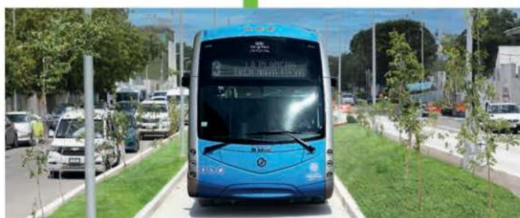
Construcción de vías en donde transitarán las unidades del IETRAM, además de construcción de banquetas y guarniciones, señalética, sistema de iluminación y pozos pluviales.