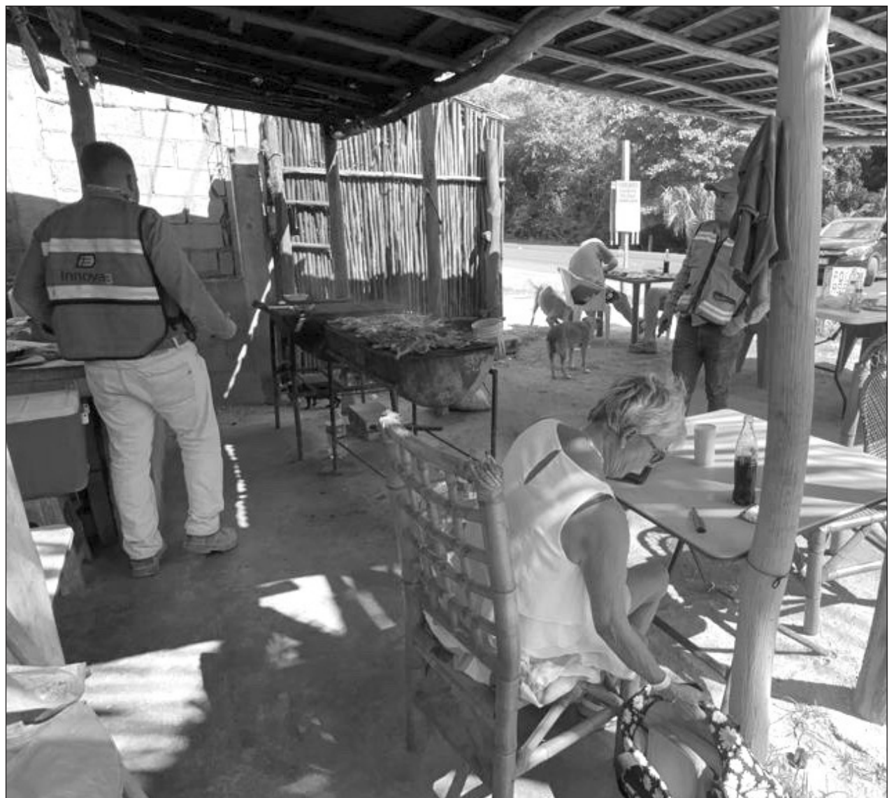
▲ Los nuevos habitantes son principalmente trabajadores que colaboran en dichas mega obras.

Agregó que también ha observado que hay negocios de comida y demás giros comerciales que están abriendo debido a la oferta y demanda que se está viendo en la zona.