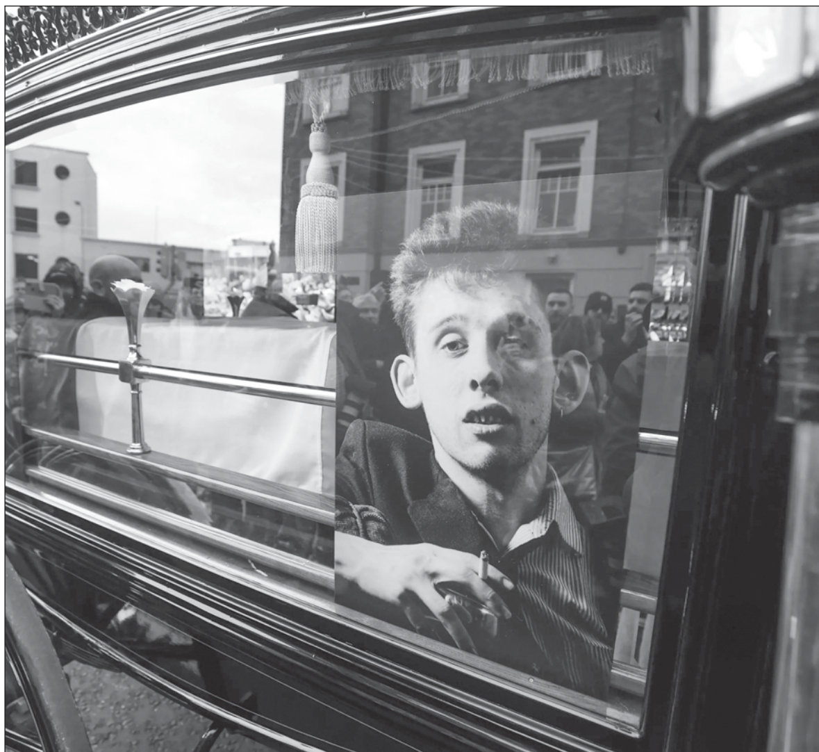
▲ “Hijo de un pueblo con una sed de siglos, con botones de autodestrucción, Shane MacGowan encontró en la poesía las balas para hacer su particular revolución (...) el presidente de Irlanda, Michael D. Higgins, lo llamó el mejor letrista vivo de su generación”.

Shane MacGowan, ahora en ese cielo que se imaginó como ríos destilados de sueños, sigue cantando con su voz de caverna, en la víspera de su cumpleaños, Fairy Tale of New York , donde recuerda: “Era Noche Buena, nena. En un tanque de borrachos”.