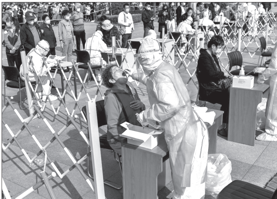
▲ De acuerdo a los reportes oficiales, de los casos positivos reportados de globalmente, al menos 25 millones 963 mil 400 se recuperaron.

China, sin tener en cuenta los territorios de Hong Kong y Macao, registró un total de 85 mil 578