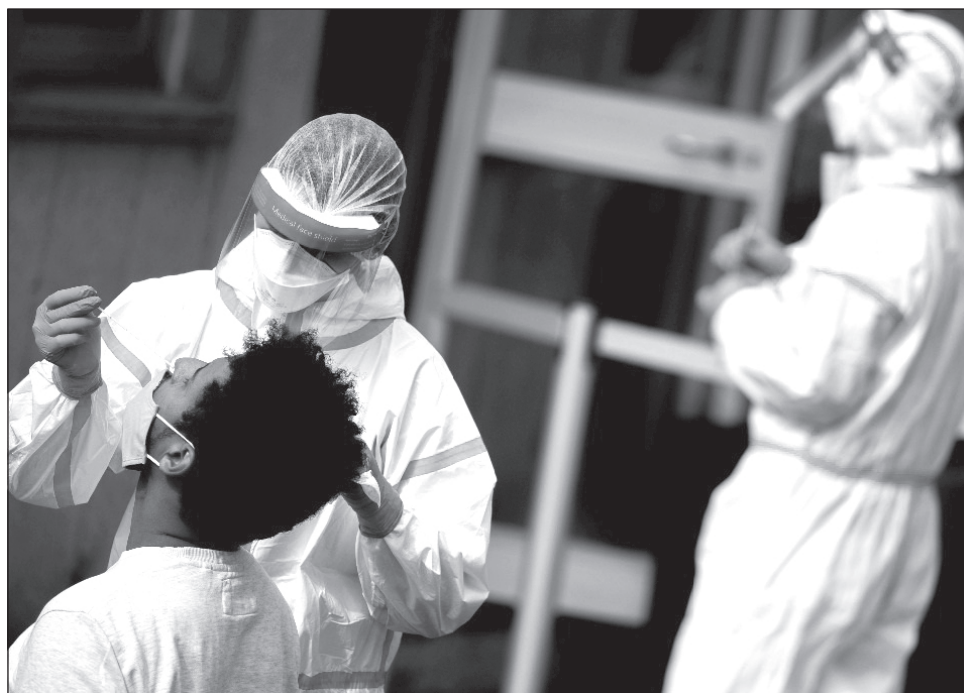
▲ La gente es con mucho más infecciosa que las superficies, dice Trevor Drew, director del Centro de Prevención de Enfermedades de Australia.

Drew dijo que hay algunas reservas. Entre ellas, que el estu-