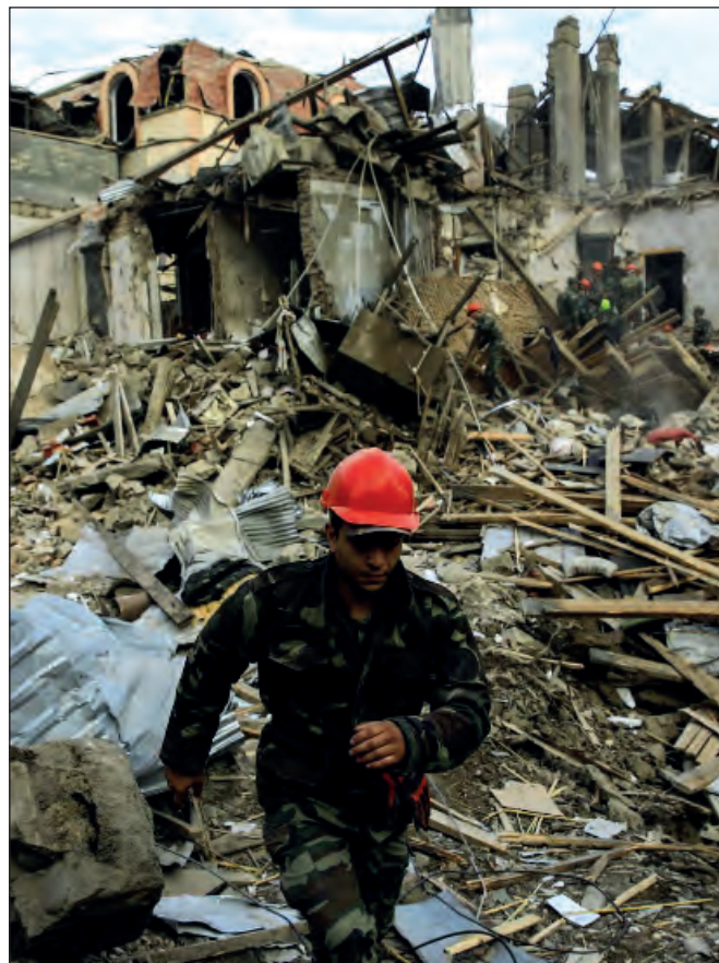
▲ Las viejas tensiones entre Azerbaiyán y la autoproclamada república de Artsaj, derivaron en un nuevo ciclo de episodios bélicos en los que han muerto ya cientos de civiles.

En Bielorrusia, en cambio, existe el riesgo de que la Unión Europea y la OTAN intenten explotar la crisis para expandirse hacia el oriente y ganar a un nuevo integrante fronterizo con Rusia. Cabe esperar que tal escenario no se concrete, pues conduciría a un nuevo y peligroso ciclo de tensiones Este-Oeste.