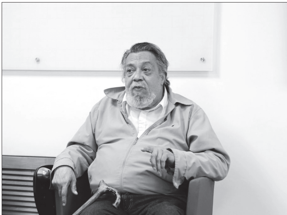
▲ El poeta, novelista y ensayista colombiano, Álvaro Miranda, falleció la madrugada del viernes, un día antes de inaugurar el festival de poesía en el que participaría.

La lectura de esos textos fue en chino, con el singular ritmo y la musicalidad nasal propios de ese idioma; pudo conocerse su significado en español gracias a la traducción al