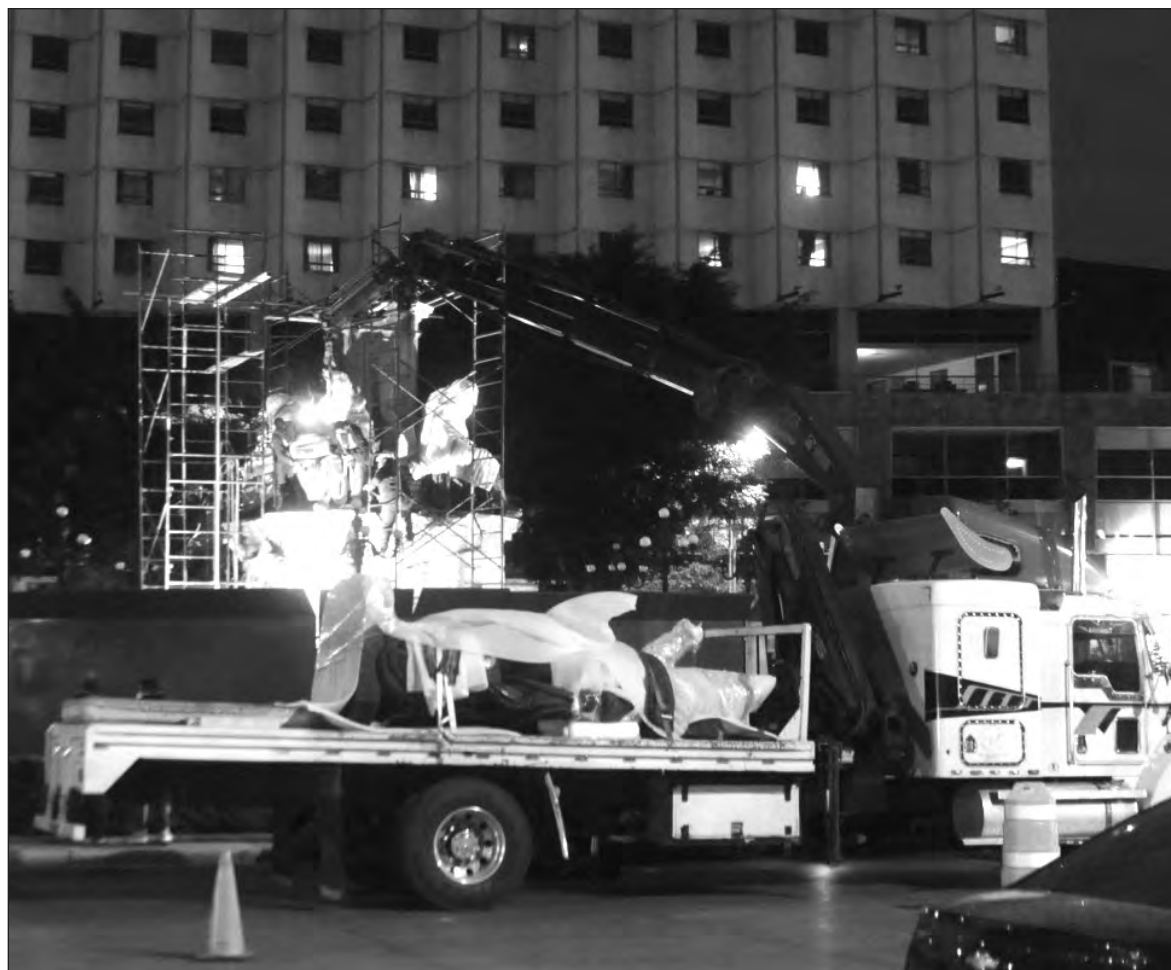
▲ El complejo escultórico de Cristóbal Colón, ubicado en el Paseo de la Reforma de la Ciudad de México, fue retirado la madrugada del 12 de octubre para su restauración.

La recuperación de la memoria comenzó a exhibir a los grandes conquistadores como lo que fueron, unos asesinos. Colón el primero (o sus esbirros),