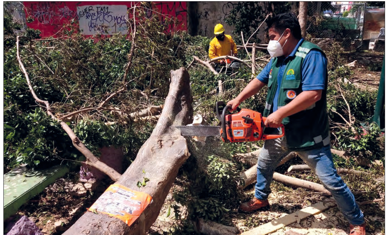
▲ El paso de los sistemas tropicales por el estado dejó afectaciones como árboles y postes de luz caídos, obstruyendo vialidades.