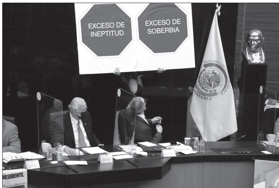
▲ La senadora Martha Márquez del PAN protestó durante la comparecencia del subsecretario de Prevención y Promoción de la Salud, Hugo López-Gatell.

No entró a confrontación, pese a que senadores del PAN y PRI pusieron en duda las cifras sobre el número de contagiados y muertos por la pandemia, y los panistas fueron particularmente agresivos.