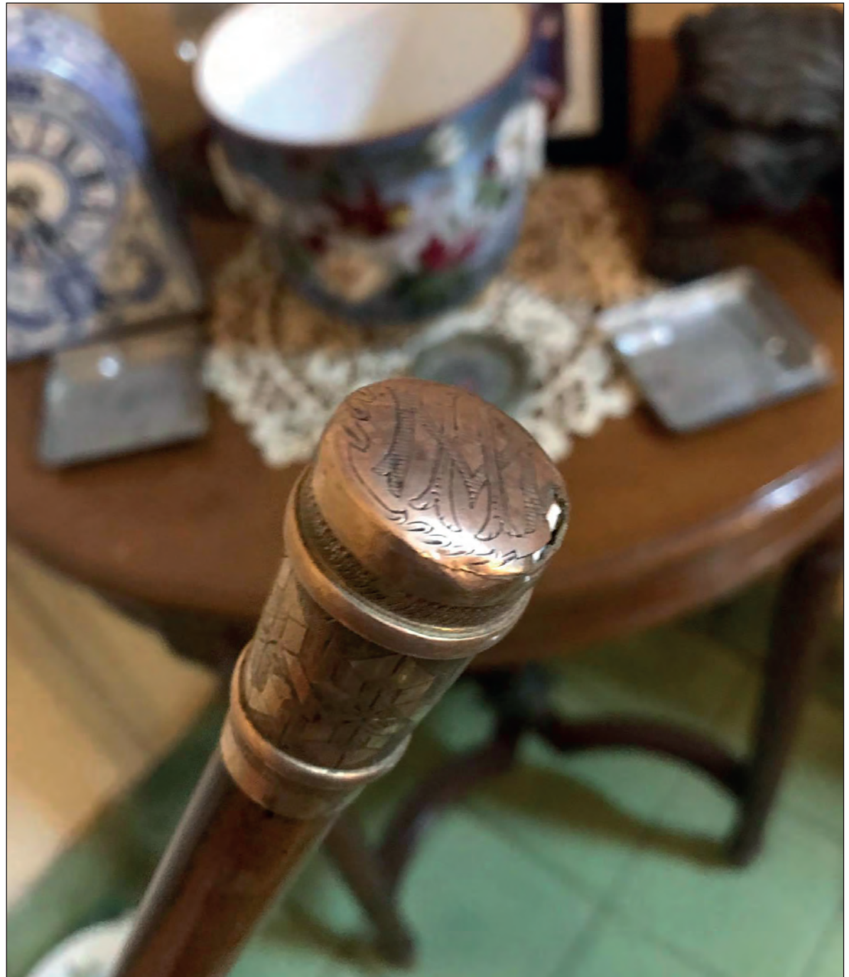
▲ Al regresar otra noche, ahí en las bastoneras, en medio de la hermosa colección de bastones del abuelo, estaban el romano y el del puño de oro, en Art Deco, con mi monograma.