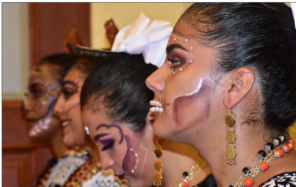
▲ Parte esencial del evento es formar parte de la escenografía, con las catrinas.

El motivo de la cancelación es la pandemia, que aún no está erradicada. El sector turismo dejará de percibir durante esos días al menos 35 millones de pesos, pues dicha eventualidad atrae a turismo nacional y extranjero.