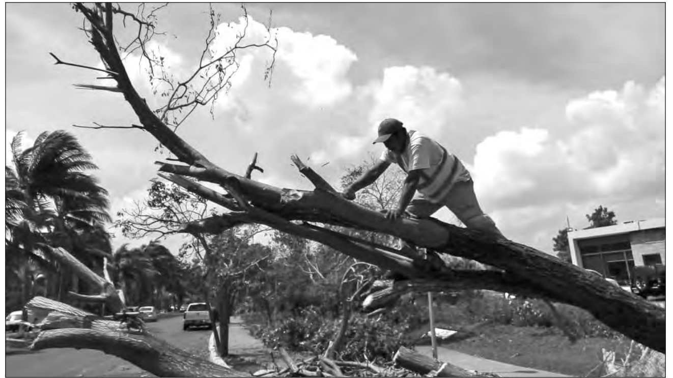
▲ En la zona hotelera de Cancún, cayeron 151 árboles monumentales.

En entrevista telefónica, Bermúdez Arreola destacó que las labores de limpieza y rehabilitación del bulevar Kukulcán llevan 70 por ciento de avance; la prioridad fue dar vialidad y apoyar las zonas inundadas y ahora trabajan en corte de árboles caídos y acopio de basura vegetal.