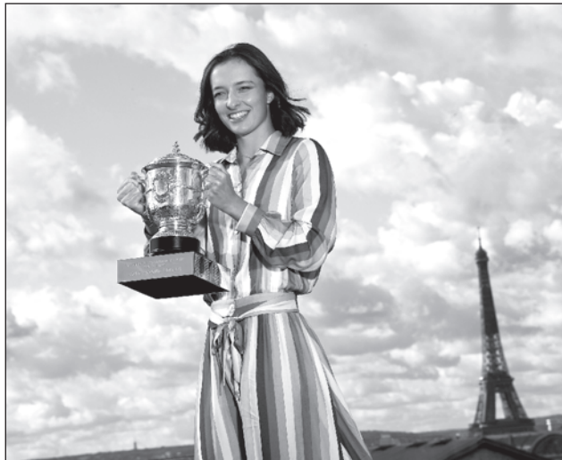
▲ Iga Swiatek, la nueva reina del Abierto de Francia.

Zarazúa, quien ya se colocó entre las mejores 150 del planeta (149) tras escalar 29 lugares, le ganó un set 6-0 a Svitolina, tercera sembrada y semifinalista en Yucatán, antes de caer ante la ucraniana. “Eso habla muy bien de ella, es una chica que va en ascenso”, indicó Fundunklian a La Jor-