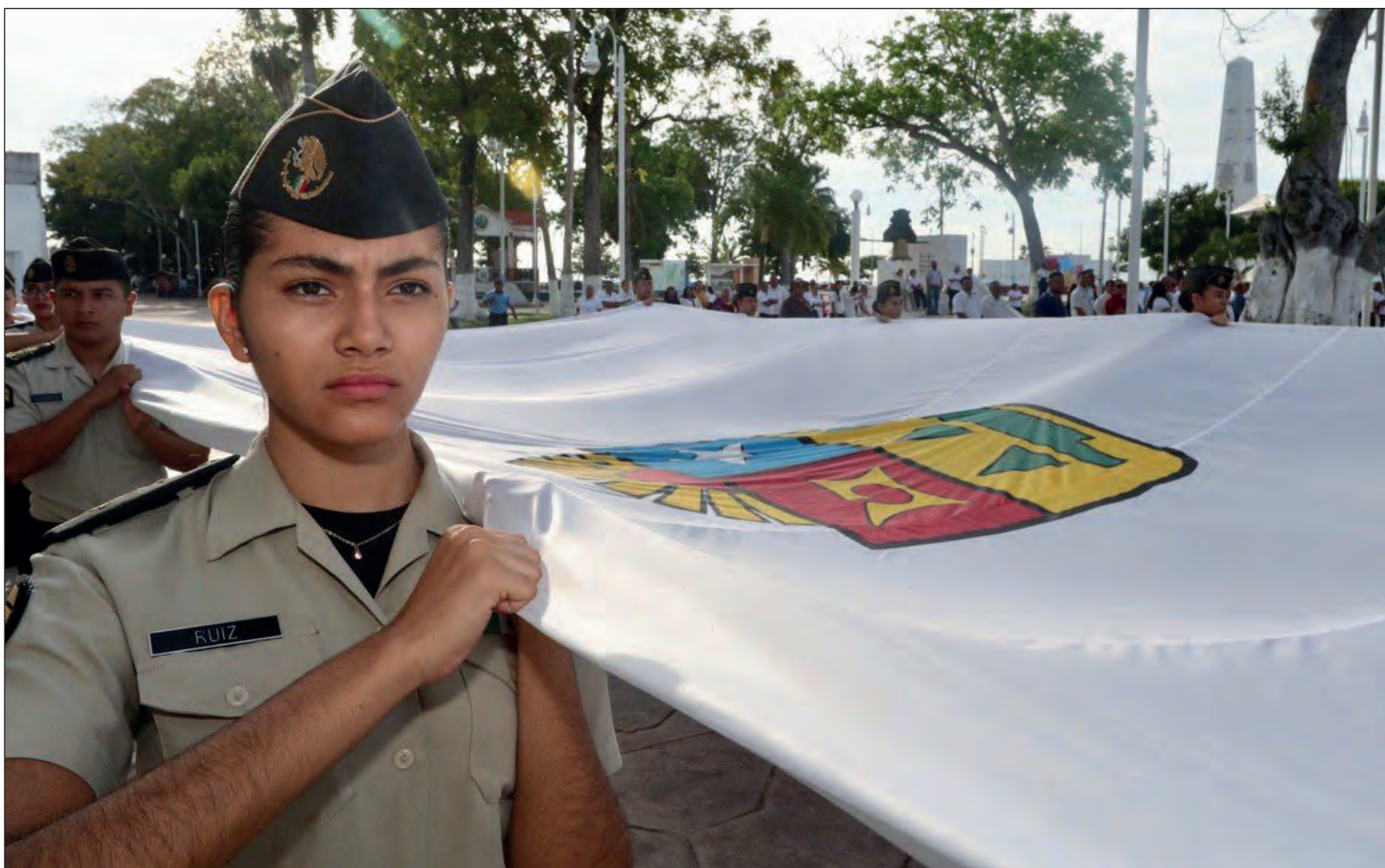
▲ Cuando el 8 de octubre de 1974 se decretó la creación de Quintana Roo como estado, la composición geográfica y poblacional era casi 180 grados diferente a la de hoy.