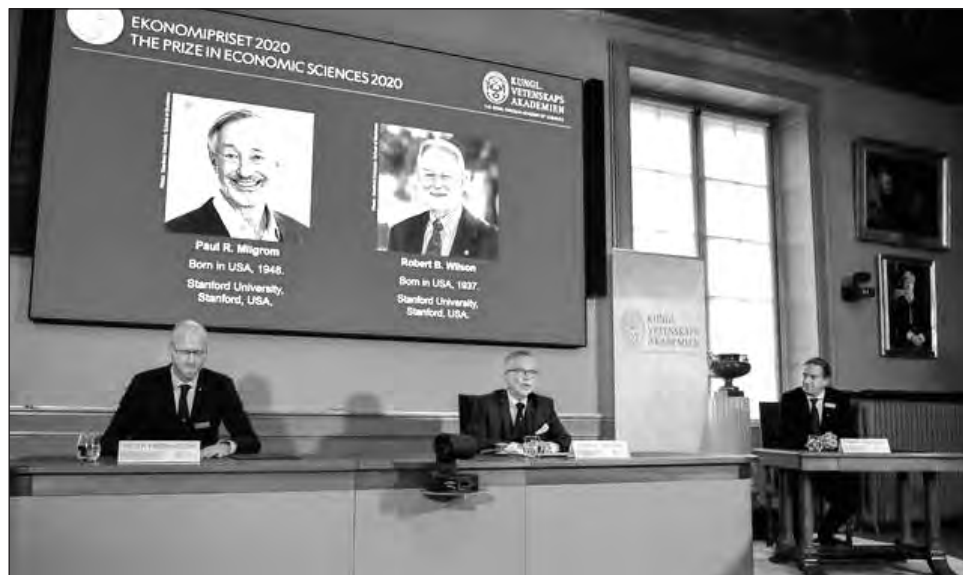
▲ Paul Milgrom y Robert Wilson idearon formatos para vender artículos interrelacionados simultáneamente, en beneficio de vendedores, compradores y contribuyentes.

Milgrom y Wilson idearon formatos para vender artículos interrelacionados