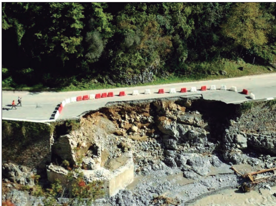
▲ Entre 2000 y 2019 se registraron siete mil 348 desastres naturales en el mundo.

Los costos de las catástrofes naturales son evaluados en al menos tres billones de dólares desde 2000 pero el monto real es más elevado porque muchos países, especialmente en África u Asia, no brindan informaciones sobre el impacto económico.