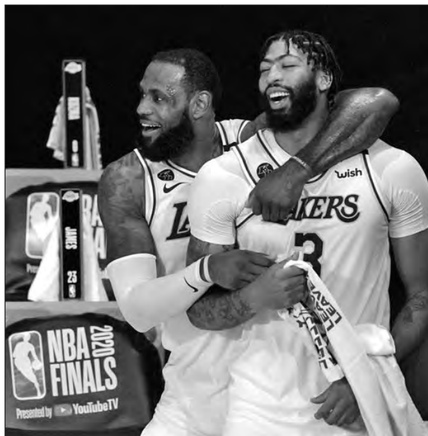
▲ LeBron James y Anthony Davis, artífices del título de los Lakers.

El domingo, tras una dominante victoria ante el Heat de Miami en el sexto partido de las finales, empataron a los Celtics de Boston como los máximos ganadores en la historia del