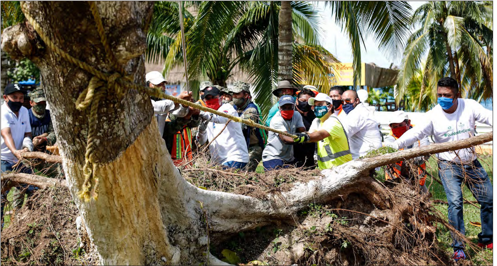
▲ La Coordinación Nacional de Protección Civil emitió este lunes Declaratoria de Emergencia para seis municipios del norte del estado: Cozumel, Puerto Morelos, Solidaridad, Benito Juárez, Isla Mujeres y Lázaro Cárdenas.