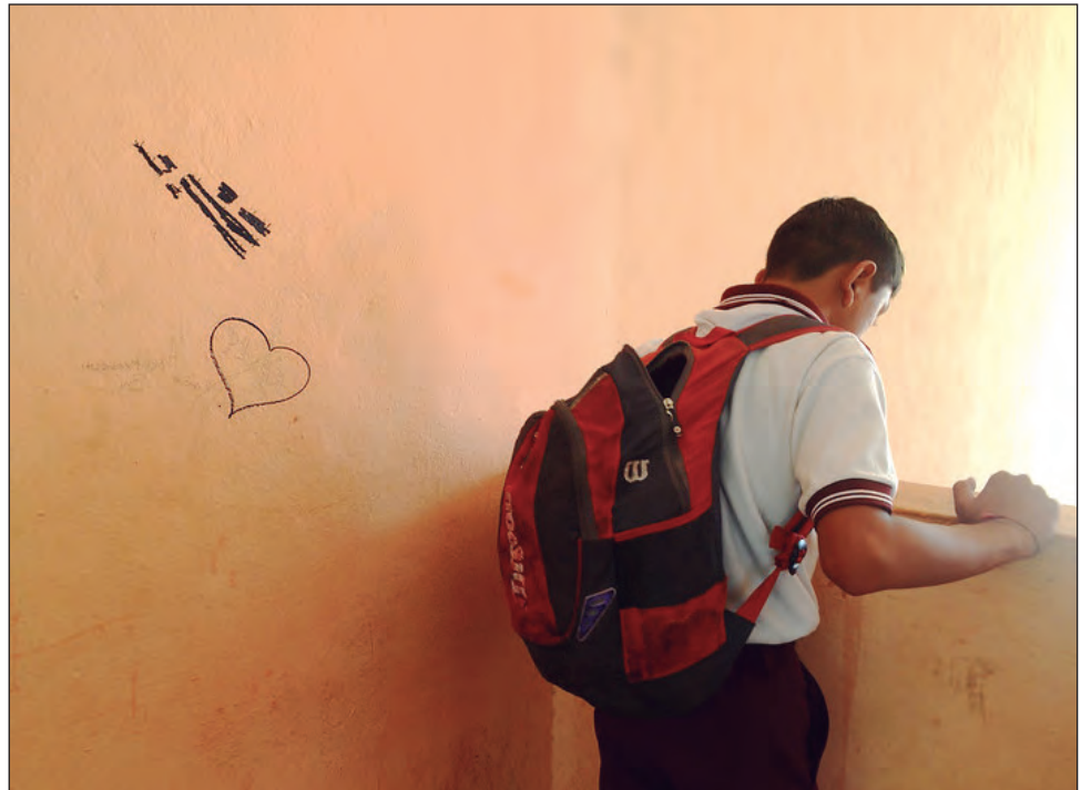
▲ Para la Cdhegroo, el veto parental lesiona el derecho a la educación y a la accesibilidad de la salud integral en sus dimensiones de información y no discriminación.

“Favorece a la obstaculización del derecho a la salud y desarrollo integral, incluida la sexual y reproductiva y la información para prevenir y atender la violencia de género en sus dimensiones de información y no discriminación; tendría un impacto negativo en algunas problemáticas como la detección oportuna del abuso sexual infantil y violencia de género”, precisó