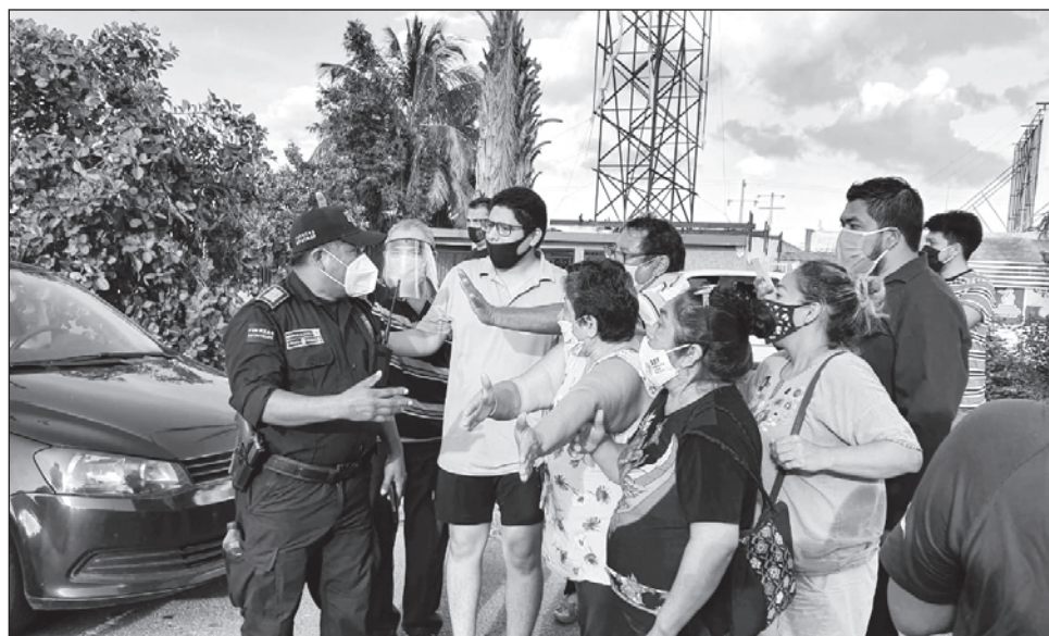
▲ A las puertas de la constructora, vecinos de Las Américas reclamaban acceso a la reunión con funcionarios municipales y Grupo Sadasi.

Agregó que habían acordado fumigar todo el fraccionamiento y sólo lo hicieron en algunas partes.