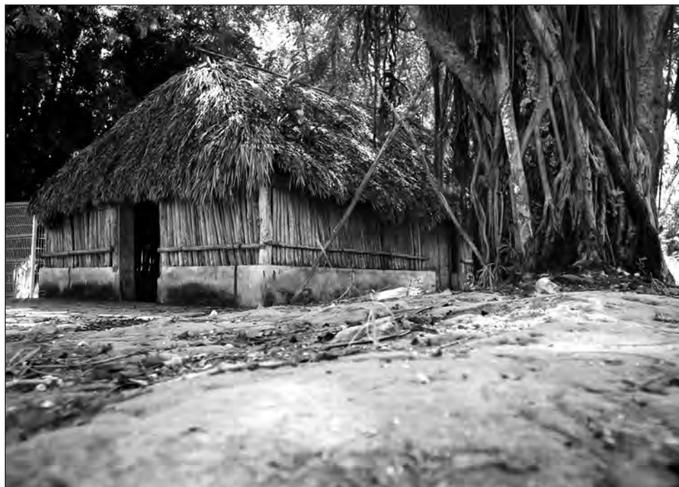
▲ En estas casas, al ser muy inclinadas, el agua resbala rápidamente, por lo que el costo de mantenimiento es mucho menor.

influye la orientación de las viviendas con respecto a los vientos, de modo que éstos no sean tan severos. En la parte inicial de la construcción, estas casas se forman por cuatro horcones de gran tamaño que sostienen la es-