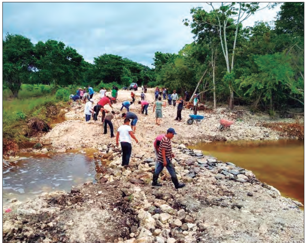
▲ Habitantes de las comunidades Río Verde y Miguel Alemán, en Bacalar, repararon el camino que las comunica con la cabecera municipal. Los arreglos permitirán la circulación de vehículos por la zona, aunque son provisionales. Ambos poblados fueron los más afectados primero por los escurrimientos de Cristóbal y luego por la tormenta tropical Gamma.