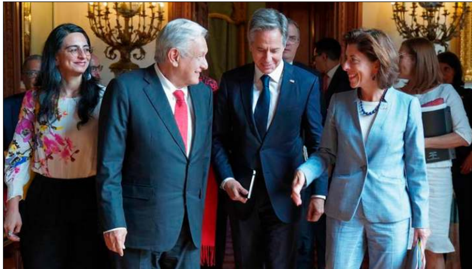
▲ Según publicó en redes el presidente López Obrador, la reunión con los secretarios estadounidenses Antony Blinken y Gina Raimondo fue "productiva y amistosa".

Luego de la reunión a puerta cerrada que se realizó