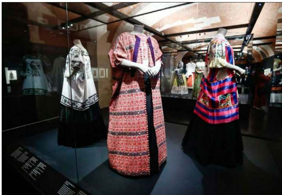
▲ La muestra Frida Kahlo, más allá de los clichés exhibe más de 200 objetos procedentes de la colección personal de la artista, descubierta en La Casa Azul en 2004.

Como toque propio, París añade a la muestra creaciones de grandes diseñadores contemporáneos como Alexander McQueen; Jean-Paul Gaultier; Chanel; Maria Grazia Chiuri, en Dior, o Riccardo Tisci, en Givenchy, que bebieron, directa o indirectamente, de la inagotable fuente de estilo e inspiración que fue Frida Kahlo.