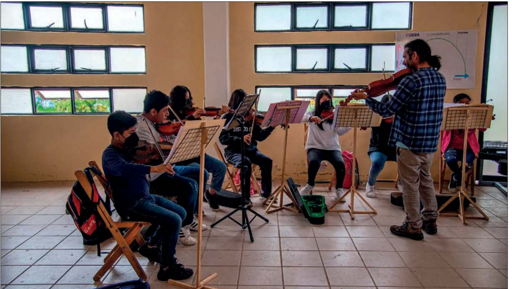
▲ En una de las zonas más conflictivas del sureste mexicano, jóvenes indígenas tzotziles con padres desplazados de sus comunidades, se unieron en una orquesta y un coro para romper la violencia.