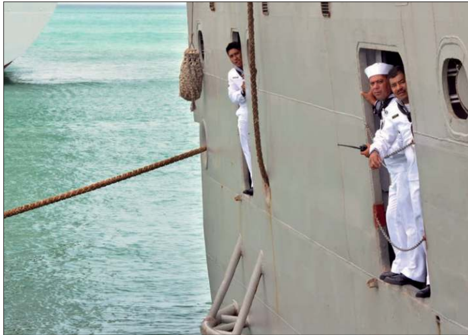
▲ La propuesta del regidor Vela Maga a es que la Marina tenga presencia permanente en la sonda de Campeche, para protecci n de pescadores y obreros. Foto Rodrigo D az Guzm n

“Es evidente la falta de presencia de los elementos