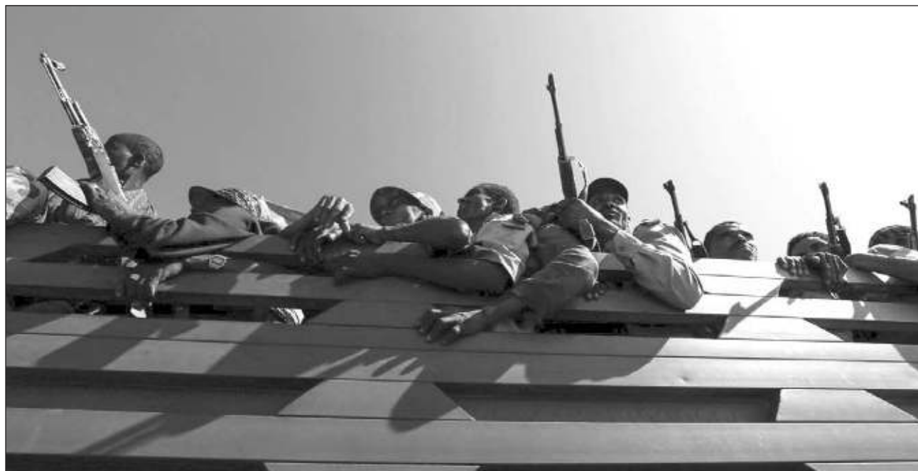
▲ Las autoridades de Tigray publicaron un comunicado el domingo por la noche tras nuevas presiones de Estados Unidos y otros países y organizaciones, después de que los combates se reanudaran el mes pasado y rompieran meses de calma relativa.

Las autoridades en Tigray habían criticado los esfuerzos de mediación de la UA di-