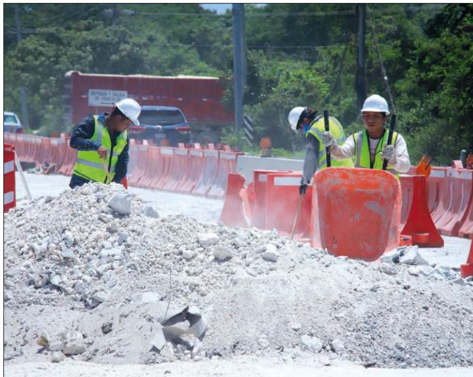
▲ Los sindicatos trabajan ahora en la mejora de salarios para nivelar lo que se percibe contra la inflación, que ha alcanzado niveles históricos.

En cuanto a los salarios, la legislación de hoy ayuda, en el sentido de que se acabaron los outsourcing y las pocas terciarias que hay están bien reguladas, lo que