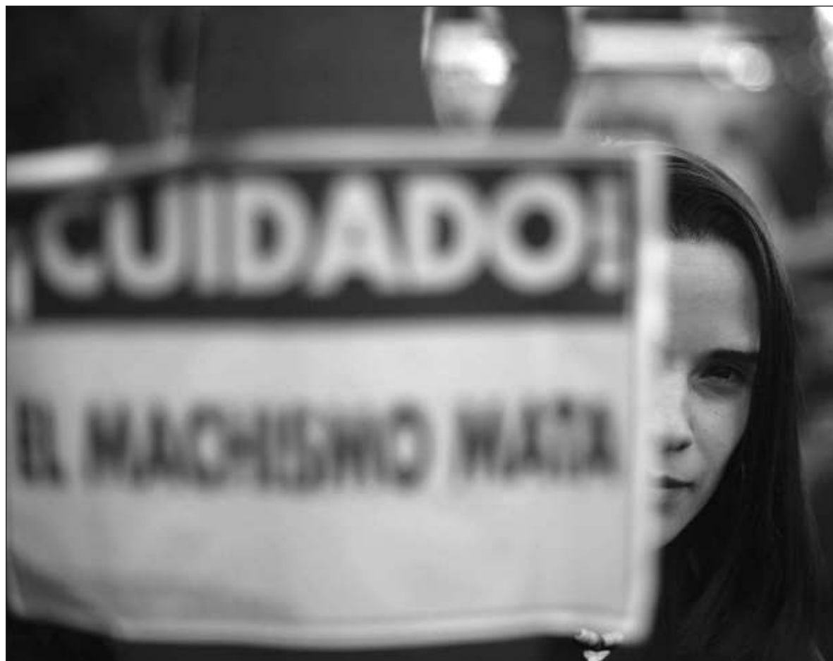
▲ “Lo que no se nombra no existe. Si lo que yo sufrí con un doble estrangulamiento por parte de mi ex novio no es un atentado contra mi vida entonces no soy una víctima... Es así como nos borran”.

A pesar de que un informe de una médica legista del Centro de Justicia para Mujeres indica que yo tenía lesiones en el cuello producto de un estrangulamiento, Villanueva Segura consideró que mi agresor no quería acabar con mi vida y yo es-