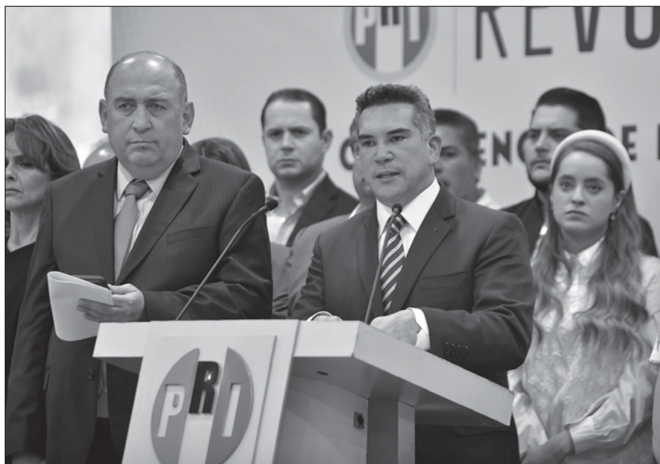
▲ En rueda de prensa, acompañado por diputados de su partido, entre ellos Yolanda de la Torre, quien presentó la iniciativa para mantener al Ejército en tareas de seguridad pública, Alejandro Moreno aseguró que el PRI “tiene visión de Estado”.

En conferencia de prensa, en compañía de la