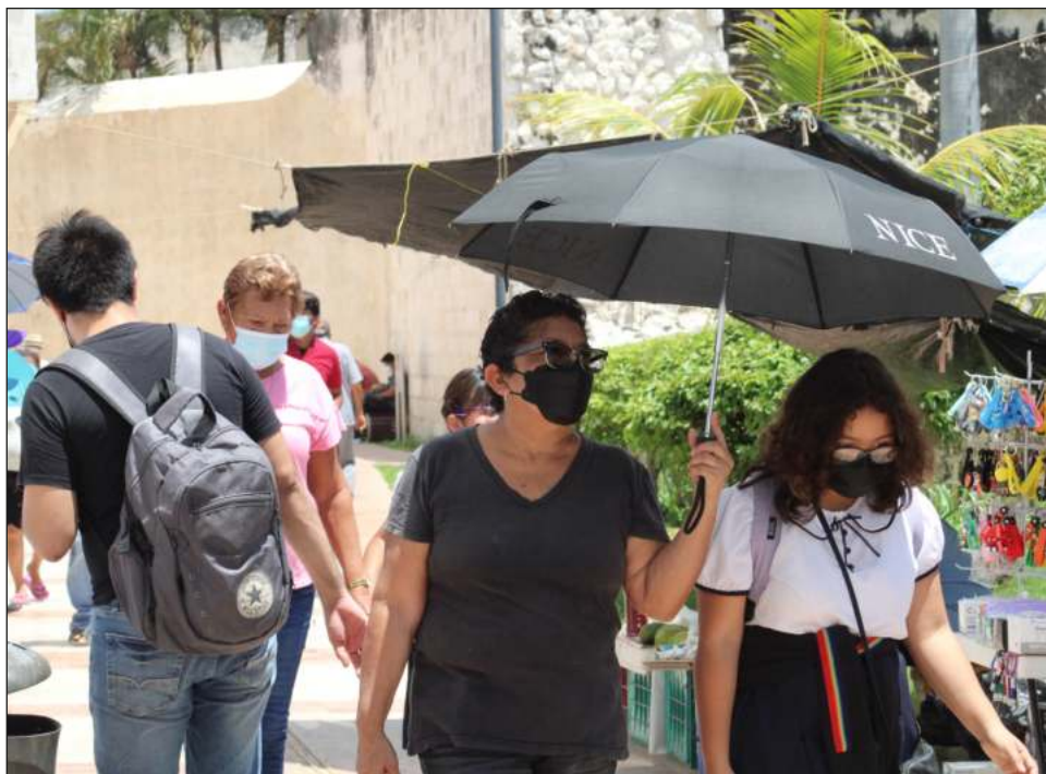
▲ De los casos activos, 267 están estables, aislados y con síntomas leves.

Como ya se mencionó, 13 de los casos positivos están en hospitales públicos y en aislamiento total. Hay otros pacientes a la espera de diagnóstico.