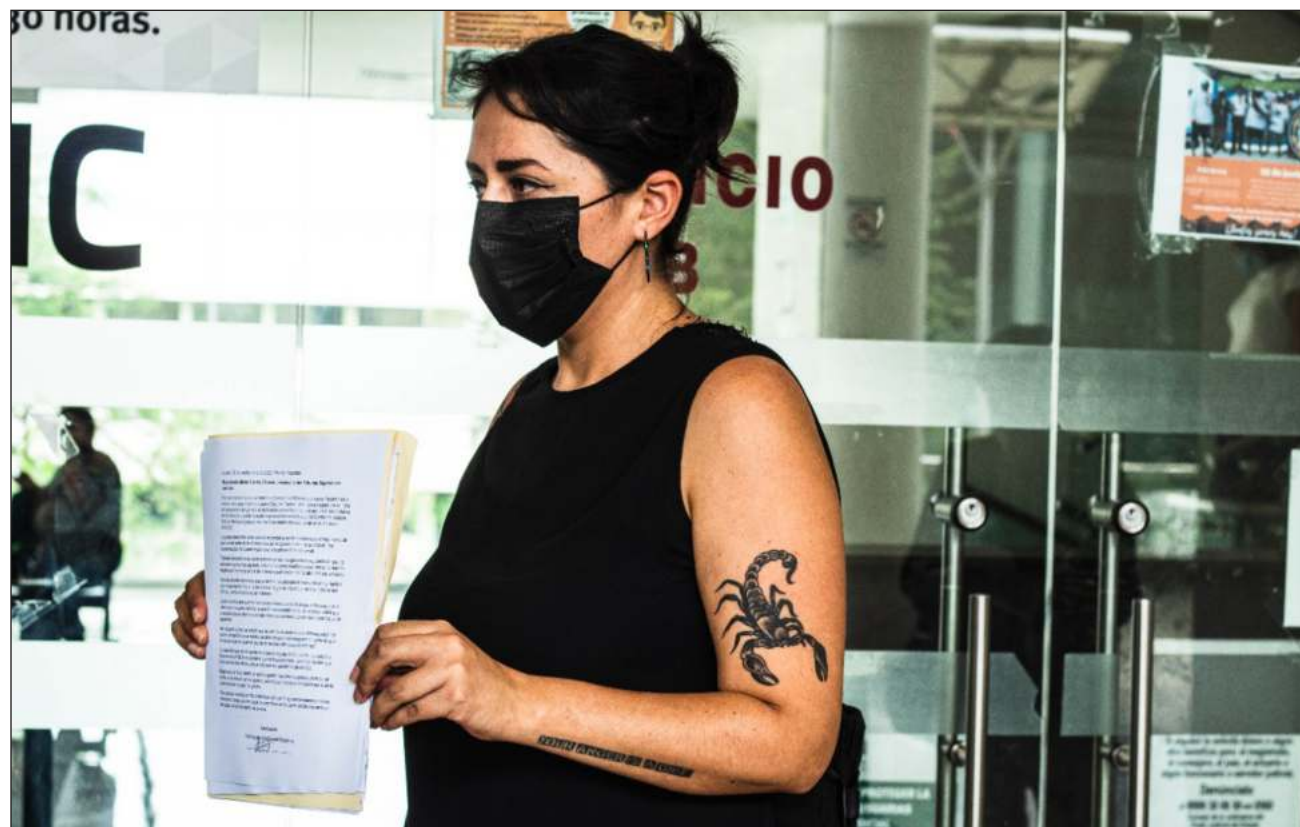
▲ “La jueza desestimó la acusación de tentativa de feminicidio bajo el argumento de que yo mal entendí las intenciones de mi agresor, quien me ahorcó en dos ocasiones por no querer seguir una relación sentimental con él”, señala la sobreviviente.

“La jueza desestimó la acusación de tentativa de feminicidio bajo el argumento de que yo mal entendí las intenciones de mi agresor, quien me ahorcó en dos ocasiones por no querer seguir una relación sentimental con él [...] menciona que yo estaba tan alterada al momento de los hechos que mi percepción fue errónea porque, según la juzgadora, no