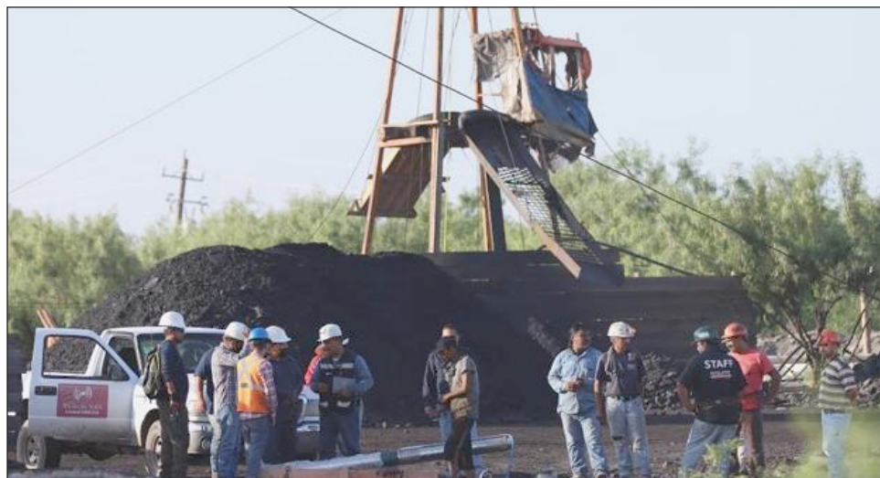
▲ La compañía de Germán Larrea señala que Buenavista "actualmente produce 60 por ciento del cobre de México"; esta misma mina vertió 40 millones de litros de solución de sulfato de cobre acidulado en los ríos Bacanuchi y Sonora, siendo uno de los mayores desastres mineros en el país.

nueve proyectos mineros más grandes del mundo, con excepción de los chinos, dice el informe de la dependencia, se encuentra Buenavista, una mina con una capacidad de 80 mil toneladas anuales y que pertenece a Grupo México.