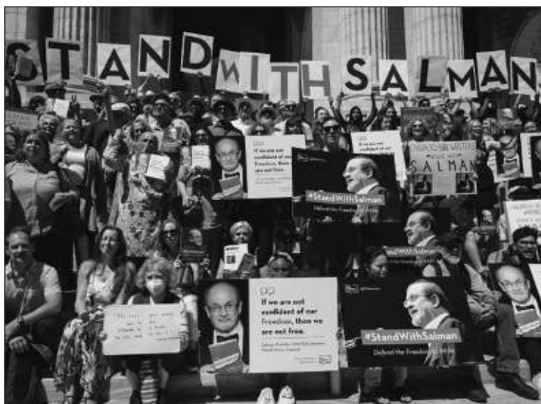
▲ "Journalism and writing have always been two dangerous professions but now even more so, and the international community can do little".

IN SOME WAYS, they can't. How do you sanction ISIS that operates outside of the global community and depends on violence as a strategy of power? How do you