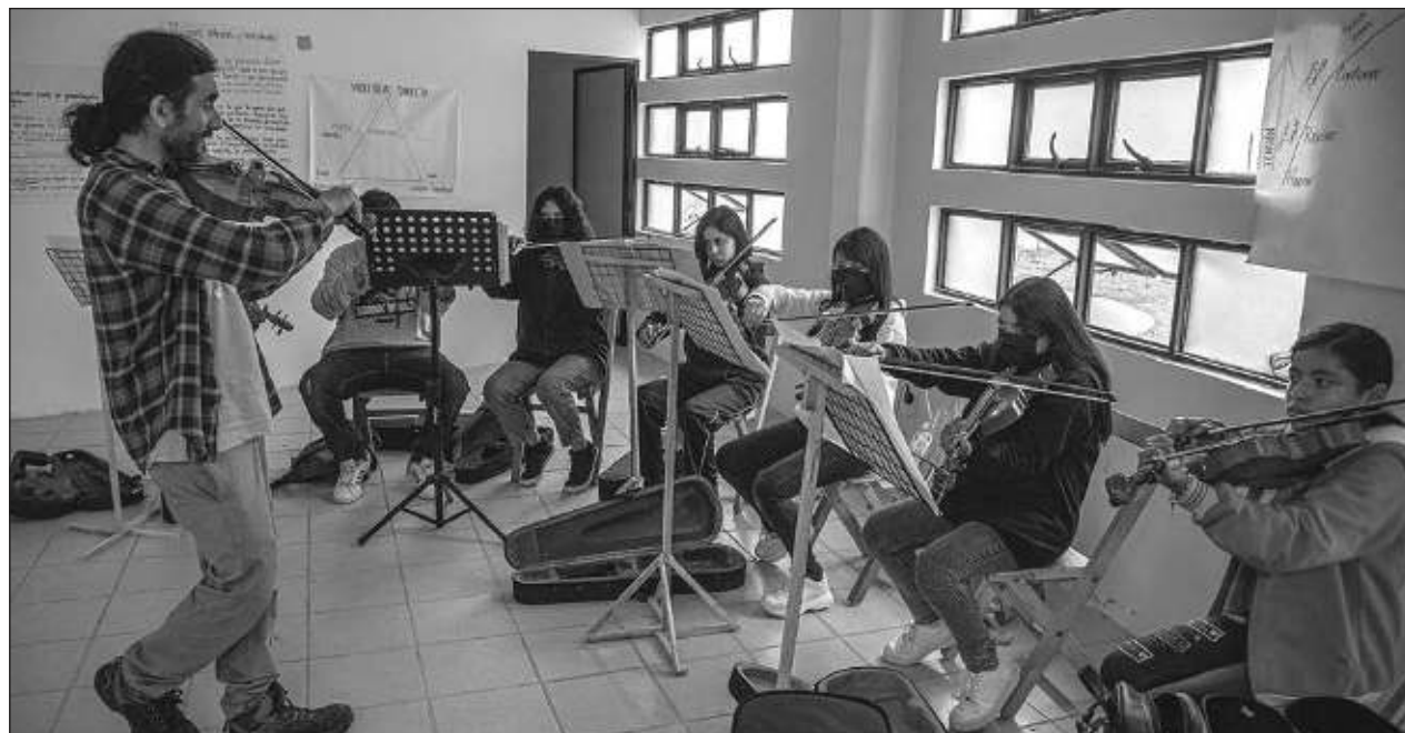
▲ El coro y la sinfónica Por la paz de la zona norte reactivó espacios culturales en San Cristóbal de las Casas.

“Por ello la participación ciudadana es fundamental para erradicar la violencia, ayudar al orden social y salvaguardar a la niñez y juventud”, concluyó el especialista en seguridad social que ha estudiado la problemática de esta zona.