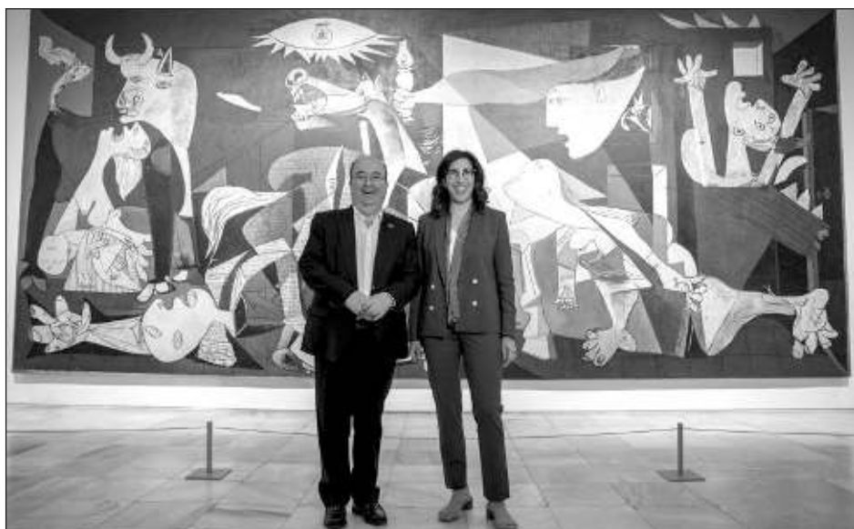
▲ Francia y España organizarán más de 40 exposiciones y conferencias en varios museos de Madrid, París, Barcelona, Málaga y otras ciudades de Europa y América en los próximos 12 meses.