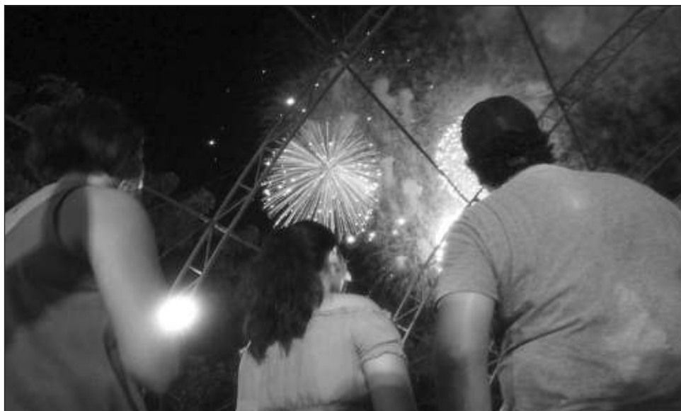
▲ El espectáculo de pirotecnia está asegurado para después de la ceremonia.

Las autoridades invitan a la población a participar e