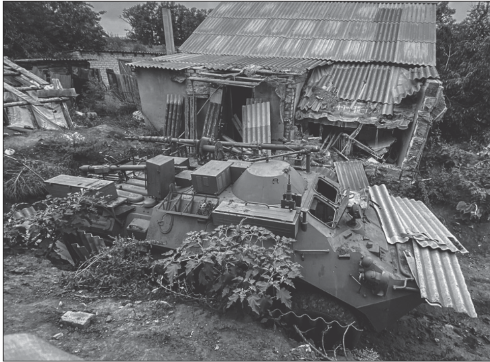
▲ El avance de las tropas ucranianas hace revivir las esperanzas de Kiev de un punto de inflexión en el conflicto, tras un largo período en el que el frente parecía estancado.

En toda la línea del frente, “las fuerzas ucranianas han logrado expulsar al enemigo de más de 20 localidades” en 24 horas, añadió, asegurando que “las tropas rusas están abandonando apresuradamente sus posiciones y huyendo”.