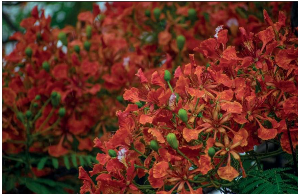
▲ "Un daltónico puede distinguir el rojo, amarillo y verde de un semáforo, o los colores de la bandera nacional, pero puede serle difícil diferenciar tonos de verde en algunos objetos o plantas".

Cuando estaba en secundaria, mi papá me acompañó con el oculista, porque yo tenía rojos los ojos. El doctor me examinó y me encontró bien,