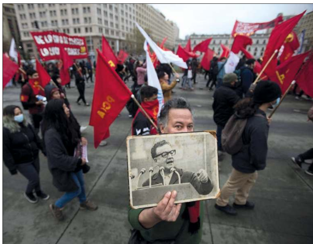
▲ Los sucesos en Santiago de Chile no fueron un episodio aislado. La continuidad de la política represiva emprendida por gobiernos anteriores es palpable en la administración de Gabriel Boric.

Tanto en las calles de Santiago de Chile como en los territorios del sur, donde el descontento histórico de la nación mapuche ha alcanzado niveles de rebelión, ese deslinde sigue sin presentarse y las autoridades siguen respondiendo a los malestares sociales con la fórmula de la dictadura y de los gobiernos formalmente democráticos que la sucedieron: la represión. Y ello lleva a una pregunta dolorosa: ¿es que en Chile no ha cambiado nada?