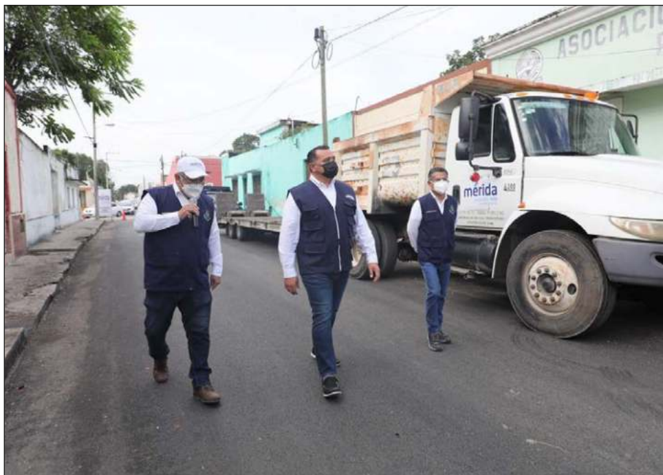
▲ El alcalde supervisó la rehabilitación de la calle 44 entre 65 y 67 de la colonia Centro, junto con los directores de Obras Públicas y Servicios Municipales.

Finalmente, se han atendido 23 mil 4 reportes ciudadanos recibidos, de los cuales 21 mil 979 ya fueron atendidos, equivalente a un 95.5% de avance.