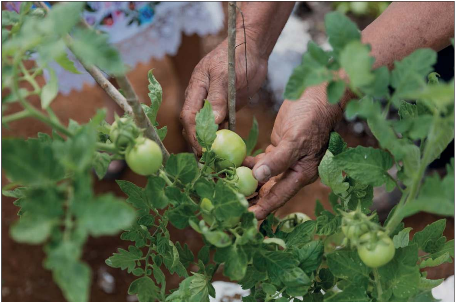
▲ "Desde la SOMEXA estamos trabajando para que con el cambio del gobierno en Quintana Roo y mejores condiciones institucionales, se haga el planteamiento de llevar a cabo un Congreso Estatal e impulsar un Programa Estatal de Posgrado en Agroecología".