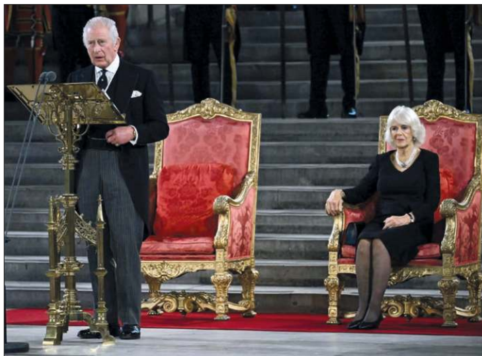
▲ En la ceremonia celebrada en Westminster Hall, el nuevo rey también rindió homenaje al Parlamento como "el instrumento vivo y palpitable de nuestra democracia".

"Al presentarme hoy ante ustedes, no puedo evitar sentir el peso de la historia que nos rodea, y que nos recuerda las vitales tradiciones parlamentarias, a las que los miembros de ambas Cámaras se dedican con tanto compromiso personal para la mejora de todos nosotros".