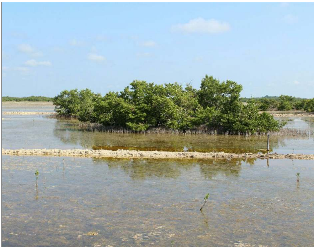
▲ Llaman a reconocer el daño que ha hecho la industrialización al estado de ríos, manglares y acuíferos.

Asimismo planteó hacer una declaración pública, para reclamar al gobierno de Estados Unidos, el país que tiene al mismo tiempo la mayor deuda histórica de emisiones de gases que dañan el clima, los más altos consumos individuales o per cápita promedio de combustibles, "su muy pobre compromiso con los asuntos de la emergencia climática y ecológica global y las falsas soluciones a estos predicamentos que ha impulsado para simular que hace algo frente a la alteración climática".