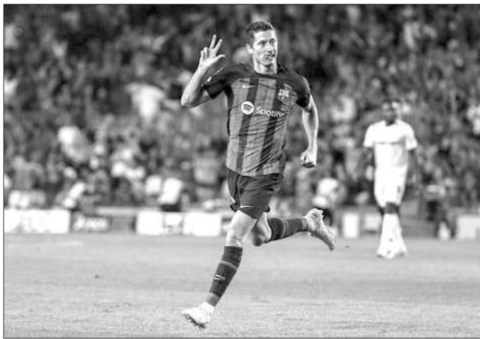
▲ Robert Lewandowski y el Barcelona se enfrentan hoy al Bayern Múnich.

Lewandowski también se encuentra en gran forma e ingresó de cambio para anotar su sexto gol en cinco juegos de la liga española en el triunfo 4-0 del Barcelona ante el Cádiz el sábado. El delantero polaco sólo no marcó en su debut —ante el Rayo Vallecano— desde que demandó al Bayern que lo enviarán al Barcelona este verano. Lewan-