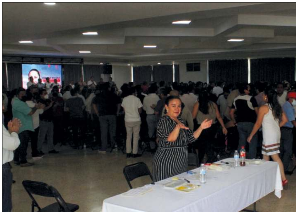
▲ La gobernadora de Campeche, Layda Sansores, y su gabinete participaron en una reunión a puerta cerrada para brindar apoyo a la actual jefa de gobierno de CDMX.

Además hace un par de semanas también llegó a un evento convocado y pagado