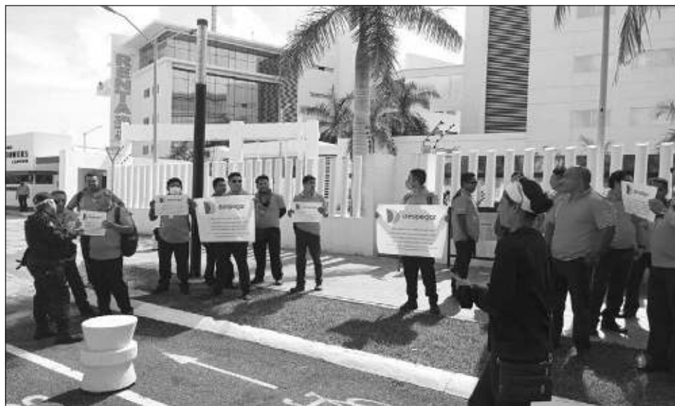
▲ La manifestación de los operadores se replicó en la ciudad de Playa del Carmen y en el encierro de vehículos ubicado en el ejido de Alfredo V. Bonfil.

“Hemos hablado con él, quisimos dialogar para no pasar la autoridad del jefe, pero no ha habido una solución, dijo que iba a haber