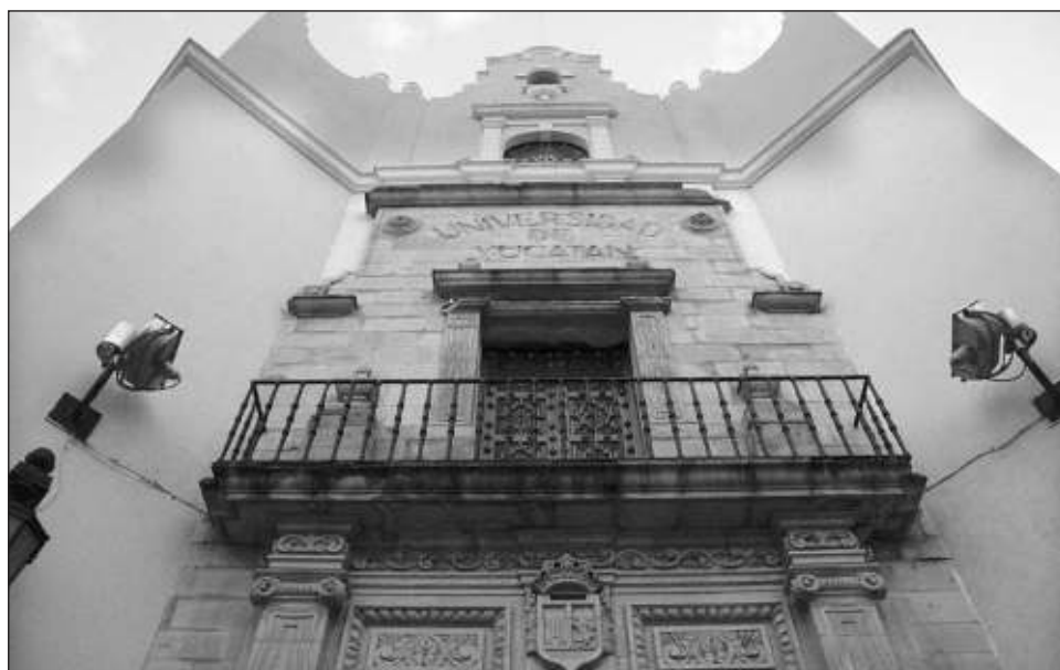
▲ Especialistas internos y externos a la institución educativa de Yucatán se encuentran apoyando a la comisión para evaluar el documento y proponer cuál debería ser la versión final.

José de Jesús explicó que actualmente dicha propuesta está siendo analizada por la Comisión Permanente Legislativa, para luego hacer el dictamen correspondiente. “Esperamos