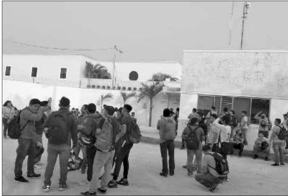
▲ La plantilla advierte que habría otra huelga en puerta.

Según el entrevistado —quien solicitó el anonimato— han sido diversas represalias las que han sufrido quienes levantaron la voz. Tampoco han atendido a la gente del sindicato que se ha