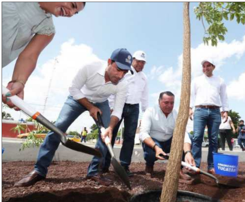
▲ Sembrarán más de mil 500 árboles, serán de las especies chakté, balché, campanita, anacahuita, chacsinkín, pasak, chaká, ciricote, cedro y maculis rosa.

Por otro lado, los autobuses generan cero emisiones de carbono y miden 12 metros de largo; cuentan con 11 cámaras para visión 360 grados y cinco internas para mayor seguridad; baterías modulares, diseñadas para adecuarse a varias necesidades; aire acondicionado especial para vehículos eléctricos; control para regular la velocidad; cargadores USB, y geolocalizador.