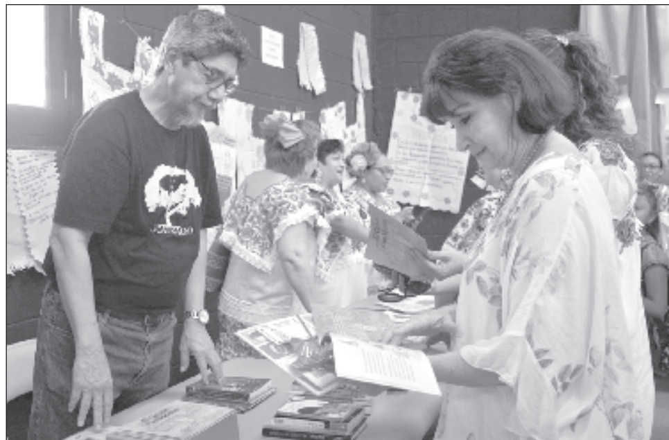
▲ En el ensayódromo del Centro Cultural La Ibérica se congregaron integrantes del Colectivo Entre cuentos nos leemos y librerías independientes.

"Hoy es un día especial, pues celebramos el 20 Aniversario del Programa Nacional de Salas de Lectura, siempre buscamos crear espacios sanos de convivencia a través de la lectura, del diálogo, como una forma de estimular la re-