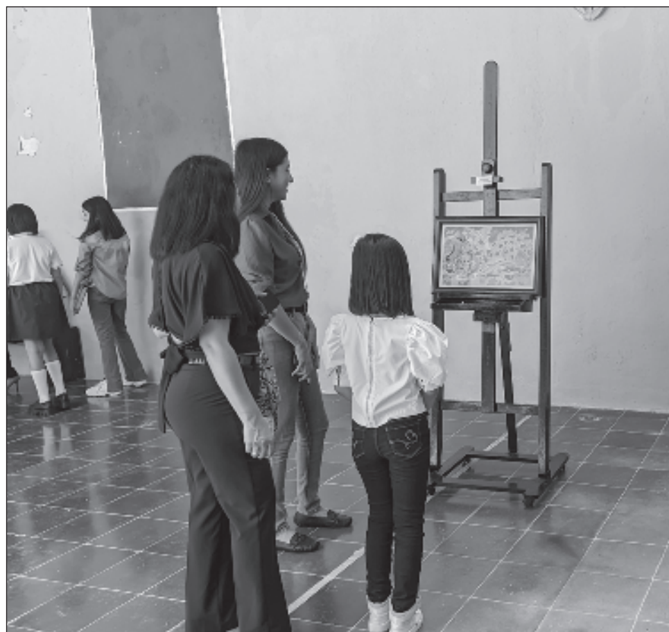
▲ Los artistas explicaron su sentido de pertenencia y orgullo hacia su entorno cultural, así como apreciación de las tradiciones y costumbres de las comunidades donde habitan.

Premiaron a seis ganadores y tres menciones honoríficas de las categorías A (6 a 9 años) y B (10 a 12 años),