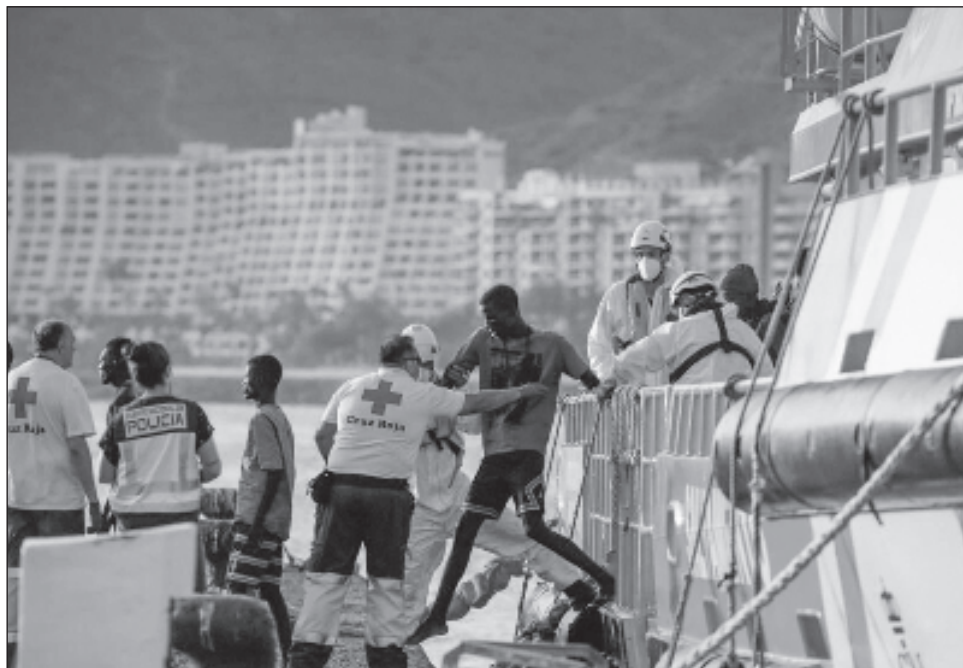
▲ Salvamento Marítimo socorrió el lunes a 78 migrantes de una precaria embarcación. Según Caminando Fronteras, no se trataba de ninguno de los tres barcos desaparecidos.

Dada la amplitud de esta zona cercana al archipiélago