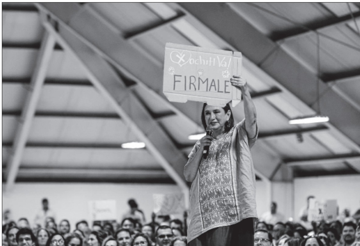
▲ “No dudamos que con el transcurso de las semanas Xóchitl vaya evolucionando de una narrativa romántica hacia algo más ideológico, programático y realista. Presentará entonces al equipo que la acompañará”.

No dudamos que con el transcurso de las semanas Xóchitl vaya evolucionando de una narrativa romántica hacia algo más ideológico, programático y realista. Presentará entonces al equipo que la acompañará en su aventura por la presidencial de 2024. Si decide rodearse por la vieja clase política opositora a la 4T pocas serán sus chances. Gente como Alito Moreno y los Chuchos del PRD poco o nada aportarán a sus proyectos y campaña. En el PAN se debaten aún si deben apoyarla o decan-