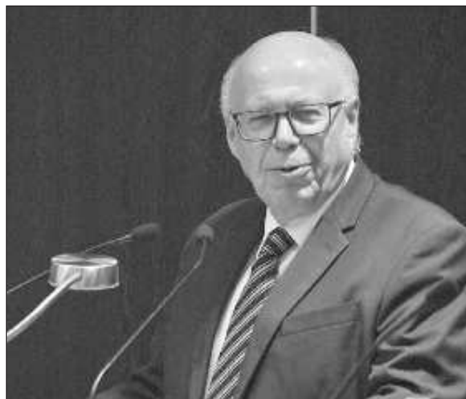
▲ La inclusión del ex rector priista José Narro Robles no debería ser motivo para formarse una primera impresión desfavorable sobre la nueva agrupación Mexicolectivo.

EL EDITORIAL DEL martes en La Jornada dijo algo que tenía que decirse: la revuelta de Chilpancingo contó con el apoyo de la base social. La gente salió a la calle para proteger a presuntos mafiosos. Se ganan a las comunidades dando empleos bien pagados y haciendo obras sociales. Esta situación se ha visto en Sinaloa y otras partes de la República.