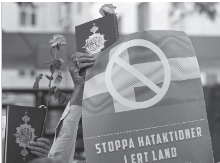
▲ La resolución fue adoptada tras un debate urgente solicitado por Pakistán en nombre de varios países integrantes de la OCI tras la quema de un Corán en Suecia.

Los principales factores de inseguridad alimentaria -conflictos, contracción económica y catástrofes climáticas- y las recientes desigualdades se han convertido en una "nueva normalidad".