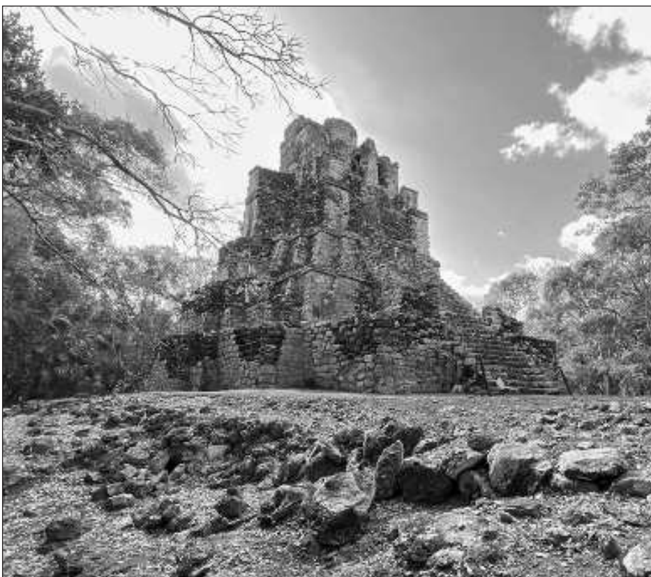
▲ De acuerdo con el delegado en Q. Roo del INAH, con el Programa de Mejoramiento de Zonas Arqueológicas, beneficiarán a las ruinas de Muyil.

Destacó que la cooperativa pesquera Vigía Chico realiza la pesca sustentable, ya que no capturan langostas con huevas o las que están pequeñas,