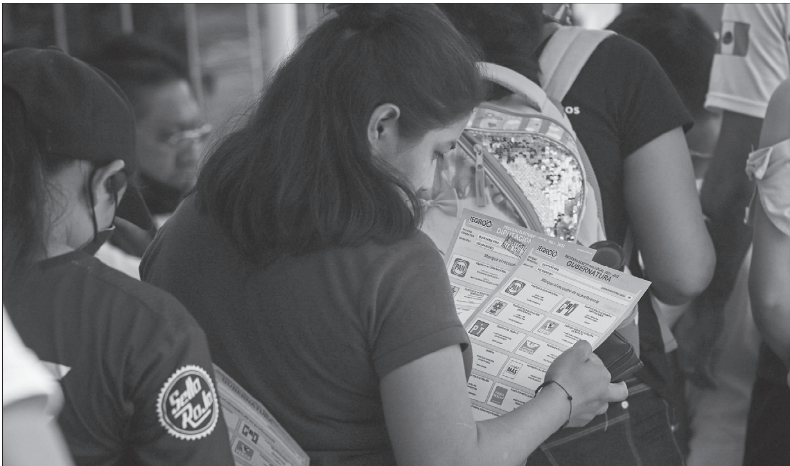
▲ “No hay nada novedoso en la oposición (...) es imposible obtener resultados diferentes en procesos electorales haciendo las mismas cosas”.