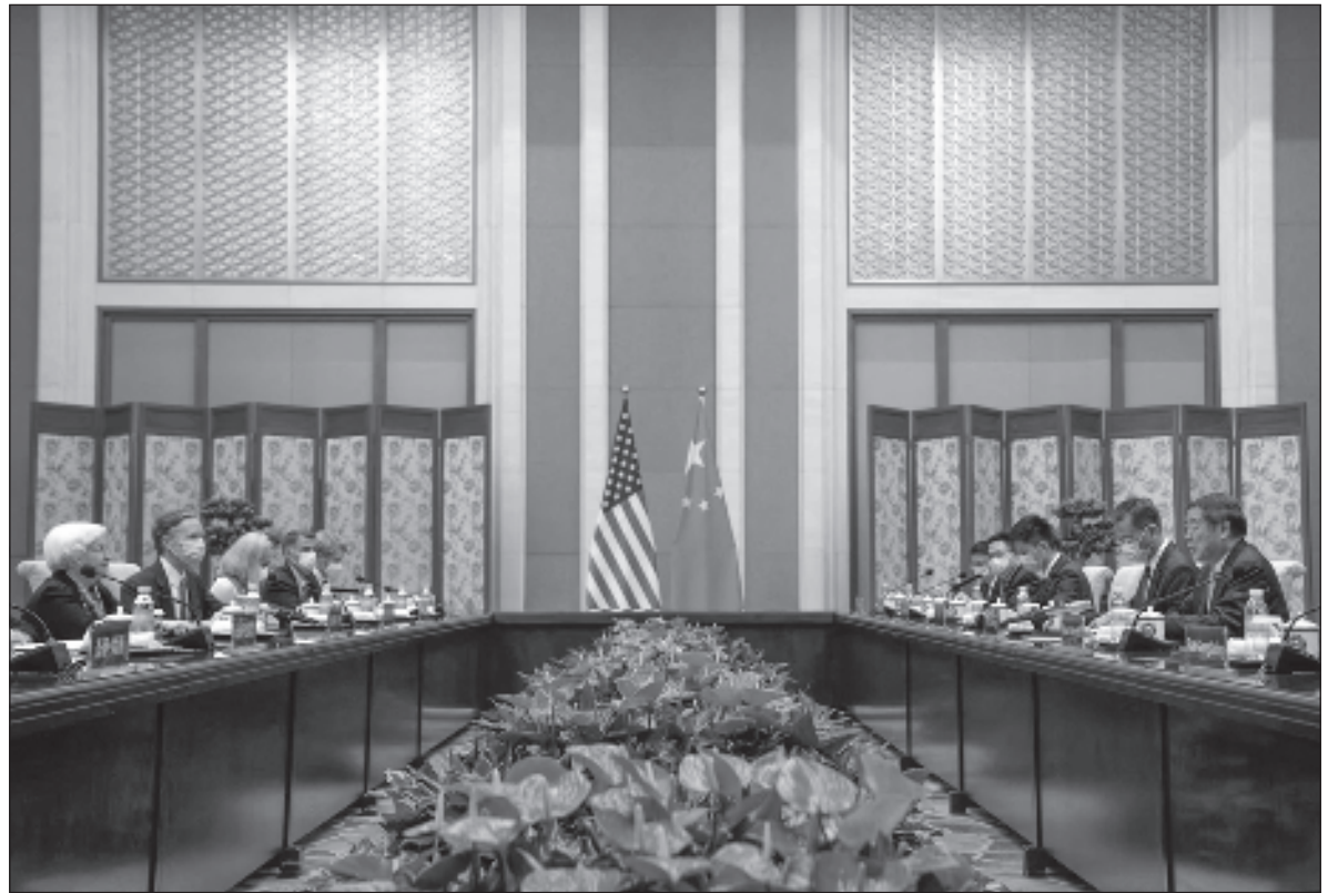
▲ "According to both sides, relations were at their lowest point since the establishment of diplomatic relations in 1979. Trying to paint one another into a corner appeared to be leading to greater confrontation".

ON THE U.S. side, concern over Chinese ambitions and actions has led to a nuclear submarine alliance between Australia, the U.S. the