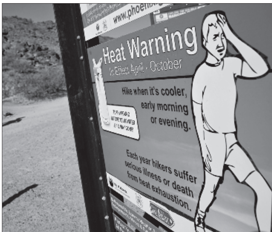
▲ El calor ha hecho que partes de Phoenix se sientan como un pueblo fantasma.

“Admitir un recuento que no está en la ley porque es ilegal, así lo mandara cualquier órgano supremo, jurisdiccional, es ilegal. Eso estaría penetrando en un terreno de ilegalidad y allí nosotros tendríamos que pensar si se cumple una orden ilegal”, reconoció la magistrada sobre el dilema que se plantearon los integrantes del tribunal electoral sobre si finalmente se hubieran visto presionados a desobedecer una orden de recuento voto a voto dado que no está contemplada en la ley.