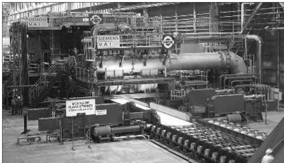
▲ López Obrador consideró que lo ideal sería que el acuerdo se pudiera dar antes que termine su mandato, pero insistió: "la verdad va a depender mucho de la actitud de él, de que ayude".

"Que el señor Ancira acepte entregar la empresa a otros inversionistas que quieren hacerse cargo. Pero el señor, no sé si mal aconsejado, aún con deudas cada vez mayores, no quiere llegar a ningún acuerdo. Han habido algunos empresarios que han querido llegar a acuerdos con él y no acepta firmar y decirles 'ahí está la empresa', y que los nuevos se hagan cargo de las deudas y que inviertan, que haya dinero fresco para echar a andar de nuevo esa empresa que es importantí-