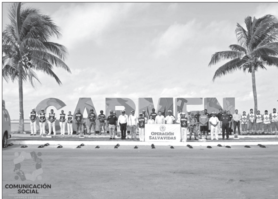
▲ La Secretaría de Marina está encargada del operativo, a la que se adhirió el gobierno municipal de Carmen a través de la Dirección de Protección Civil y Ordenamiento Vial.

tir de este miércoles y hasta el próximo 11 de agosto, con la finalidad de estar atentos ante cualquier emergencia durante la temporada vacacional.