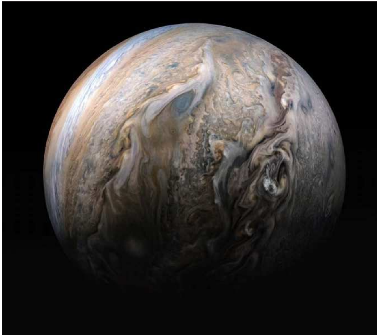
▲ Te'ela' óol chíika'an bix yanik tu yóok' kabil le nojoch wóoliso'.