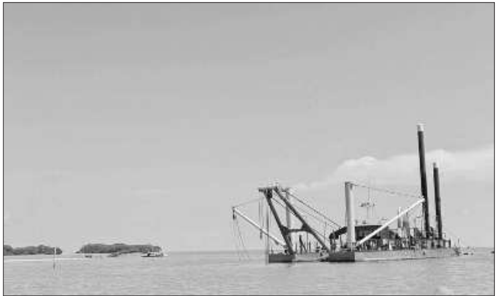
▲ El desazolve se desarrolla en tres etapas que van desde la desembocadura a la Laguna de Términos, hasta la capital del municipio.

En el tramo 1 extrajeron 165 mil metros cúbicos de azolve; en el tramo 2 se extraerán 433 mil metros cúbicos, y finalmente en el tercero, 56 mil metros cúbicos de lodo y sedimentos que se acumularon durante años.