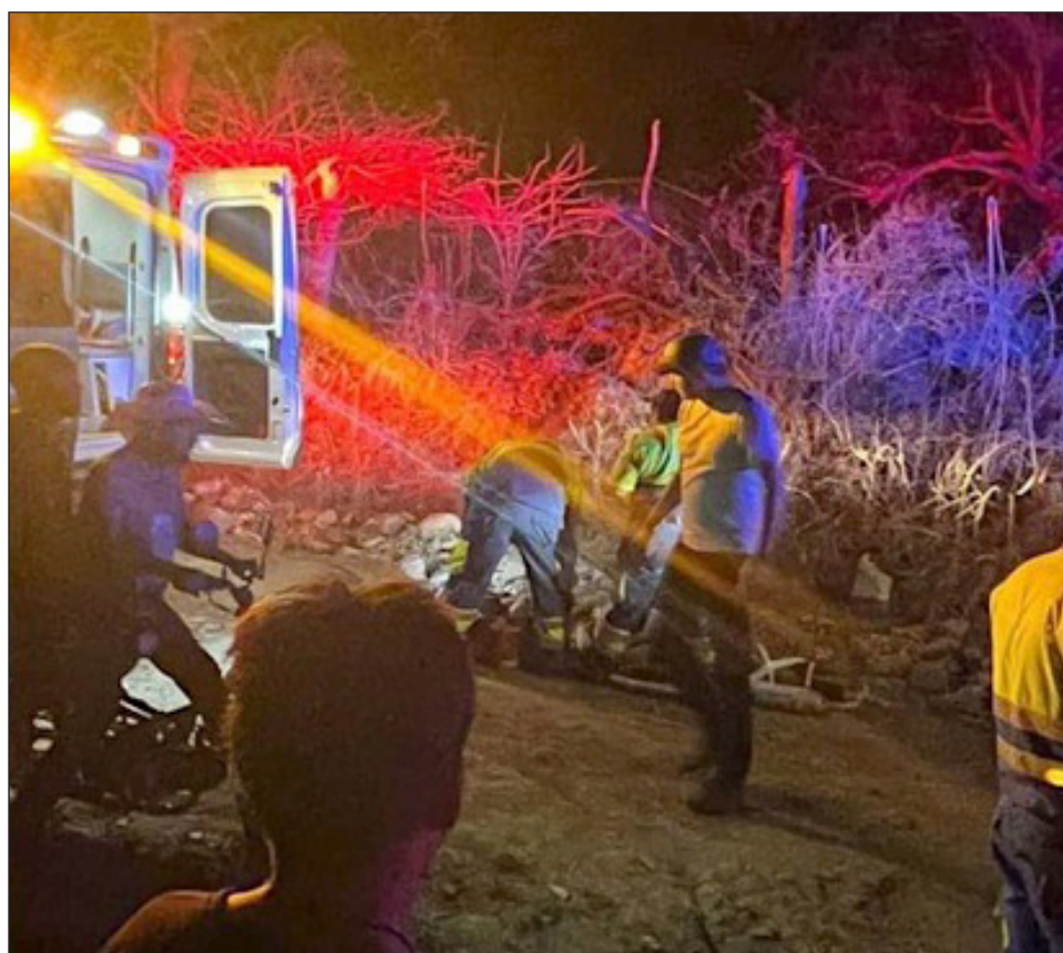
▲ El gobernador Enrique Alfaro calificó el ataque como “un desafío (de la delincuencia organizada contra el Estado mexicano en su conjunto)”.

El atentado se perpetró en la colonia Larios, en la zona centro de Tlajomulco, adonde un numeroso grupo de rescatistas y servicios médicos acudieron para trasladar a los lesionados, mientras personal del agru-