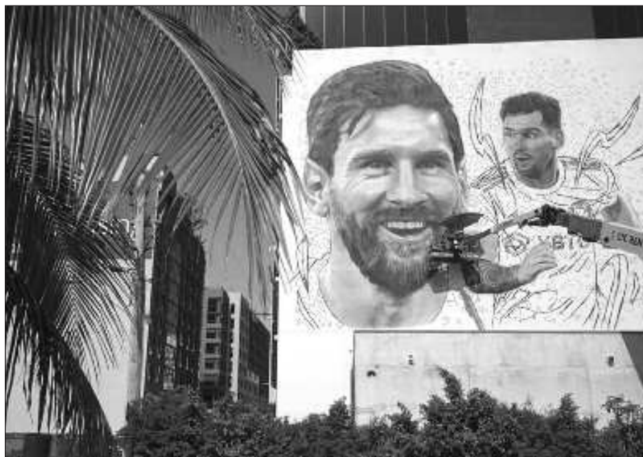
▲ El artista Maximiliano Bagnasco pinta un mural de Lionel Messi en Miami.

merosa comunidad latinoamericana aficionada al balompié, incluyendo poco más de 100 mil argentinos, que han hecho crecer el entusiasmo por este deporte año tras año y ahora se ven esperanzados de concurrir a las canchas para ver partidos de mejor calidad, incluyendo la Copa América el año próximo y la Copa Mundial en 2026.