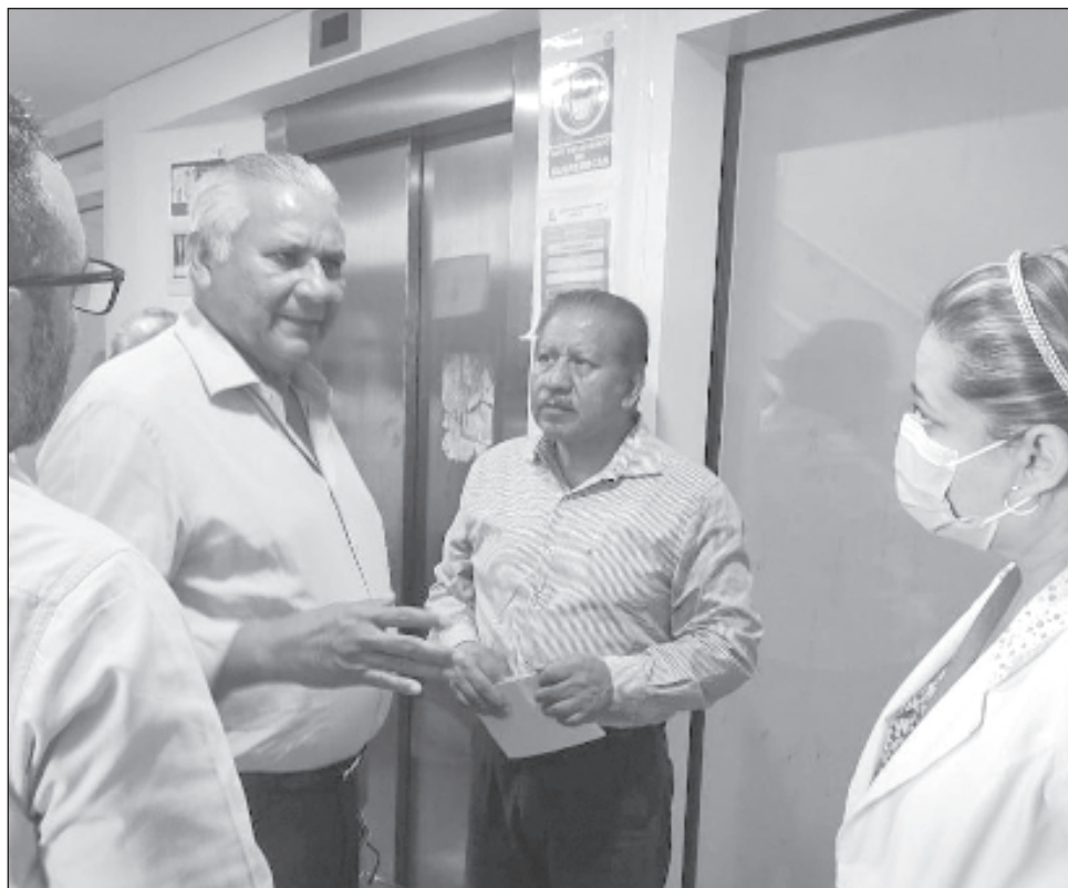
▲ En un comunicado, el IMSS anunció que separará del cargo a los funcionarios encargados de conservación y mantenimiento del hospital, en tanto se realizan las investigaciones y se deslindan responsabilidades, y aseguró que colaboran con la Fiscalía General del Estado en las pesquisas.

La gobernadora Mara Lezama se pronunció al respecto en sus redes sociales: “Sostuve una llamada con el