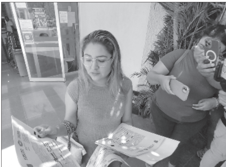
▲ Las siete denuncias contra Abel N van por abuso de confianza, fraude, violación a la intimidad sexual, agresión contra mujeres, amenazas, robo e intento de homicidio.

"Significa garantizar un sistema de salud digno, el presidente López Obrador está creando el IMSS Bienestar y a nosotros nos va a tocar fortalecer ese sistema de salud gratuito, que atienda desde la prevención hasta la enfermedad más compleja".