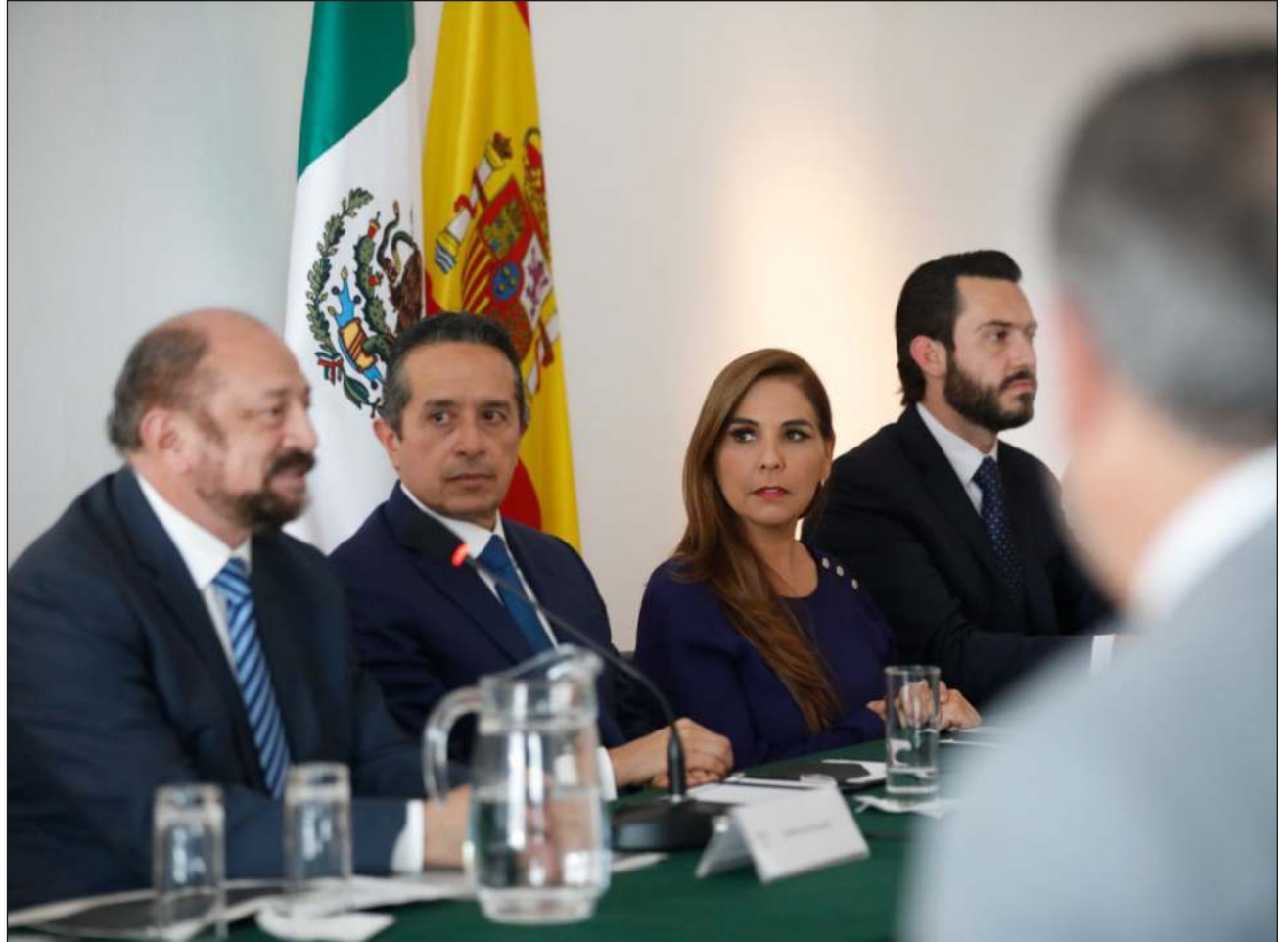
▲ En conferencia de prensa, tras la presentación de Carlos Joaquín, la gobernadora electa, Mara Lezama, informó que continúan las inversiones en infraestructura turística en el estado de Quintana Roo.

Tras la presentación del mandatario Carlos Joaquín, la gobernadora electa, Mara Lezama, informó que continúan las inversiones en infraestructura turística en Quintana Roo para ofrecer servicios más cómodos para los turistas y visitantes. Entre estos están la construcción de nuevos aeropuertos internacionales para tener cuatro -que abre la posibilidad de más conexión con el mundo-, así como el Tren Maya, que abrirá nuevas rutas en la península, así como nuevas inversiones en cuartos de hotel.