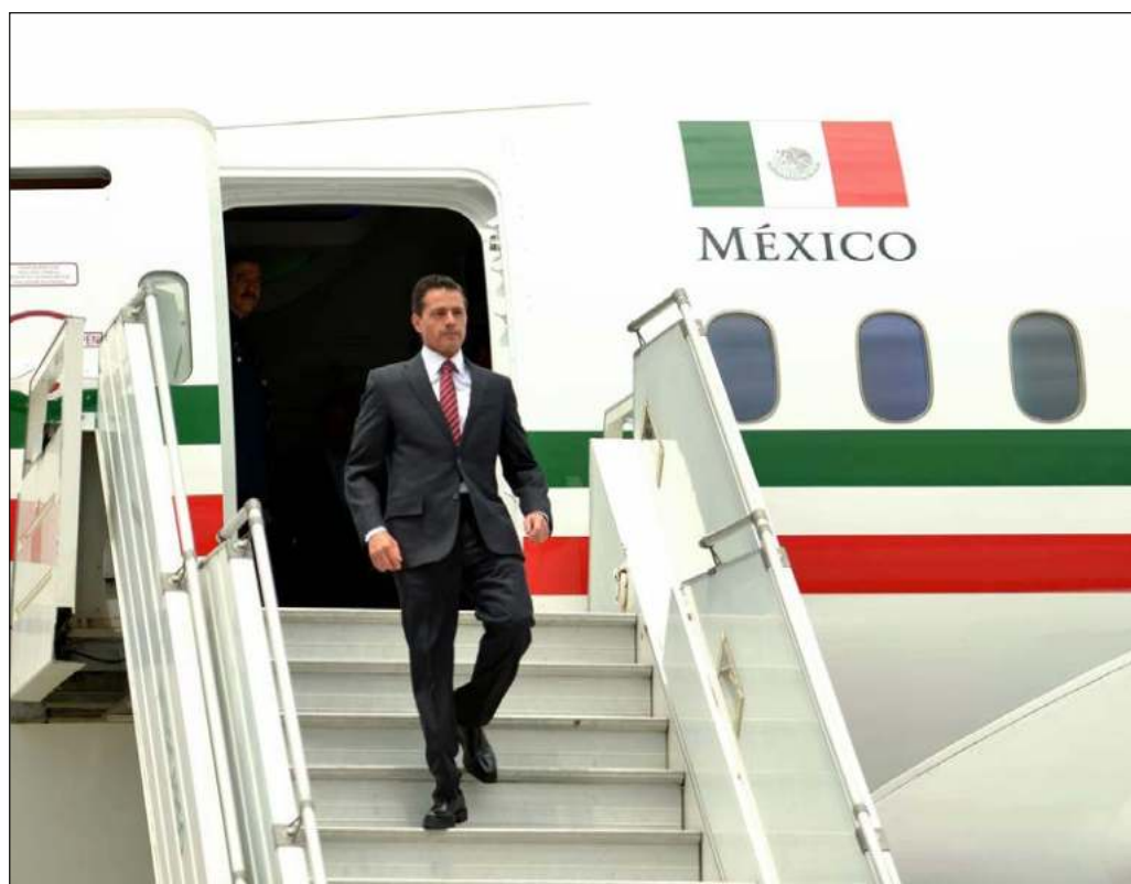
▲ La justicia efectiva y pareja para opositores y oficialistas es la forma más efectiva de desvirtuar la acusación en boga entre priistas, panistas y perredistas. Foto Enrique Peña Nieto

Finalmente, la justicia efectiva y pareja para opositores y oficialistas es la forma más efectiva de desvirtuar la acusación en boga entre priistas, panistas y perredistas, quienes se declaran víctimas de persecución política a la menor acción judicial que los involucra.