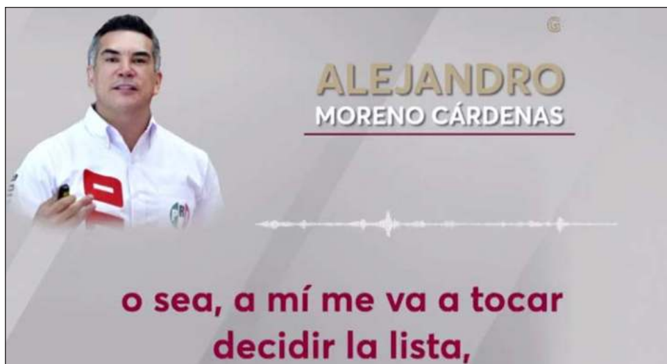
▲ En el audio presentado ayer se escucha al presidente nacional del PRI que no le importaba "lo que dicen aquellos pendejos que andan diciendo que me van a sacar".