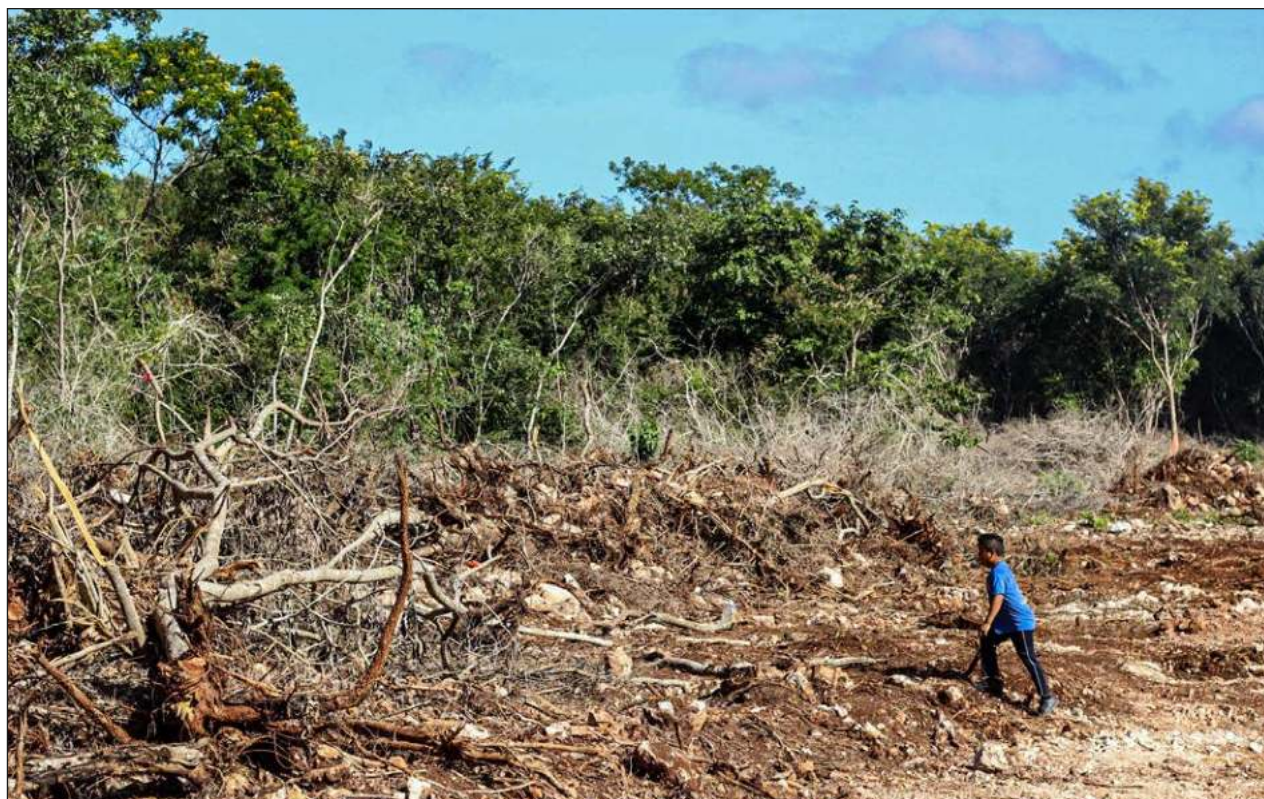
▲ En foro, activistas y expertas exponen las afectaciones que el Tren Maya traería a la península de Yucatán; señalan que el proyecto genera impactos al medio ambiente y aumenta la violencia.

El dolor nadie lo entiende y no sabemos para qué sirve. En 409 años yo si lo sé y cuando veo que alguien sufre me alegro muchísimo pues sé, de positivo, que esa persona va a ser feliz después.