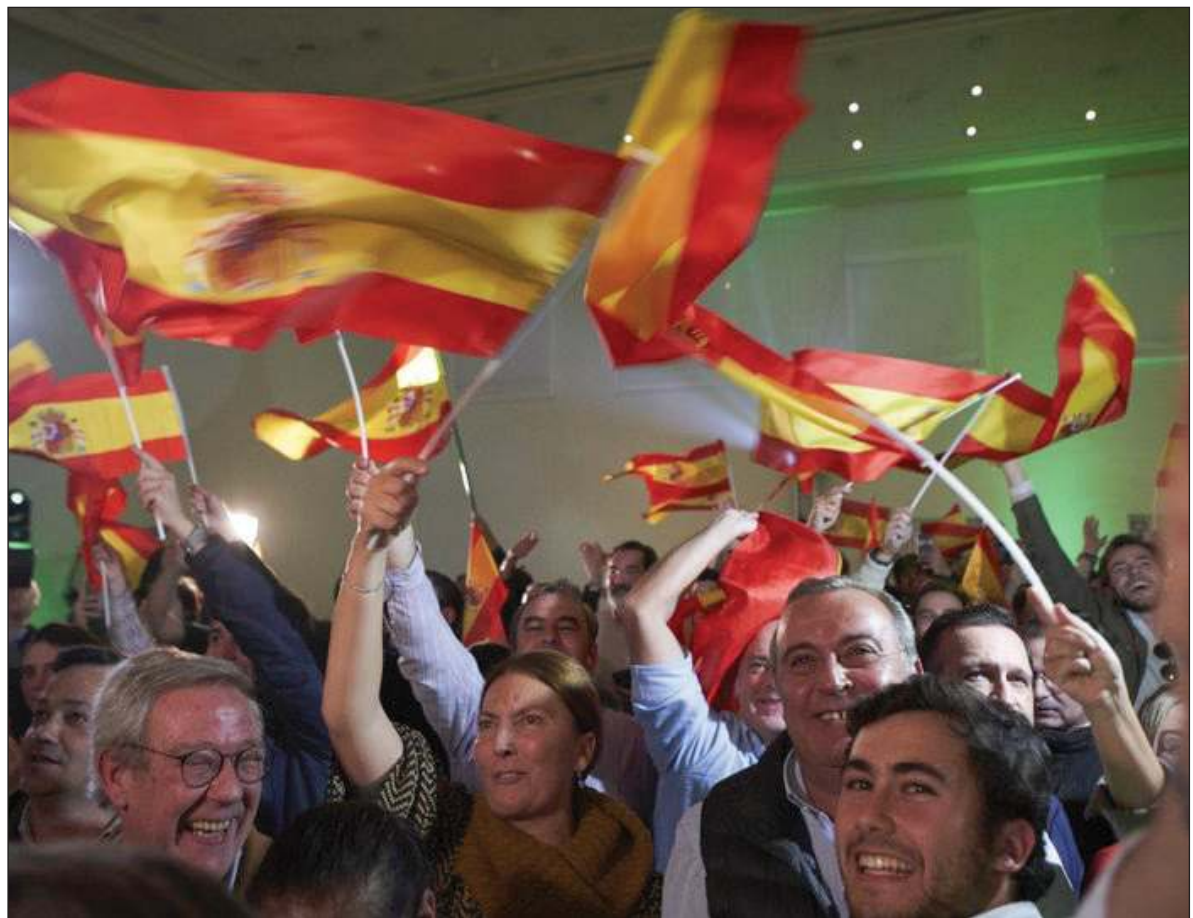
▲ “Pablo Iglesias cobró en 2014 y sólo dos meses después de la fundación de Podemos 272 mil 325 dólares del régimen de Nicolás Maduro por ‘asesorías para el desarrollo social en el país’”.

SEGÚN LA “REVELACIÓN” hecha en el Ok Diario ( www.okdiario.com ), dirigido por Eduardo Inda, acusado con insistencia de ser un profesional de la mentira mediática, “Pablo Iglesias cobró en 2014 y sólo dos meses des-