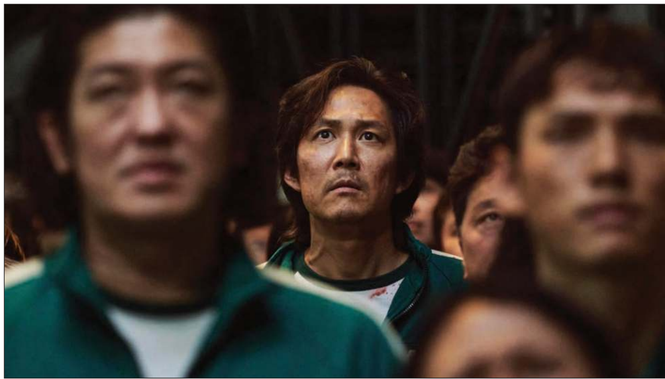
▲ Squid Game, un drama ambientado en Corea del Sur en el que los pobres son objeto de juegos brutales, obtuvo una nominación a mejor serie de drama y otras 13 candidaturas. Los premios Emmy se entregan en septiembre.

Por el premio a la mejor actriz en una serie de comedia compiten Rachel Brosnahan por The Marvelous Mrs. Maisel; Quinta Brunson por