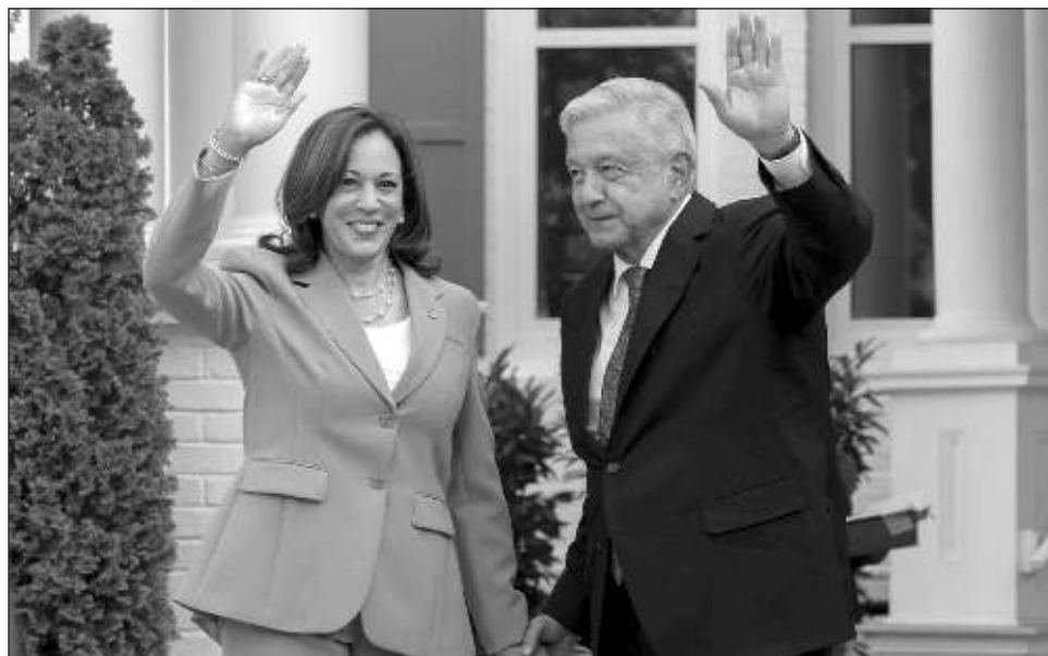
▲ La reunión entre el presidente mexicano y la vicepresidenta estadounidense se caracterizó por el intercambio de elogios. López Obrador destacó que sus conversaciones han sido “en beneficio de nuestros pueblos y de nuestras dos naciones. Y ahora vamos a hacer lo mismo”.

“Es un enorme placer darle la bienvenida a mi amigo, el presidente de México, él y yo hemos pasado momentos gratos tanto en la Ciudad de