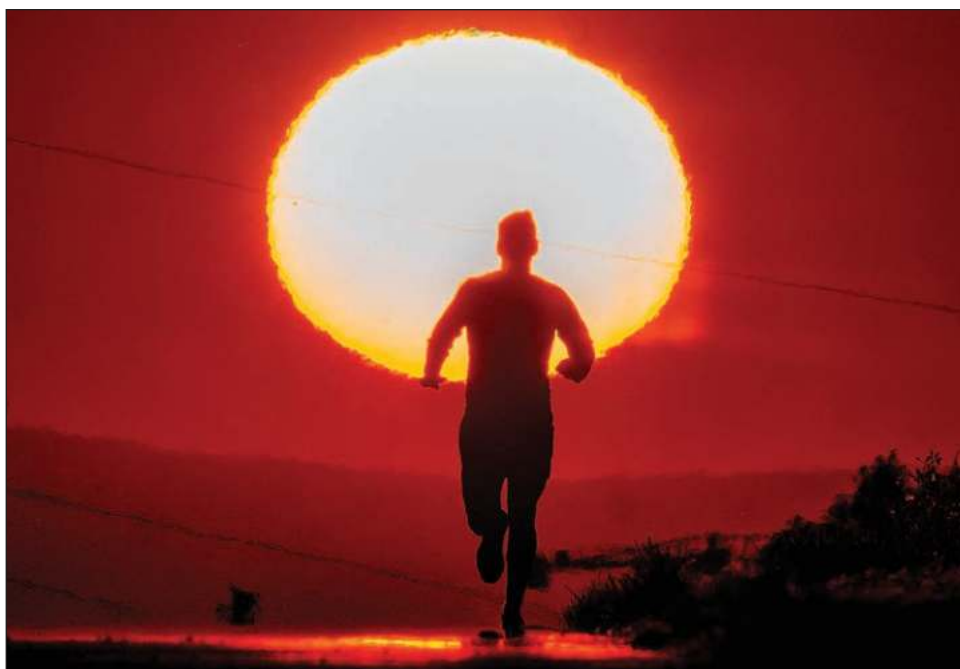
▲ Según los científicos, el aumento de las olas de calor está directamente ligado al calentamiento global. En la imagen, amanecer en Francfort, Alemania.

En las calles de Madrid, el calor extremo afectaba particularmente a las personas vulnerables o a quienes