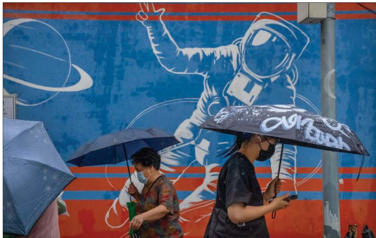
▲ La OMS exhortó a los gobiernos a implementar medidas como el uso de cubrebocas y protocolos de detección.

La agencia de las Naciones Unidas anunció el mantenimiento de la pandemia de Covid-19 en el rango de “emergencia de salud pública de alcance internacional”, el más alto nivel de alerta de la orga-