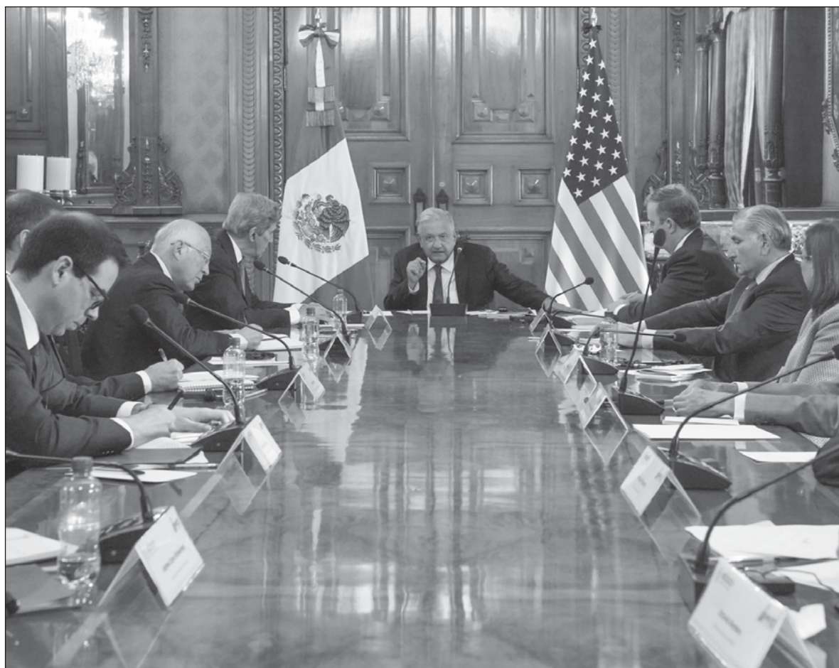
▲ “¿Qué pueden idear los jefes de dos Estados –uno neoliberal a ultranza, el otro de izquierda, aunque más bien podría colocarse en un moderado liberalismo– para contener el alza de precios?” Foto Presidencia

PRIMERO LOS ACCIONISTAS de Twitter no querían venderle la compañía a Elon Musk, el creador del automóvil eléctrico Tesla, pero como retiró su propuesta ahora quieren obligarlo a que compre. El precio convenido era de 43 mil 700 millones de dólares; desde un principio pareció excesivo. Mas no es el precio el motivo del desencuentro, sino los bots. Musk quiere tener información más exacta y confiable sobre su número. Sospecha que hay un alto porcentaje de cuentas balines y eso demerita el valor de la compañía. Twitter ha contratado a bufetes de abogados Wachtell, Lipton, Rosen & Katz para demandar a Musk. La compañía de San Francisco va a presentar su querrela contra el magnate