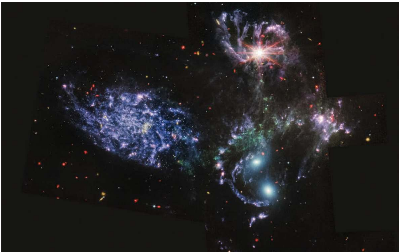
▲ "El telescopio nos muestra el infinito a través de un cerrojo. Y el infinito es una discoteca: el Big Bang fue un espectáculo de pirotecnia".