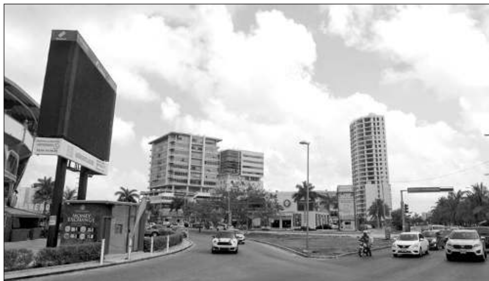
▲ Actualmente en el país se están construyendo 19 millones de viviendas, cerca de 260 mil nuevos cuartos de hotel y 20 millones de metros cuadrados de oficinas

Asimismo, dio a conocer que se tiene un tamaño pro-