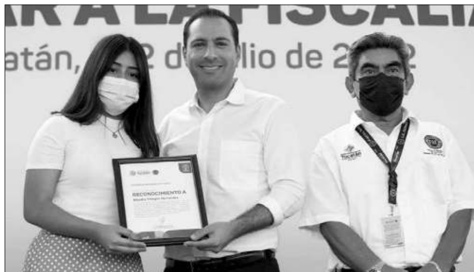
▲ Este martes, el gobernador entregó las primeras becas para hijos de personal operativo de la Fiscalía General del Estado que aprobó sus exámenes de confianza.

En el marco del Día del Abogado, Vila Dosal también comunicó que los hijos del personal operativo de la FGE que apruebe sus exámenes de confianza, podrán acceder a becas completas, tanto de inscripción como de colegiatura, en cualquier universidad del estado, pública o privada, lo cual se hará extensivo a primaria, secundaria y preparatoria; además, en el caso del nivel superior, se les dará 2 mil 600 pesos bimestrales para gastos de alimentación y transporte. En el acto, el gobernador entregó a los primeros elementos de la Fiscalía beneficiados con este esquema.