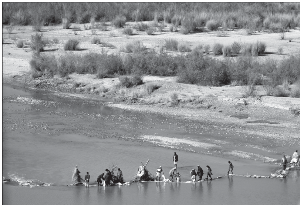
▲ A las autoridades les preocupó que hubiera más personas muertas que armas recuperadas en algunos de los operativos, dejando entrever que los elementos del SAS mataban a personas desarmadas, según el reporte publicado por la cadena televisiva.

La agencia señaló que dos pesquisas independientes han investigado la conducta de las fuerzas británicas en