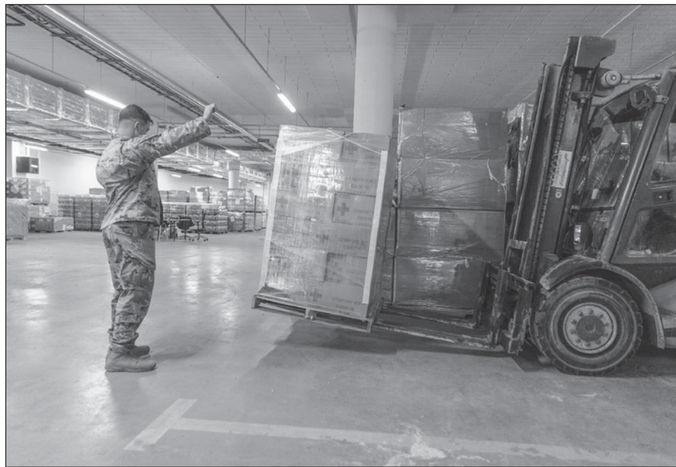
▲ Los fondos provistos por la Agencia para el Desarrollo Internacional de Estados Unidos (USAID), el Departamento del Tesoro estadounidense y el Banco Mundial son para aliviar el fuerte déficit presupuestario provocado por la guerra.

A mediados de mayo, la Comisión Europea, el brazo ejecutivo de la UE, propuso una ayuda adicional de hasta 9 mil millones de euros para Ucrania. El desembolso de estos mil millones forma parte de esa iniciativa, que