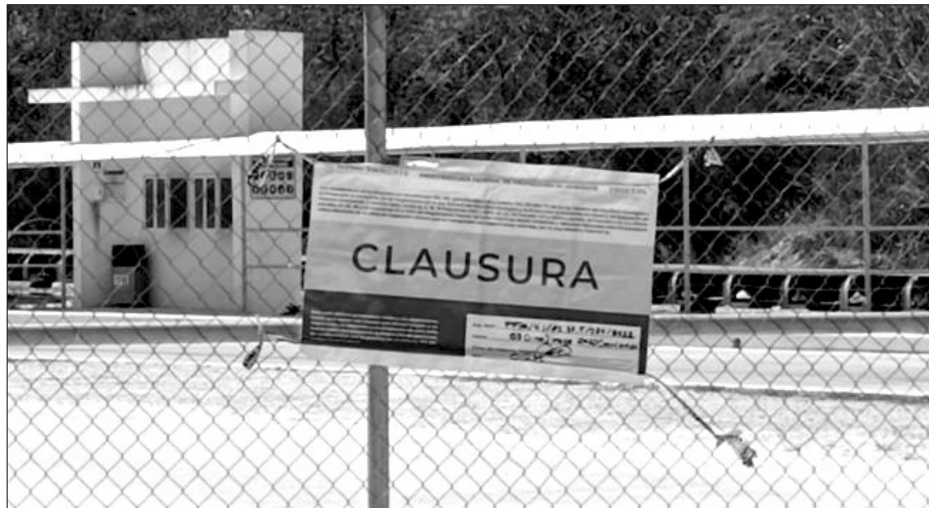
▲ Desde mayo pasado la Semarnat clausuró las instalaciones de Sactun a las afueras de Playa del Carmen.

Asimismo, se instruyó que en los próximos tres días se remita el expediente a los tribunales colegiados del 27 circuito, con residen-