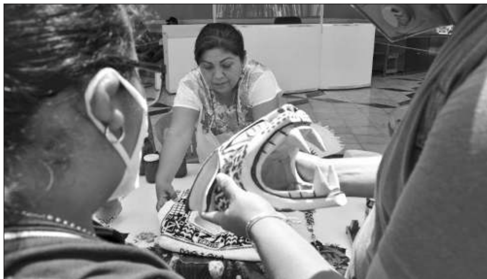
▲ Además de la oferta de creaciones, los emprendedores ofrecerán talleres de manualidades y clases de yoga desde este viernes 15 hasta el domingo 17, en la explanada Román Piña Chan.

Más de 25 emprendedores dedicados a la creación de ropa, cerámica, joyería y más, son apoyados por la alcaldía con la realiza-