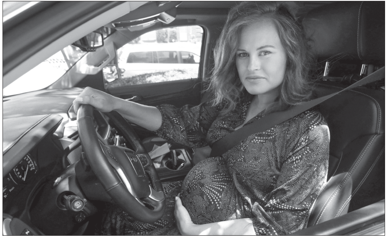
▲ El incidente ocurrió el 29 de junio de este año, pocos días después de que la Corte Suprema de Estados Unidos ilegalizara el aborto, dejando en manos de cada estado decidir sobre permitir la interrupción del embarazo.

Autoridades del ultraconservador estado de Texas, así como quienes pelean contra el derecho al aborto, defienden que un feto debe ser considerado como una persona, lo cual