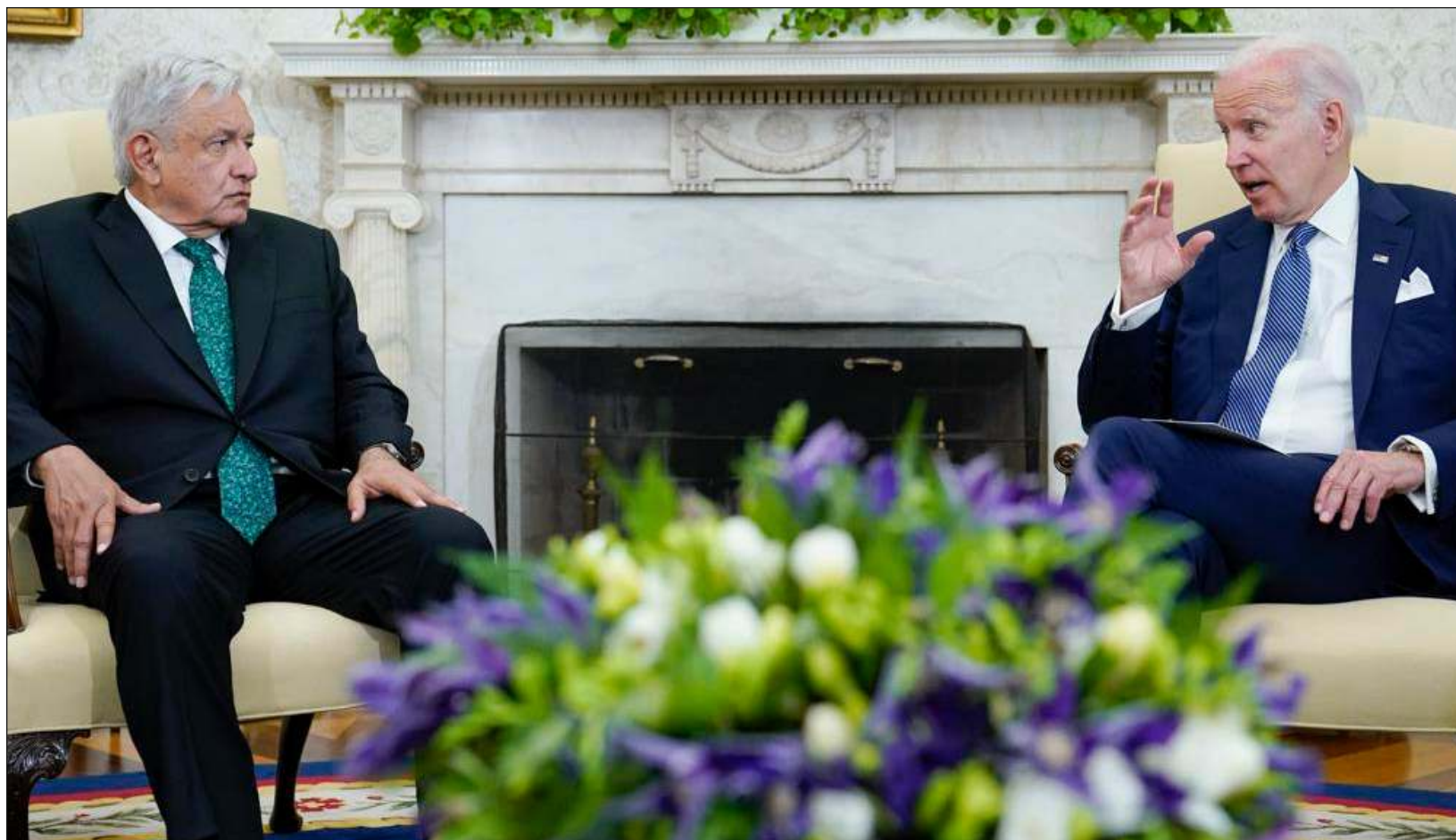
▲ Biden escuchó pacientemente a López Obrador y se dijo ansioso por trabajar en la agenda bilateral entre México y Estados Unidos.

El punto de China no cayó bien en el estadounidense, que tras la intervención del mexicano replicó que Estados Unidos produce más alimentos que aquel país del oriente.