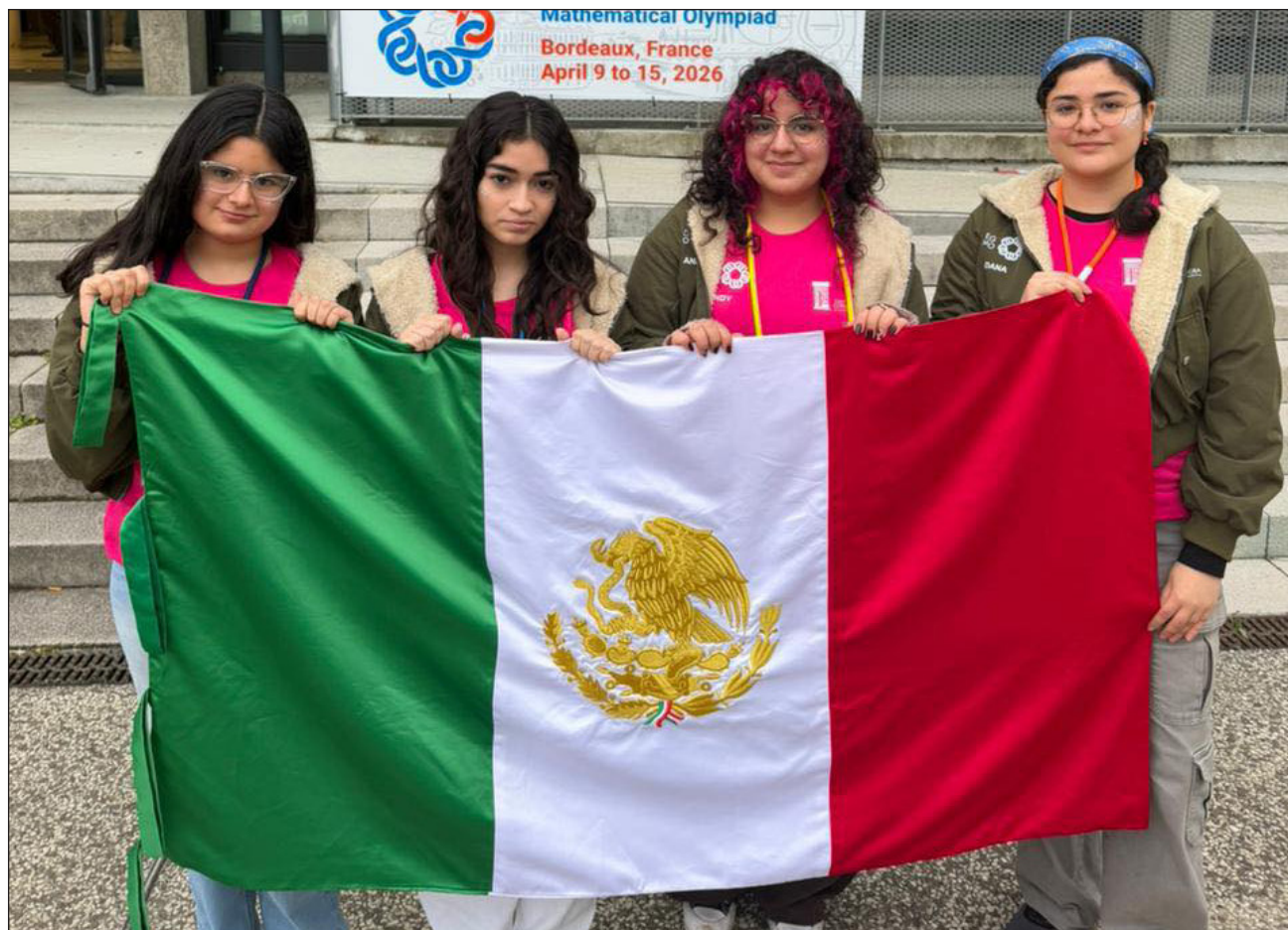
▲ Destacan la oportunidad de viajar y convivir con otras jóvenes interesadas en las matemáticas.

En un mensaje a las niñas, Díaz Mondragón recomienda: “si les interesa aunque sea sólo probar, inténtenlo. Seguramente encontrarán personas que las apoyen, no tienen que ser las mejores para disfrutarlo”.