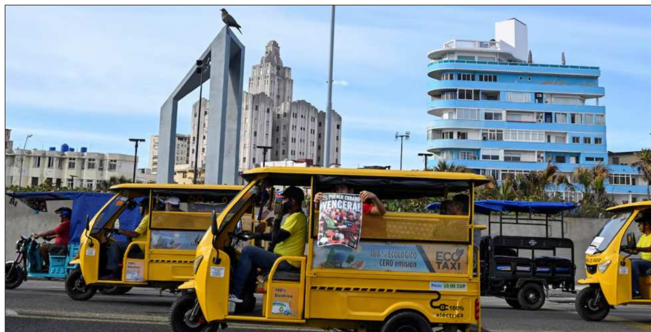
▲ “¡Cuba está pidiendo ayuda, y vamos a hablar!”, declaró Trump, aceptando por primera vez comunicación directa.

El líder republicano en el Senado, John Thune, declaró ayer lunes que ese conflicto con Irán debe ser la prioridad máxima. “Creo que en estos momentos estamos concentrados (...) en reabrir el estrecho de Ormuz”, declaró a periodistas que le preguntaron