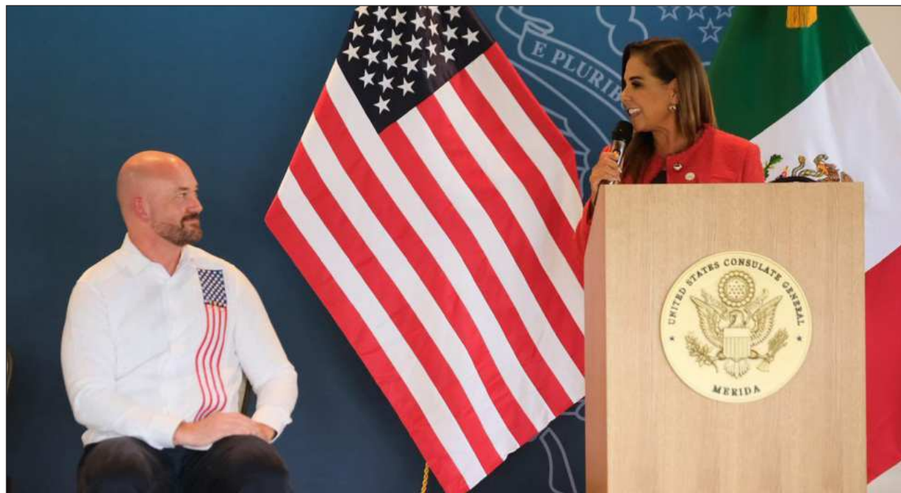
▲ Cancún fue sede de la celebración Freedom 250 por el aniversario de la independencia de EU.

El cónsul Thomas expresó a la mandataria su agradecimiento “por su constante