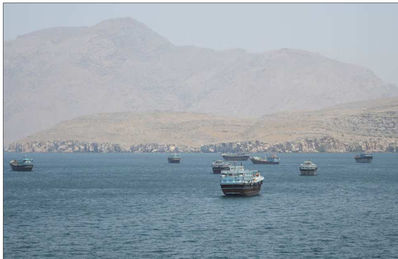
▲ El estrecho de Ormuz sigue bajo el control de Teherán, EU mantiene un bloqueo contra Irán y las negociaciones están estancadas.

El estrecho de Ormuz sigue bajo el control de Teherán, Estados Unidos mantiene un bloqueo contra Irán y las negociaciones entre los dos países