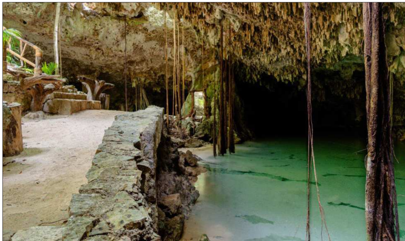
▲ El sargazo obliga a impulsar espacios naturales que permitan mantener la actividad económica del sector.

La funcionaria explicó que, aunque las playas continúan siendo uno de los principales imanes turísticos del destino, la temporada de sargazo obliga a impulsar otros espacios natu-