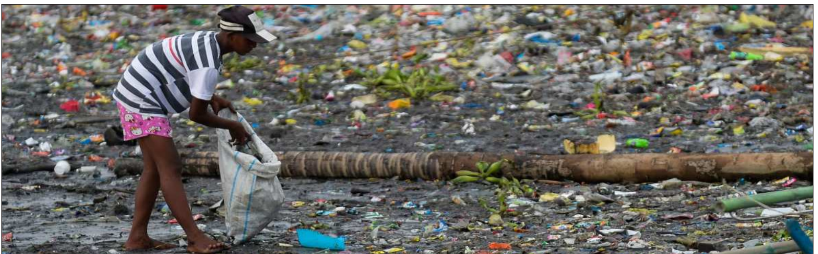
▲ “No se podrá superar lo que hoy hay que asumir como una emergencia asumiendo una postura de business as usual , o seguir haciendo las cosas como se han hecho”.