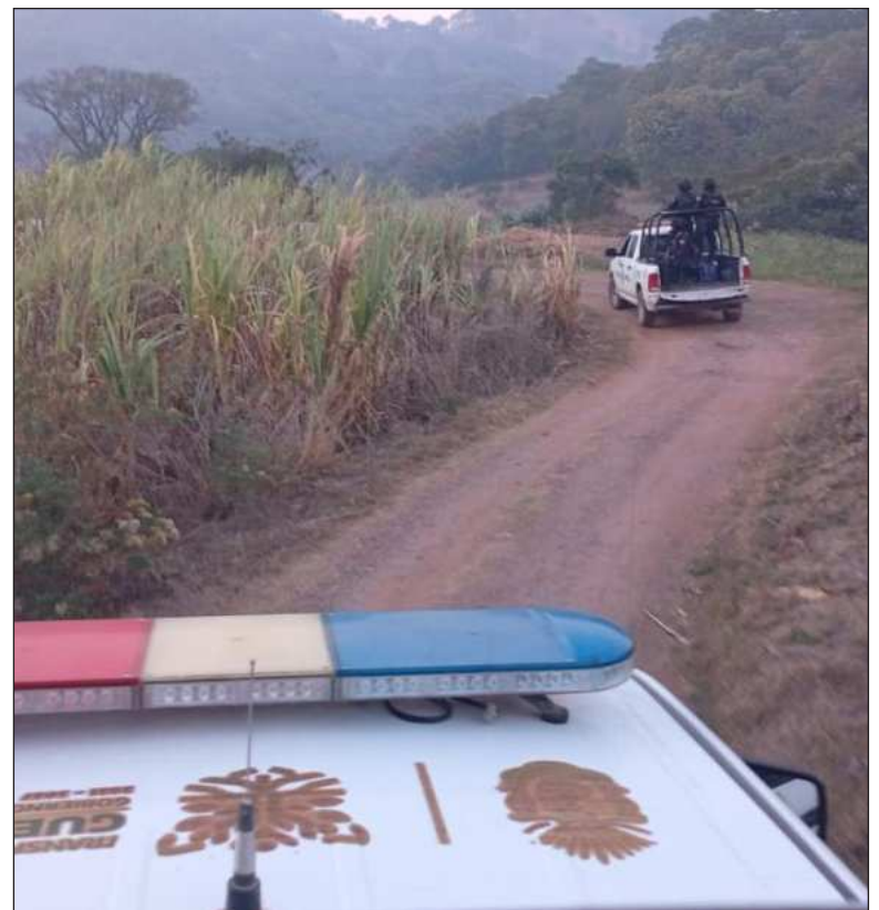
▲ “Los Ardillos tienen el control del Chilapa; antes lo dominaban Los Rojos. Fueron parte del cártel de los Beltrán Leyva”.