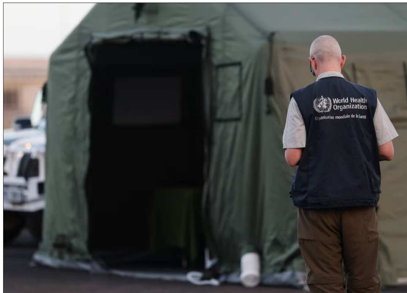
▲ La recomendación de la OMS es que las personas evacuadas sean sometidas a un seguimiento activo durante 42 días.

De los evacuados, por ahora, tres personas han dado positivo por hantavirus, una enfermedad contagiosa poco frecuente para la que no hay vacuna. Son una francesa, un estadounidense y un español.