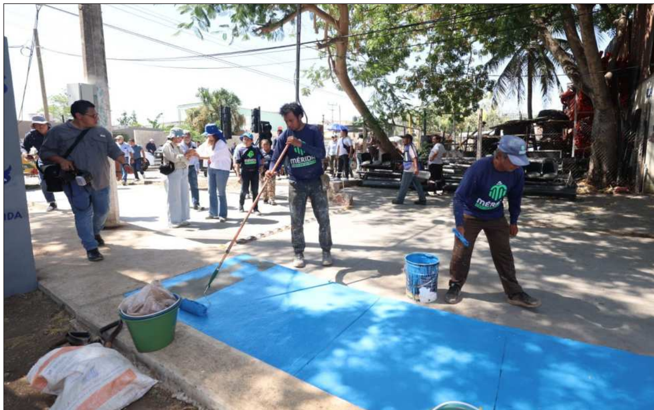
▲ Las acciones beneficiaron directamente a 2 mil 532 habitantes y 88 unidades económicas.

Con el de la Manzana 115, ya suman 19 Mega Operativos en las distintas colonias de Mérida