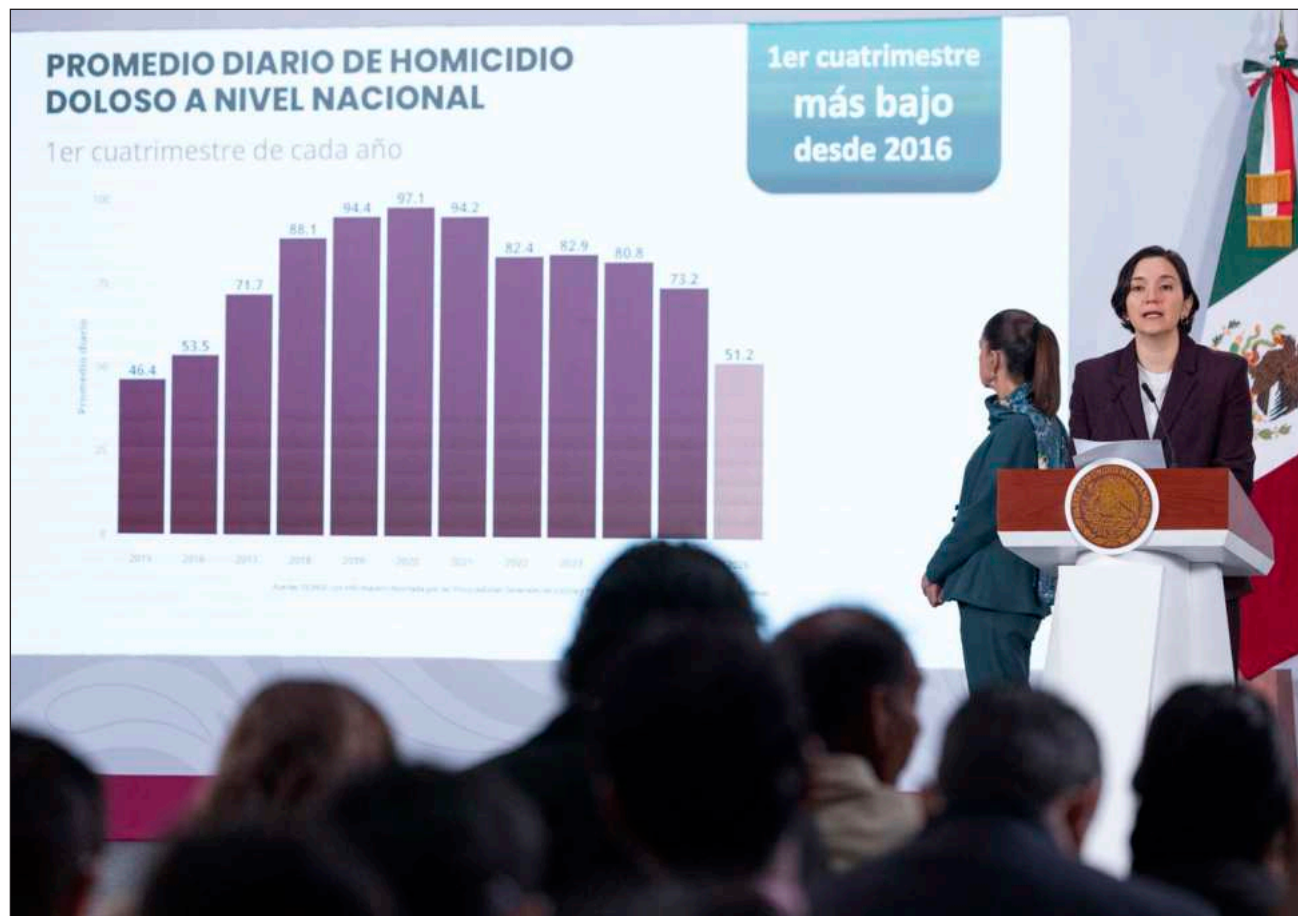
▲ De septiembre de 2024 a abril de 2026, los homicidios dolosos en el país pasaron de un promedio diario de 86.9 a 52.5, lo que representa 34 incidencias menos respecto a este delito, destacó la titular del Ejecutivo Federal.

Quintana Roo está en el lugar 22, con 0.7 por ciento (11 casos), Campeche en el 25, con 0.6 por ciento (nueve casos) y Yucatán es el 32 de la lista, con 0.1 por ciento (dos homicidios).