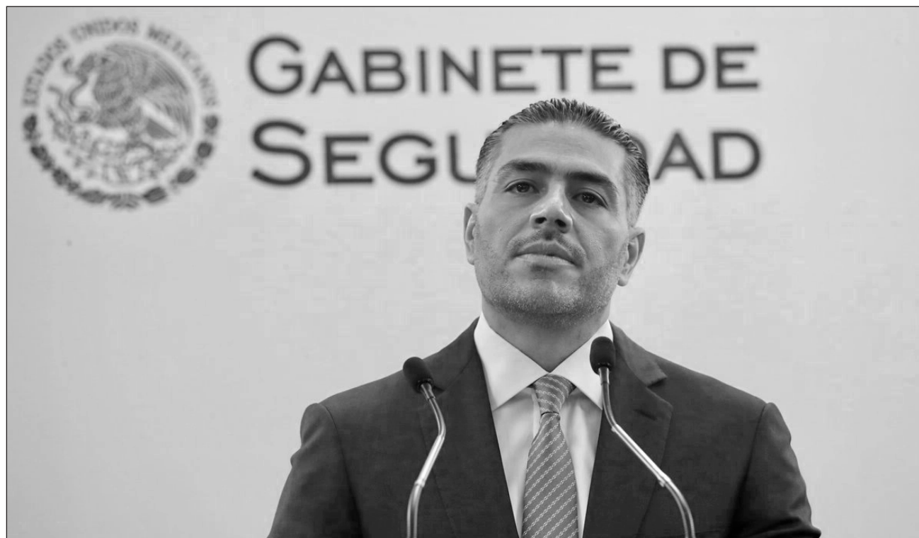
▲ Harfuch respondió a la información difundida por CNN que señala guerra secreta de la CIA en México.

México”, en la cual el también coordinador del Gabinete de Seguridad posteo en su cuenta de X: “sobre una explosión ocurrida en Tecámac, Estado de México, en la que se señala una presunta