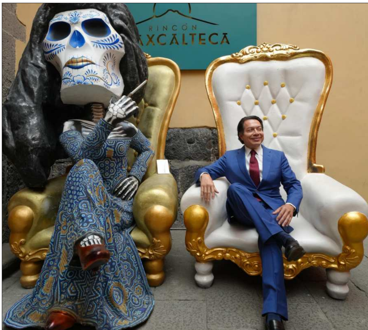
▲ El titular de la Secretaría de Educación Pública, Mario Delgado, quien reculó ayer del anuncio hecho el jueves de recortar el calendario escolar, es mencionado como posible aspirante a la candidatura de Morena al gobierno de Colima.