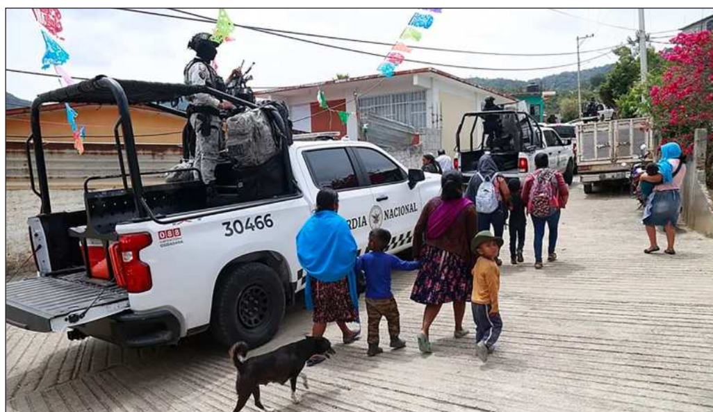
▲ "El testimonio de quienes han sido desplazados debiera conducir a un entendimiento del fenómeno de la migración por la violencia, pero también al Estado a intervenir aplicando la máxima inteligencia".

Aunque por encima de todo, la nación bien puede exigir el desmantelamiento de los grupos delincuenciales que existen en Guerrero porque su permanencia implica que existe una continuidad de aquello que alguna vez se dijo que distinguiría a la Cuarta Transformación: la corrupción y las alianzas con el crimen organizado. El desafío a las instituciones está ahí y es entendible que la prioridad sea la protección de la población civil, pero no puede consentirse que Ardillos , Rojos y Tlacos sigan medrando mientras queda la percepción de que las autoridades se encuentran coludidas con ellos.