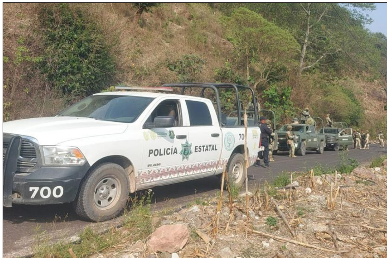
▲ De acuerdo con la mandataria federal, lo que se busca es evitar enfrentamientos que afecten a los civiles.

La mandataria explicó que en la zona existen “tres