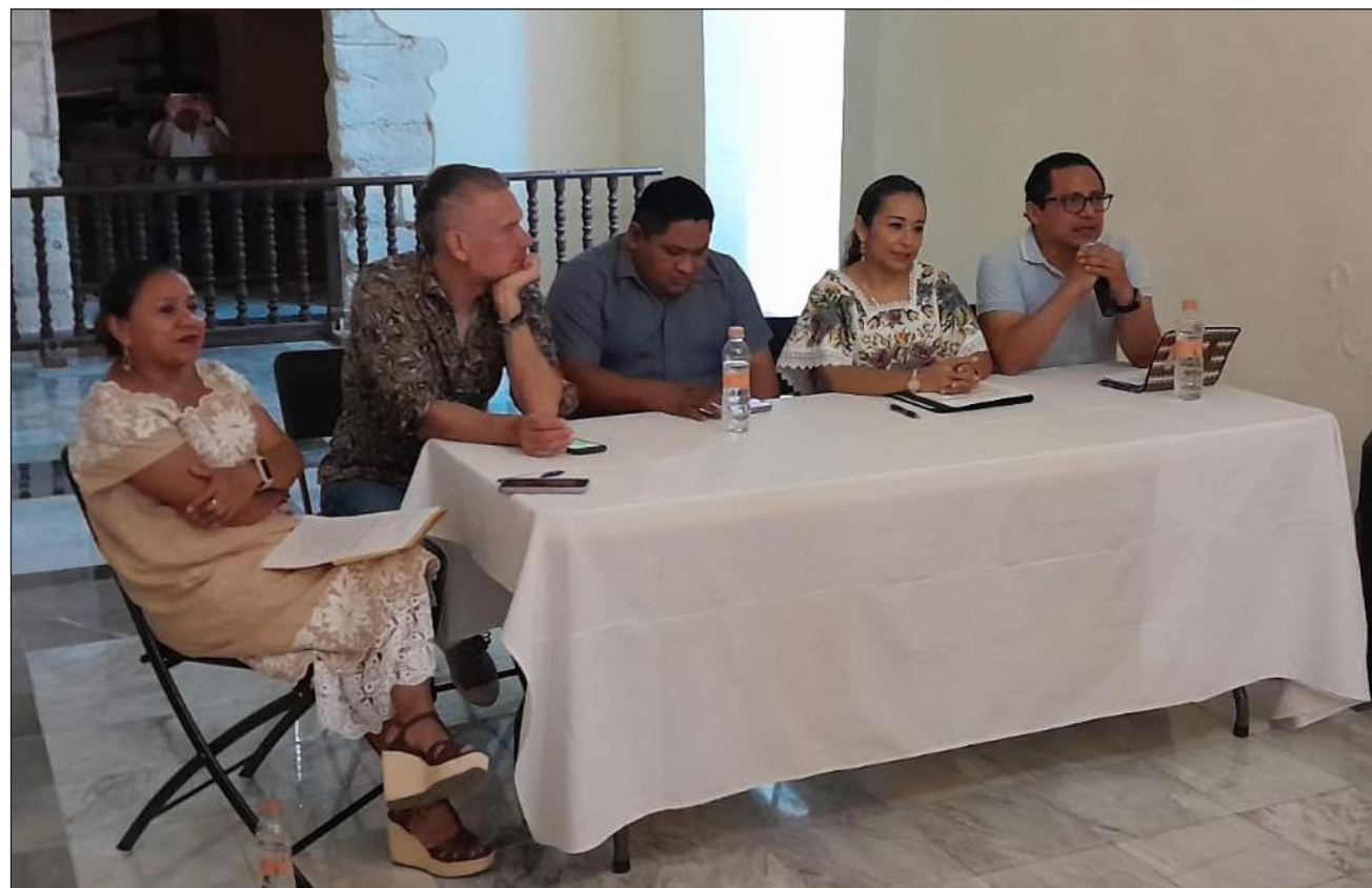
▲ Entre las conclusiones está que las personas mayas no necesitan monumentos para existir, “no se reduce a una placa”.