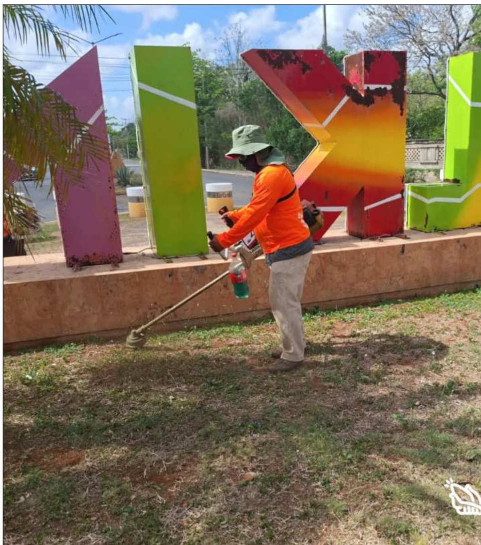
▲ Los ayuntamientos sostuvieron reuniones con sus directores y llegaron a la decisión de modificar sueldos para no dar de baja a los trabajadores.