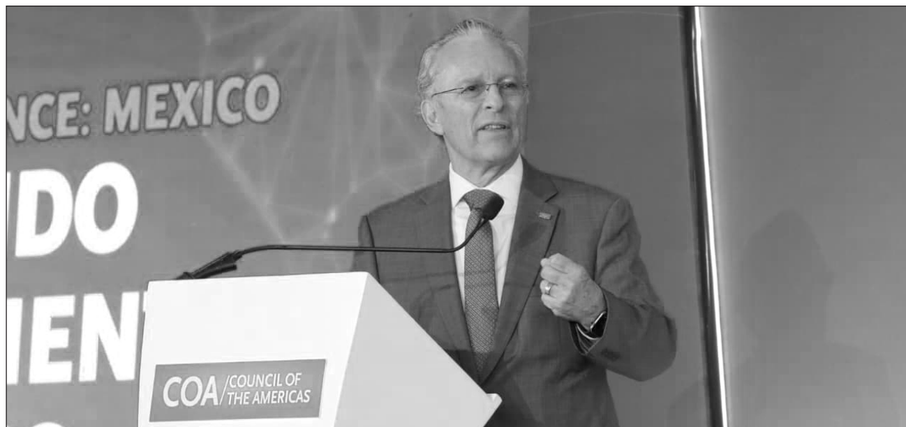
▲ Medina Mora reconoció que no se sabe si Donald Trump querrá seguir el camino de que se renueve para que sean 16 años más con revisiones cada seis, o que no se renueve y que sean 10 años más con revisiones anuales

de que vamos bien, y más adelante, en algún momento en que decida una sola persona, el presidente Trump, se llegará a una conclusión”, afirmó Medina Mora.