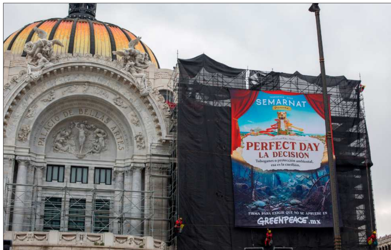
▲ La agrupación exigió que la institución federal haga efectivo el principio precautorio, rechace el mega proyecto de Royal Caribbean y trabaje en orientar iniciativas que prioricen la restauración y protección de la Selva Maya.

Poco antes de las 6 horas, seis activistas pertenecientes a la organización ambien-