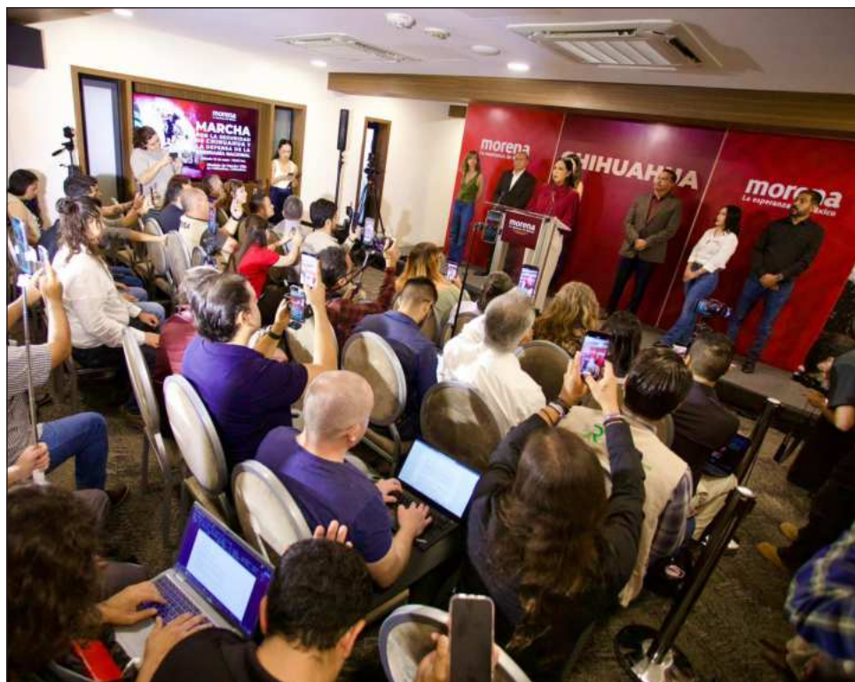
▲ La presidenta nacional de Morena, Ariadna Montiel Reyes, convocó a la militancia de su partido a la movilización social en Chihuahua el próximo sábado 16 de mayo.

En investigaciones que lleva a cabo la Fiscalía General de la República (FGR) en torno a la presencia de elementos de la Agencia Central de Investigación (CIA) para desmantelar un narcolaboratorio en el estado de Chihuahua en abril pasado, ya han comparecido