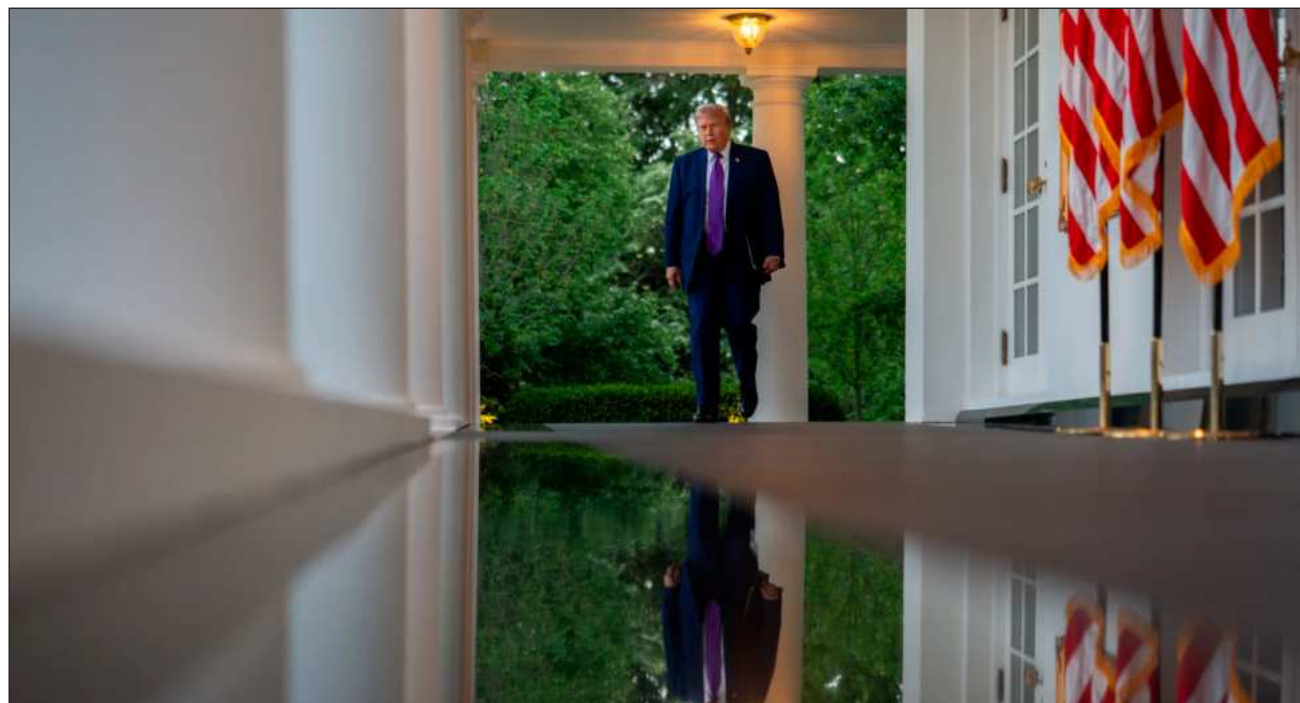
▲ El gobierno de Trump parece decidido a no permitir que las diferencias sobre Irán eclipsen los esfuerzos por avanzar en otros asuntos difíciles en la compleja relación, que van desde el comercio hasta una mayor cooperación contra el fentanilo.

Pero justo antes de salir de la Casa Blanca el martes para su vuelo a Beijing, Trump buscó restar importancia a las diferencias con Xi sobre Irán y a los efectos