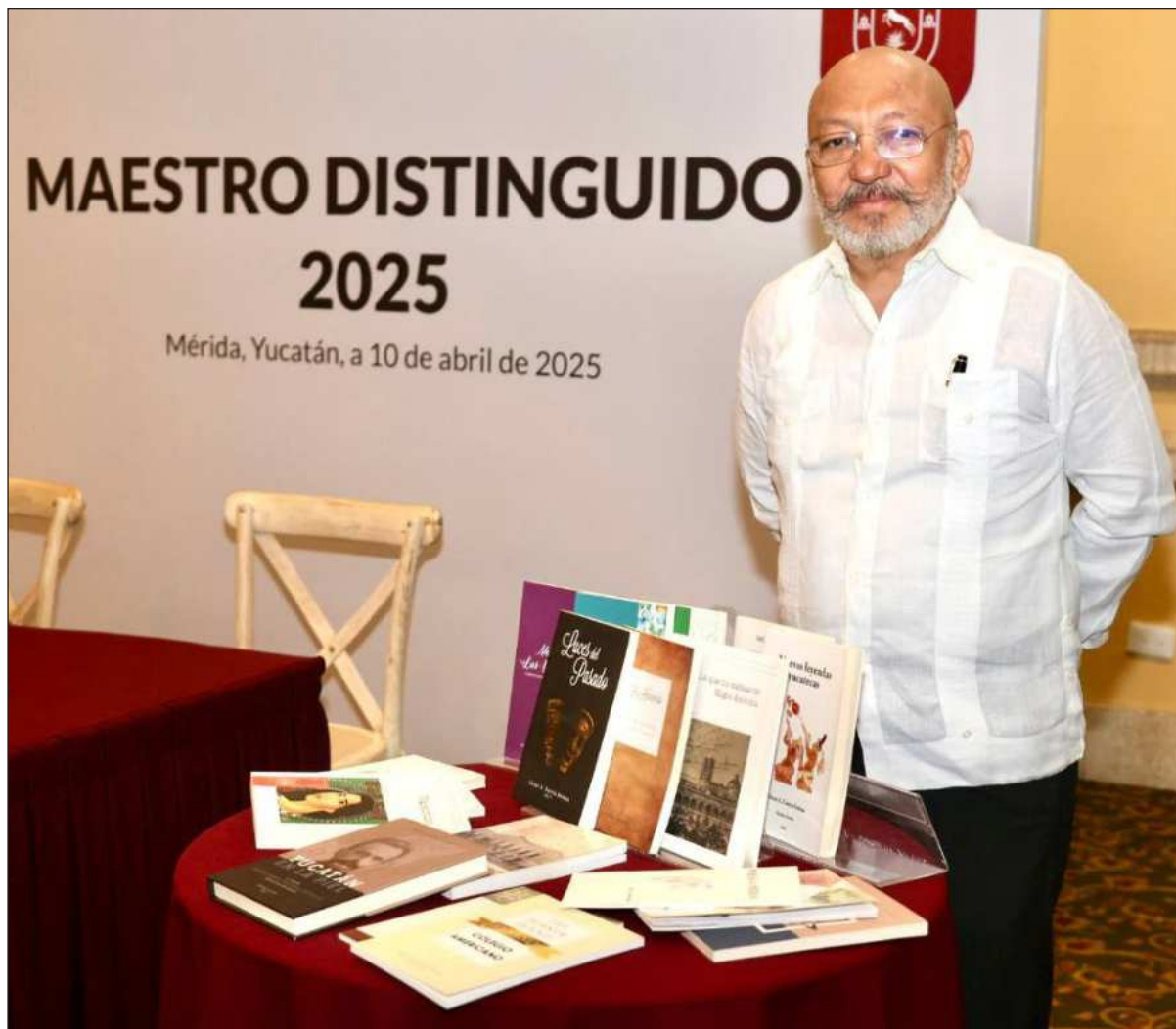
▲ “En su discurso agradeció a su familia como el sostén de su vida, como esa presencia constante que entendió sus esfuerzos, sus ausencias y la intensidad de una vocación que a veces exigía entregarse por completo”.

Otra experiencia emblemática fue la revista Palabra de Estudiante , editada entre 2003 y 2010. En sus páginas solo se publicaban textos originales elaborados por los propios alumnos: cuentos, noticias, ensayos y poemas. Más que un ejercicio extracurricular, la revista fue una apuesta por la lectura, la escritura y la creatividad en una