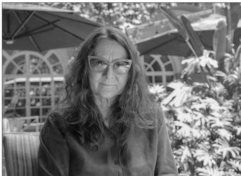
▲ En el evento también fue presentado el documental más reciente de la cineasta.

Además, porque Lucrecia Martel es “una de las voces más influyentes del llamado Nuevo Cine Argen-