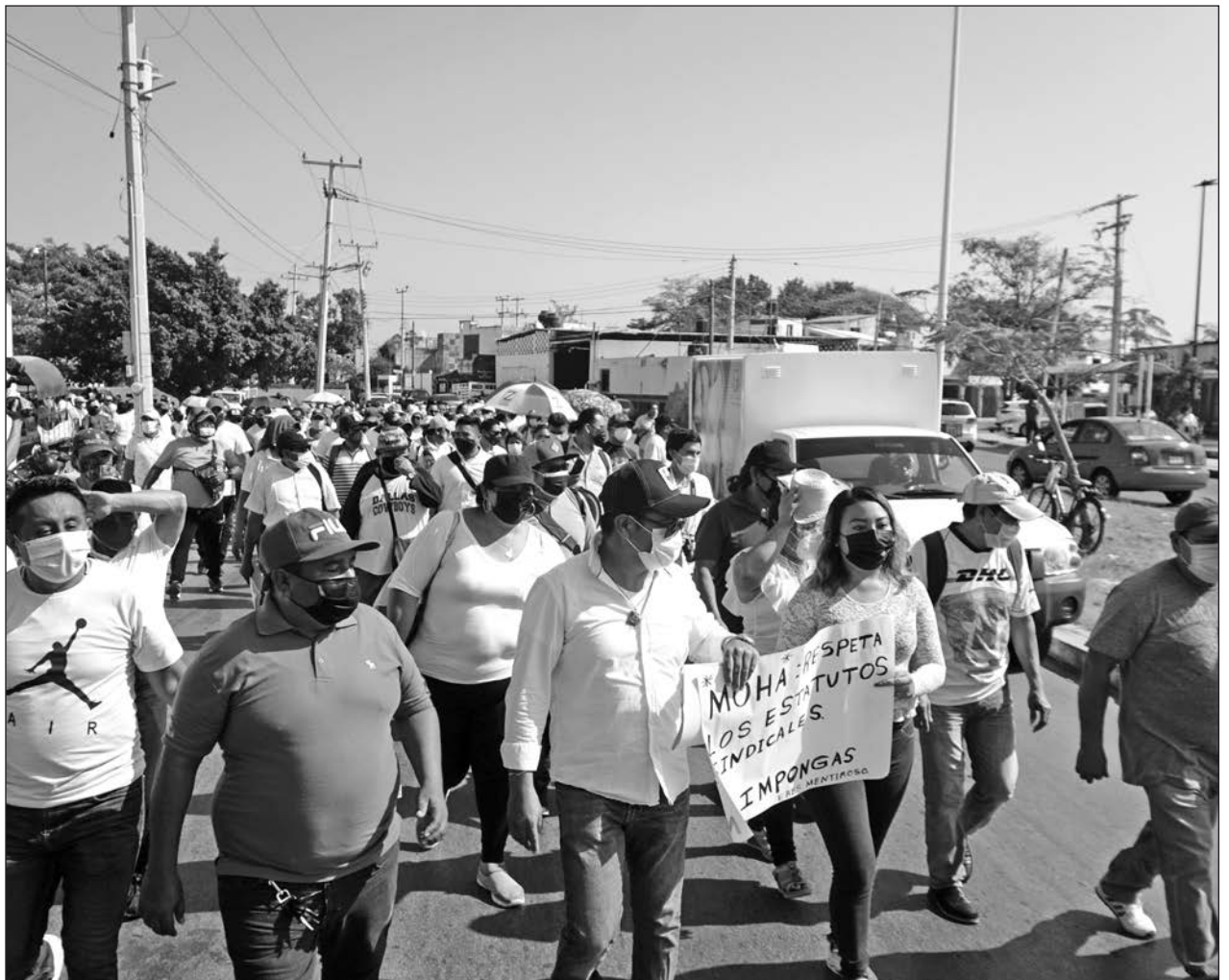
▲ Trabajadores del sindicato del ayuntamiento de Campeche caminaron hacia la sede de los Tres Poderes.

Puntualizó que ni en la primera aplicación de la vacuna, ni ahora, se han presentado casos de personas que hayan presentado reacciones grave al biológico.