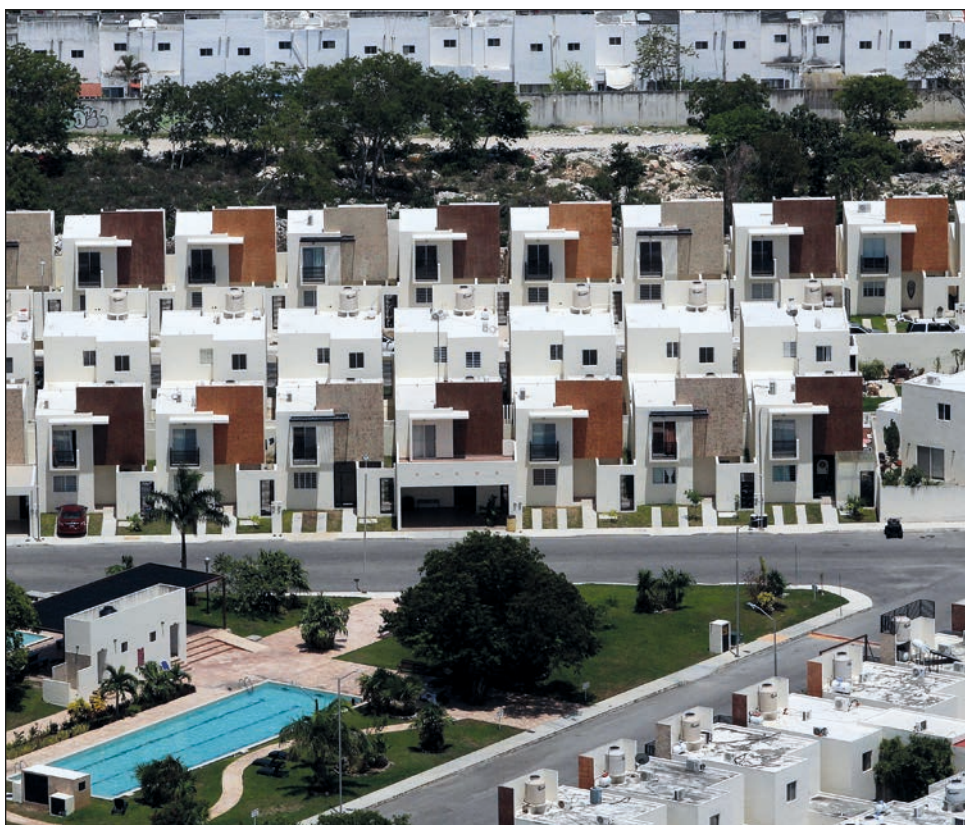
▲ El presidente, Andrés Manuel López Obrador, cuestionó la existencia de los aparatos burocráticos para el otorgamiento de créditos en casas de interés social.