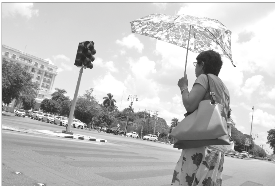
▲ Las temperaturas en la península de Yucatán rondarán entre 40 y 45 grados centígrados en esta temporada, advirtieron especialistas.