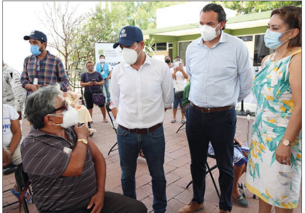
▲ En Yucatán, las personas tienen oportunidad de ser testigos de su propio proceso de vacunación contra el nuevo coronavirus.

Con estas cifras, el especialista indicó que este periodo está cerca de alcanzar la intensidad de abril de 2015, cuando se dieron ré-