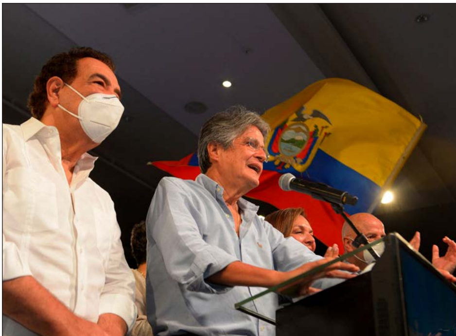
▲ La democracia ha triunfado y los ecuatorianos han optado por un nuevo rumbo, uno muy diferente al de los últimos 14 años, afirmó el ganador