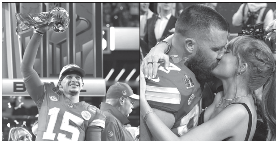
▲ Patrick Mahomes, el quarterback que volvió a brillar a la hora cero, y Travis Kelce, quien arriba a la derecha aparece con su novia Taylor Swift, ganaron su tercer anillo juntos con Kansas City.

"Esto es fabuloso", dijo Mahomes. "Legendario".