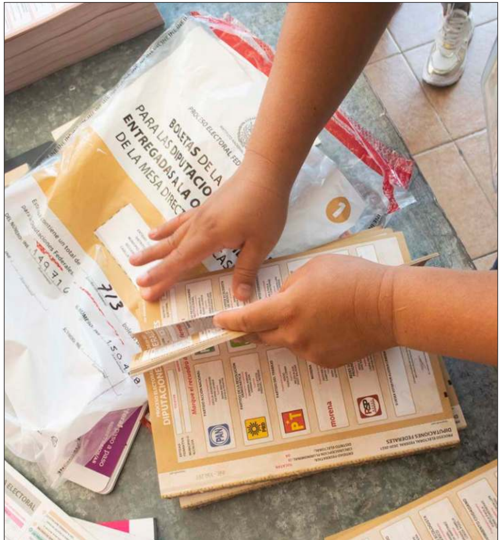
▲ Copamex es la empresa encargada de producir este papel, la cual se encuentra en Chihuahua, y efectuará 21 viajes para llevarlo a los Talleres Gráficos de México.

A su vez, TGM producirá más de 312 millones boletas electorales. Este proceso inicia el primero de marzo con la producción de la boleta para la elección presidencial, continuando con la boleta para senadurías y finalizando para la diputación federal.