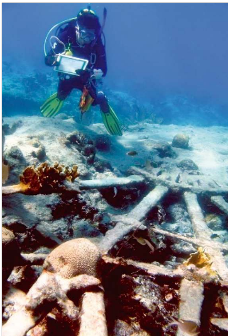
▲ "Preservar el patrimonio cultural subacuático in situ no sólo enriquece nuestra comprensión del pasado, sino que también fomenta la investigación y la conexión con nuestra identidad cultural".

PRESERVAR EL PATRIMONIO cultural subacuático in situ no sólo enriquece nuestra comprensión del pasado, sino que también fomenta la investigación y la conexión con nuestra identidad cultural. Estos secretos sumergidos no solo son testimonios del pasado, sino también oportunidades para