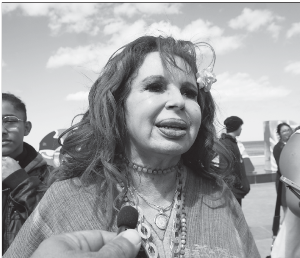
▲ Durante su reciente gira de trabajo por el municipio de Carmen, la mandataria estatal expuso que los homicidios que se han cometido están siendo investigados.

“Campeche es uno de los tres estados más seguros del país y de los que mayor porcentaje de homicidios dolosos esclarecidos, derivado del trabajo pericial de los elementos policiacos”. Indicó que sólo grupos políticos buscan generar un ambiente de inseguridad que no existe, pero tiene objetivos electorales muy específicos.