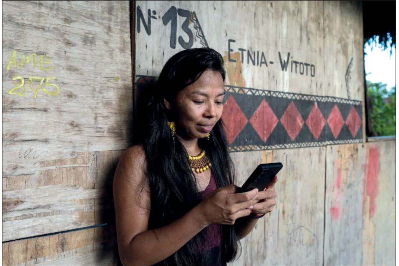
▲ Ojéela'ane' tak walkila', ts'o'ok maanal 3 mil u téena'al éensa'an le áaplikasyoona'.

Ba'ale', tak ma' seen úuche', mixba'al ti' le ba'alo'oba' táakbesa'am ichil séelularo'ob, tumen walkila' ojéela'an ku