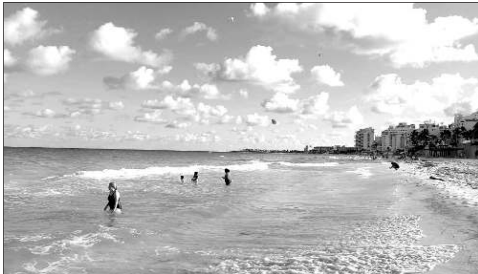
▲ La Asociación de Hoteles de Cancún, Puerto Morelos e Isla Mujeres han recibido quejas de gente engañada en tiempos compartidos, que desembolsan dinero, llegan y no tienen nada confirmado.