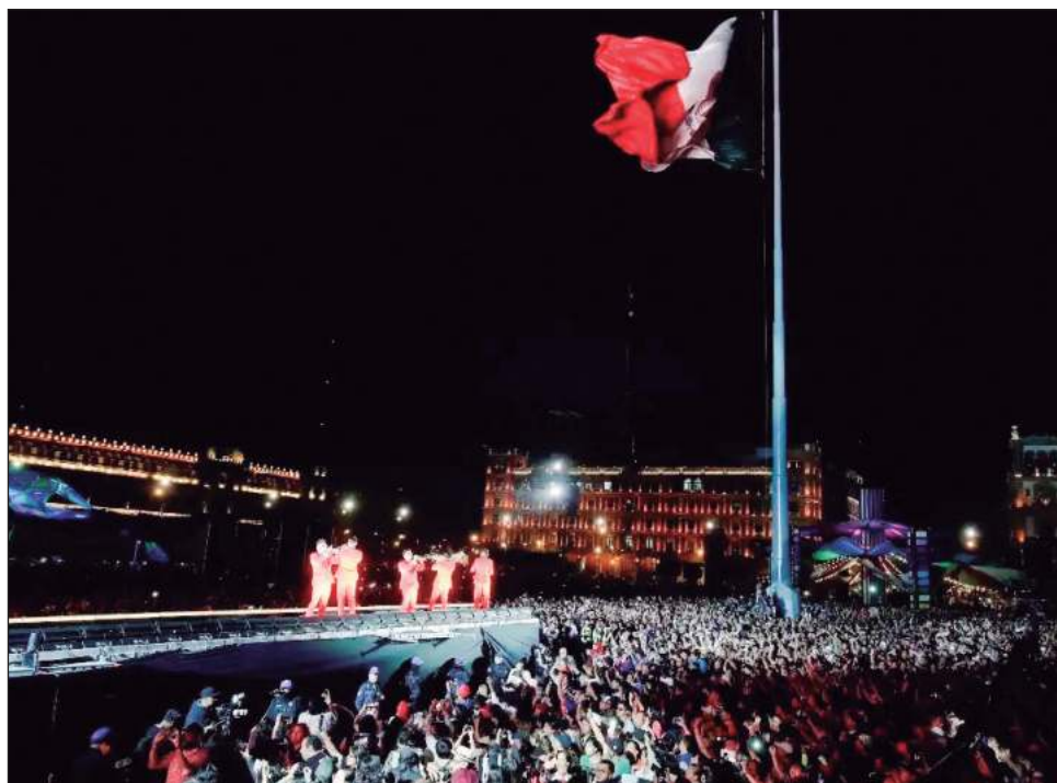
▲ Adultos mayores, familias, turistas y personajes folclóricos tradicionales del primer cuadro de la urbe gozaron con los éxitos de la emblemática agrupación.