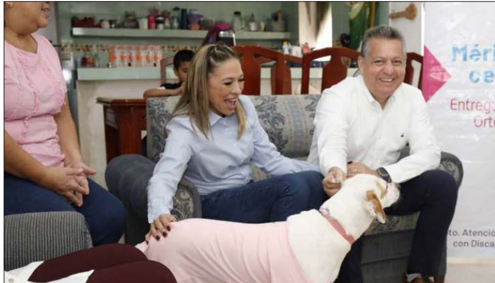
▲ El alcalde Alejandro Ruz Castro señaló que “este es un compromiso que tenemos con la ciudadanía, porque sabemos que la esterilización de un perro o un gato en muchas ocasiones está fuera del alcance del bolsillo de algunas personas, entonces con esta campaña queremos apoyarlos”.

“Trabajaremos para que acudan las personas a la jornada del 17 de marzo que se realizará en la Clínica Veterinaria Municipal, por ello, las valoraciones previas serán del 19 de febrero al 1 de marzo para constatar que los animales de compañía estén en