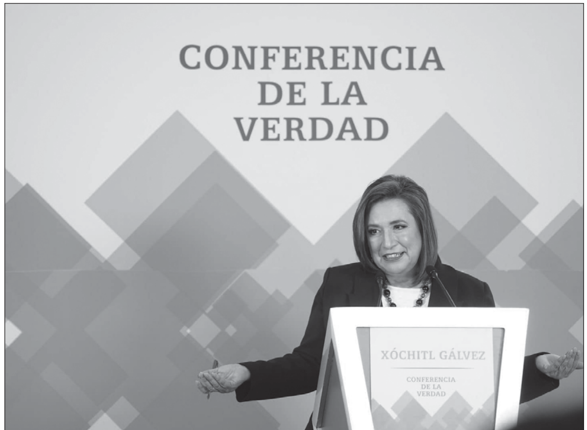
▲ “El embate sincronizado de publicaciones extranjeras sobre presunta entrega de fondos criminales a la campaña de López Obrador en 2006 suministró una plataforma de arranque para la gira de Xóchitl”.

EL TAMAÑO DE la apuesta que grandes inversionistas políticos han lanzado ha podido verse en el insólito sostenimiento de etiquetas contra AMLO y Sheinbaum en los cuatro prime-