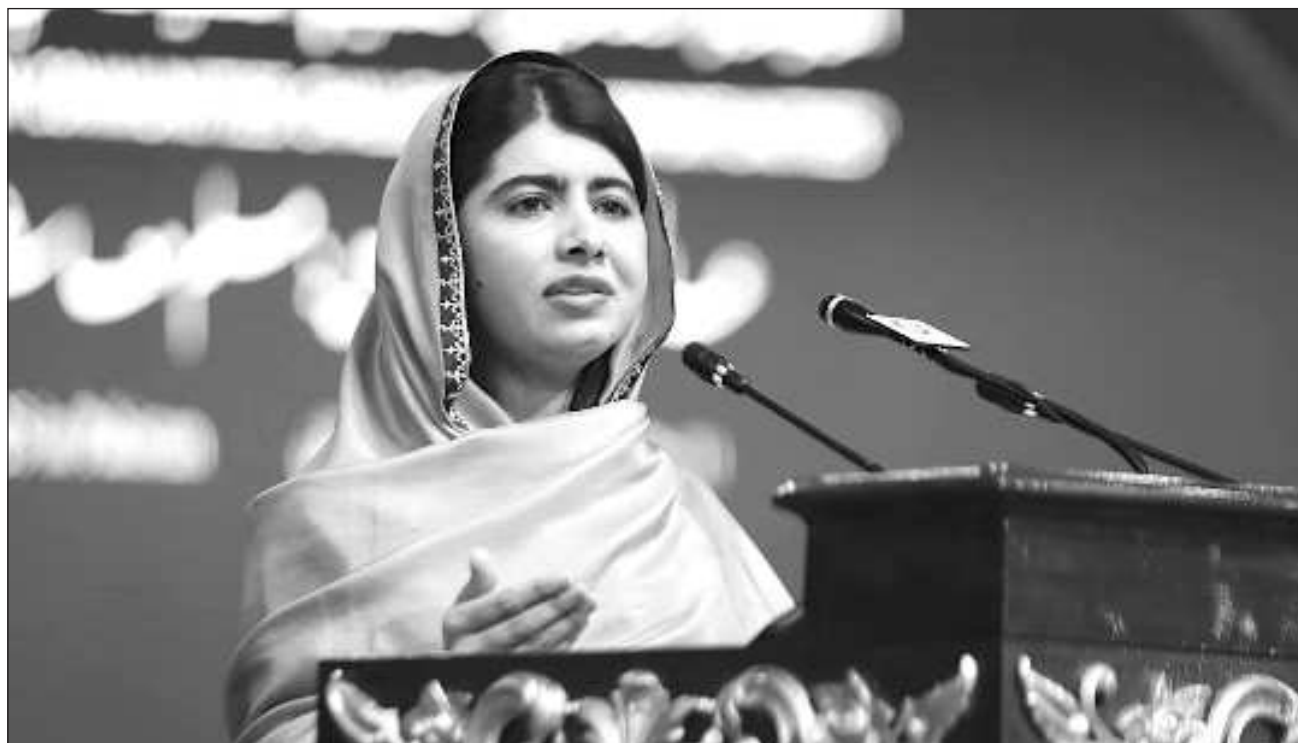
▲ En 2012, cuando tenía 15 años y defendía el derecho de las niñas a la educación en Pakistán, Yousafzai recibió un disparo de los talibanes en el rostro, mientras iba a bordo de un autobús escolar en el remoto valle de Swat, cerca de la frontera con Afganistán.

Luego fue evacuada al Reino Unido, donde vive y se ha convertido en portavoz mundial del derecho a la educación de las niñas. En 2014, a los 17 años, se convirtió en la ganadora más joven del Premio Nobel de la Paz.