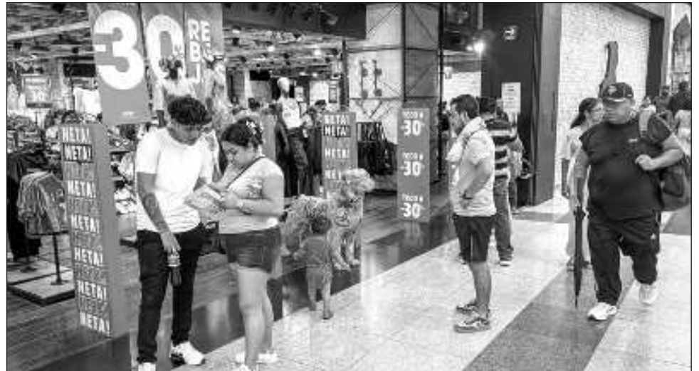
▲ La Canaco Cancún señaló que en 2024 cerraron 365 negocios y muchos de ellos ahora están en la informalidad, ya que no hay presiones ni pagan nada.

Asimismo, enfatizó el entrevistado, siguen los cambios en los hábitos de consumo de muchas personas, sobre todo de los jóvenes, que están más acostumbrados ya al Internet, ya muchos compran todo, hasta sus despensas, en línea. De todas las ventas, estimó que lo que se consume por In-