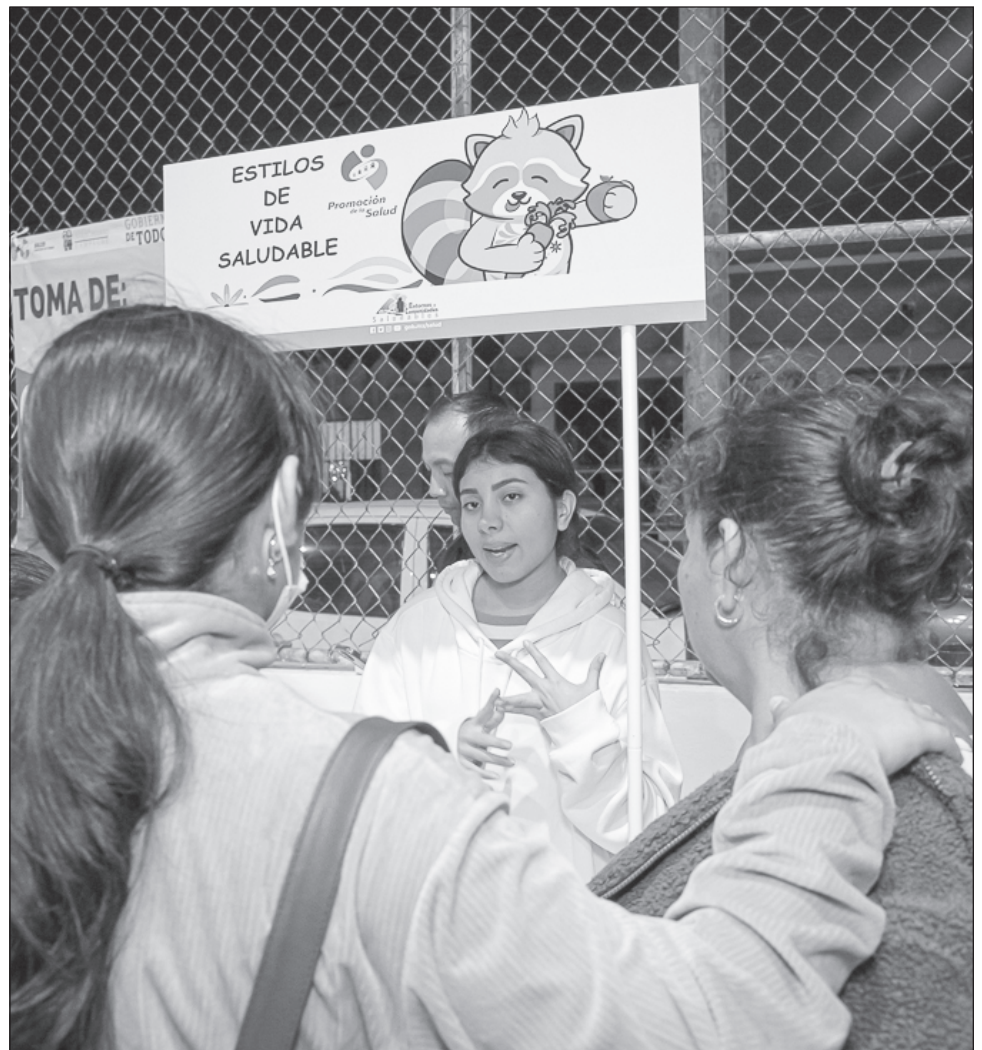
▲ Durante 2024 se lograron seis alianzas con instituciones y dependencias del gobierno y una con la iniciativa privada con la finalidad de generar políticas públicas, estrategias, actividades o acciones diseñadas para la prevención y atención.

Las instituciones que participaron son las Secretarías de Bienestar y la de Medio Ambiente, los Institutos de Cultura, Nacional de Pueblos Indígenas, de la Juventud y Bepensa (privada).