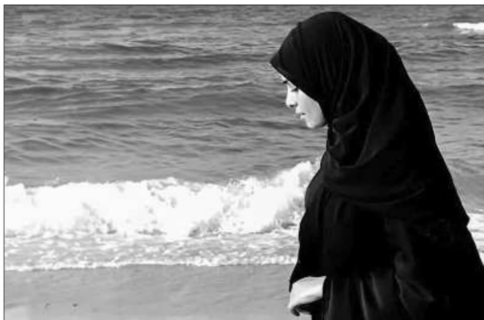
▲ El documental dirigido por Rafael Rangel muestra el miedo que se vive en general ante esa pesadilla interminable que sólo destrucción y muerte ha llevado a la población palestina.

Rasheed enfatizó: “Como hemos visto, a pesar del genocidio implacable –por bombas, heridas o incluso por los bebés que mueren por el frío cortante–, mi pueblo aún encuentra formas de cantar, bailar, sonreír e insistir en vivir. Y si ellos pueden hacerlo, entonces nosotros debemos persistir con más fuerza y determinación en poner fin a esta abominación. Mi pueblo cuenta con todos nosotros