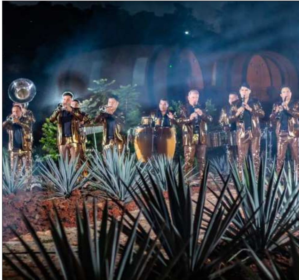
▲ El 3 de marzo, en el Festival de Lunes de Carnaval se presentará la agrupación La Arrolladora Banda El Limón a partir de las 21 horas en el Foro Ah Kim Pech.