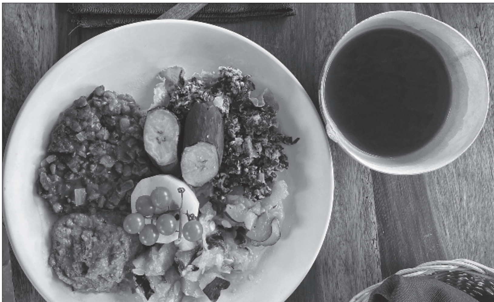
▲ El consumo nacional de frijol ronda el millón de toneladas, lo que significa que en los últimos años México ha dejado de ser autosuficiente, teniendo que importar de países como Estados Unidos, Canadá, Argentina, Guatemala, China y España, alrededor de una cuarta parte de lo que demanda la población. Foto crédito

Otro revés para la producción de frijol en México es la disminución en el consumo de las familias.