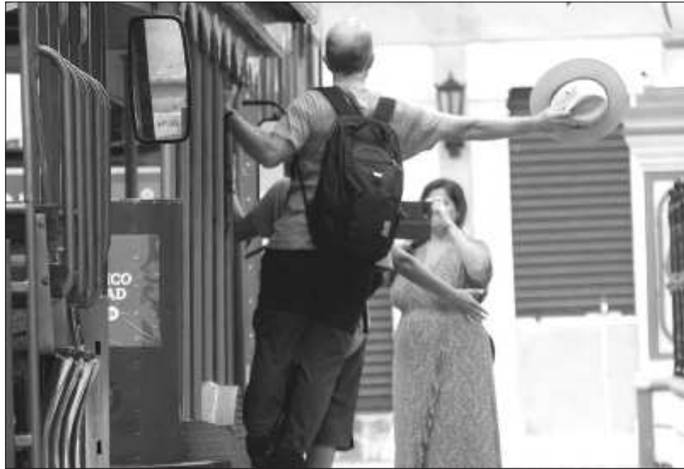
▲ La llegada de turistas anual dejó derrama económica estimada en 4 mil 200 mdp.

Para ser más específicos, el 2023 arribaron un millón 593 mil 288 turistas, esto representa una derrama de 3 mil 807 millones de pesos; ya en el 2024, arribaron