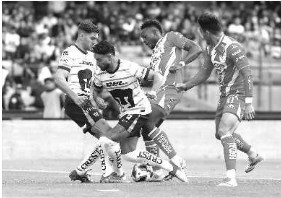
▲ Los Pumas, apoyados en su talento joven, vencieron al Necaxa.

El argentino dio orden de calentar a todo el mundo. Dos de los que lo hicieron fueron Ulises Rivas y Rogelio Funes Mori, decisivos el torneo pasado, en el que cayeron con Monterrey en cuartos de final.