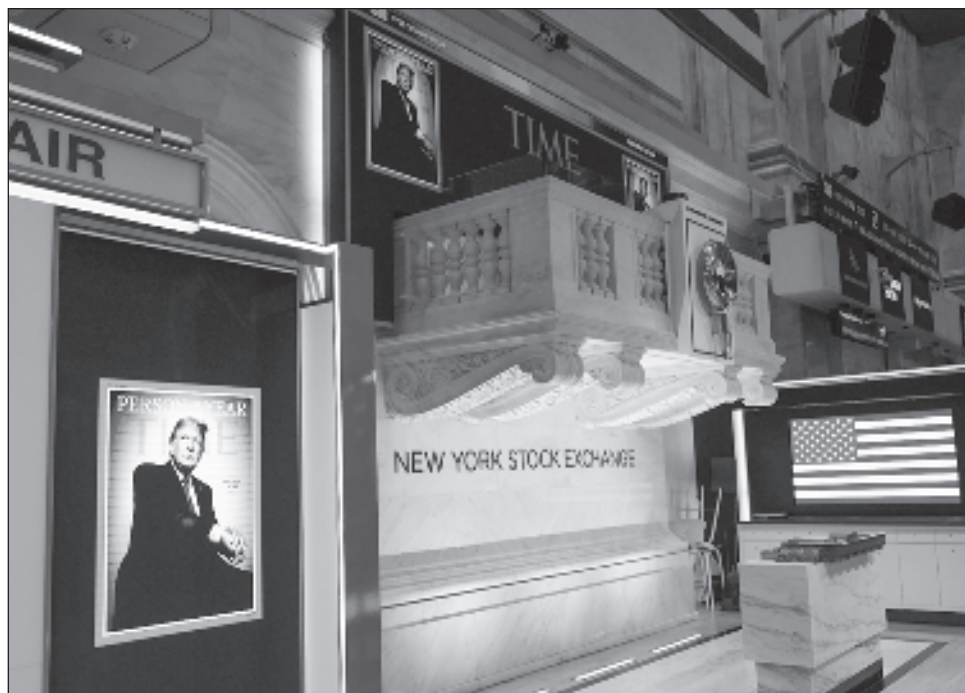
▲ A pesar de sus bravatas y del apoyo de sus simpatizantes que quieren crear realidades alternativas, el futuro presidente Donald Trump no puede cancelar las leyes de la aritmética.

Apelando a medidas "extraordinarias", Biden puede