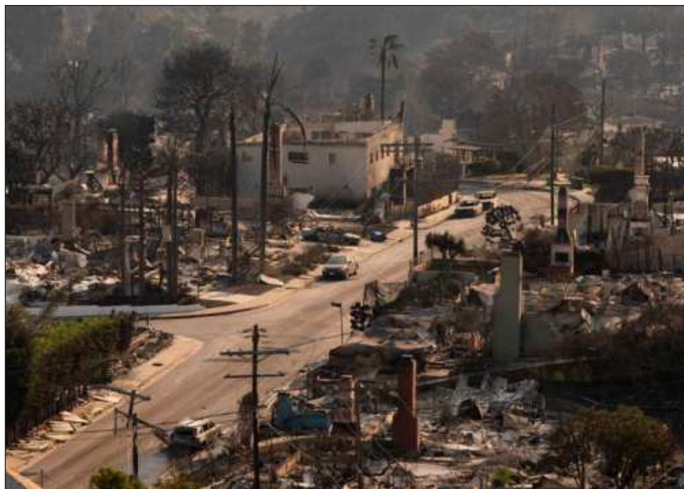
▲ Meteorólogos de Estados Unidos volvieron a advertir de clima peligroso por el regreso de vientos fuertes esta semana, condiciones “muy críticas” para incendios.