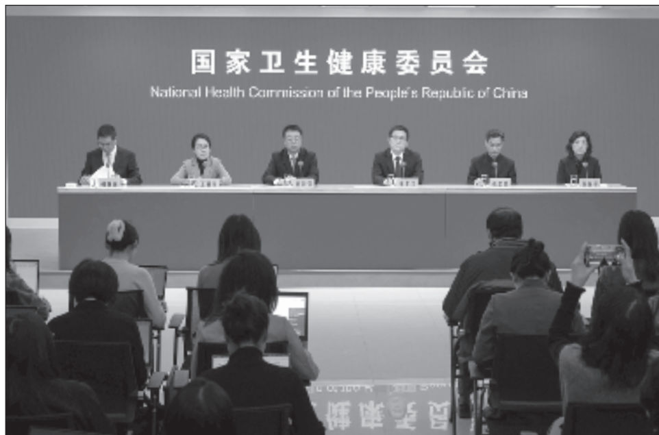
▲ Wang añadió que el aumento de casos del virus en los últimos años, registrado por primera vez en los Países Bajos en 2001, se debe a mejores métodos de detección.

Los expertos dicen que el HMPV no es como el Covid-19, en el sentido de que ha estado presente durante décadas y existe cierta in-