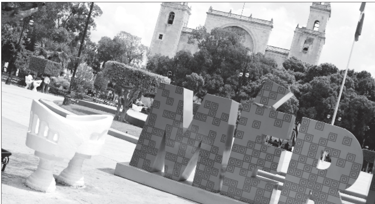
▲ "Desde los mayas antiguos que le dieron origen, pasando por el arribo hispánico y diferentes momentos históricos, la centenaria Jo'/Mérida no ha dejado de crecer y aumentar en habitantes, ritmo que se ha acelerado los últimos años (...) la ciudad creció 12 por ciento en un lustro".

http://orga.enesmerida.unam.mx/ Facebook @ORGACovid19 Instagram @orgacovid19 X @ORGA_COVID19