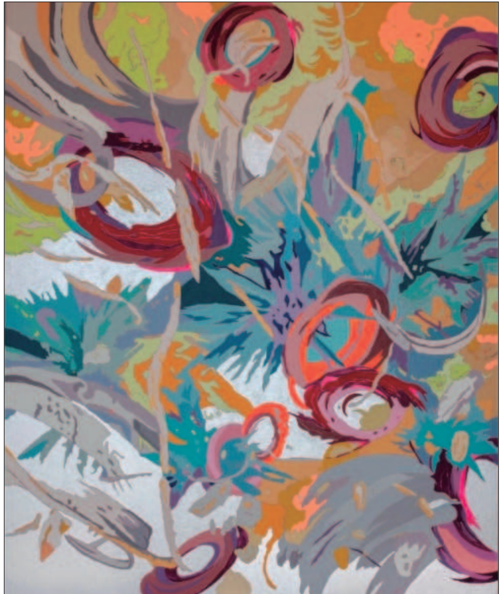
▲ La exhibición en la galería Ramón Alva de la Canal, en Xalapa, Veracruz, reúne 50 piezas entre las cuales destacan gran variedad de exploraciones plásticas que incluyen pintura al óleo, cerámica y dibujo.