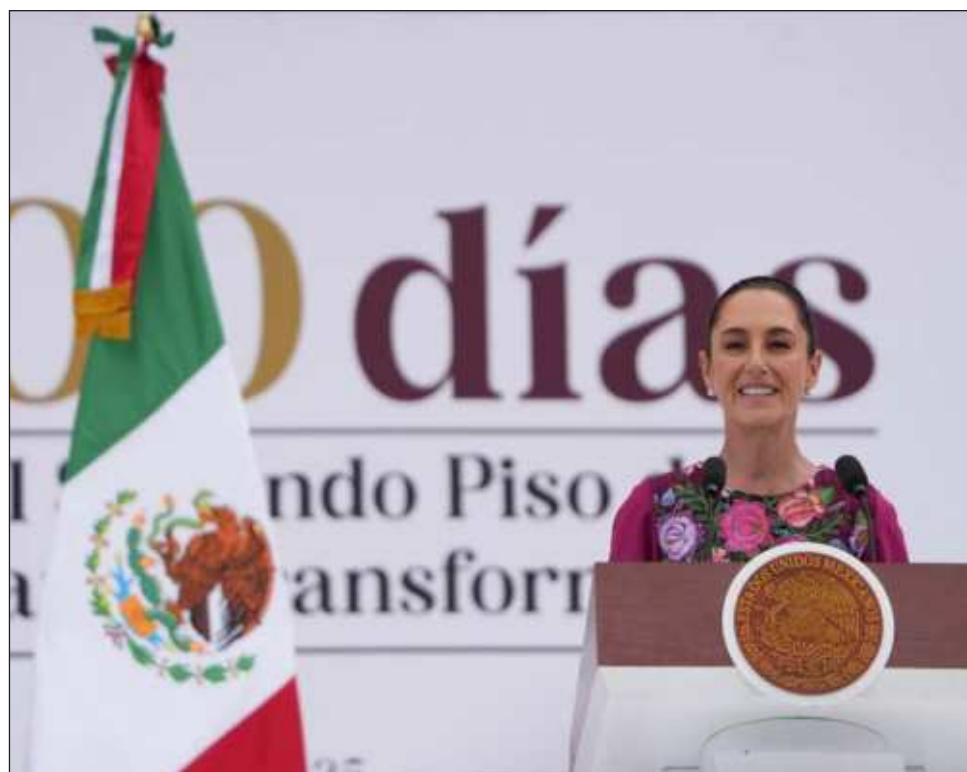
▲ Al rendir su informe de los primeros 100 días de su gobierno, la jefa del Ejecutivo dejó claro que el poder judicial de la federación será autónomo.

“Qué vivan nuestros hermanos migrantes en Estados Unidos, que viva la cuarta transformación, que viva el pueblo de México, que viva México”, lanzó la mandataria al concluir su mensaje.