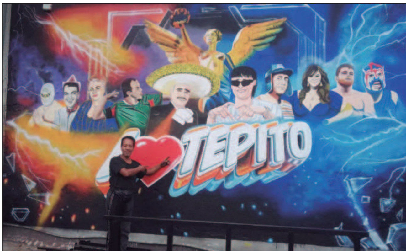
▲ Denominada por las autoridades como un tributo al diseño capitalino, en dicha exposición se explora la escena de esta metrópoli y se presentan algunos de los exponentes más importantes de esa disciplina.

“Hoy día ya hay pocos rotulistas; lo que hace que busquen a unos más y a otros no tanto, es la calidad del trabajo. Me gusta mucho hacer letras, innovar con diseños, jugar con los colores”.