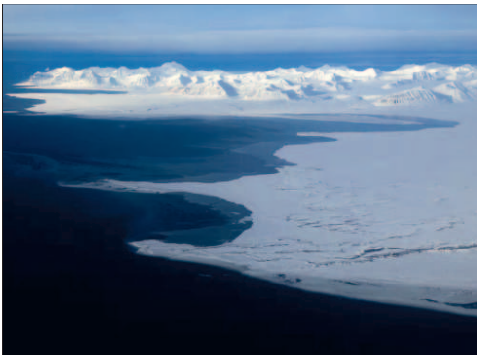
▲ Las temperaturas globales en 2024 fueron 1.28 grados Celsius superiores a la línea de base del siglo XX de la NASA (1951-1980), lo que supera el récord establecido en 2023.

El momento de la publicación de los seis conjuntos de datos de temperatura se coordinó entre las instituciones para destacar las condiciones excepcionales que se experimentaron durante 2024.