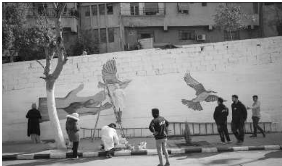
▲ Un mes después de la caída del presidente sirio Bashar al Assad, Arabia Saudita, la principal potencia económica de Oriente Medio, busca aumentar su influencia en Siria.

El gobierno de transición está liderado por Ahmed