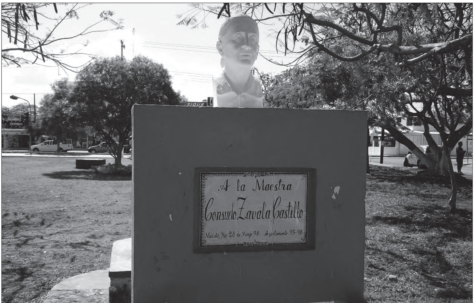
▲ Sus ideas de avanzada y feministas la motivaron a luchar por la emancipación de la mujer a través de la educación.

“Venid compañeros, venid celebremos” el legado de Consuelito que pervive en las mujeres yucatecas. Su lucha continúa inspirando los logros de quienes decidimos seguir con dedicación y entusiasmo su “augusta misión”.