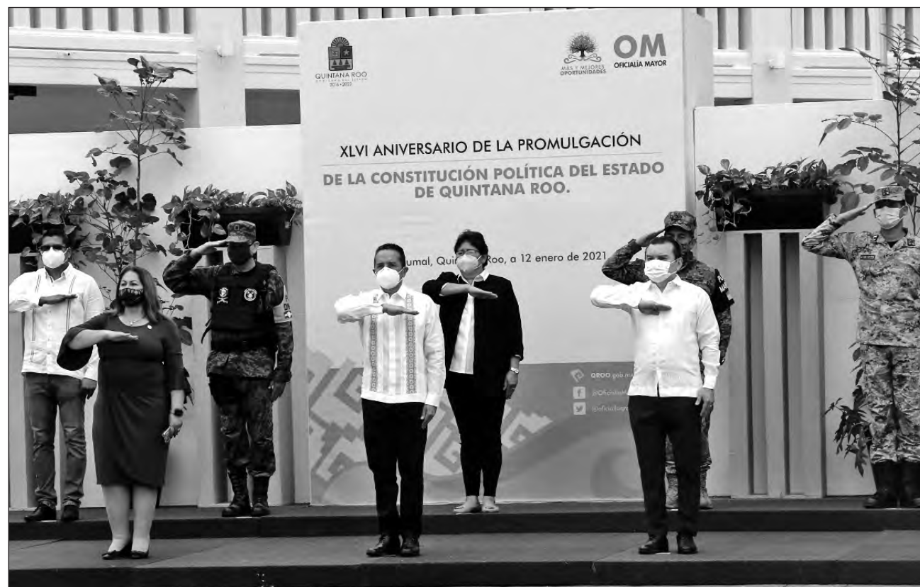
▲ La ceremonia inició con los honores a la Bandera Nacional, seguida del izamiento de la bandera del estado.

El gobernador y las autoridades que le acompañaban se dirigieron al Centro de Convenciones de Chetumal para participar en la Sesión Solemne del Congreso del Estado por motivo del 46