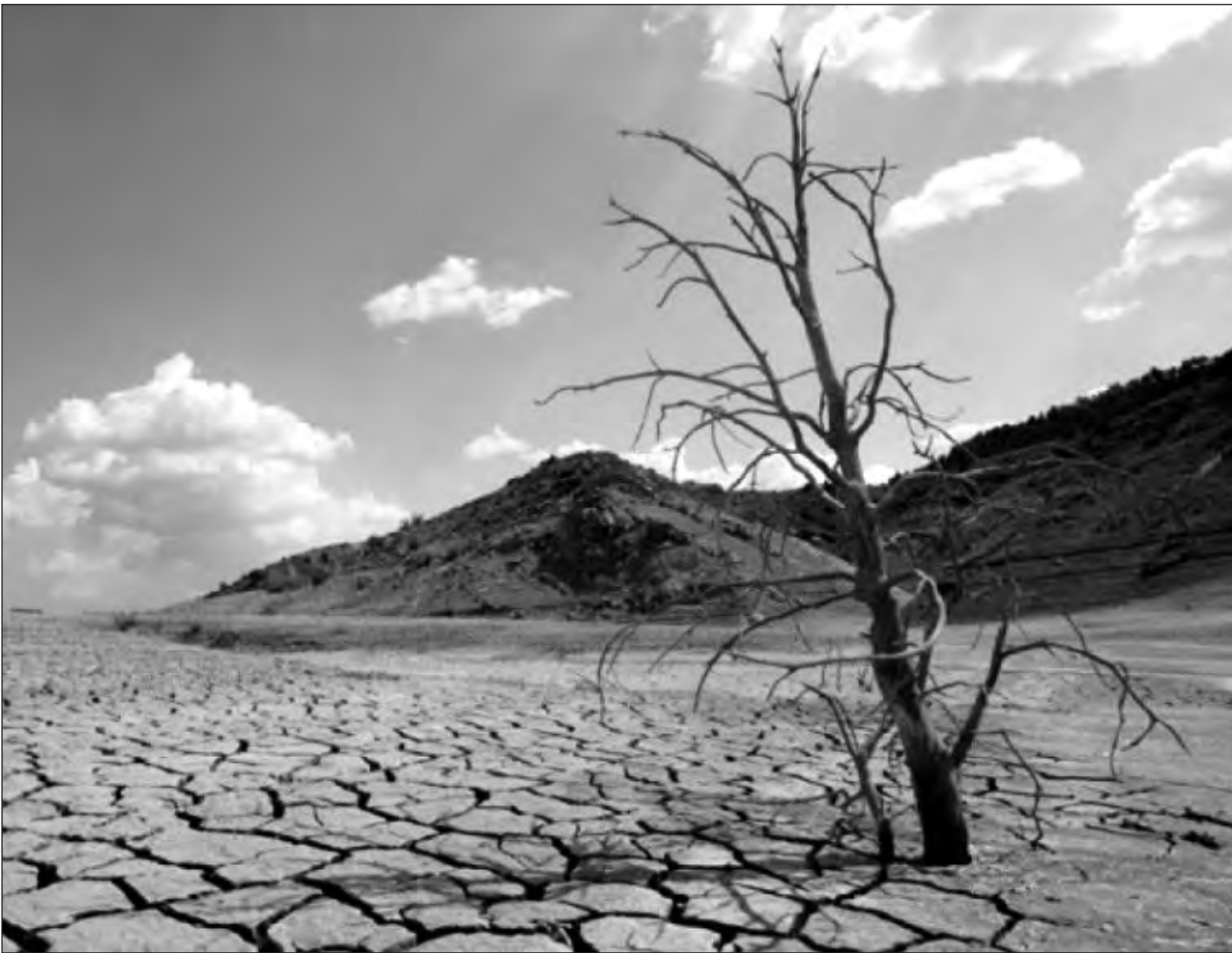
▲ De acuerdo con la última actualización del Monitor de Sequía de México, 954 municipios se encuentran con algún grado de sequía.