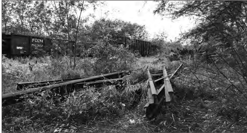
▲ Las características especiales del suelo yucateco exigen soluciones creativas para la puerta en marcha del proyecto ferroviario que promueve el Fonatur.