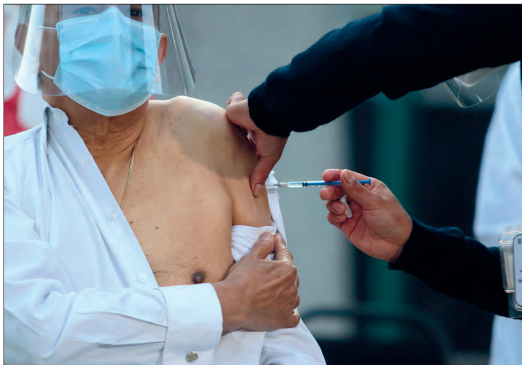
▲ Será necesario mantener, al menos durante todo 2021, el distanciamiento social, la utilización de mascarillas y demás medidas de higiene estipuladas.

En momentos en que buena parte del mundo enfrenta un rebrote en contagios y defunciones provocadas por el COVID-19, la Organización Mundial de la Salud (OMS) echó un nuevo balde de agua fría sobre la opinión pública internacional, al señalar que el reciente estreno de la vacuna para prevenir esa enfermedad y el comienzo de las inoculaciones masivas no van a traducirse en la generación de una inmunidad de rebaño en el curso de este 2021.