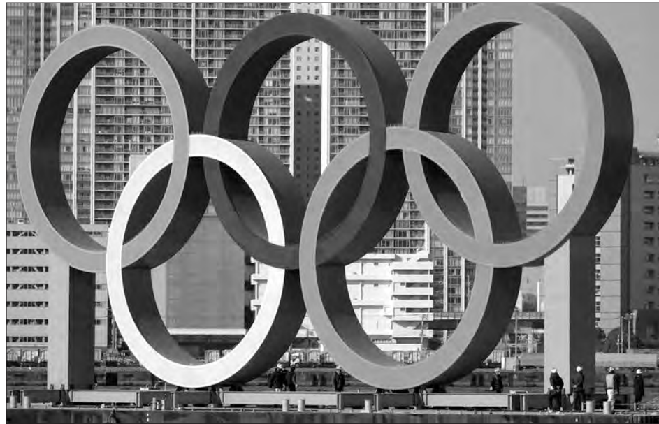
▲ Los organizadores insisten en que los Juegos Olímpicos se llevarán al cabo en Tokio este verano.

Los organizadores y el Comité Olímpico Internacional insisten en que la cita