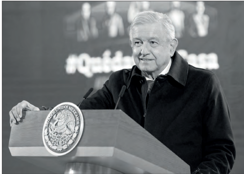
▲ El mandatario asegura que los medios de comunicación al servicio de la mafia del poder están en un plan de desinformación.

“¿Cómo nos van a quitar el derecho de manifestación, de expresión, cómo le quitan el pueblo