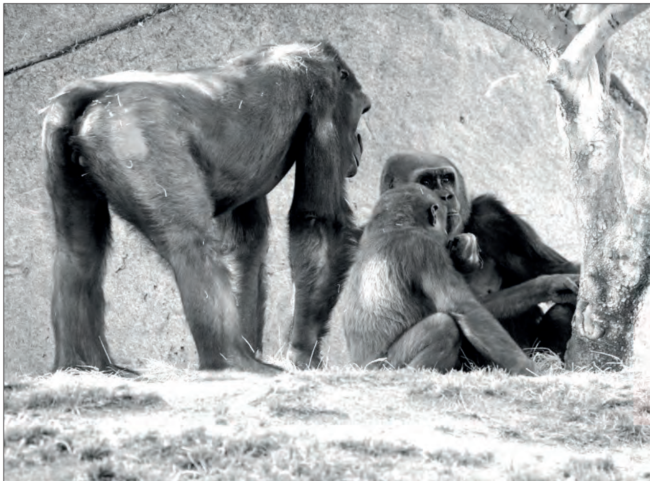
▲ El Zoológico de San Diego se encuentra cerrado al público debido a la pandemia.

Sobre el abordaje al grupo de gorilas, el San Diego Zoo Global dijo desconocer si la infección por SARS-CoV-2 creará una enfermedad similar a la humana en los gorilas. Los veterinarios vigilarán de cerca a los mamíferos y tratarán los síntomas a medida que surjan, apoyándose en funcionarios de salud que tienen experiencia con el virus para su asesoramiento y consulta.