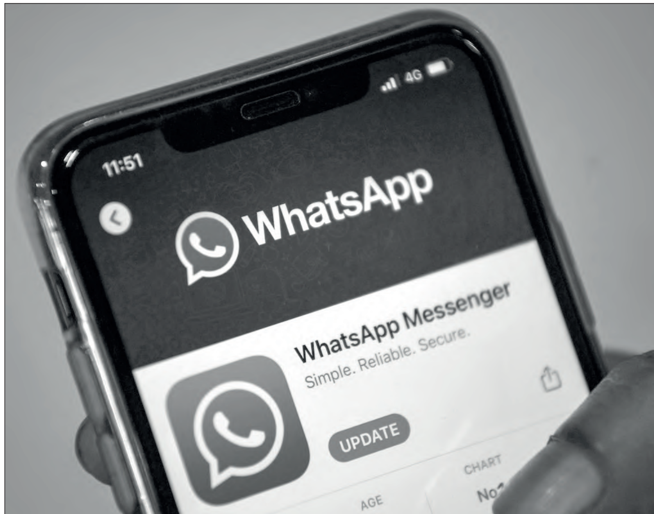
▲ WhatsApp ha recibido muchas críticas, tras haber solicitado a sus dos mil millones de suscriptores aceptar nuevas condiciones de uso.

Sin mencionar a su competencia, hace referencia a WhatsApp, bajo el fuego de las críticas desde el jueves pasado tras haber solicitado a sus dos mil millones de suscriptores aceptar nuevas condiciones de utilización.