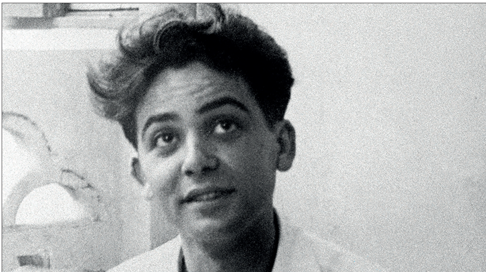
▲ Michèle Audin escribió Una vida breve para reconstruir su propia memoria y así refrescar la de los europeos. En esa novela recuerda cómo los soldados franceses la arrancaron de los brazos de su padre, el joven matemático comunista Maurice Audin.