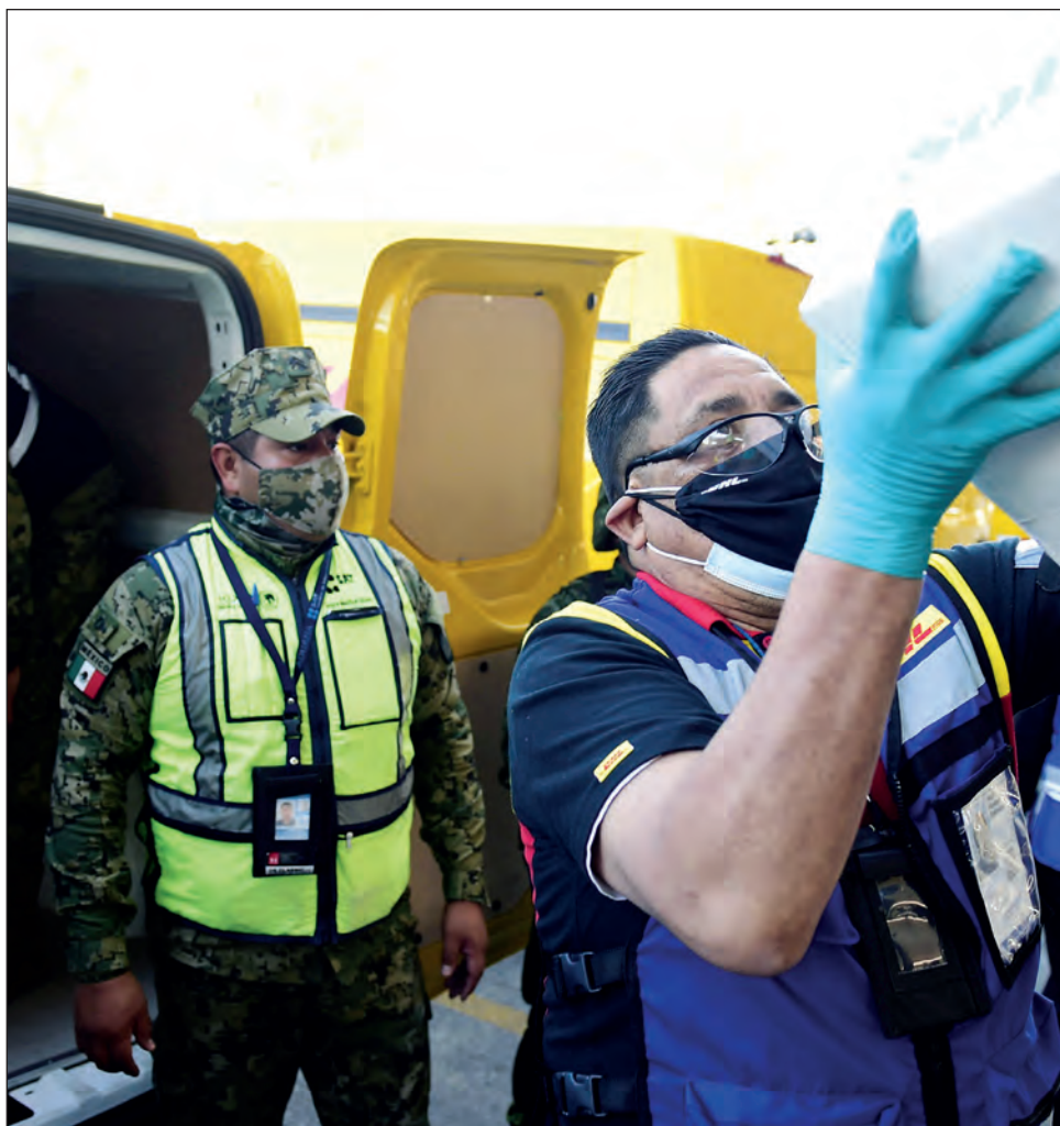
▲ La vacuna anti COVID se reparte por ocho rutas aéreas.

Por otro lado, dijo, incrementó el número de pruebas rápidas que ya se aplican en una nueva etapa en Chetumal y Cancún del 11 al 17 de enero. Indicó que en una primera etapa se aplicaron 10 mil pruebas y ahora sumarán otras 15 mil.