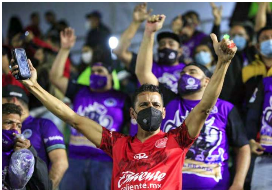
▲ En el estadio Kraken no hubo la distancia idónea entre los aficionados que poblaron las gradas durante el partido de la fecha uno entre Mazatlán y Necaxa.

“Sin embargo, me llama mucho la atención que se haya autorizado justo cuando los niveles de con-