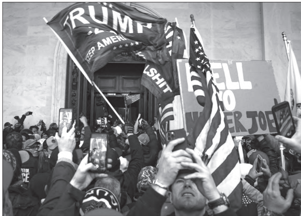
▲ El moderno edificio que alberga las cámaras de diputados y senadores sólo había sido sitiado en la ficción de Hollywood por extraterrestres en la cinta ¡Marcianos al ataque! .

El nacionalista blanco Tim Gionet, conocido en Internet como Baked Alaska y un participante notorio en la marcha Unite the Right en Charlottesville, transmitió un en vivo desde las oficinas del Congreso, documentando alegremente la irrupción para más de 15 mil espectadores en la plataforma de streaming Drive . El