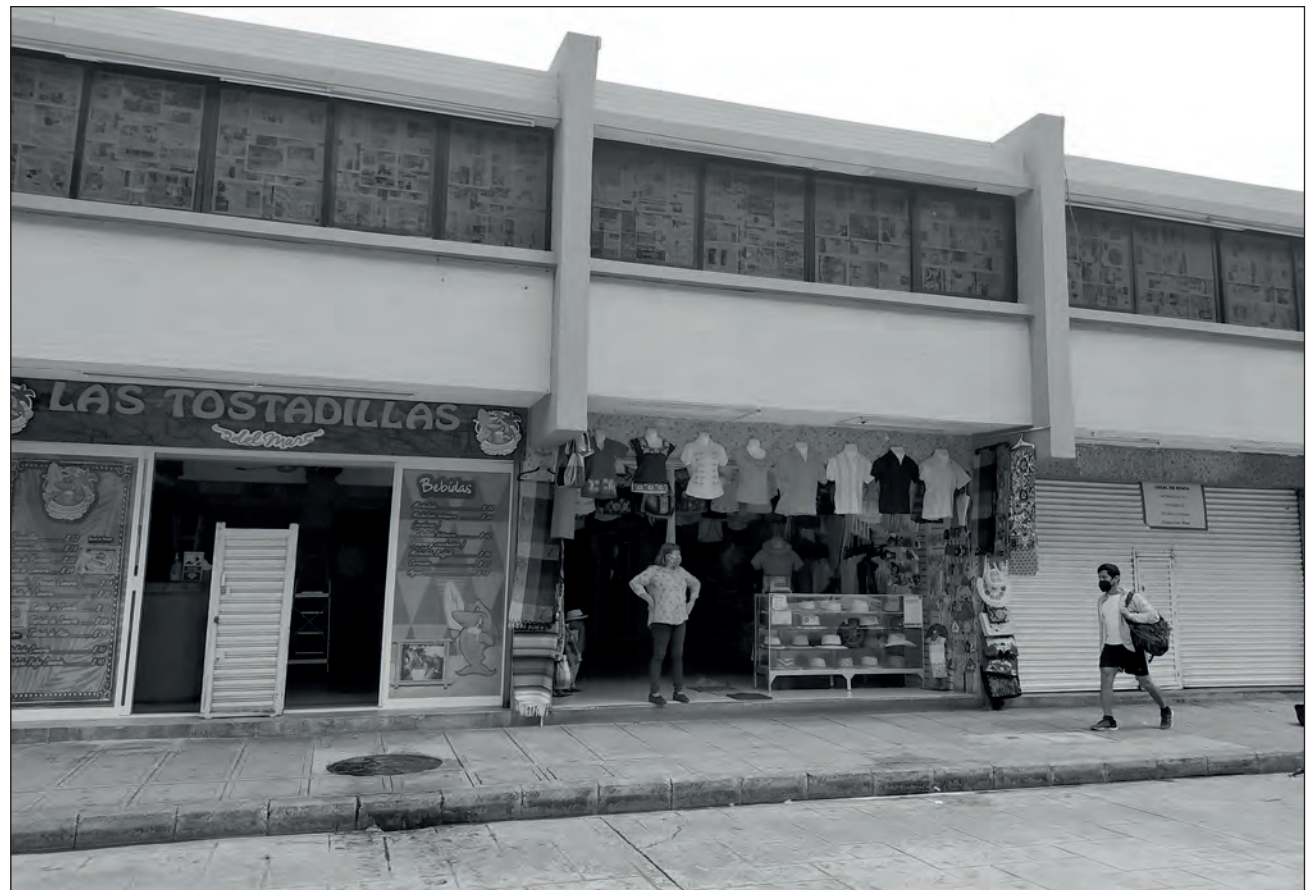
▲ Las restricciones de de movilidad y las clases sean en línea han afectado a los comercios del centro, ya que redujeron el tránsito de las personas por la zona..

Los comerciantes de la Cámara Nacional de Comercio en Pequeño de Servicios y Turismo (Canacope) describen que en la cadena de empresarios, ellos son los más perjudicados, pues dependen en gran medida de la actividad económica de otras empresas de mayor tamaño.