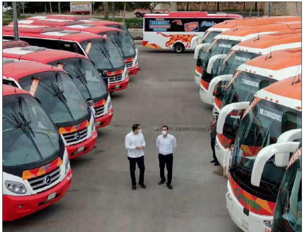
▲ La compañía anunció la renovación de parte de su flota vehicular e infraestructura tecnológica en su nuevo modelo de viaje, basado en uno inteligente denominado AhorroBus.