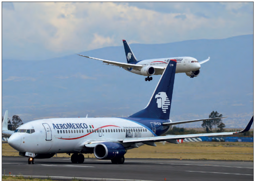
▲ Aeroméxico alega “motivo notorio de fuerza mayor” para su solicitud de dar por terminados los contratos colectivos de trabajo.

Señaló que, además de cumplir con los compromisos y objetivos contractualmente requeridos por los fondeadores bajo el financiamiento preferencial garantizado, que fue obtenido dentro del proceso voluntario de restructuración financiera bajo el capítulo 11 de la legislación de Estados Unidos y de lograr las condiciones necesarias para tener acceso al siguiente desembolso bajo el tramo 2, los recursos son indispensables no sólo para preservar el negocio en marcha sino para evitar incumplimientos generalizados en las obligaciones de Aeroméxico con los acreedores financieros.