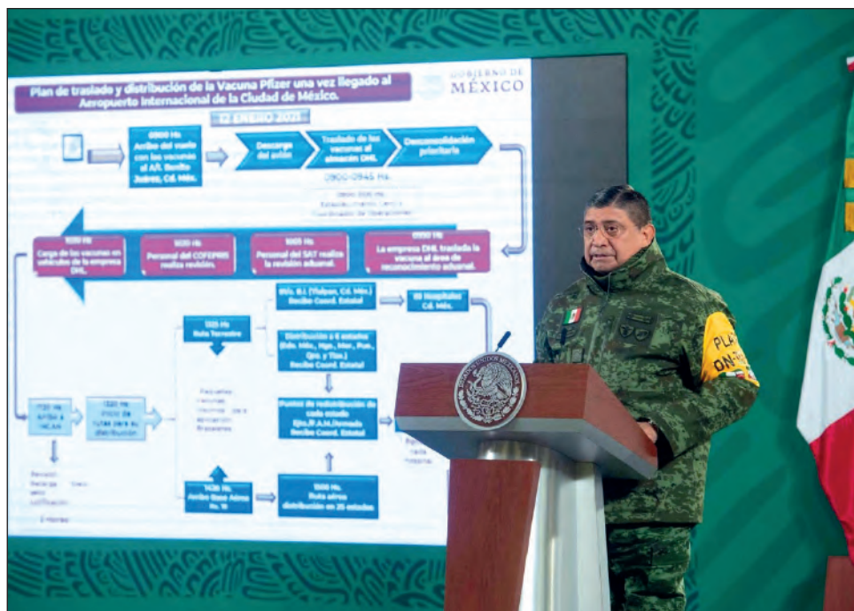
▲ El secretario de la Defensa Nacional, Luis Cresencio Sandoval González, explica el plan de distribución de vacunas en el país durante la conferencia presidencial matutina en Palacio Nacional, ayer 12 de enero.

Señaló que en principio las vacunas se trasladarán a las grandes ciudades me-