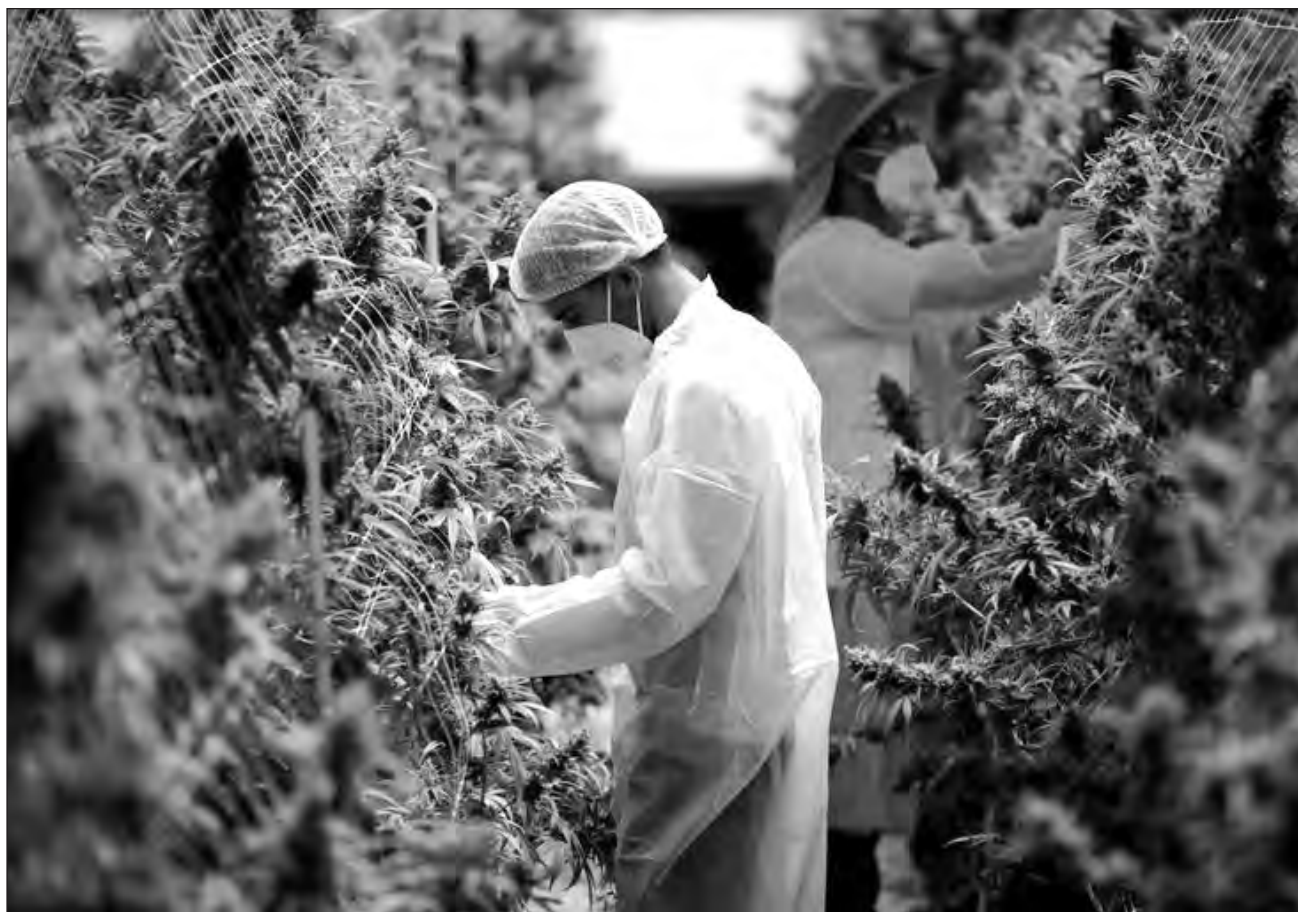
▲ Las farmacias autorizadas para la venta de medicinas elaboradas con cannabis deberán contar con un registro de pacientes.

Los médicos que deseen prescribir alguno de los productos farmacológicos con cannabis que serán controlados, deberán obtener el código de barras para los recetas especiales de prescripción de medicamentos, el cual proporcionará la Comisión Federal para la Protección contra Riesgos