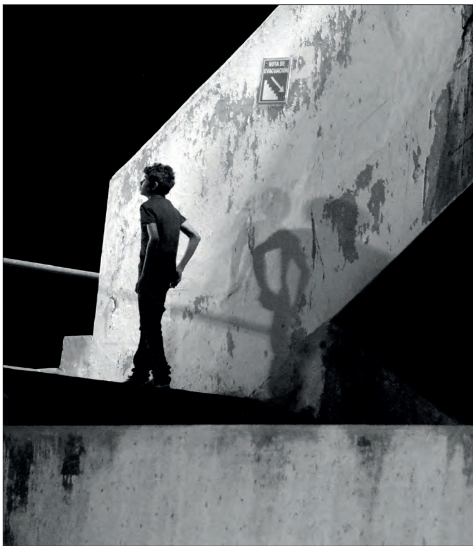
▲ Hace falta información, mucha gente ignora que tuvo depresión en la infancia.

El trabajo con niños y adolescentes implica trabajar con la familia para ver cómo ayudar al niño y al entorno. “No hay que tener miedo a la palabra depresión, es algo que se puede prevenir y a la vez algo que puede pasarle a cualquier persona, incluso a los niños, y lo mejor es quitarle el miedo a pedir atención psicológica siendo adultos, porque eso le quitará el miedo a los niños a pedir ayuda”, concluyó.