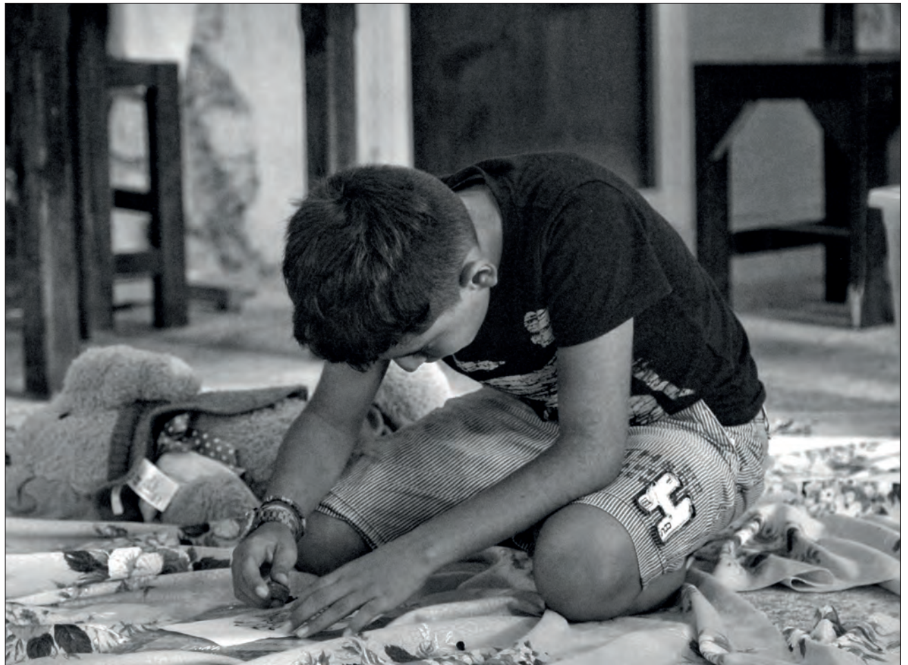
▲ Tristeza constante, llanto en exceso o irritabilidad, dejar de disfrutar actividades que antes eran placenteras, son síntomas de que la salud mental de los niños está siendo afectada.

En entrevista con motivo del día de la depresión, que se conmemora este 13 de enero, la terapeuta conductiva-conductual explicó que la depresión infantil aún es un tema del que no se habla mucho: "Estamos hablando de que el cinco por ciento de la población ha tenido depresión durante la infancia o adolescencia, y es un estimado porque justamente, como no todo el mundo accede a atención psicológica, supones que el número es más alto".