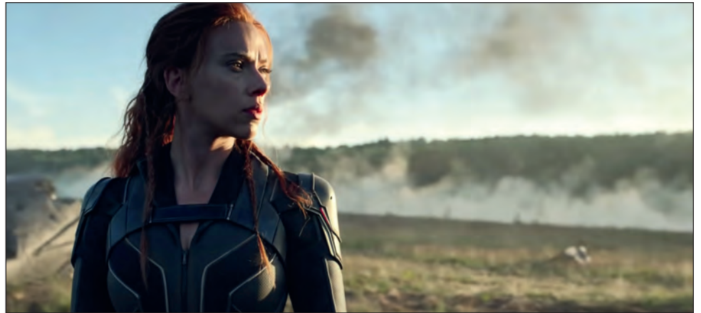
▲ El aplazamiento de Viuda Negra , protagonizada por Scarlett Johansson, tuvo un efecto dominó en el resto de lanzamientos del universo de Marvel. Fotograma de Viuda Negra

Samaritan . Una de las pocas películas del género no vinculadas a una franquicia que se estrenará en 2021. Protagonizada por Sylvester Stallone, Samaritan relata la historia de un joven que descubre que un superhéroe al que se creía muerto hace 20 años sigue vivo. Dirigida por Julius Avery ( Overlord ), se espera que sea una ver-