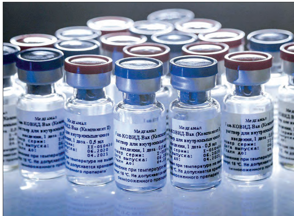
▲ El subsecretario de Salud señaló que hay un avance muy positivo en los diferentes procesos de adquisición de vacunas.

“En esta parte del mundo habíamos tenido dificultades de acceso a la información sobre la información rusa; había algunas inquietudes sobre la seguridad y la eficacia de esta vacuna derivadas de ensayos clínicos en la fase 3, dado que hasta el momento sólo