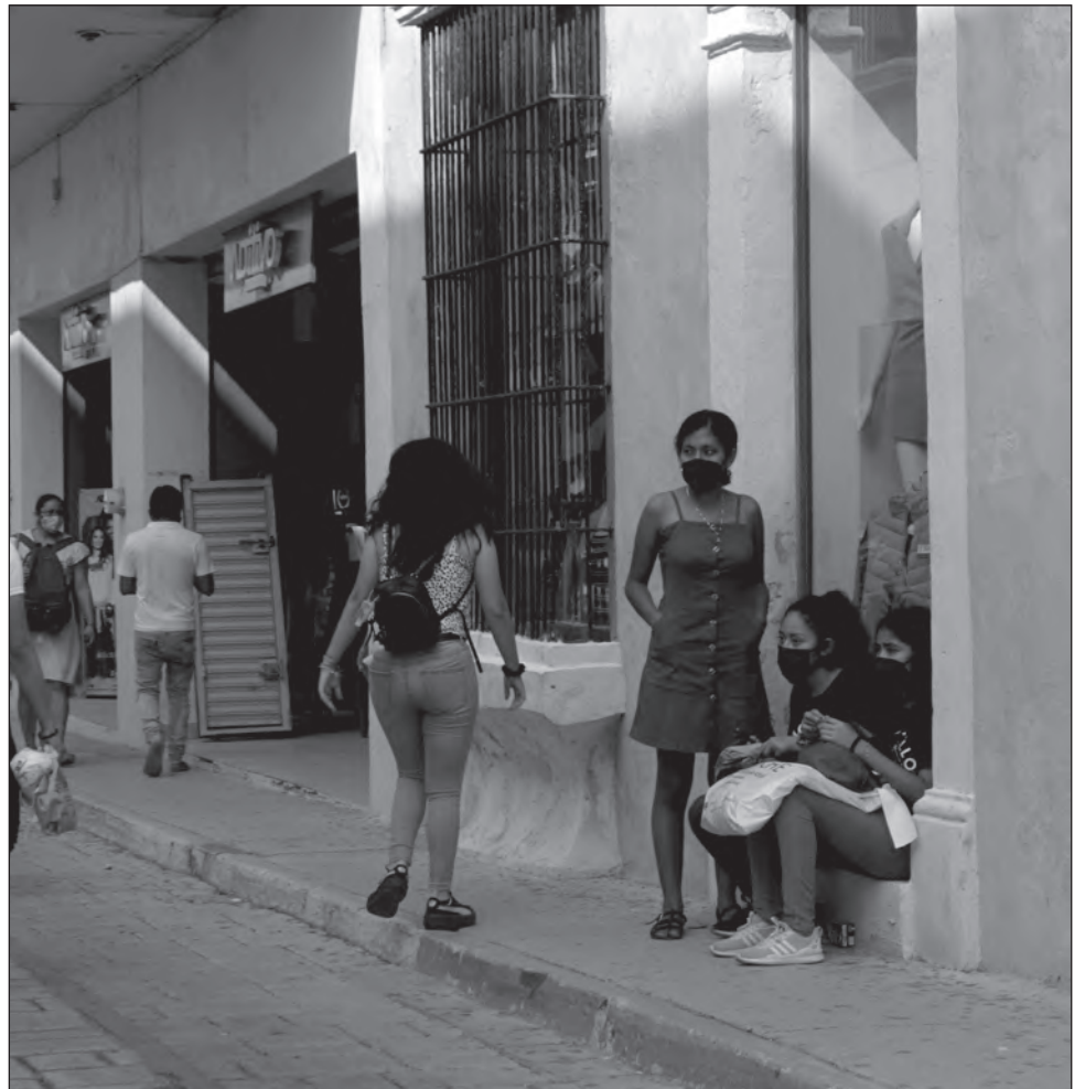
▲ Los giros de ropa y novedades fueron los de mayor movimiento en el último trimestre de 2020.

“La pandemia trajo un aumento al desempleo inimaginable, cierre de empresas y un flujo económico bajo; por lo que en lo que respecta a los últimos tres meses, hubo desarrollo económico atípico, a algunos meses fue excelente y a otros mal, pero hay que seguir en la búsqueda de estrategias que abonen a un desarrollo paulatino”.