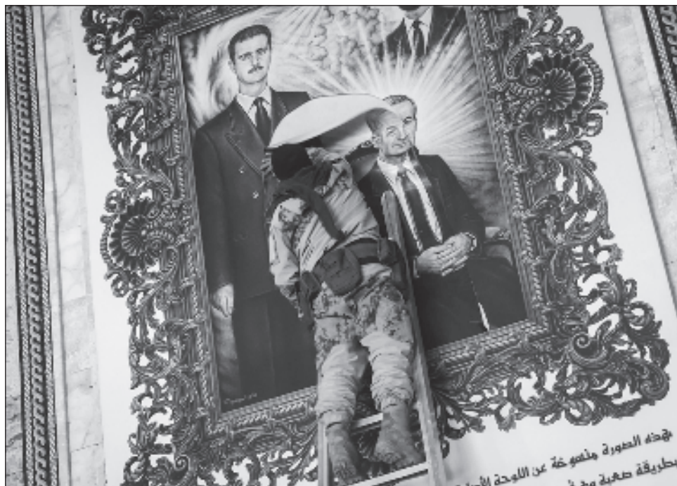
▲ El nuevo primer ministro dirigía hasta ahora el gobierno del bastión rebelde de Idlib, en el noroeste de Siria, de donde salió la ofensiva que derrocó al presidente Al Assad.

El nuevo primer ministro dirigía hasta ahora el gobierno del bastión rebelde de Idlib, en el noroeste de Si-