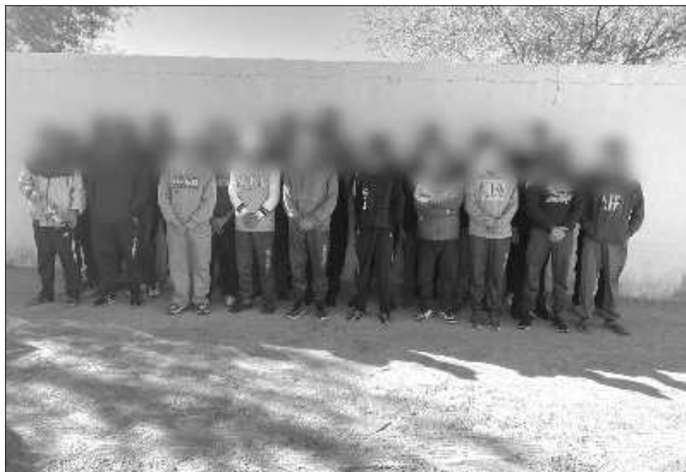
▲ Entre las víctimas rescatadas se encuentran 30 personas de origen indio, cuatro ecuatorianas, una nepalí y una paquistaní; todos fueron atendidos por el INM.

Este rescate se da en un momento crítico para la