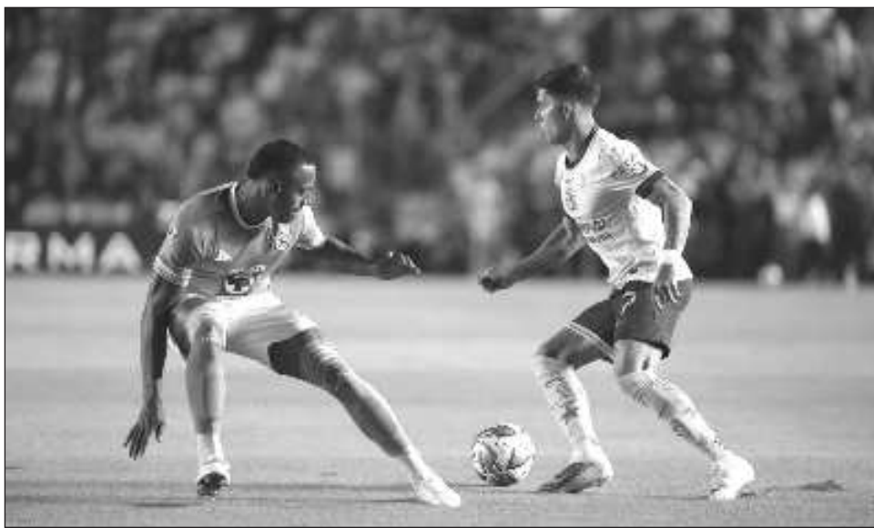
▲ El bicampeón América dejó en el camino a los dos mejores equipos de la fase regular.

"Viviremos una noche mágica con estadio lleno, no es nuestro estadio, pero nos sentimos mucho en casa", dijo Jardine. "Veamos si ha-