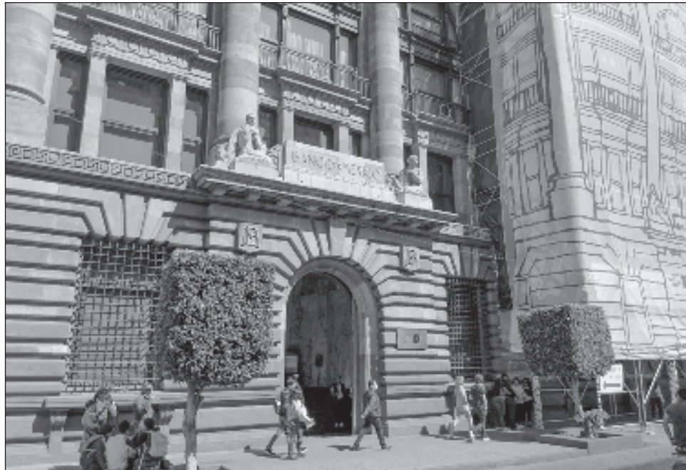
▲ Victoria Rodríguez Ceja, gobernadora del Banco de México, afirmó para el tercer trimestre del año, el sector financiero local ha mantenido su estabilidad gracias a su robustez, con una banca comercial que mantiene altos niveles de capital y liquidez.

No obstante, al presentar el informe Reporte de esta-