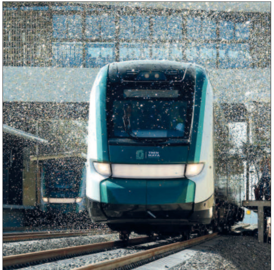
▲ El 31 de diciembre de 2023 el entonces presidente de México, Andrés Manuel López Obrador, hizo el viaje inaugural del Tren Maya, saliendo de la estación Cancún Aeropuerto y llegando a Palenque, Chiapas, en un tiempo aproximado de 11 horas.

Para el domingo 15 está previsto un evento en Chetumal para conmemorar el aniversario del Tren Maya.