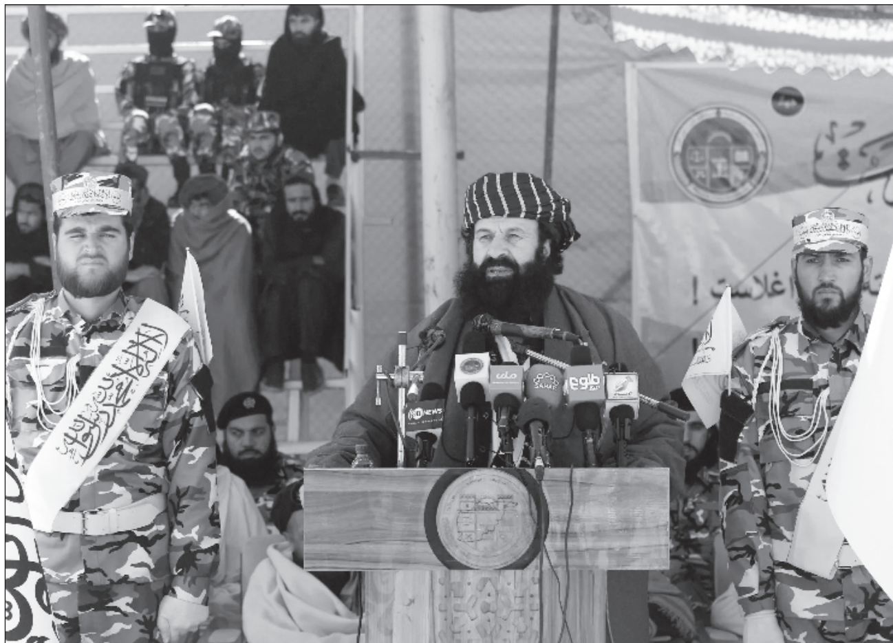
▲ Rahman Haqqani es el funcionario talibán de más alto nivel fallecido en un atentado desde que los fundamentalistas se hicieron con el control de Kabul en agosto de 2021; la explosión fue producto de un ataque contra el despacho oficial.

Agregaron que dicho combatiente "esperó el momento en que el destacado funcionario, Khalilur Haqqani, saliera de su oficina, acompañado por varios de sus ayudantes y guardias" para detonar su chaleco explosivo y matar al responsable, que iba acompañado de "sus ayudantes y