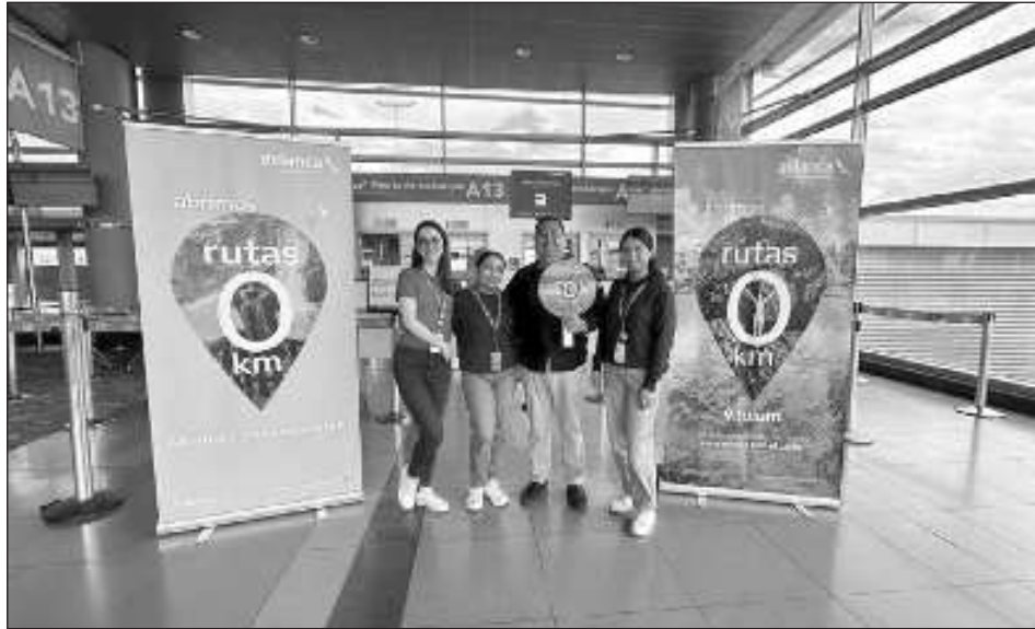
▲ El vuelo de la aerolínea Avianca con el número 94 proveniente de Bogotá, Colombia, llegó con 160 pasajeros a bordo.

Declaró que junto a él viajó de cortesía un grupo de fam trip , con la finalidad