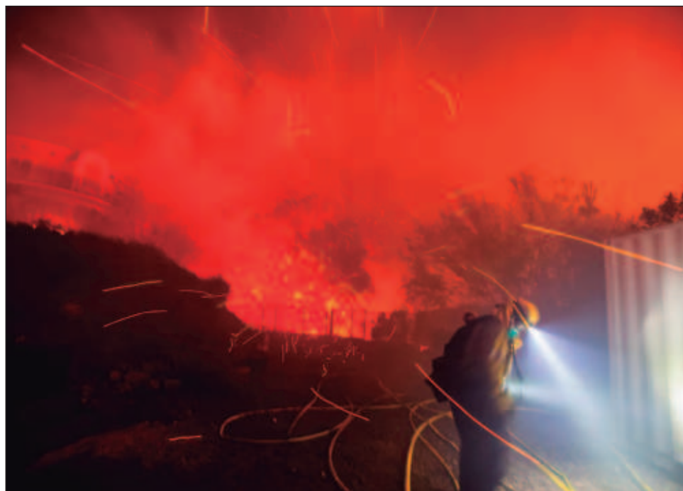
▲ La mayoría de los daños se registran en Malibú, una comunidad de unos 10 mil habitantes en el extremo oeste de Los Ángeles, conocida por su paisaje de acantilados junto al mar.

Más de mil 500 bomberos combatían el incendio; muchos de ellos escalaban inclinados cañones cerca de las líneas de fuego y otros rociaban con mangueras los techos colapsados de establos de caballos y hogares carbonizados.