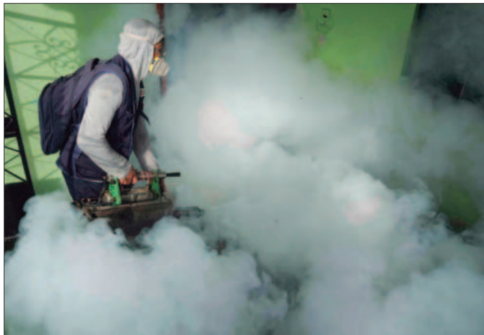
▲ "El dengue está representando un riesgo mayor de lo normal para los niños" en países como Guatemala, afirmó el doctor Jarbas Barbosa en una rueda de prensa.

Los menores de 15 años representan más de un tercio de los casos graves en países como Costa Rica, México y Paraguay.