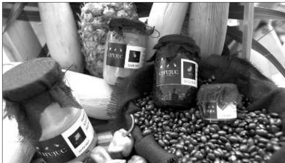
▲ El público podrá encontrar productos artesanales de excelente calidad, como bolsas tejidas, joyería artesanal, decoraciones pintadas a mano, playeras, artesanías de macramé y madera, blusas bordadas, servilleteros, entre otros.

Las expositoras formaron parte del curso Sé mujer