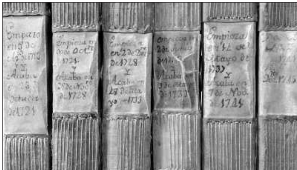
▲ La octava actualización de la vigesimotercera edición del DLE por primera vez aspira a incluir las entradas, acepciones y vocablos de uso cotidiano por toda su comunidad.

En la sede de la RAE se presentó la octava actualización de la vigesimotercera edición del Diccionario de la Lengua Española (DLE), con la que se cierra un ciclo. Queremos cuidar la vida de la lengua