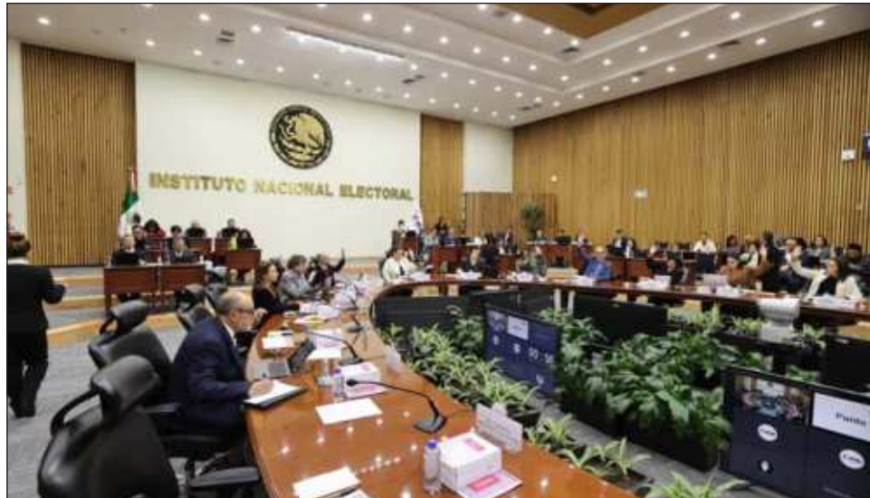
▲ Descartan reducir financiamiento a partidos, de casi 8 mil millones, pues está diseñado a partir de una fórmula establecida en la Constitución, de ahí que la merma recaerá en la elección de juzgadores.

“Genera una preocupación importante; nosotros estamos obligados a realizar la elección judicial, pero ese re-