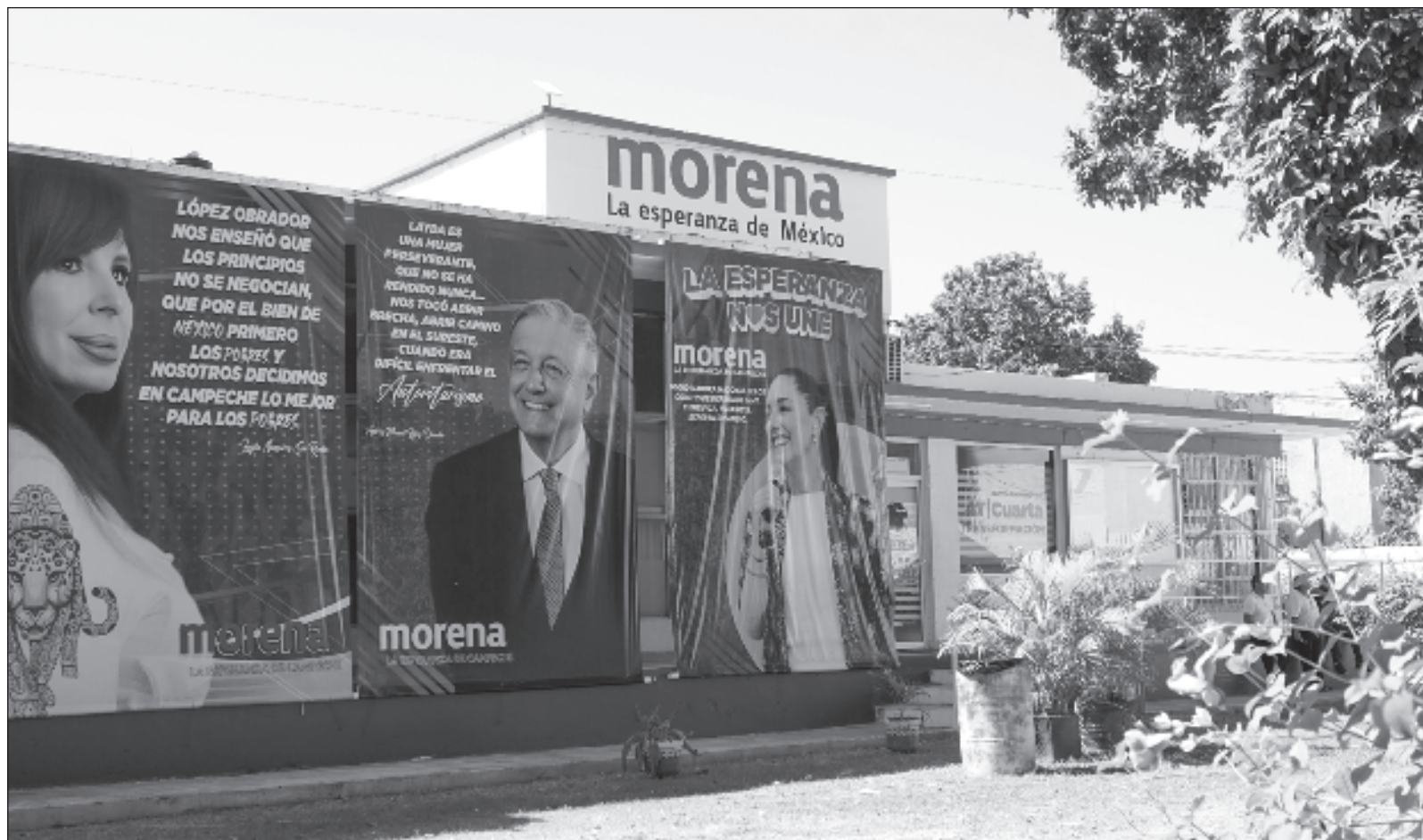
▲ "Lo tajante de sus afirmaciones se perdieron en su pragmatismo político, cuando se convirtió de facto en el rasero para medir el bien y el mal, sin importar las acciones de las personas. Así 'perdonó' y 'limpió' a muchos personajes de partidos de oposición que se sumaron a su movimiento".