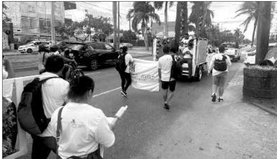
▲ Las autoridades locales han preparado un operativo de seguridad que incluye la participación de la Guardia Nacional, Sedena, Marina y Protección Civil.

Dijo que cada día, tres o cuatro grupos han pasado