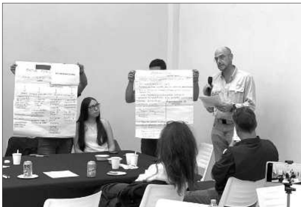
▲ En el evento efectuado en el Colegio de Ingenieros y Arquitectos, los representantes de los sectores social, académico, privado, ambiental, entre otros, dieron su opinión del tema.

Detalló que cada mesa se dividió por sectores como agrícola, minería y asentamientos humanos, entre otros, de tal manera que cada uno de los participantes expuso y señaló algunos criterios o lineamientos que