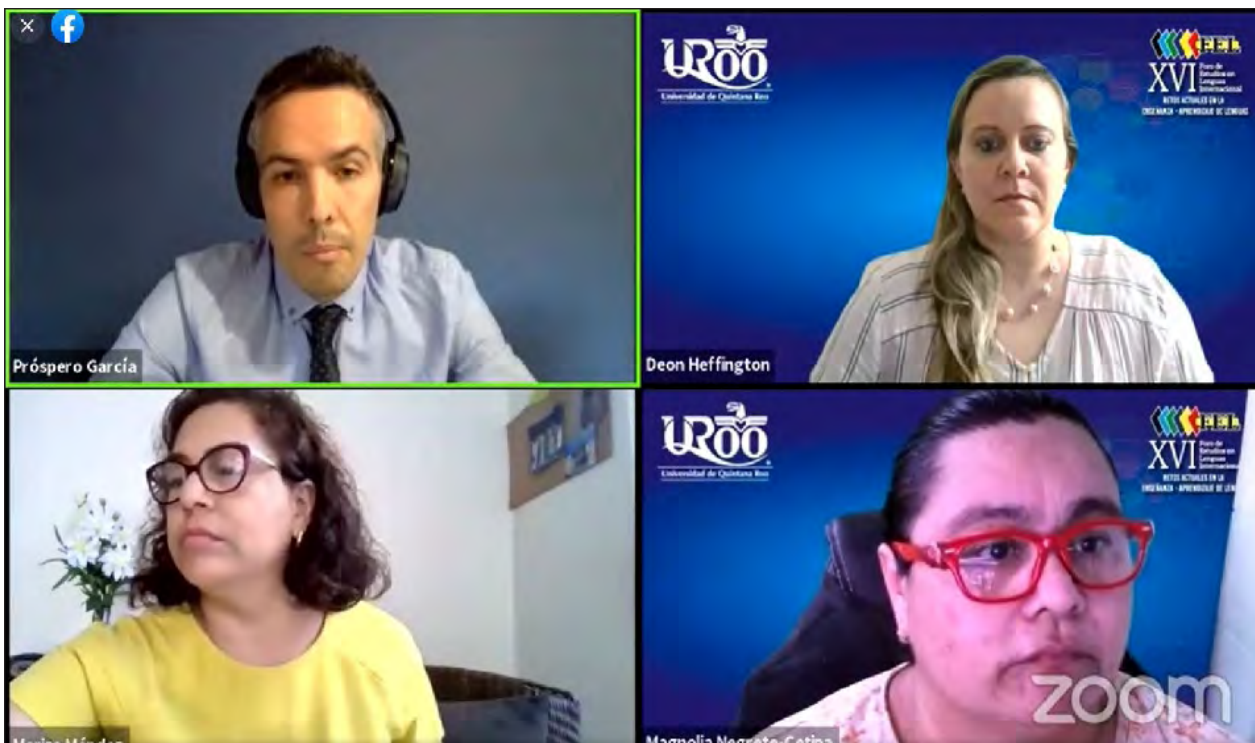
▲ Las sesiones consistieron en la video-grabación de 104 ponencias y mesas redondas.

De la UPMH participan igual 24 estudiantes de las carreras de Ingeniería en Logística y Transporte, Comercio Internacional y Aduanas, Arquitectura Bioclimática y Energía, Animación y Efectos Visuales, Aeronáutica.