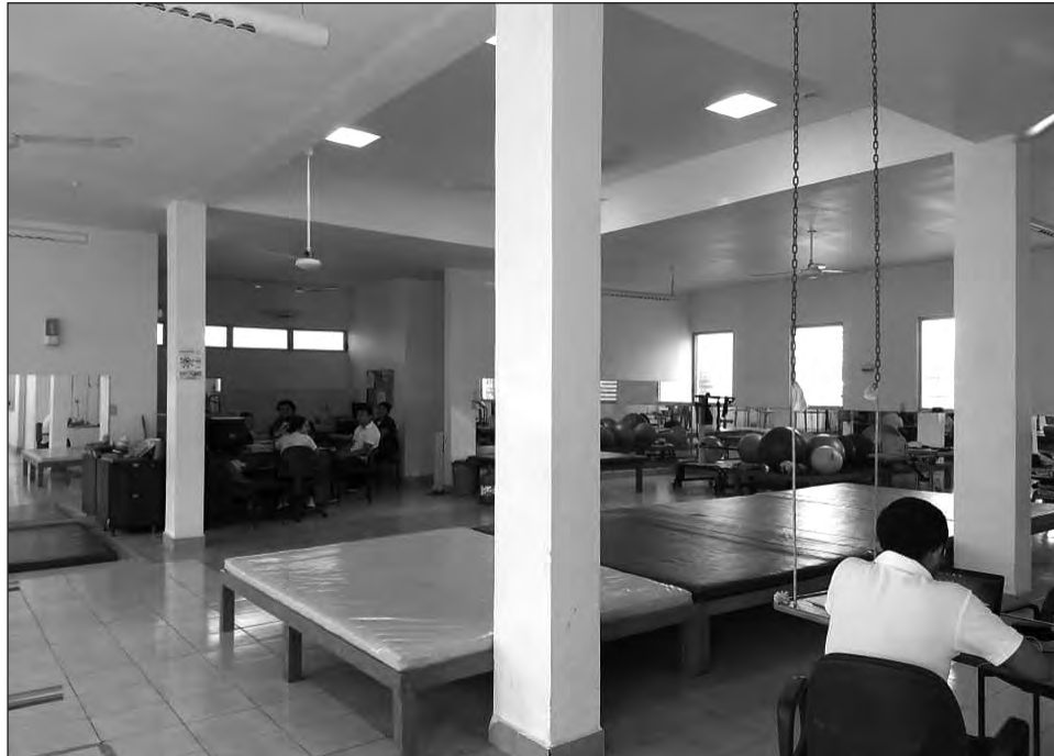
▲ Este año, la asociación civil se trazó la meta de recaudar 470 mil pesos que se utilizarán para cubrir el costo de las terapias de sus 110 alumnos y alumnas que presentan condiciones intelectuales y neuromotoras.

En ese sentido, Bárbara Guasch hizo un llamado a todos los sectores de la sociedad y los diferentes órde-