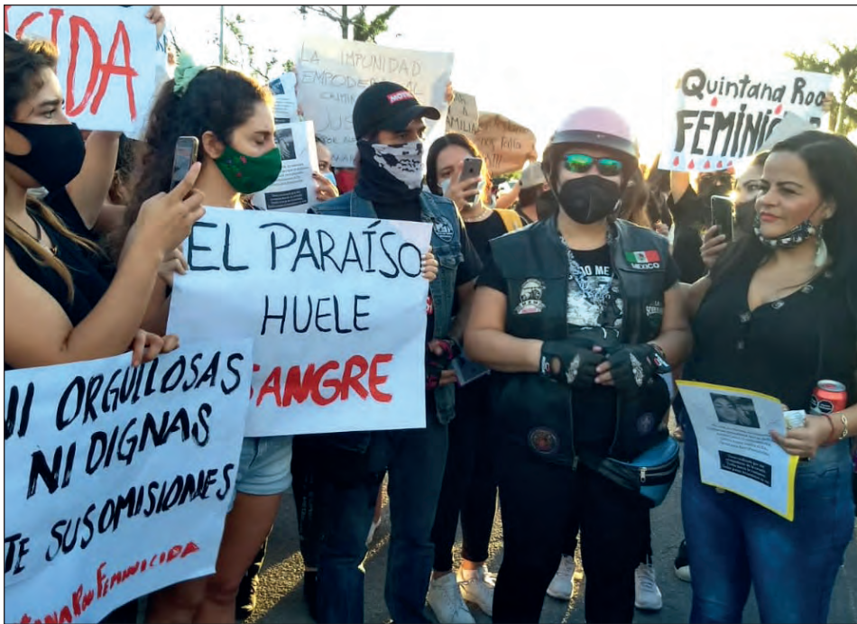
▲ La Red Feminista Quintanarroense advirtió que se retira de las mesas de trabajo con las instituciones gubernamentales.

El funcionario sólo fue separado del cargo hasta que concluyan pesquisas por la represión