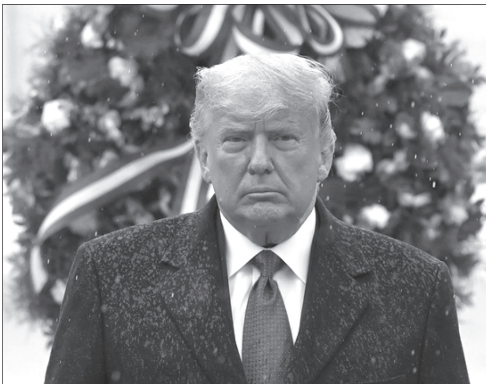
▲ A una semana de la contienda electoral, Trump no se ha dirigido a la nación más que a través de Twitter, y no acepta su derrota frente a Biden.

Trump criticó una encuesta "posiblemente ilegal" justo antes de la jornada electoral que, según él, desanimó a los votantes republicanos.