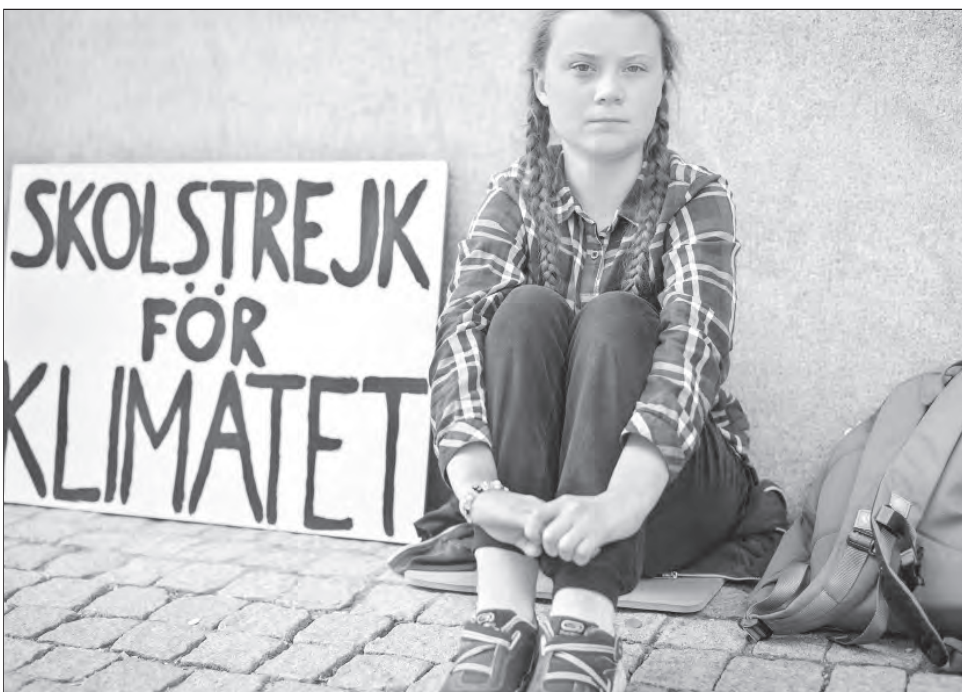
▲ Escenas de la película Greta, la fuerza de la naturaleza , acerca de la adolescente que llama al síndrome de Asperger su súper poder.

creo, no se ha sentido que puede reconocerse. El personaje unidimensional de la joven siempre está muy enojado, es una chica frustrada. En la película se puede apreciar que también es alegre y que tiene lados distintos.