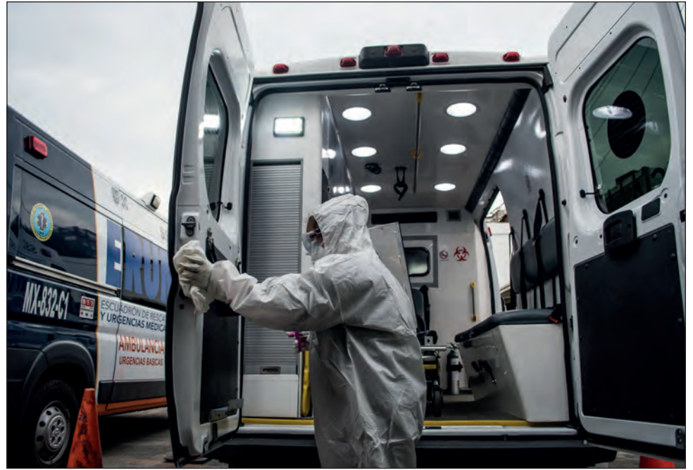
▲ La baja de traslados y de renta de tanques de oxígeno indican una mejora en las cifras de contagio en el municipio de Solidaridad, Quintana Roo.

Hasta el 11 de noviembre la Secretaría de Salud de Quintana Roo contó 13 mil 775 contagios de COVID-19, mil 690 de ellos en Solidari-