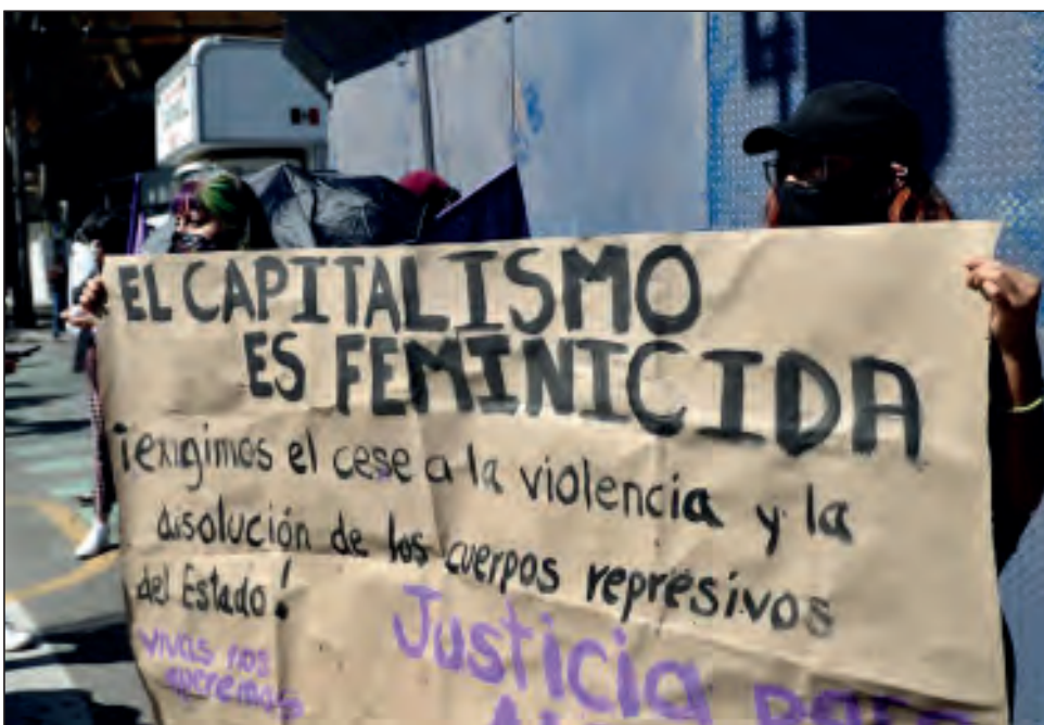
▲ Integrantes de varias organizaciones feministas coincidieron en que el país, sumido en la violencia, les ha dejado como una única salida la protesta social.