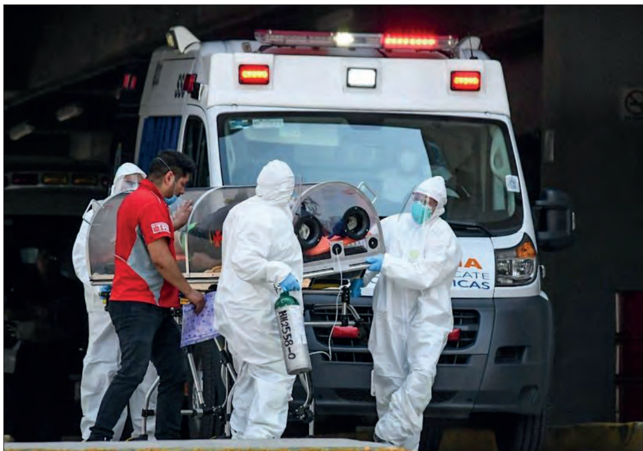
▲ Como medida preventiva, los paramédicos deben utilizar un equipo especial consistente en traje taiber, goggles de seguridad, careta, mascarilla N95, dos pares de guantes y cubre zapatos o botas, el cual deben desechar tras un servicio.

Sobre el protocolo de traslado, explicó que se ha trabajado con el gobierno de Yucatán, puesto cuando una persona enferma de COVID-19 cuenta con seguro médico, se canaliza a las clínicas del Instituto Mexicano del Seguro Social (IMSS) y si no, a los hospitales Juárez o el General Agustín O’ Horan.