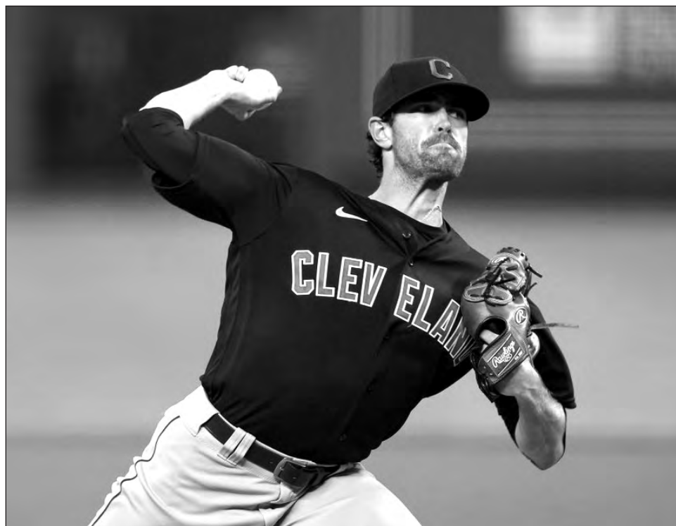
▲ Shane Bieber fue implacable y prácticamente imbateable desde la loma con los Indios de Cleveland.

Asimismo, Bieber fue el primer pitcher en liderar la Gran Carpa en las tres categorías desde que el venezo-