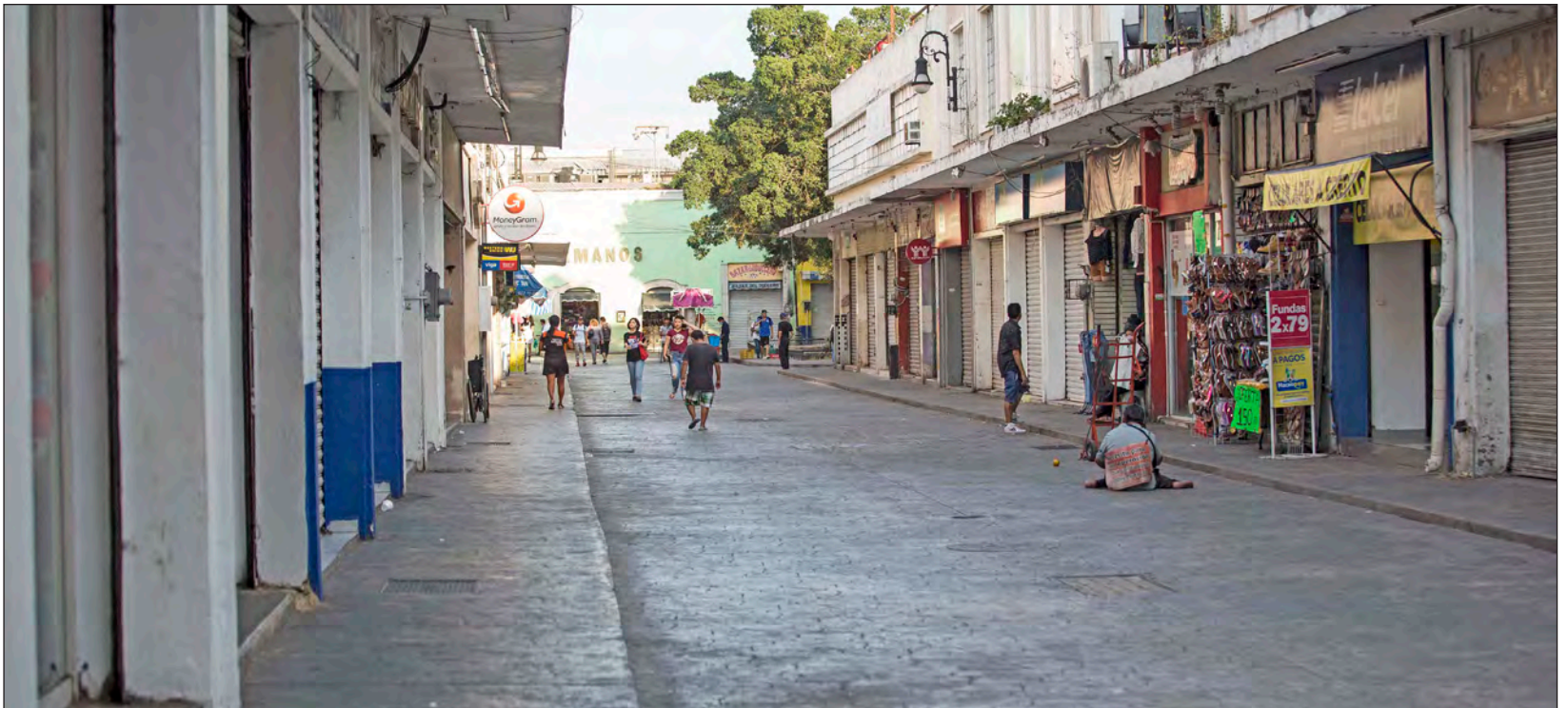
▲ El Instituto Mexicano para la Competitividad coloca a la capital yucateca como la ciudad mexicana con la tasa más baja en homicidios.