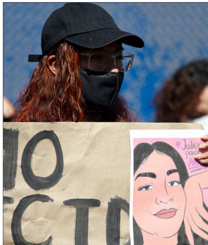
▲ Algo sigue existiendo en la cultura cívica mexicana que se aterra con la mujer que se pone de pie, alza la voz y reclama.

“A las mujeres hay que ponerlas en orden”, pareciera ser la consigna, y los balazos, que son impensables frente a otros, contra ellas son legítimos. Ese es