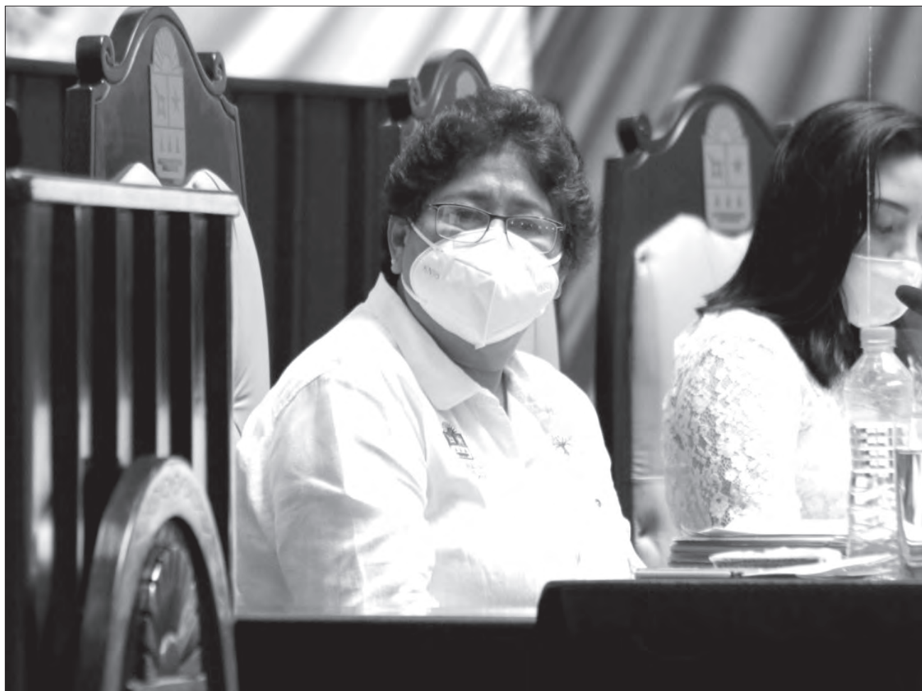
▲ Yohanet Torres resaltó la entrega de estímulos y subsidios estatales a las familias quintanarroenses y al sector empresarial para hacer frente al COVID-19. Gobierno de Quintana Roo.

Detalló las acciones y gestiones que se han realizado en función de impulsar y lograr un desarrollo económico equilibrado para Quintana Roo a pesar de la situación sanitaria del COVID-19. Tam-