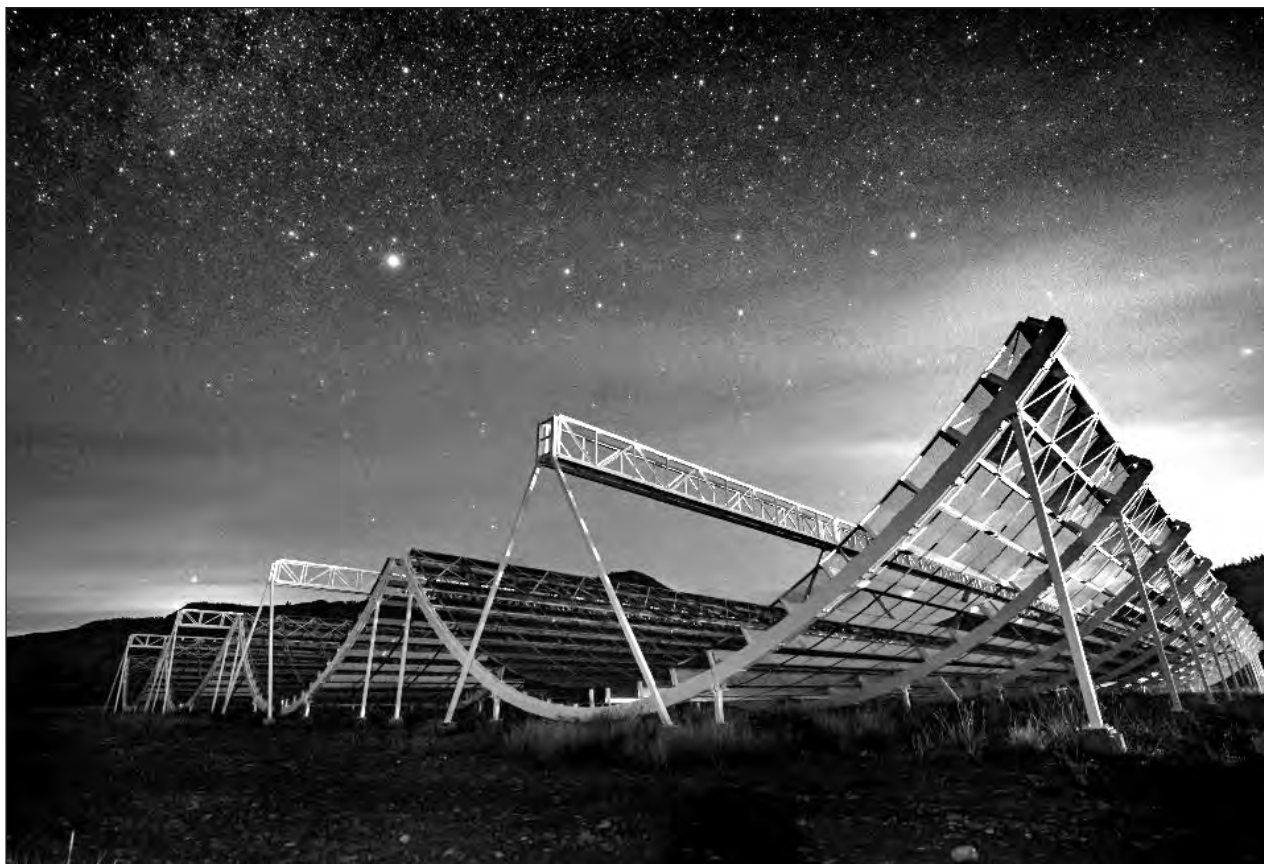
▲ El hallazgo es fruto de un esfuerzo internacional, al comprender el telescopio canadiense CHIME, la pequeña red estadounidense de estaciones de escucha de radio STARE2 y el radiotelescopio chino FAST.

Un ERO (Earth Return Orbiter) proporcionado por la ESA se reuniría con las muestras en órbita alrededor de Marte y las llevaría en una cápsula de contención de alta seguridad para traerlas a la Tierra en la década de 2030.