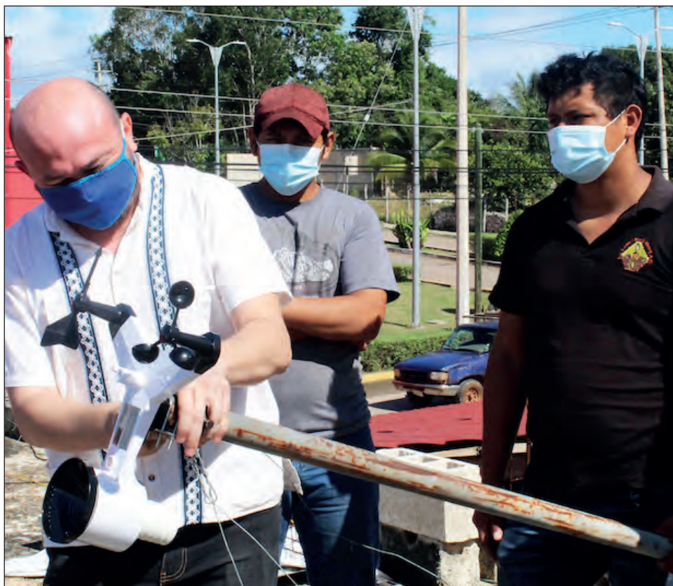
▲ Los expertos sostienen que la observación climática debe combinar la aplicación de la tecnología y los conocimientos tradicionales.