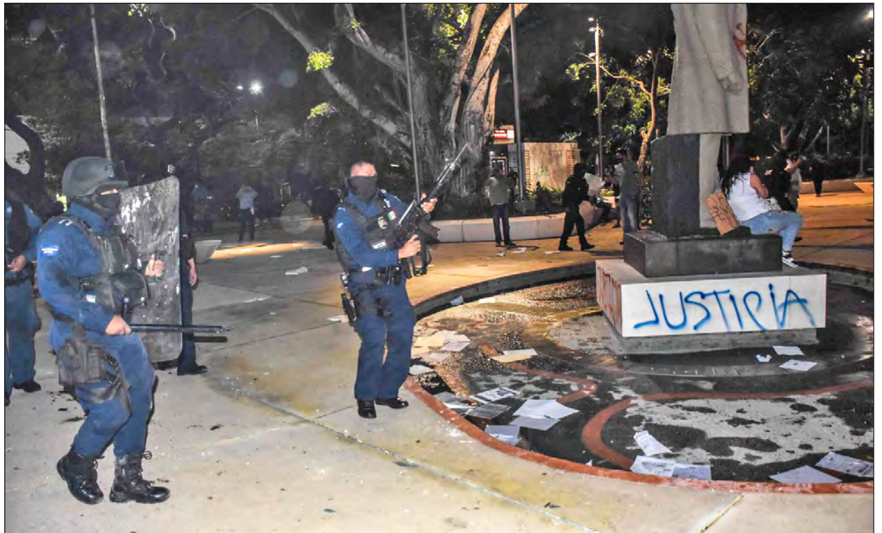
▲ El pasado 9 de noviembre, elementos de la policía municipal de Benito Juárez dispararon al aire, golpearon e incluso violentaron sexualmente a mujeres que protestaban por el feminicidio de Alexis.

El detenido era la pareja sentimental de la hoy occisa, quien de acuerdo con los vecinos pidió auxilio a gritos desde su vivienda; al llegar los cuerpos de emergencia confirmaron su deceso.