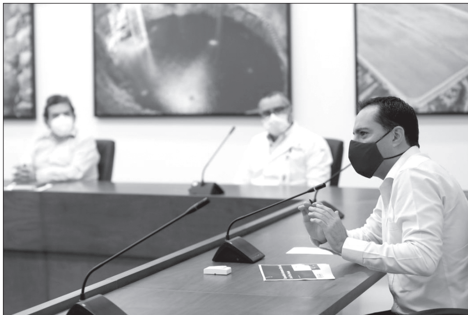
▲ Los indicadores sobre el desarrollo del COVID-19 en Yucatán presentan disminuciones considerables, gracias a las disposiciones y la participación de la población.

Vila Dosal agradeció la colaboración de los