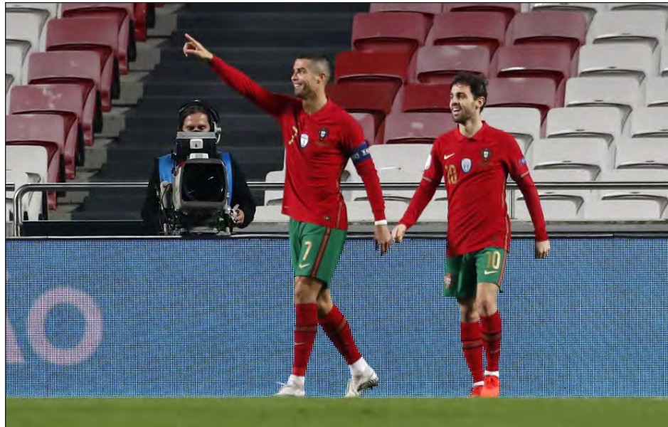
▲ Cristiano Ronaldo aportó a la contundente victoria de Portugal.

Los encuentros en los que participaron Italia, Bélgica, Alemania y República Checa figuraron entre los afectados por la pandemia. El partido de Noruega, en casa frente a Israel, se can-