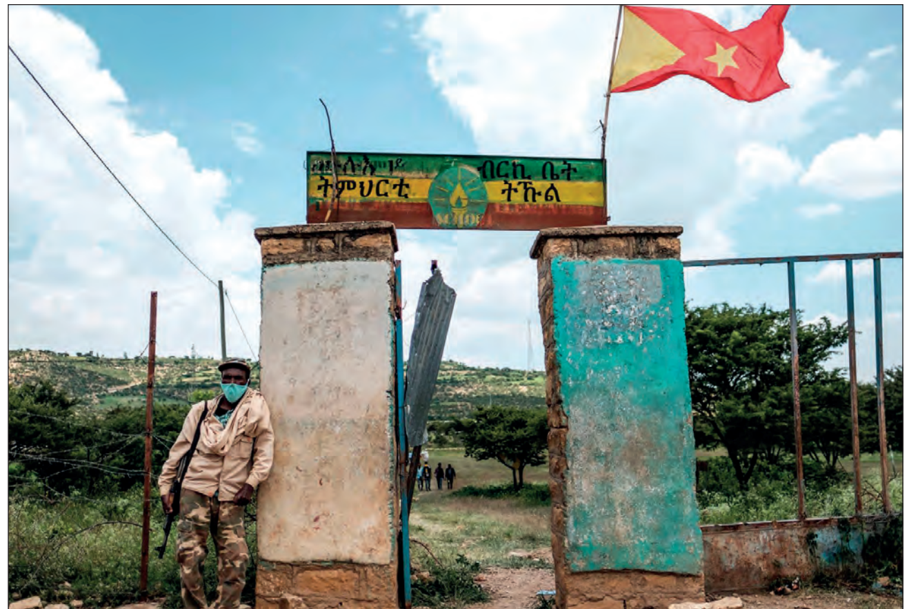
▲ Pese a la intensidad del conflicto bélico etíope, no pueden saberse las cifras exactas de muertos, heridos y desplazados en Tigray porque el gobierno en Adís Abeba impuso un bloqueo de comunicaciones en la zona.

El ministro de Defensa etíope, Kenea Yadeta, afirmó ayer que la ofensiva en Tigray fue lanzada debido a que el TPLF supone un riesgo para la “so-