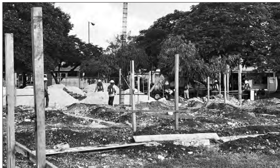
▲ El nuevo espacio de atención al adulto mayor se ubicará en el Fraccionamiento del Parque.

El lugar contará igualmente con áreas verdes, que estarán en diversos puntos del proyecto, para tener espacios naturales dentro y fuera del centro; con pasto natural y arbolado, una plaza conexión que interconectará las áreas existentes con las del proyecto, para facilitar el acceso a los adultos mayores y los trabajadores.