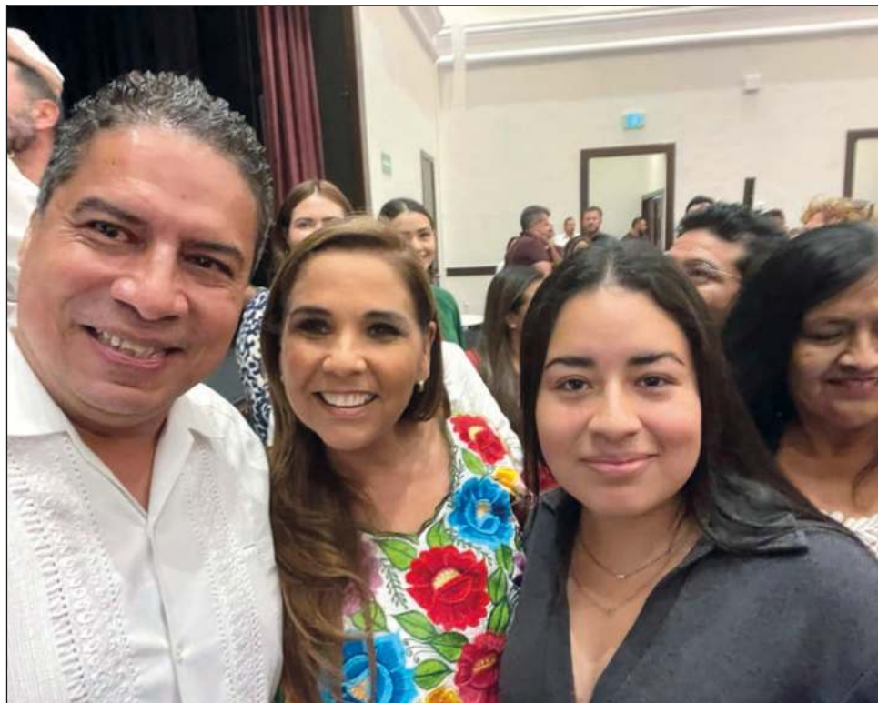
▲ Seguridad, diversificación económica y sargazo, entre las prioridades a resolver por la gobernadora electa, quien tomará protesta el 25 de septiembre.

En tercer orden importancia, el líder empresarial