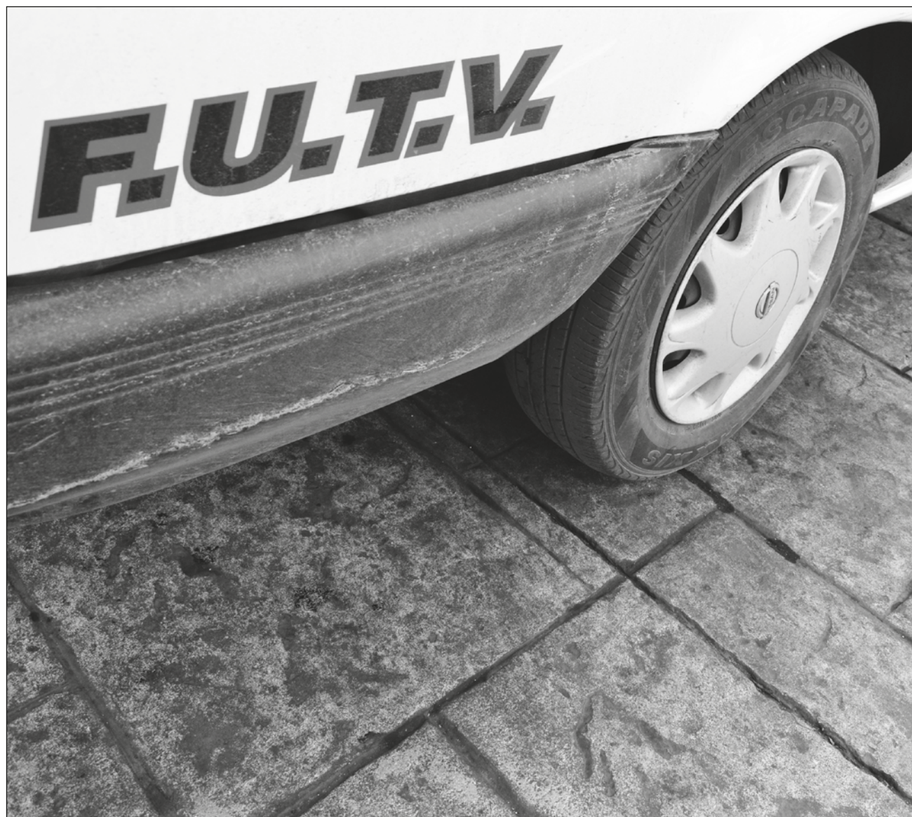
▲ Sólo podrán emitir su voto los dirigentes de los 19 gremios transportistas de cada uno de los 11 municipios.

Entre las principales peticiones de los taxistas es que el Instituto de Movilidad del Estado de Quintana Roo (Imoveqroo) regule aspectos como las tarifas, que no permita el ambulante y que evite la operatividad sin permisos.