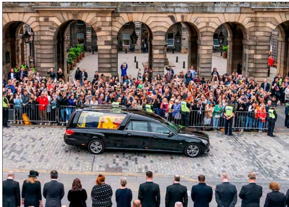
▲ En las calles, escoceses guardan silencio en presencia de los restos de la reina.

Algunos arrojaron flores ante el coche fúnebre negro que transporta el féretro de Isabel, cubierto con el estandarte real de Escocia y una corona de brezo blanco, dalias y arvejillas, mientras recorre un soleado y verde campo escocés.