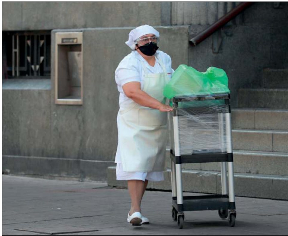
▲ Las mujeres son penalizadas en el acceso al empleo.

La tasa de desánimo, entendida como la proporción de personas disponibles para trabajar sin activamente estar en búsqueda de un empleo, con respecto a la población efectiva en edad de trabajar, muestra una distinción por género que penaliza a las mujeres.