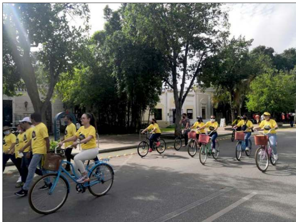
▲ Portando playeras amarillas, los asistentes a la rodada de este fin de semana partieron desde el remate para concluir en el Monumento a la Patria.