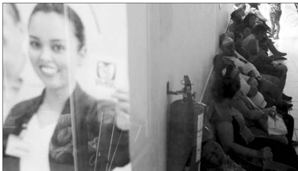
▲ Quienes llegan al IMSS tras haber intentado suicidarse son atendidos de las lesiones físicas que pudieran tener en las áreas de atención médica continua o urgencias; posteriormente se les realiza una valoración y reciben tratamiento en salud mental.

En las Unidades de Medicina Familiar (UMF), deportivas y Centros de Seguridad Social (CSS) forman grupos de adolescentes, llevan a cabo pláticas informativas y talleres de ocupación de tiempo libre para promover hábitos de vida saludables que den apoyo, acompa-