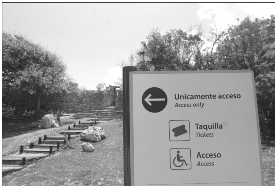
▲ Tanto los guías de turistas como artesanos de la zona arqueológica esperan que las celebraciones patrias atraigan a turistas mexicanos.

No obstante, confía que el puente festivo atraiga turistas mexicanos y contraten sus servicios para recorrer y conocer los monumentos mayas.