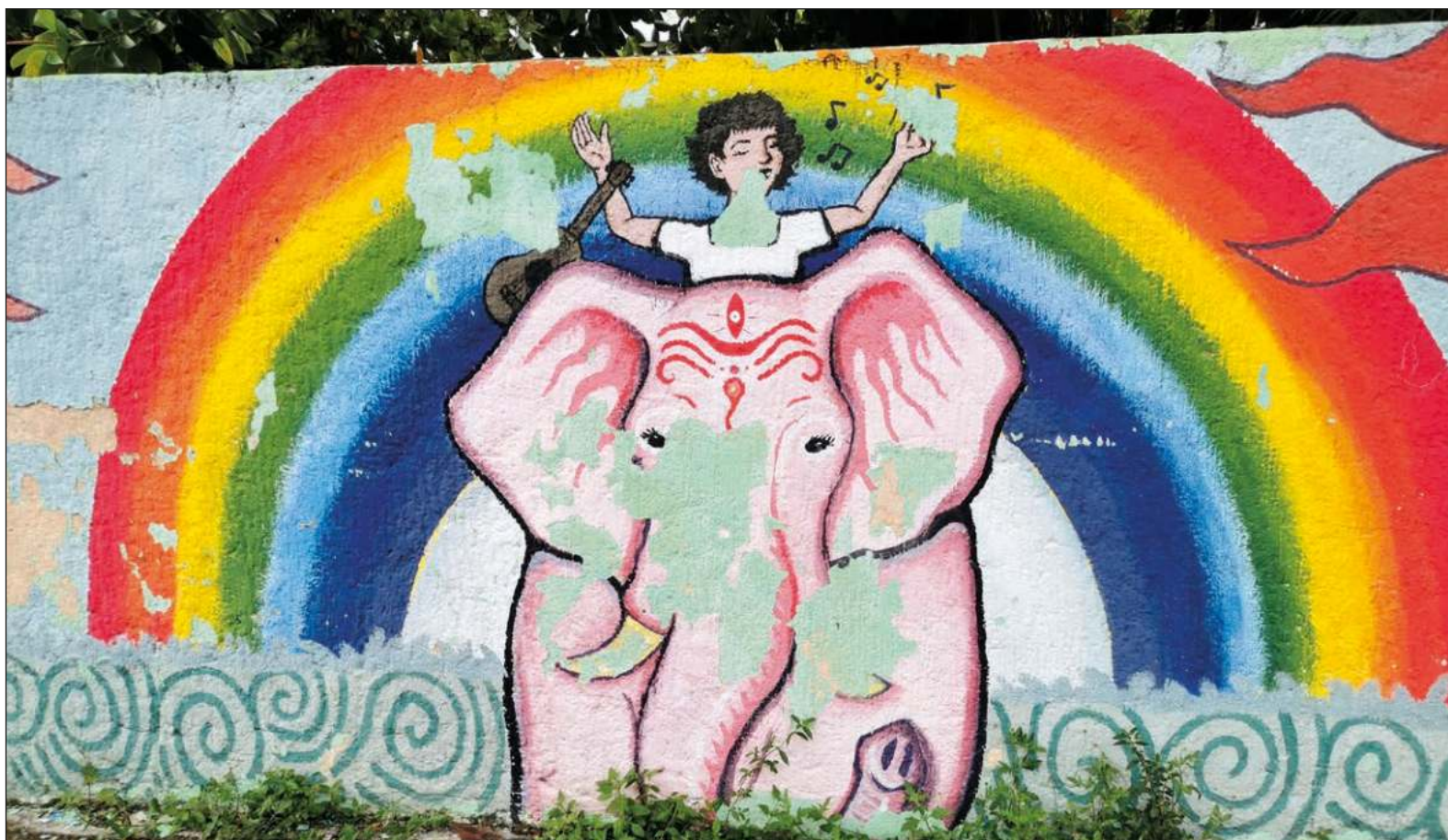
▲ "Quizá piensen que en Yucatán solía deambular semejante espécimen, o que el arcoiris es el portal que los trajo".