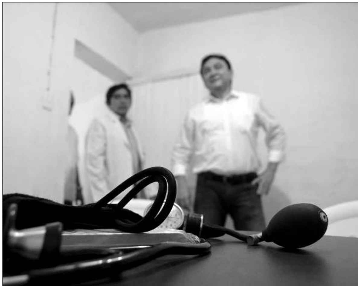
▲ “Tenemos una contienda cerrada, candidatos que no conectan con la población y un posible caballo negro (o azul), ese es el corte de estos días. Ya veremos cómo se mueve la película, porque esto es tan solo una foto”.