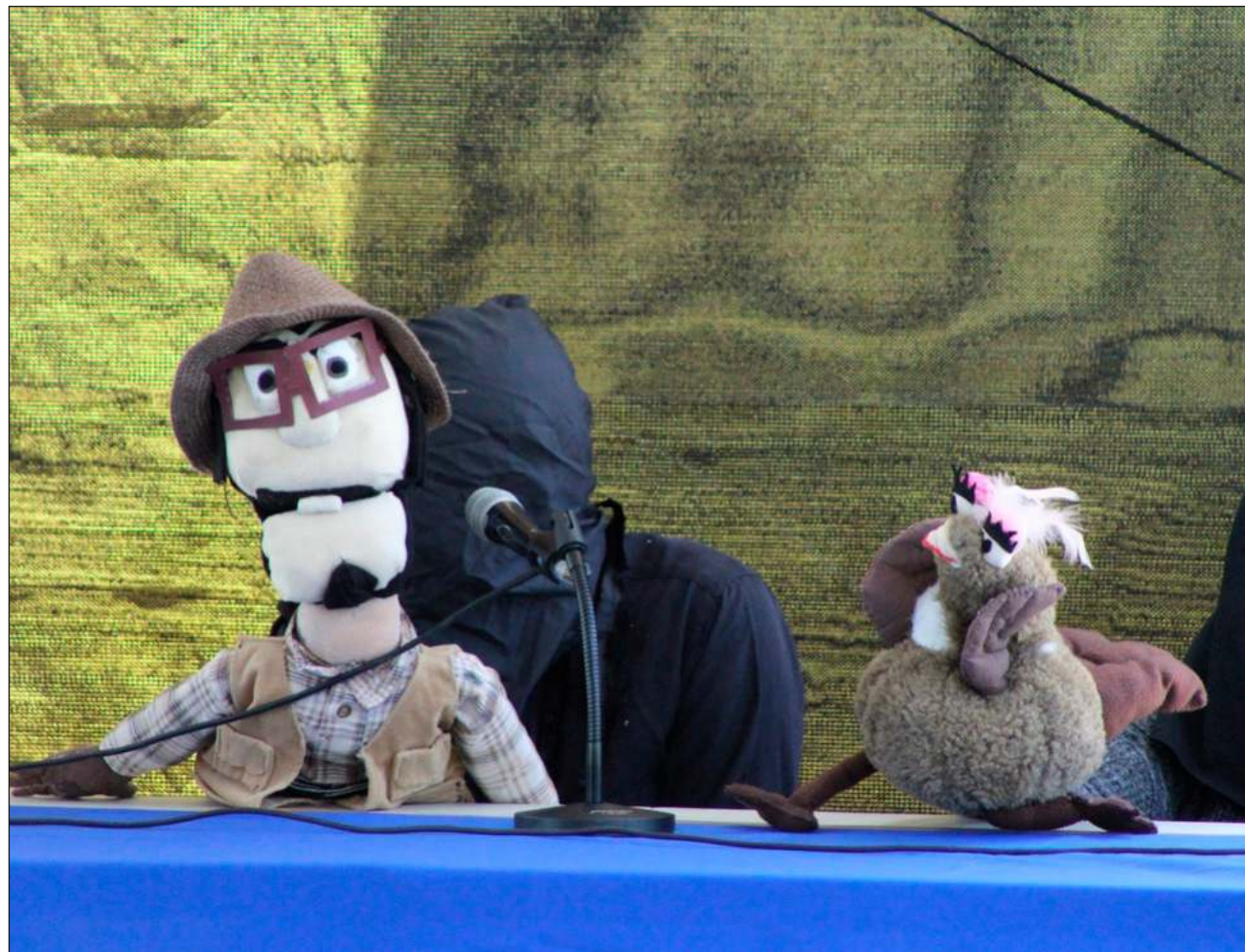
▲ La serie, auspiciada por la Secretaría de Cultura federal, cuenta con un arduo proceso de preparación de los integrantes, a quienes se imparten talleres de investigación, periodismo, títeres y desarrollo escénico.

Desde entonces, el investigador labora en el proyecto con el fin de que los niños reflexionen sobre la preservación de los restos de la cultura teotihuacana, su importancia y salvamento.