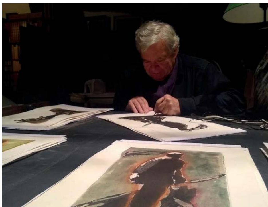
▲ Robles se vale de trazos de una violencia estética que arroba el espíritu.

Cacerías imaginarias , agregó la cineasta, es un libro dirigido a todo aquel interesado en el cine, pero también le habla directa, sincera y auténticamente a todos los escritores o aspirantes a serlo, los invita a pensar, discutir e intercambiar puntos de vista y generar diálogo.