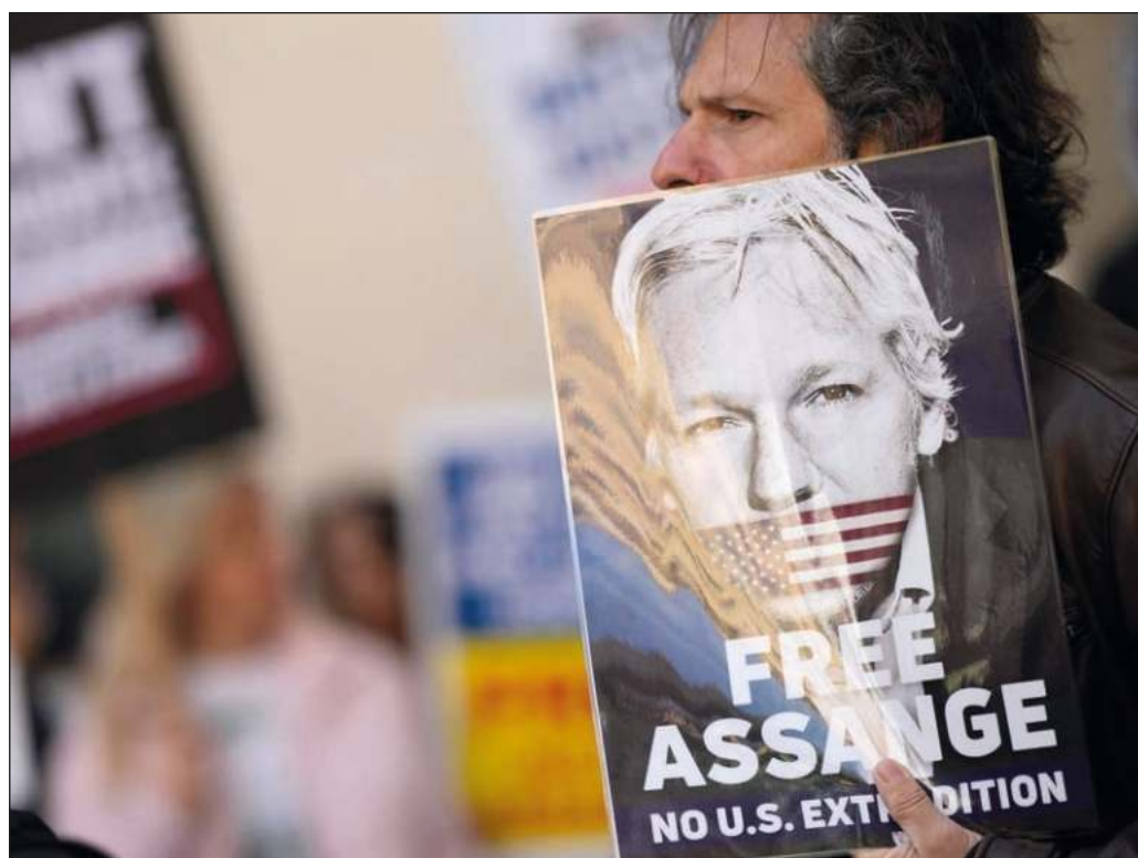
▲ La campaña para desaparecer a Assange del ojo público y suplantarlo con el discurso de sus perseguidores ha contado con la complicidad de los grandes medios corporativos.

Pese a que hoy todo parece en contra de Julian, cabe desear que la solidaridad de los muchos tarde o temprano triunfe sobre la sed de venganza de Washington.