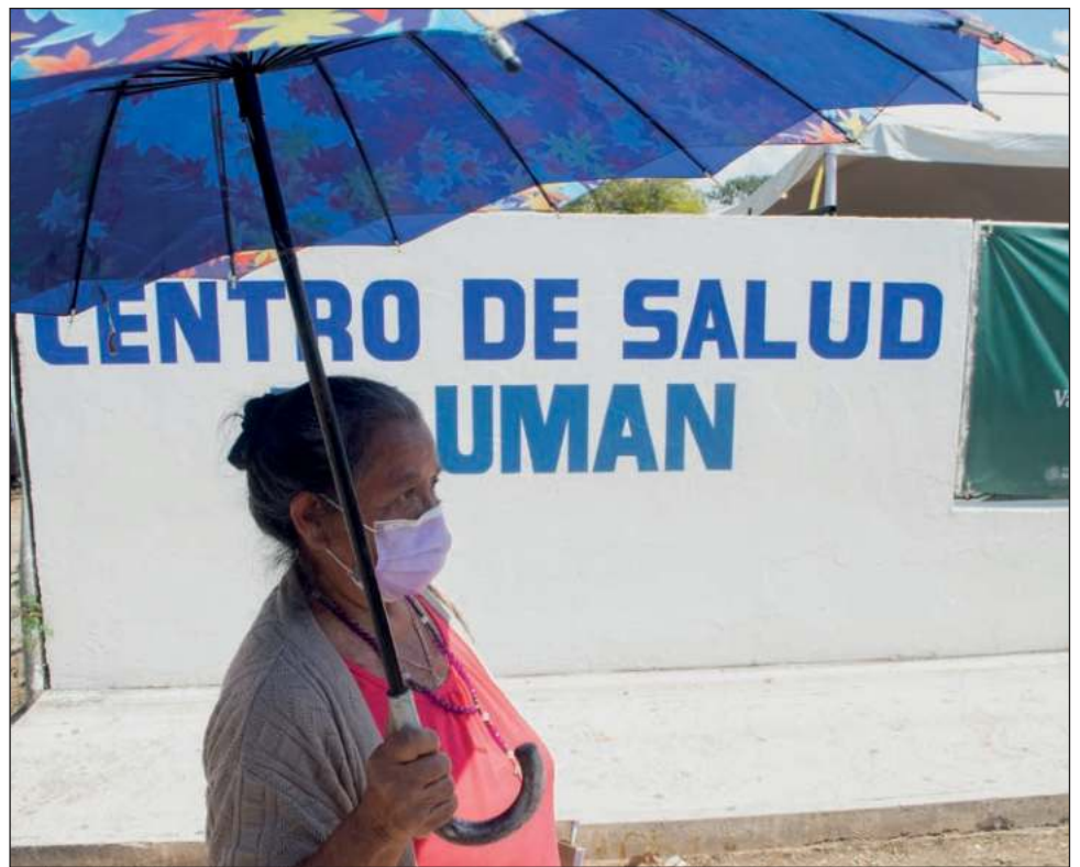
▲ Las activistas exigen que fiscalías y tribunales se hagan presentes en las comunidades mayas, se contrate a más intérpretes y suficientes defensores de oficio.

“Exigimos que las puertas del gobierno estén abiertas para las mujeres”.