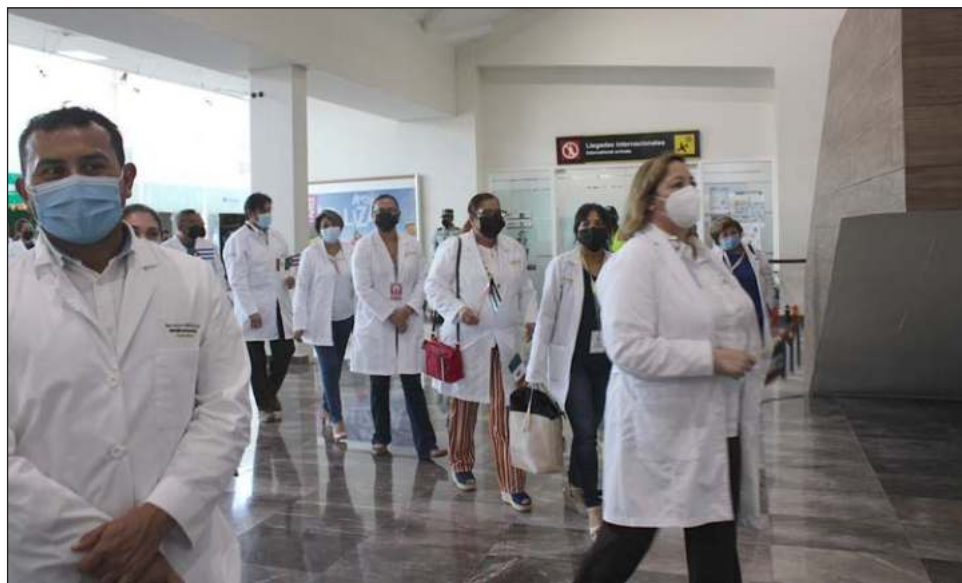
▲ En total son 80 especialistas cubanos los que arribaron a la capital campechana; de estos, 51 se quedarán en Campeche y el resto continuará su viaje a La Paz, BC y a Sonora.

El embajador cubano agradeció a la mandataria por acudir a recibir al grupo de médicos especialistas que viene a trabajar a Campeche, “me da mucha alegría, porque juntos vamos a trabajar para poder ayudar al gobierno mexicano a elevar la salud del pueblo mexicano; usted puede estar segura que nuestros compa-