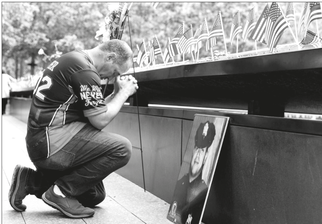
▲ En Nueva York, una multitud reunida cerca del memorial en Manhattan guardó silencio durante dos minutos.

El sábado por la noche, Nueva York se iluminó con un "Tributo a la luz" que mostraba dos rayos azules proyectados en el cielo nocturno, simbolizando las Torres Gemelas.