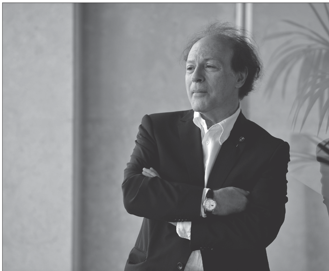
▲ Marías fue elegido miembro de la Real Academia Española, la máxima autoridad literaria del país, en 2006.

"Día triste para las letras españolas", tuiteó el presidente del Gobierno español, Pedro Sánchez. "Nos deja Javier Marías, uno de los grandes escritores de nuestro tiempo. Su inmensa y talentosa obra siempre será parte fundamental de nuestra literatura".