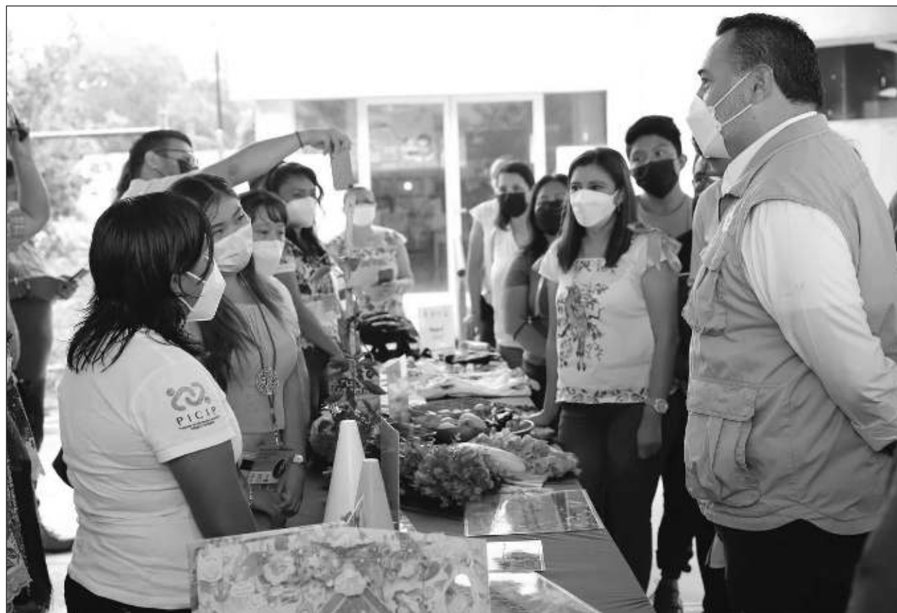
▲ El Mercadito con Causa es parte de las acciones de fortalecimiento impulsadas por Renán Barrera; está formado por asociaciones que ayudan al prójimo y la venta de productos les permitirán continuar con sus causas sociales.

El alcalde señaló que los objetivos principales son la vinculación y sinergia con aliados externos, visibilizar las causas sociales de la organización, venta de productos que les permitirán continuar con sus causas sociales, elaboración de un plan de trabajo de talleres de capacitación para el 2022 y crear políticas de calidad en sus procesos.