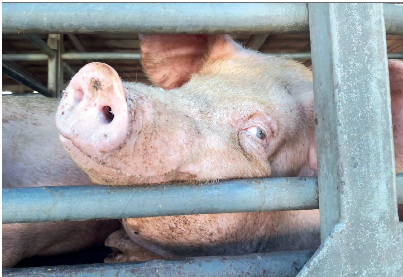
▲ En el reporte El Enemigo del Planeta, Igualdad Animal documentó las condiciones en que viven los cerdos en dos granjas porcícolas de Jalisco.