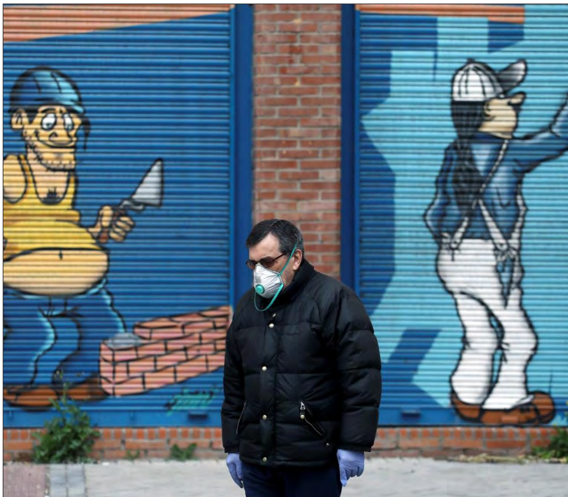
▲ This year has seen COVID-19 and its short term massive economic and social impact as well as longer term implications for our economies and societies.

IN THE EIGHTIES we went from the "we" generation to the "me" generation, inspired by commercialism. We also came together with We Are The World, the birth of CNN and 24/7 news coverage (soon emulated by other global cable news networks), the assassination of Anwar Sadat, SOLIDARNOCZ, Pope John Paul II, the death of Mao, the USSR in Afghanistan, AIDS, the Iran-Iraq war, and civil wars in Lebanon and Central America.