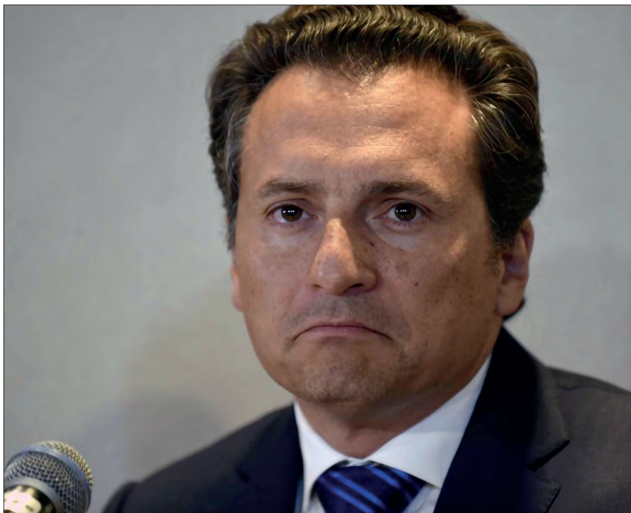
▲ "Dinero que vino de Odebrecht para Emilio y de Emilio para esos asesores, para esa campaña electoral, para esa campaña electoral".

Sin citar nombres, el titular de la FGR, Alejandro Gertz Manero, lo informó así en un video difundido a los medios de comunicación: "El que después fue presidente y su secretario de Hacienda (Luis Videgaray) son las personas que este individuo, que está presentado la denuncia, señala que fueron los que le ordenaron que ese dinero fuera entregado a varios asesores electorales extranjeros que colaboraron y trabajaron para la campaña de estas dos personas".