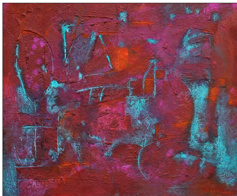
▲ Soliloquio proyecta un encierro de sí mismo, donde el ensimismado habla de sí para sí. Obras de Ariel Guzmán

Así, entre la luminosidad del escenario del monólogo y la oscuridad del aislamiento del soliloquio, Ariel Guzmán ha creado dos imágenes que denotan diálogo, ya sea