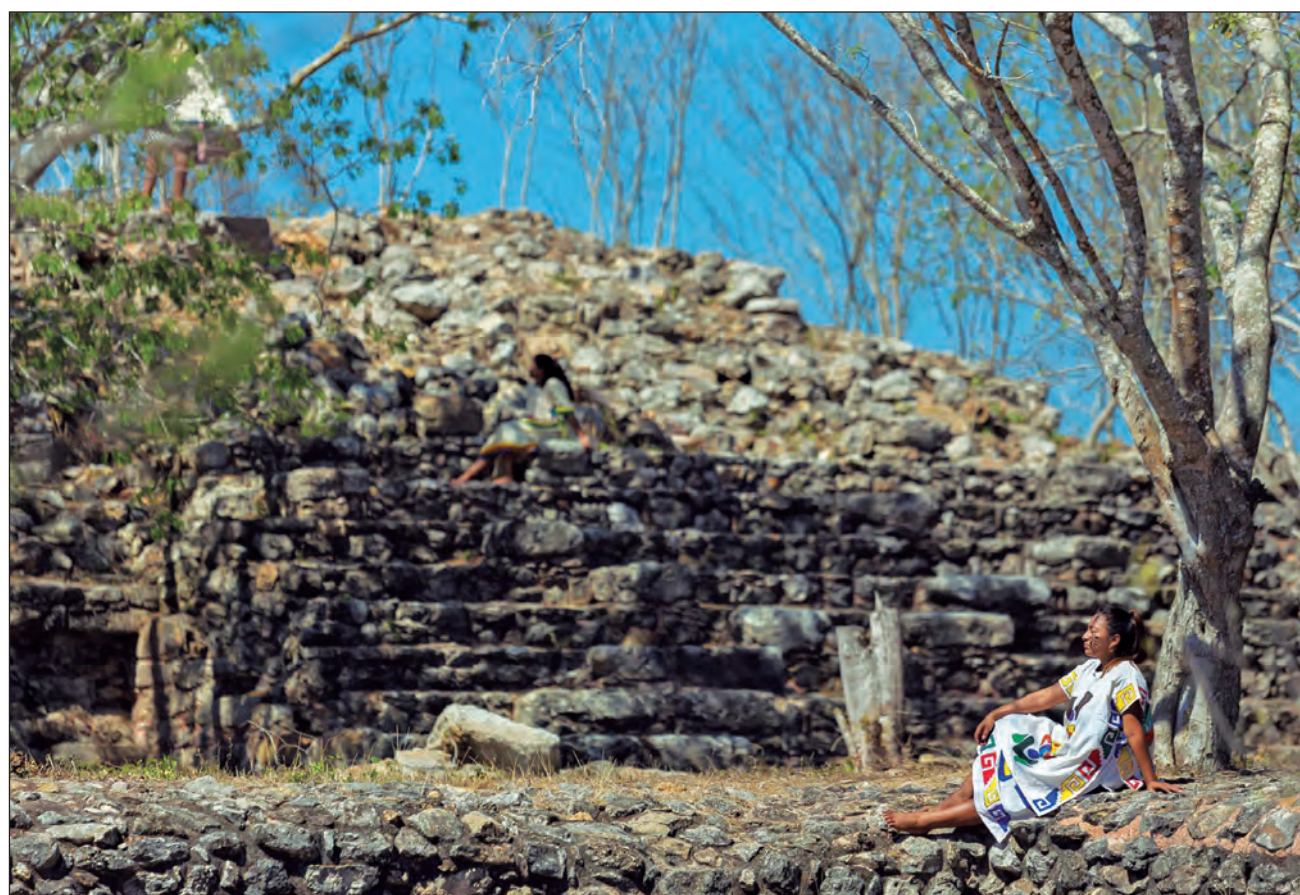
▲ El personal para custodiar los sitios arqueológicos es insuficiente para garantizar la protección del patrimonio cultural. En la imagen, zona arqueológica de Chaltún Ha en Izamal, Yucatán.