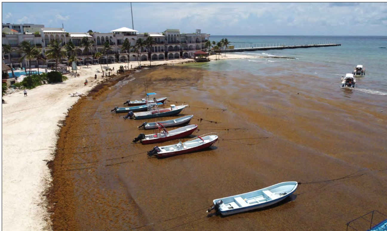
▲ Un centro biólogo químico de Morelia ha sido el asesor del movimiento Biomaya, instruyéndolos en cómo eliminar los metales pesados y dejar las partes buenas de la talofita.

El movimiento igualará el concepto cíclico que los mayas tenían del mundo