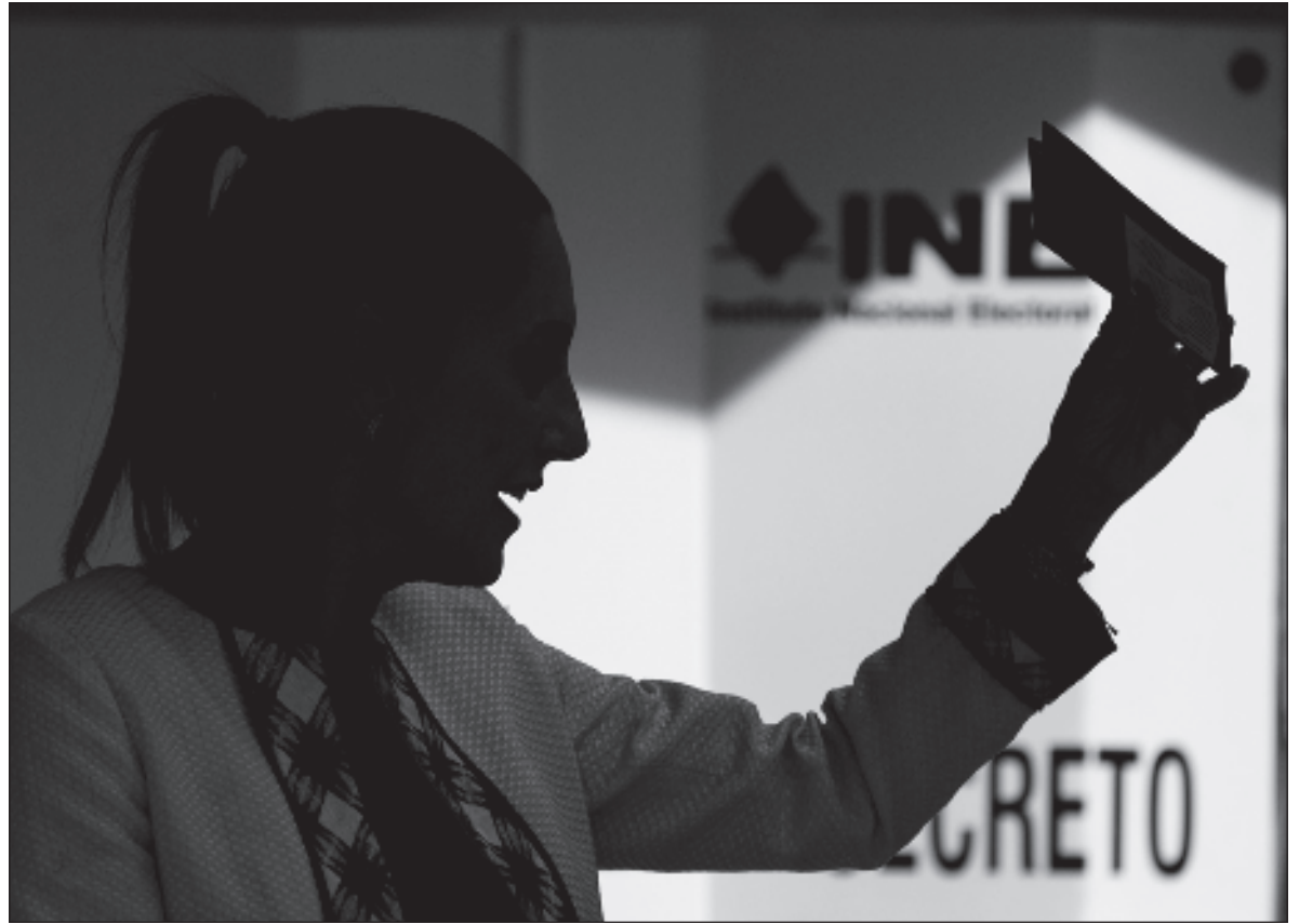
▲ “Improductivo y paralizante es dedicar la energía ciudadana a descalificar, alimentando la desconfianza y el prejuicio, e intentando frenar, detener o dificultar cualquier acción que provenga de la administración legítimamente constituida”.

Unos pocos sugieren que tenemos delante un brevísimo período de transición, de unos cuatro meses, que nos pone delante la tarea de conocer lo que espera lograr la presidenta electa, saber quiénes formarán parte de su equipo y cuál será su talante y su capacidad, estimar cómo matiza su relación con la administración anterior y el partido (ha ofrecido sin cortapisas que será “presidenta”