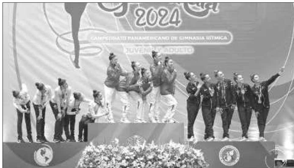
▲ El equipo nacional de gimnasia rítmica se coronó en el campeonato panamericano.

"Pasamos por mucho, la ruta ha sido larga y con muchas piedras en el camino, lo que nos sucedió entrenando con las campeonas mundia-