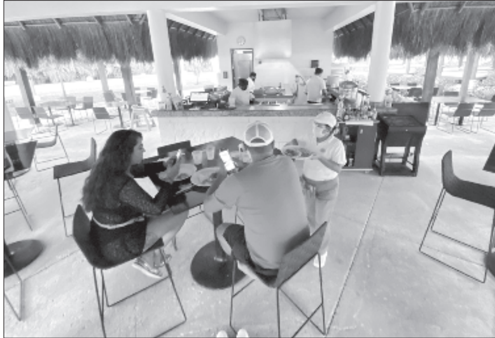
▲ En busca de fortalecer alianzas y generar beneficios, Gignet firmó un convenio de colaboración con la APAR para ofrecer Internet de calidad a sus miembros, además de acceso a proyectos especiales y participación en la feria de rentas vacacionales.

En ese marco, Luis de Potestad mencionó que a nivel nacional hay cerca de 900 mil cuartos hoteleros y una tercera parte de esa cifra es renta vacacional, es decir, cerca de 350 mil unidades, pero en Quintana Roo esa proporción es mayor, pues de un total de 130 mil cuartos hoteleros que reporta la Secretaría de Turismo, hay cerca de 65 mil más