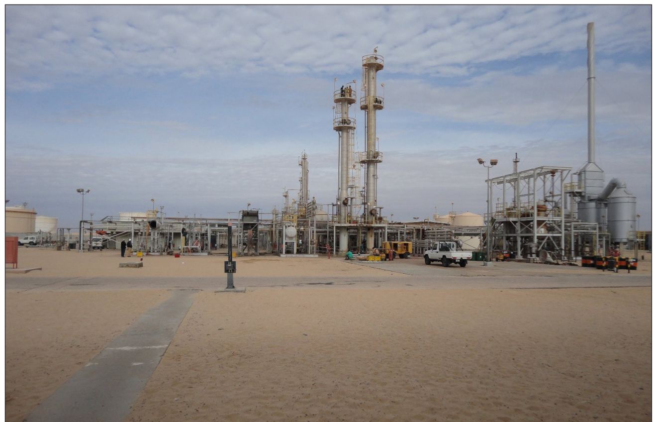
▲ Refinería Ras Lanuf -con capacidad de 220 mil barriles diarios- integra un complejo industrial en golfo de Sirte.

La refinería Ras Lanuf -una de la más importantes de Libia, con una capacidad de refinado de petróleo de