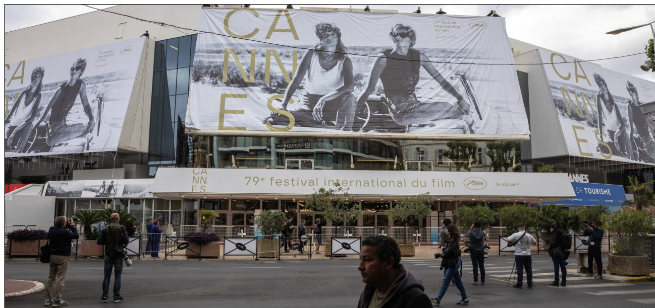
▲ Cannes firmó una carta que reclamaba la paridad en todas las áreas del cine, pero el texto no incluía que eso se tuviera que aplicar a la competición oficial. “Nos acusan de lavado de imagen feminista”, dijo Thierry Frémaux

En una rueda de prensa en la víspera de la apertura