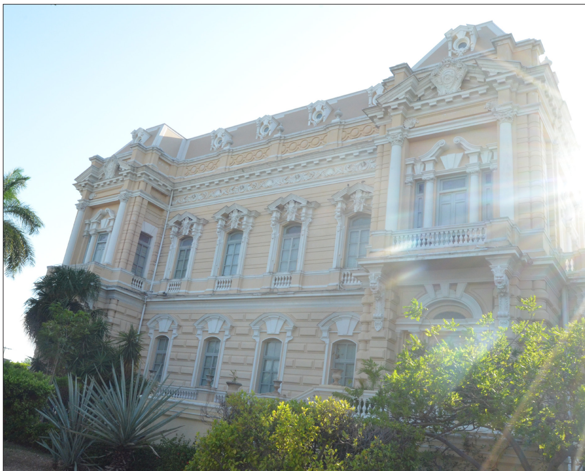
▲ "No sólo construir o intervenir, sino cuidar, interpretar y transmitir. Es una forma de arquitectura que exige sensibilidad, responsabilidad y compromiso, pero que también ofrece una enorme riqueza en términos de aprendizaje y significado".