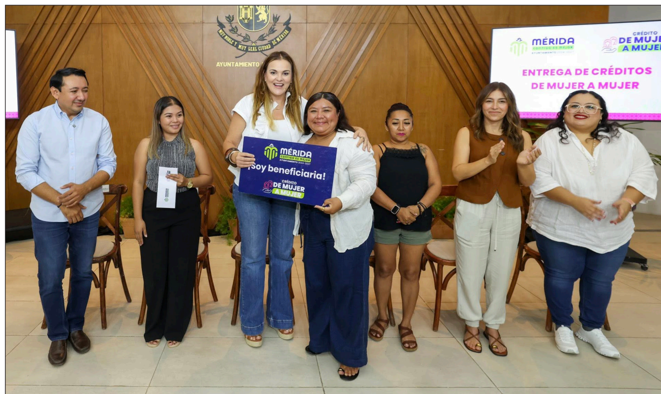
▲ Los servicios ayudan a mejorar las condiciones de vida de las y los meridianos, y a su desarrollo profesional.

Patrón Laviada recordó que hay apoyos al empleo