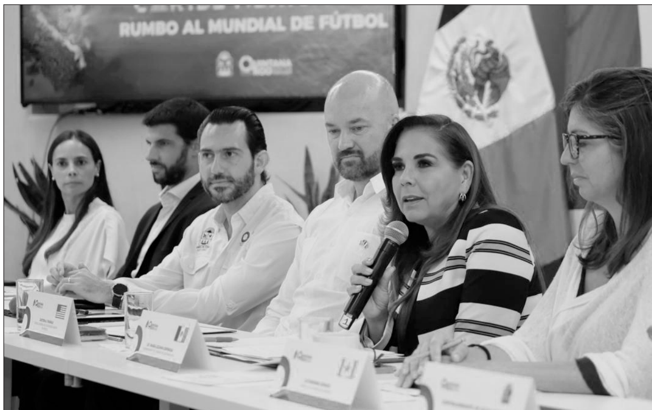
▲ La gobernadora Mara Lezama estuvo acompañada de la alcaldesa de Benito Juárez, Ana Paty Peralta.

El Caribe Mexicano “será un hub de entrada y de permanencia” mientras dure el evento deportivo, destacó Lezama