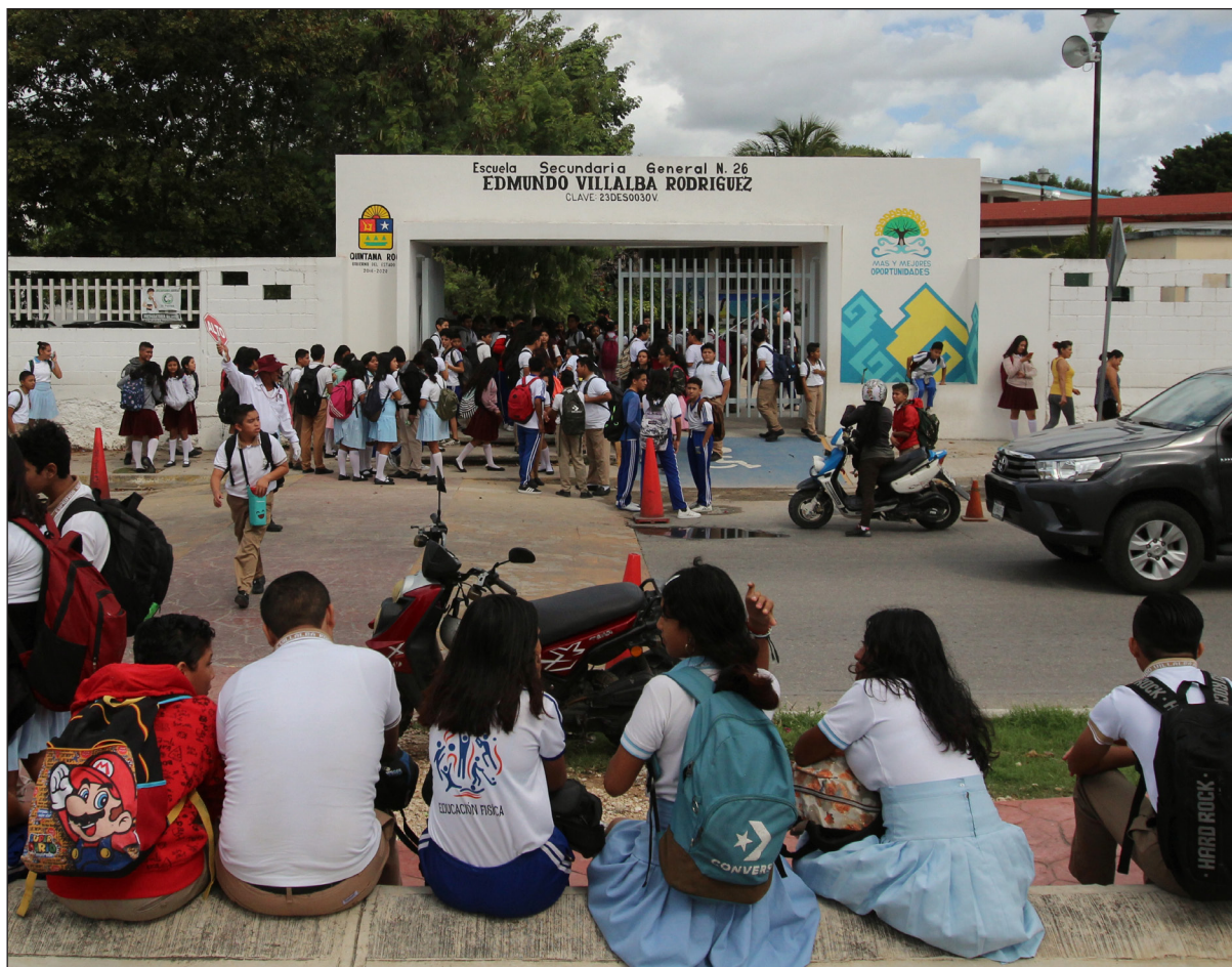
▲ "El Conaedu es una herramienta poderosa contra el centralismo histórico de México porque las y los consejeros se encargan de transmitir las propuestas, inquietudes y preocupaciones de sus zonas escolares".

*Subsecretaria de Educación Básica del gobierno de México