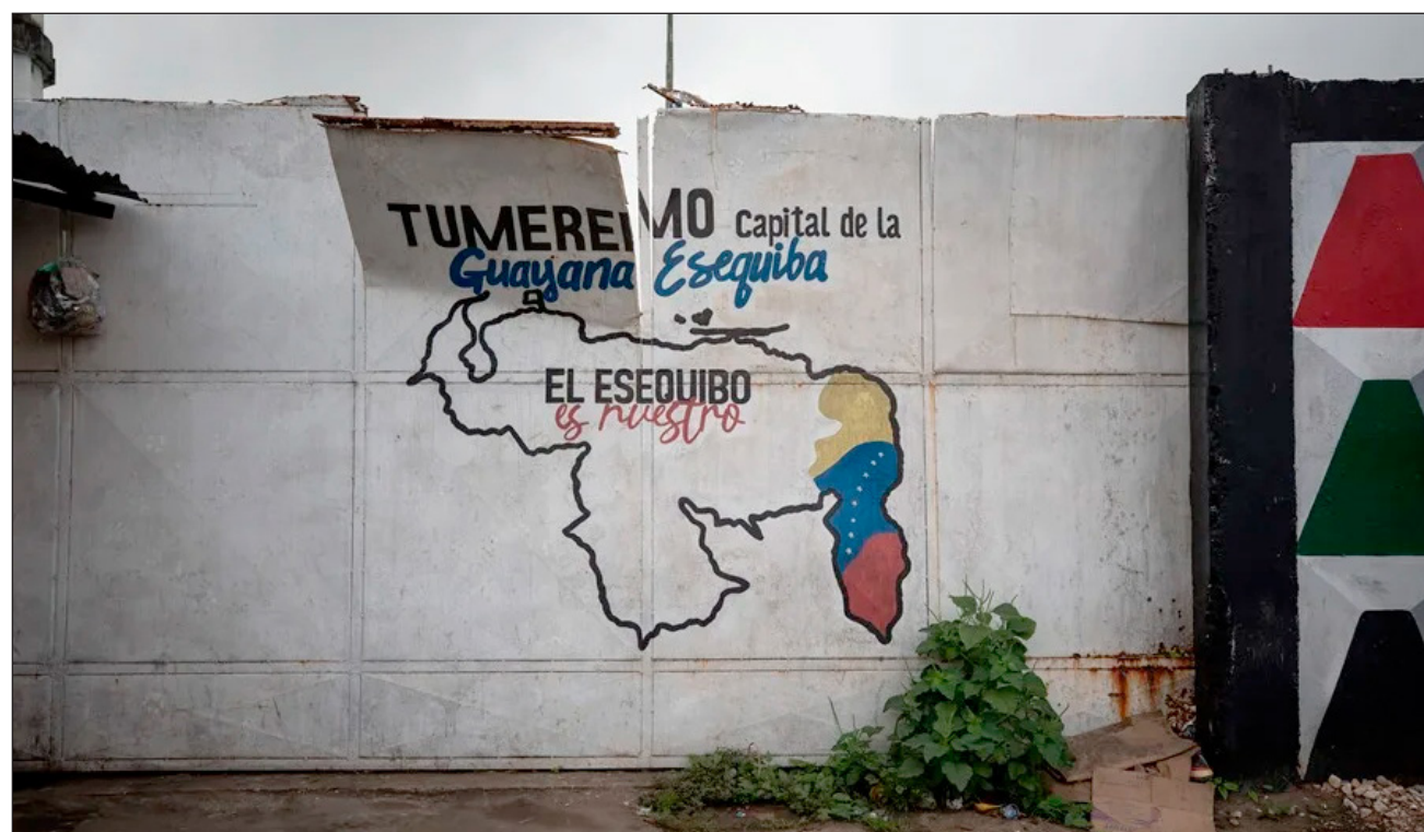
▲ Venezuela reclama el territorio de El Esequibo, que abarca unos 160 mil kilómetros cuadrados.

La alta funcionaria aseguró que Venezuela desea “resolver la controversia territorial sobre la Guayana Esequiba mediante la negociación política, pacífica”. Se trata del primer viaje de