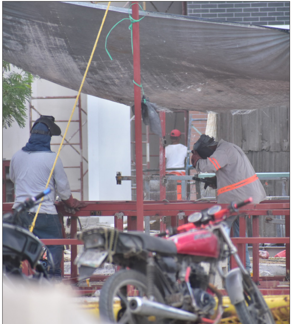
▲ El salario base de cotización promedio de los puestos de trabajo afiliados alcanzó un monto de 664.5 pesos diarios, el más alto para cualquier mes desde que se tenga registro.

Al 30 de abril de 2026, se tienen inscritos ante el Instituto un millón 19 mil 230 registros patronales, con una variación mensual negativa de mil 40.