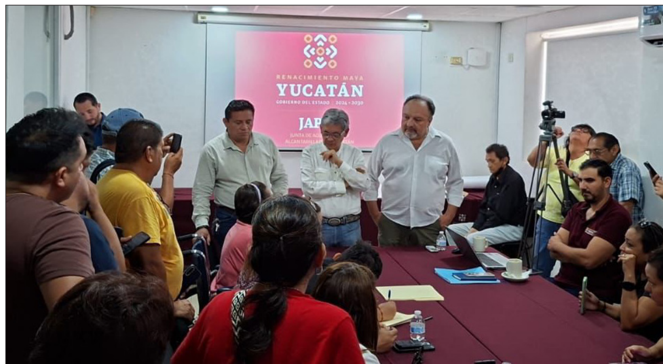
▲ El titular de la Japay señaló que el desabasto se debe en parte al crecimiento de la ciudad.

Para atender el nulo abasto de agua en colonias como la Alemán, Jesús Carranza, San Miguel, López Mateos, Industrial, entre otras, se construirá un nuevo cárcamo con miras a estar listo en diciembre de este