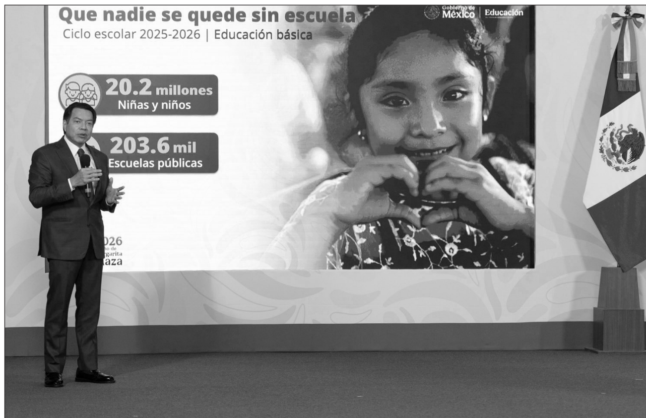
▲ Según Mario Delgado, esta decisión privilegia el derecho superior de las niñas y niños a una educación integral.

El gobierno también acordó que ante circunstancias extraordinarias o condiciones particulares de las entidades federativas, de conformidad con el artículo 87 de la Ley General de Educación, podrán ajustarse al calendario escolar.