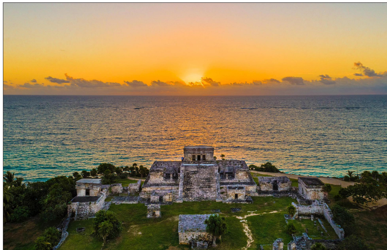
▲ La independencia administrativa, política y económica permitió un mayor desarrollo para el noveno municipio.

“Del año 97 al 2000, cuando fuimos parte del Consejo Delegacional de Tulum, cuando éramos parte