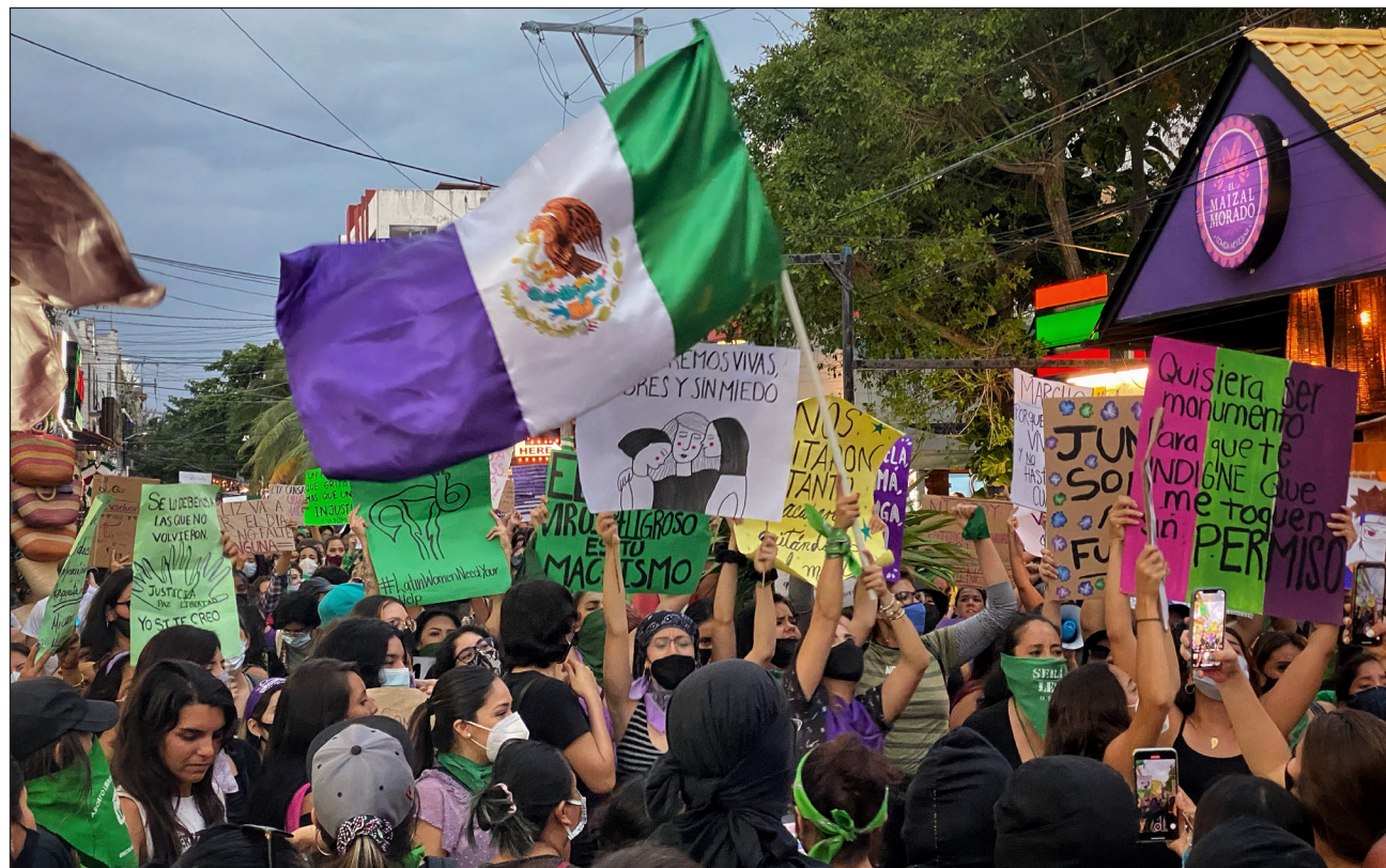
▲ Las legisladoras que forman parte de la Comisión Permanente de Igualdad de Género celebraron la homologación de la ley con la esperanza de que puedan mejorar las condiciones de vida para las mujeres.

“Lo ideal sería que jamás se tuviera que utilizar este protocolo, que nunca a las mujeres se se han asesinado por el hecho de ser mujeres y por ningún otro motivo, pero cuando se tenga que usar vamos a exigir su obligatoriedad, exigir a quien lo lleve a cabo, que lo cumpla cabalmente. Nos toca ser a todas las activistas y desde luego a la Comisión de Derechos Humanos observa-