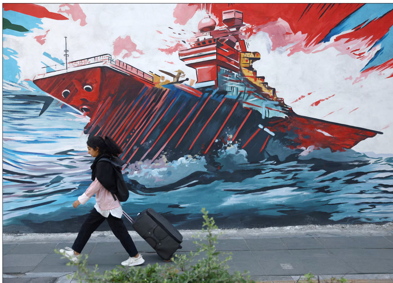
▲ En la imagen, una mujer iraní camina junto a mural en una calle, Teherán, Irán, 11 mayo 2026.

“Yo lo llamaría el más débil, después de leer ese pedazo de basura que nos enviaron”, añadió Trump. “Ni siquiera terminé de leerlo”.