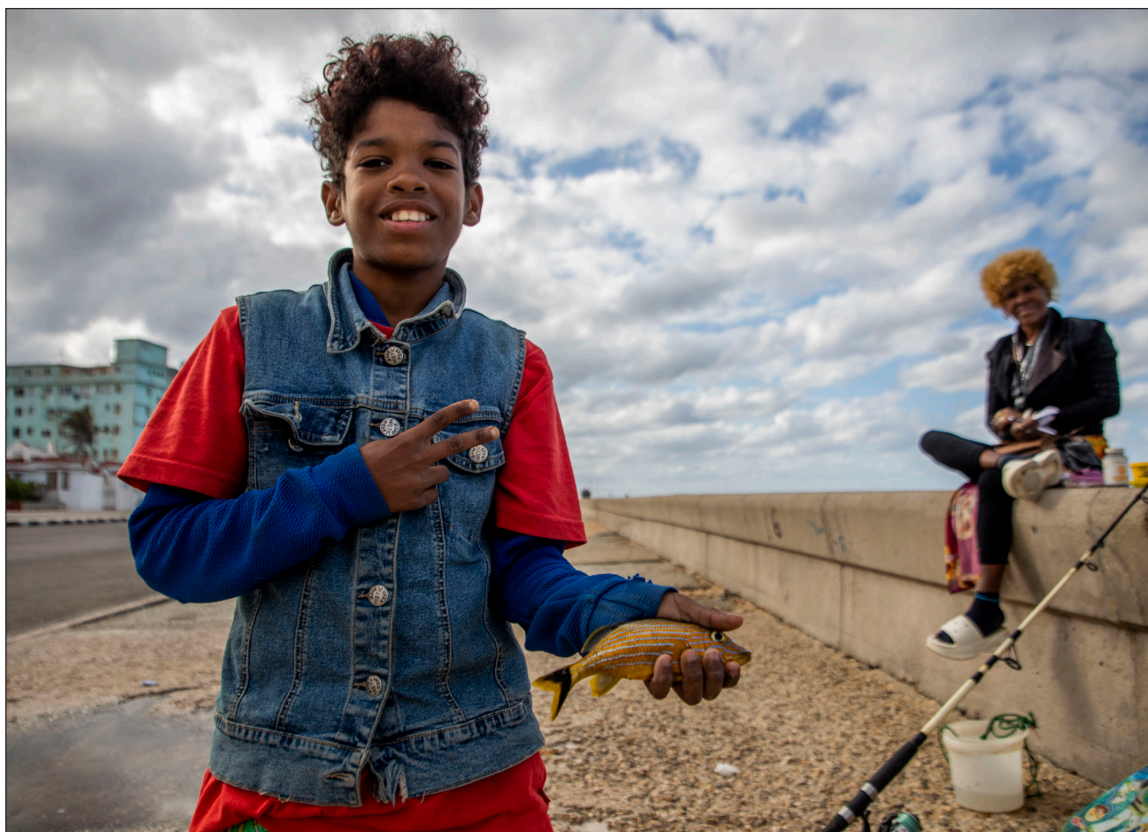
▲ Colección editorial muestra que el pueblo cubano es dueño de su futuro porque conquistó su pasado.

El periodista detalla: “lo que hicimos fue dar cuenta de la resistencia y resiliencia. Encontramos desde el primer momento, caminando en las calles y hablando con la gente, que los cubanos tienen una gran capacidad de inventiva, de adaptación. “Como nos dijo alguien en el Callejón de Hamel: ‘los cubanos somos especialistas en tres cosas: en huracanes, aquí cada año pasan, destrozan y nosotros seguimos bailando, tomando, haciendo nuestras cosas y seguimos adelante; en béisbol, pues sabemos todo del juego de pelota, quiénes son los mejores pitchers y shortstops , y somos especialistas en crisis”.