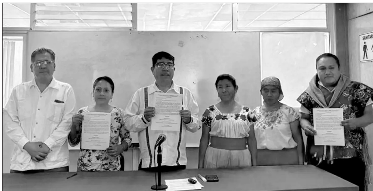
▲ Integrantes buscarán la creación de una comisión de esclarecimiento y entregarán una carta a la embajada de España en México que incluya demandas centrales y a la Iglesia Católica en México para que la haga llegar al Vaticano.

Para lo cual, realizarán del 18 al 22 de mayo de 2026 en la Ciudad de México, la Cumbre Internacional sobre la Doctrina del Descubrimiento, un encuentro de pueblos provenientes de diferentes partes del continente, como de Argentina, Chile, Colombia, Perú, Ecuador, Bolivia, Guatemala y diferentes estados de México.