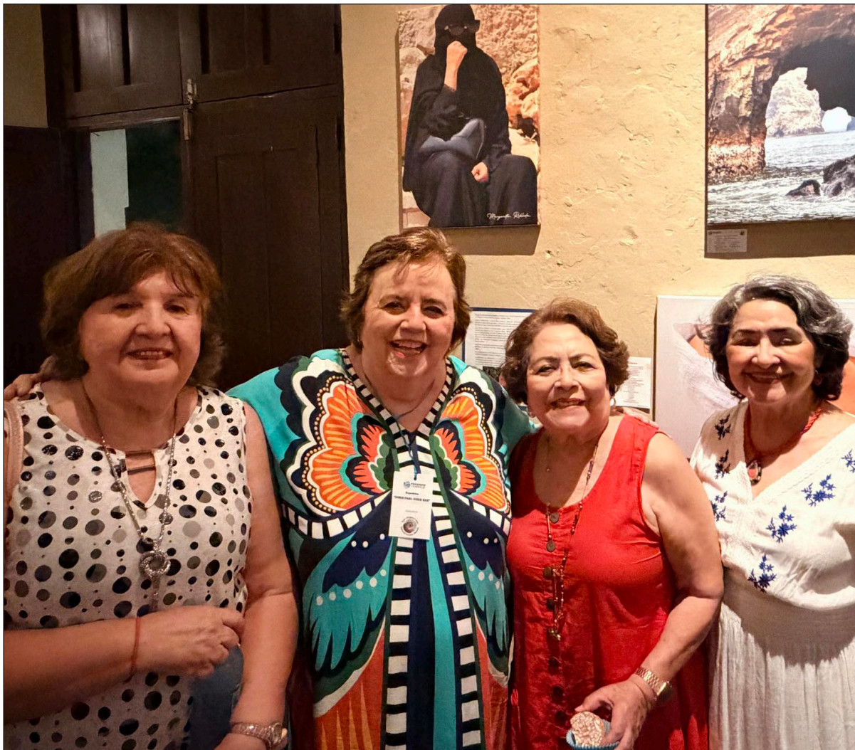
▲ "El final de nuestras historias de chicas MMC ha sido variado. Algunas tristes, otras, al reconocer la inexistencia de los cuentos de hadas y que nadie es perfecto, lograron, con sus altas y bajas: disfrutar la armonía".

Je, Je... La sabiduría de los años me enseñó que siempre seremos los conocidos de alguien.