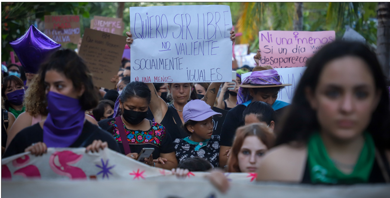
▲ Yucatán es una de las 27 entidades que aprobó la reforma para emitir una ley general a fin de prevenir, investigar y sancionar el delito de feminicidio, con la cual se podrá establecer un protocolo y sanciones únicas para todo el país.