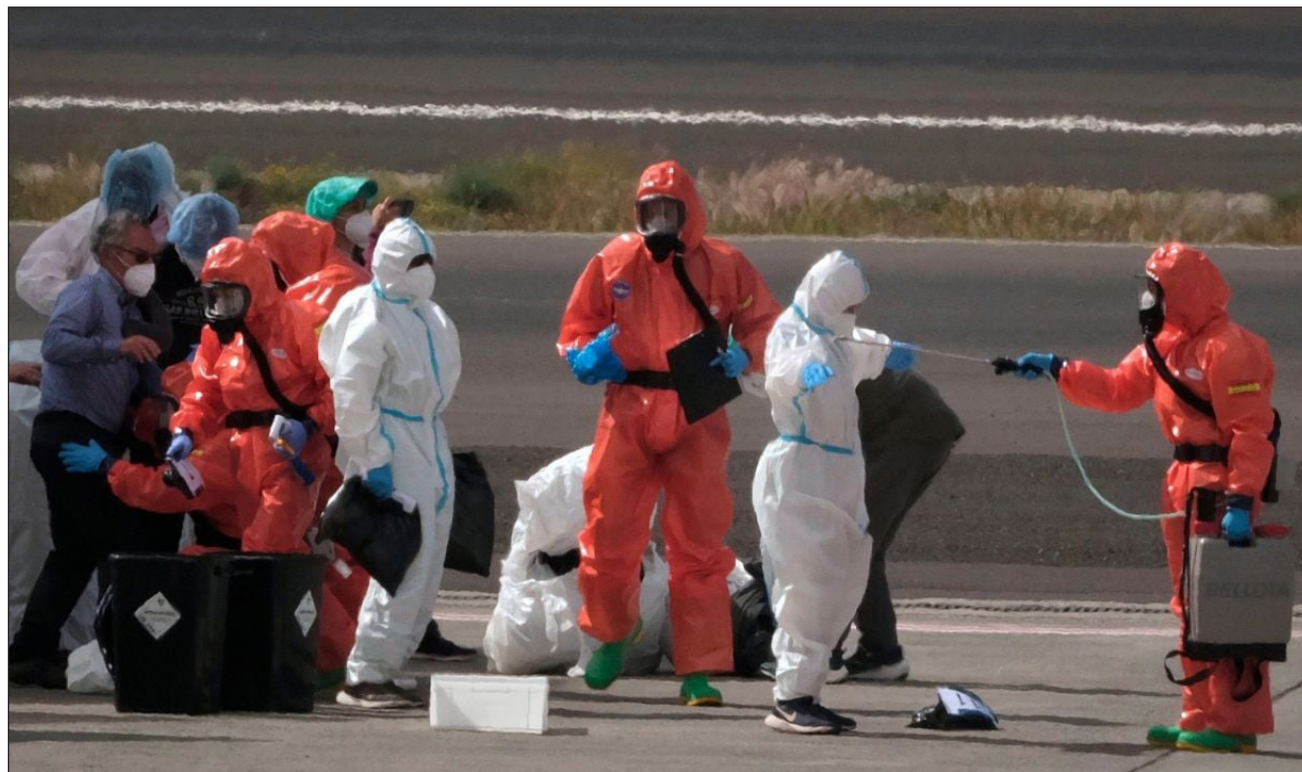
▲ La Organización Mundial de la Salud dice que la detección y el tratamiento tempranos mejoran las tasas de supervivencia.

Los pasajeros del barco comenzaron a volar de regreso a casa el domingo a bordo de aviones militares y gubernamentales después de que el MV Hondius atracara en Islas Canarias. Personal con equipo de protección escoltó a los viajeros del barco a tierra en Tenerife, en un operativo que concluyó el lunes.