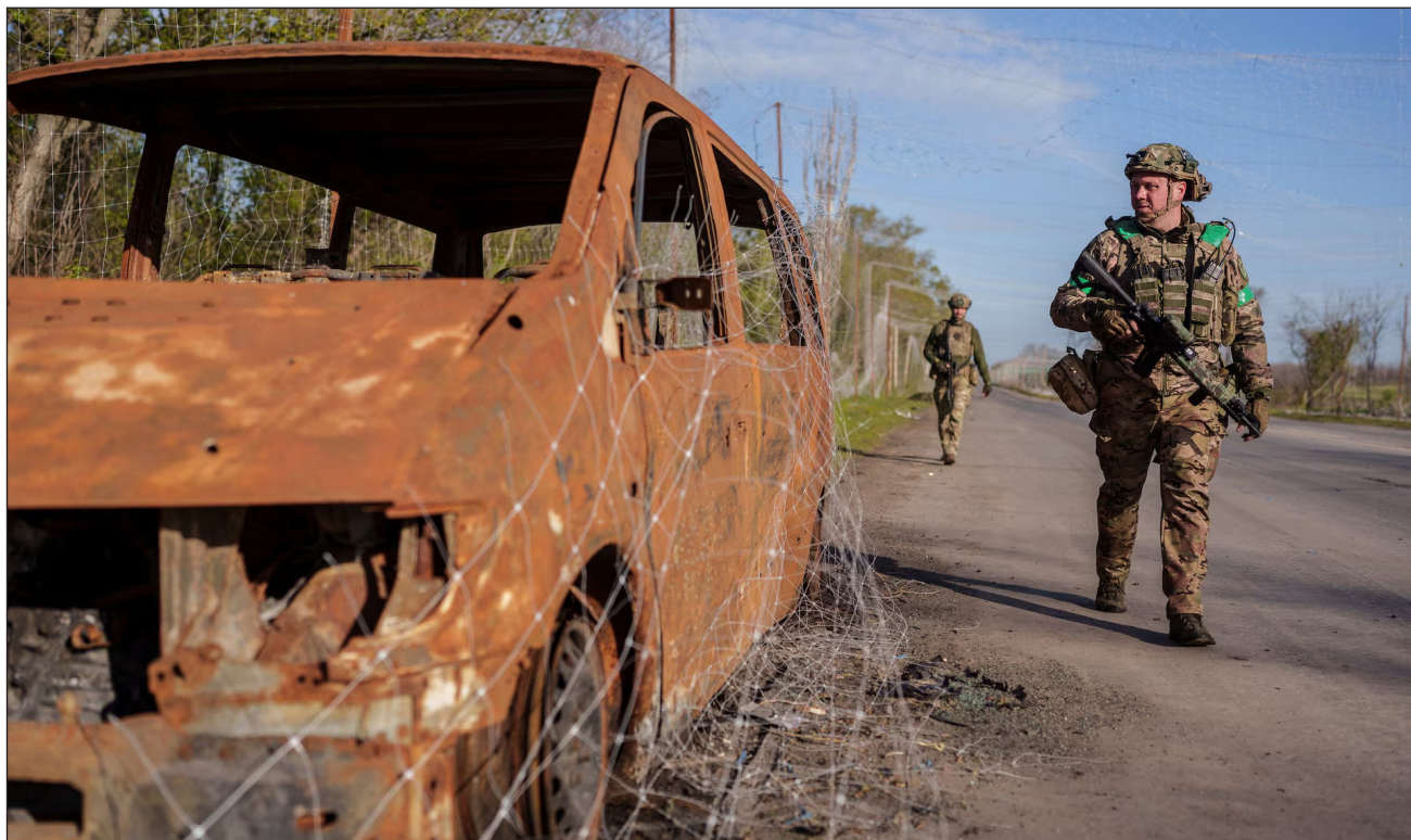
▲ Putin sugirió que la guerra en Ucrania "se encamina a su fin" tras más de cuatro años de derramamiento de sangre.

"Ucrania está en una posición mucho mejor que hace un año (...) pero, por supuesto, no hay tiempo para la autocomplacencia".