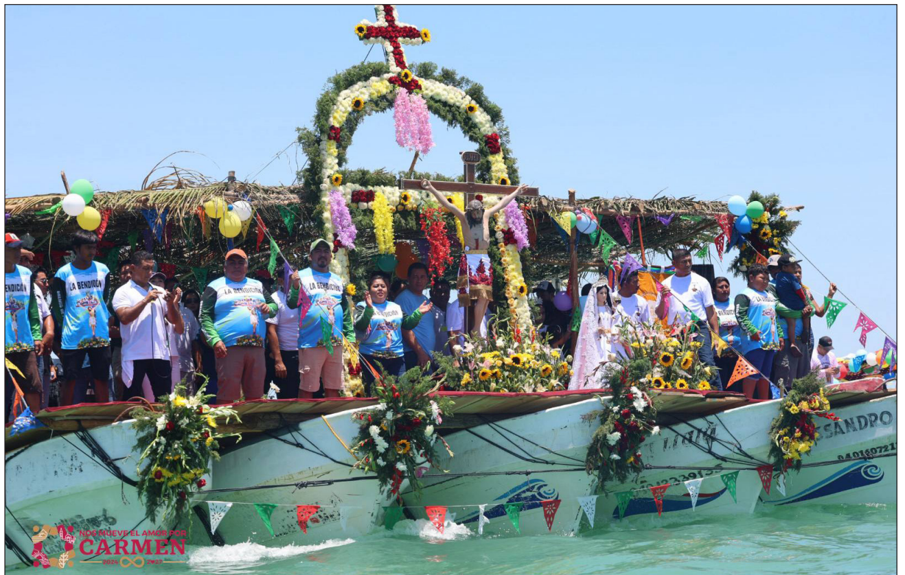
▲ La imagen fue subida a una estructura armada por cinco embarcaciones ribereñas con motor fuera de borda de los pescadores de la localidad, y así cruzar los dos puentes posteriormente.

Al paseo se sumaron hombres del mar y sus familias, con los barcos adornados