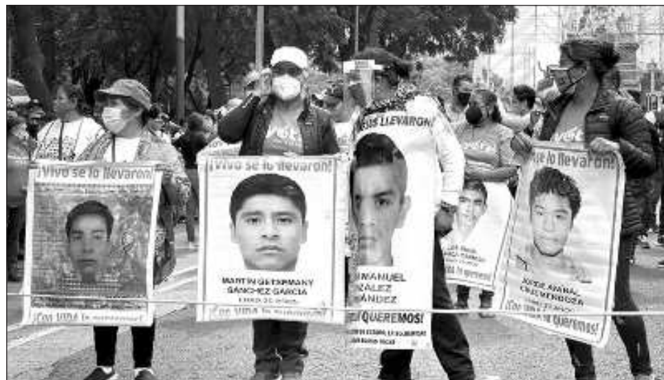
▲ López Obrador también señala que el desmoronamiento de la llamada verdad histórica, urdida en la pasada administración priista, generó una secuela de complicaciones.

"La desaparición de los jóvenes y el crimen de Iguala no fue ordenado por el pre-