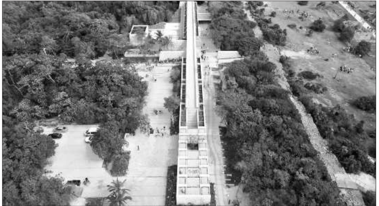
▲ El funcionario federal, Román Meyer Falcón, se trasladó a Tulum, donde informó que el módulo principal de recepción de turistas ya fue entregado al Instituto Nacional de Antropología e Historia (INAH) y se encuentra en operación.

Posteriormente el funcionario federal se trasladó a Tulum, donde informó que el módulo principal de recepción de turistas ya fue entregado al Instituto Na-