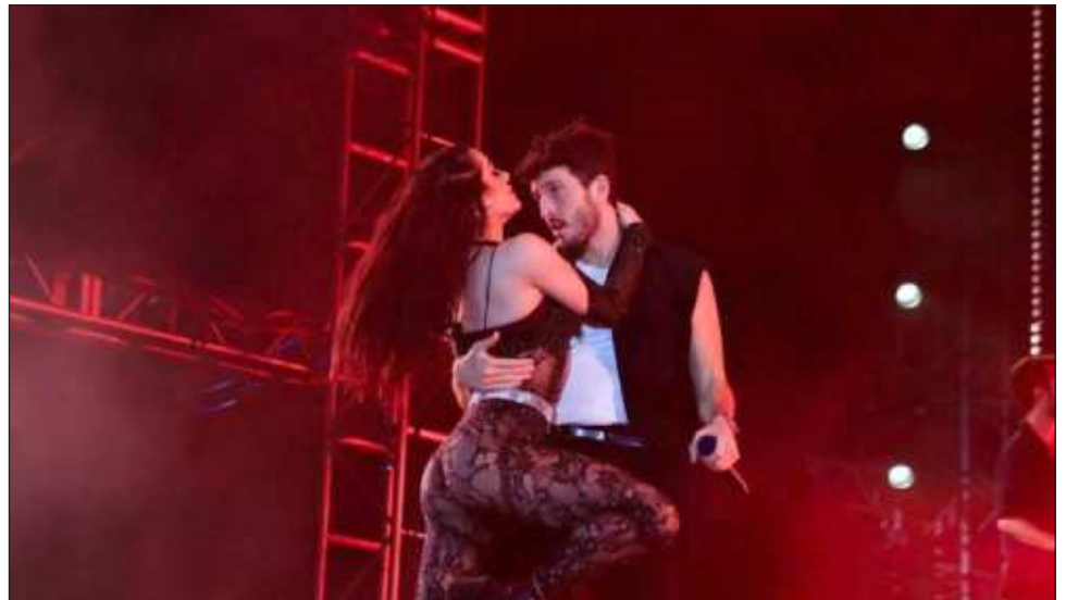
▲ El cantante colombiano puso a cantar y bailar a todo el público asistente con Tacones rojos , Traicionera , Como mirarte y Pareja del año , entre otros éxitos.

El recorrido de comparsas se embelleció con