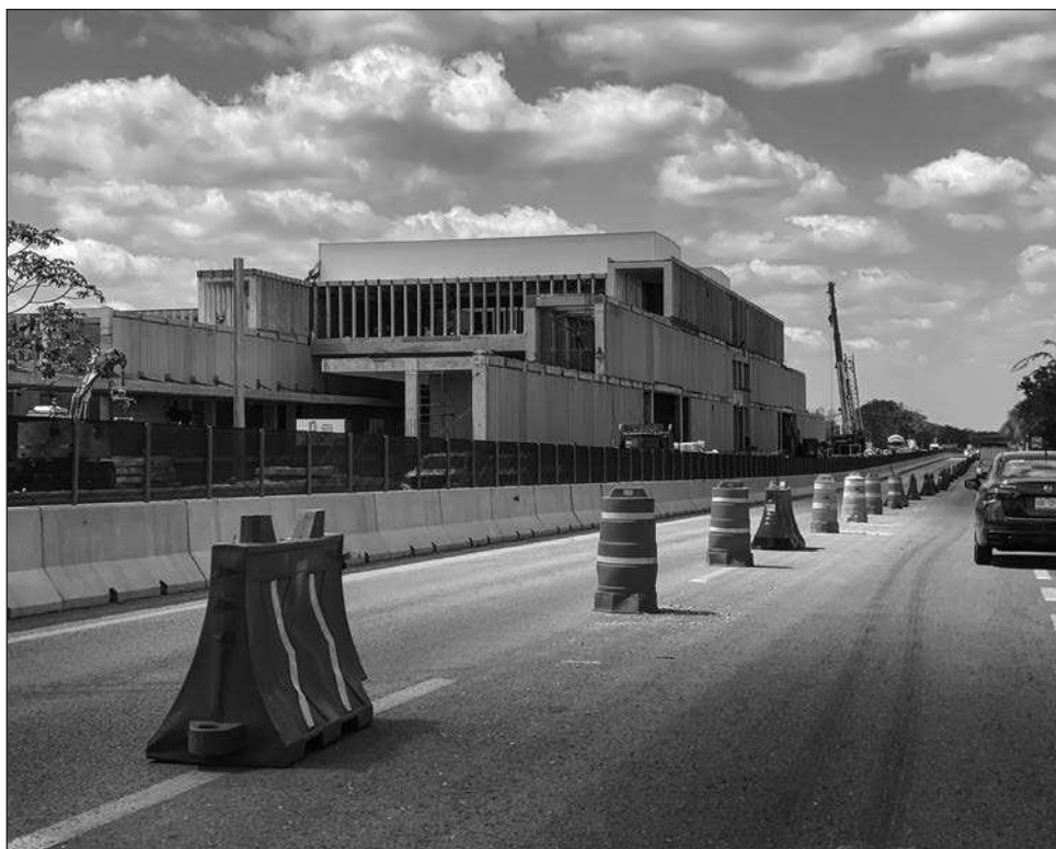
▲ El Programa de Desarrollo Urbano del Centro de Población contempla cuatro alternativas de libramiento, todas incluidas dentro del programa y consideradas viables, aunque su ejecución dependerá de evaluaciones técnicas y de tiempos a corto, mediano y largo plazo.

En cuanto al calendario, informó que si el proceso avanza conforme a lo previsto el Pduc podría ser presentado al Cabildo el próximo 27 de marzo para su análisis y eventual aprobación.