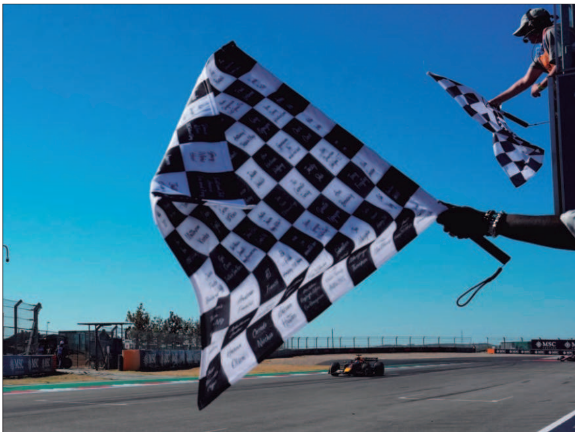
▲ “Al objetivo de los go karts es ganar carreras; actualmente entreno a niños que corren karts y otros que no son tan niños apasionados por correr. Una de las primeras lecciones que doy es que el objetivo es ganar”.

—¿Se debe tener cierta complejidad para ser piloto de carreras?