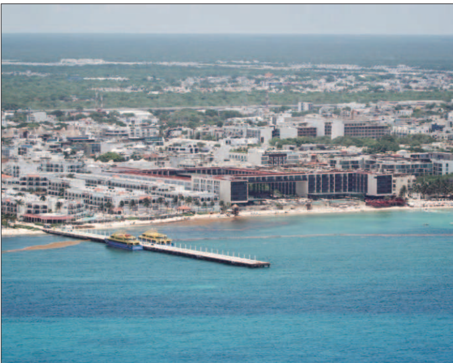
▲ La alcaldesa reiteró que la seguridad y la prevención son prioridades permanentes de esta administración, y su compromiso con los más altos estándares en gestión de riesgos.

Mientras que el turismo médico también ha ido al alza por sus costos accesibles, entre 40 y 80 por ciento más bajos en comparación con Estados Unidos y Canadá; también se cuenta con conectividad aérea; calidad médica; terapias de menor riesgo, que permiten recuperaciones rápidas y sin hospitalización prolongada; y la posibilidad de combinar tratamiento con actividades turísticas, lo que convierte el viaje en una experiencia integral.