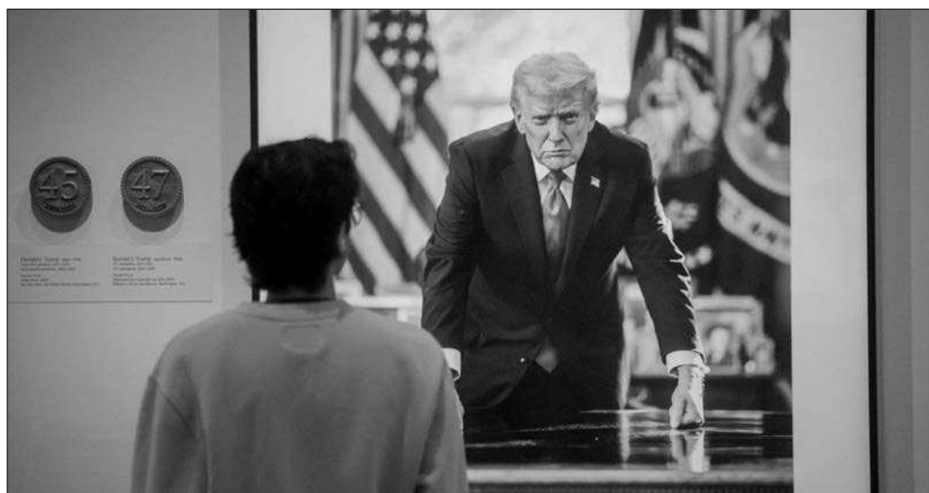
▲ Trump ha indicado que procederá contra los cárteles, pero en lugar de hacerlo en su propio país, la amenaza es la de impulsar operaciones de su ejército en cualquier lugar del continente americano.

Ahora, mantener el respeto en la relación ha sido un reto para el gobierno mexicano. Una reacción inmediata, impulsiva, en algún otro momento, podría haber tenido consecuencias graves para el comercio entre ambos países, y pudo haber sido el pretexto para intentos por parte de Estados Unidos para intervenir en la política nacional. El aplomo y serenidad que ha transmitido la Presidenta en sus respuestas ha sido clave para que las instituciones mexicanas puedan hacer su trabajo y el país siga siendo soberano.