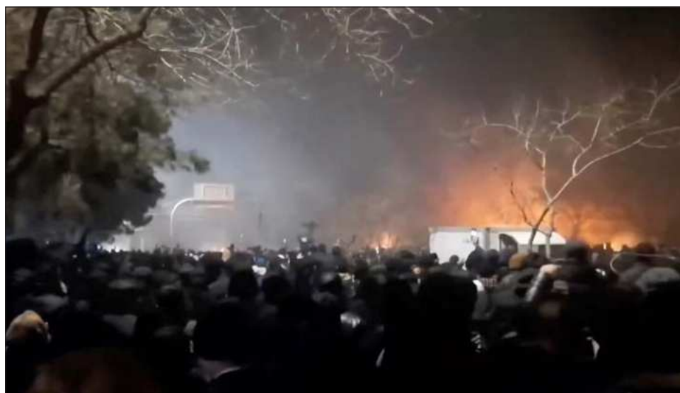
▲ Más de 10 mil 600 personas han sido detenidas durante las dos semanas de protestas, según la Agencia de Noticias de Activistas de Derechos Humanos, con sede en Estados Unidos.

Con el internet caído en Irán y las líneas telefónicas cortadas, evaluar las manifestaciones desde el extranjero se ha vuelto más difícil. El gobierno iraní no ha ofrecido cifras totales