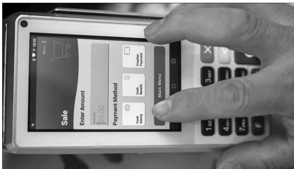
▲ En 2019 el sistema financiero tenía registradas más de 16 mil comisiones y para 2025 se contabilizaban poco más de 12 mil 500, esa reducción no elimina su peso dentro de la banca nacional.

Esa reducción en el número de comisiones no elimina su peso dentro del sistema. Aun con menos registros que hace seis años, las cifras del banco central