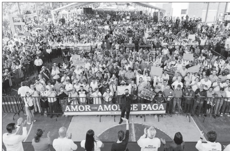
▲ La mandataria sostuvo que la estrategia federal consiste en generando las condiciones para que ningún joven vea en su incorporación al crimen organizado como una opción de vida.

En su primera visita a Michoacán tras anunciar el Plan de Justicia para la entidad -derivado del asesi-