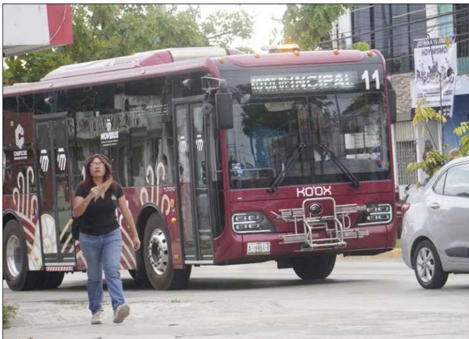
▲ El costo total del traslado no superará los 18 pesos, incluso si se realizan uno o varios transbordos. Preciso que el primer viaje, de las colonias a las rutas troncales, tendrá un costo de 12 pesos; el uso de las rutas troncales será de seis pesos, y el tercer y cuarto traslado serán gratuitos.

También sostuvo que el traslado, aunque haya algún o algunos transbordos, no superará los 18 pesos pues, pues aclaró "el primer viaje que es de las colonias a los troncales, será de 12 pesos, los troncales tienen un valor