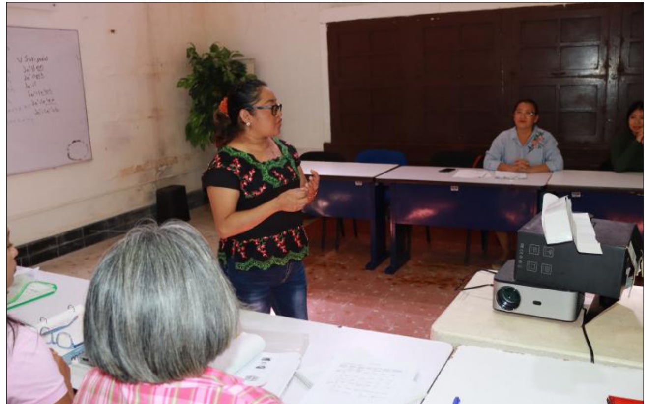
▲ El objetivo de este programa del Indemaya es fortalecer el conocimiento, uso y preservación de la lengua maya, patrimonio cultural e identidad del pueblo yucateco. Los cursos cuentan con cupo limitado. Foto crédito

El inicio de clases está programado para el miércoles 18 de febrero, en los horarios de 11 a 12 horas y de 14 a 15 horas. Asimismo,