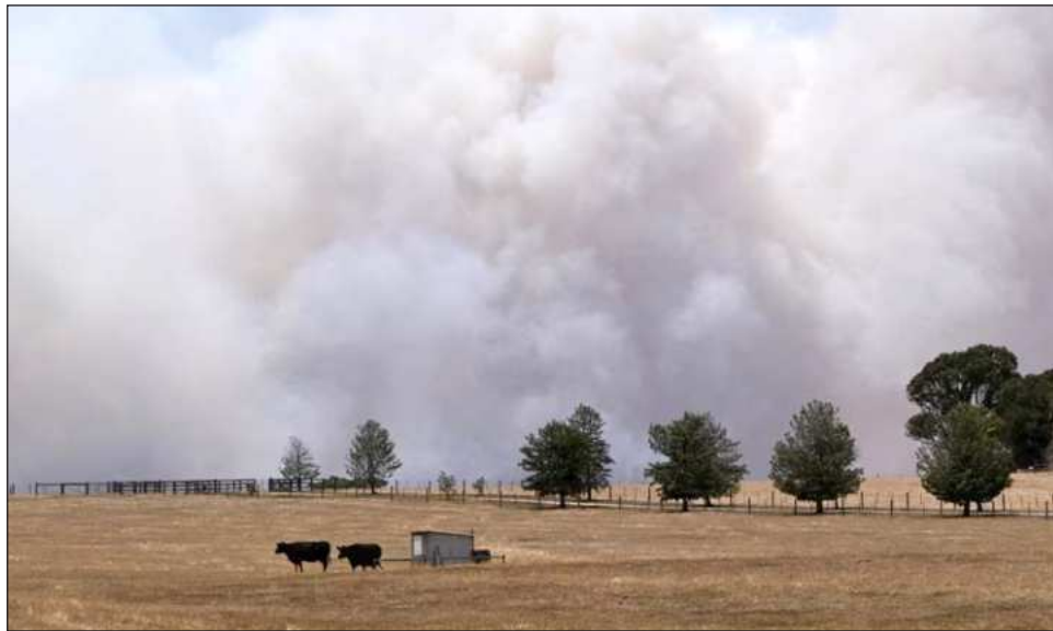
▲ Más de 70 casas fueron destruidas, junto a grandes terrenos agrícolas y bosques.

Más de setenta hogares fueron destruidos por el fuego, junto a grandes extensiones de terrenos agrícolas y bosques, agregó.