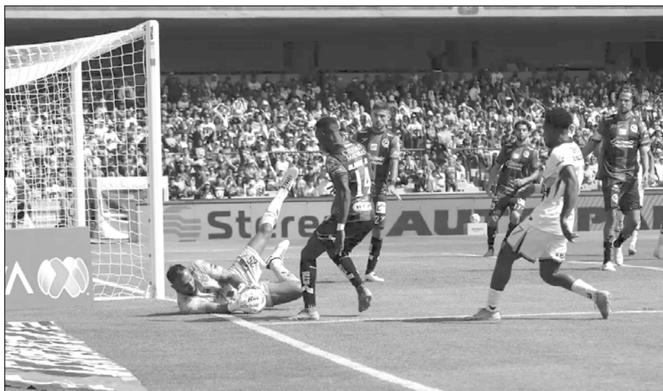
▲ Los Pumas decepcionaron en su estreno, ante los Gallos Blancos.