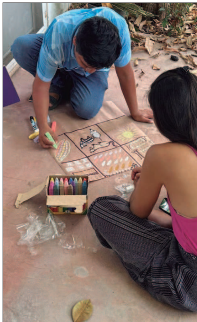
▲ El proyecto promueve la organización comunitaria para enfrentar riesgos como huracanes e inundaciones.

Esta nota periodística es parte del proyecto Voces Sustentables del Instituto para la protección del medio ambiente natural A.C. en colaboración con La Jornada Maya .