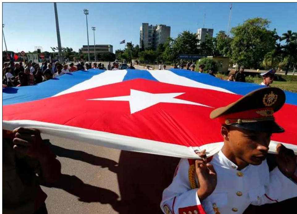
▲ “Quienes culpan a la Revolución de las carencias económicas, deberían callar (...) reconocen que son fruto de las draconianas medidas de asfixia extrema que EU nos aplica”, señaló Miguel Díaz-Canel.

“Cuba es una nación libre, independiente y so-