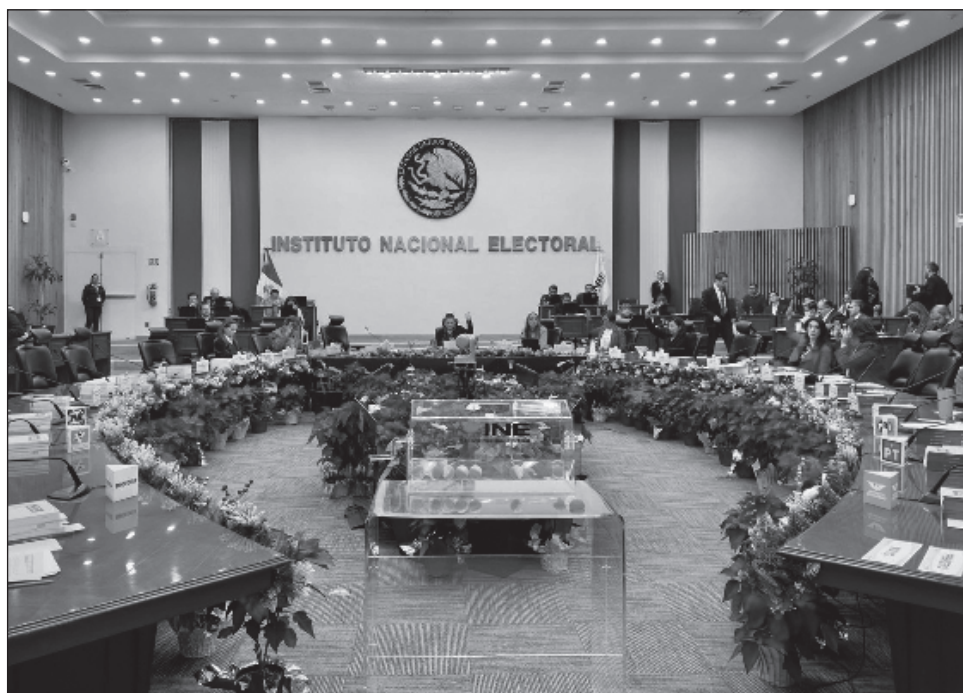
▲ Uno de los puntos a destacar es el fortalecimiento de la tarea fiscalizadora del INE, tanto a partidos como a particulares, en territorio y plataformas digitales.

“Garantizar la trazabilidad de los recursos que utilizan los sujetos obligados para el desarrollo de sus actividades, mediante la verificación del origen, destino, aplicación y monto mediante la regulación del uso de activos virtuales y nuevas figuras que se incorporen en el sistema financiero”, se lee en la agenda temática.