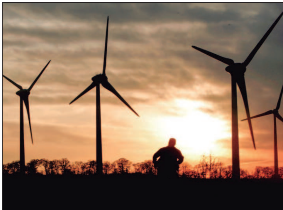
▲ Creciente impacto de las fricciones geopolíticas y geoeconómicas, así como de la automatización, en la fuerza laboral del sector, motivos de la desaceleración: Irena.

China sigue siendo el líder indiscutible en este campo, al acaparar 44 por ciento del total global de creación de empleo en el sector, donde la energía solar fotovoltaica se mantiene como número uno, gracias