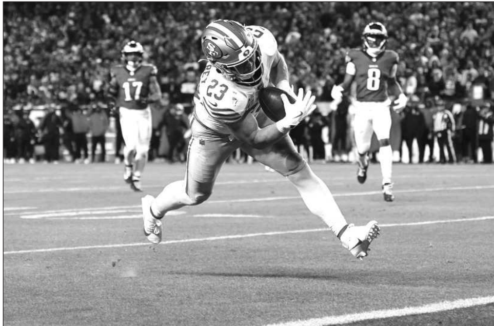
▲ Christian McCaffrey, de los 49's, anota durante la segunda mitad del duelo ante las Águilas.

La postemporada se puso en marcha el sábado