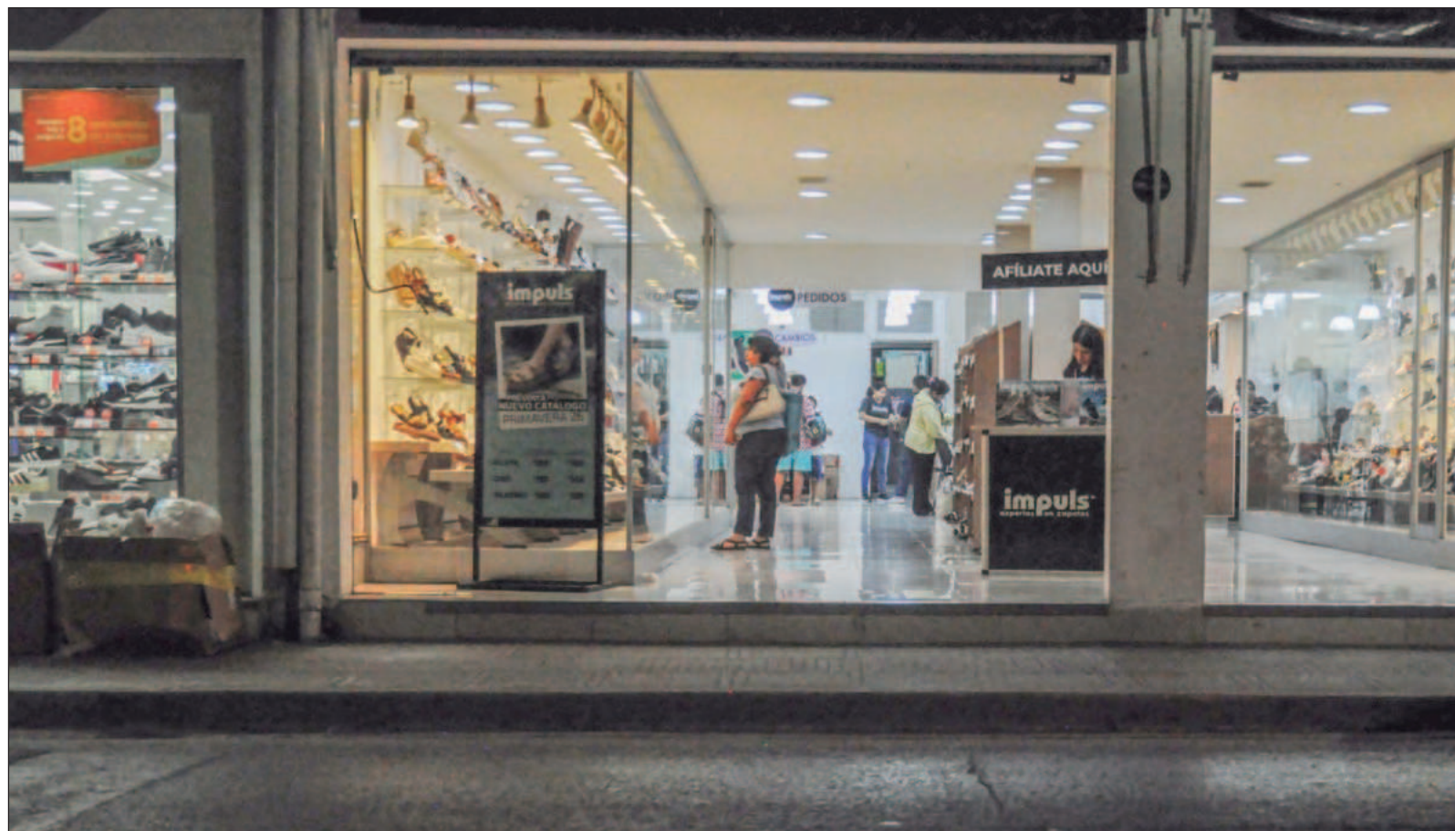
▲ “Cada regalo nuevo, cada sorpresa, cada capricho porque sí, genera un pico de placer, pero a la larga, el cerebro se habitúa. Lo que era emocionante, ahora se vuelve normal, lo que ilusionaba, ahora aburre y lo que debería agradecerse, ahora se exige”.