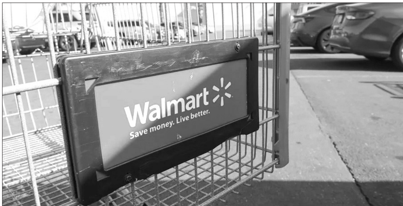
▲ “La transición de la búsqueda tradicional web o de aplicaciones al comercio dirigido por agentes representa la próxima gran evolución en el comercio minorista”, dijo John Furner, presidente y director ejecutivo entrante de Walmart, en un comunicado junto a Google.

Una función de pago instantáneo permitirá a los clientes realizar compras en algunos negocios y a través de una variedad de provee-