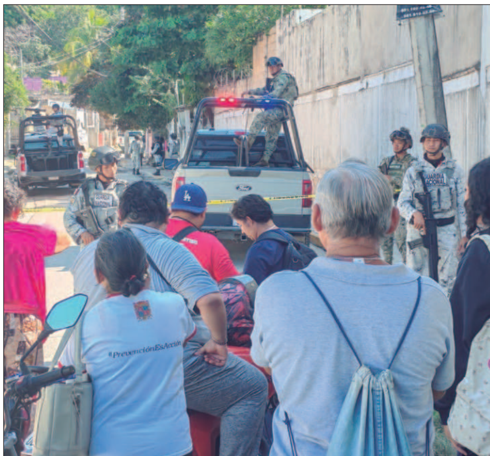
▲ El líder municipal del PAN en Campeche subrayó que “nada es más falso que la narrativa de un gobierno que no quiere combatir al crimen ni acabar con la violencia”.

Finalmente, lanzó una pregunta directa a la ciudadanía: “¿Hoy se sienten más seguros en las carreteras de nuestro país? ¿se sienten con la plena seguridad de salir a las dos o tres de la mañana sin que les suceda algo? Estoy seguro de que la respuesta es no”.