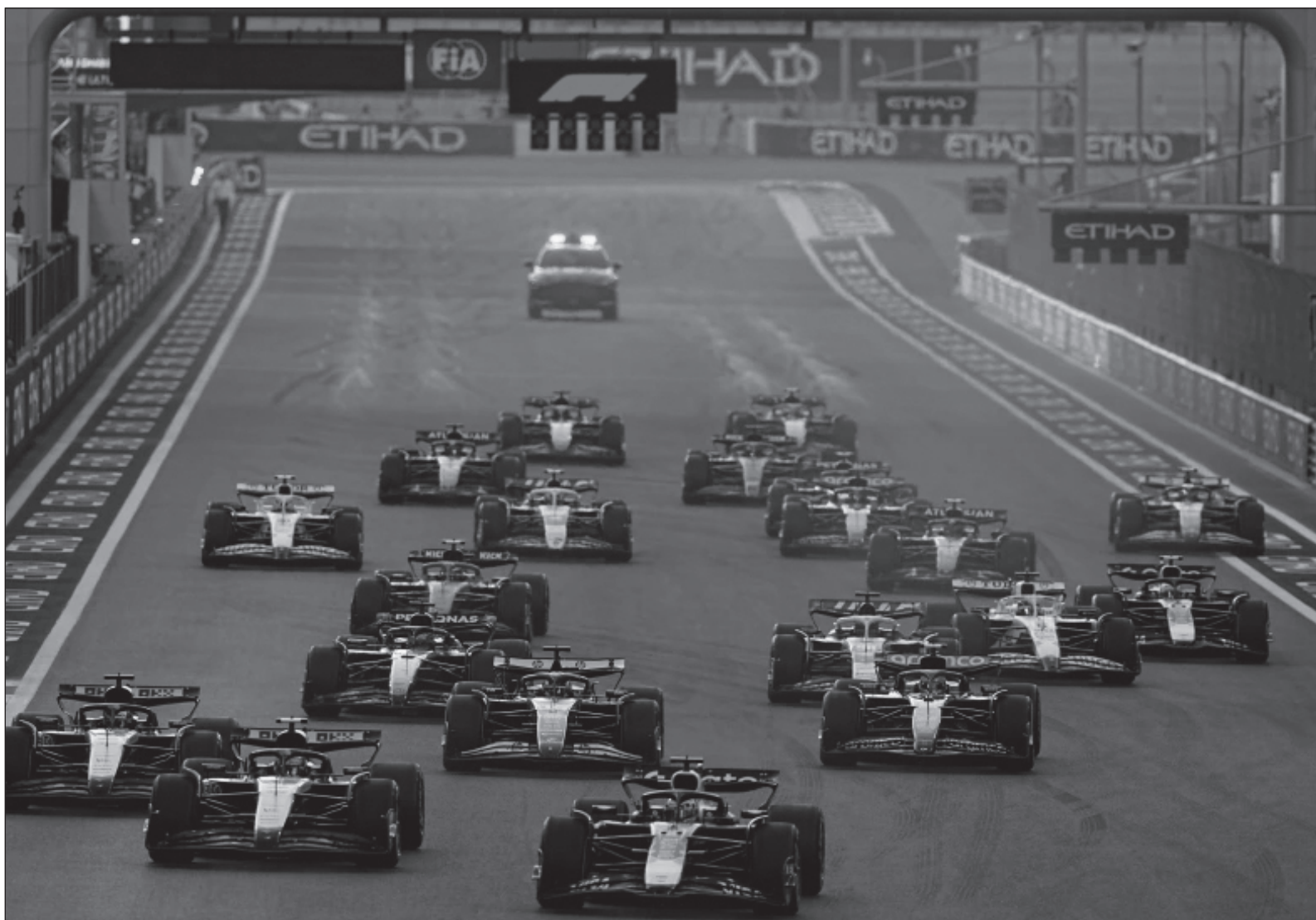
▲ “El kart da una habilidad muy única, la resiliencia porque por más perfecto que tengas todo, puede fallar cualquier cosa y ahí te quedas, se terminó tu carrera. Esa probabilidad le pasa a todos los pilotos, ninguno está exento de una falla mecánica o un accidente”.