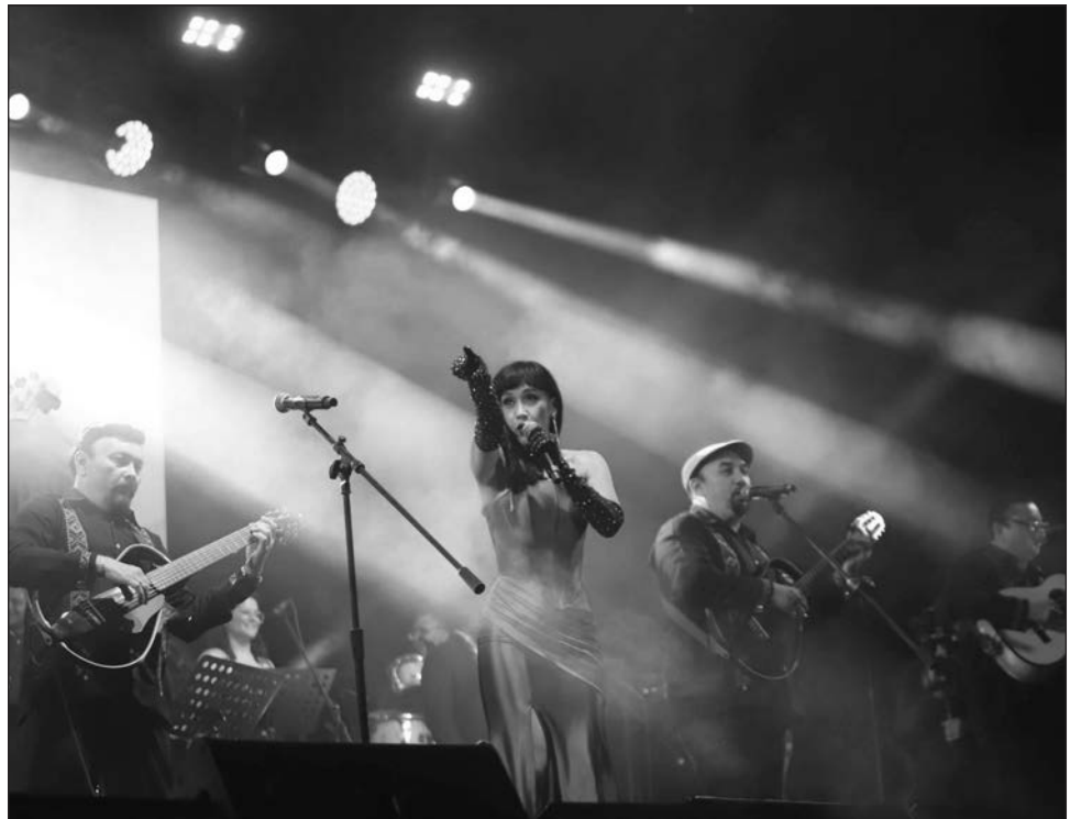
▲ Una noche estrellada fue el marco del espectáculo, estreno mundial en honor del afamado compositor yucateco y evento central del Mérida Fest 2026.

Los eventos del Mérida Fest 2026 continúan hasta el 18 de enero. La cartelera completa se puede consultar en merida.gob.mx/meridafest .