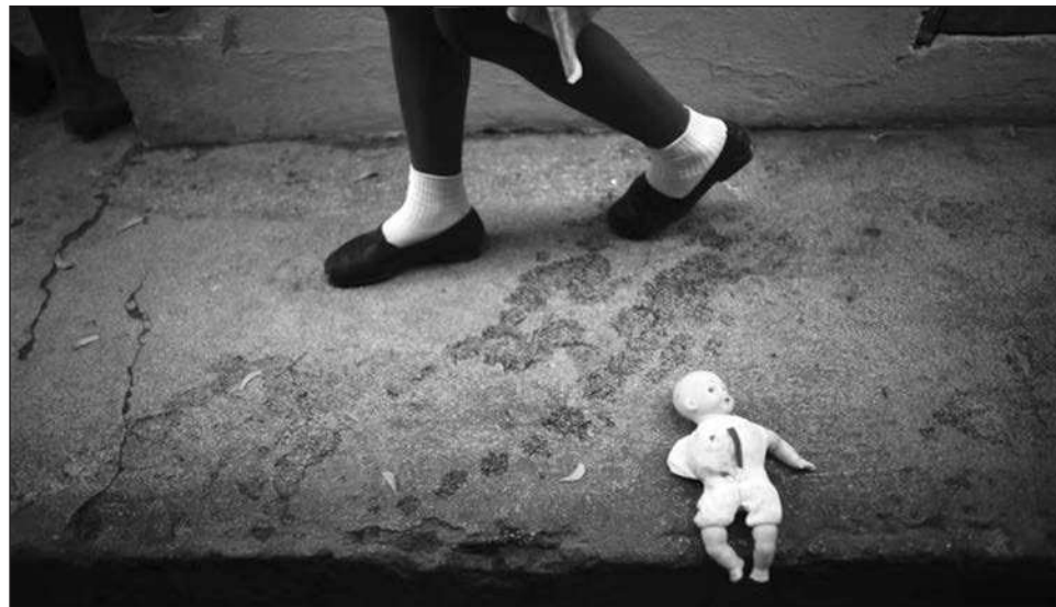
▲ Según el estudio, se estima que 10.4 millones de mujeres de 15 años y más se casaron o unieron antes de los 18 años, y que de ellas, 4 por ciento lo hicieron antes de cumplir quince.

Para erradicar el matrimonio infantil y las uniones