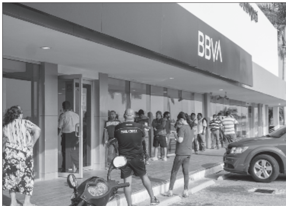
▲ El entorno de altas tasas de interés que persiste permite que los márgenes entre los intereses que cobran a deudores y los que paga a los ahorradores les beneficie.

Según las estadísticas de la CNBV, el margen financiero entre enero y agosto fue por un monto de 491 mil 129 millones de pesos, toda