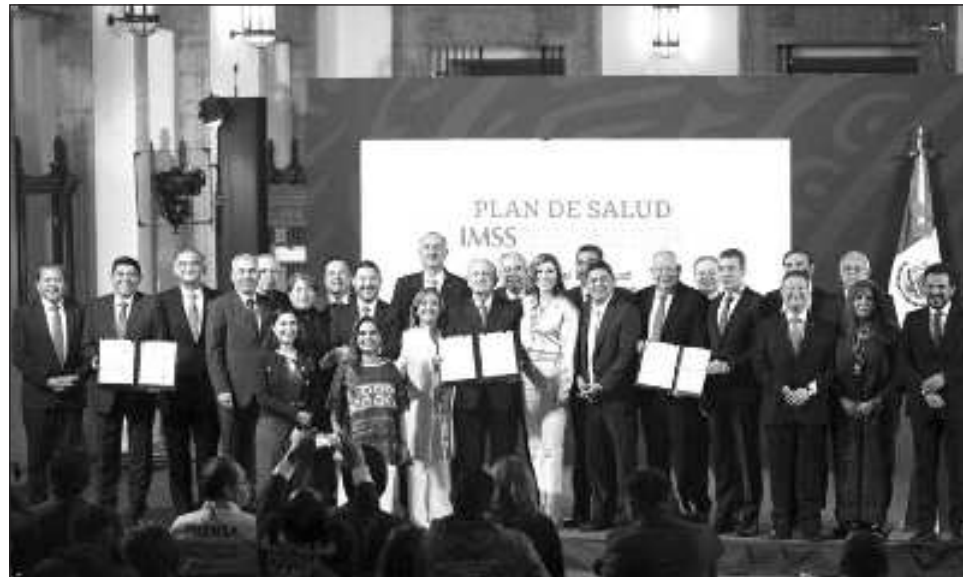
▲ El acuerdo fue suscrito por el Presidente y las autoridades federales correspondientes; no acudieron los gobernadores de Morelos y Guerrero, pero sus titulares de Salud acordaron la firma.

Alcocer indicó que de un universo de 66.4 millones de personas sin seguridad social, el IMSS-Bienestar atenderá a 53.2 millones de personas, equivalente a 80.2 por ciento. El acuerdo fue suscrito por el Presidente y