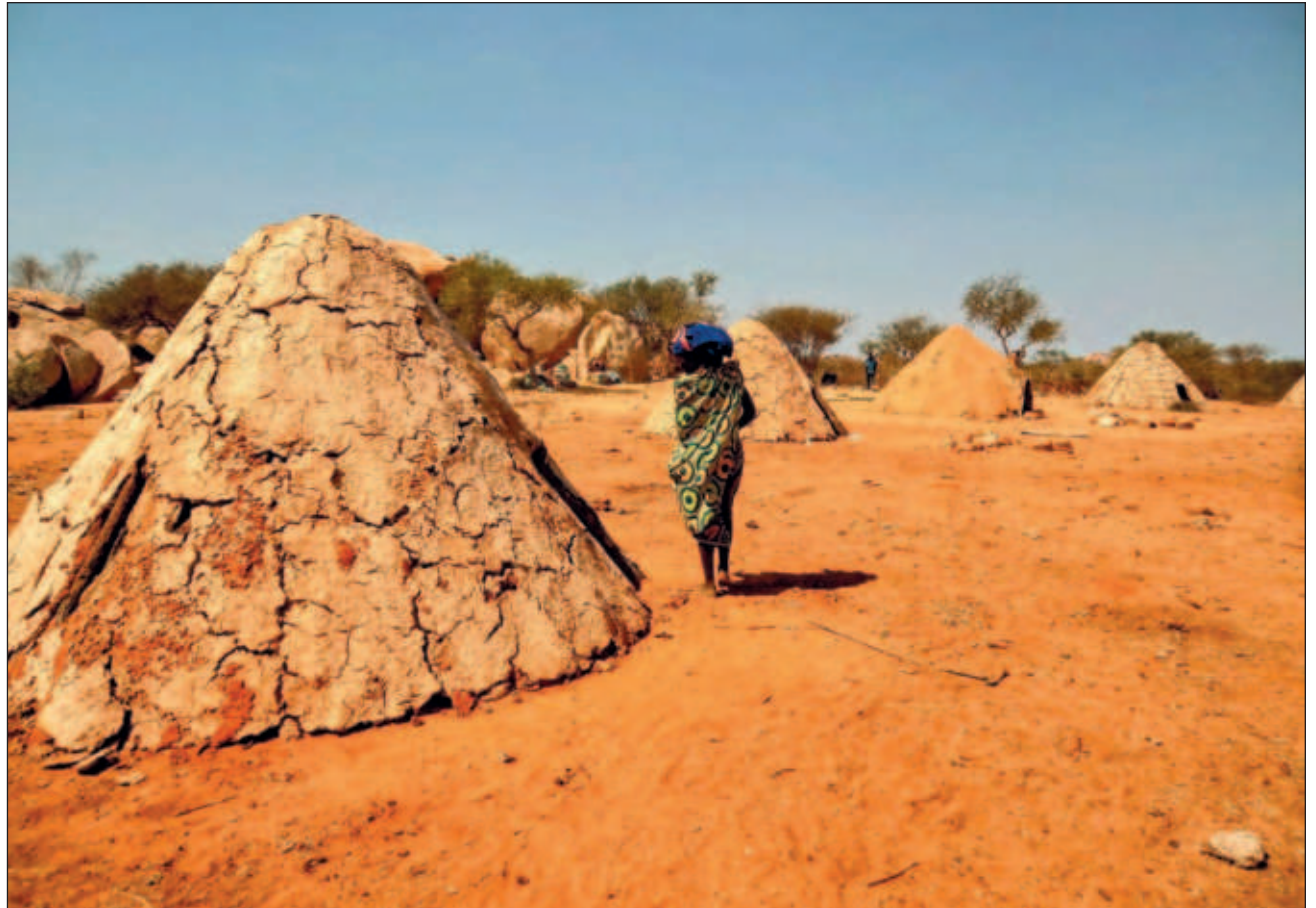
▲ Ba'ax meyajta'abe' ku ye'esik u kajnáalo'ob Namib angoleñoile' yaanal u yóolo'ob ti' uláak' túumben kaajo'ob, ba'ale' jach mu'uk'a'an yanik ichilo'ob.

"Béeychaj k-kaxtik jayp'éel múuch'o'ob ku tukulta'al ts'o'okili' u ch'éejelo'ob walkil maanal 50 ja'abo'ob", a'alab tumen Jorge Rocha, juntúul jeenetista ku meyajtik kaajo'ob, tu kúuchil