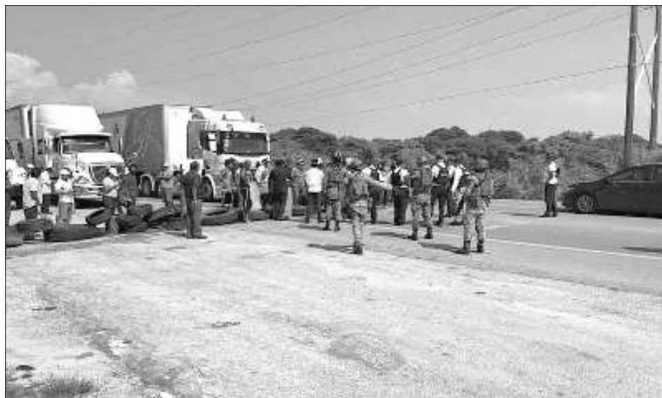
▲ Aproximadamente 50 personas utilizaron llantas y palos para bloquear el acceso al Puente de la Unidad, manteniendo su exigencia de eliminación de la medida gubernamental.

Cerca de las 9:30 horas de este martes, un grupo de comerciantes de la Villa de