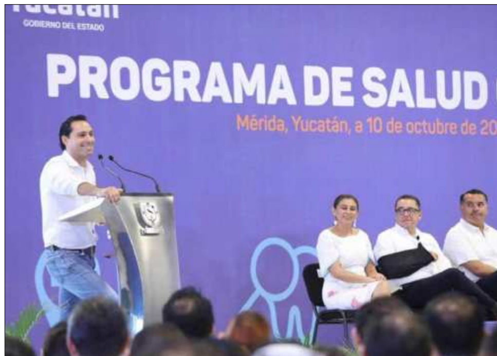
▲ El gobernador Mauricio Vila aseguró que el Programa Salud Cercana y el lanzamiento de dicha tarjeta van a generar un antes y un después en dicho sector.

Para seguir fortaleciendo a las 140 clínicas estatales, también dotarán de tanques de oxígeno y una mochila roja, con todo lo necesario para estabilizar pacientes que están