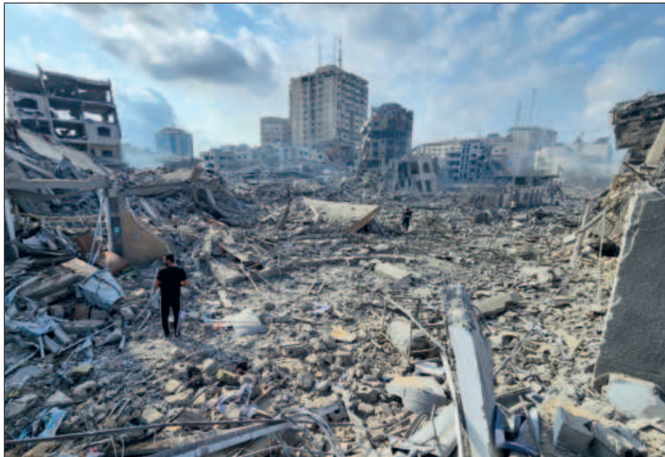
▲ El Programa Mundial de Alimentos (PMA) de Naciones Unidas necesita 17.3 millones de dólares en las próximas cuatro semanas para abordar "esta situación crítica".

De ellos, 137 mil 500 están refugiados en escuelas de la