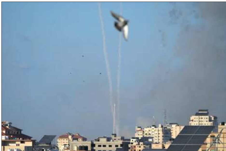
▲ En su conferencia, López Obrador condenó el uso de la violencia para dirimir conflictos, enfatizando que México siempre se ha pronunciado por la paz, con base en una política diplomática.

Mencionó que hay una solicitud de mil ciudadanos mexicanos que quieren regresar al país, puntualizando, por otro lado, que de los tres mexicanos que estaban desaparecidos y se localizó al primero.