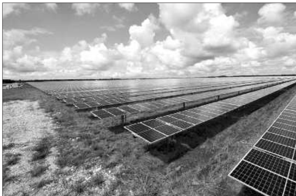
▲ El alcalde aseguró que la población prefiere inversiones sustentables a la instalación de una planta porcícola que quedó descartada debido a la negativa ciudadana.

El edil señaló que "la granja porcícola quedó descartada desde hace un año aproximadamente, el pueblo no la quiso debido a lo que representaba el posible