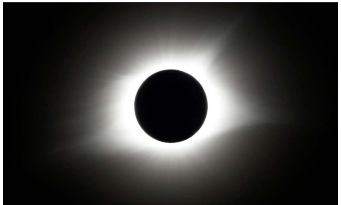
▲ El sur del estado será el mejor punto para ver el eclipse; el estado distribuirá 4 mil lentes a través de los planetarios, más los filtros de los 109 telescopios que se instalarán el sábado.

El planetario de Cozumel iniciará actividades a las 8:30 horas con una pajareada gratuita; la visualización del eclipse es de 10:50 a 14:30 horas. Más información en la página de Facebook @planetariodecozumel.