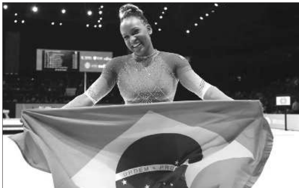
▲ La gimnasta Rebeca Andrade será una de las grandes estrellas en los Juegos Panamericanos de Chile.

Andrade fue elegida por Panam Sports como embajadora junto a la dominicana Marileidy Paulino, la canadiense Maggie Mac Neil, la mexicana Alejandra Orozco, el venezolano Daniel Dhers, el cubano Mijaín López, la