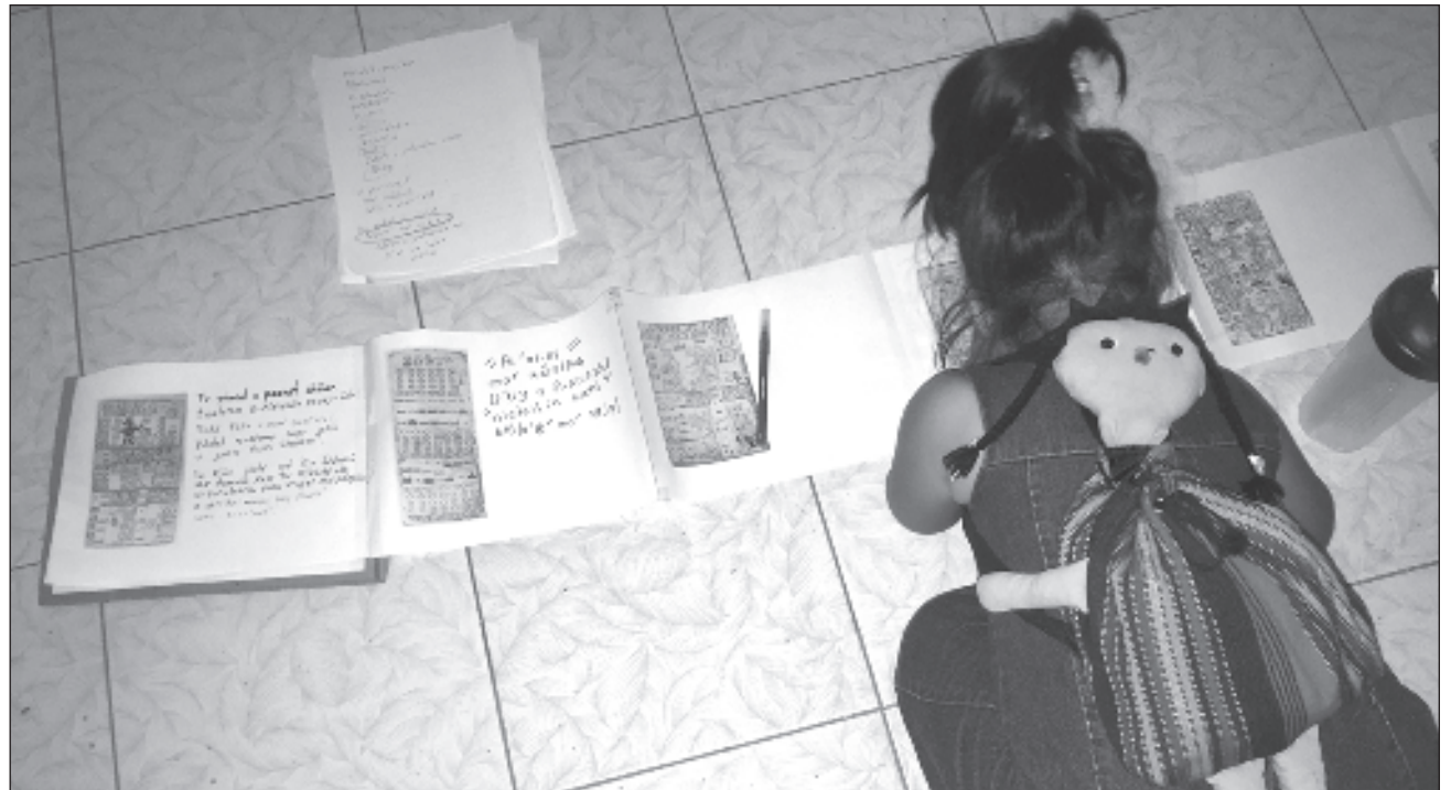
▲ Las reformas constitucionales aprobadas a la Ley de Educación del Estado tienen el objetivo de garantizar la interculturalidad, el multilingüismo, el respeto a la diversidad cultural y los derechos lingüísticos.