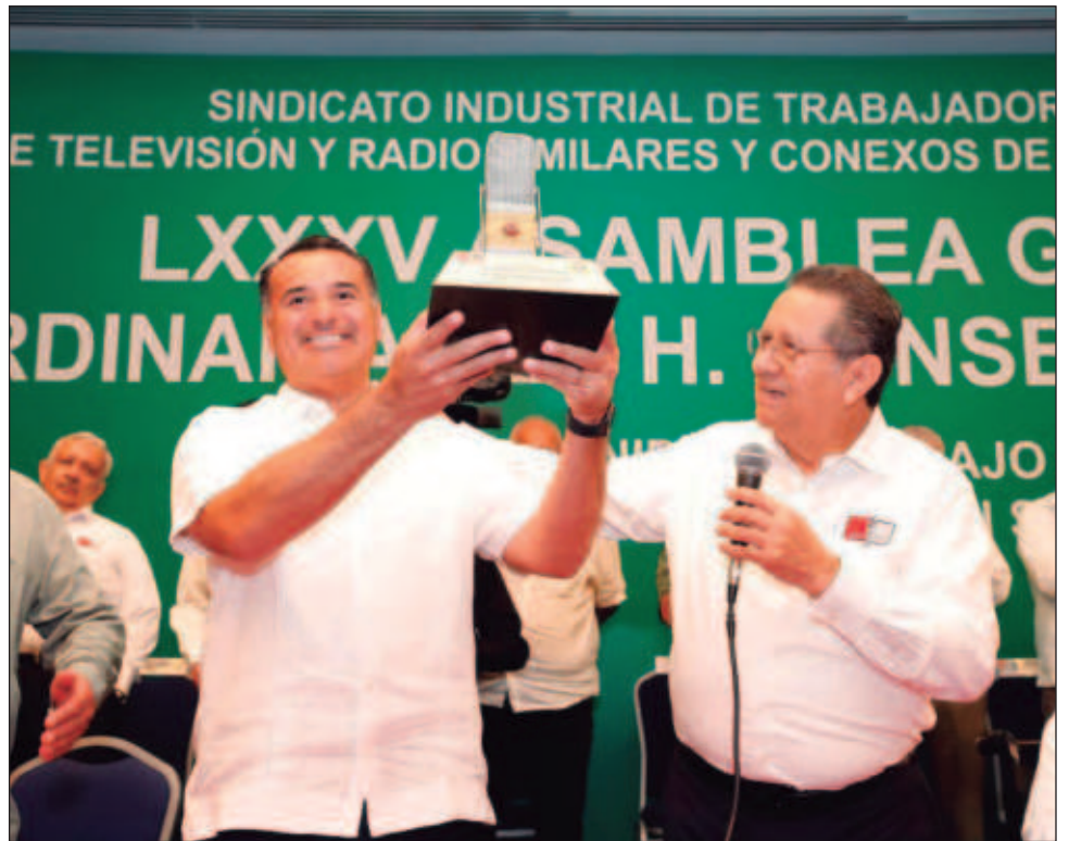
▲ En su mensaje, el alcalde destacó la importancia de este sector, porque mediante su labor informativa se promueve y fortalece la democracia.

“Estoy convencido de que, si trabajamos en equipo, unidos, con la mira puesta en el bien colectivo, avanzaremos de manera más ágil y rápida en la construcción de la sociedad que todos queremos”, expresó.