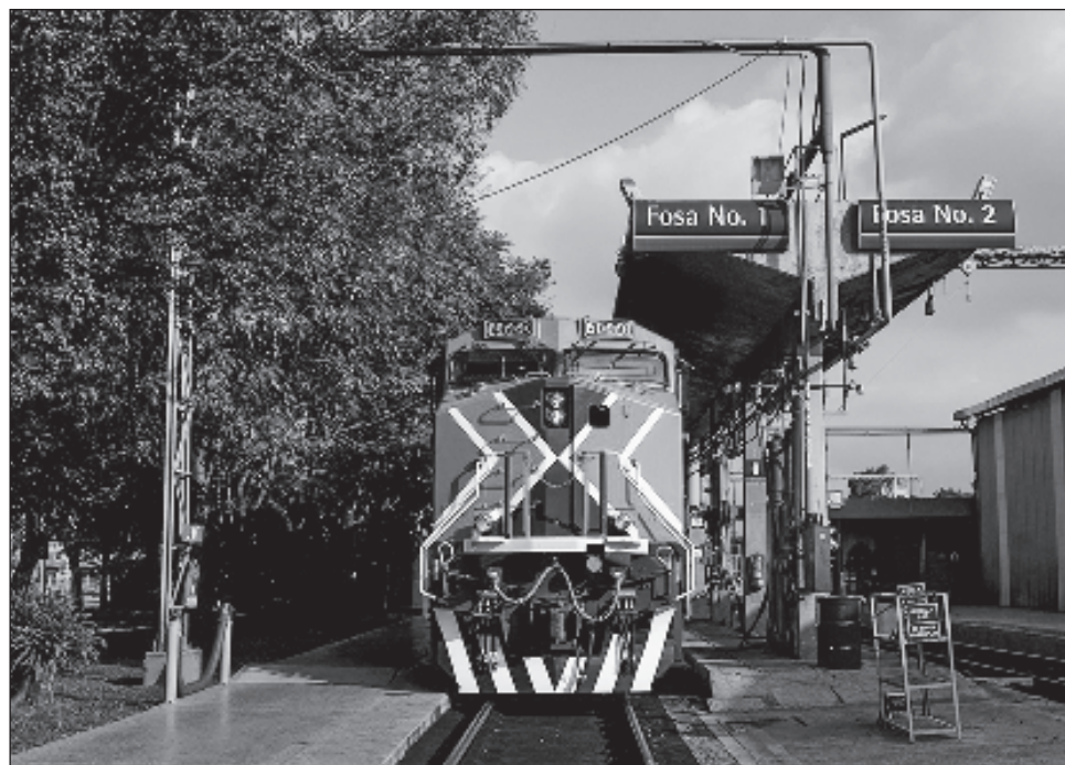
▲ El Presidente destacó en su conferencia que si bien sólo le queda menos de un año para concluir, se quedaría como parte de los proyectos encaminados para que el nuevo gobierno tenga esta opción.

Comentó que si bien sólo le queda menos de un año para concluir, se quedaría como parte de los proyectos encaminados para que el nuevo gobierno tenga esta opción. “Vamos a hacer la propuesta formal cuando se tenga todo el proyecto. Nos falta menos de un año, pueden salir muchas otras cosas. Pensar hacia adelante. No es