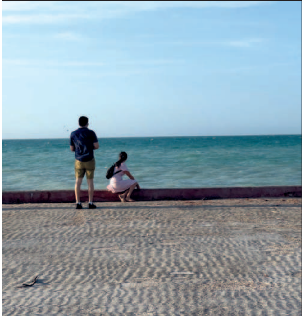
▲ Los trastornos de ansiedad suelen presentarse en la adolescencia, pero es importante aclarar que los síntomas comienzan a aparecer desde la infancia y muchas veces no se detecta a tiempo.