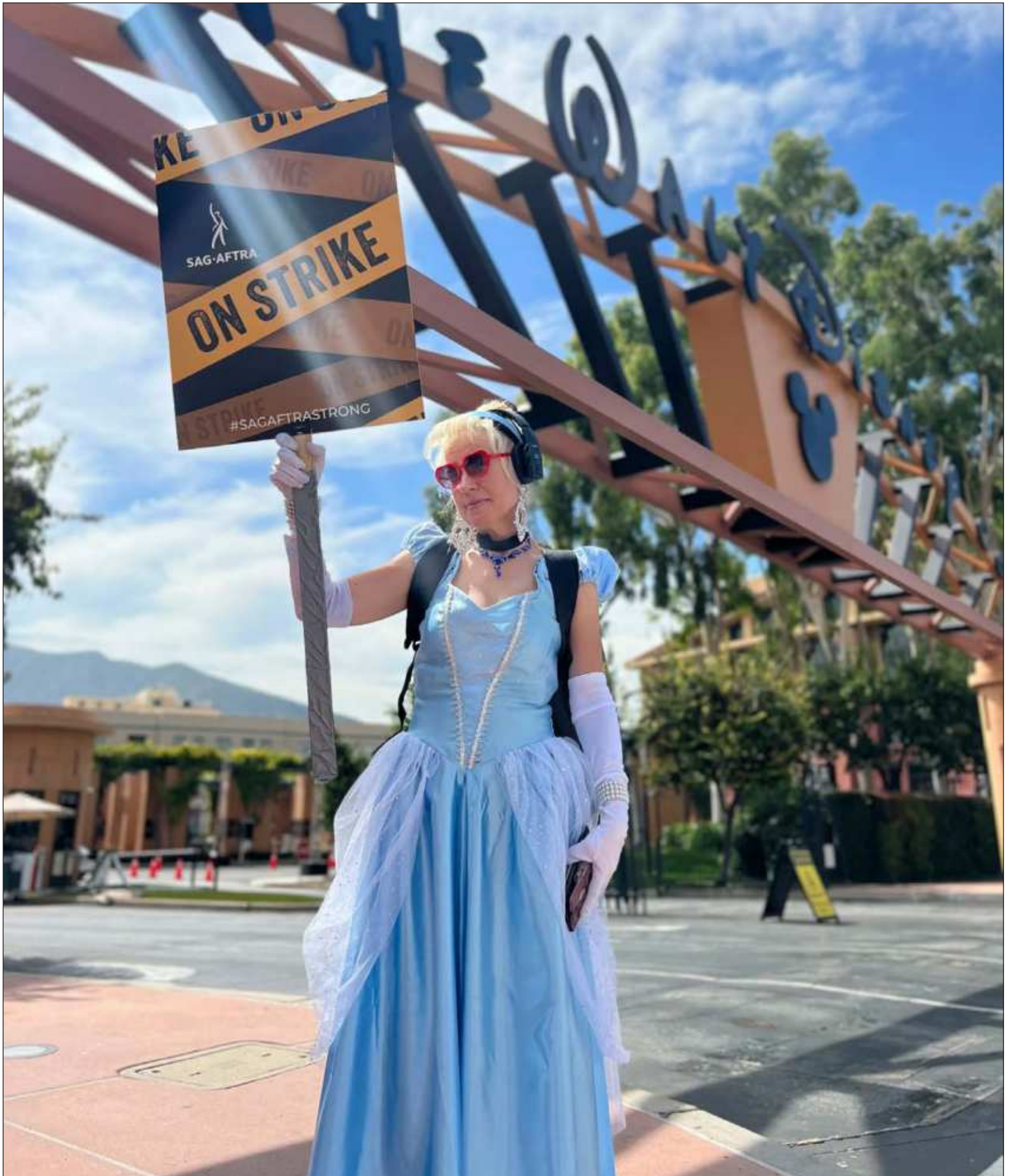
▲ Los guionistas de Hollywood votaron casi por unanimidad para aprobar el acuerdo contractual alcanzado por sus líderes sindicales, que puso fin a casi cinco meses de huelga, mientras que los actores continúan en negociaciones para encontrar una salida a su propio paro laboral.