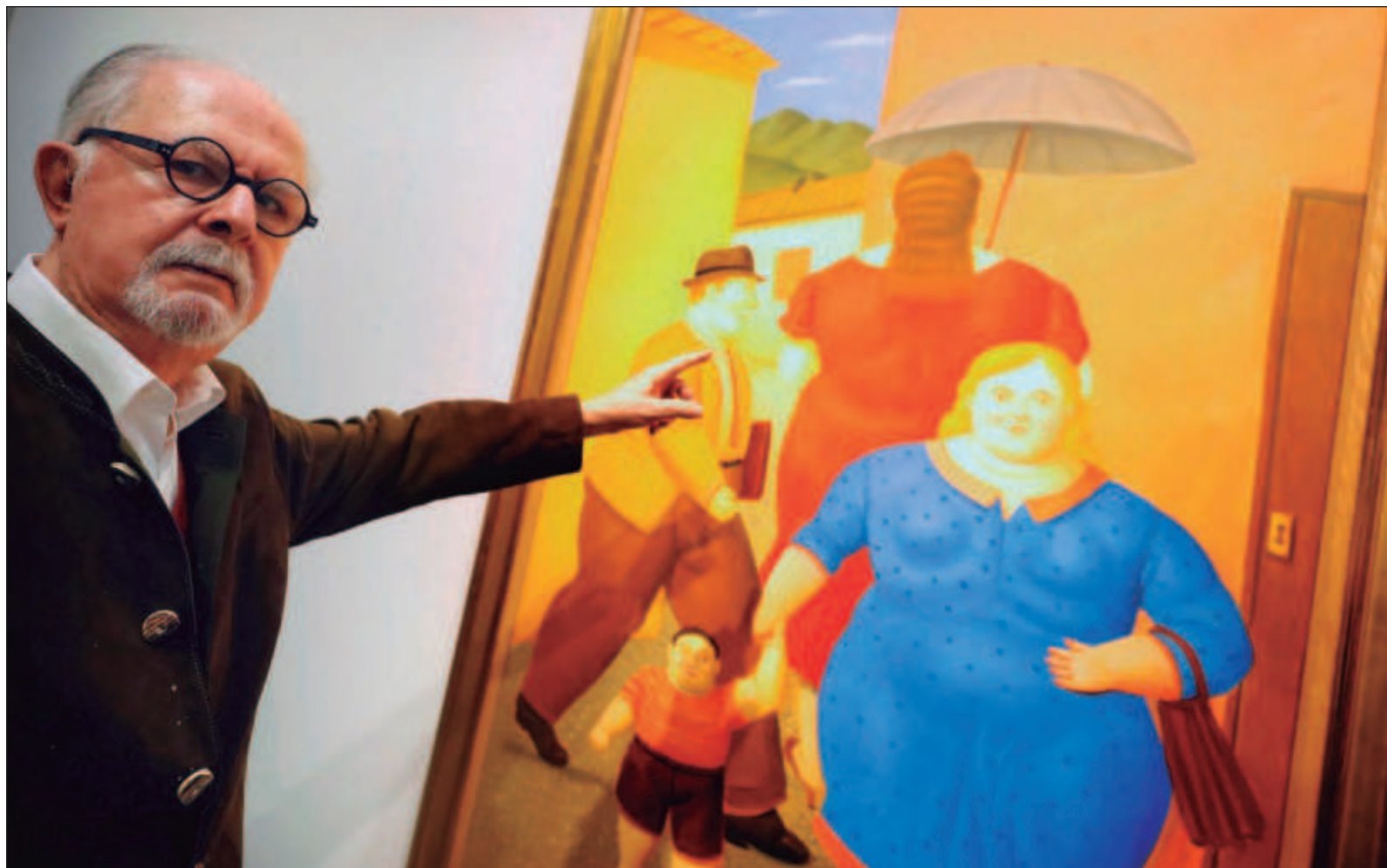
▲ "La única esperanza que tiene es que la pintura que encontró al hacer limpieza en el taller sea una pintura original, de ese que se acaba de morir, Botero".