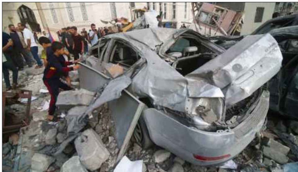
▲ De acuerdo con Josep Borrell, jefe de la diplomacia del bloque de la UE, una amplia mayoría de estos 27 países se opone a la suspensión de los pagos de ayuda a palestinos.

El comisario europeo de Vecindad y Ampliación, Olivér Varhelyi, había anunciado el lunes en la red X la suspensión inmediata de los pagos de ayuda al desarrollo a los palestinos.