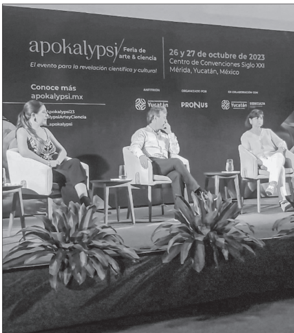
▲ El evento contará con la participación de más de 40 científicos y actores culturales, que llevarán a cabo actividades como talleres, performances y conciertos.

Apokalypsi es un evento gratuito, los interesados en registrarse pueden hacerlo en el sitio www.registropronusevents.com/apokalypsi/