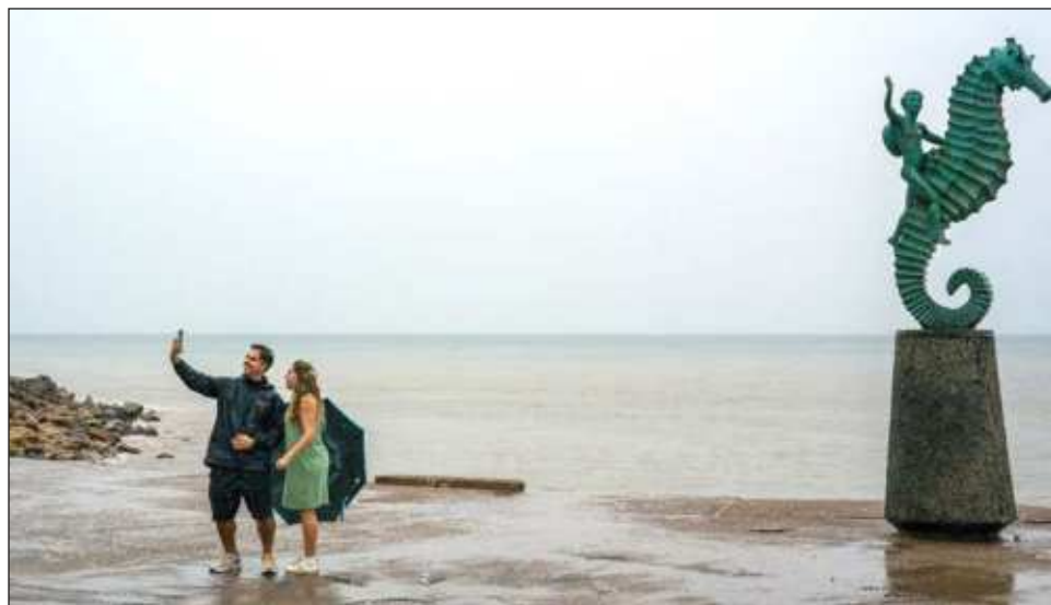
▲ En redes sociales, Andrés Manuel López Obrador pidió a la población que tome en consideración las recomendaciones oficiales, sobre todo en los límites entre los estados de Nayarit y Jalisco

Su amplia circulación mantendrá, en las próximas horas, las condiciones para lluvias extraordinarias (mayores a 250 milímetros [mm]) en Colima, Jalisco y Nayarit; torrenciales (de 150 a 250 mm) en Michoacán y el occidente de Guerrero; intensas (de 75 a 150 mm) en Durango y Sinaloa, y muy fuertes (de 50 a 75 mm) en