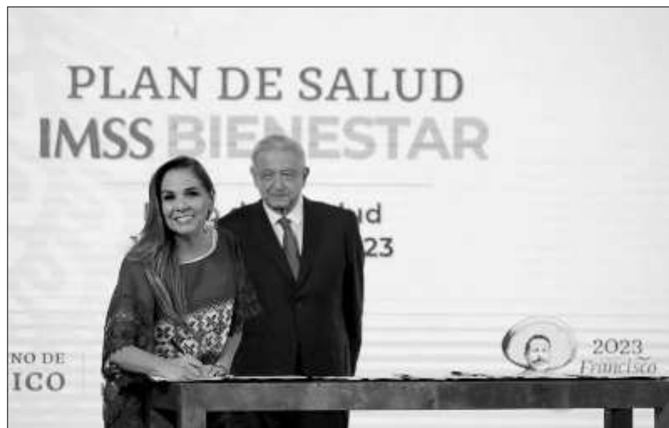
▲ Para sumarse a este Acuerdo Nacional, en Quintana Roo se han transferido al INSABI el Hospital Oncológico de Chetumal, el Comunitario de Tulum y el de Nicolás Bravo.

En el caso de Quintana Roo se ha avanzado, de modo tal que con base en el Nuevo Acuerdo por el Bienestar y Desarrollo se trabaja para que las personas que más lo necesitan tengan acceso a los servicios de salud, a través de las Unidades del Bienestar, la Caravana del