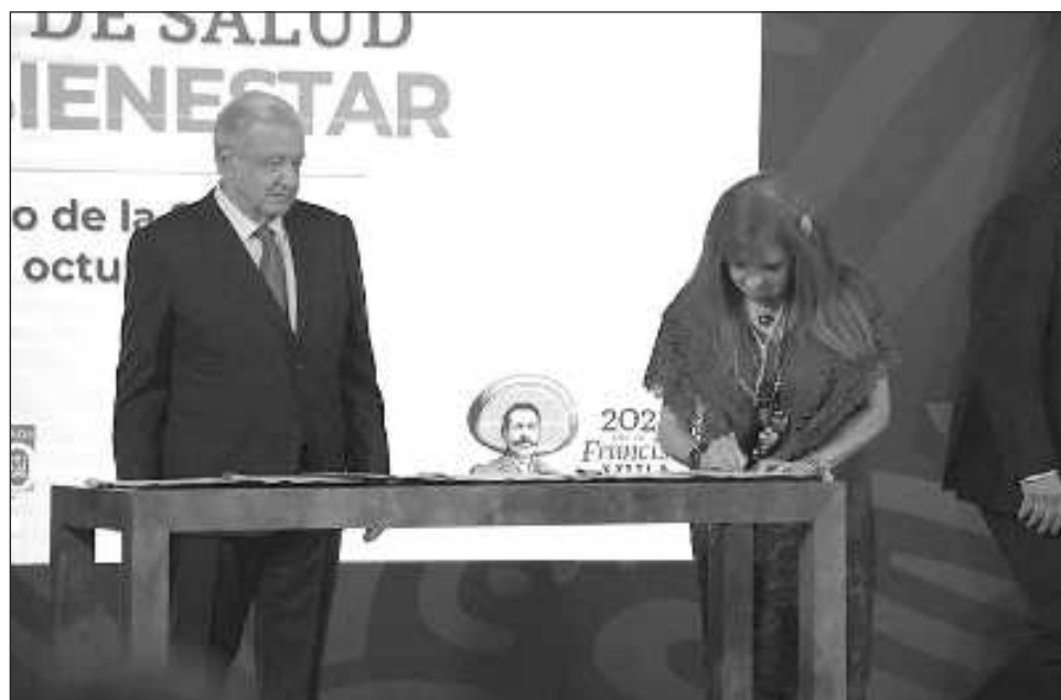
▲ “Que no se cobren las intervenciones quirúrgicas, que no se cobre por nada, porque la salud no es un privilegio, es un derecho del pueblo”, subrayó AMLO en la firma.

“Mediante una inversión pública sin precedente para mejorar todas las instalaciones de salud pública: centros de salud y hospitales; contratar médicos generales,