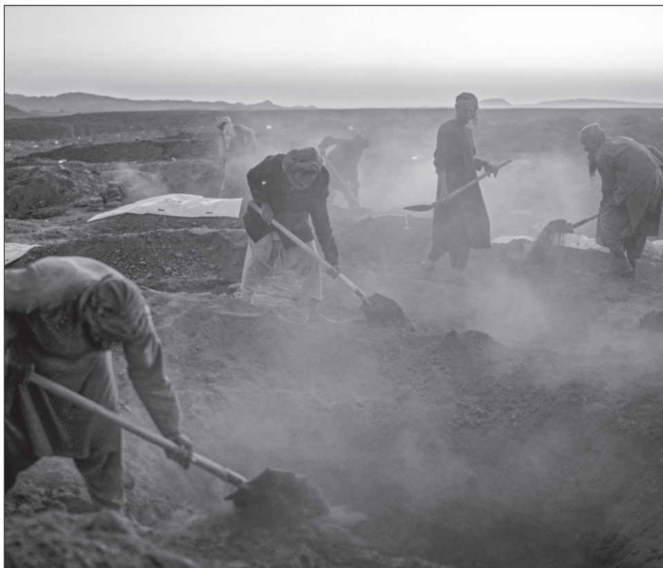
▲ Se estima que alrededor de 12 mil 110 personas, incluidas mil 730 familias, resultaron afectadas por el seísmo en cinco distritos de la provincia de Herat.

El nuevo terremoto se produce en medio de la devastación de la región, en donde al menos una veintena de aldeas ha quedado destruidas.