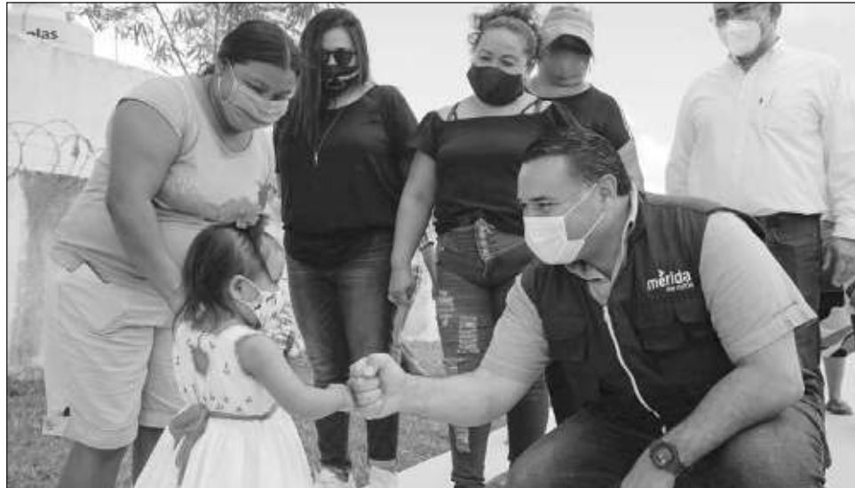
▲ La intención de la ruta Circuito Aventura es que las familias inviertan menos en su traslado y puedan convivir más tiempo, incluso visitando las tres atracciones en un día.

“Con la puesta en marcha del programa Circuito Aventura las familias podrán planear con anticipación sus actividades lúdicas en el Cente-