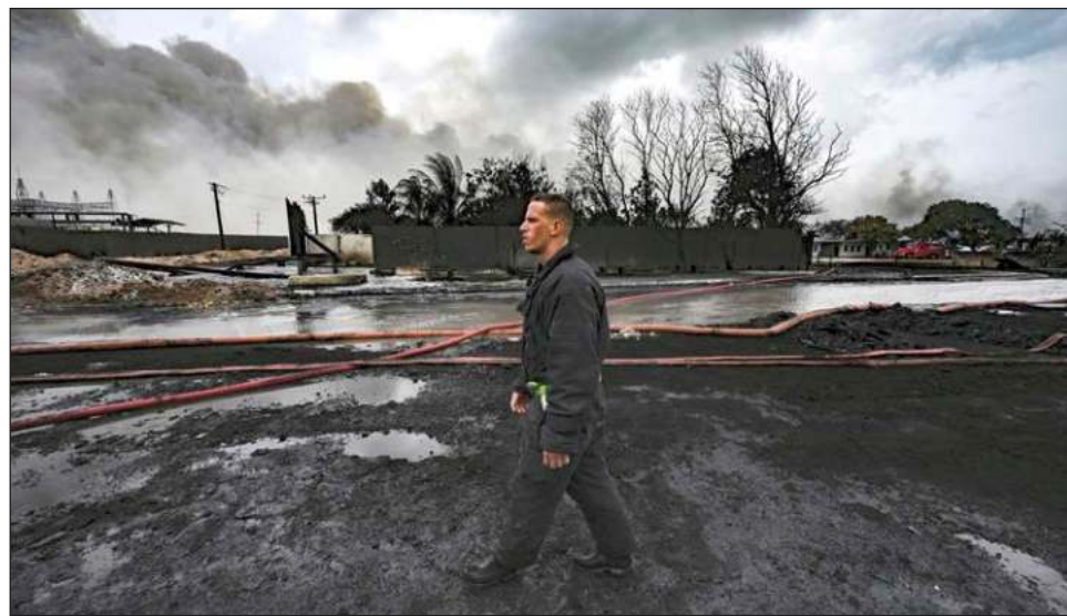
▲ El incendio arrasó cuatro tanques con capacidad para almacenar 50 millones de litros de combustible cada uno, ubicados en la base de supertanqueros de Matanzas.

Temprano, una tripulación de un helicóptero mexi-