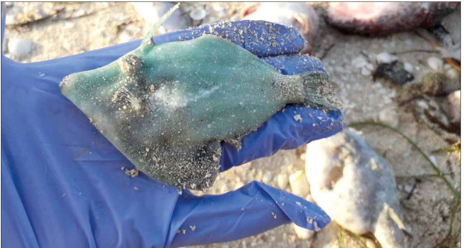
▲ “Las soluciones BIP (Baratas, Inmediatas y Populares) que la mayoría de gobernantes implementan no resuelven los problemas. Ante esta marea roja, no hay un protocolo estatal que cómo atenderla en la limpieza de playas y el destino bioseguro de esa fauna en descomposición”.