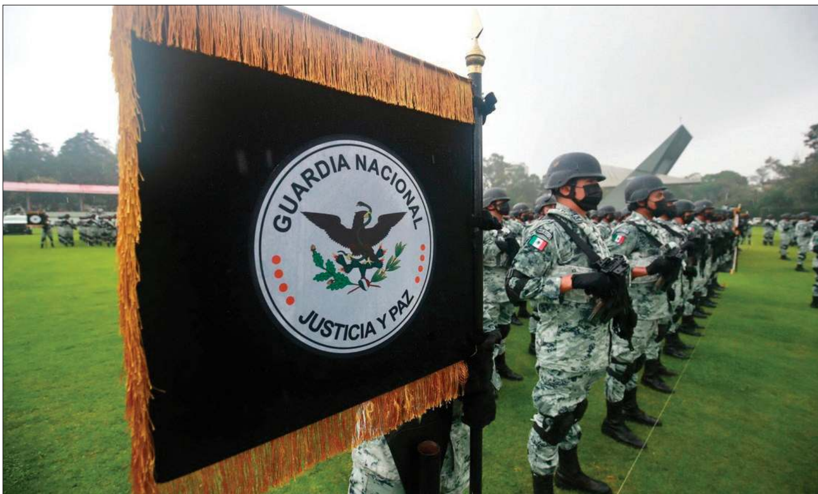
▲ "El riesgo que la Guardia Nacional se 'eche a perder' es elevado y AMLO pretende evitarlo transfiriendo la corporación a la Sedena".