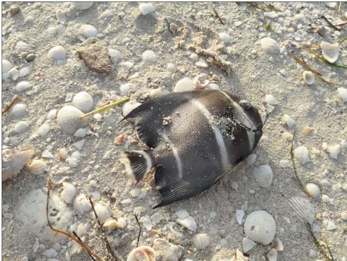
▲ "La biomasa estimada de la fauna muerta por kilómetro cuadrado es de 30 toneladas, de peces y mariscos que ya no formarán parte de la potencial captura comercial de Yucatán, con el impacto que ello implica".

En este año, la marea roja tiene un efecto impresionante en la biodiversidad marina de la flora y fauna y en su biomasa. Unas especies las vemos porque recalán a la playa y son grandes. Pero otras, las microscópicas, las larvas y crías que no las vemos. Esas también están muriendo. Lo mismo los pastos marinos, que requieren de luz solar y la marea roja causa efecto de sombra. Además de la disminución del oxígeno disuelto, se tiene una proliferación de bacterias, virus y sustancias del metabolismo de las micro algas de la marea roja