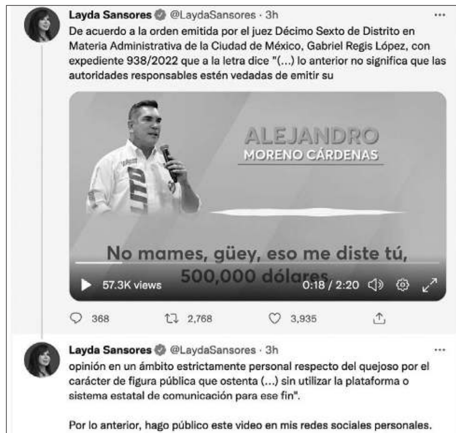
▲ En audio difundido en la cuenta personal de la gobernadora, Moreno Cárdenas habla de una reform fiscal que haría que varios empresarios se sientan apretados.

Por ello, a un día de presentar su primer informe de gobierno, Sansores San Román apuntó en su cuenta que "por lo anterior, hago público este video en mis redes sociales personales", un audio en el que el presidente del PRI nacional habla de que con una reforma