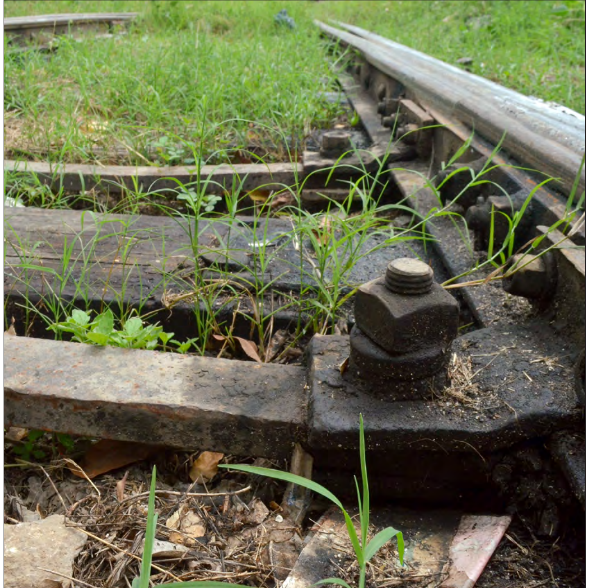
▲ Los grandes proyectos, como el Tren Maya, impulsan la economía regional, pero para que el crecimiento sea sostenido a largo plazo es imperativo el impulso a la productividad.

Hay en el caso de Tabasco una interpretación que se ha extendido y que sólo es parcialmente cierta. Ese comportamiento positivo se asocia a la construcción de la refinería de Dos Bocas. Claro que esta obra ha ayudado a la economía local, sin embargo, deben tomarse en cuenta dos factores