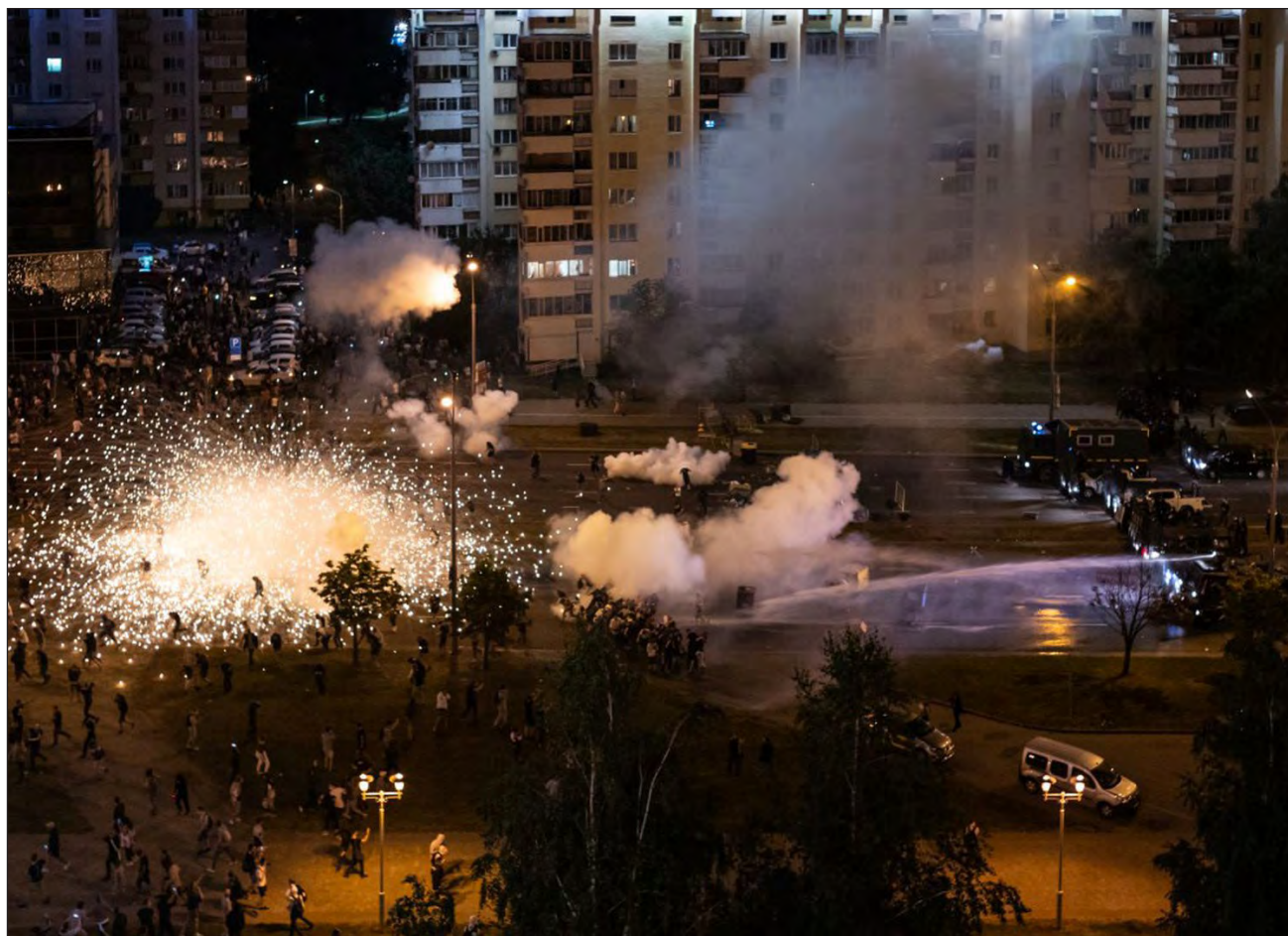
▲ La ONG bielorrusa Viasna afirma que las protestas de los últimos dos días han dejado al menos una persona muerta y más de 200 detenidos por las fuerzas de seguridad estatales.

Después del anuncio oficial, Tijanovskaya señaló que "los datos que nosotros tenemos no coinciden con los anunciados", y afirmó que ella se considera la ganadora de las elecciones presidenciales.