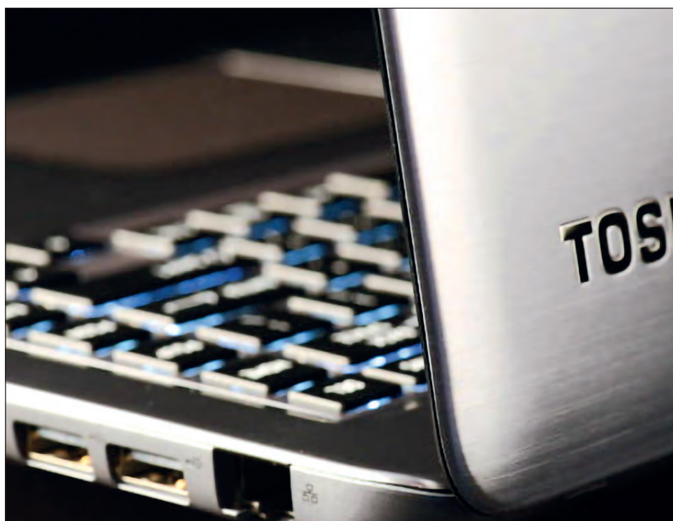
▲ La primera computadora personal de Toshiba fue vendida por 2 mil dólares en 1985.

El primer computador personal de Toshiba, el T1100, fue lanzado en 1985. Contaba con 256 kb de memoria y se vendía a 2 mil dólares. Durante la década de los 90 y principios de los años 2000, Toshiba fue uno de los principales fabricantes de laptops del mundo.