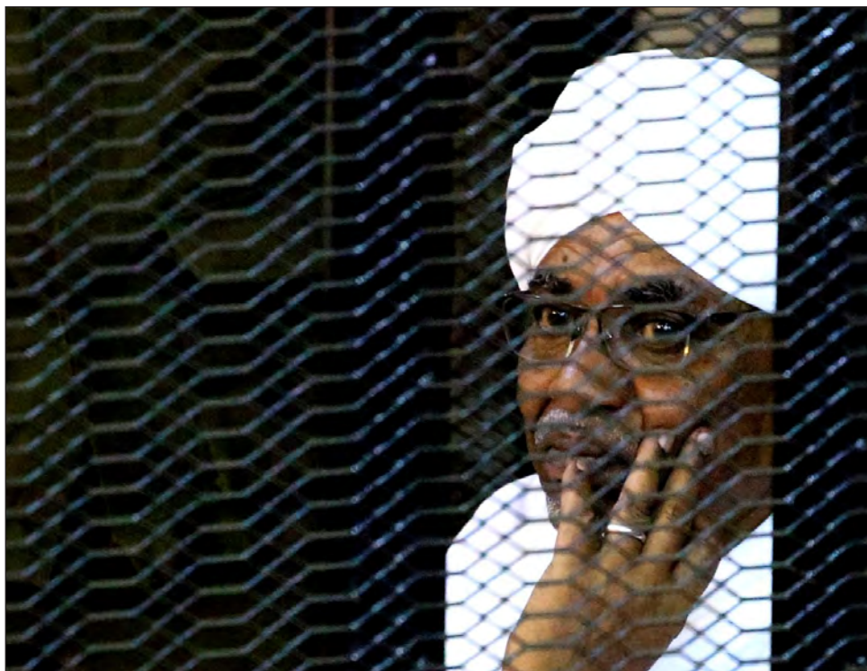
▲ Sobre Al Bashir, quien gobernó Sudán por casi 30 años, pesan dos órdenes de arresto del Tribunal Penal Internacional por crímenes contra la Humanidad.

Sobre Al Bashir, dirigente de Sudán por cerca de 30 años, pesan dos órdenes de arresto del Tribunal Penal Internacional por genocidio, crímenes contra la Humanidad y crímenes de guerra por los presuntos abusos cometidos bajo su mando en la región de Darfur.