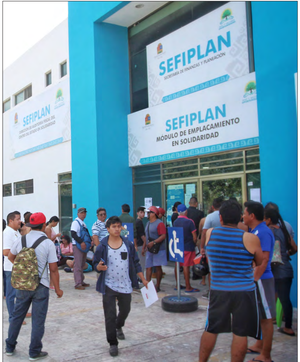
▲ Las pesquisas se realizan en las áreas de tránsito de los 11 municipios del estado, así como en la Sefiplan.

"Se realizarán detenciones en flagrancia y se actuará en consecuencia, como lo establece la ley", concluye el comunicado.