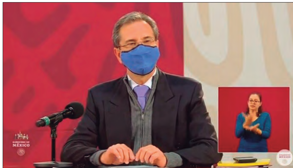
▲ El titular de la SEP, Esteban Moctezuma señaló que la currícula comprenderá las materias de Vida Saludable y Formación Cívica y Ética.

En la conferencia vespertina en Palacio Nacional, donde se dieron más detalles