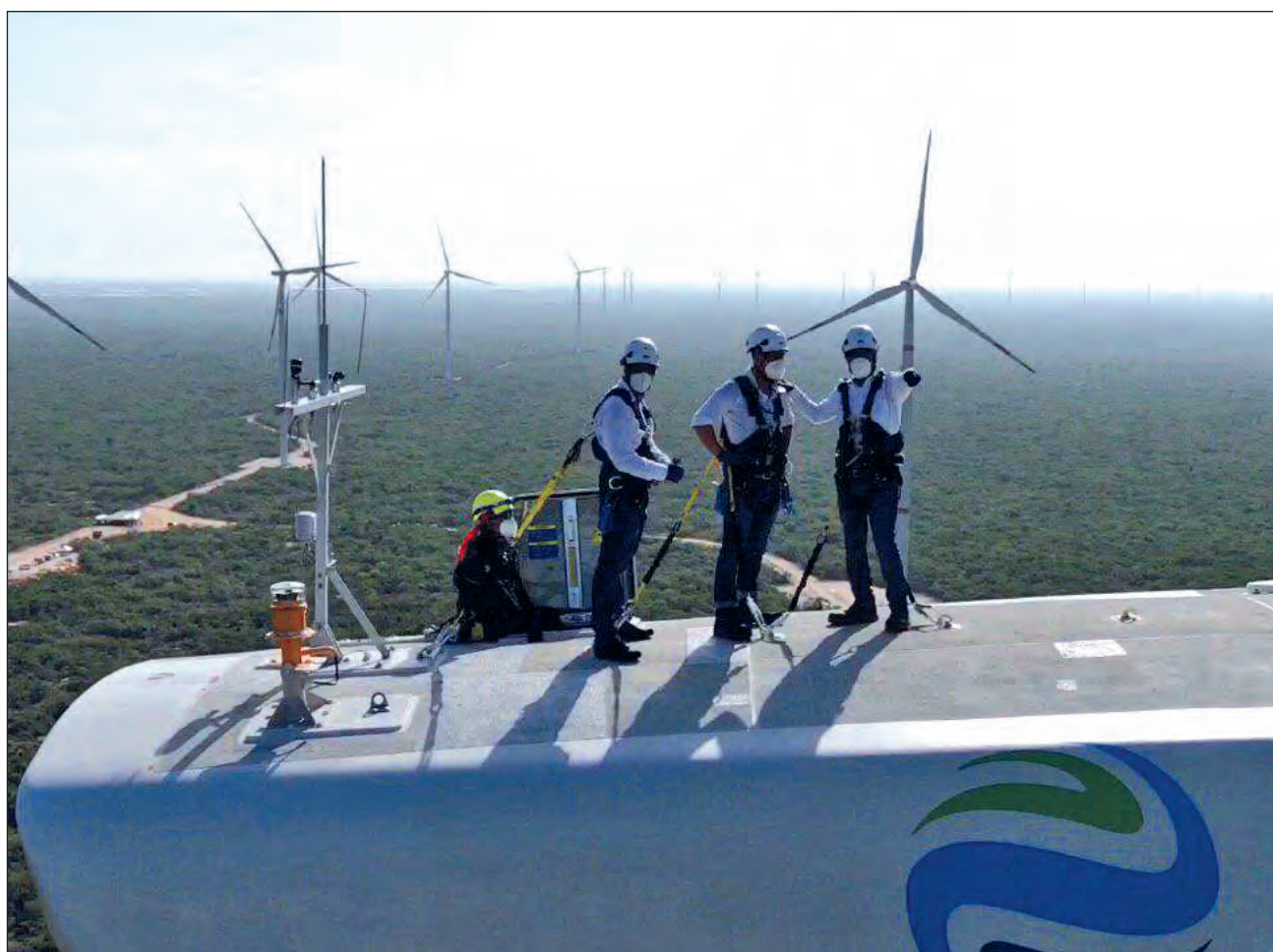
▲ El Parque Eólico de Progreso es una de las 24 iniciativas de este tipo que están planteadas para desarrollarse durante la presente administración.

Mientras la demanda eléctrica a nivel nacional crece al 3%, la del sistema peninsular lo hace al 10% anual