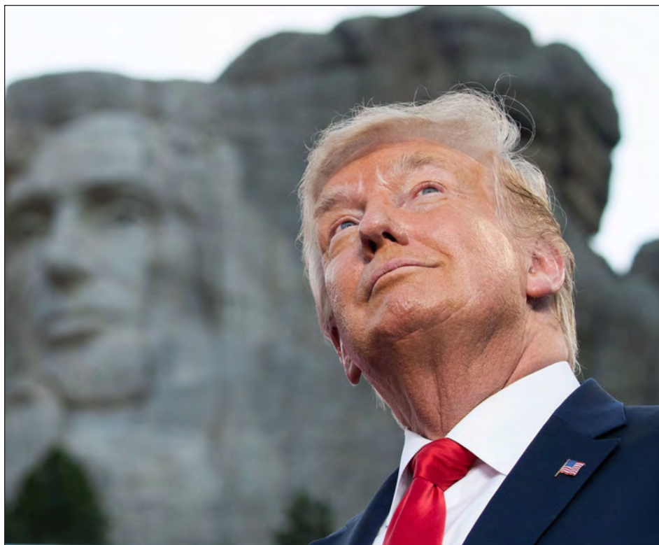
▲ El presidente de Estados Unidos, Donald Trump, afirmó este domingo que le parece buena idea se añada su cara a los rostros esculpidos de cuatro mandatarios del país en el monte Rushmore (Dakota del Sur).

"Nunca lo he sugerido, aunque en base a todas las cosas conseguidas durante mis primeros tres años y medio, a lo mejor más que ningún presidente ¡Suena una buena idea para mí!", tuiteó el mandatario.