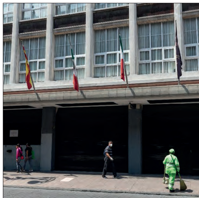
▲ En gran parte del mundo los hoteles permanecen cerrados debido a la pandemia de COVID-19.

Los ingresos totales por esta actividad llevan mayor avance. En abril se reportaron divisas por un monto de 71 millones 800 mil dólares, en mayo crecieron a 33.29 por ciento y en junio a 83.07 por ciento.