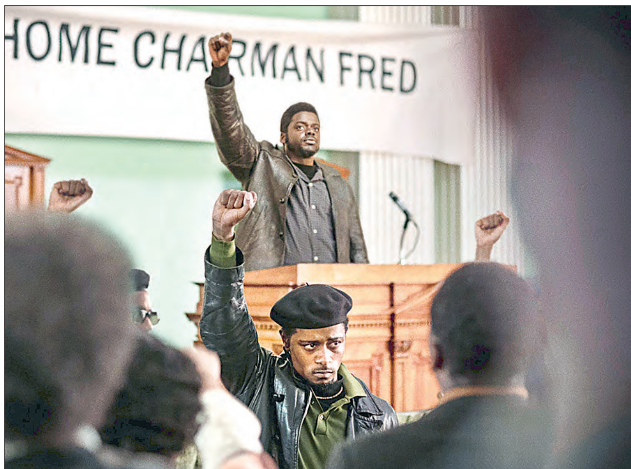
▲ El filme retrata dos luchas: por un lado, las causas de Hampton, y por el otro, la culpa de O'Neal quien padece la presión de la policía.

Medio siglo después de su muerte, las ideas de Hampton aún resuenan. Seguimos luchando contra la misma bestia, los mismos monstruos, los mismos sistemas, aseguró Shaka King, cineasta que dirigió Judas and the Black Messiah (Judas y el mesías negro), cinta basada en la vida del líder político.