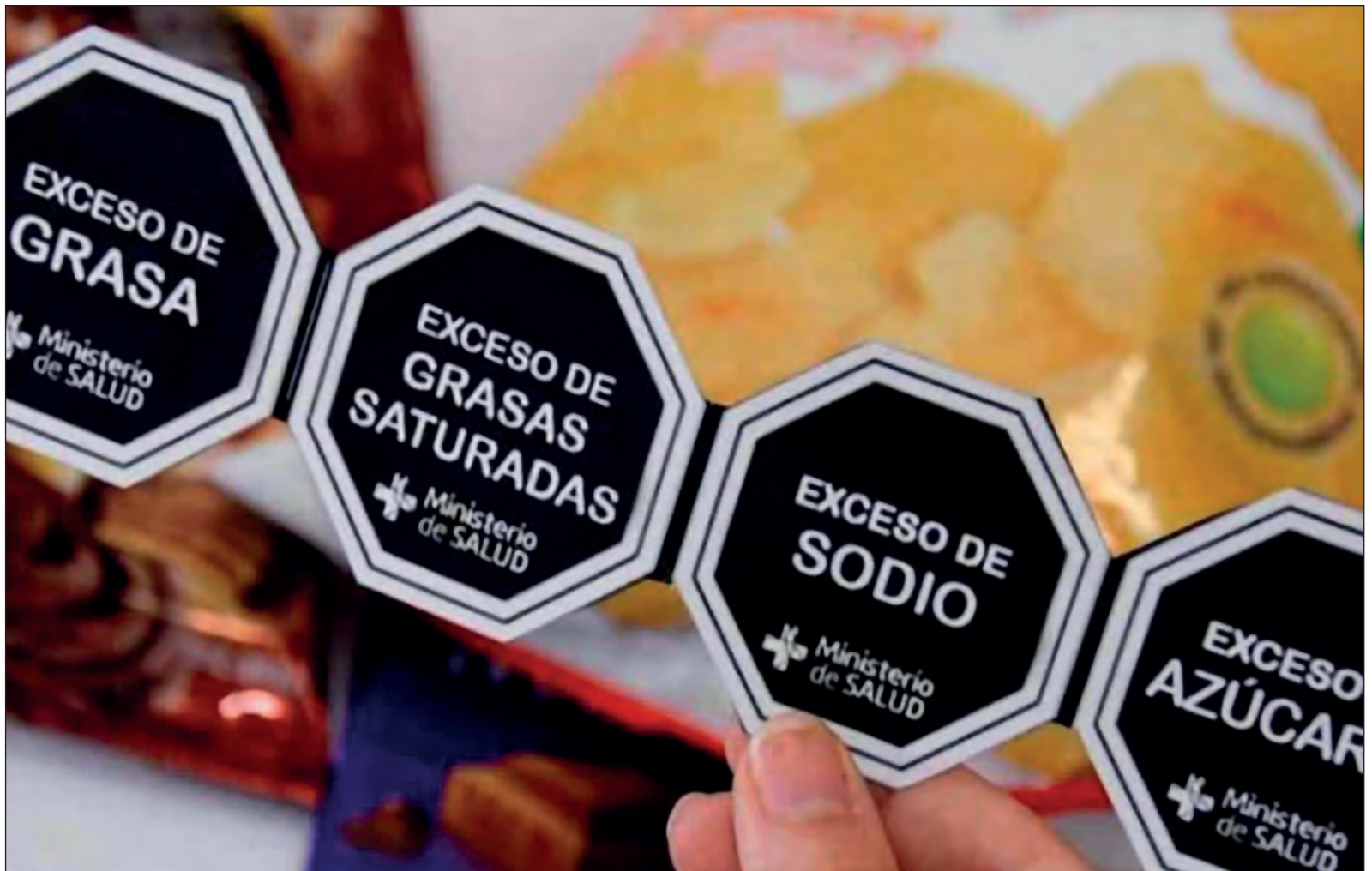
▲ Con el nuevo etiquetado en productos procesados las autoridades de salud esperan reducir padecimientos como la diabetes, la obesidad o problemas cardiovasculares.