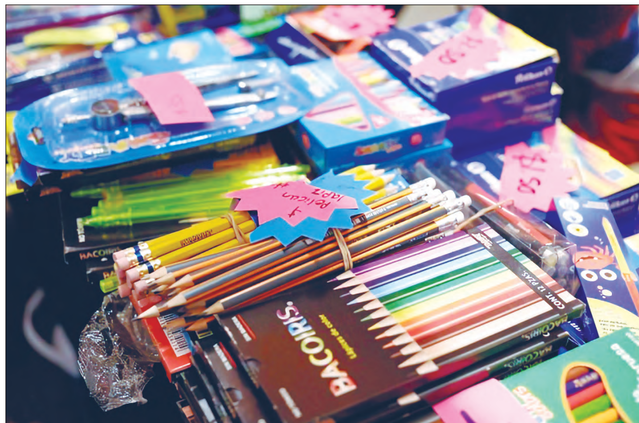
▲ Las papelerías no fueron consideradas como negocios esenciales y la venta de marzo a julio cayó un 70 por ciento; aunque este porcentaje corresponde al 20 por ciento de las ventas que se realizan fuera de la temporada escolar.

En 2019 se obtuvo una derrama general, no úni-