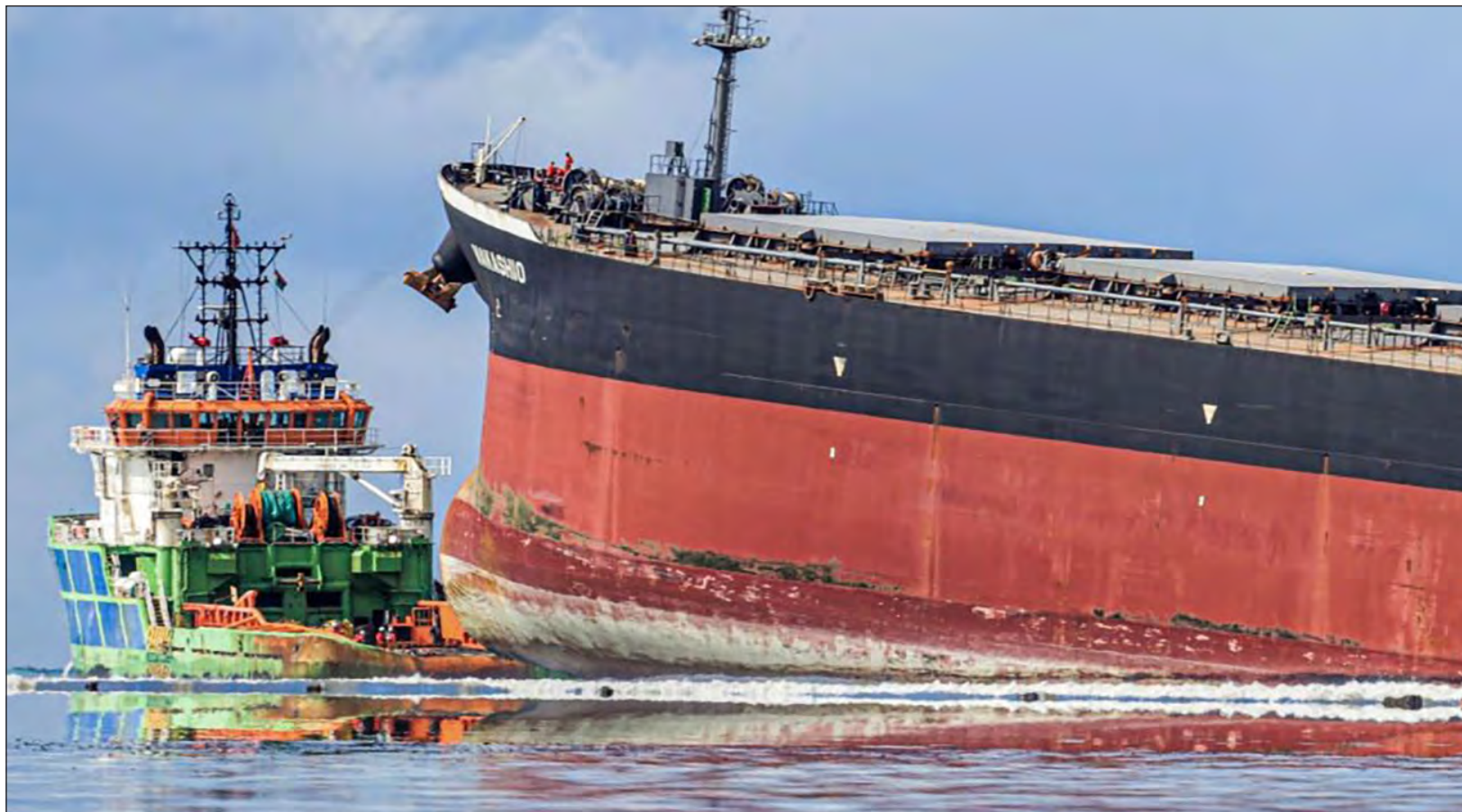
▲ Francia anunció que enviará equipos de especialistas y material para ayudar a la isla Mauricio para hacer frente al derrame y evitar así daños mayores al entorno natural.

La erupción del lunes no produjo de momento ningún herido ni muerto, pero las autoridades indonesias emitieron una advertencia ante la intensa actividad en el volcán.