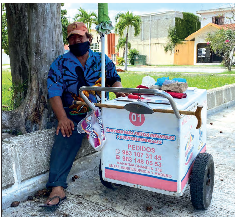
▲ Para don Víctor, quedarse en su casa no es una opción: tiene que recibir ingresos de algún modo, y pasar tiempo a solas le hará sentir peor.

Confiesa que quedarse en su casa no es una opción, primero porque debe tener ingresos y luego porque se va “a sentir peor de pasar tiempo solo, sin luz, sin ventilador y sin una radio”.