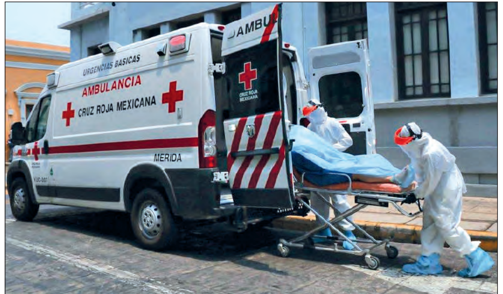
▲ Cualquier llamada de auxilio, sea o no por coronavirus, activa el protocolo de protección de los socorristas.

Al inicio, reconoció el socorrista, había un ambiente de incertidumbre y temor entre el personal sobre cómo manejar la pandemia, pero con la capacitación y al paso de los días todo cambió, además de saber que su labor es fundamental para el bienestar y salud de las personas.