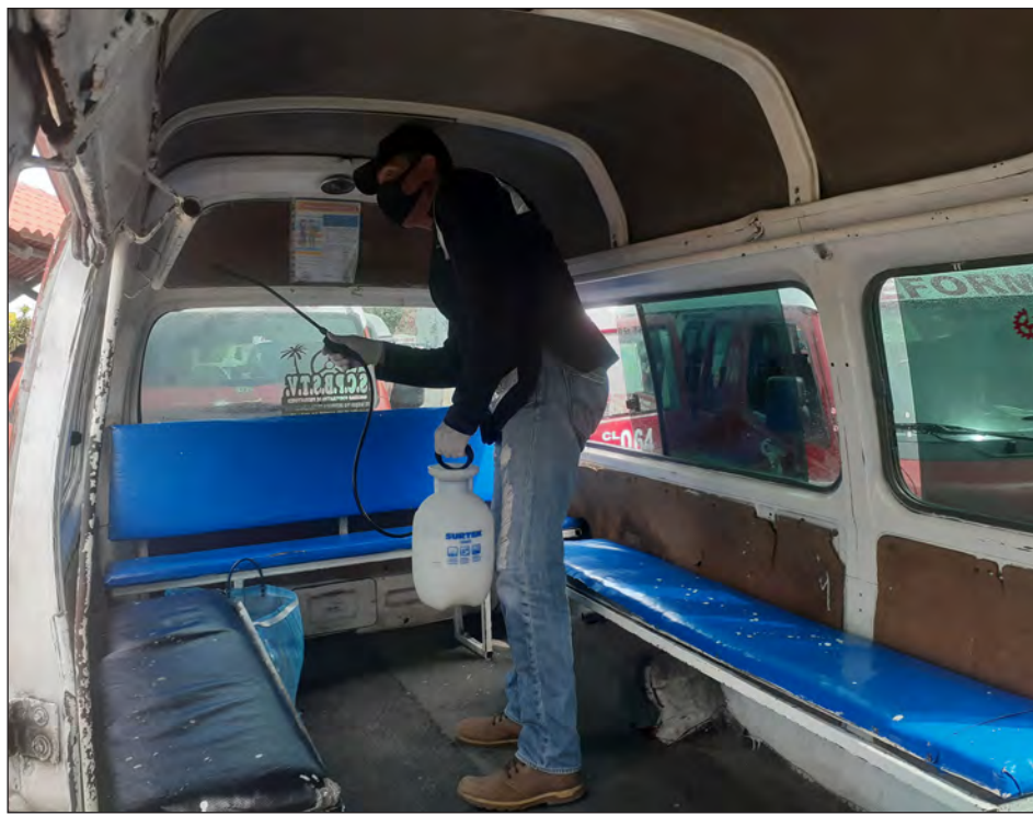
▲ Diariamente se desinfectan los vehículos del transporte público, tanto autobuses como combis.