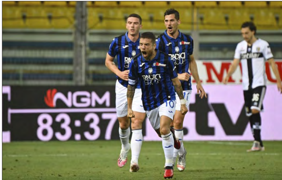
▲ Atalanta no sólo juega para conquistar la Liga de Campeones, sino para devolverle la alegría a una de las regiones más golpeadas por el coronavirus.