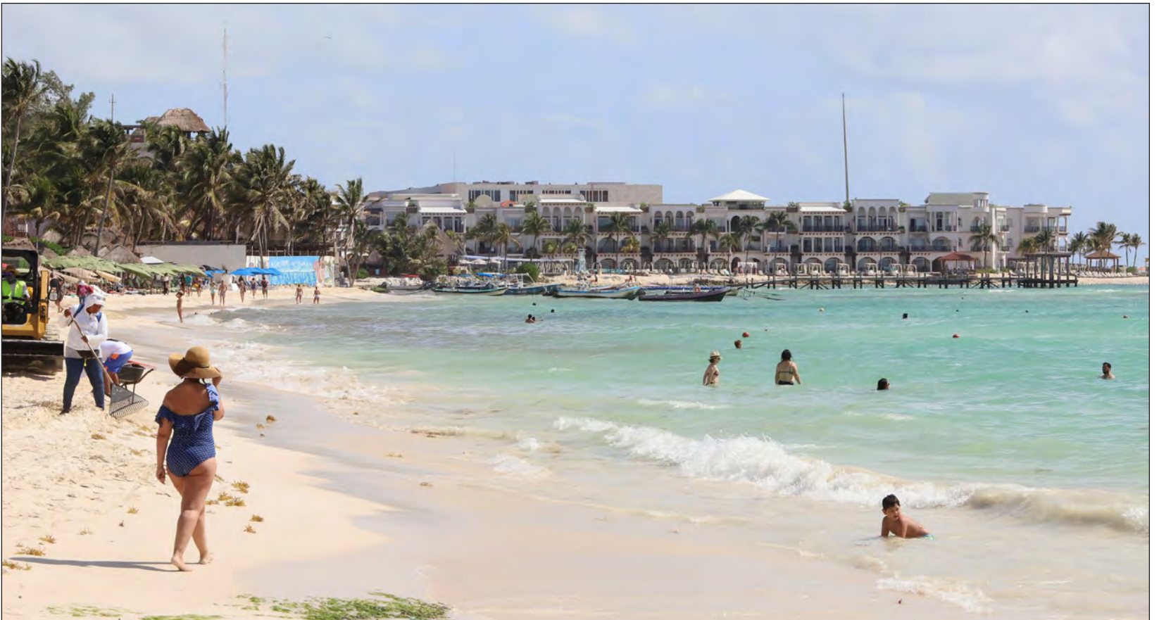
▲ Alrededor del 50% de los visitantes que ha recibido la Riviera Maya son nacionales.

HAN REABIERTO 62 DE LOS 135 CENTROS DE HOSPEDAJE QUE CONFORMAN LA AHRM