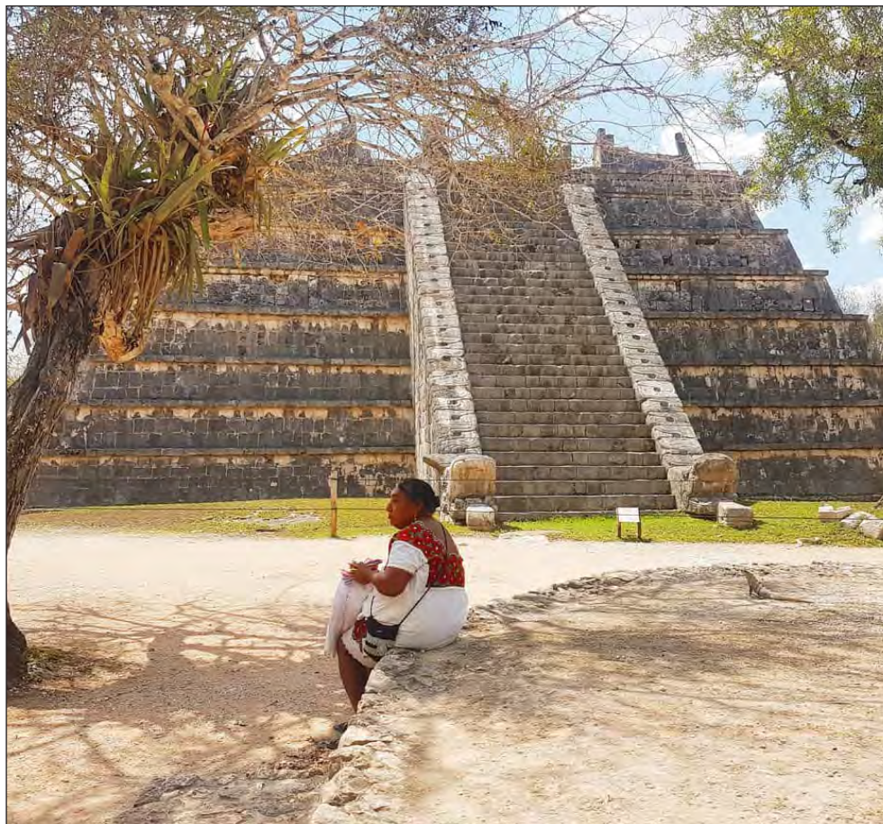
▲ El ORGA atenderá los ámbitos de seguridad alimentaria y pueblo maya, además de economía, empleo, violencia de género y restricciones a la movilidad.