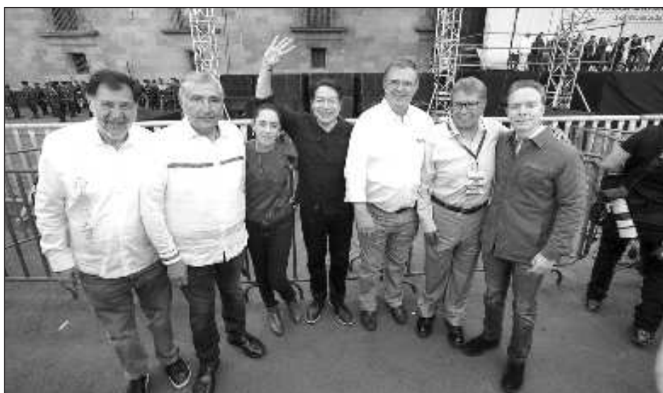
▲ El presidente López Obrador subrayó que “la verdad que todos los que están participando son gente con mucha experiencia en la administración pública, buena política, son honestos”.