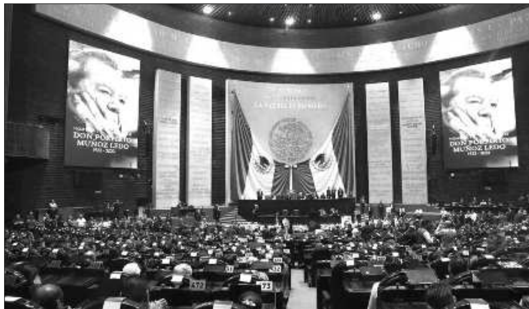
▲ Este lunes se celebró un homenaje luctuoso por Muñoz Ledo en San Lázaro. El domingo, su familia y amigos más cercanos lo despidieron en el Panteón Francés de la Ciudad de México.

Este lunes se celebró un homenaje luctuoso por Muñoz Ledo en San Lázaro. El domingo, su familia y amigos más cercanos lo despidieron en el Panteón Francés de la Ciudad de México. Se fue un hombre de Estado, que es tal vez su esencia; con todos los demás siempre hubo la posibilidad de un rompimiento, pero siempre, también, la del entendimiento mutuo.