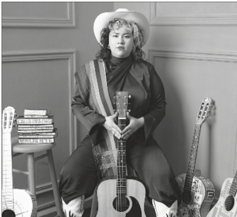
▲ El nuevo sencillo es una composición llena de melancolía y transparencia, sostiene Vivir Quintana, quien es autora del himno feminista Canción sin miedo .

Este tema “lo hice pensando en la música, pero como persona, por eso parece de amor, algo como de