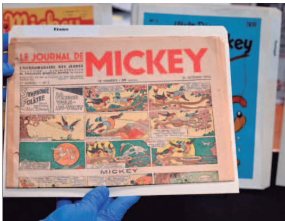
▲ “¡No puedes crear con IA personajes como los que yo hago, por ejemplo la cabeza del genio que se vuelve tostador!”: Eric Goldberg, animador de Disney.

El asunto también está entre las demandas que negocian los actores de Ho-