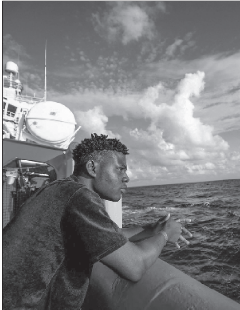
▲ “Some EU members, with right-wing anti-immigration governments espouse extreme right-wing views with respect to cultural and religious purity”.

THE RIOTS IN France were caused by two triggers: the first when police killed a 17-year-old Muslim boy likely due to racial profiling. The second is frustration amongst Muslim immigrant communities at what they perceive as a system that beha-