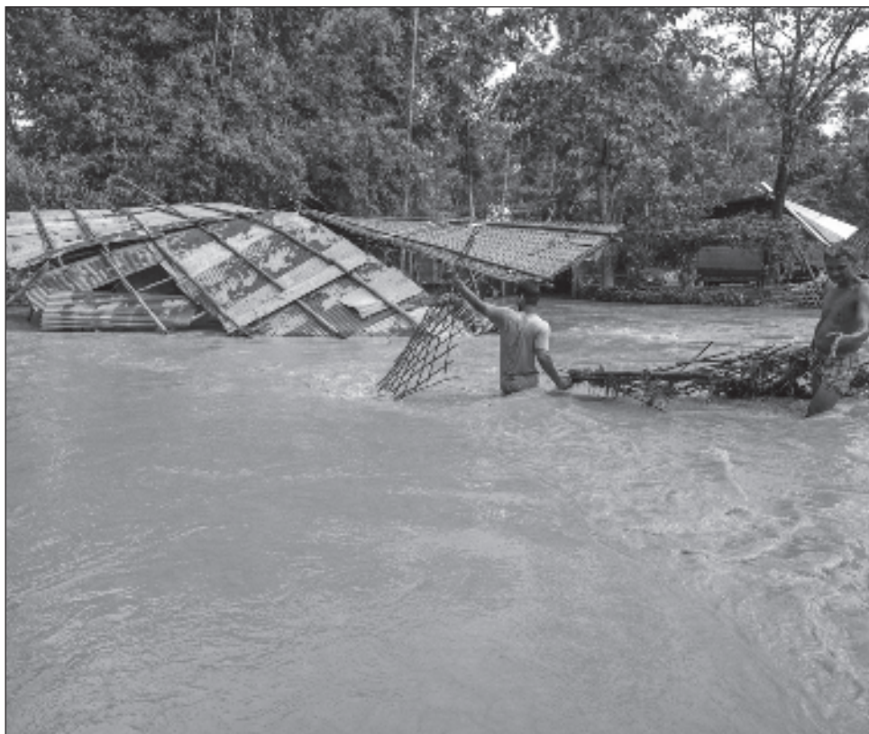
▲ El monzón, fenómeno meteorológico que se extiende de junio a septiembre, representa entre 70 y 80 por ciento de las precipitaciones anuales en el sureste asiático.

Según datos oficiales, la cantidad de lluvia del monzón en India es 2 por ciento mayor a la media. El monzón, que se extiende de junio a septiembre, representa entre 70 y 80 por ciento de las precipitaciones anuales en el sureste asiático. En los últimos años, los corrimientos de tierras y las inundaciones aumentaron por ello.