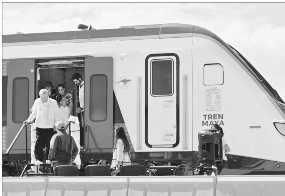
▲ La gobernadora de Campeche, Layda Sansores San Román, comentó que en septiembre realizarán las pruebas dinámicas de uno de los trenes que serán usados para el megaproyecto federal.

Agradeció al jefe del ejecutivo nacional por su visión de desarrollo para el