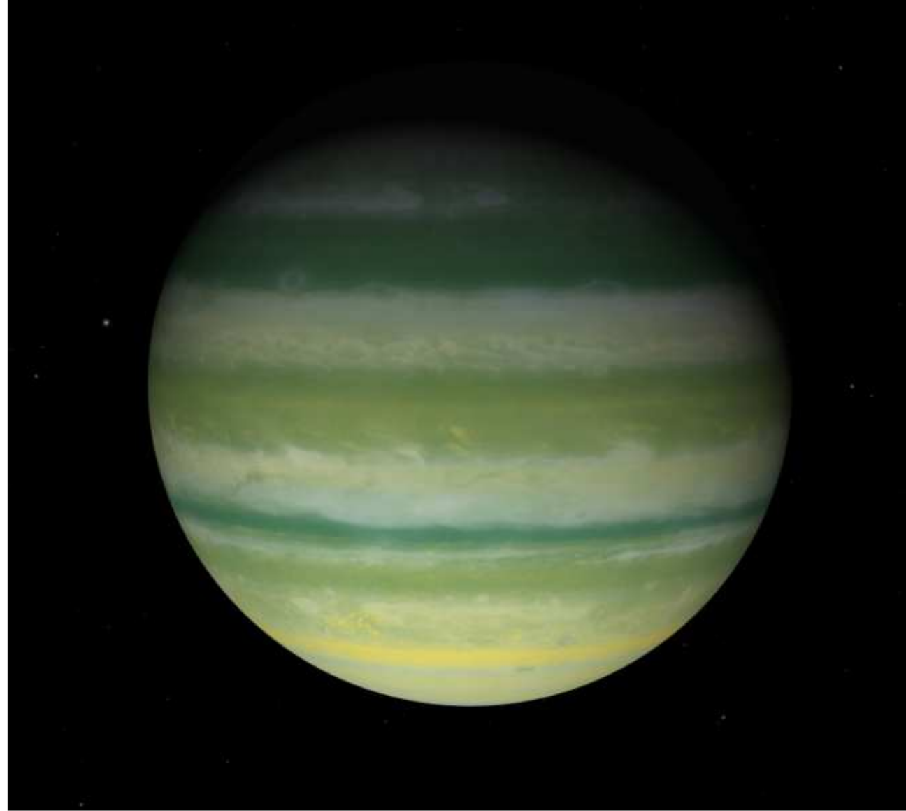
▲ K'aaba'obe' ku chíimpoltik u jets'óolal kaaj yéetel bix u paktik ka'an.

Ichil ba'ax jts'a'ab k'ajóoltbil tumen IAU, u k'aaba' le t'aano'ob ku yu'ubal tu kaajil Chiapase', yaan ba'al u yil yéetel u yutsil yantal ba'al, ich jets' óolal yéetel ki'iki' óol, beyxan yéetel bix u na'atal kuxtal tumen le miatsilo'.