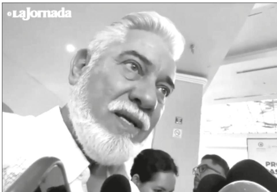
▲ Los periodistas locales señalaron que el mecanismo de protección nunca ha funcionado en Nayarit, y refirieron que hubo una persona que se capacitó, se le designó al frente del mecanismo, pero fue orillado a renunciar.