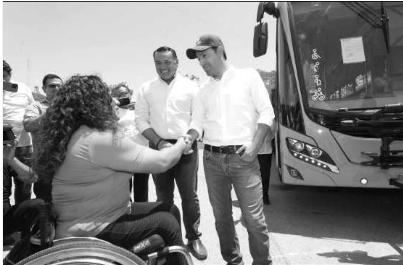
▲ El gobernador Mauricio Vila Dosal y el presidente municipal de Mérida, Renán Barrera Concha, inauguraron en el Parque Centenario de Ejército Mexicano la nueva ruta para el sistema de transporte Va y Ven .

"El Circuito Poniente, Plazas y Universidades tendrá un horario de lunes a domingo de 5 de la mañana a 11 de la noche con frecuencias de 6 minutos en promedio y 121 paradas definidas en una longitud de más de 52 kilómetros. Se trata del circuito más largo en el área metropoli-