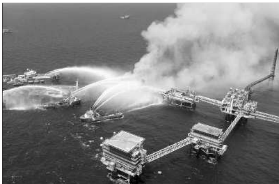
▲ Encarnación Cajún hizo un exhorto a las autoridades de Petróleos Mexicanos para que pongan especial atención en la urgente necesidad de implementar acciones de mantenimiento preventivo, para de esta manera, reducir las probabilidades de incidentes fatales.

"Nosotros hemos alertado en diferentes ocasiones y en los foros a los que acudimos, que es necesario