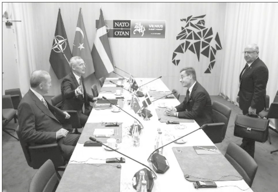
▲ La cumbre de la OTAN tendrá como asunto central la relación de la alianza militar transatlántica con Ucrania, que desde febrero de 2022 enfrenta una invasión por parte de tropas rusas.

Erdogan mantuvo este lunes una reunión con Stoltenberg y el primer ministro de Suecia, Ulf Kristersson, pero ante la nueva exigencia se organizó un encuentro del dirigente turco con el titular del Consejo Europeo, Charles Michel.