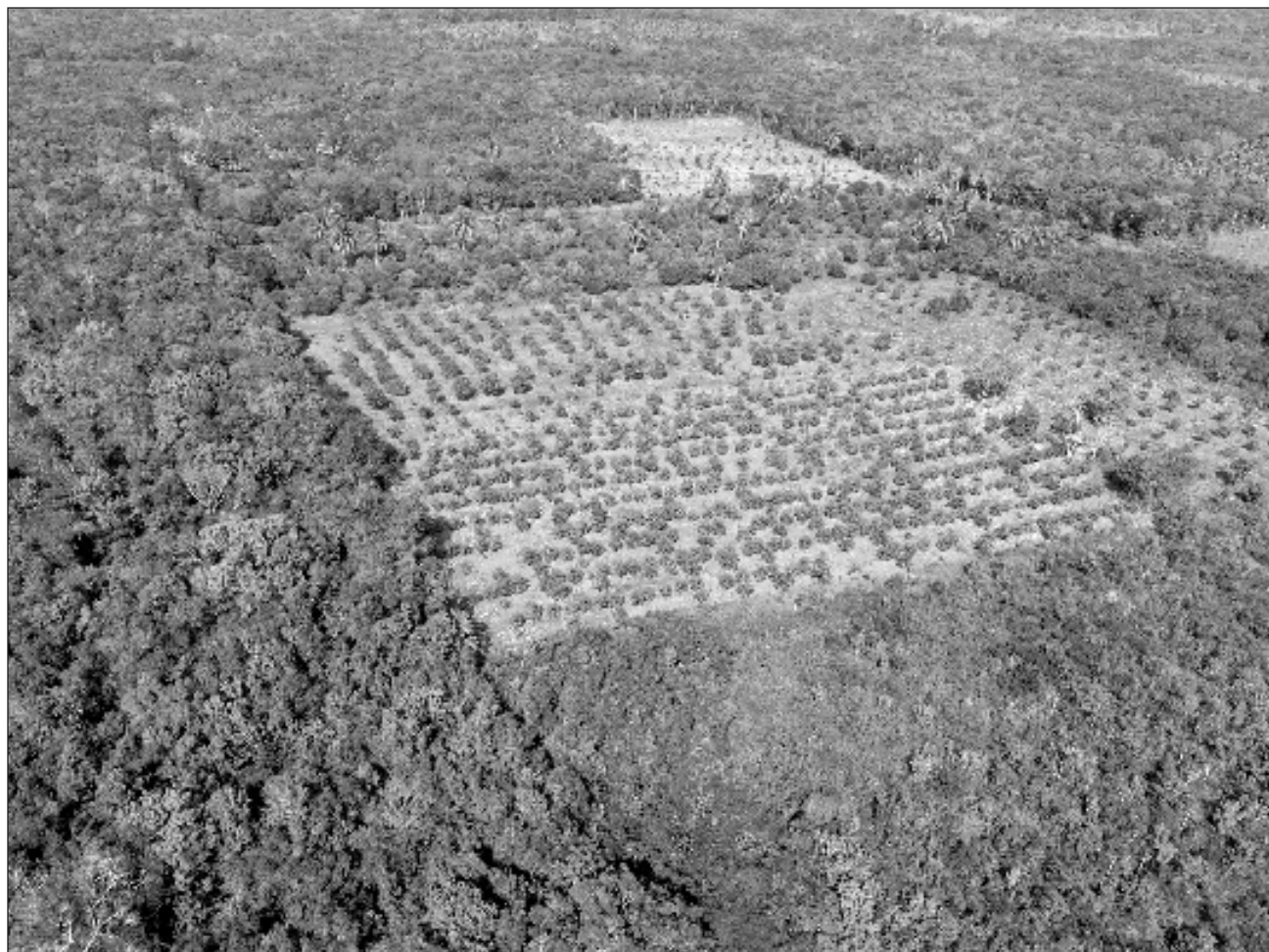
▲ Las hectáreas corresponden a los ejidos de El Cafetal, Pedro Antonio Santos y Chunyaxché y Anexos.

Con base a la información publicada en el DOF, en los tres casos se asegura que ya