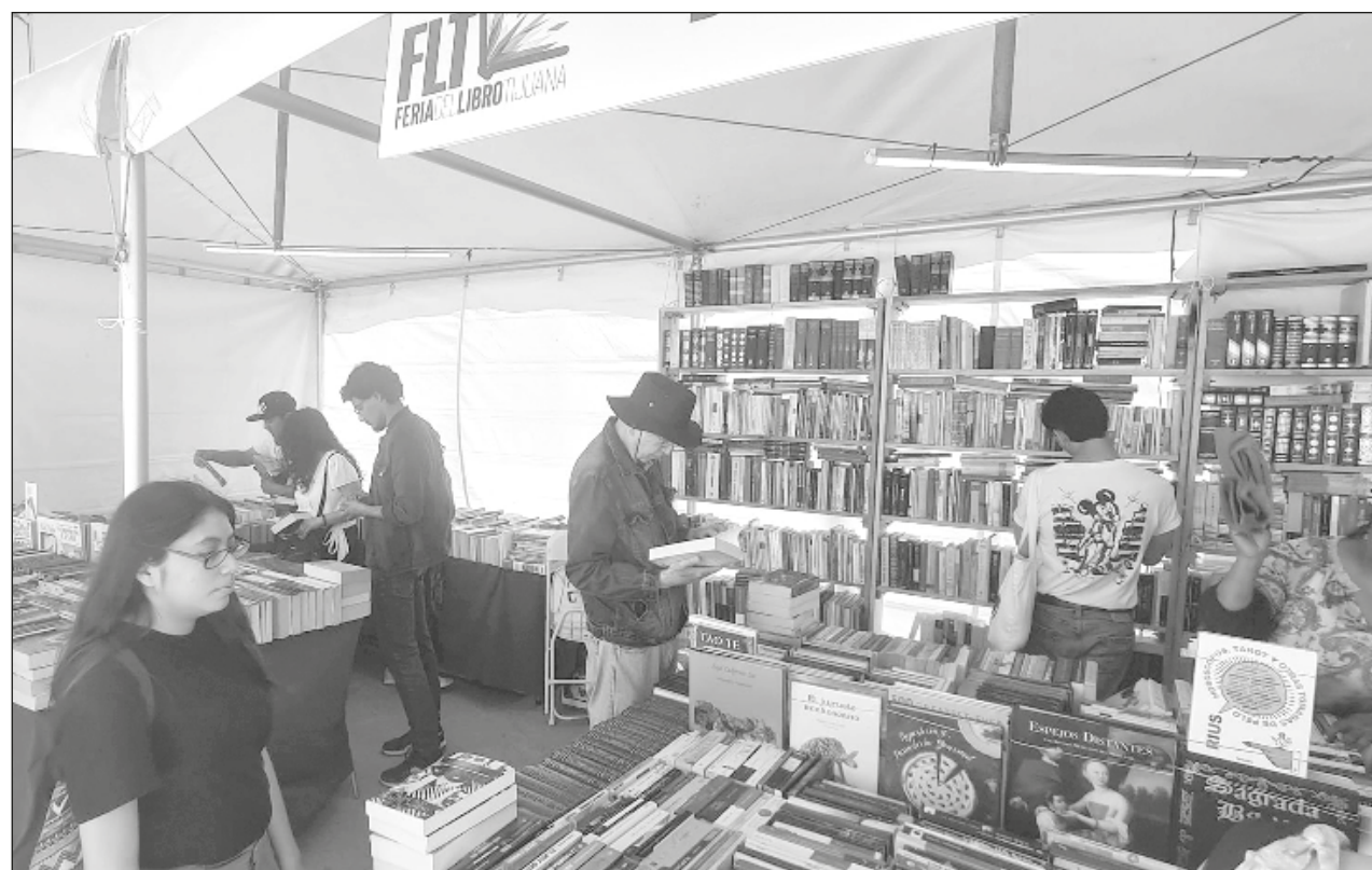
▲ El encuentro librero regresó este fin de semana luego de tres años de incertidumbre, con un programa que combina libros y autores de gustos diversos, desde los best sellers de Bucay hasta autores locales de novela y poesía.