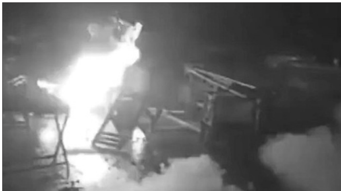
▲ Versiones policíacas indicaron que al interior de un par de locales y dos bodega había gente durmiendo y quedaron atrapadas en el incendio; rescataron con vida a dos personas que fueron trasladadas al hospital Adolfo López Mateos.

El incendio inició alrededor de las 2:30 de la madrugada y al sitio acudieron bomberos de Toluca y elementos de la policía estatal y municipal, quienes pudieron rescatar con vida a dos personas que fueron trasladadas al hospital Adolfo López Mateos para recibir atención médica, no obstante se les reporta como graves ya que tienen quemaduras de se-