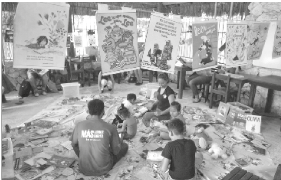
▲ El ayuntamiento, la Cruz Roja y otras instituciones realizarán actividades artísticas y deportivas para la temporada vacacional.

El gobierno municipal ofrecerá del 24 de julio al 18 de agosto un curso de verano de Prevención del Delito , totalmente gratuito para niños de 8 a 13 años, con cupo para 35 niñas y niños, quienes podrán jugar, realizar actividades depor-