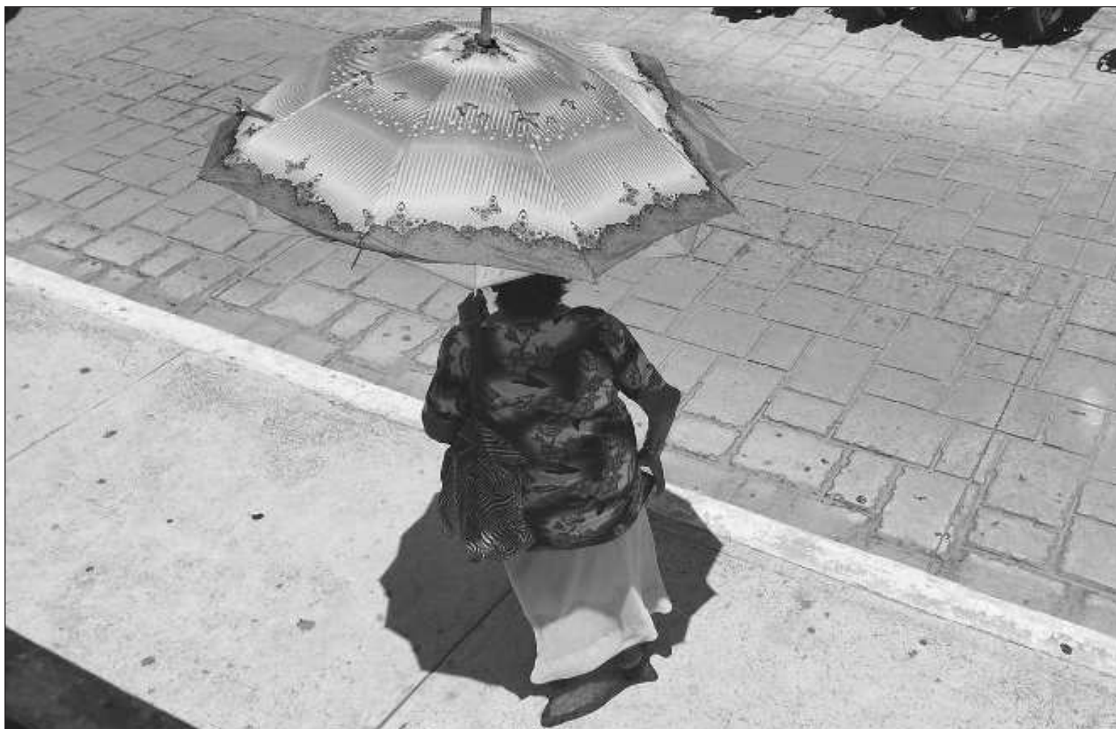
▲ "Hoy nos enfrentamos a una carrera contra el tiempo, estamos muy cerca de rebasar el máximo incremento promedio mundial establecido".