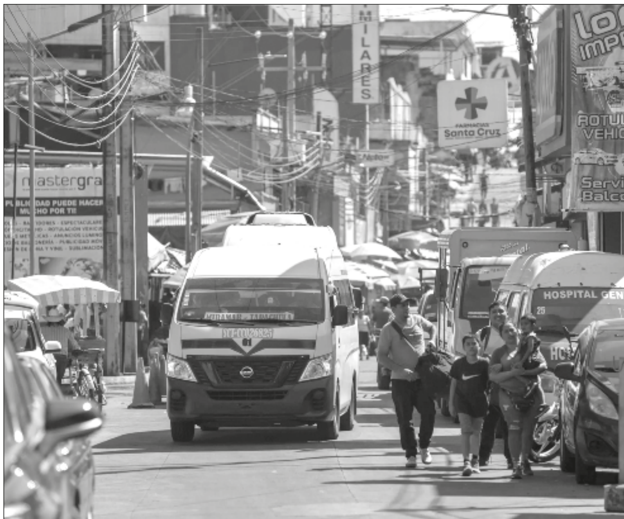
▲ El Presidente aceptó que existe desplazamiento en algunas regiones del estado, pero insistió que la violencia en Chiapas no es generalizada, “los medios lo magnifican y se genera toda una percepción de que hay muchísima inseguridad”.

Por lo anterior, Cofepris recomienda el uso de Barmicil y productos genéricos con betametasona, gentamicina y clotrimazol únicamente bajo estricta supervisión médica.