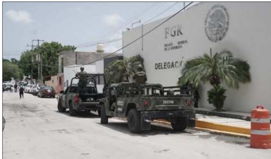
▲ La Fiscalía General del estado de Campeche, con más de 500 solicitudes de información, de acuerdo con el último informe de la COTAIPEC.

Tras lo mencionado, los entes que más solicitudes acumularon fueron el ayuntamiento de Campeche, con más de 800 solicitudes de información; así