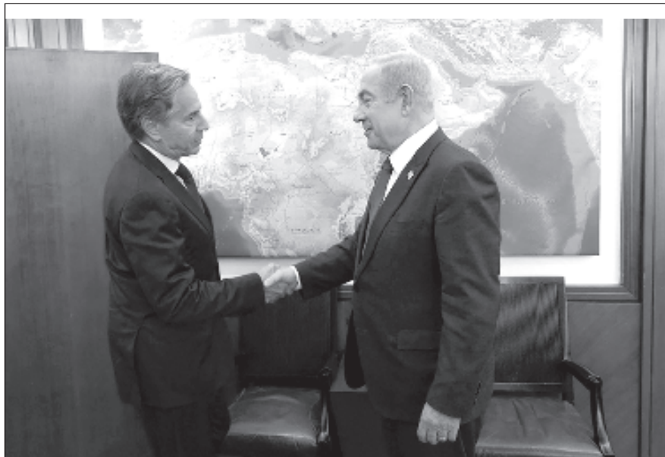
▲ La visita de Blinken se produce un día después de que el miembro del gabinete de guerra israelí Benny Gantz, un político de centro rival de Netanyahu, dimitiese del gobierno, tras haber exigido, sin éxito, la adopción de un "plan de acción" para la posguerra en Gaza.

La tercera versión del plan de Biden, consultada por Afp, contempla en una primera fase un alto el fuego "inmediato y completo", la liberación de los rehenes tomados por el movimiento islamista palestino Hamas, que serían intercambiados por prisioneros palestinos en Israel; la retirada del ejército israelí de las zonas más pobladas de Gaza y el ingreso de ayuda humanitaria.