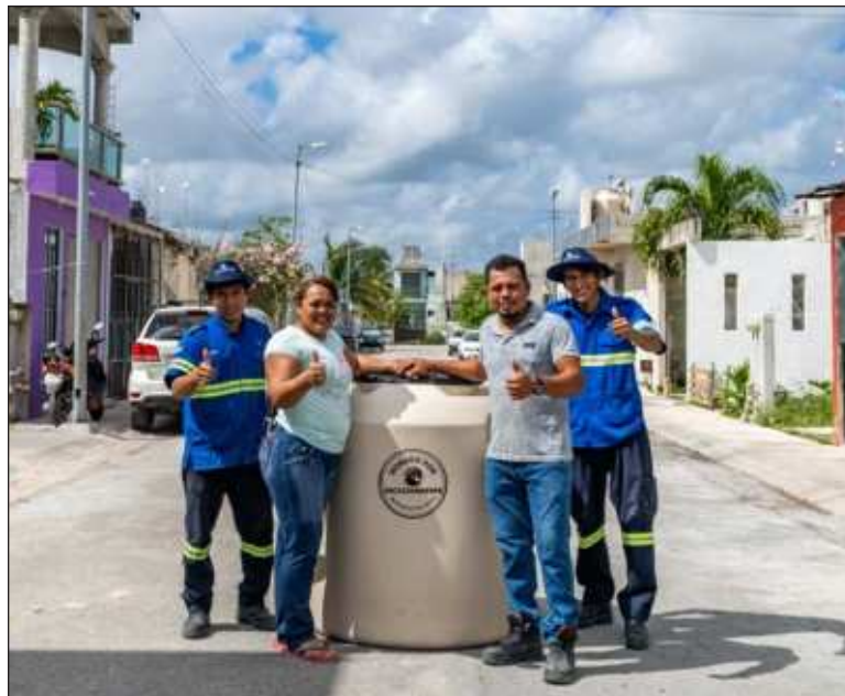
▲ Aguakan priorizará a la población en situación de pobreza y vulnerabilidad para este programa, incluyendo preferentemente a madres solteras, personas con discapacidad y adultos mayores.

Esta campaña también tiene como objetivo concientizar a la comunidad del uso y ventajas de contar con una cisterna de agua en casa, ya que de junio a noviembre se extiende la temporada de huracanes, así como en agosto y noviembre el fenómeno La Niña, por lo que durante estos meses, es común que se produzcan cortes de energía que afectan directamente la distribución del servicio de agua. Contar con un tinaco que