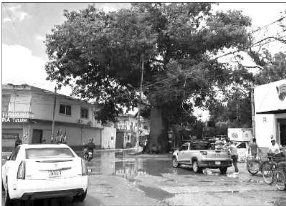
▲ En un recorrido por la zona céntrica se pudo observar que el tránsito vial presentó problemas debido a que no serían los semáforos, mientras que los comercios lucían vacíos desde la mañana.