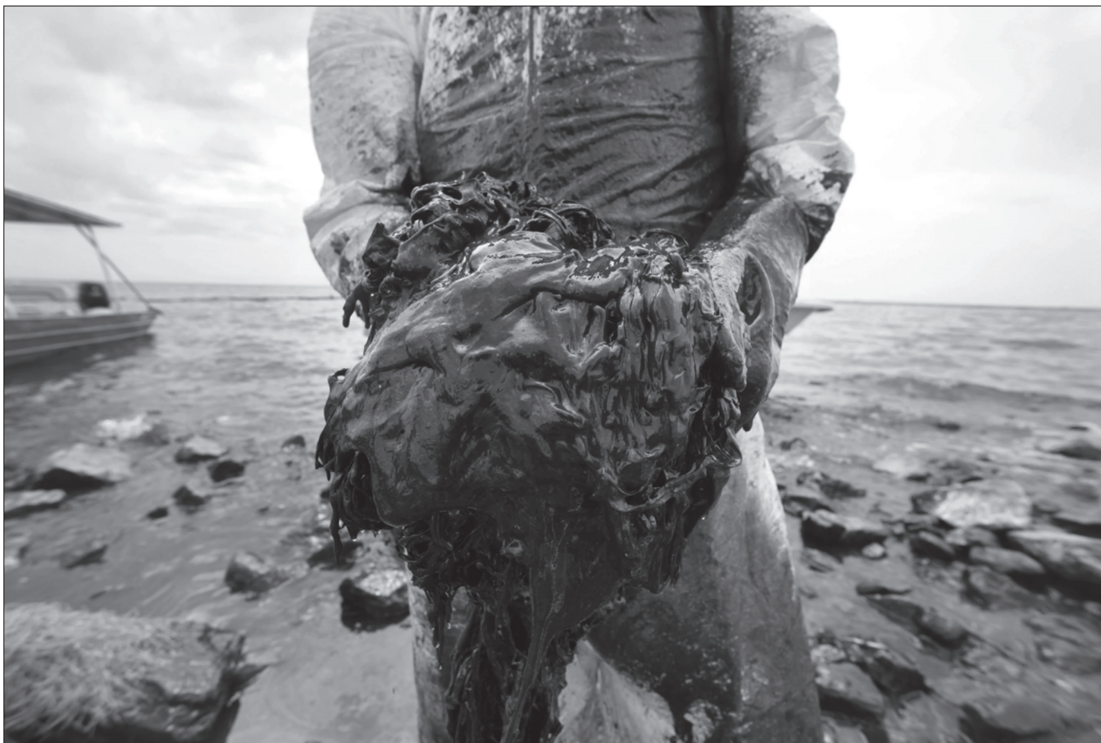
▲ "Las elecciones o reelecciones no impiden o no han afectado positivamente los grandes retos globales que impactan a lo local. Vale la pena no olvidarlos porque la estabilidad social puede tener mayor reacción que el resultado de las elecciones. Y, por supuesto, se necesita de un país unido para enfrentar esos retos globales".