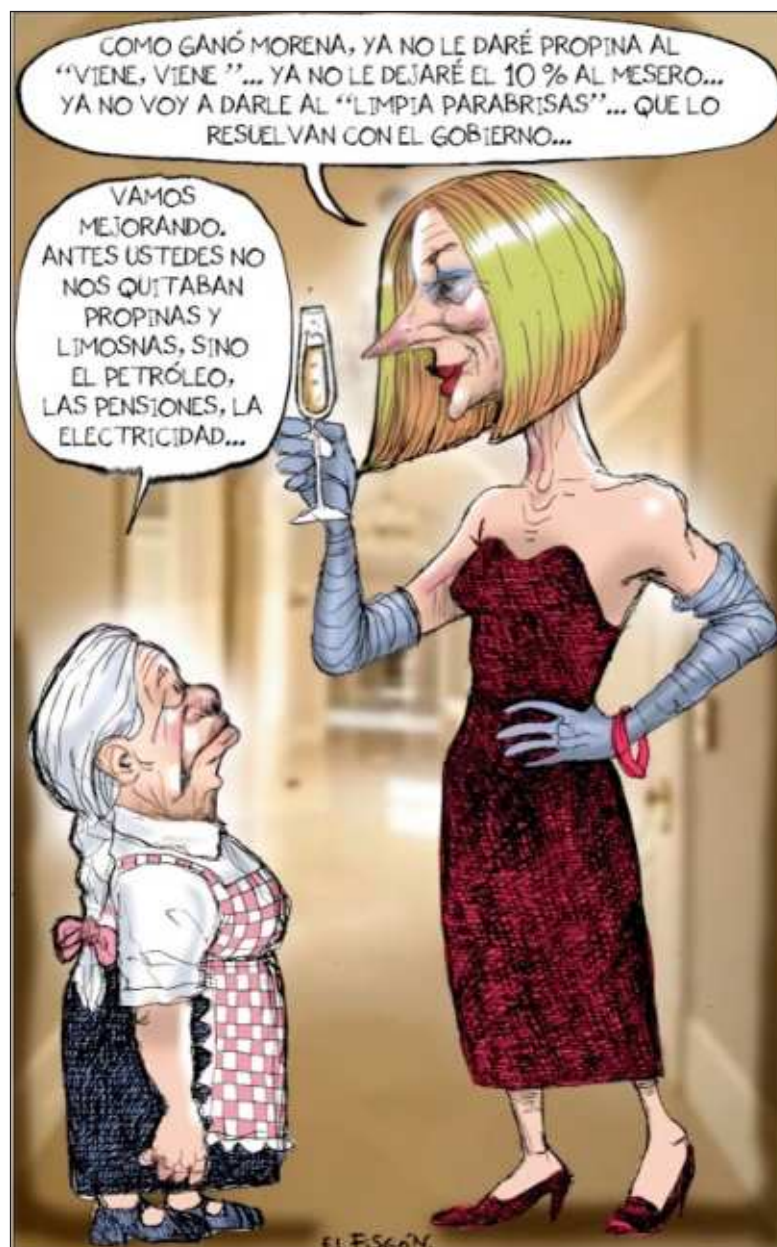
▲ "Se pasaron todo el sexenio escuchando y creyendo los mensajes de pánico en la mayoría de los medios de comunicación". Cartón Debate poselectoral de El Fisgón

EN ESTE CONTEXTO , muchos de estos partidos y movimientos pretenden redefinir el significado de la izquierda. En muchos casos abandonan la representación y defensa de los intereses de importantes grupos sociales populares, hacen a un lado las luchas de quienes fueron empobrecidos a partir de las medidas neoliberales. En síntesis, cambian sus objetivos y banderas, ya no hablan de mejoras salariales o de condiciones de trabajo, prestaciones, distribución del ingreso, salud, jubilaciones y un largo etcétera, que caracterizaba la lucha histórica de los movimientos de izquierda. Actúan en realidad más como liberales y prefieren ser referidos como "progresistas" o "progres". Su nuevo credo es la llamada política de las identida-