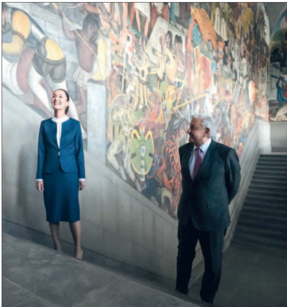
▲ La virtual presidenta electa ofreció una conferencia de prensa desde Palacio Nacional, tras encontrarse en privado con Andrés Manuel López Obrador.

“Hablamos de muchos temas, desde que no nos veíamos desde la campaña, el resultado de la elección, lo que significa el avance de nuestro movimiento con este resultado histórico no sólo para la Presidencia, sino en gubernaturas, la jefatura de gobierno, los resultados en la Cámara de Diputados, para el Senado, en las presidencias municipales. El reconocimiento de ese gran movimiento al que pertenecemos y que tuvo este resultado histórico”.