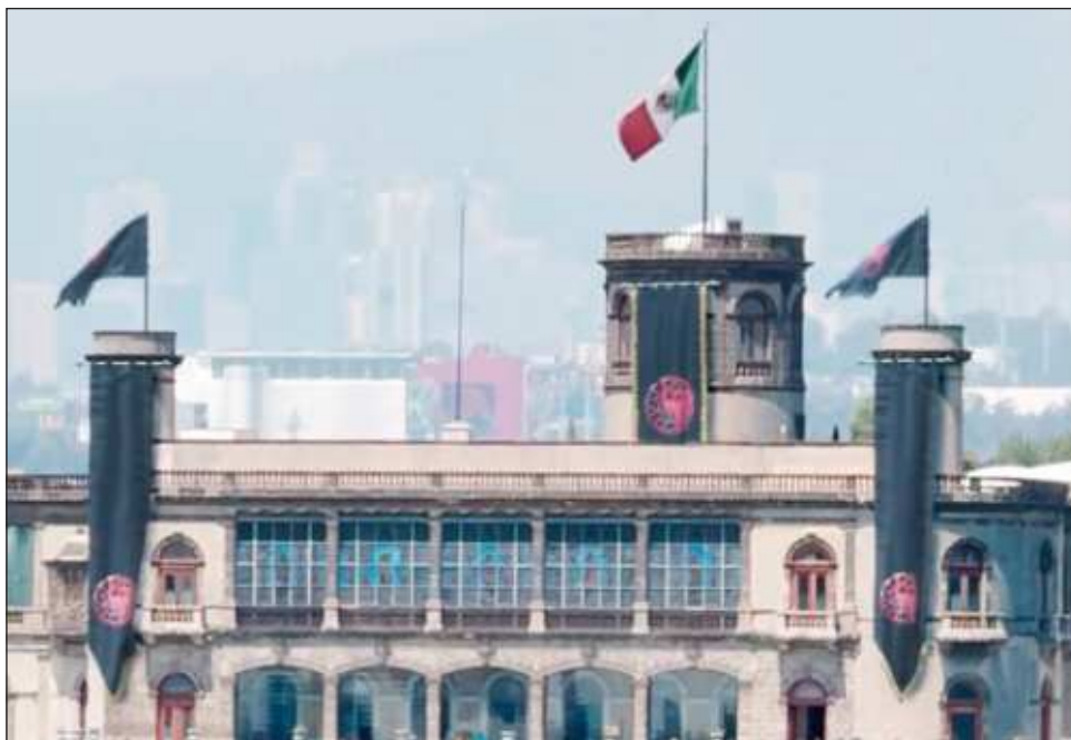
▲ Las autoridades detallaron que en ningún momento se colocaron banderas, pendones ni ningún otro material publicitario relativo dicha serie sobre el Museo Nacional de Historia.

En redes sociales, circularon esta mañana imágenes del Castillo de Chapultepec intervenido con banderas de la Casa Targaryen, de la famosa serie de Max La Casa del Dragón , que estrenará el primer episodio de su segunda temporada este domingo.