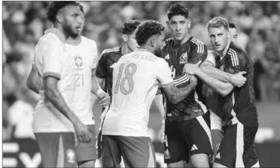
▲ El Tricolor aceptó siete goles en sus dos juegos de preparación para la Copa América.

A los aficionados que lleguen de Latinoamérica se su-