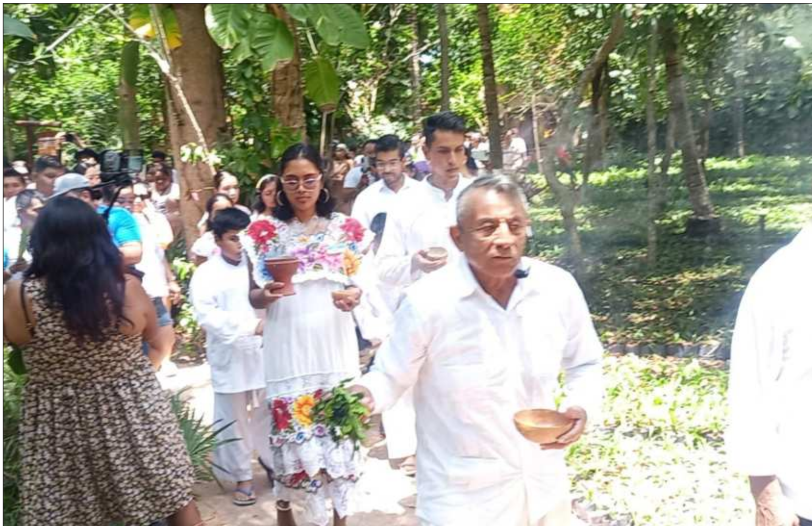
▲ La abeja melipona ha sido venerada por los mayas desde la antigüedad debido a su invaluable contribución a la polinización y sus propiedades medicinales.

En la época prehispánica se realizaban entre cuatro y seis ceremonias como esta al año; actualmente se celebran dos veces al año en Xel Há. Asimismo, se dio a conocer que el parque Xel Há, ubicado en Tulum, se convirtió en el primer parque en el mundo en obtener certificación Master por parte de la organización Earth Check.