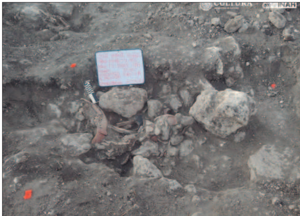
▲ De los 26 entierros humanos recuperados, una decena estaban dentro de cistas, revelaron especialistas del Instituto Nacional de Antropología e Historia.

Una vez concluidas las labores de prospección, lideradas en primera instancia por el arqueólogo Eric Saloma García, y después por el