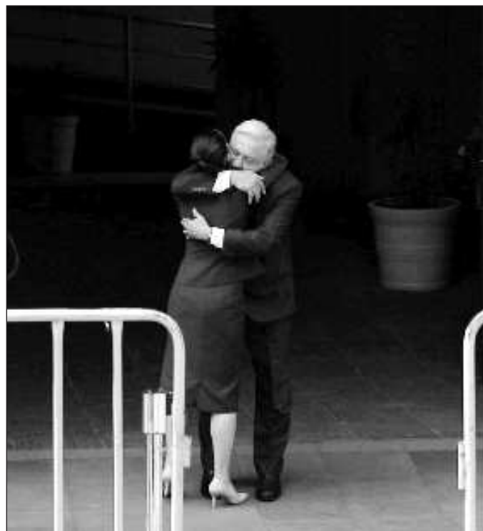
▲ En realidad, AMLO la reconoció como interlocutora, más que como subordinada en el movimiento de la 4T.

Por otra parte, López Obrador se convertirá en el primer presidente que, en 30 años, consigue entregar la banda presidencial no sólo a alguien de su propio partido, sino a quien fue su candidata in pectore desde el primer momento. Carlos Salinas no pudo dejarle el cargo a Luis Donald Colosio, por el asesinato de éste; quien entró de relevo a ocupar la candidatura del PRI en 1994 fue Ernesto Zedillo, quien a su vez reconoció el triunfo del panista Vicente Fox en 2000; y si bien en 2006 se declaró vencedor al candidato del PAN, Felipe Calderón Hinojosa, el