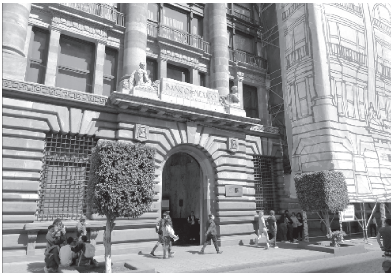
▲ El BM resaltó que México, como país de ingresos medianos altos y miembro de la OCDE, ha logrado avances significativos en sofisticación económica, expansión de las exportaciones y crecimiento de la inversión extranjera directa.

El IFT es competente para resolver la operación, ya que Sky México ofrece en México los siguientes servicios: la provisión del servicio de televisión de paga; la provisión de servicios de telefonía fija y acceso a internet fijo; la provisión del servicio de conducción de señales unidireccionales por satélite, entre otros.