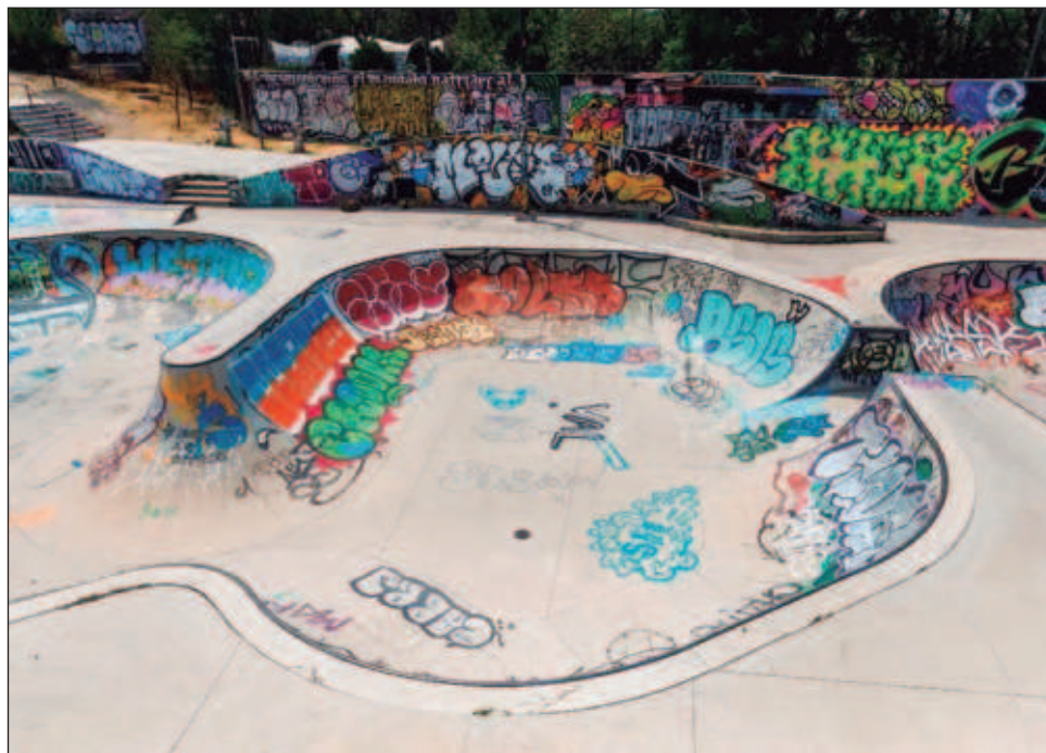
▲ El espacio del Parque de Cultura Urbana (Parcur) se encuentra ahora en lo que fueron albercas y estanques de los parques acuáticos El Rollo y Atlantis.

Con el Proyecto Chapultepec: Naturaleza y Cultura se dio reconocimiento a quienes habían ocupado las pozas vacías para expresarse con color y movimiento sobre ruedas del skate. Dentro de las piscinas ahora se deslizan las nuevas