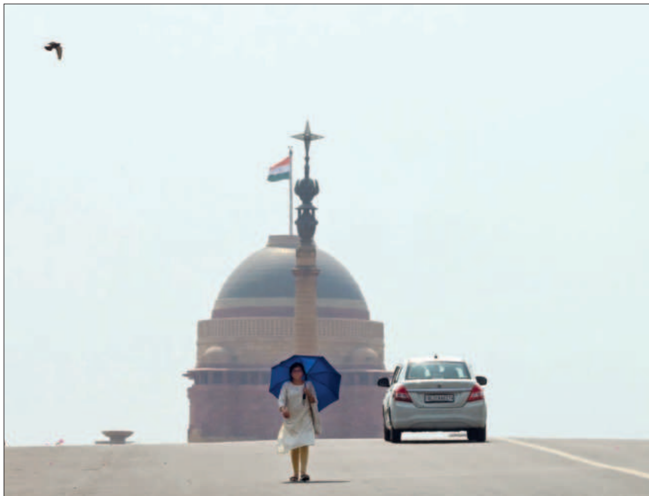
▲ El especialista explicaba que "las actividades humanas, el aumento de la población, el proceso de industrialización y el transporte están provocando un aumento de la concentración de monóxido de carbono, metano y clorocarbonos".

Mzuzu es la tercera ciudad más grande de Malawi y la capital de la región norte. Se encuentra en una zona montañosa y boscosa dominada por la cadena montañosa de Viphya, que tiene vastas plantaciones de pinos.