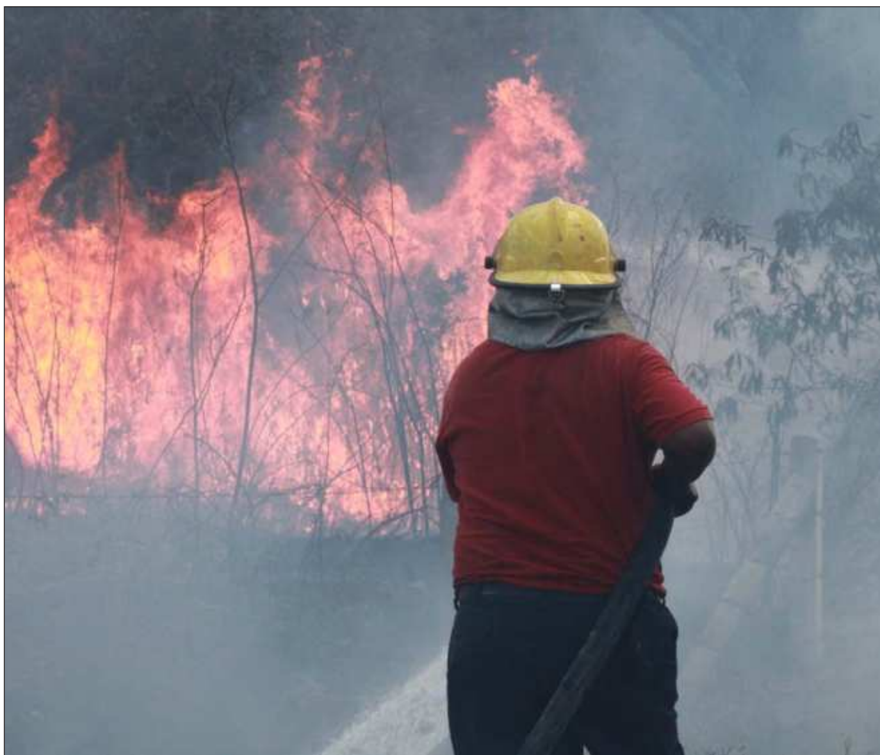
▲ La Semabice indicó que, del total, 30 siniestros ya fueron liquidados y sólo queda uno activo, este es el incendio forestal de Pucnachén, ubicado en el municipio de Calkiní, con 300 hectáreas afectadas de forma preliminar.