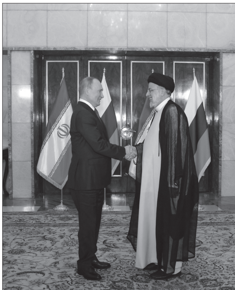
▲ “The main challenge facing the West is not left versus right, but totalitarianism versus democracy. Common sense rather than platitudes”.

ONE WONDERS IF the Trudeau government is being advised by