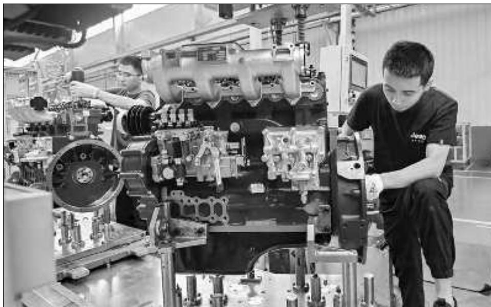
▲ Sólo China, Rusia y México disfrutaron de un crecimiento positivo de los salarios reales en 2023.

“Es poco probable que la erosión del nivel de vida resultante de la inflación se compense rápidamente”, indicó la OIT en su informe Perspectivas Sociales y del Empleo en el Mundo: Tendencias 2023 .