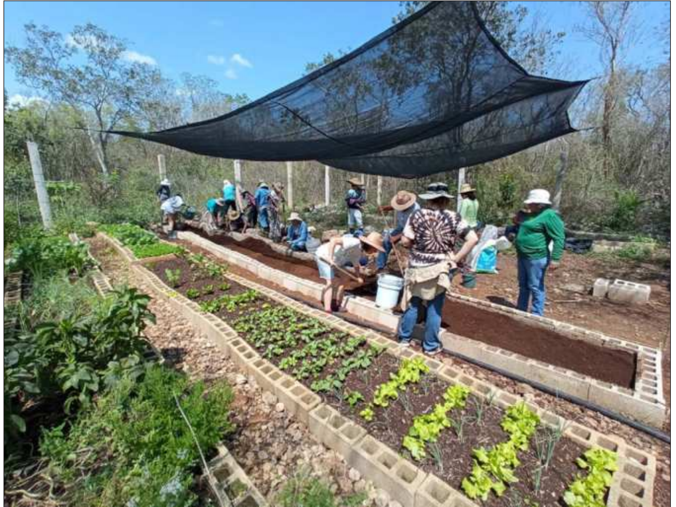
▲ Yaan u káajal tu yáax sábadoil febrero yéetel yaan u chúunul noviembre.

Kaambal kun e'esbil tumen U Neek' Lu'ume'