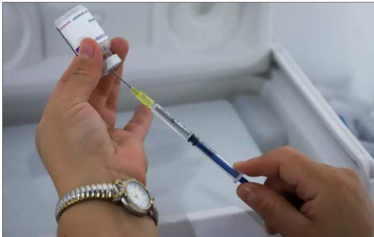
▲ De acuerdo con el reporte al 10 de enero de Sesa, la entidad está en la posición 23 a nivel nacional por número de casos de Covid-19, y en el 29 por número de defunciones; actualmente hay 124 mil 449 casos acumulados.

Respecto a los casos de influenza e influenza estacional, con estadísticas acumuladas de todo el 2023, reportaron un total de 85 casos y 12 defunciones. Los casos están divididos por muni-