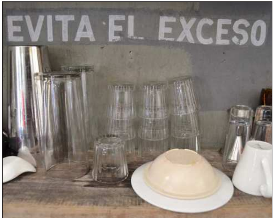
▲ En la mayoría de los casos de alcoholismo, el factor que más prevalece entre personas con esta adicción es la desintegración familiar, recalcó don Andrés, coordinador de Infomación de AA.

Recuerda que la última vez que tomó manejaba un tsuru, estaba en estado de