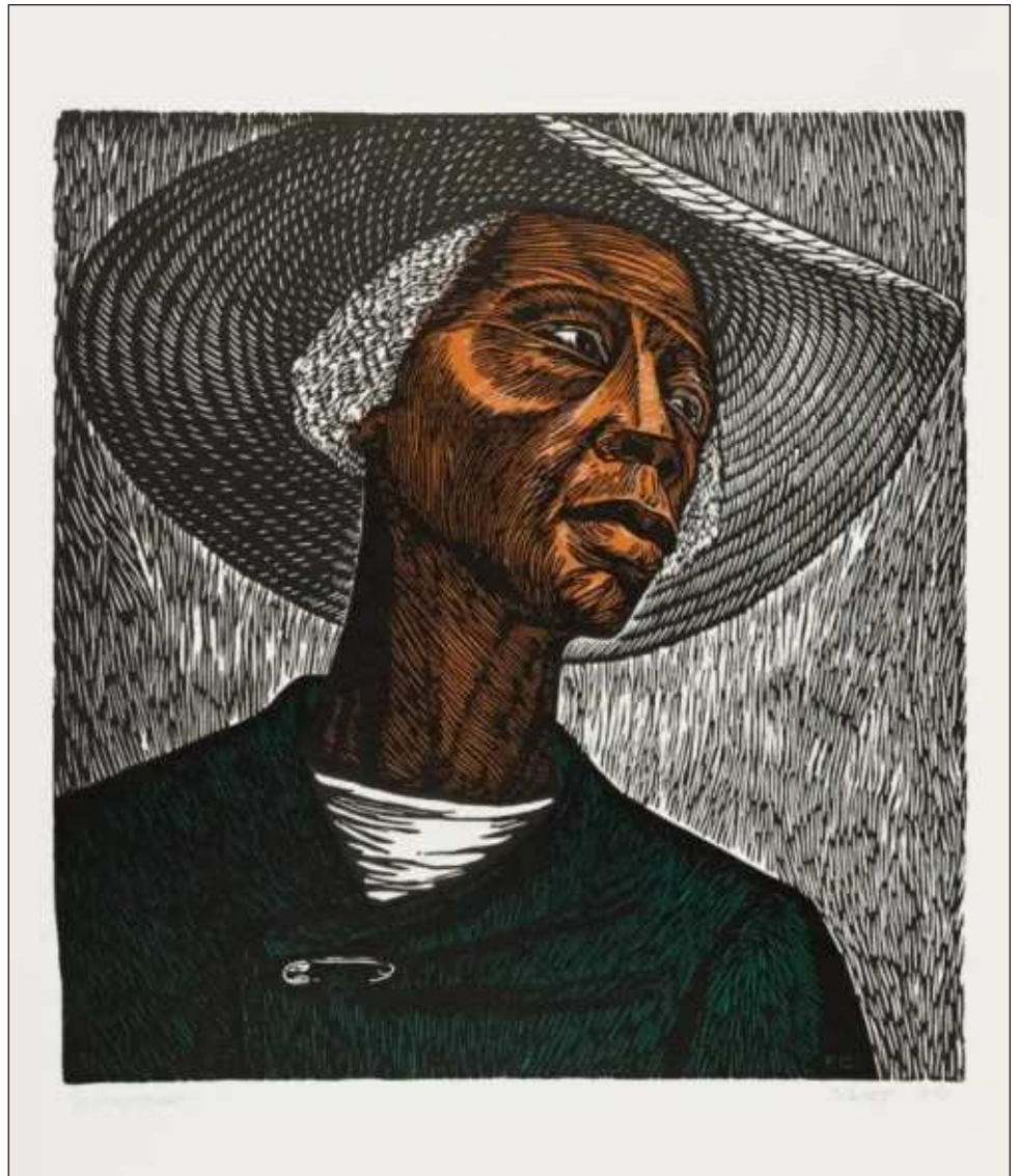
▲ Actualmente, el Museo de Arte Moderno en Frankfurt, Alemania, donde reunieron 175 piezas en una “primera revisión comprensiva” de la labor artística de Elizabeth Catlett, mucha de la cual fue realizada en México.

El TGP se volvió el hogar social y artístico de Catlett. Para entonces se había casado con el pintor y grabador Francisco Mora,