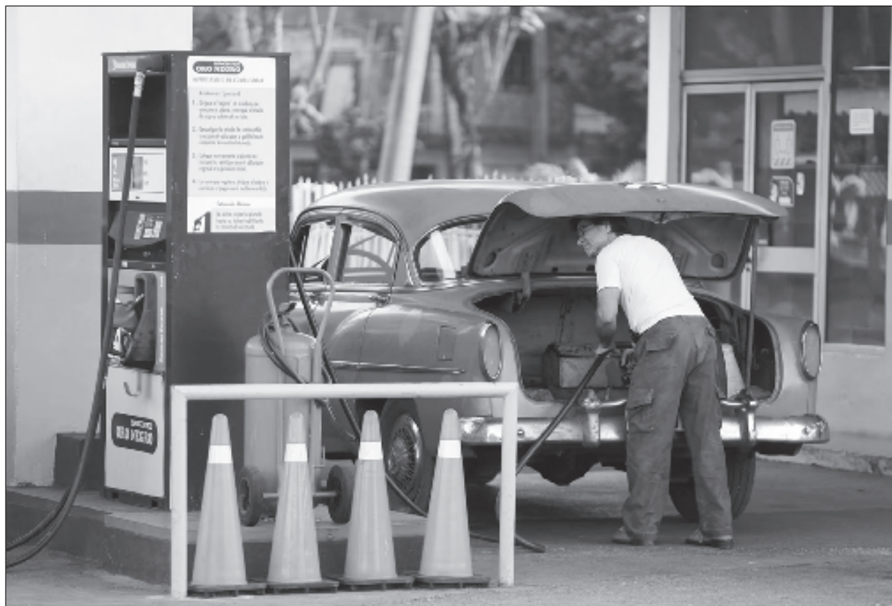
▲ El mandatario cubano aseguró que las medidas – incluidas en el mayor ajuste macroeconómico en décadas– tienen el fin de “enfrentar” los “problemas” provocados por el embargo económico de Estados Unidos.

Desde que el primer ministro, Manuel Marrero, confirmó a mediados de diciembre en la Asamblea Nacional (Parlamento unicameral) el plan de choque, tras años de profunda crisis, con escasez de bienes básicos, distintos ministros del Gobierno han desfilado en la televisión estatal para informar sobre los cambios que se implementarán este año.