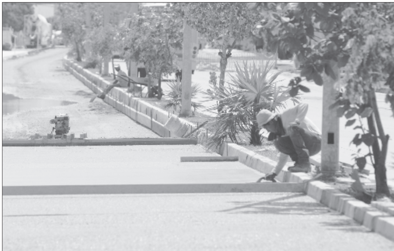
▲ Compañías de la entidad pueden registrarse en el programa de proveedores para participar.

Detalló que además de la derrama económica que se tendrá, como producto de esta importante obra, se estarán generando fuentes de empleo para los habitantes de estas 45 comunidades en 10 municipios del estado.