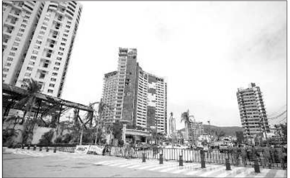
▲ Las familias de Acapulco y Coyuca, Guerrero, que fueron afectadas por el huracán, se encuentran adquiriendo materiales para rehabilitar sus viviendas.

Al conocerse el fallecimiento de García Ramírez, diversas instituciones, políticos y académicos manifestaron su pesar a través de las redes sociales, entre ellas la CIDH; Olga Sánchez Cordero, ministra en retiro de la Suprema Corte de Justicia de la Nación, la Asociación Nacional de Magistrados de Circuito y Jueces de Distrito del Poder Judicial de la Federación, y la Academia Mexicana de Ciencias Penales.