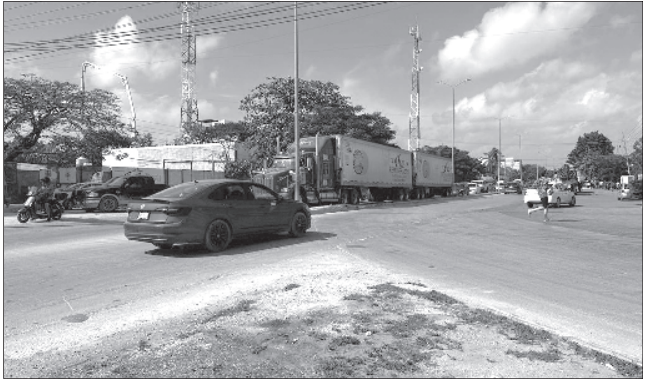
▲ Actualmente circulan hasta 75 vehículos por minuto en cada una de los tres accesos al municipio, cuando por lo general el movimiento es de 25 a 30 unidades, reveló Erik Bojorges, director municipal de Tránsito.

Apuntó que en la zona sur de la cabecera municipal también han tenido una nutrida afluencia de automovilistas, quienes ingresan y salen de los eventos musicales, pero también de los que habitan el fraccionamiento Aldea Tulum.