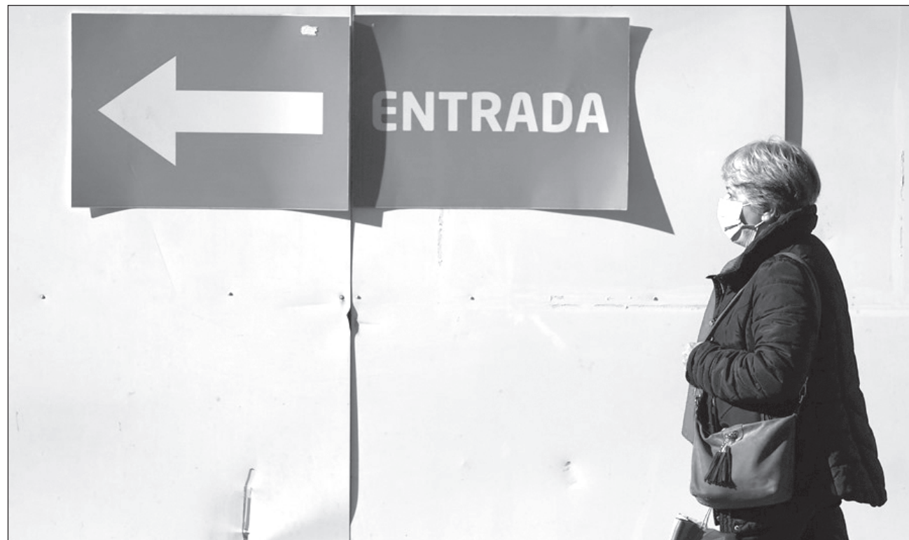
▲ El director general de la Organización Mundial de la Salud pidió a los gobiernos que sigan facilitando el acceso a pruebas, tratamientos y biológicos, y a los ciudadanos les instó a vacunarse si pertenecen a grupos de riesgo.

“Impulsada por las reuniones en el periodo vacacional y por la variante JN.1, que ya es la más comúnmente registrada, la Covid ha causado casi 10 mil muertes en diciembre”, indicó en su primera