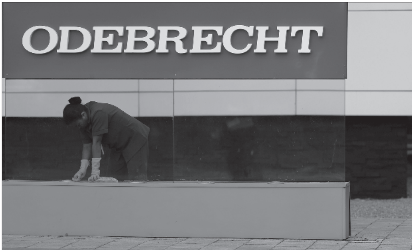
▲ “En otros países la estela de corrupción de Odebrecht significó prisión y el final de carreras políticas en los niveles más altos; en México no”.