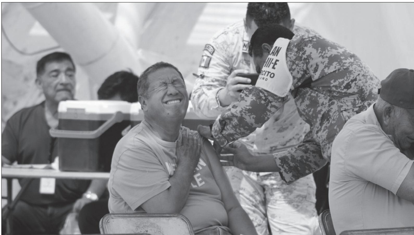
▲ “Los escándalos de los efectos secundarios, conforme va pasando el tiempo, son imposibles de esconder, aunque estos pueden tardar en manifestarse”.