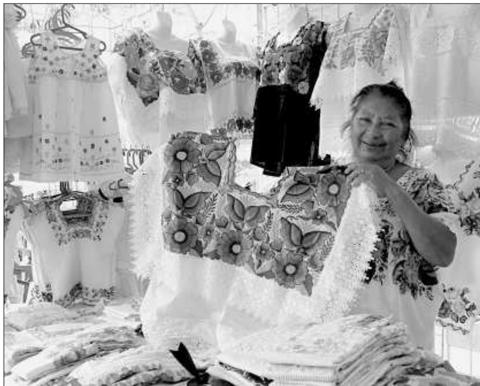
▲ El Centro de Emprendedores de Tekax iniciará operaciones en abril.

Con los apoyos que genera el Iyem, cada año se formalizan aproximadamente 120-150 negocios.