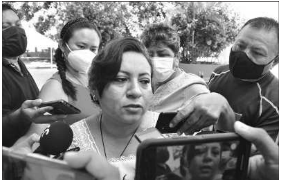
▲ La alcaldesa fue entrevistada saliendo del Palacio de Gobierno y con evidente molestia respondió que son noticias falsas vertidas desde la cabecera municipal de Calkiní.

Cuestionada al respecto, la alcaldesa fue entrevistada saliendo del Palacio de