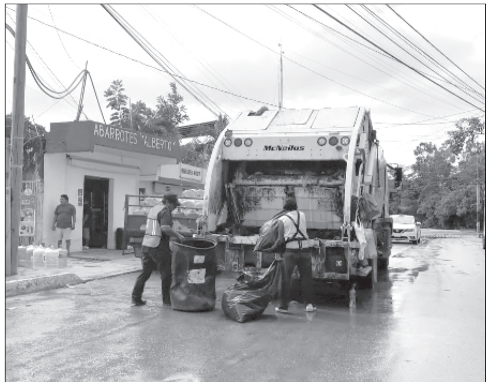
▲ El relleno sanitario de Tulum fue cerrado desde noviembre del año pasado por la inauguración del Aeropuerto Internacional Felipe Carrillo Puerto.

De igual manera, pidió a los habitantes seguir haciendo las denuncias por medio de las páginas oficiales del ayuntamiento para atender cualquier llamado para mejorar la recolección de basura.