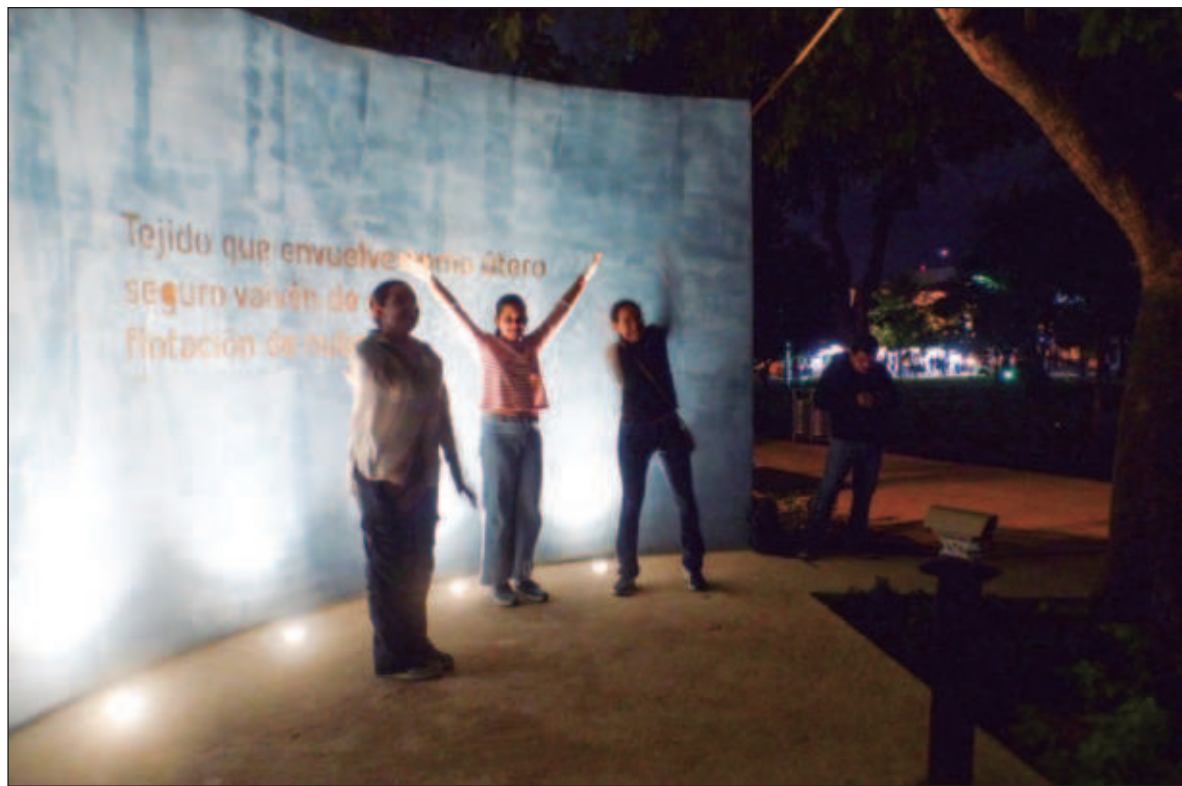
▲ “La icónica fachada de La Peni se convierte en un lienzo: un mural interactivo de 140 metros de largo (...). El espectador no se limita a contemplar sino que se convierte igual en creador”.

La inmersión es la posibilidad de sumergirse, literalmente, en el espectáculo; bucear en él. En Mérida se han montado unos cuantos ejemplos de este tipo de experiencias, la más reciente Van Gogh, The Immersive Experience . Esta es una muestra itinerante que se ha presentado igual en otras ciudades de México y el mundo. Flotar en campos de girasoles y noches estrelladas tiene un