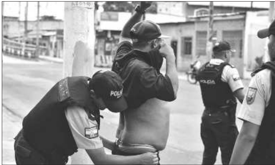
▲ El mandatario mexicano confió en que la situación sea transitoria y se restablezca la paz.

“Expresamos nuestra solidaridad y apoyo al pueblo de Ecuador y a su gobierno. Desde luego que reprobamos estas actitudes vandálicas, la violencia, el querer imponerse con el uso de