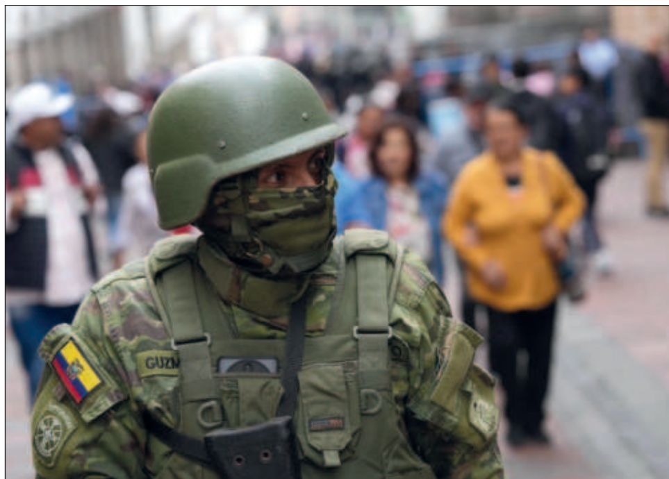
▲ Con el decreto firmado por el jefe de Estado, Daniel Noboa, los militares ecuatorianos tienen potestad de utilizar "la fuerza letal para rendir al enemigo".

Además, cuatro oficiales de policía, que según las autoridades fueron secuestrados por delincuentes entre el lunes y el martes, también están deteni-