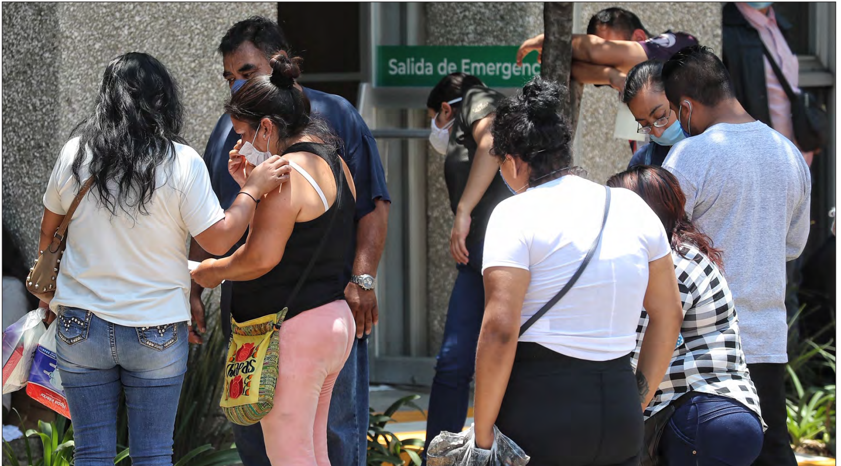
▲ Este domingo, la pandemia cobró la vida de seis personas en Yucatán.