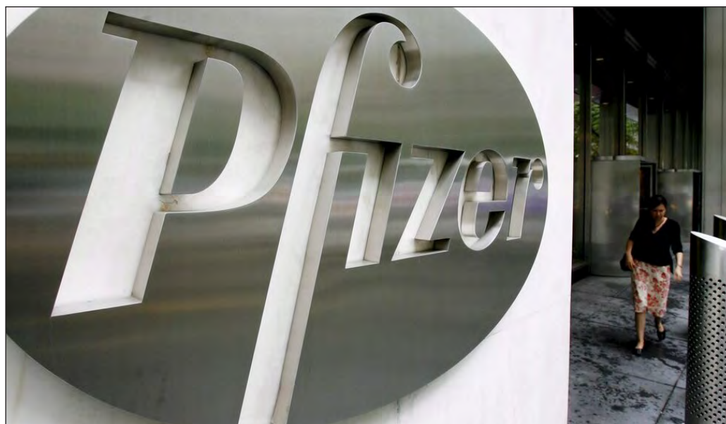
▲ Las farmacéuticas son de las grandes ganadoras en medio de la crisis económica provocada por la pandemia.

Un estudio efectuado por la empresa de análisis de datos científicos Airfinity puso cifras a un aspecto digno de atención en la lucha contra la pandemia de COVID-19, el de los ingentes recursos destinados por los gobiernos para la investigación de una cura para la enfermedad causada por el coronavirus. De acuerdo con dicho informe, los Estados han aportado cerca de 8 mil 600 millones de dólares, las compañías farmacéuticas aproximadamente 4 mil 400 millones y las fundaciones de asistencia privada alrededor de mil 900 millones; es decir, que el sector público ha aportado prácticamente el doble que el privado, pese a que será este último el que recoja todas las ganancias derivadas de la comercialización de las vacunas y las posibles curas.