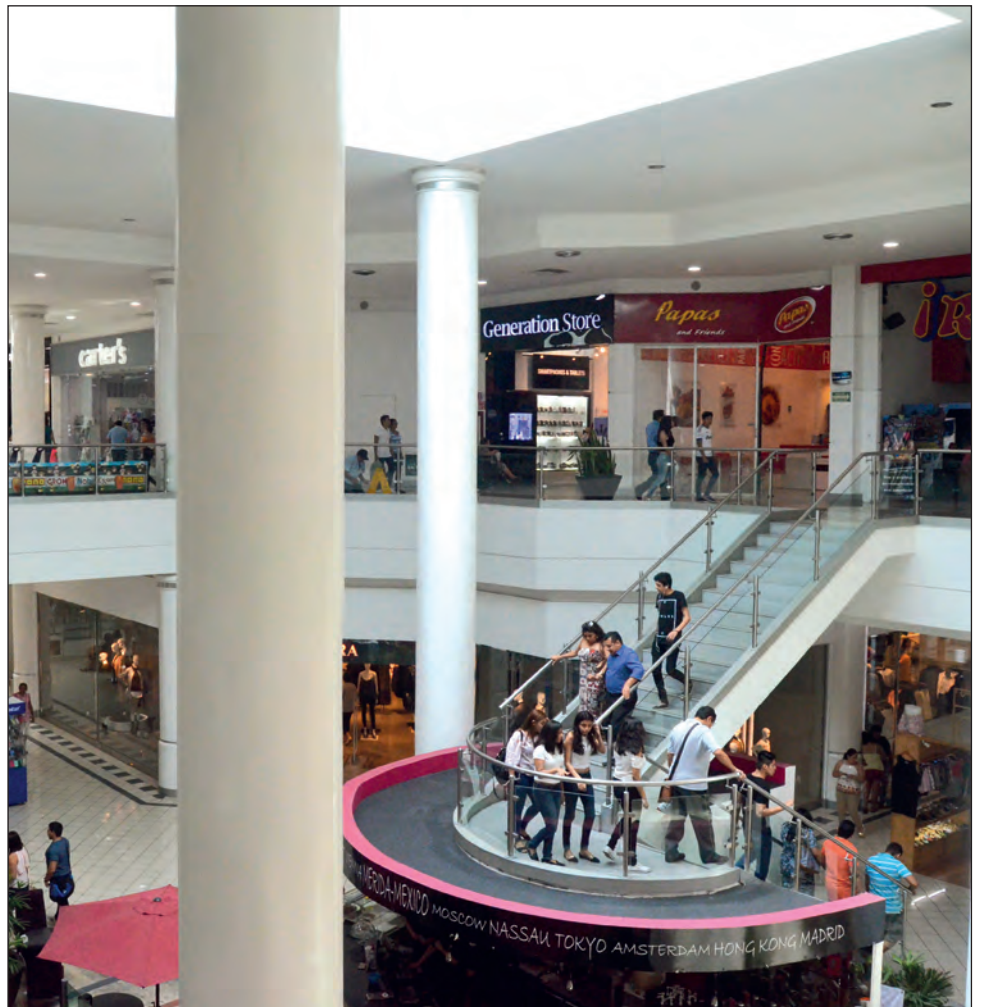
▲ El guardia encargado de tomar la temperatura y aplicar gel antibacterial estará a cargo de monitorear el acceso a menores de edad.

En las tiendas Coppel ya no permiten el ingreso de menores y han buscado que solo entre un miembro por familia; lo anterior no sólo para no arriesgar a sus colaboradores, sino para evitar multas o sanciones de la Comisión para la Prevención contra Riesgos Sanitarios de Campeche (Copriscam).