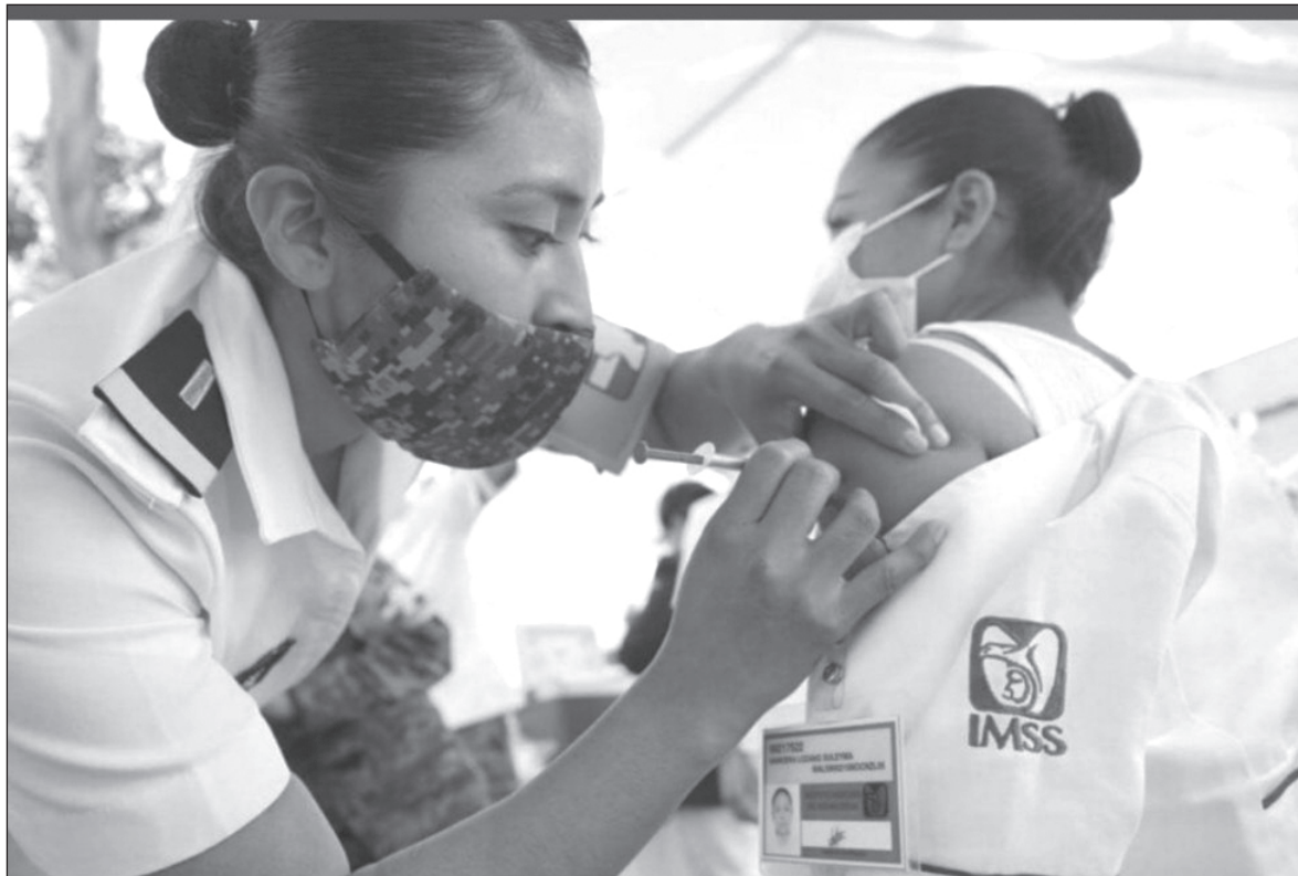
▲ El personal médico que será vacunado entre enero y febrero será seleccionado por las dependencias de salud, sin importar si son públicas o privadas.

ES A PARTIR DE febrero 2021 que iniciará la vacunación masiva para la población. Durante febrero se continuará con el resto del personal médico y se comenzará con personas mayores de 60 años (etapa 2). Está lógica continuará hasta los meses de abril y mayo que será cuando la pobla-