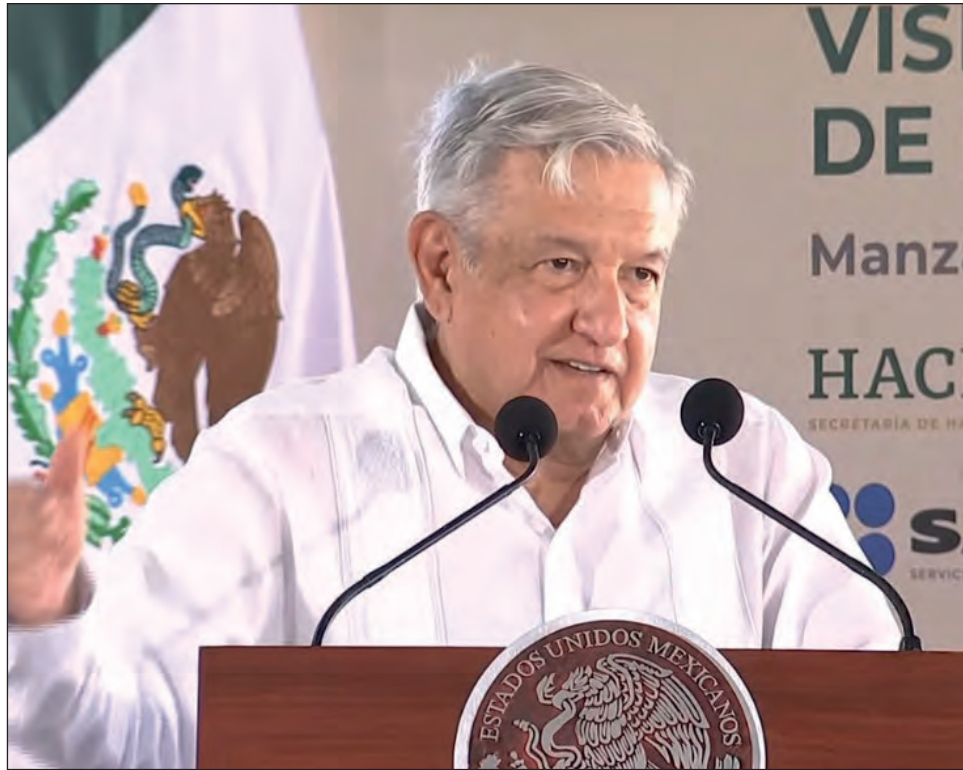
▲ El presidente Andrés Manuel López Obrador habló del nuevo plan integral para Manzanillo, Colima.

El mandatario informó que en el encuentro las autoridades estatales y municipales plantearon que se requiere inversión federal para atenuar el impacto urbano de la operación del puerto de