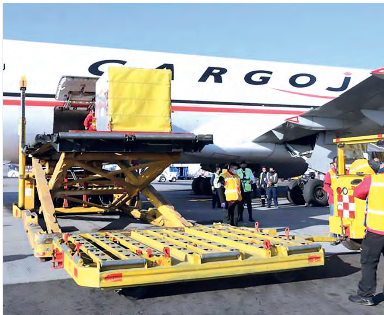
▲ A partir de mañana martes y hasta el 1 de febrero, deberán llegar a Yucatán 27 mil 300 vacunas de la farmacéutica Pfizer, que se aplicarán al personal sanitario de las áreas COVID en hospitales.

“En el tema de la vacunación no puede haber colores, aquí lo que existe es Yucatán, lo que existe es México y todos tenemos que poner de nuestra parte sin regatear un centímetro para que esto pueda salir bien y pueda ser una vacunación rápida y eficiente, que le permita a nuestro personal de salud tener la certeza de que ellos van a estar seguros, que no van a estar contagiando a su familia”, precisó.