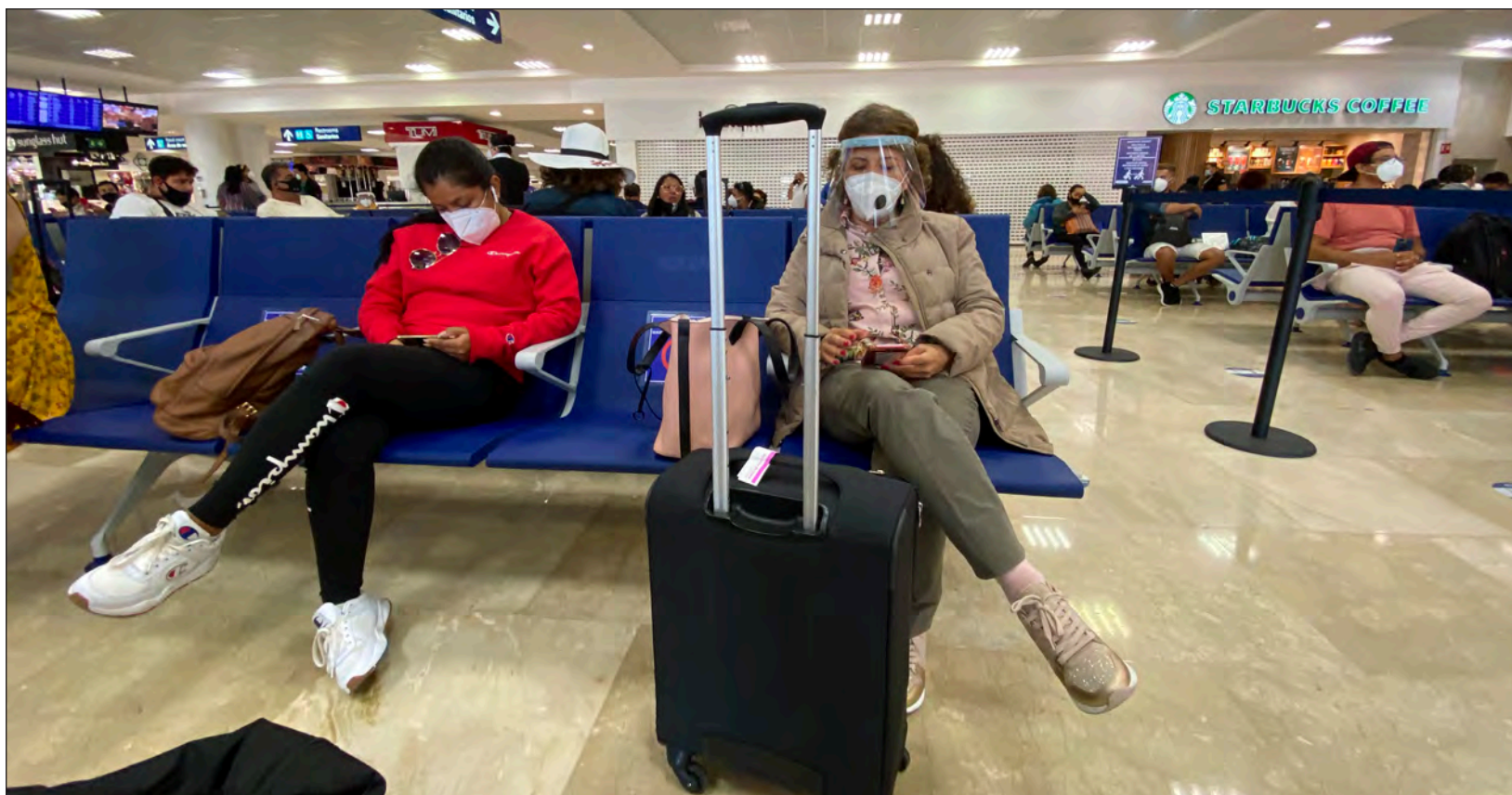
▲ La conexión aérea de Quintana Roo con ambos países de Norteamérica es muy amplia e incluso ha incrementado a raíz de la pandemia.