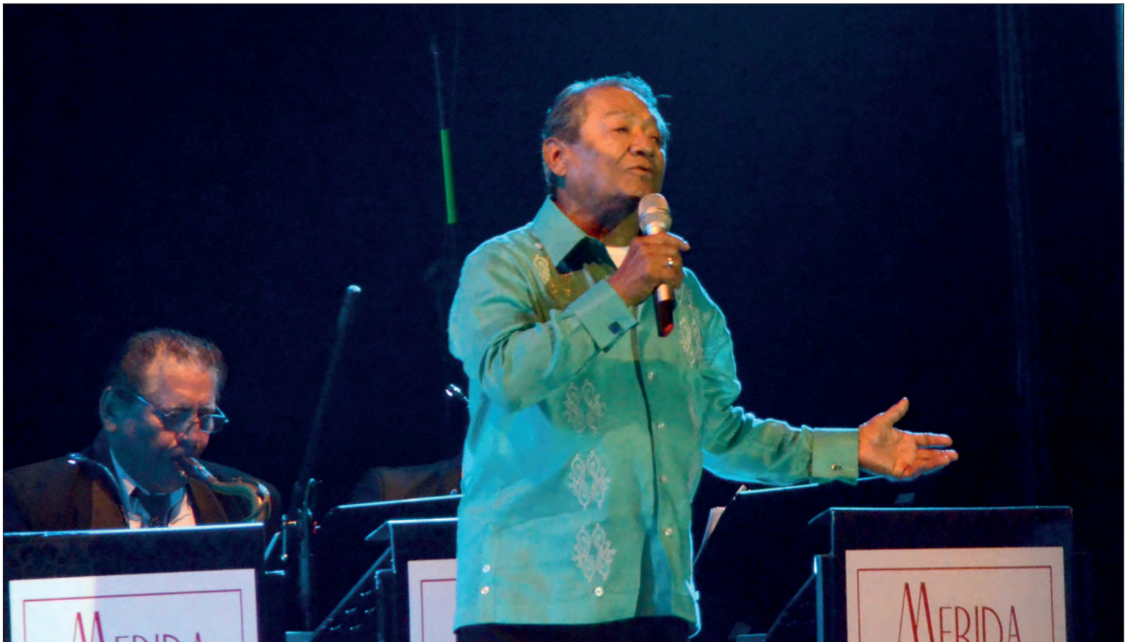
▲ El Día del Compositor, que homenajeará al maestro Armando Manzanero, tendrá una duración aproximada de cinco horas.