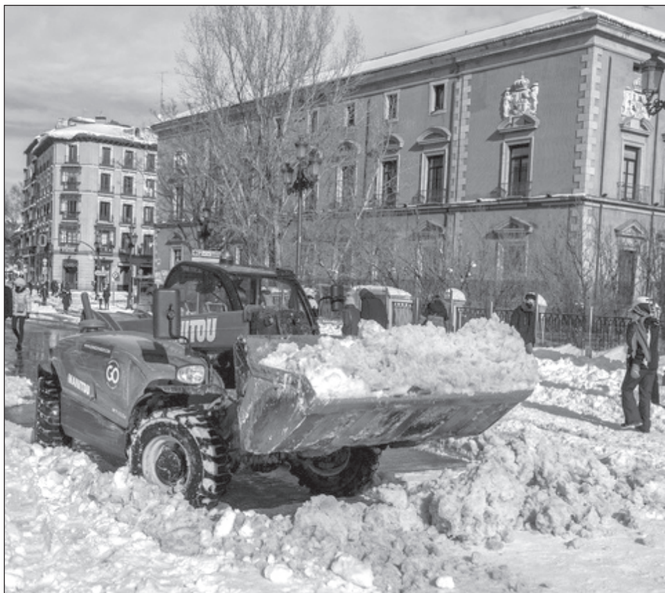
▲ Una barredora despeja las calles de nieve en el centro de Madrid, España.

La tormenta Filomena se desplazaba este domingo hacia las regiones de Cataluña y Aragón (noreste), afectadas hasta ahora por nevadas menos importantes que la víspera en el centro del país.