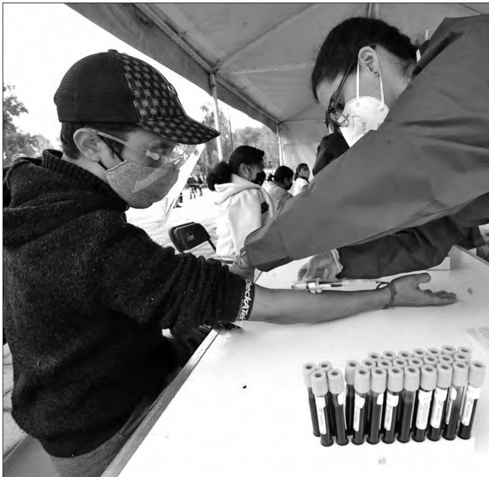
▲ Las autoridades sanitarias recomiendan extremar las medidas preventivas como el uso del cubrebocas, el lavado frecuente de manos y quedarse en casa el mayor tiempo posible.

La funcionaria insistió en su llamado a extremar las medidas preventivas como el uso del cubrebocas, el lavado frecuente de manos y quedarse en casa el mayor tiempo posible, ya que se ha confirmado que la mutación B117 es más contagiosa que la cepa original.