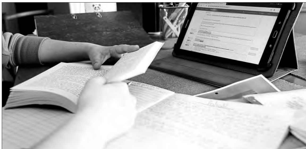
▲ Profesores señalan que el programa Aprende en casa 3 no será el eje central de la formación que impartan a los alumnos porque no responde a la realidad de aprendizaje de cada niño.

Profesores frente a grupo ven “muy lejano un posible regreso a las clases presenciales, no sólo porque la pandemia sigue activa en la mayor parte del país, también porque una de las demandas que hemos reiterado es que no habrá regreso a la escuela si no hay las condiciones para ello, lo que implica no sólo alcanzar el color verde del semáforo epidemiológico, sino que se cuente con agua pota-