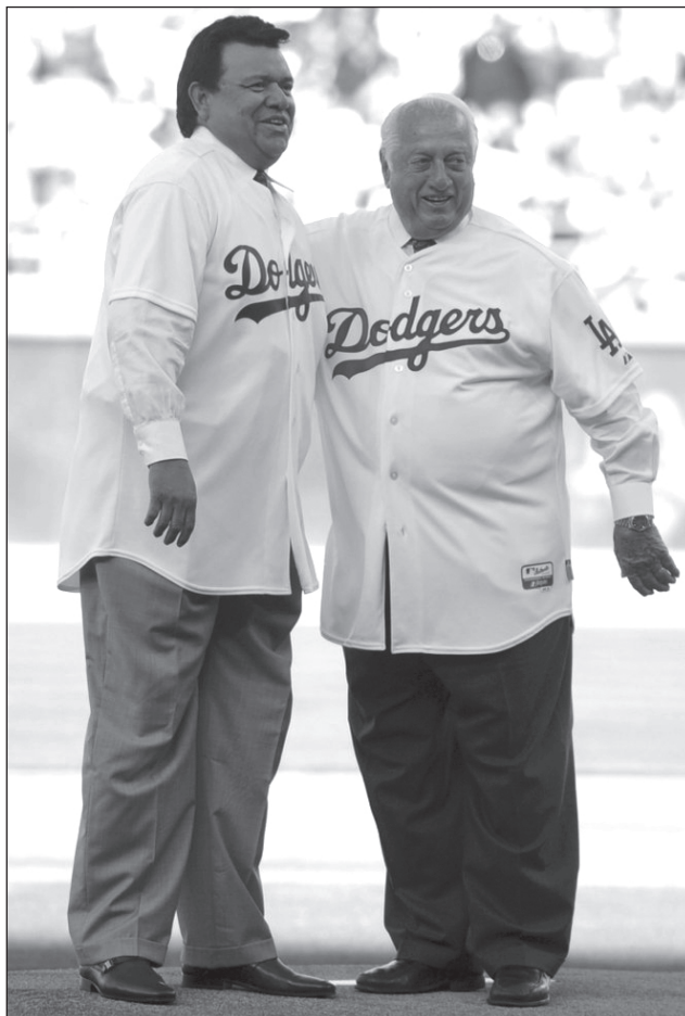
▲ Fernando Valenzuela comenzó su camino rumbo a convertirse en una leyenda de los Dodgers en una mágica temporada de 1981 bajo el mando de Tommy Lasorda.

Steve Garvey, destacó que el ex lanzador fue “un maestro, un mentor, un padre y un verdadero ícono del beisbol”.