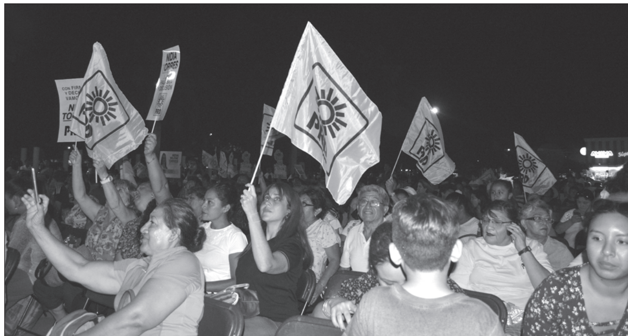
▲ En el proceso electoral 2021 se renovará el Ejecutivo estatal, 13 ayuntamientos, 21 diputaciones locales y dos federales, además de las juntas municipales.

“En estos tiempos, luego de los efectos negativos por la pandemia, en donde durante el 2020 muchos de los micro y pequeños comerciantes se vieron afectados (...) será de gran beneficio que la millonaria derrama económica que se espera en las elecciones se quede en