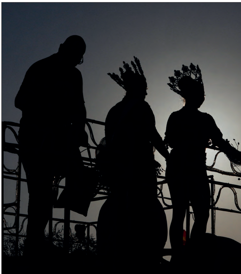
▲ La tradicional coronación de reyes y todos los eventos asociados al Carnaval deberán esperar a que haya condiciones sanitarias idóneas.

No habría reyes de Carnaval, pero sí actividades recreativas, entre otras cosas que próximamente darán a conocer con mayor detalle, reiteró el alcalde Renán Barrera.