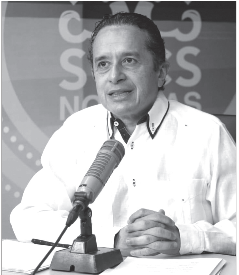
▲ El gobernador Carlos Joaquín ordenó la suspensión temporal del programa, con el objetivo de controlar los contagios de COVID-19.

La Sedeso alertó a los beneficiarios para que no caigan en fraudes, pues una publicación falsa que no corresponde al programa dio un número de cuenta para hacer depósitos.