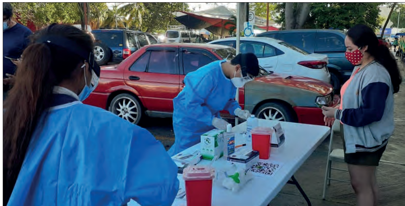
▲ En Benito Juárez y Othón P. Blanco se ofrecen pruebas rápidas de detección de COVID, sin costo alguno para la población.

Hasta el 9 de enero, la Secretaría de Salud estatal reportó 16 mil 460 contagios de COVID-19 y 2 mil