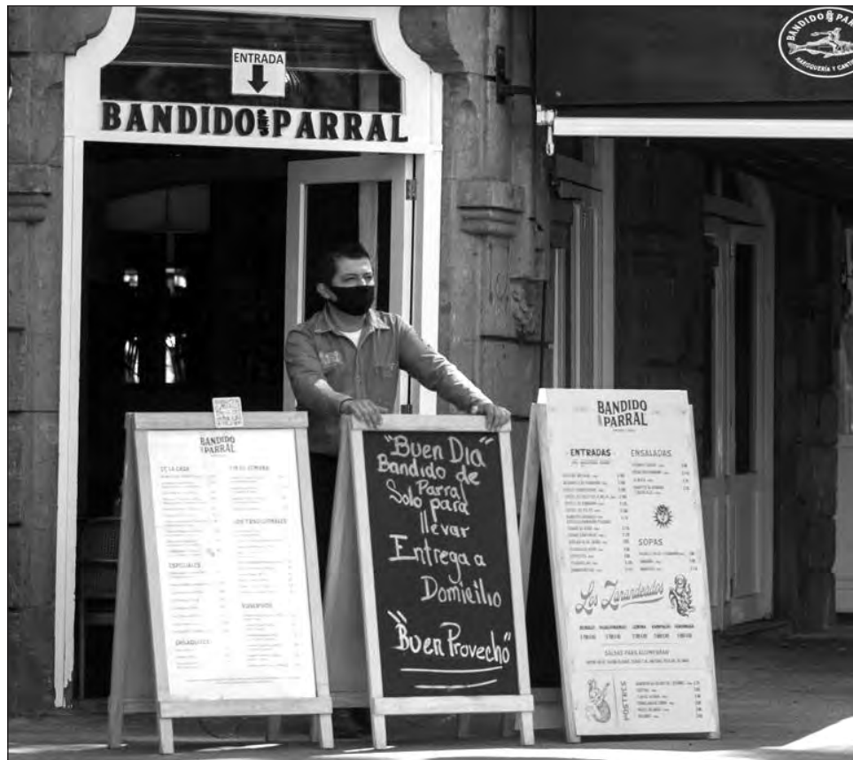
▲ Un mesero a la entrada de un restaurante ubicado en la esquina de Álvaro Obregón y Orizaba, en la colonia Roma, en el que se ofrece servicio a domicilio y para llevar, a partir de hoy.

Las empresas de turismo también se han visto afectadas, pues éstas perdieron ingresos por 19 mil 900 millones de pesos, afectación que se traduce en 70 por