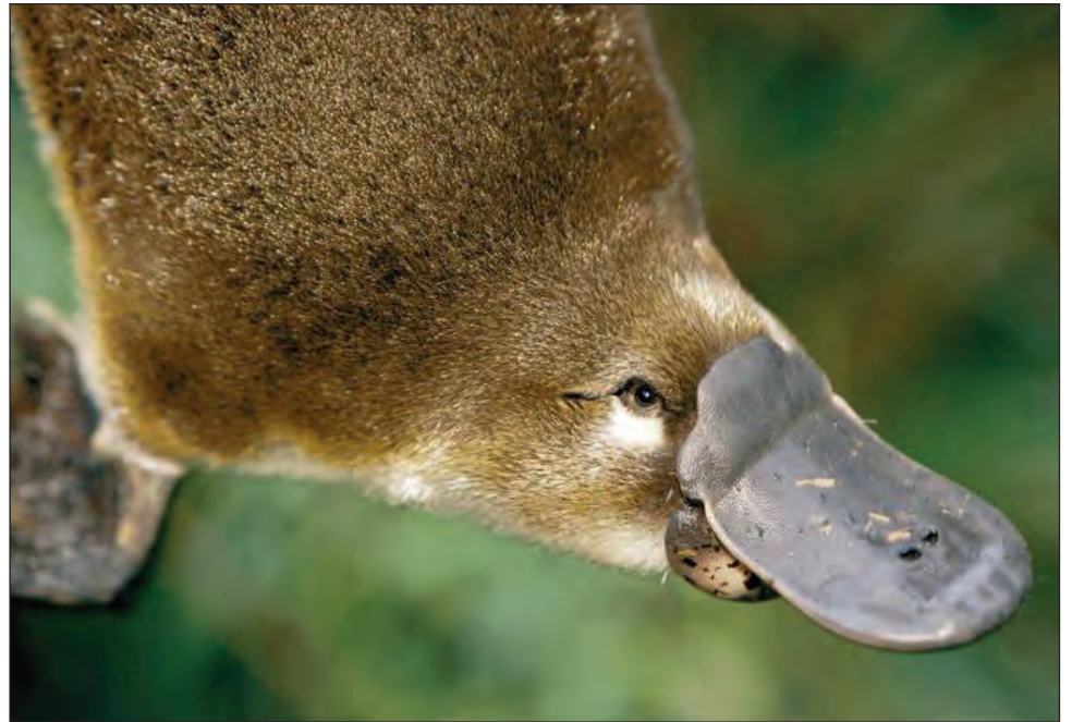
▲ El ornitorrinco australiano pone huevos, pero sus crías maman leche que exuda, no tiene dientes, tiene un espolón venenoso, tiene patas palmeadas, pelaje que brilla y tiene 10 cromosomas sexuales.

“De hecho, el ornitorrinco pertenece a la clase Mammalia, pero genéticamente es una mezcla de mamíferos, aves y reptiles. Ha conservado muchas de las características originales de sus antepasados, lo que probablemente contribuya a su éxito en la