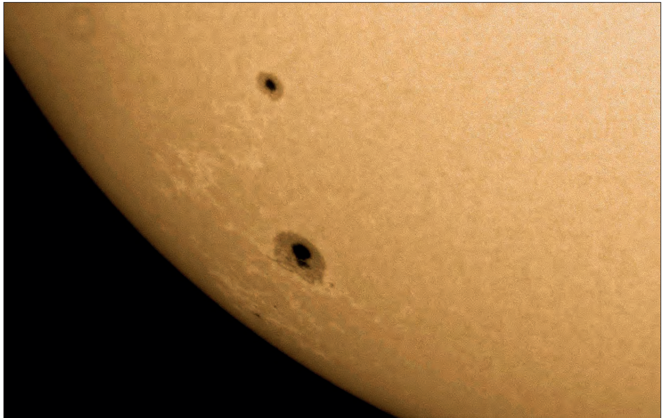
▲ Las imágenes captadas por Germán Ávila están disponible en la página Stellar Sky, de Facebook.

Su interés por observar objetos de espacio profundo, es decir, todo lo que está fuera del sistema solar, como galaxias, nebulosas y