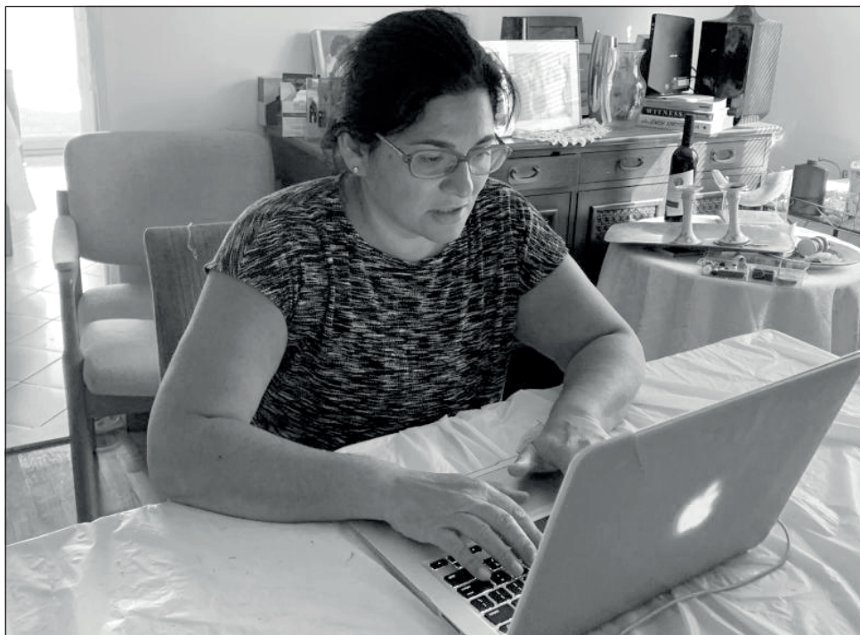
▲ El teletrabajo deberá ser voluntario y sus condiciones estarán regidas en un contrato específico.

También se incluyen obligaciones especiales a los empleados en esta modalidad, como el cuidado, guarda y conservación de los insumos que se le proporcionen para sus labores, así como respetar las disposiciones en materia de seguridad y salud en el trabajo, y la protección de datos utilizados en el desempeño de sus actividades.