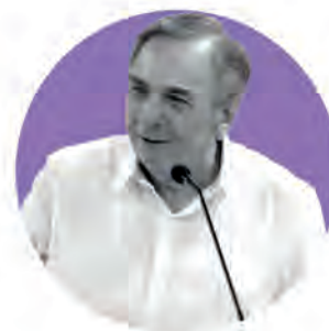
Carlos Aysa González

Población gobernada: 1,501,562 habitantes Meses de gestión: 50 Porcentaje de aprobación: 58.9% Posición en el ranking: 6