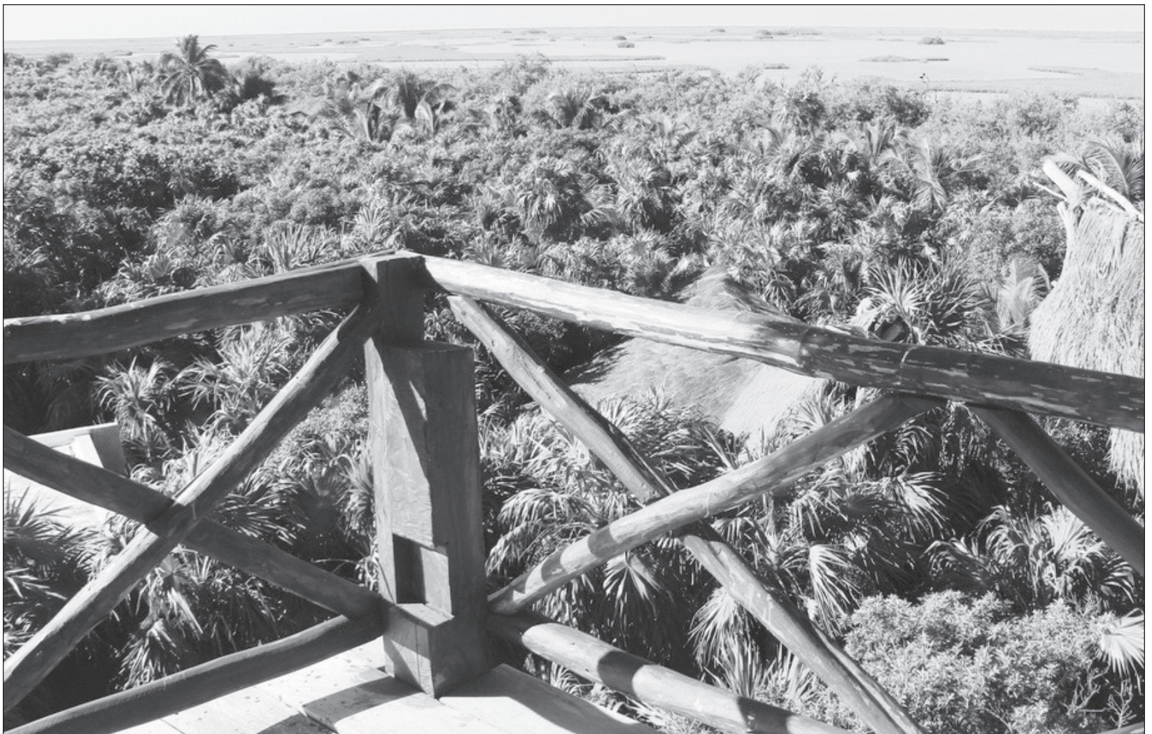
▲ Las autoridades ambientales de la península yucateca revisaron el proyecto de la ley forestal de Quintana Roo.

De las tareas iniciadas en la Ventana A quedan acciones por consolidar, a las que habrá que dar seguimiento y atención durante 2021. Resaltan como prioritarias: trabajar en los Programas de Ordenamiento Territorial Ecológico y de Desarrollo Urbano Sustentable y en las acciones para reducir el cambio de uso suelo.