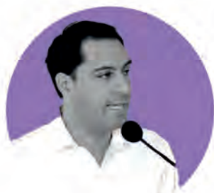
Mauricio Vila Dosal

De acuerdo con la encuesta Ranking Mitofsky Capítulo Gobernadores y Gobernadoras de México con corte al 20 de noviembre estos son los resultados para la península de Yucatán: