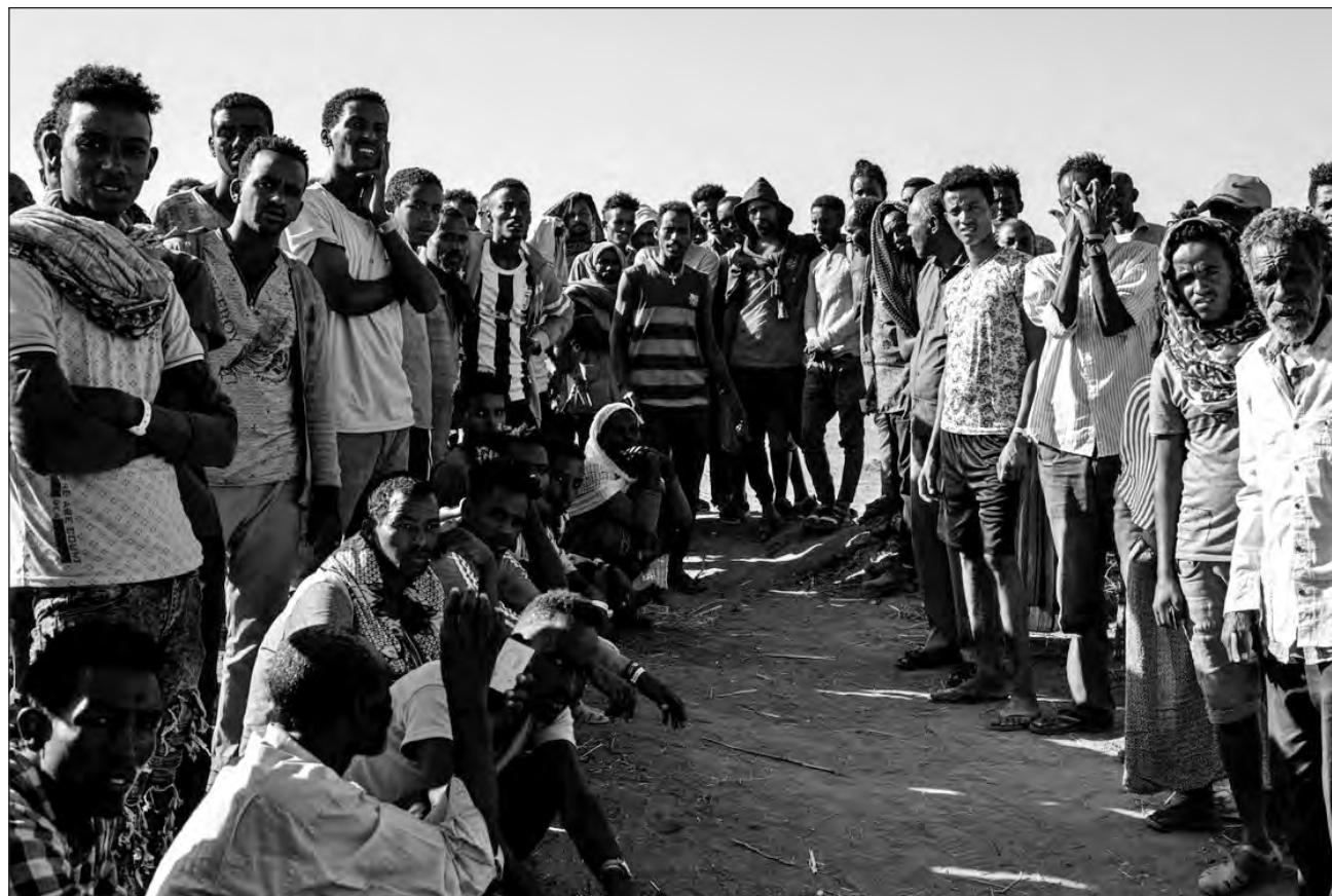
▲ La violencia en Siria, El Congo, Mozambique, Somalia y Yemen provocaron nuevos éxodos en el primer semestre, refiere el alto comisionado de la ONU para los refugiados.

Esa cifra de 79.5 millones incluye 45.7 millones de personas desplazadas en sus países, 29.6 millones de refugiados y otras personas desplazadas de