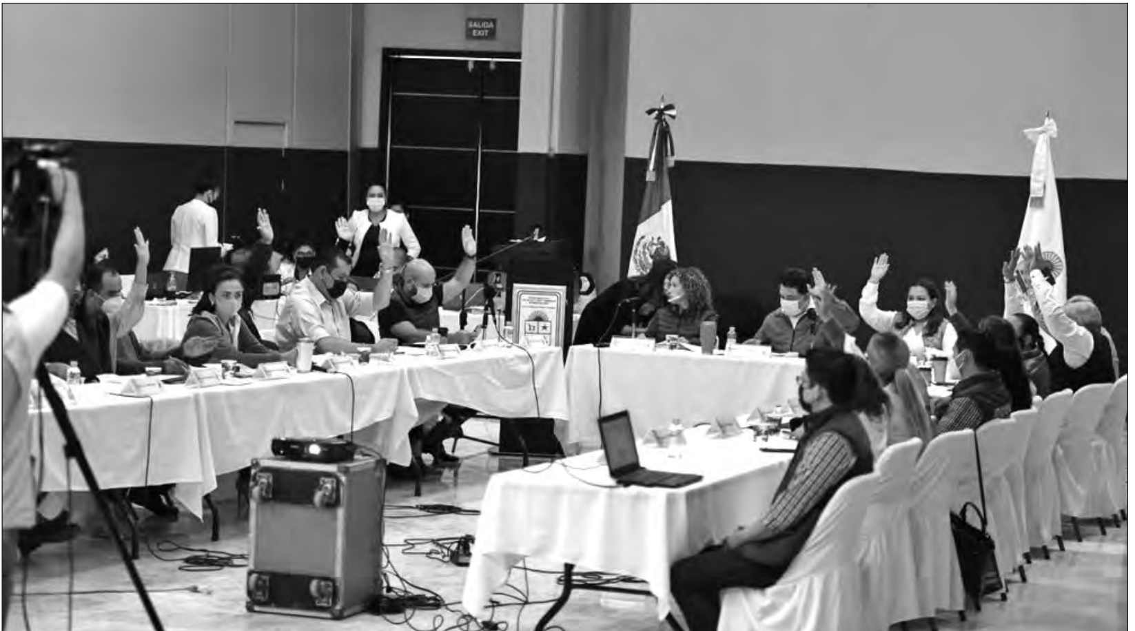
▲ Los diputados establecieron una calendarización para abordar los derechos sexuales y reproductivos de las mujeres; el dictamen final se dará a conocer el 28 de abril.