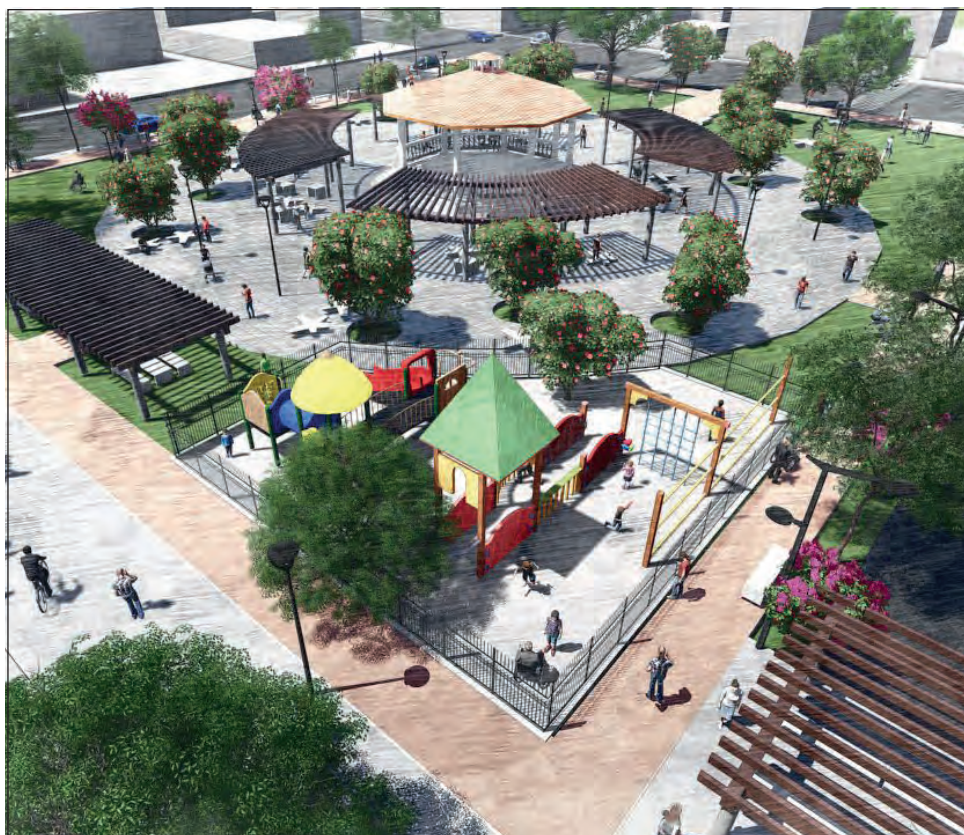
▲ Las obras incluyen la construcción y remodelación de espacios lúdicos y deportivos en áreas públicas.

En el puerto de Chuburná, el gobernador visitó la obra de construcción de módulo deportivo, biblioteca y mejoramiento de plaza cívica, donde se trabaja en los componentes de jardines y áreas verdes, de descanso y de juegos infantiles, accesos y áreas de circulación, cancha y campo deportivo, así como en la biblioteca. Todo ello, repre-