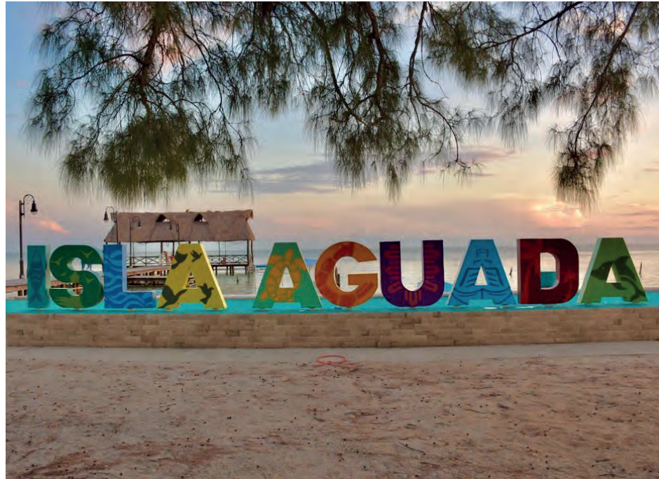
▲ El nombramiento de Isla Aguada como Pueblo Mágico ya despertó el interés de agencias de viajes nacionales e internacionales que pretenden ofrecer esta población como destino.

“Hace algunos días que recibimos este nombramiento, ya tenemos cerca