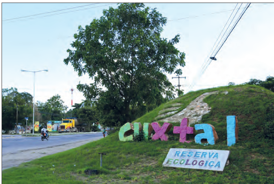
▲ La Reserva Cuxtal ha sido deforestada desde hace tiempo, ya sea para agricultura, crecimiento de la mancha urbana u otras obras.

Destacó que el éxito a largo plazo de la restauración dependerá de la participación de los titulares de la tierra. Deben existir acuerdos de colaboración e incluso de corresponsabilidad con los pueblos originarios para el desarrollo de las acciones de restauración y conservación.