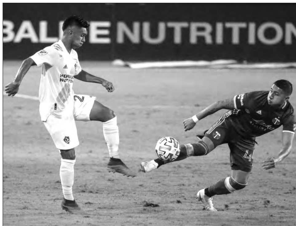
▲ Liga Mx y MLS preparan un torneo binacional.

Bonilla seguirá trabajando en la Liga Mx en el área internacional que, además de gestionar la posible fusión con la MLS, buscará que el país regrese a compe-