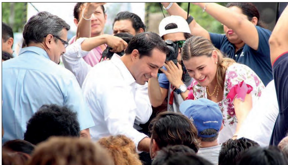
▲ Mauricio Vila tiene 69.6 por ciento de aprobación de acuerdo al conteo realizado por la empresa Mitofsky.

En los primeros lugares le siguen a Vila Dosal su similar de Sinaloa, Quirino Ordaz Coppel; Carlos Mendoza Davis, de Baja California Sur; Miguel Riquelme Solís, de Coahuila, y Claudia Sheinbaum Pardo, de