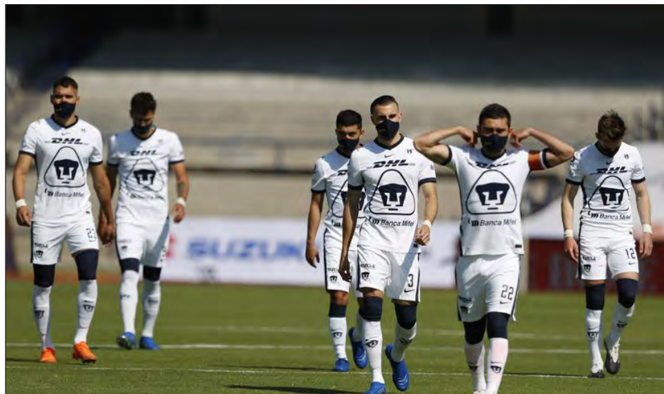
▲ El León es el favorito, pero los Pumas llegan a la final con la motivación a tope.

"Escuché críticas sobre que no jugamos tan bien y