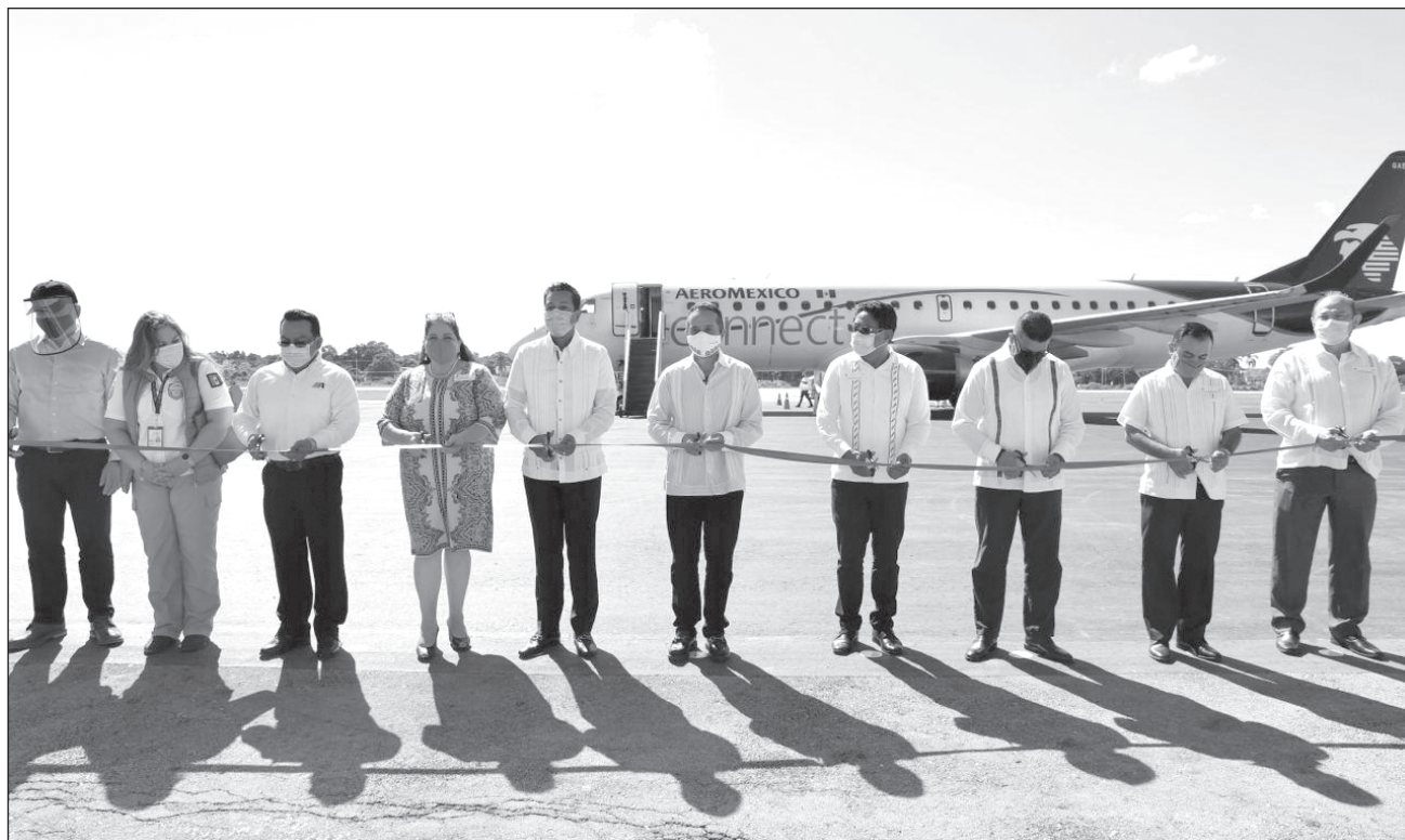
▲ En el Aeropuerto Internacional de Chetumal, el mandatario Carlos Joaquín dio la bienvenida a este primer vuelo, que llegó con 84% de ocupación.

Carlos Joaquín explicó que ésta es una oportunidad para tener mayor conectividad entre la zona sur de Quintana Roo y la Ciudad de México, para mejorar la economía y para generar más empleos para la gente.