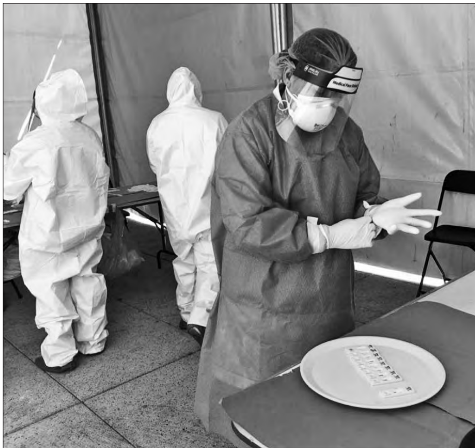
▲ En la primera fase de inoculación serán aplicadas 73 mil 374 dosis (dos por cada individuo), a quienes están en la primera línea de atención de la pandemia.

La otra cara de la moneda son aquellas personas que mejoraron su alimentación, pues al disponer de mayor tiempo en su casa, se han dedicado a cocinar alimentos más saludables, y ya no se ven obligadas a comer en la calle.