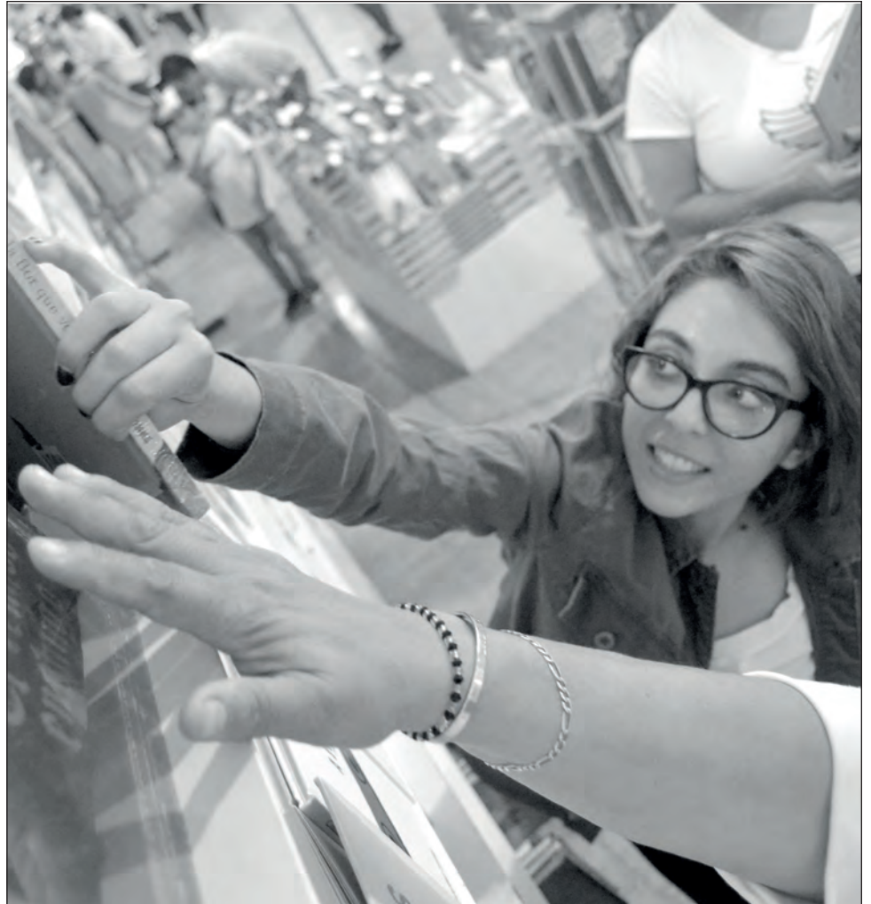
▲ Entre los mecanismos de promoción habrá un programa en línea con un Teléfono Rojo y se entregarán ejemplares a los primeros en llamar.

—Rescatamos todos los Tarzanes de Edgar Rice Burroughs. La idea es que esto sea muy vivo. Que no sólo digamos aquí están a 50 pesos, sino que, señalemos que Rice Burroughs es una muestra de la supremacía blanca sobre los negros, o de la supremacía negra sobre los blancos, o del amor por los orangutanes,