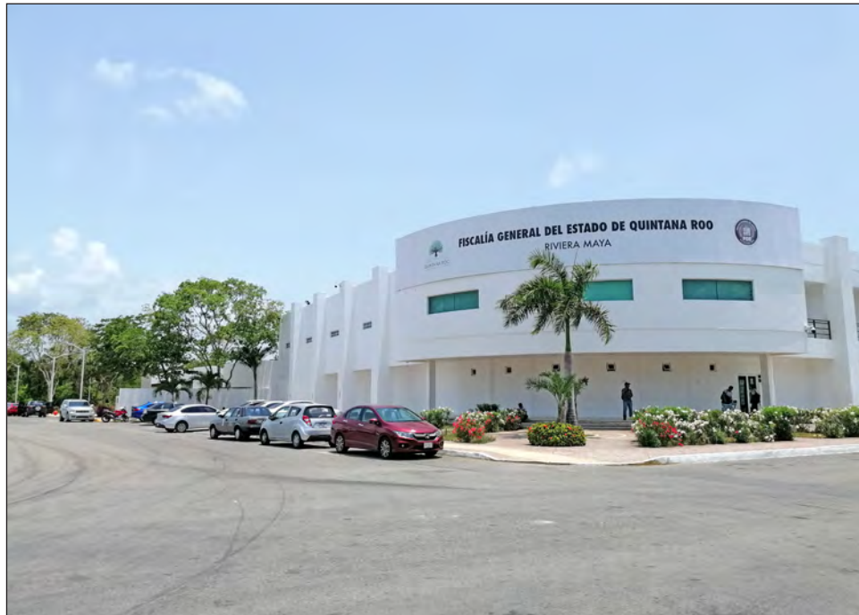
▲ De las 21 recomendaciones generadas en lo que va del año, 11 fueron dirigidas a la Fiscalía.

Resaltó que pese a la contingencia sanitaria, la Cdheqroo continúa laborando