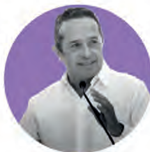
Carlos Joaquín González

Población gobernada: 2,097,175 habitantes Meses de gestión: 25 Porcentaje de aprobación: 69.6% Posición en el ranking: 1