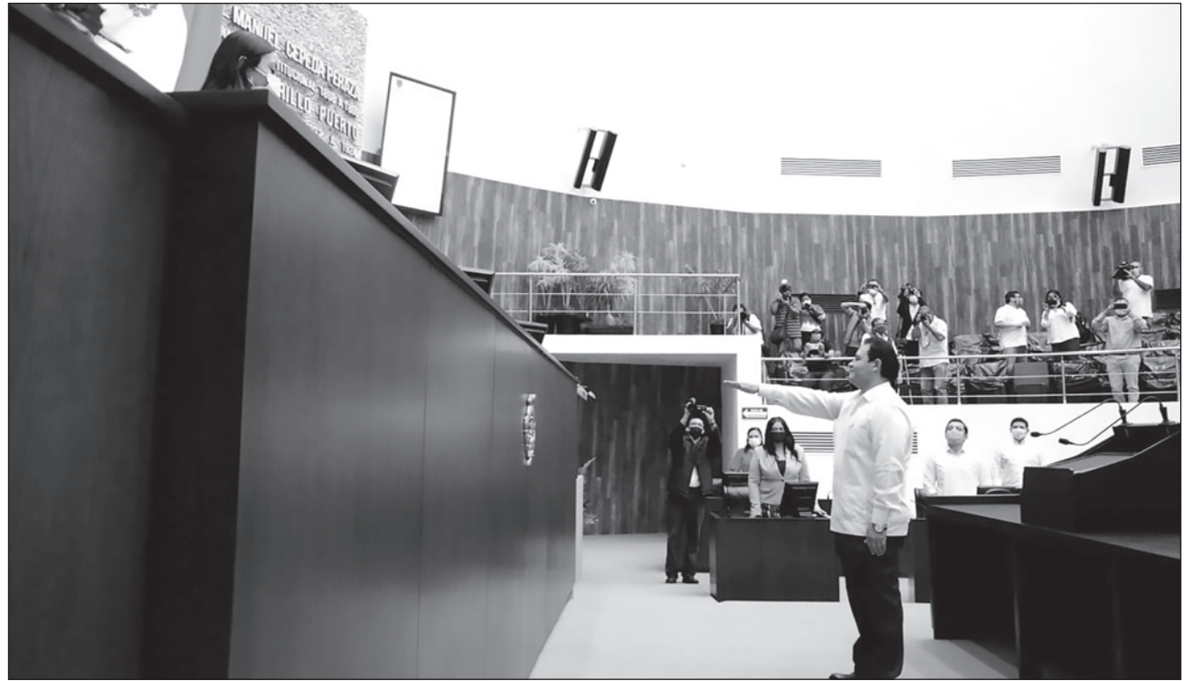
▲ El fiscal trabajará sobre cuatro ejes: procuración de justicia eficaz, eficiente y transparente; capacitación integral de los servidores públicos; coordinación integral en materia de seguridad, y hacer respetar los derechos humanos.

Asimismo, ha garantizado que las investigacio-