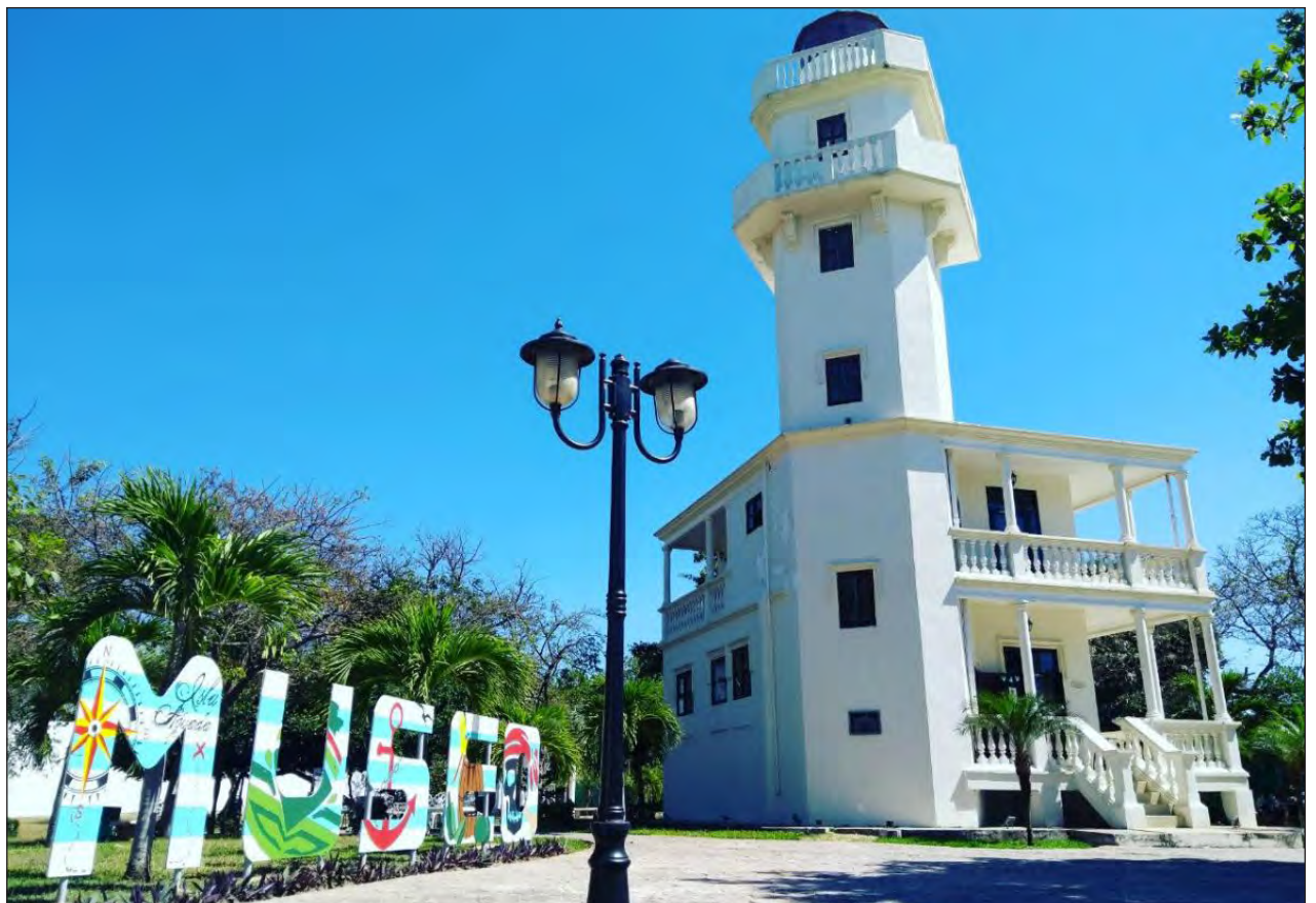
▲ El empresariado carmelita tomó el estudio del IMCO como una oportunidad para construir alianzas con empresas nacionales y extranjeras.

El funcionario señaló que el resultado de este estudio son buenas noticias para todo el estado, en especial para el municipio, lo cual no es nuevo, ya que Carmen siempre ha sido un lugar privilegiado por los recursos naturales que tiene y los recursos humanos con que cuenta.