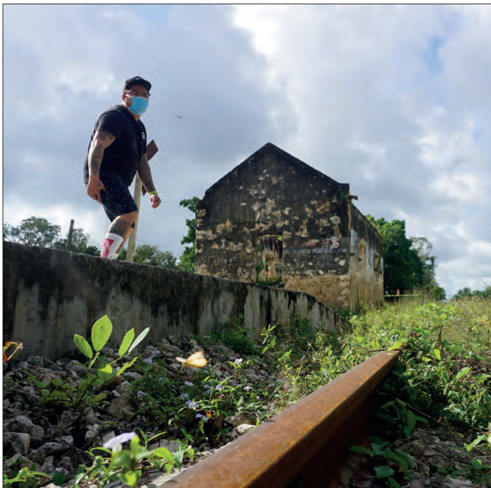
▲ La SCJN deberá resolver el amparo que solicita el grupo Chuun t'aan .

Este asunto deberá ser resuelto por la SCJN en una de sus primeras sesiones del próximo año.