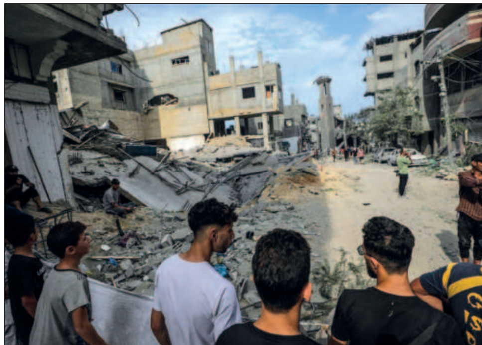
▲ Israel, que ocupa Cisjordania desde 1967, anexionó la parte oriental de Jerusalén e impone un bloqueo a Gaza desde que Hamás tomó el poder en el enclave en 2007.

Los milicianos de Hamas mataron a más de 250 personas que participaban en un festival de música cerca del enclave palestino, según la ONG Zaka que ayudó en las operaciones de recuperación de los cadáveres. Del