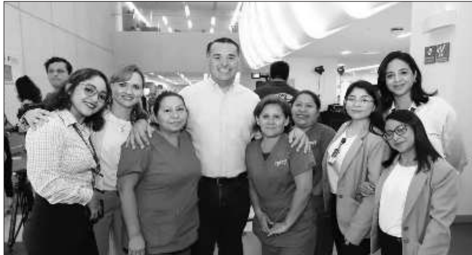
▲ “Nos une nuestro compromiso de evitar el dolor humano (...) cerramos filas para que cada vez haya menos mujeres violentadas”, expresó el alcalde Renán Barrera.

Con estas acciones el Hospital Faro del Mayab se convierte en el primer hospital en formar parte de este programa, que consiste en la impartición de cursos y pláticas para sensibilizar a las y los trabajadores sobre los tipos de violencia que existen.