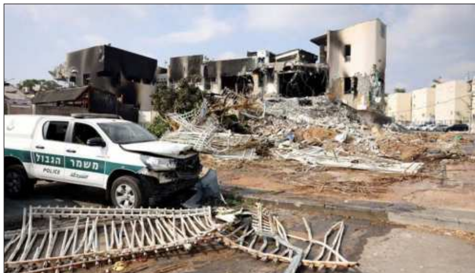
▲ En Gaza, los heridos son ya 3 mil 726, según el último recuento de su Ministerio de Sanidad de la Franja, que desde el domingo sufre intensos bombardeos por parte de la aviación israelí.

Los muertos en Israel ascienden ya a más de 900 tras el brutal ataque de Hamas por tierra, mar y aire del sábado, mientras que los fallecidos en la franja suman 687, incluidos 140 niños, en el tercer día de guerra entre Israel y las milicias palestinas, que asimismo secues-