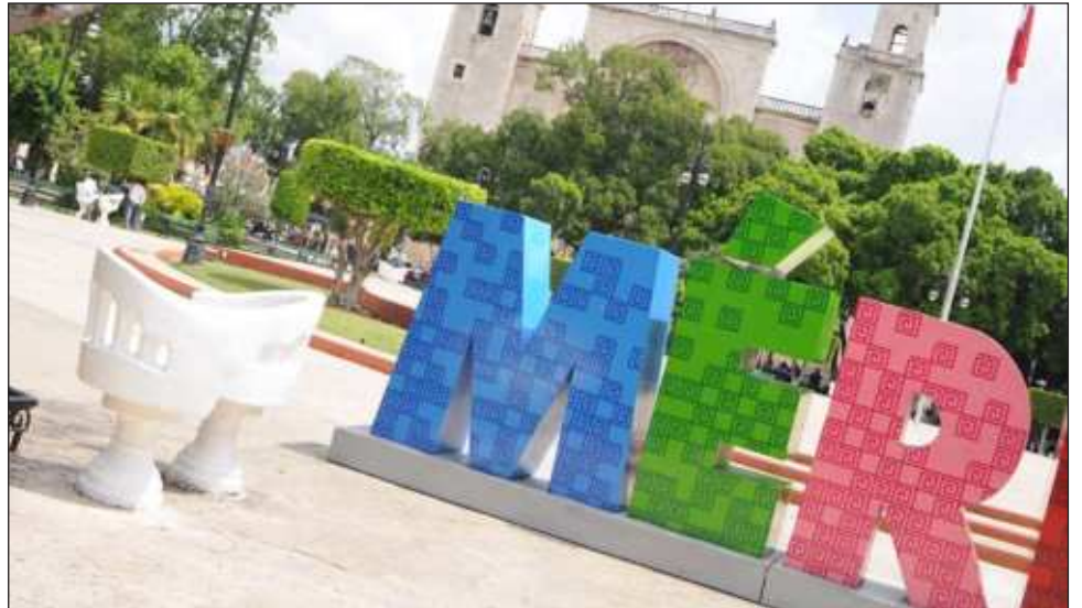
▲ La medida representará más de 10% menos de los recursos de disponibilidad, esto con base a 2023 y ya habiendo cubierto obligaciones como jubilaciones y pensiones, detalló la SAF.

La Secretaría de Administración y Finanzas dio a conocer que, después de analizar