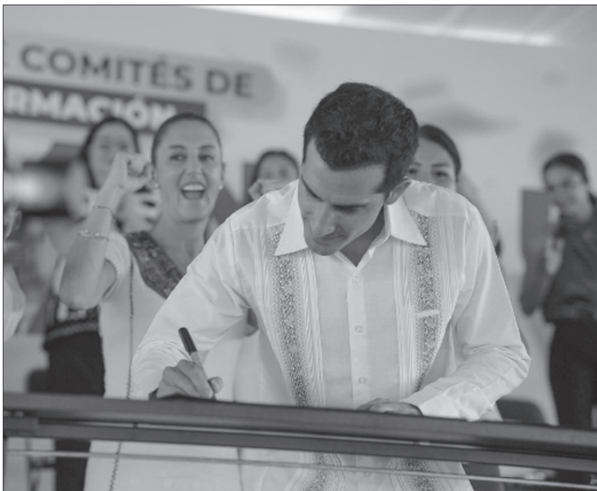
▲ “La misma Sheinbaum ha dado una entusiasta bienvenida a las filas guinda a algunos de esos ‘traidores a la patria’, como Rommel Pacheco, que semanas atrás apoyaba a Xóchitl Gálvez y, al ser rechazado por el PAN como aspirante a presidir la ciudad de Mérida, se ha sumado al ‘proyecto’ de Claudia”.