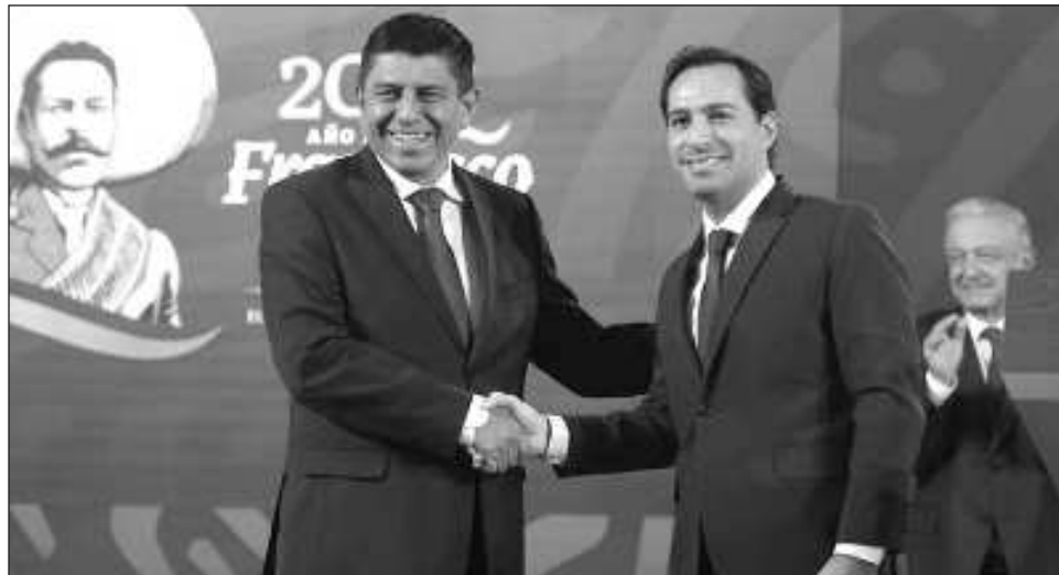
▲ Durante la conferencia de prensa mañanera del presidente López Obrador en Palacio Nacional, Vila Dosal aseveró que es necesario planear y compartir metas a futuro.

Tras reconocer el trabajo que hizo al frente de la Conferencia su anterior presidente