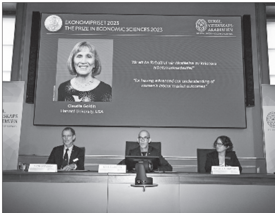
▲ El anuncio de la Real Academia fue un avance diminuto para cerrar la brecha de género del premio: Goldin es apenas la tercera mujer entre los 93 galardonados en la categoría de Economía.

La academia recordó que, "a pesar de la moder-