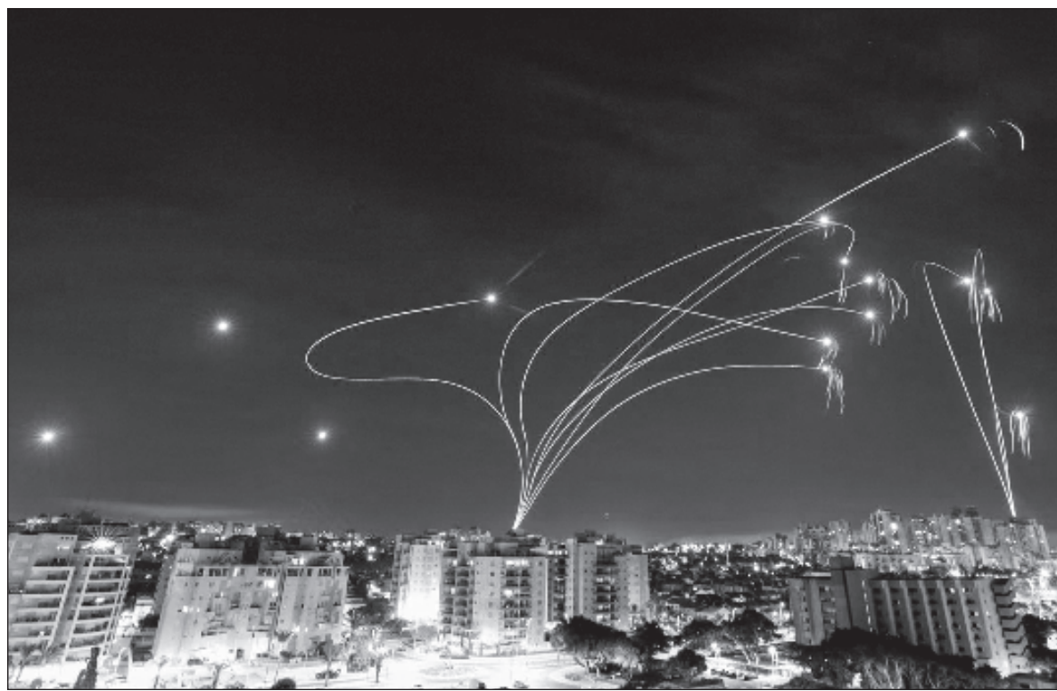
▲ "Today, this war is being fought on television and on social media, with Israelis witnessing civilian brothers and sisters being kidnapped and taken hostage into Gaza and with other Israeli civilians being murdered in cold blood".

UNLIKE 1973, WHEN the enemies of Israel had a leader in