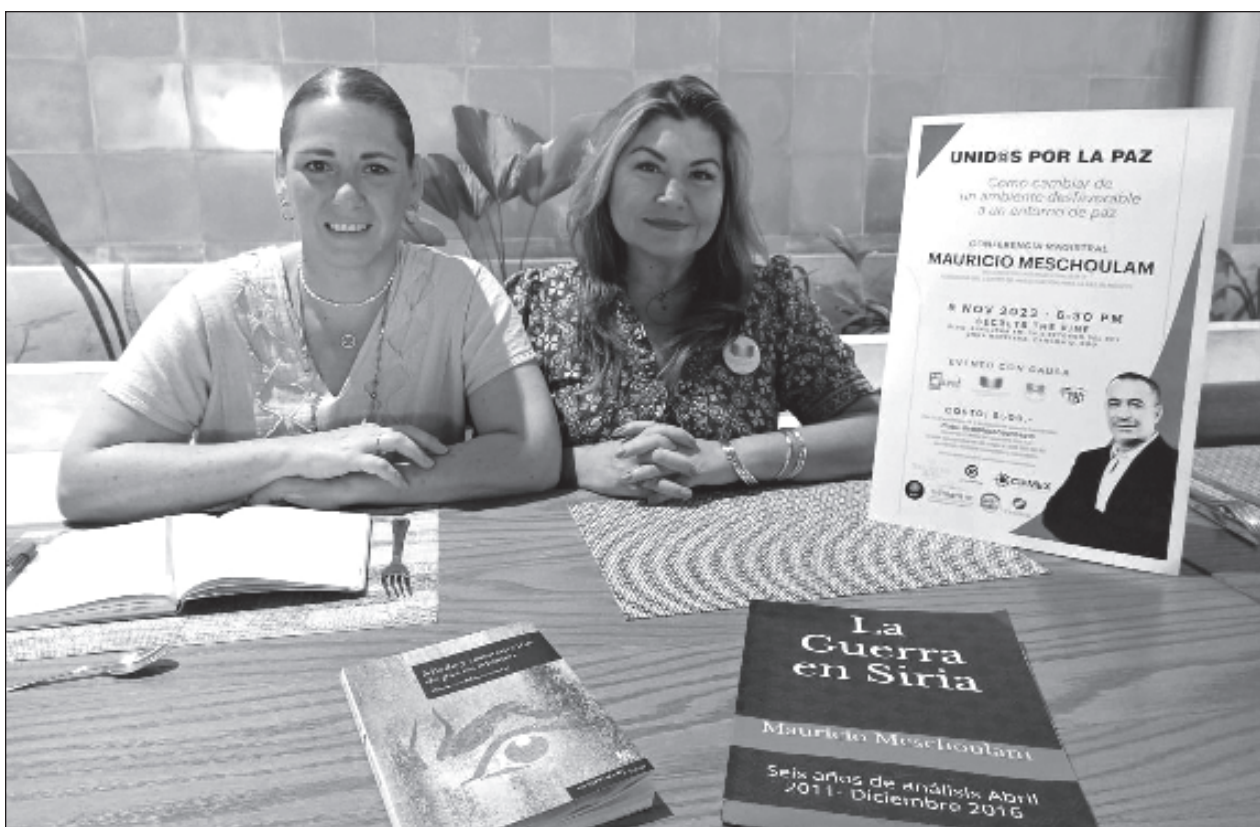
▲ Unid@s por la Paz es una conferencia que tratará sobre las herramientas necesarias para construir la paz.

“Nosotros estamos listos para trabajar en unidad con los compañeros de Morena, con el Partido del Trabajo, con (el movimiento) Suma”, mencionó Renán Sánchez.