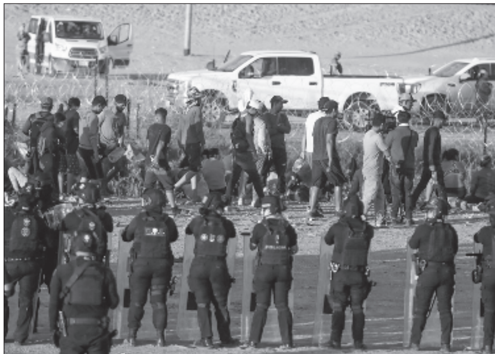
▲ La intención de AMLO es que las naciones convocadas elaboren una propuesta para enfrentar el flujo migratorio, particularmente enfocada en atender las causas.

La intención de López Obrador es que las naciones convocadas elaboren una