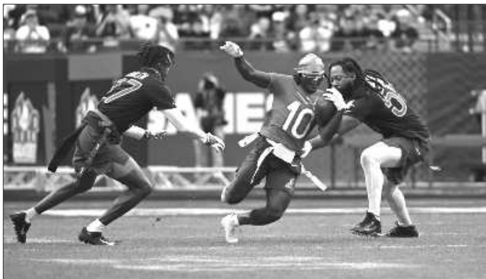
▲ Tyreek Hill (10) acarrea el balón en un juego de fútbol bandera durante el Pro Bowl de la NFL.

Casey Wasserman, el director ejecutivo de los Juegos de Los Ángeles, señaló que los nuevos deportes son "relevantes, innovadores y benefician a la comunidad, que se juegan en patios de escuelas, centros comunitarios y parques en todo Esta-