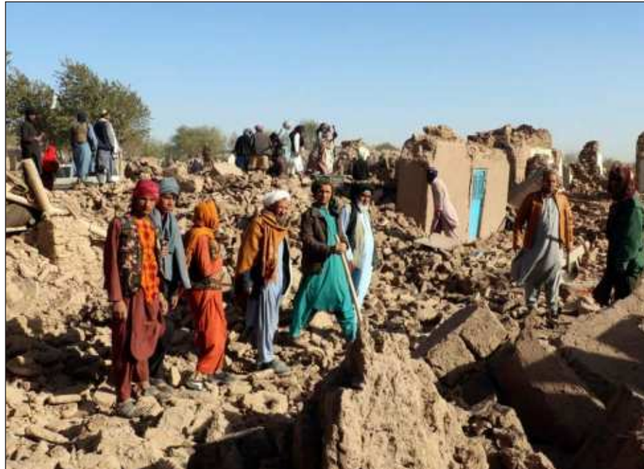
▲ "Bajo el argumento de no apoyar directa o indirectamente a un régimen terrorista, el mundo occidental se ha permitido pasar por alto, una y otra vez, el sufrimiento de la población local".

Aunque algunos políticos y organizaciones humanitarias han señalado que la falta de apoyo se debe en gran parte a la dificultad logística para acceder al país, la realidad pragmática es que el mutismo global alrededor del sismo es resultado de la complicada relación política con el autoproclamado gobierno talibán, situación que trae a la luz la doble moral que sus-