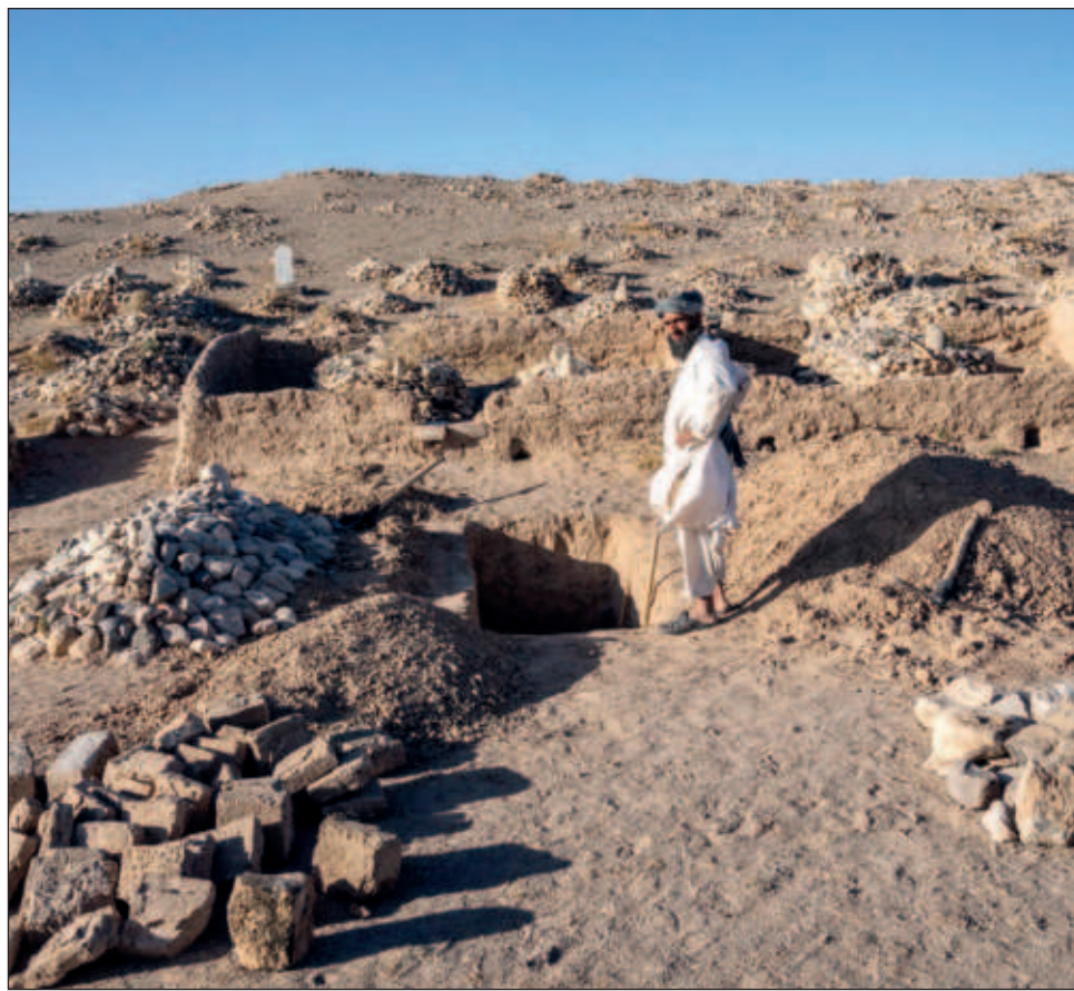
▲ El gobierno talibán reconoció que carecen de recursos para hacer frente a esta catástrofe y pidió ayuda a todas las organizaciones humanitarias para esta "gran emergencia". Foto crédito

El Gobierno dispone de limitada maquinaria y tecnología para las operaciones de rescate y pese a los pedidos de ayuda, el aislamiento de los talibanes ha complicado el envío.