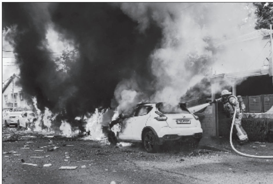
▲ “Es lo más irracional que puede haber, que puede existir, la confrontación, el uso de la fuerza y la guerra que produce mucho sufrimiento, no queremos víctimas por las guerras, lamentamos mucho lo que esta pasando por este enfrentamiento de palestinos, de israelitas”, destacó el Presidente.

“Hoy deberían estar convocando a una asamblea de todos los países miembros, y buscar la aprobación de una resolución que ayude