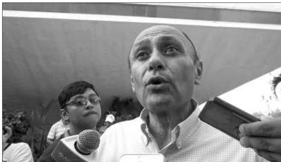
▲ Tras recalcar que toda investigación debe tener un sustento, el dirigente del PRI en Campeche llamó a las autoridades fiscalizadoras a conducirse de manera profesional.

Señaló que toda investigación debe tener un sustento, y que la magnitud de la acusación respecto al monto presuntamente observado de Moreno Cár-