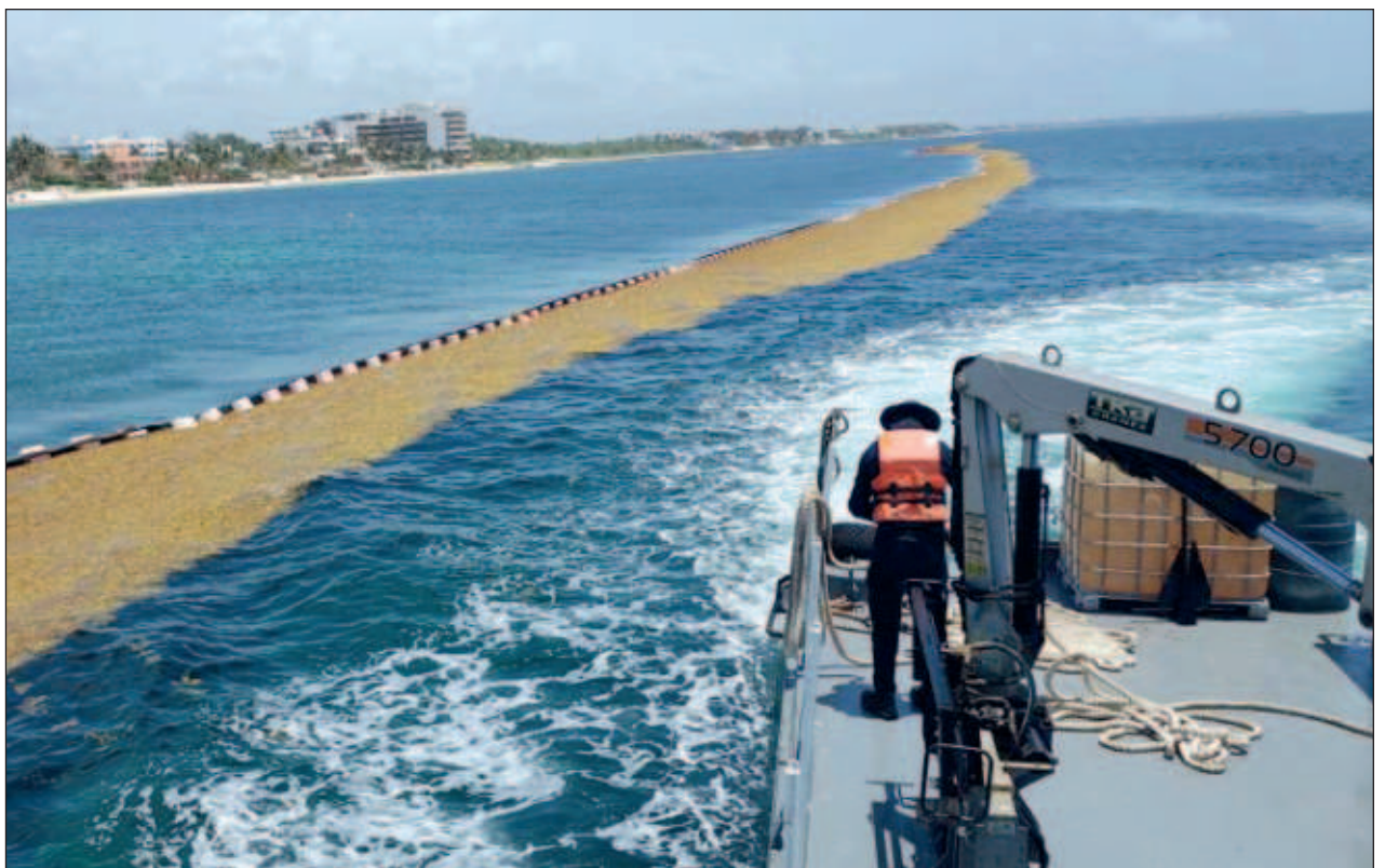
▲ La aplicación de la estrategia será más fácil ahora debido a que es más contundente, y se podrá avanzar con una técnica, desde la transportación, el acopio, la transformación y el marco jurídico que se irá aplicando.

“No se tiene un presupuesto, ni necesitamos un presupuesto... el gobierno del estado está preparado, todos los sectores están preparados, todos los que tienen que ver, como las empresas que transforman, que transportan, que acopian; está Zofemat, los municipios, la Federación, nosotros, la Marina también está preparada para cualquier contingencia”.