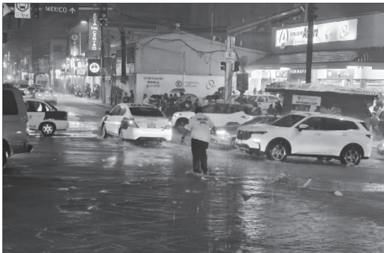
▲ El SMN, en coordinación con el Centro Nacional de Huracanes en Miami, Estados Unidos, mantiene como zona de prevención por efectos de tormenta tropical desde Acapulco, Guerrero, hasta Punta San Telmo, Michoacán.

El SMN apuntó que las precipitaciones podrían ser con descargas eléctricas y generar deslaves, incremento en niveles de ríos y arroyos, desbordamientos e inundaciones en zonas de los estados mencionados, por lo que exhortó a la población a atender los avisos