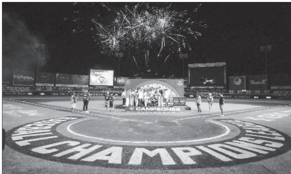
▲ Fargo-Moorhead, de la American Association, obtuvo la primera corona de la "champions".

"La primera edición de la 'Baseball Champions League' termina y es el comienzo del torneo de clubes más importante en el mundo! Felicidades a los cuatro equipos pioneros y felicidades a los RedHawks por el triunfo!", publicó en Twitter Riccardo