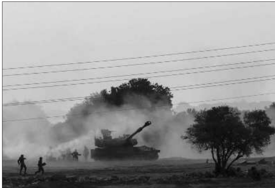
▲ Los intensos ataques de Israel, que se prolongaron durante casi dos horas, se produjeron después de que un grupo armado entrase a territorio israelí desde el Líbano y se enfrentaran al Estado judío.

Los intensos ataques de Israel, que se prolongaron durante casi dos horas, se produjeron después de que un grupo de personas armadas entrasen a territorio israelí desde el Líbano y se enzarzasen en enfrenta-