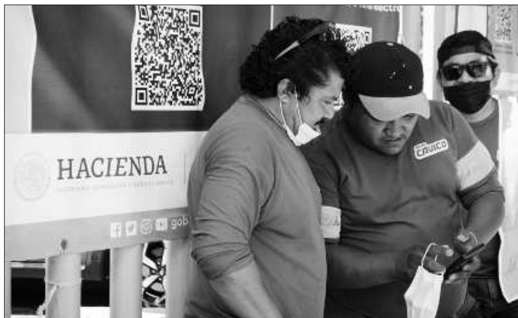
▲ Era previsible que la proyección de recaudación para 2024 fuera menor a la del año en curso, y que la cantidad de dinero a distribuir iría también a la baja.

Igualmente, la actual administración estatal debe reconocer su responsabilidad en el crecimiento demográfico que ha tenido Yucatán en los últimos años, cuestión que no tiene relación con el presupuesto federal, sino que es resultado de la promoción que se ha hecho y de haber conseguido transformar a la entidad en "un polo de desarrollo más que interesante". Debemos mirar en el futuro que el despegue económico de Yucatán se refleje en la captación de recursos propios y que estos se apliquen con la misma disciplina en futuros presupuestos.