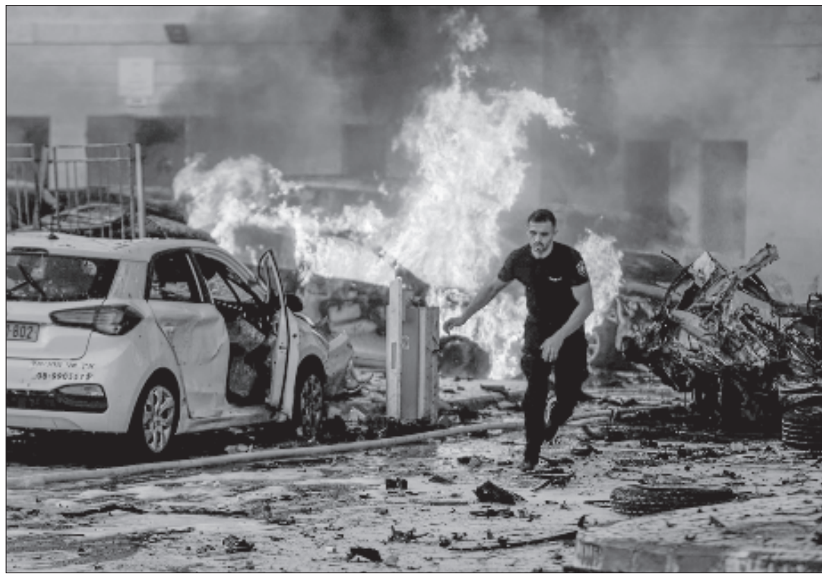
▲ “Una operación militar terrestre en Gaza, lo que sin lugar a dudas se traducirá en bajas militares, y sobre todo, en incontables muertos civiles palestinos, los que a ojos de los medios y gobiernos occidentales parecen tener menor valía, ya que las noticias cotidianas dan cuenta de la muerte de palestinos, niños, mujeres y ancianos incluidos, sin que las cancillerías eleven la voz”.

También algunos observadores y analistas, no sin argumentos, señalan que es muy dudoso que el Mossad y demás servicios secretos de Israel no supieran de los planes de Hamas y de su sangriento ataque que según cifras provisionales ha dejado casi un millar de israelíes muertos y al menos un centenar de secuestrados, muchos de ellos extranjeros, además de niños y ancianos, con el objetivo de intercambiarlos por presos palestinos.