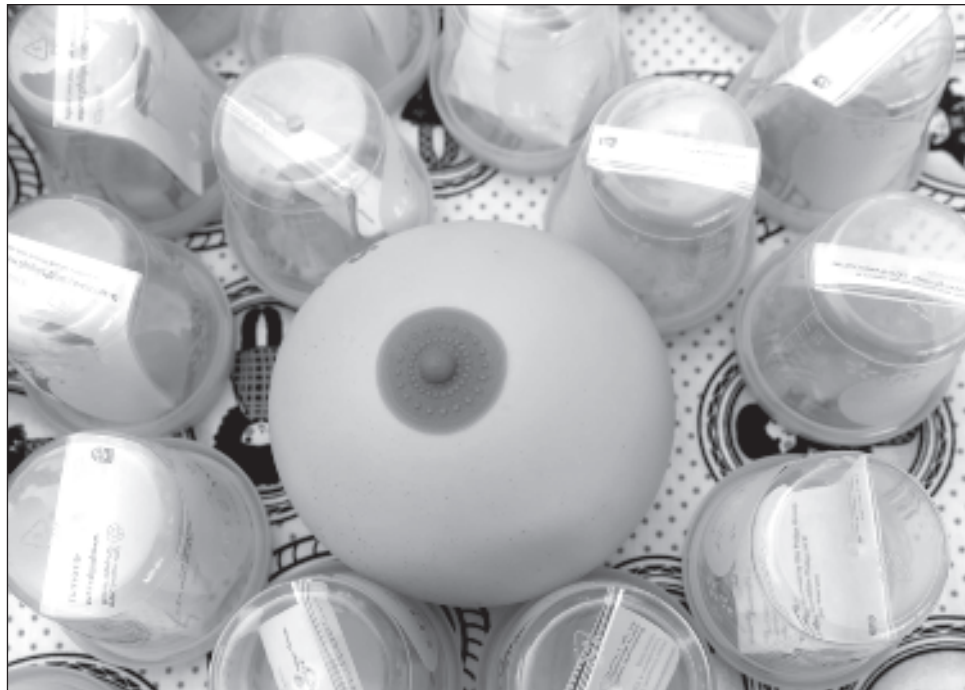
▲ La recomendación es que en los primeros seis meses de vida, los bebés consuman únicamente leche materna, la cual contiene todos las vitaminas y nutrientes necesarios.

La asesora de lactancia hizo énfasis en que los primeros seis meses de vida la recomendación es dar únicamente leche materna, los