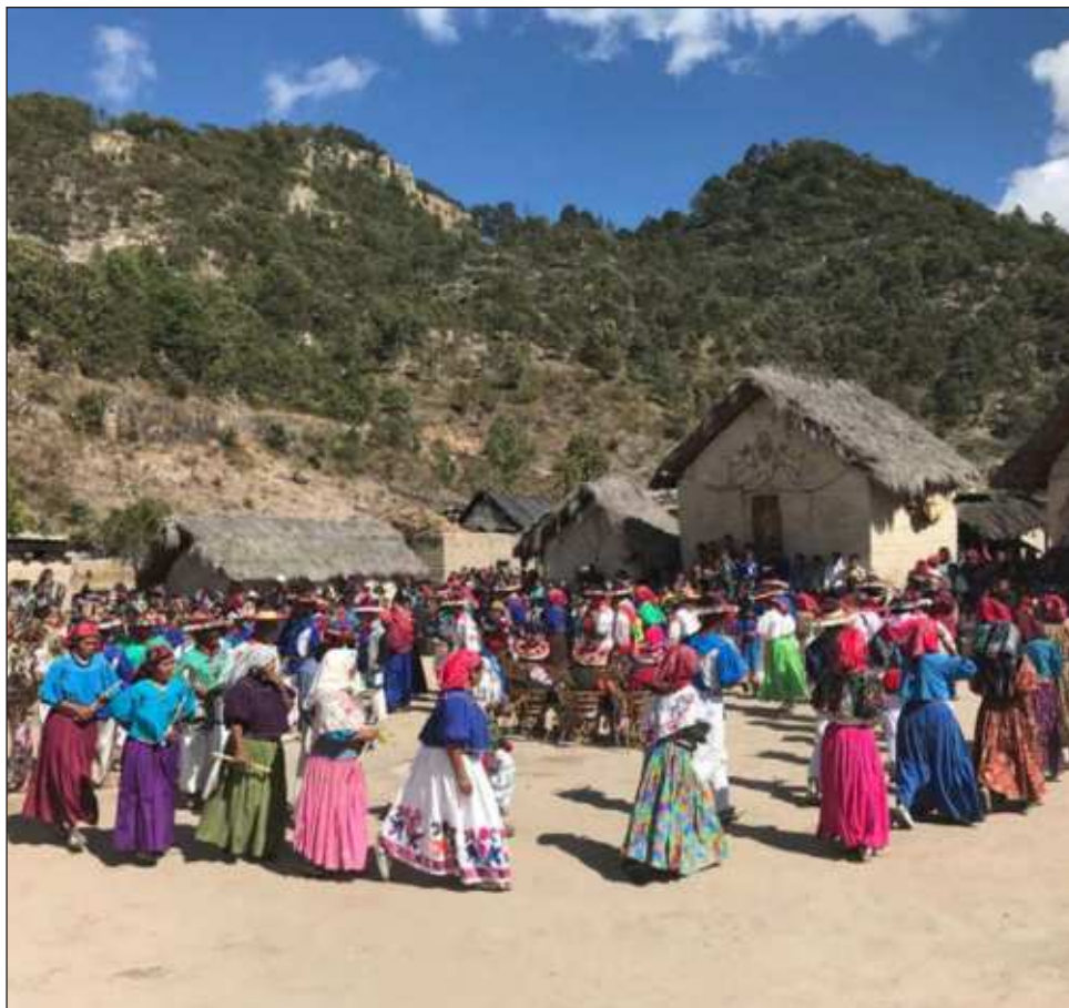
La firma del decreto obedece a un compromiso que López Obrador hizo en septiembre de 2022 durante una visita que realizó a Santa Catarina, Jalisco.

“He instruido a todos los servidores públicos para que den cumplimiento efectivo a este decreto y pongan alto a todas las agresiones, invasiones a sus tierras y lugares sagrados”, dijo.