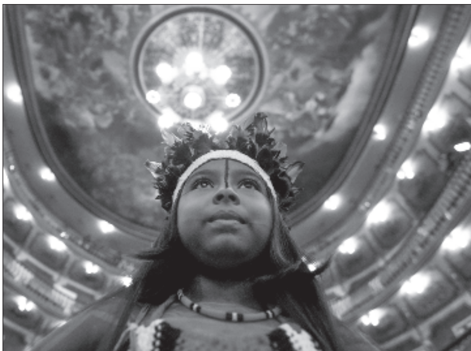
▲ La Cumbre de la Amazonia en Brasil concluyó con una hoja de ruta para proteger las selvas tropicales, calificada como paso importante en la lucha contra el cambio climático.