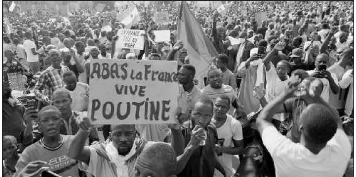
▲ "The EU and France are withholding financial and development aid to Niger and suspending all security cooperation agreements with the country. France has stated that it continues to recognize Mr. Bazoum as the 'sole president' of Niger, with ECOWAS also stating that it recognized Mr. Bazoum as the 'legitimate and legal President of Niger'".

THE REGION IS the major playground for ISIS as the terrorist group continues in its campaign to eliminate foreign influences and establish fundamentalist Islamic control there. Niger has received large scale military and financial backing from the West, especially