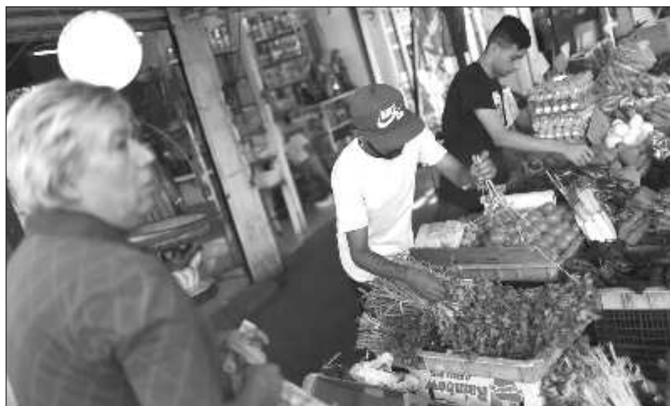
▲ El Inegi reportó que el índice de precios al consumidor aumentó 0,48% en junio.

El índice de precios de la canasta de consumo mínimo, conformada por 176