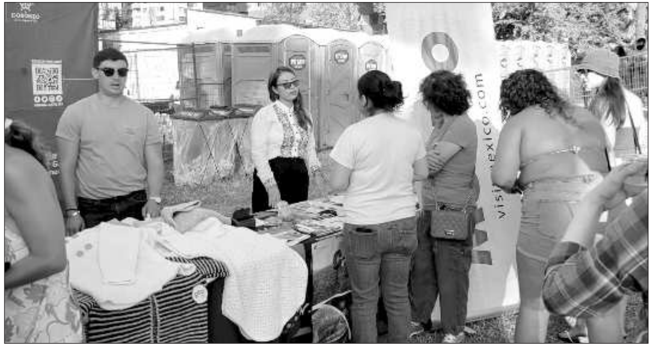
▲ Los asistentes a la feria Honda Celebration of Light 2023 pudieron conocer productos campechanos como artesanías, fibras y miel melipona, una de las más cotizadas en el mundo.

El festival representó una oportunidad para llevar