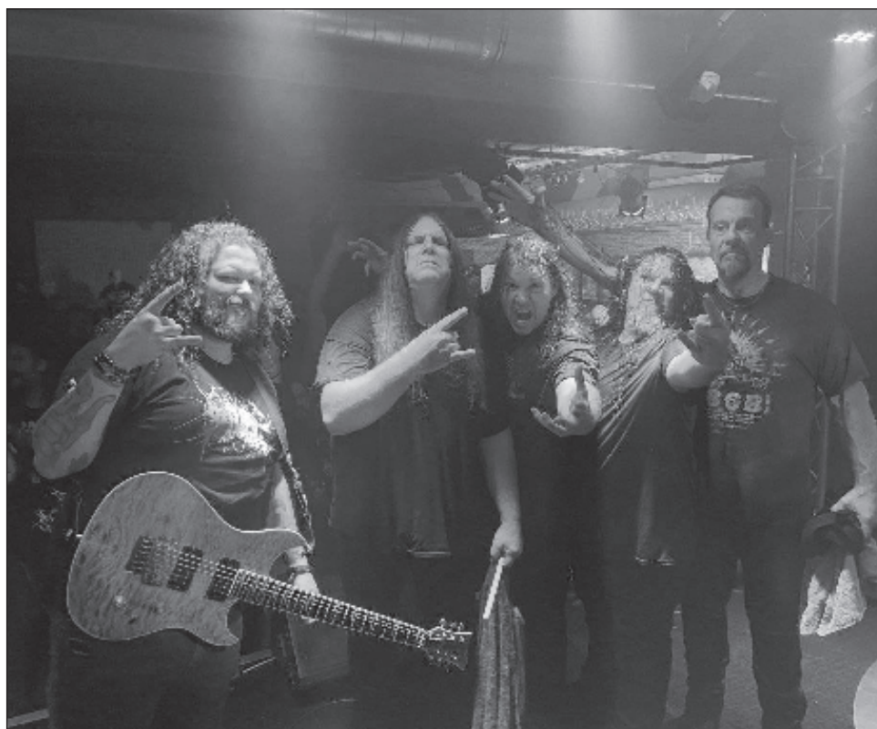
▲ El evento reunirá a bandas mexicanas legendarias como Transmetal, Makina, Next y Luzbel en Hacienda El Triunfo de la capital yucateca.

Desde las 11 de la mañana sonarán los primeros guitarrazos para dar espacio a las 15 bandas y un DJ que reproducirá viniles entre cada show. “Es la primera vez que hace un festival de metal así de largo y que incluya todas