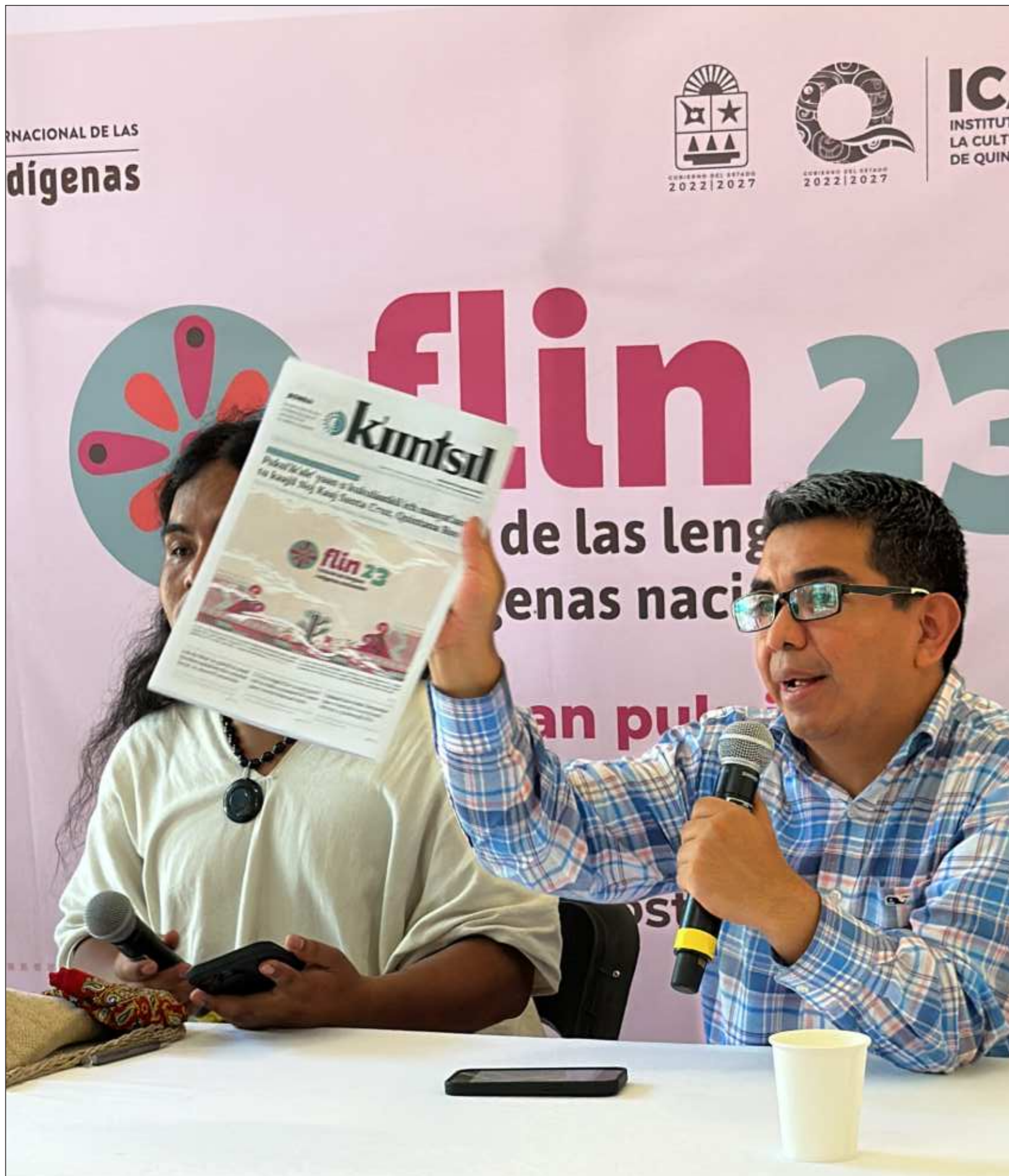
▲ Ayer arrancó la Feria de las Lenguas Indígenas Nacionales (Flin) 2023 en el teatro del municipio de Felipe Carrillo Puerto, Quintana Roo, donde