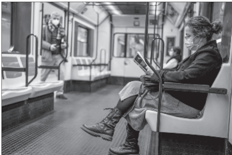
▲ Desde el inicio de la pandemia a finales de 2019, la OMS ha contabilizado más de 768 millones de casos de la enfermedad en todo el planeta, 6.9 millones de ellos mortales.

Funcionarios esperan que en este otoño ya estén disponibles las vacunas contra Covid-19 actualizadas que contienen una versión de la variante ómicron, llamada XBB.1.5. Es una modificación importante de las vacunas de hoy en día, que mezclan la variante original del coronavirus con las subvariantes más comunes de ómicron del año pasado.