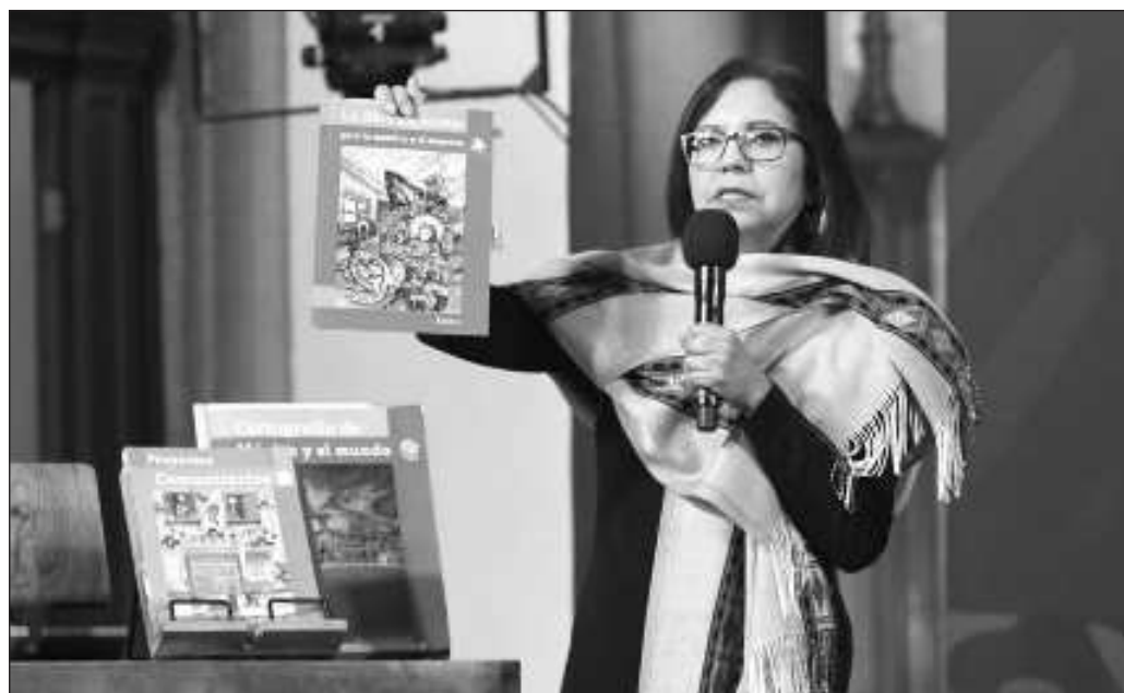
▲ La titular de la SEP, Leticia Ramírez Amaya, ha salido a decir, apegándose a la letra legal, que no existe amparo que impida la impresión y distribución de los libros. Es cierto, pero es una verdad a medias.

Queda cuestionar si era posible que los LTG llegaran a las aulas sin más cuestionamientos que algunas erratas o algún ejemplo de ejercicio mal resuelto; algo que los docentes pudieran solucionar en un santiamén. Después de lo pasado por miles de maestros durante el confinamiento, que con recursos mínimos lograron elaborar cuadernillos y materiales educativos de lo más diversos de acuerdo a las necesidades de sus alumnos, queda la impresión de que algo se pudo hacer mejor y así evitar una polémica que no deja ver con claridad de qué trata la llamada Nueva Escuela Mexicana.