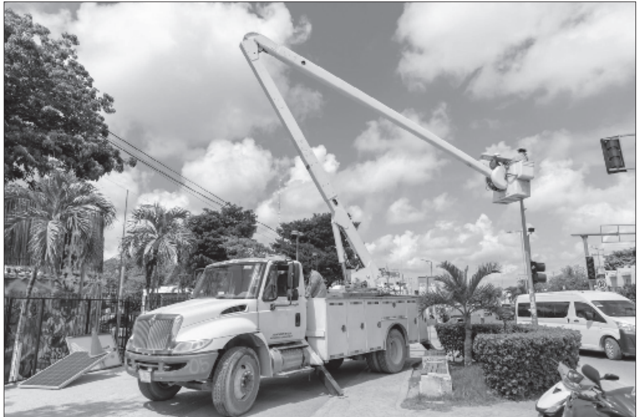
▲ Una cuadrilla de obreros trabaja en el cambio de lámparas de la avenida y otras colonias.

Indicó que la administración municipal invierte re-