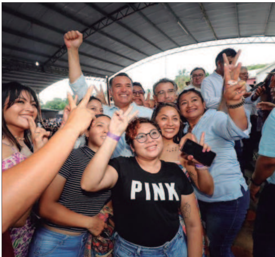
▲ Barrera Concha hizo un llamado a unir fuerzas sin distinción de colores y partidos para que Yucatán siga transformándose en materia de educación y economía. “La transformación no es propiedad de ningún gobierno, la transformación no es de partidos”.

“La transformación no es propiedad de ningún gobierno (...) la transformación es la capacidad que tiene cada uno de ustedes de modificar su realidad”, apuntó.