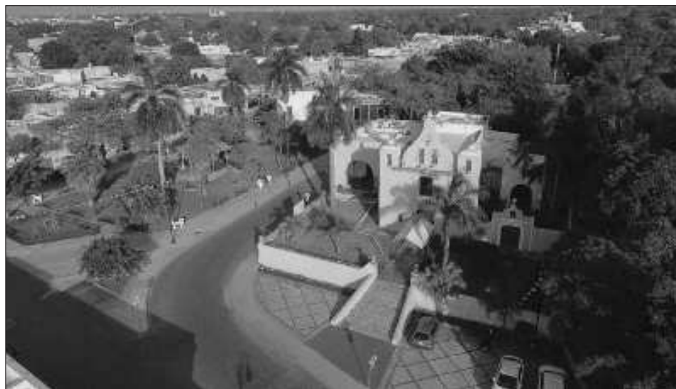
▲ En Yucatán existen siete Pueblos Mágicos: Tekax, Espita, Motul, Izamal, Maní, Sisal y Valladolid, y ahora nombró como Barrio Mágico a La Ermita, San Sebastián y Xcalachén, en Mérida.

“Tener una más amplia y diversa oferta turística nos beneficia, incrementamos no sólo nuestros indicadores de llegada de visitantes sino también de derrama económica, por ejemplo, el primer semestre de este año crecimos 55.1 por ciento con respecto al año pasado, también nos ayuda a