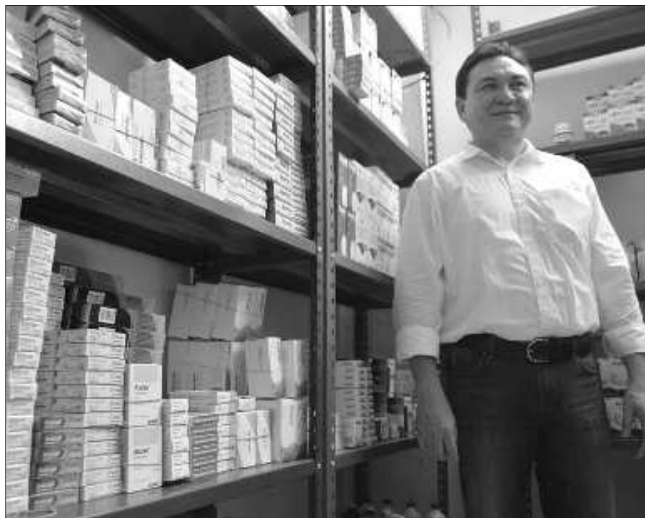
▲ Las demandas se presentaron ante la Unidad Técnica de lo Contencioso Electoral de la Secretaría Ejecutiva para que realice los análisis y las indagatorias correspondientes.

En las denuncias interpuestas contra Rommel Pacheco, el PRI recordó que en el artículo 198 de la Ley de Instituciones y Procedimientos Electorales del Estado de Yucatán establece que se entenderá por actos de promoción previos al proceso electoral aquellas "actividades propagandísticas y publicitarias o difundidas en cualquier medio, que sean anticipadas a la fecha de inicio del proceso electoral de manera pública".